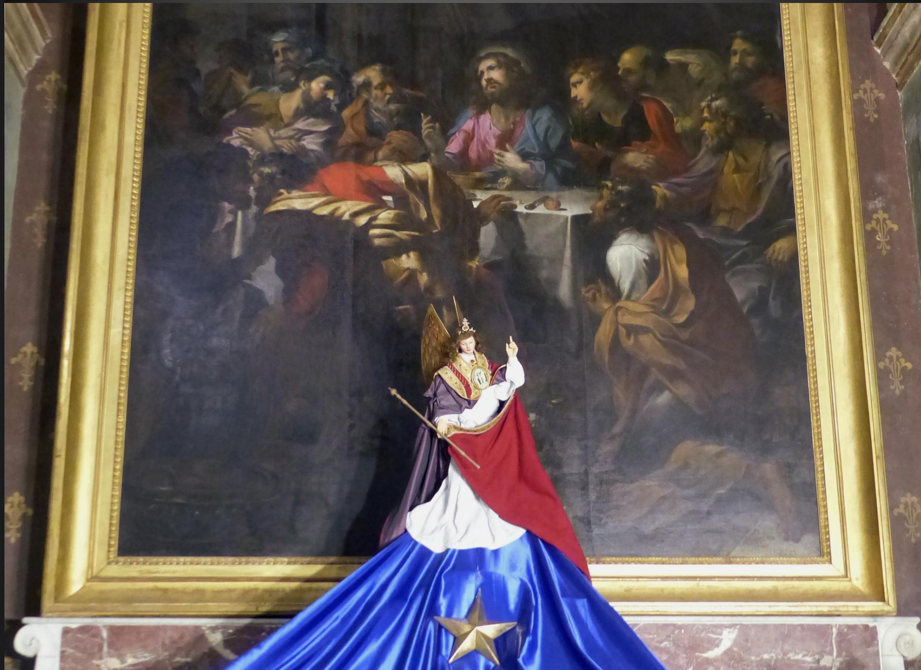
Cathédrale Saint-Sauveur _ La crèche a été placée sous un grand tableau de la Cène, de Jean Daret père.