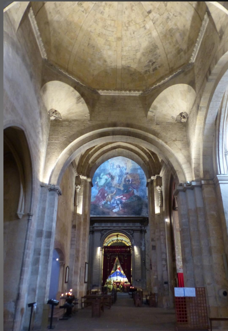
Cathédrale Saint-Sauveur _ La crèche provençale est au fond de la nef romane (fin du XIe siècle, elle est due à l'archevêque Rostang de Fos).