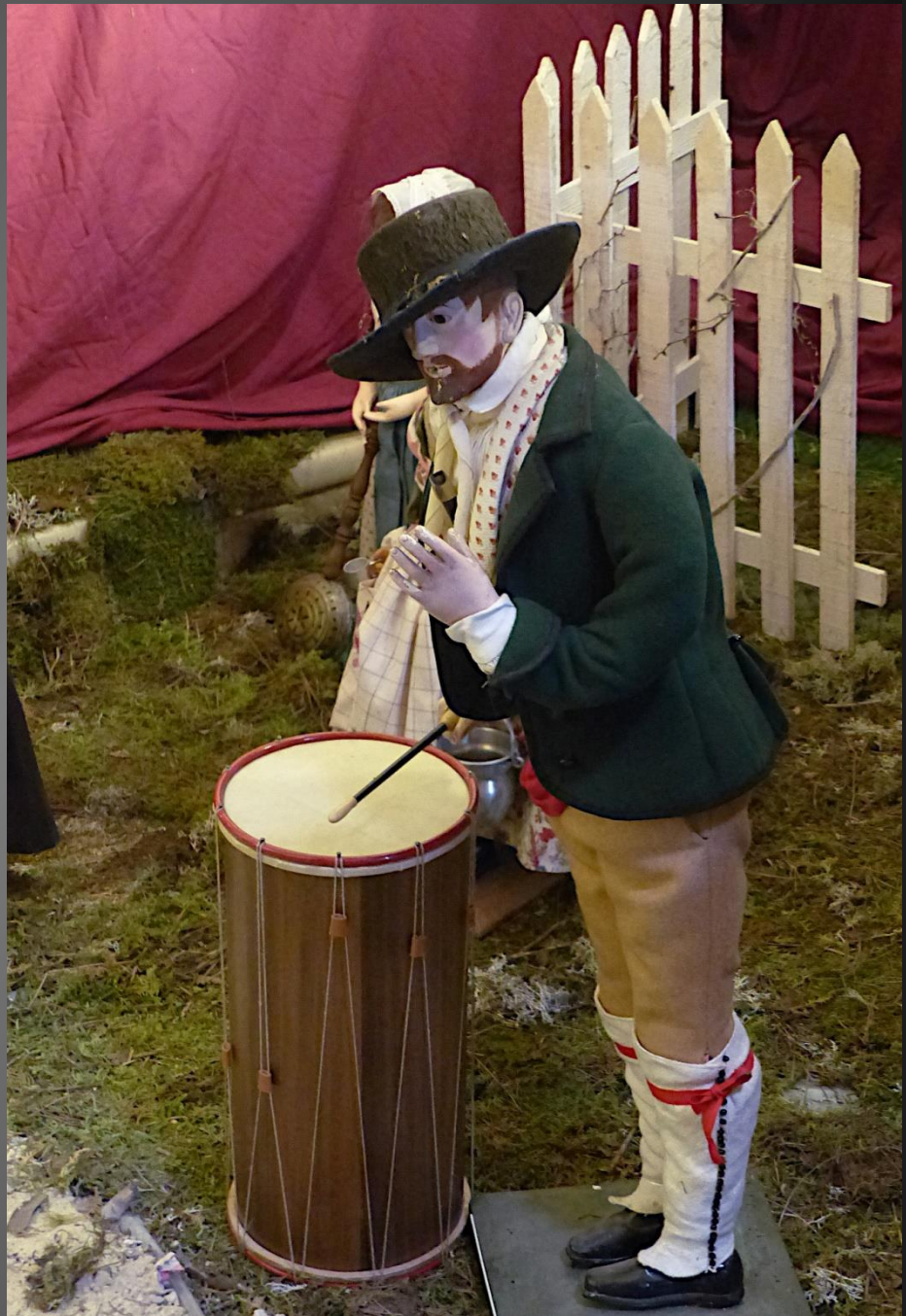
Cathédrale Saint-Sauveur _ Le Roi Mage Balthazar , aux allures de prince africain, offre la myrrhe, il viendrait de l'Inde. Le Tabourinaire est toujours présent dans les fêtes provençales.