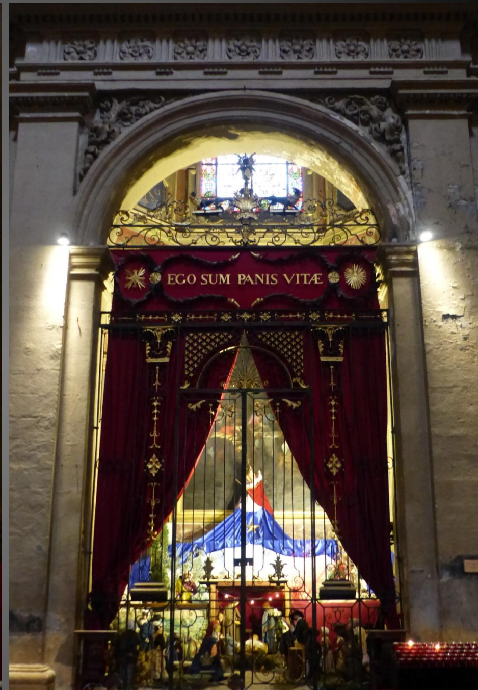
Cathédrale Saint-Sauveur _ Juste avant crèche provençale , le Sacré-Cœur semble inviter le visiteur à méditer devant l'évocation de l'Incarnation.