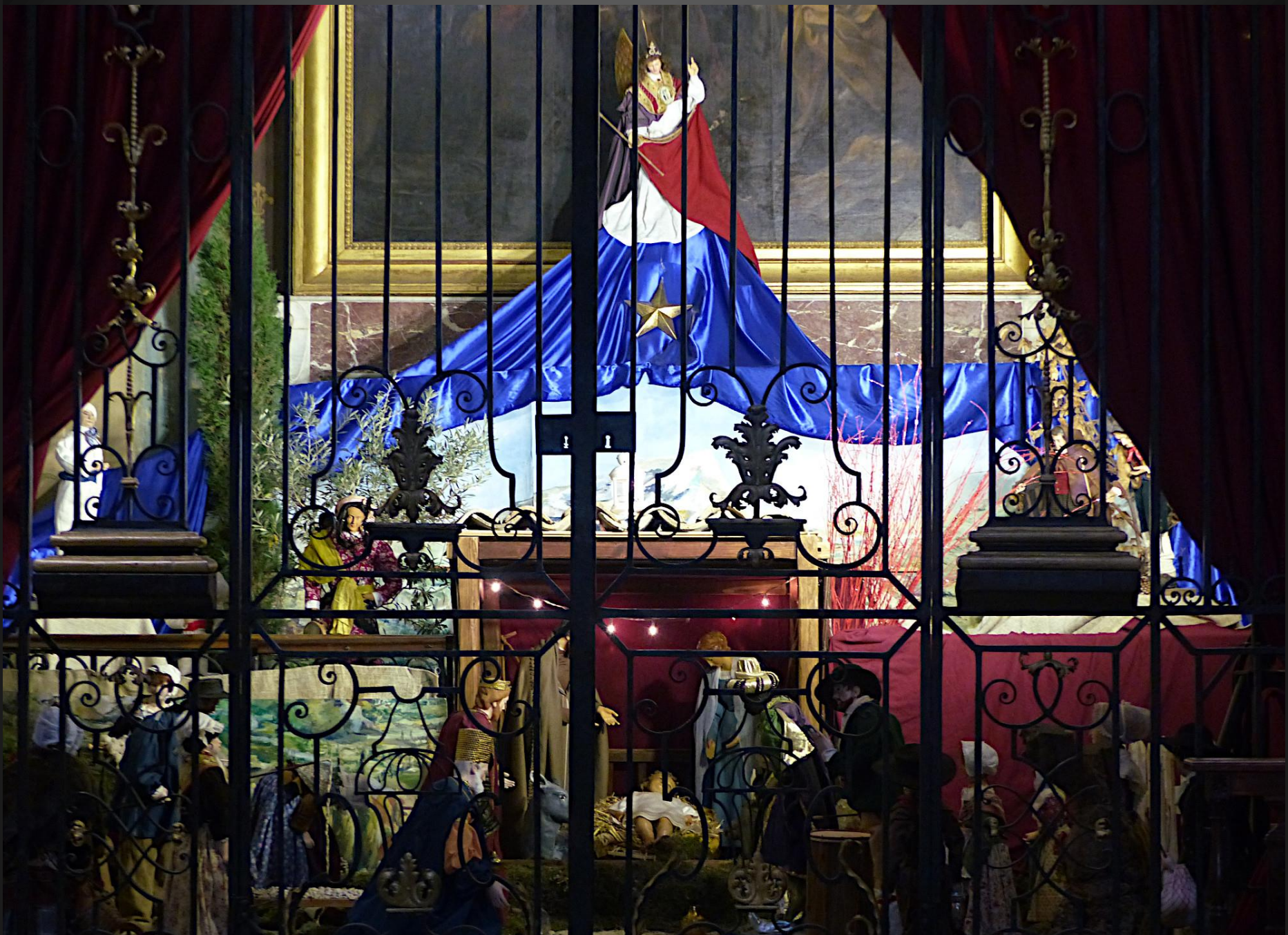
Cathédrale Saint-Sauveur _ La crèche , placée dans la chapelle du Saint-Sacrement - EGO SUM PANIS VITAE - est protégée par une grille. Ouvragée.