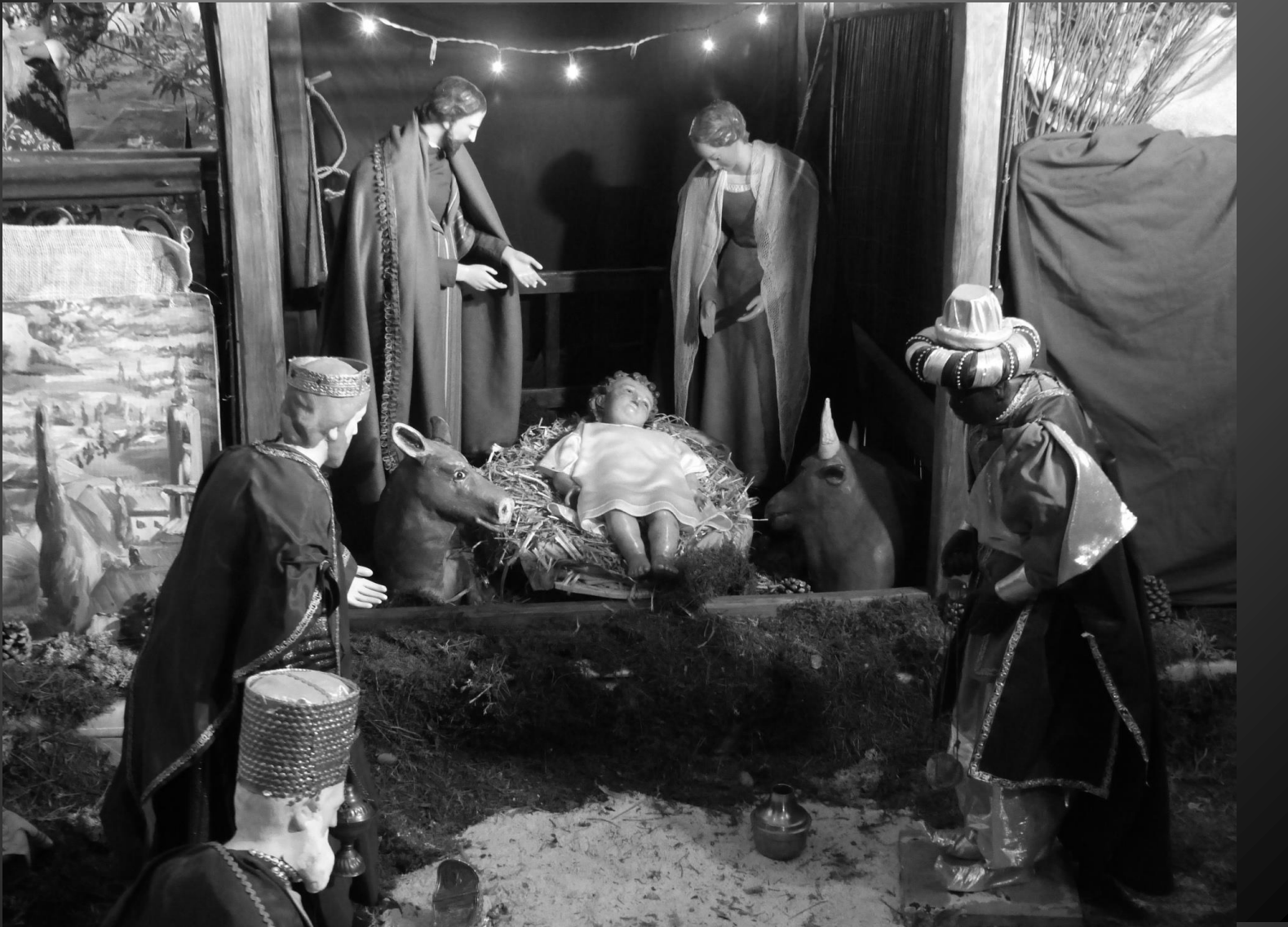
Tous les rois se prosterneront devant lui, toutes les nations le serviront. (Psaume 72:11)