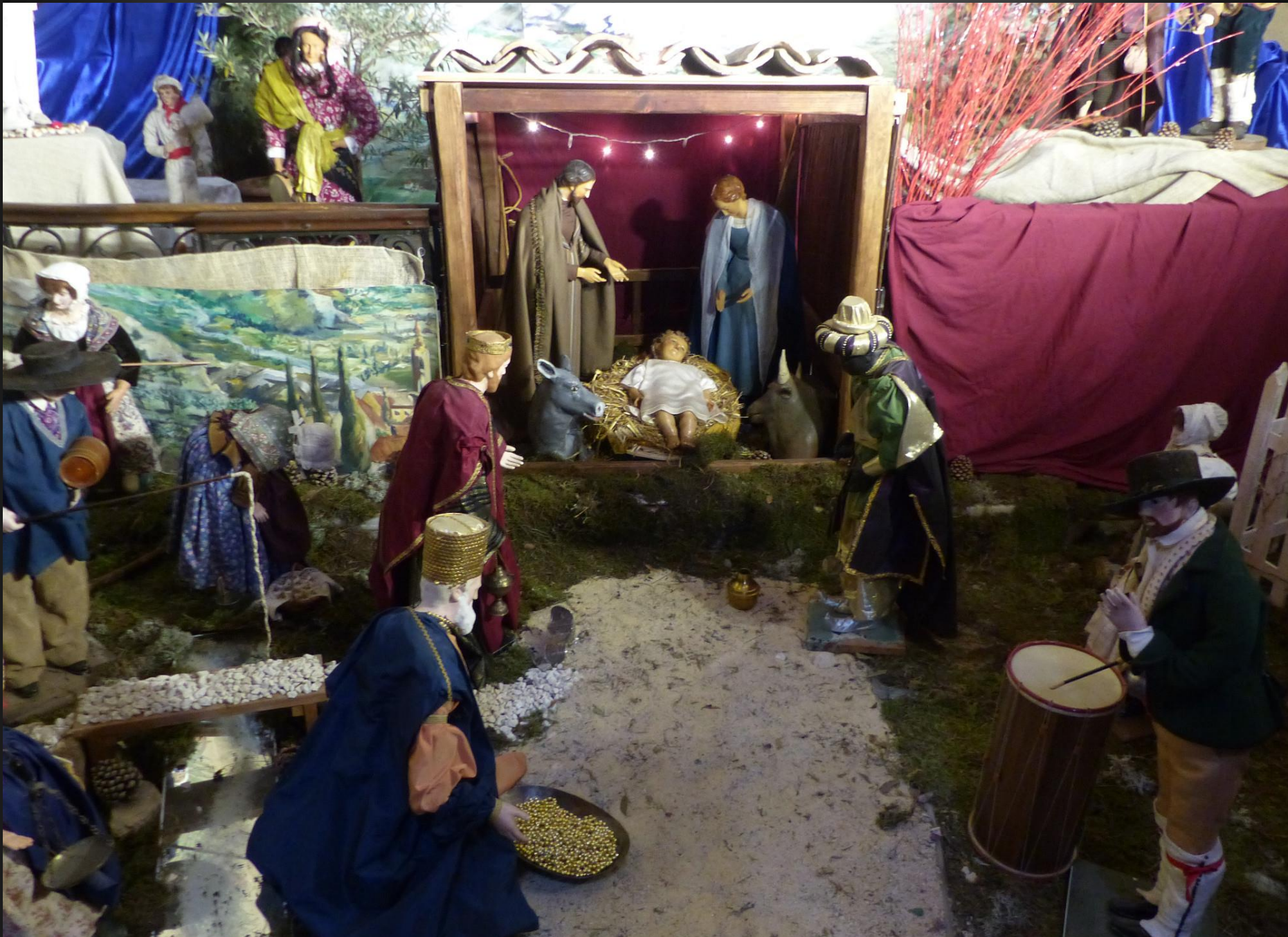
Cathédrale Saint-Sauveur _ Les Rois Mages ont apporté l'or, l'encens et la myrrhe en hommage à l'Enfant-Roi.