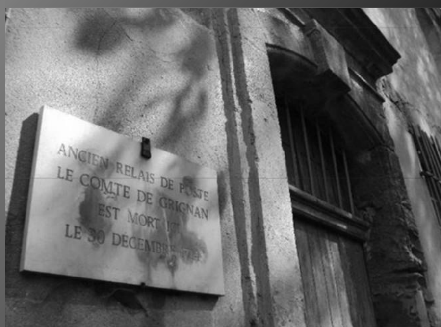
LE PONT DE SAINT-PONS_ L'ancien Relais de Poste, rive gauche de l'Arc, où décéda le Comte de Grignan, le 30 décembre 1714.