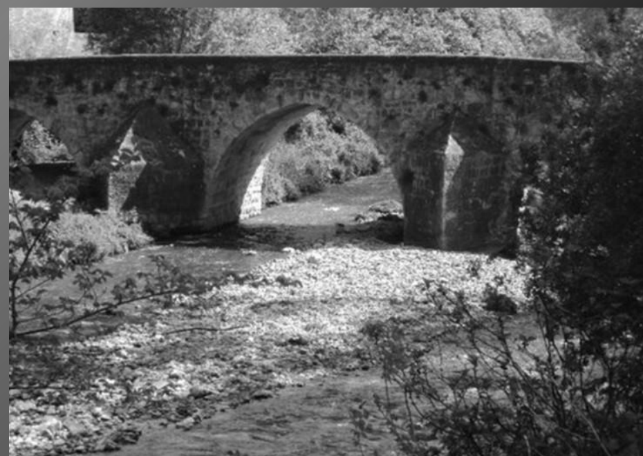
LE PONT DE SAINT-PONS _ En haut à droite, l'ancienne Hostellerie sur la rive droite.