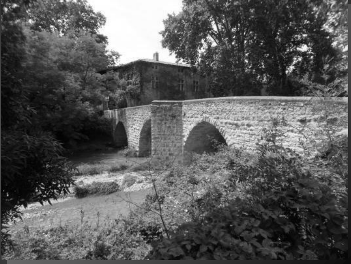
Le site bucolique du pont de Saint-Pons.