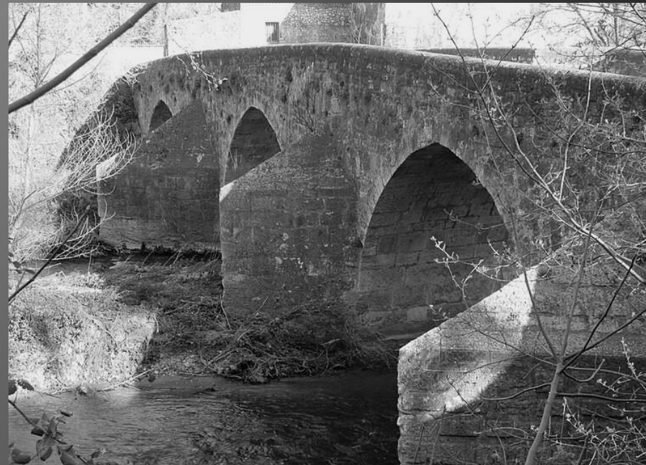
LE PONT DE SAINT-PONS_ L'imposant Relais de Poste, vu de la rive droite. L'avant-bec de la pile centrale. Vue des avant-becs triangulaires.