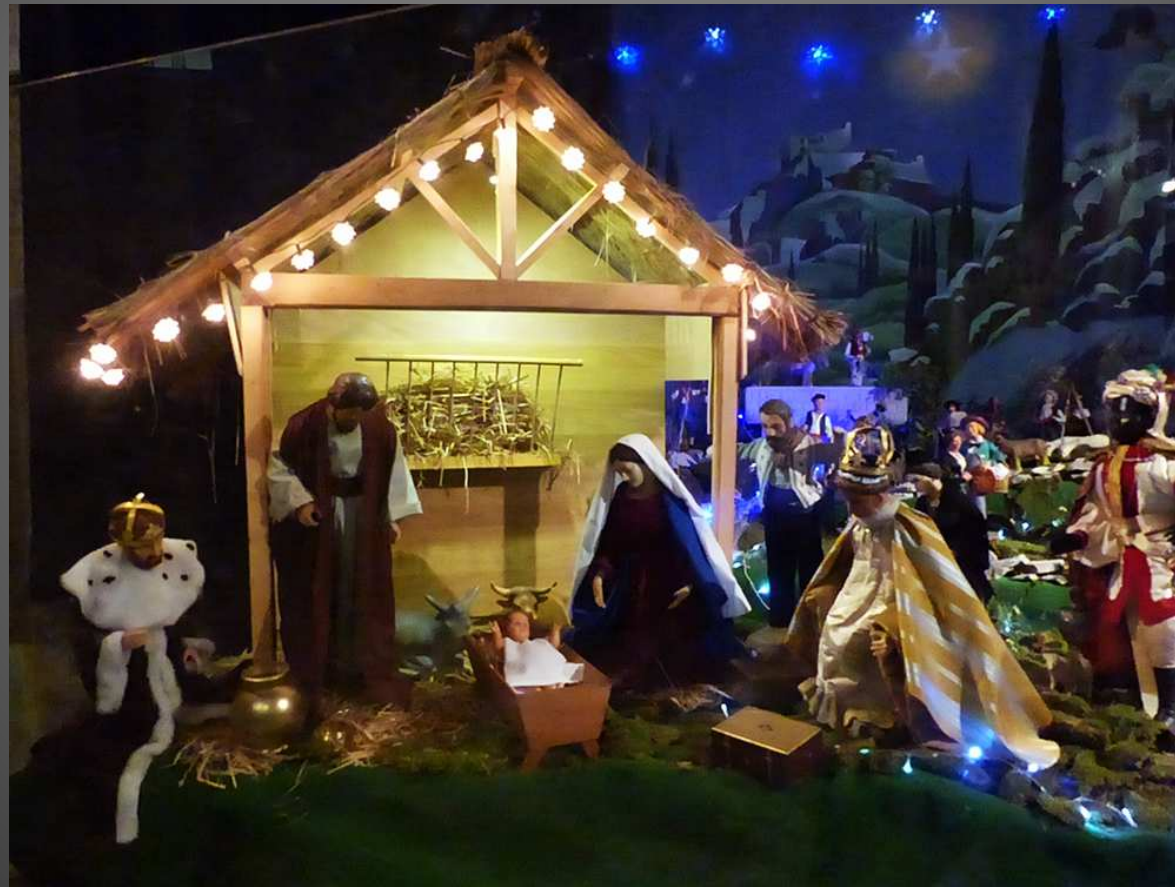
Crèche de la Primatiale, dans une chapelle rayonnante accessible par le déambulateur.