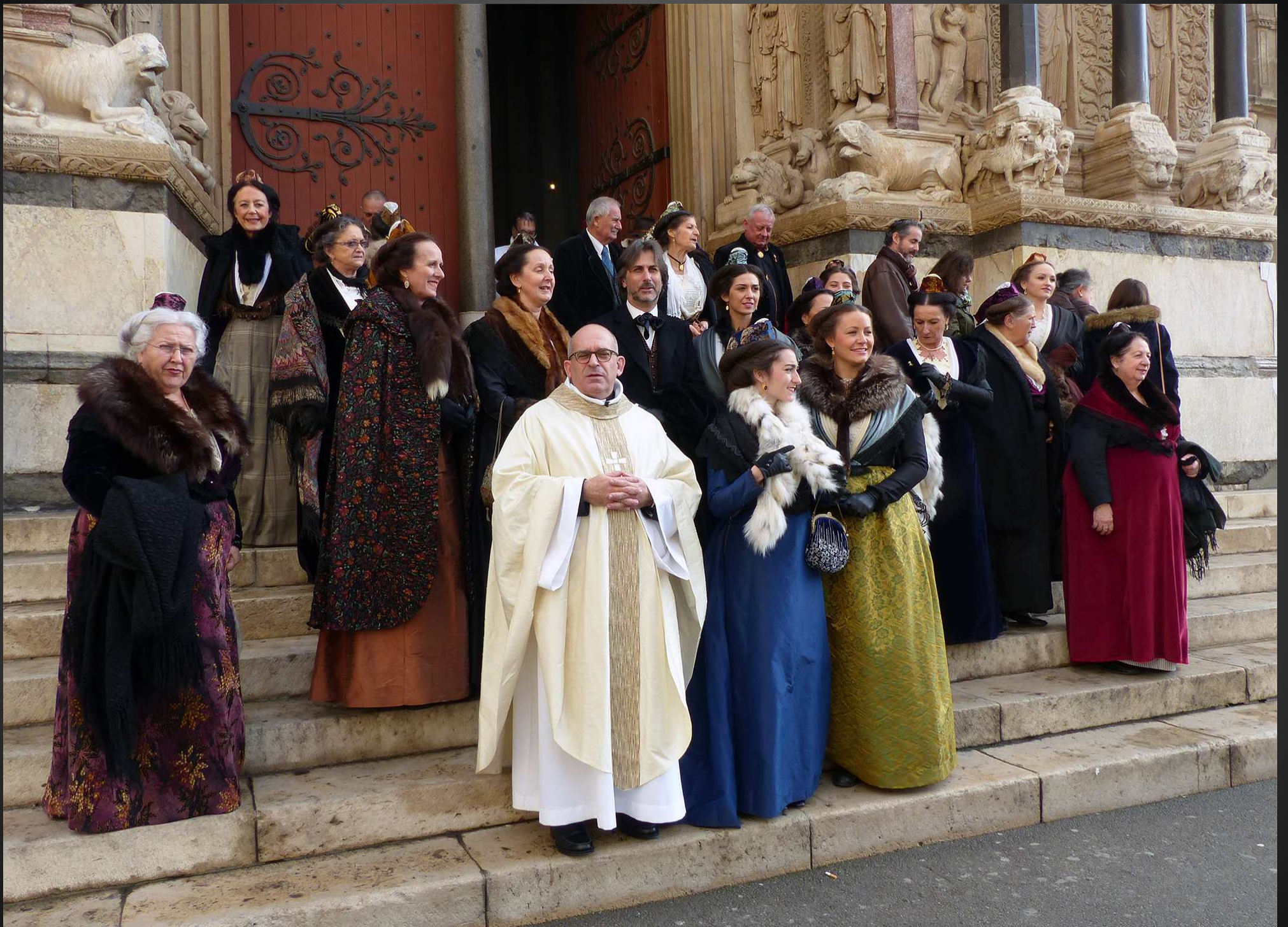
Primatiale Saint-Trophime _ La Messe du 10 janvier 2016 clôture le 58 e Salon International des Santonniers.