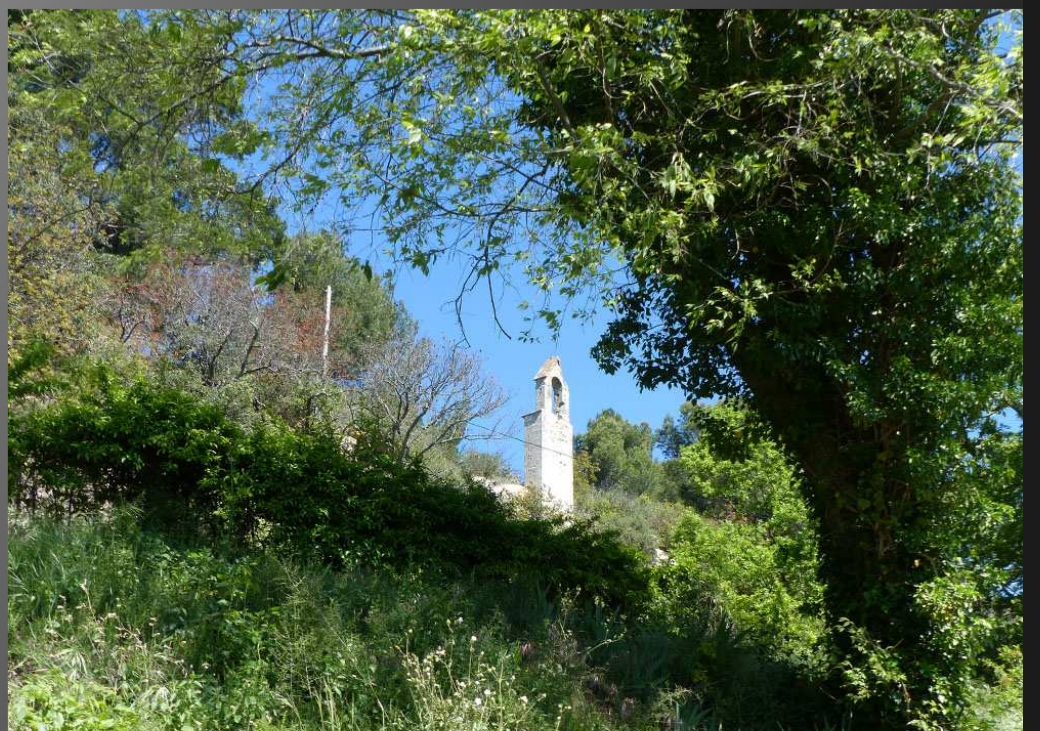
ABBAYE SAINT-PIERRE-DES-CANONS _ Un coup d'œil à l'oratoire gothique de l'ancien ermitage qui se dresse sur les hauteurs.