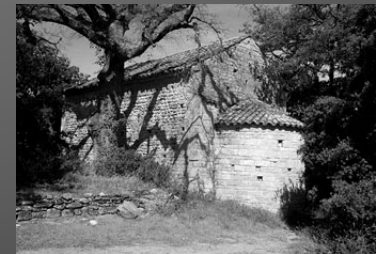
La chapelle St-Martin du Sonnailler, en direction de Vernègues, XIIe siècle.