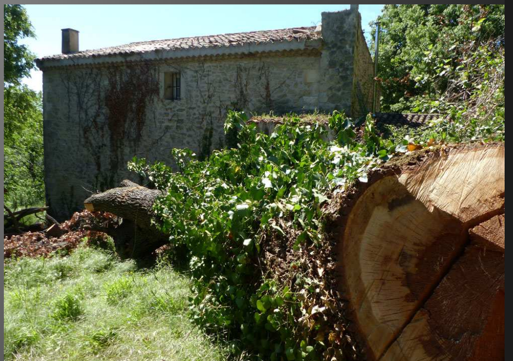
ABBAYE SAINT-PIERRE-DES-CANONS _ Un énorme chêne qui menaçait de tomber sur une dépendance a été abattu et va être débité...