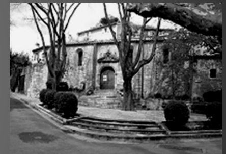
L'église paroissiale Saint-Pierre-ès-Liens.