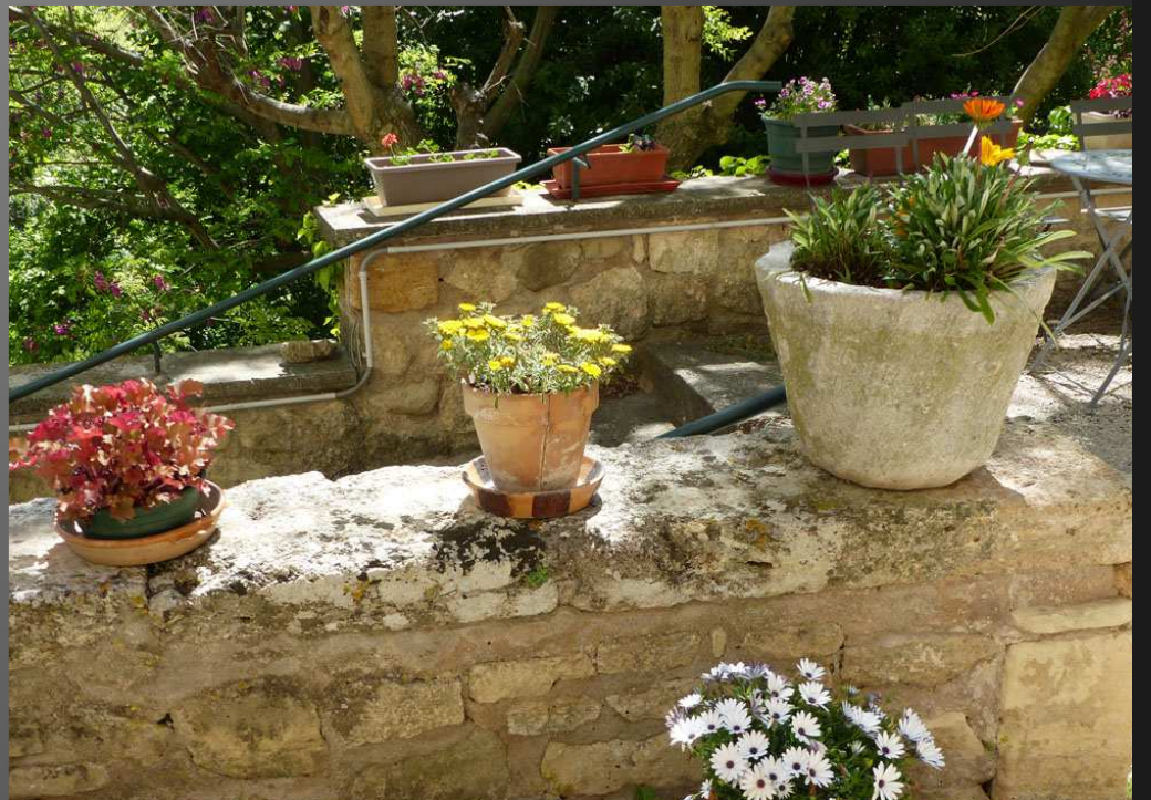
ABBAYE SAINT-PIERRE-DES-CANONS _ De multiples espèces florales décorent de touches multicolores les abords de la façade Renaissance de l'abbaye.