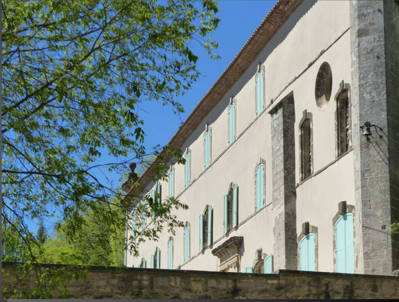
ABBAYE SAINT-PIERRE-DES-CANONS _ Par temps de mistral, la longue façade méridionale de l'abbaye est éclaboussée de soleil.