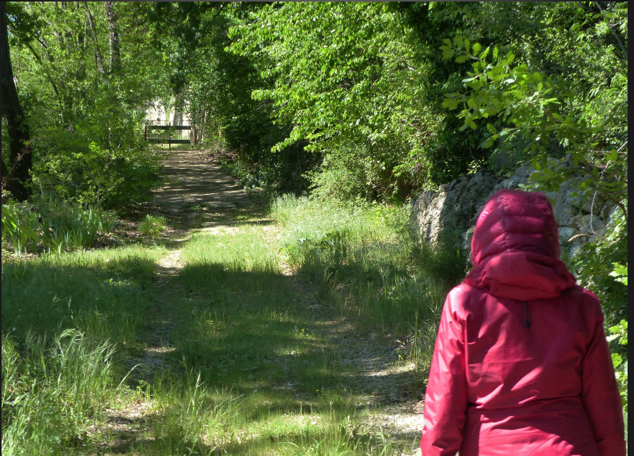
ABBAYE SAINT-PIERRE-DES-CANONS _ Retour vers l'Abbaye sur ce verdoyant sentier voûté d'une exubérante frondaison.