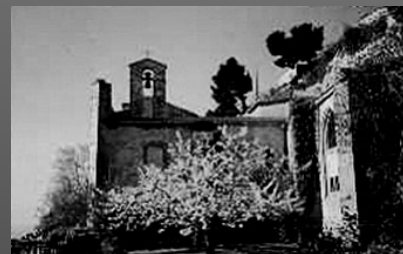
L'abbaye Saint-Pierre-des-Canons, très prospère au XVIIe siècle.