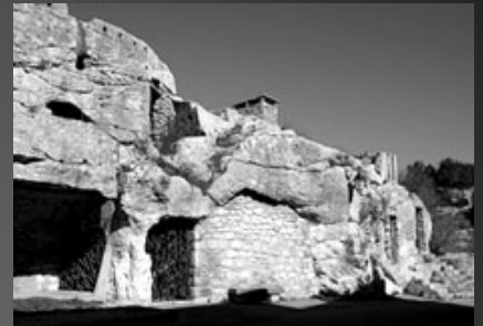
Les grottes du Castellas, à Aurons.

Cette statue de la Vierge à l'Enfant était à son origine au centre de la cour du château de la Marquise de Florans édifié en bordure de la D68 où quelques vestiges tels que les deux tours ou colonnades subsistent encore. Un pèlerinage a lieu chaque année la veille du 15 août.