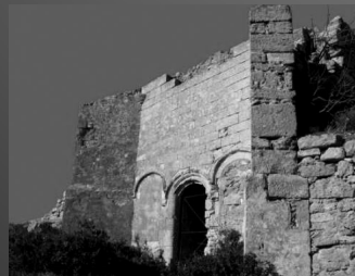
Façade de la chapelle rupestre de Ste-Croix, XIe siècle (Ve ?)