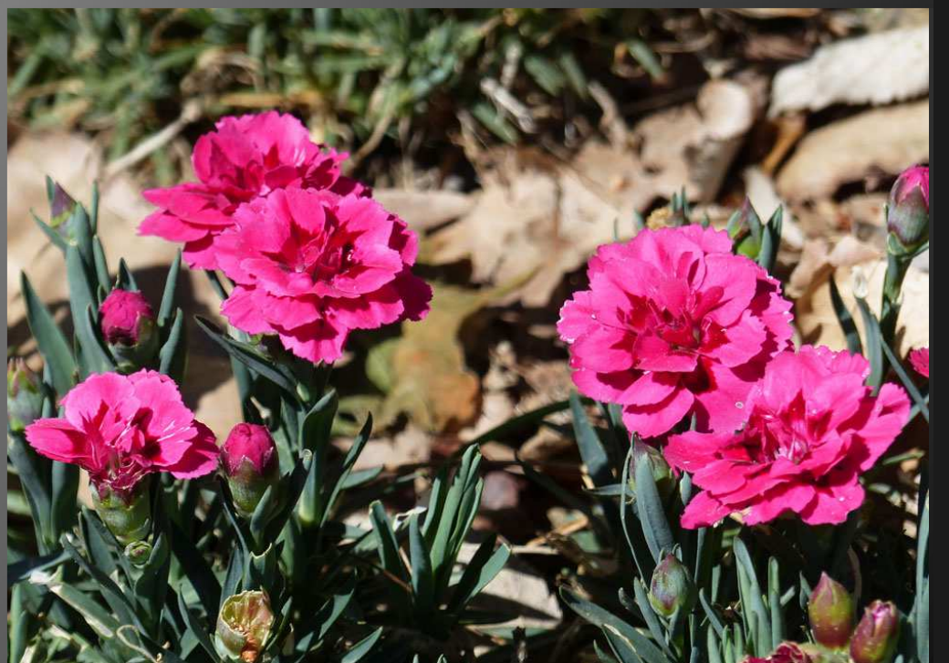
ABBAYE SAINT-PIERRE-DES-CANONS _ Dès le portail d'entrée franchi, des fleurs au pied de la falaise offrent au visiteur des couleurs printanières et des senteurs printanières.