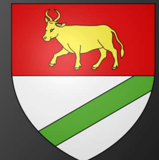
Blason d'Aurons : Coupé de gueules à un bœuf d'or, et d'argent à la barre de sinople.