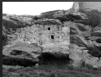
Baume fortifiée de Ste-Croix, au NE de Salon-de-Provence.