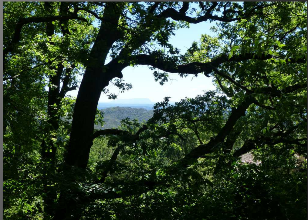
ABBAYE SAINT-PIERRE-DES-CANONS _ Au détour du chemin qui descend vers le parc, Sainte-Victoire apparaît dans le lointain, à travers les branchages de la chênaie.