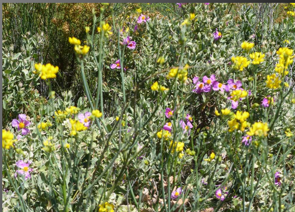
ABBAYE SAINT-PIERRE-DES-CANONS _ Le pigeonnier se montre à travers les branchages, tandis que le sentier sort de l'ombre des grands chênes et avance entre des tapis de fleurs sauvages.