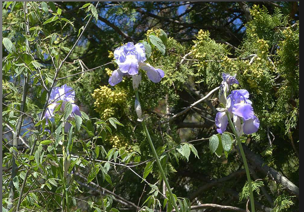
ABBAYE SAINT-PIERRE-DES-CANONS _ A la sortie du tunnel donnant accès au parc, de magnifiques iris – famille des Iridaceae – saluent à leur tour les visiteurs...