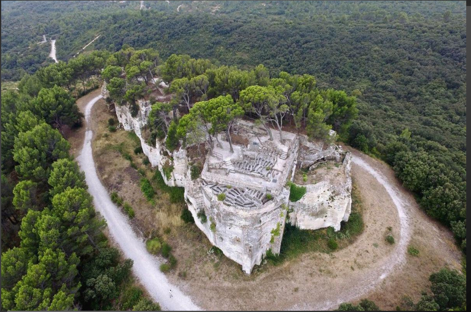
Le rocher de l'Abbaye de Saint-Roman.