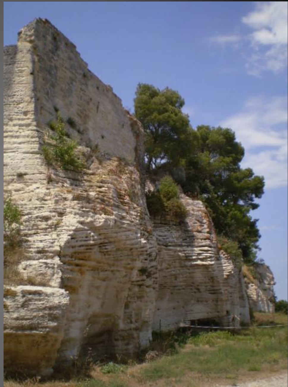
BEUCAIRE _ Le rocher de l'Abbaye de Saint-Roman.

Le chemin des moines serpente jusqu'au sommet de la colline calcaire, à travers les plantes et les odeurs de la garrigue méditerranéenne.