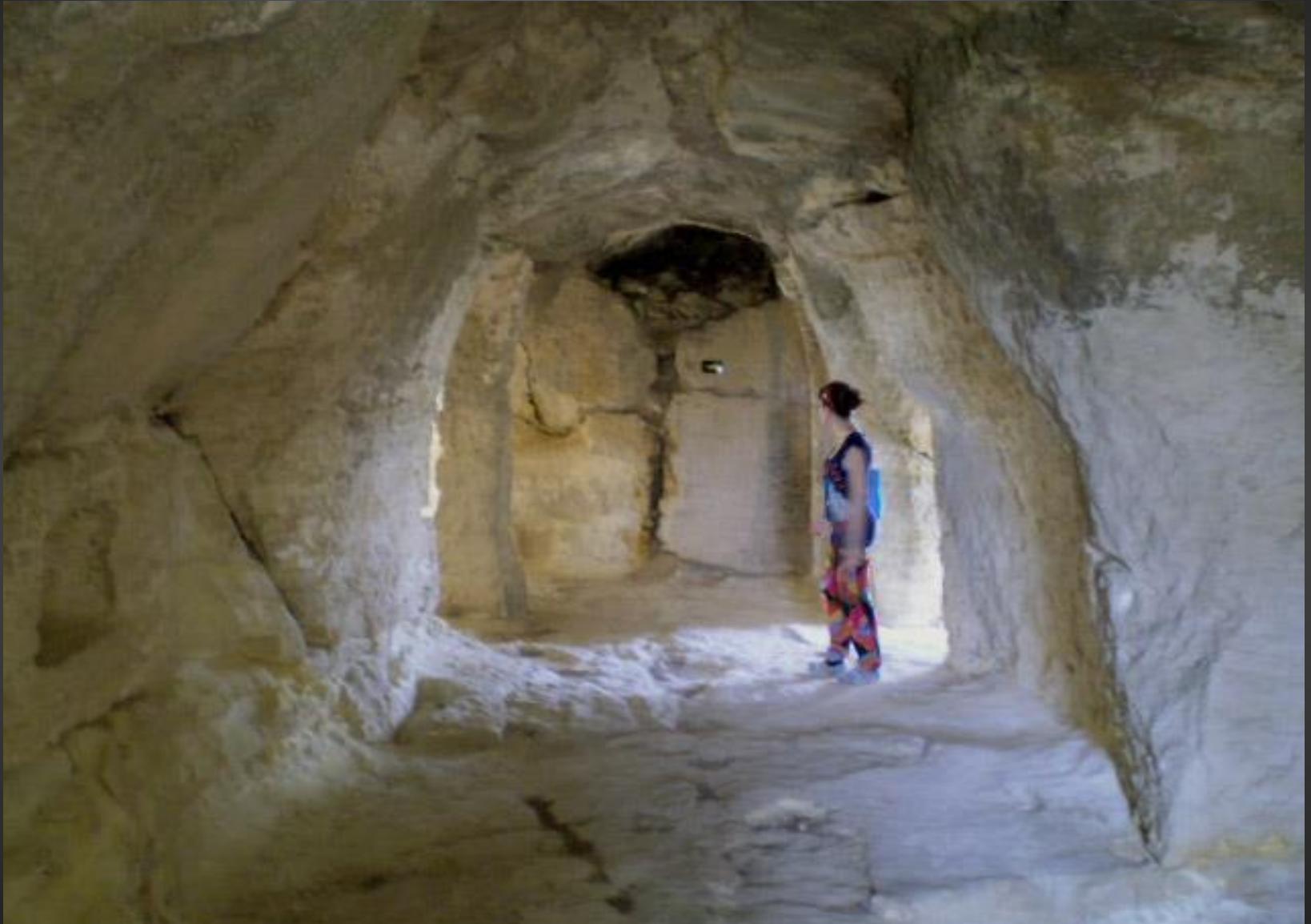
Un vrai labyrinthe de pierre.