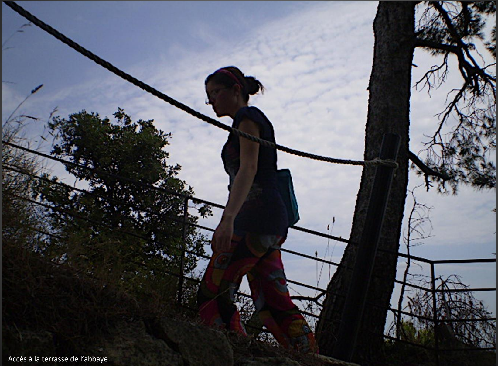
Accès à la terrasse de l'abbaye.