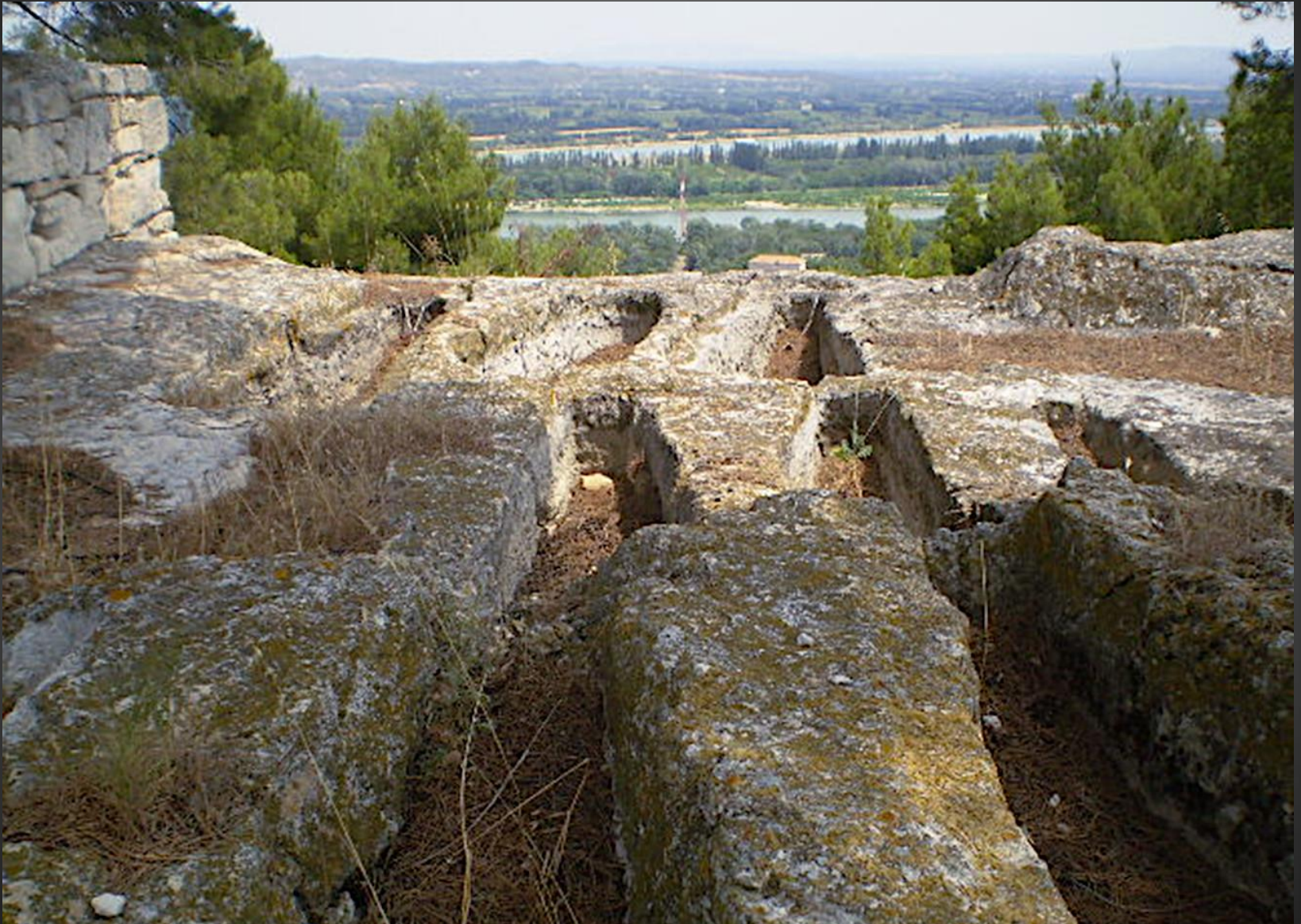
La nécropole domine la vallée du Rhône. Ces tombes creusées dans le roc rappellent celles de l'abbaye de Montmajour