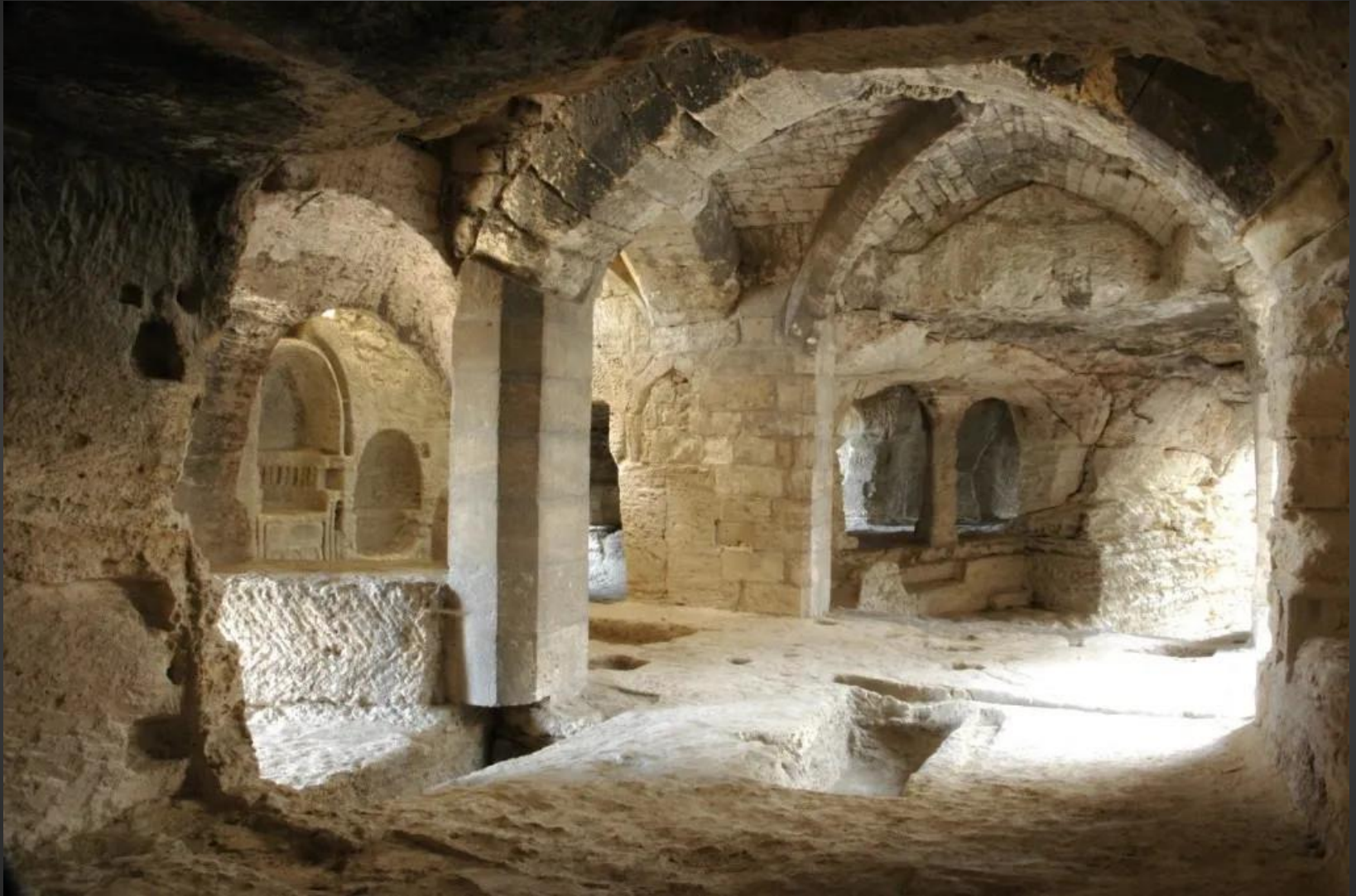
Vue générale de la chapelle.