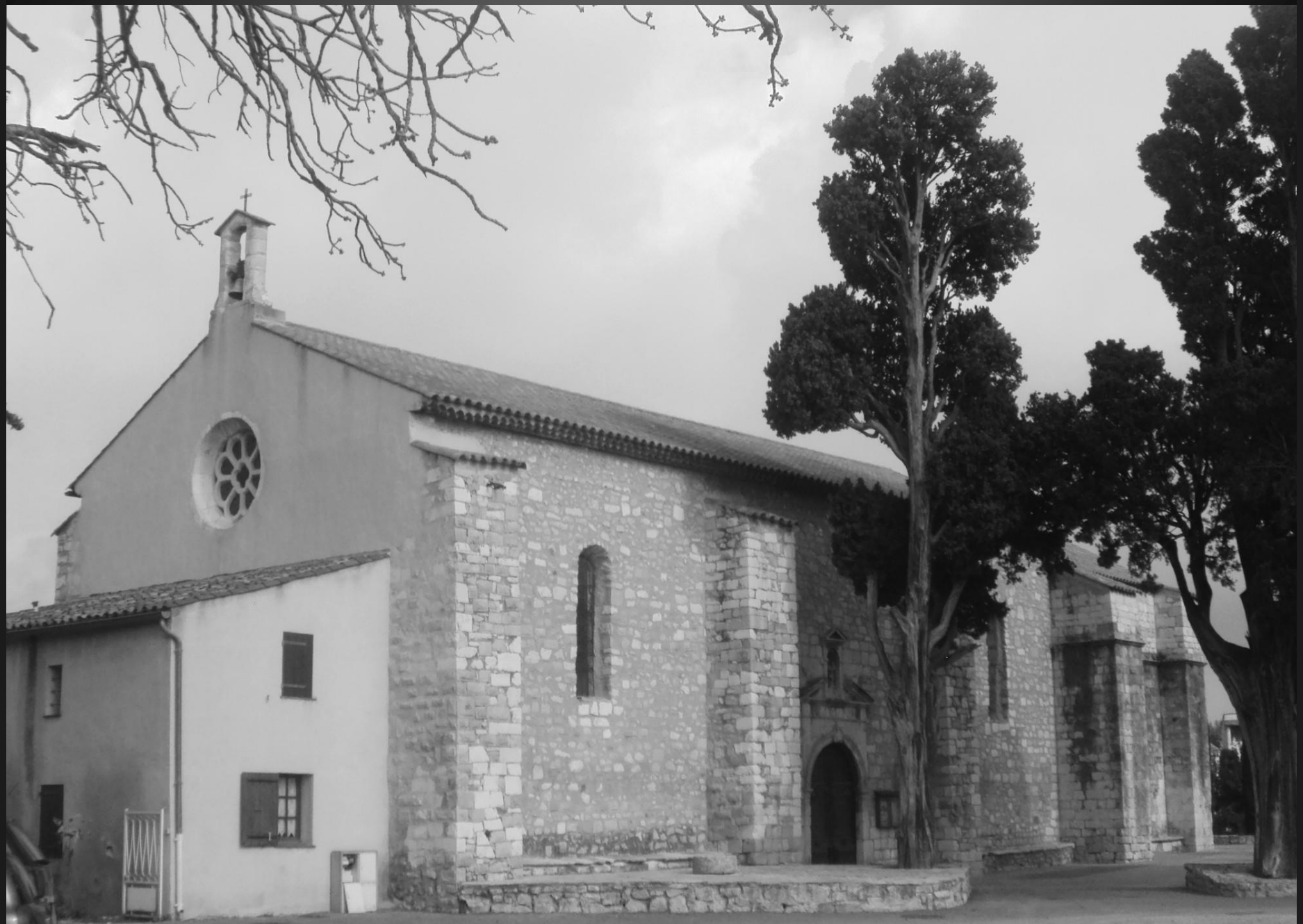
NOTRE-DAME DE CADEROT _ Vue générale de la chapelle (longue de 32 mètres) et de ses larges contreforts.