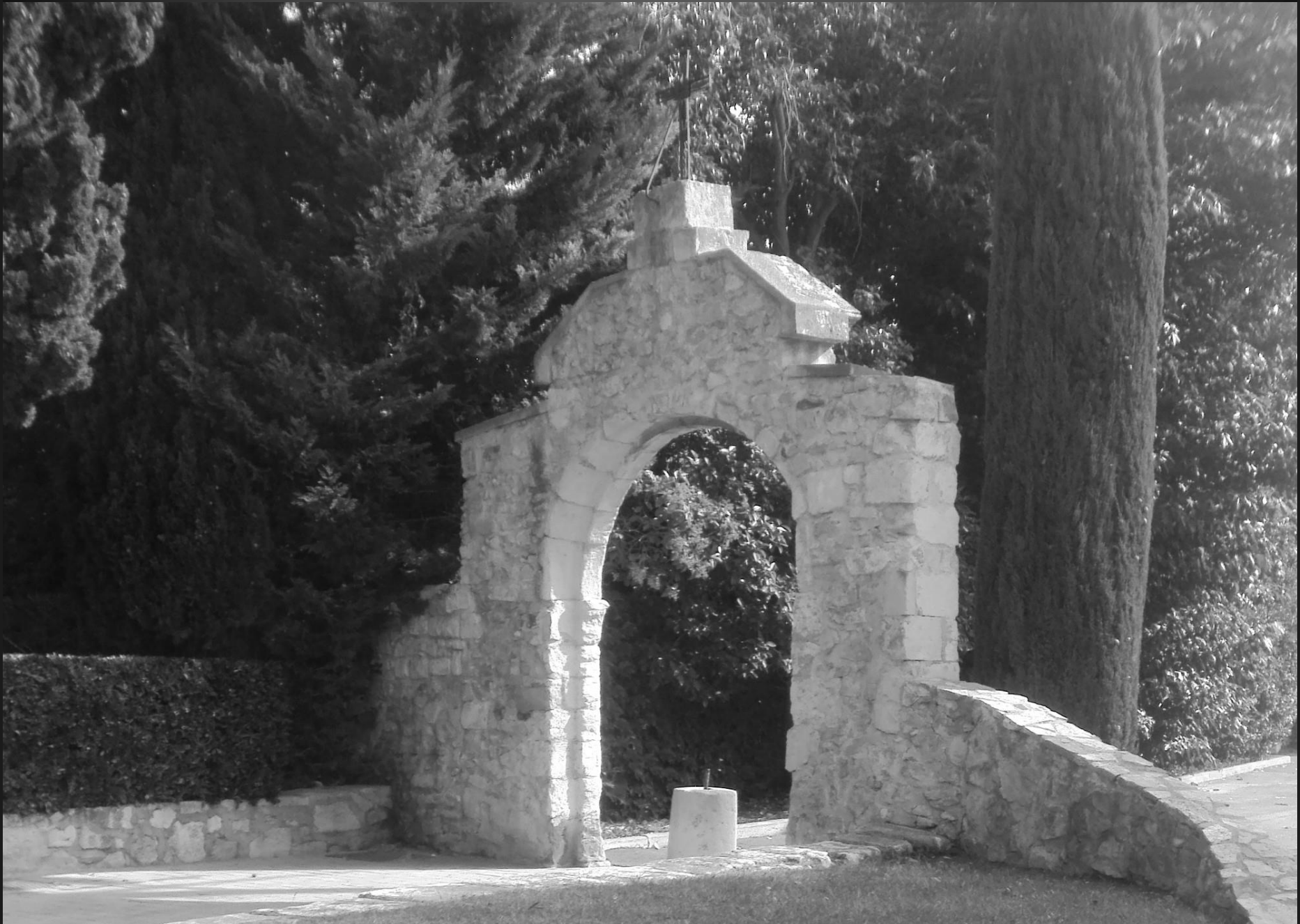
NOTRE-DAME DE CADEROT _ La moitié de la population de la commune a succombé à la Peste de 1720, introduite à Marseille sur le « Grand Saint-Antoine » en provenance de Syrie.