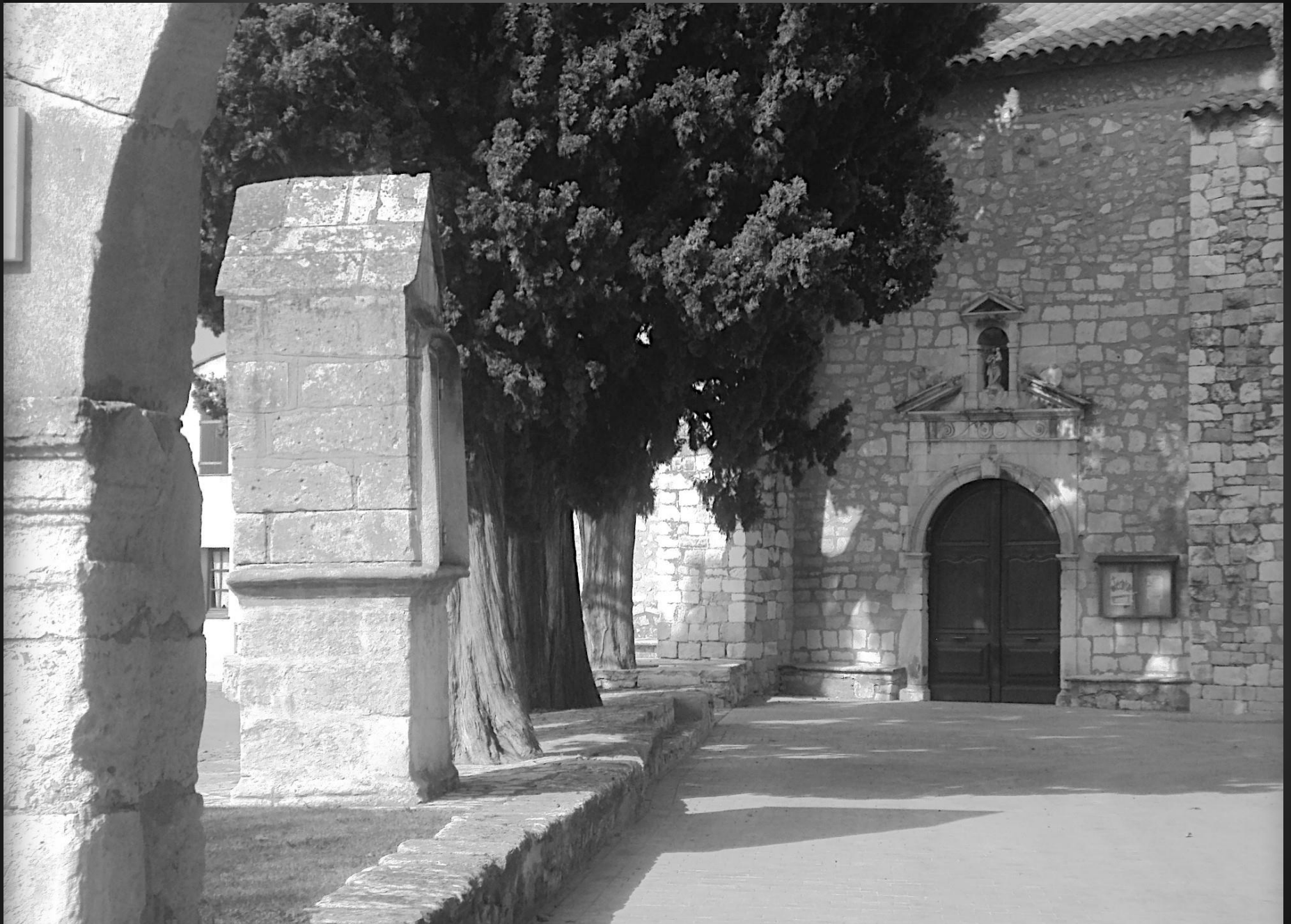
NOTRE-DAME DE CADEROT _ Les cyprès sont plantés sur deux tranchées où les 1701 victimes de la peste de 1720 ont été enterrées. Un mémorial en hommage aux victimes a été érigé dans le jardin de Caderot en septembre 1993.