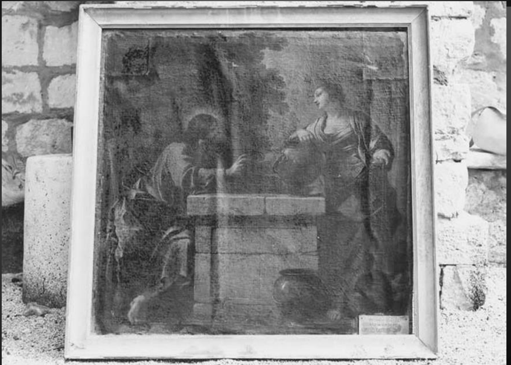
NOTRE-DAME DE CADEROT _ Tableau : Jésus et la Samaritaine.