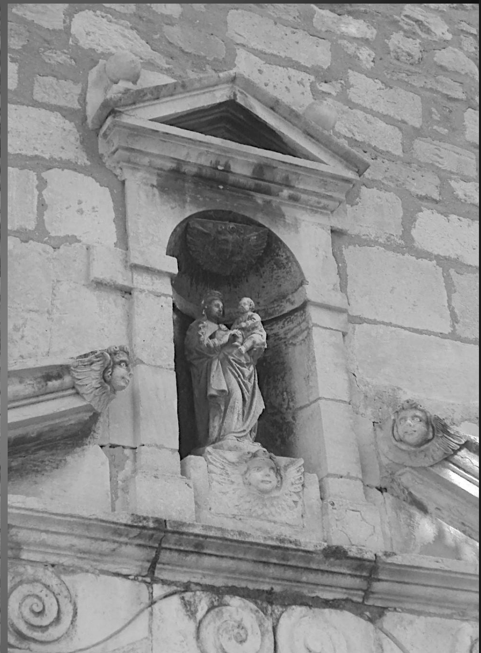
NOTRE-DAME DE CADEROT _ Le portail d'entrée est surmonté d'une niche avec une statue de la Vierge à l'Enfant.