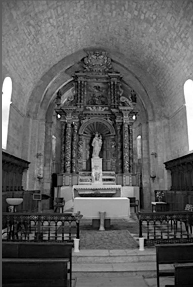
NOTRE-DAME DE CADEROT Le retable en bois de bois polychrome de 1507 devant l'abside romane.