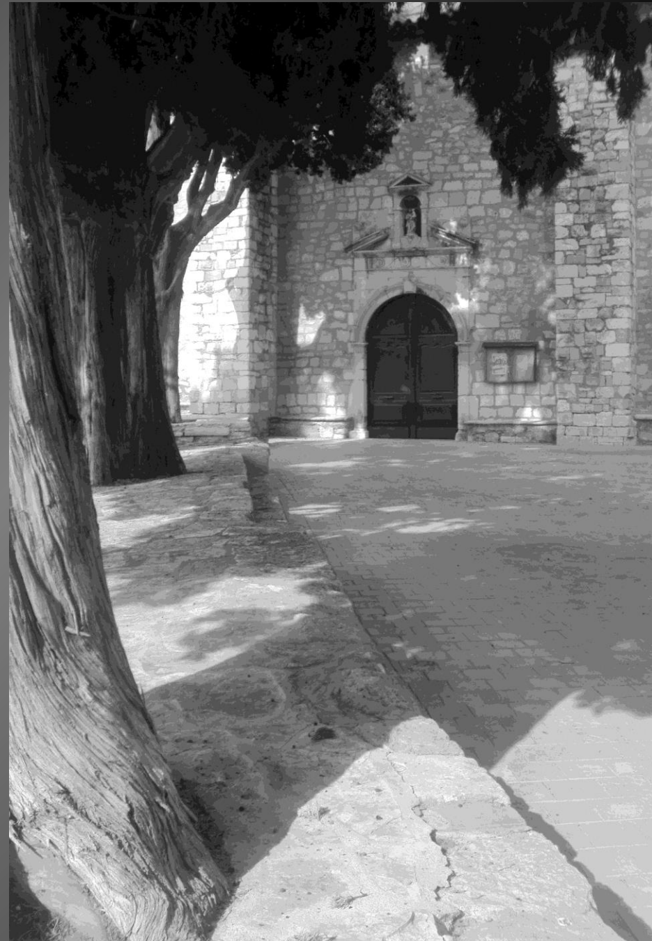
NOTRE-DAME DE CADEROT _ Ces ossuaires font l'objet d'une cérémonie du souvenir le 16 août de chaque année, jour de la fête de Saint Roch et date de la disparition de la peste en 1721.