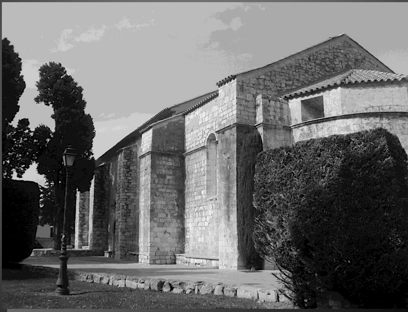
BERRE L'ETANG Chapelle Notre-Dame de Caderot