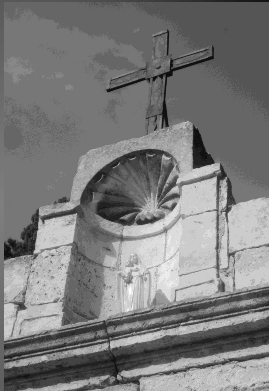
NOTRE-DAME DE CADEROT _ Le portail surmonté d'une niche donne accès au parc Vailhen-Maurin.