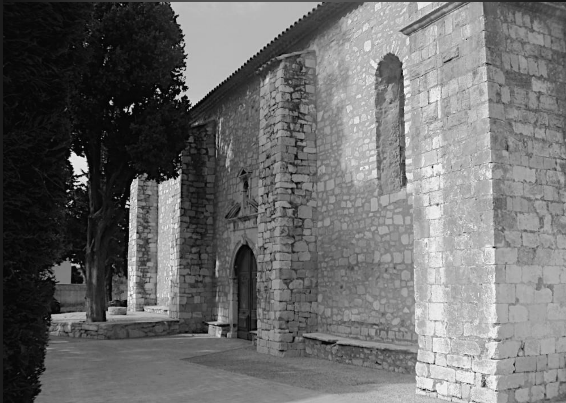
NOTRE-DAME DE CADEROT _ Des contreforts massifs se dressent au niveau de l'arc triomphal qui sépare le nef du chœur.