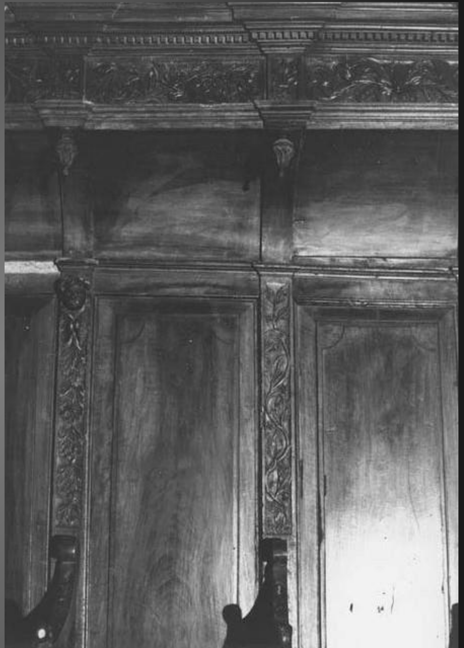
Détail des stalles sculptées.