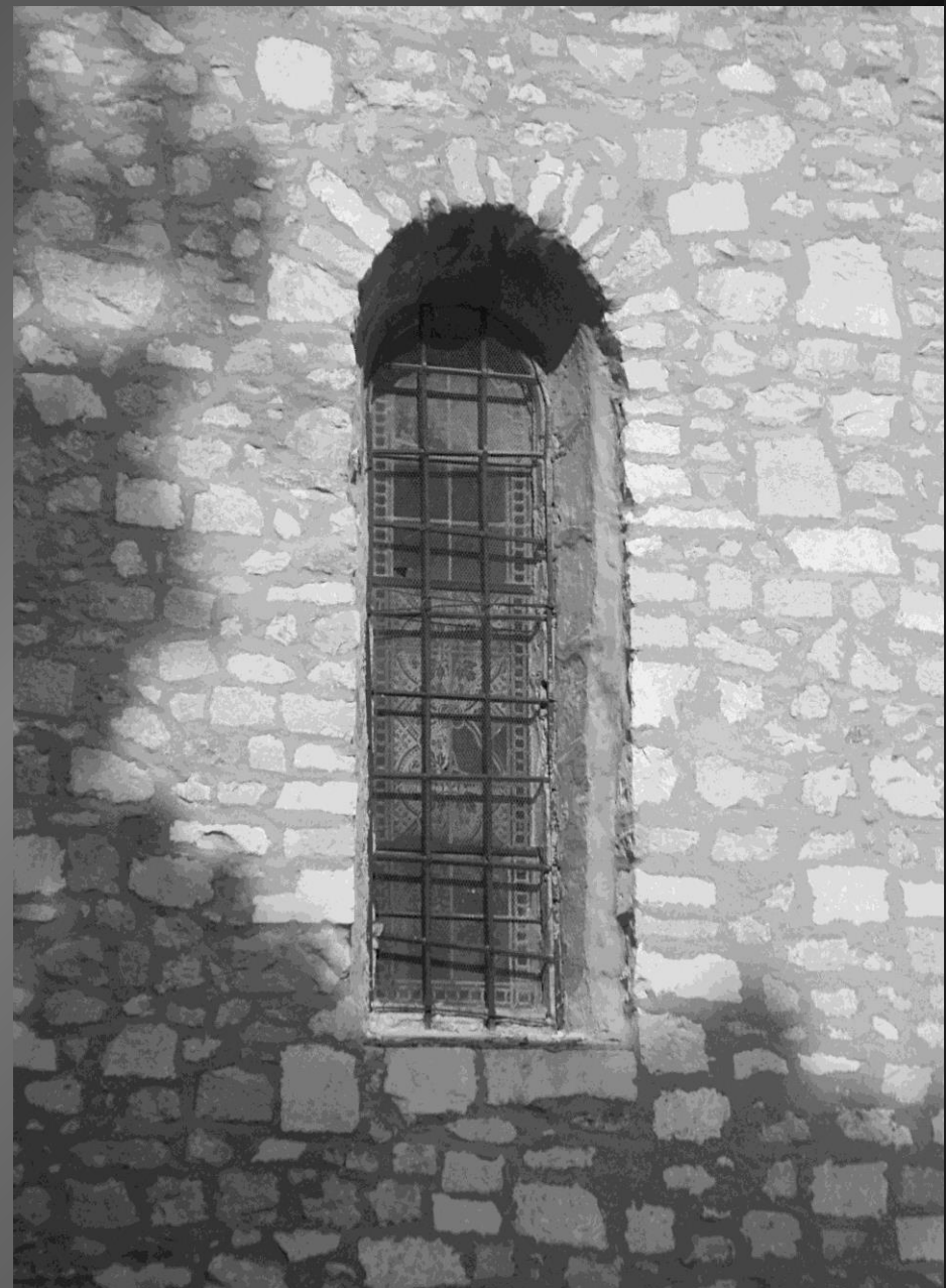
NOTRE-DAME DE CADEROT _ L'édifice roman a peu d'ouvertures. A droite du portail d'entrée, une étroite baie en plein cintre donne un peu de lumière à la nef.