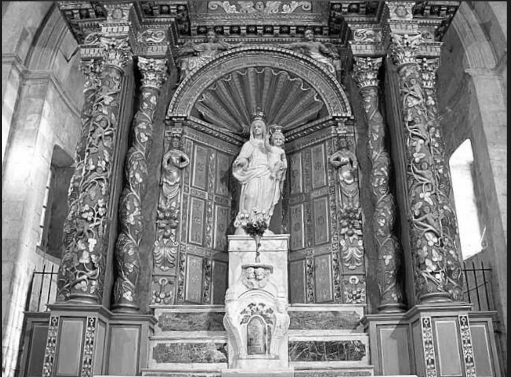
NOTRE-DAME DE CADEROT _ Le retable en bois de bois polychrome de 1507 avec une statue en marbre de la Vierge à l'Enfant, l'autel, et le tabernacle.