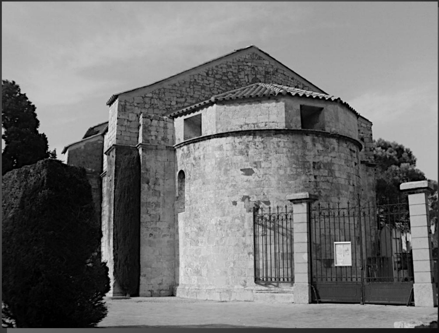
NOTRE-DAME DE CADEROT _ L'abside circulaire, est surmontée d'un toit à six pans.