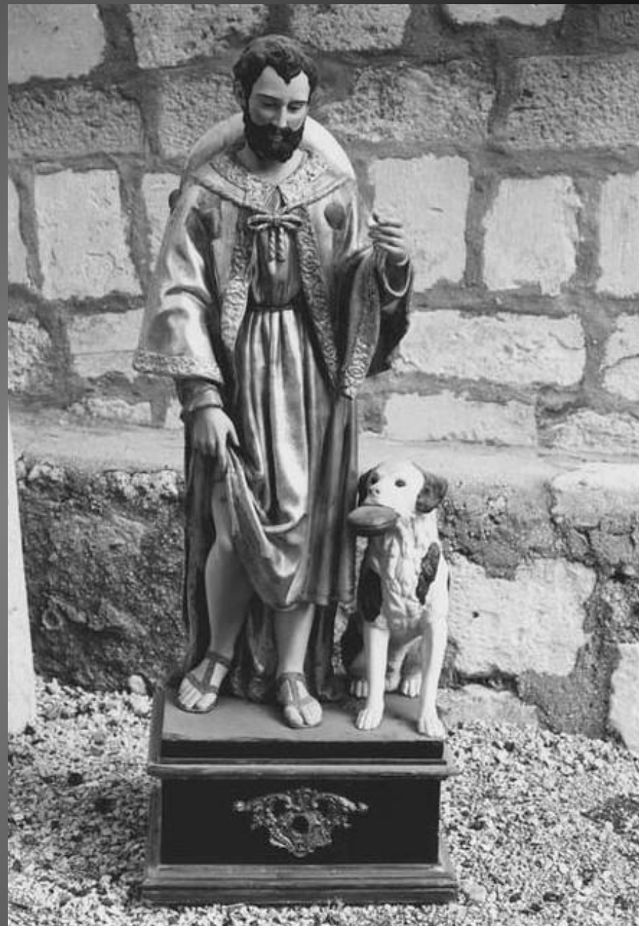
NOTRE-DAME DE CADEROT _ Statues de saint Jean-Baptiste (à gauche) et de saint Roch (à droite).