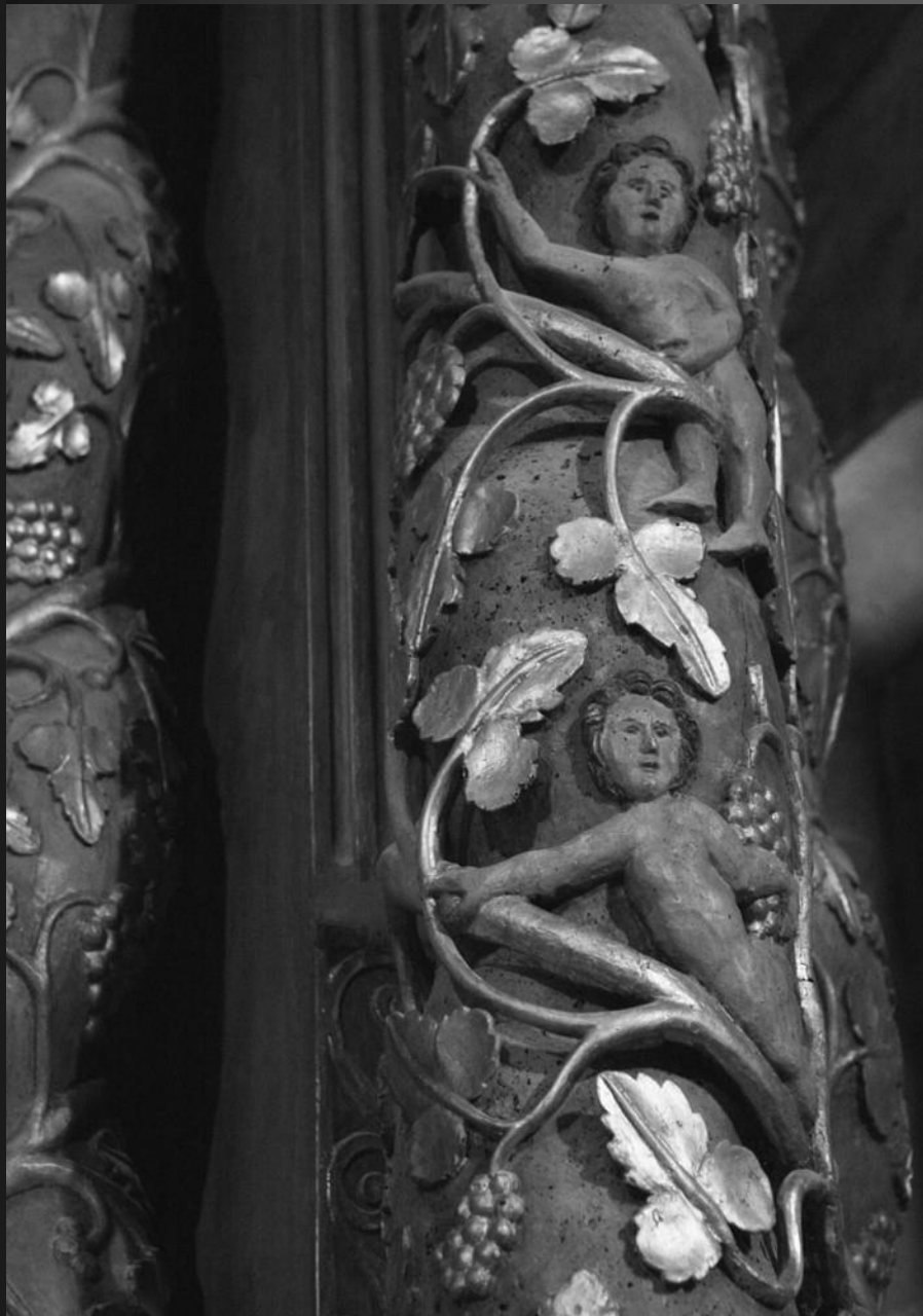
NOTRE-DAME DE CADEROT _ Détail des colonnes ouvragées du retable.