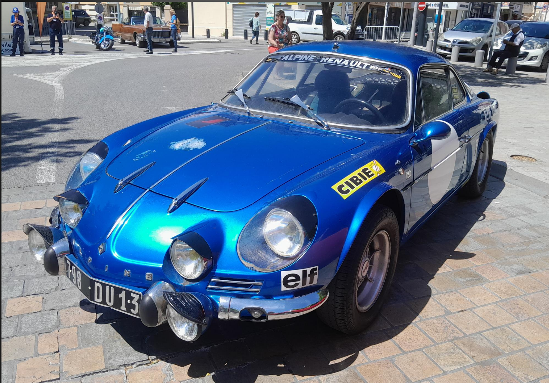
BERRE L'ETANG _ Voiture de légende, l'Alpine A110 est fabriquée à partir de mécaniques Renault à de 1962 à 1977. Elle est la voiture de rallye la plus performante en 1971, début d'un historique unique dans le sport automobile face aux Porsche 911, Ford Escort Twin cam et Lancia Fulvia HF. En 1971, Alpine remporte son premier titre de champion d'Europe des constructeurs en rallye. En 1973, elle est sacrée premier champion du monde des rallyes avec 155 points devant Fiat (89 points) et Ford (76 points).