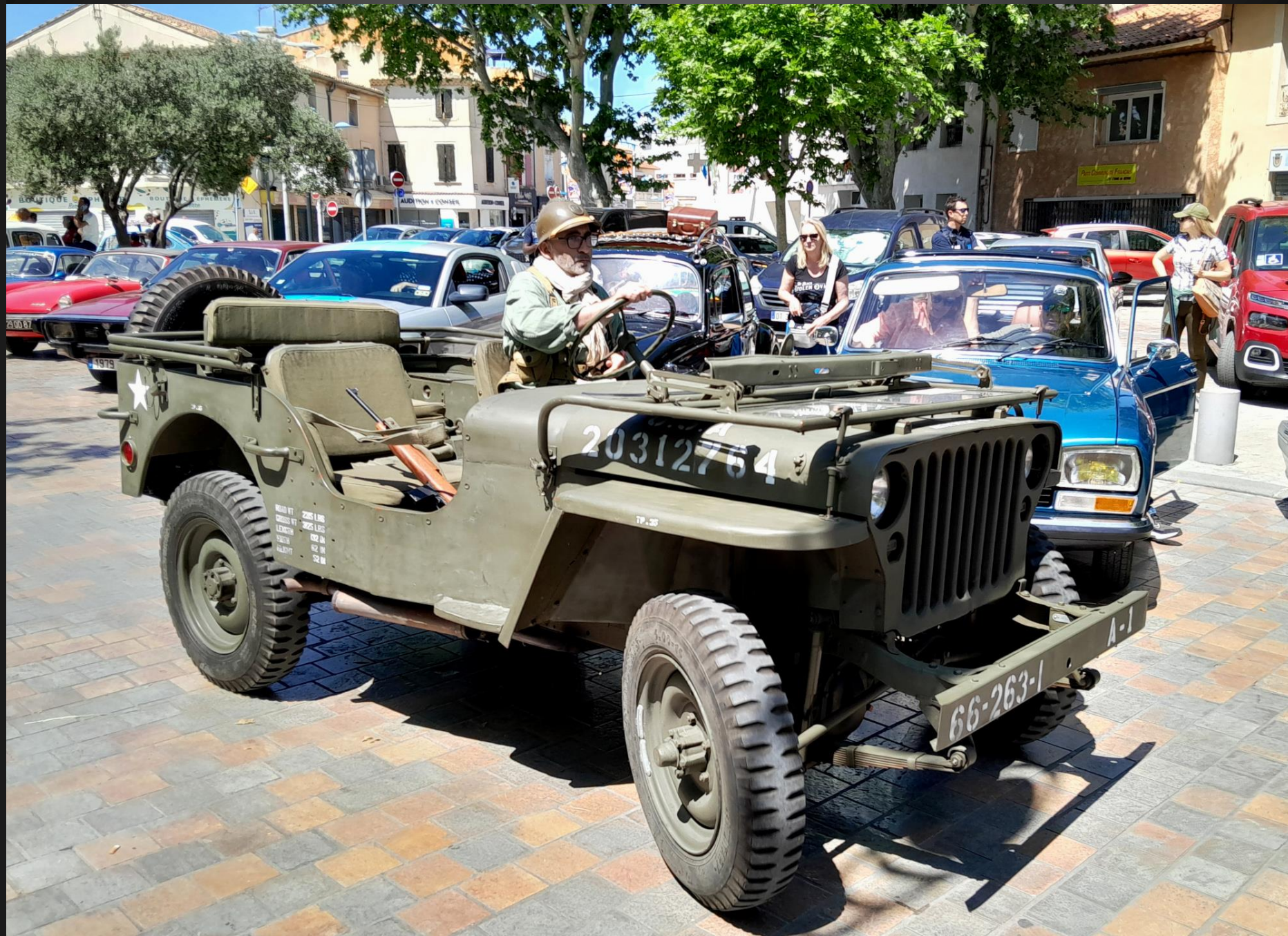
BERRE L'ETANG _ A la fin de la guerre, l'armée Française disposait de 22 000 Willlys ou Ford « Jeep » bien rincées par les combats.