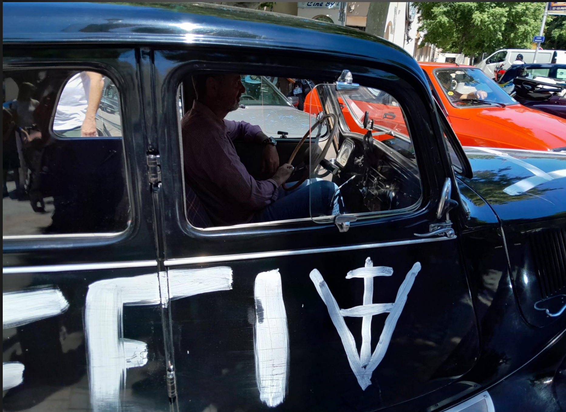
BERRE L'ETANG _ 760 000 exemplaires de la Traction Avant ont été produits. Un rare Cabriolet 11BL de 1939 serait estimé aujourd'hui entre 80.000 et 100.000 €.