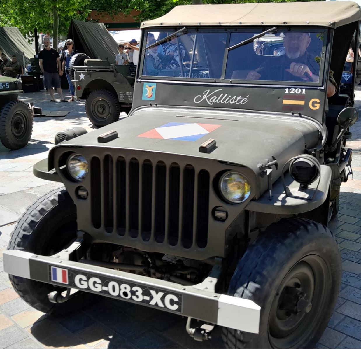
BERRE L'ETANG _ Après la guerre, des licences de fabrication sont vendues à 11 pays pour produire des 'Jeep' de Willys-Overland.