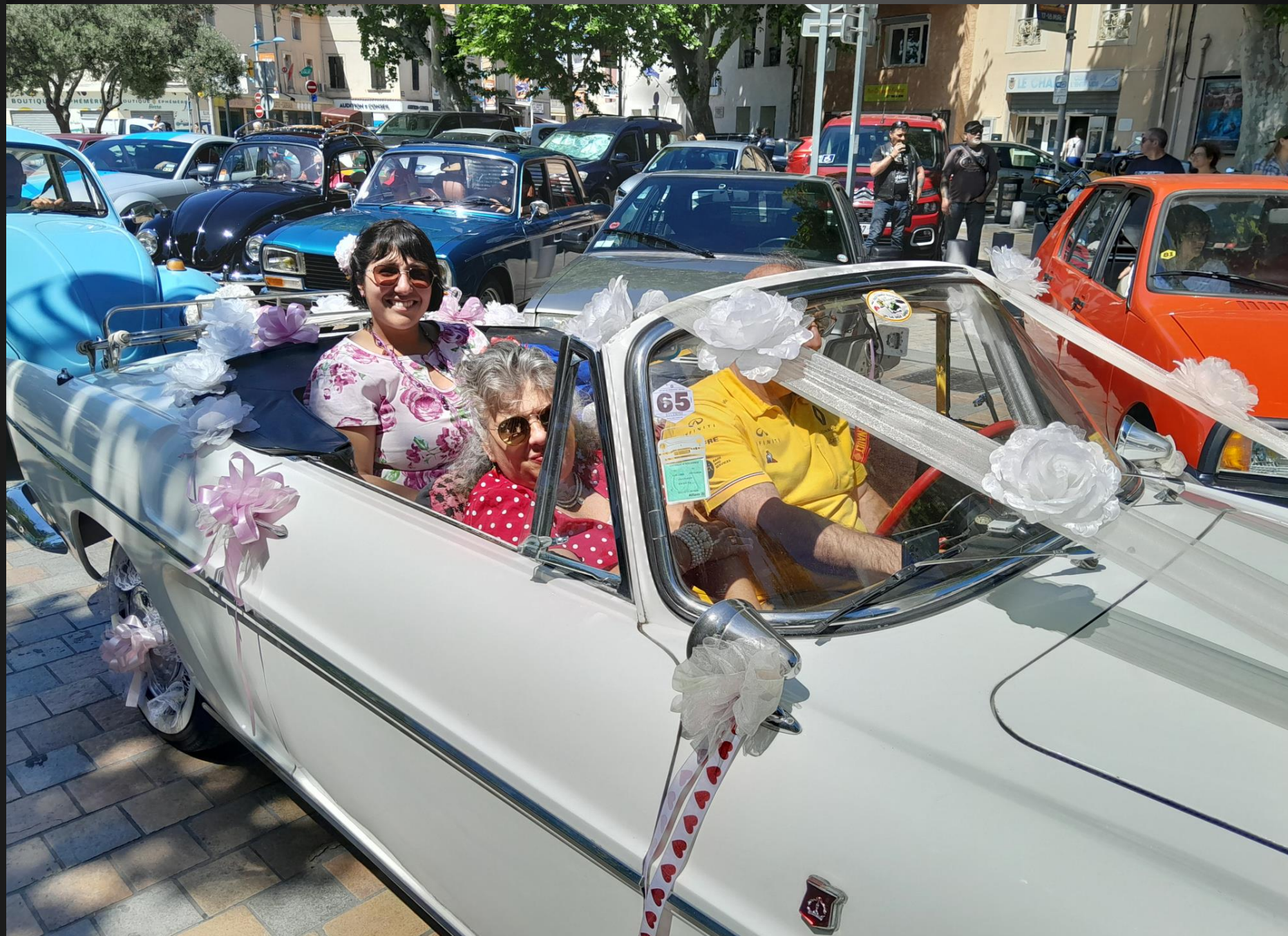
BERRE L'ETANG _ Qui n'a pas connu les élégantes Renault Floride et Caravelle fabriquées à 117 039 exemplaires entre 1958 et 1968 ?