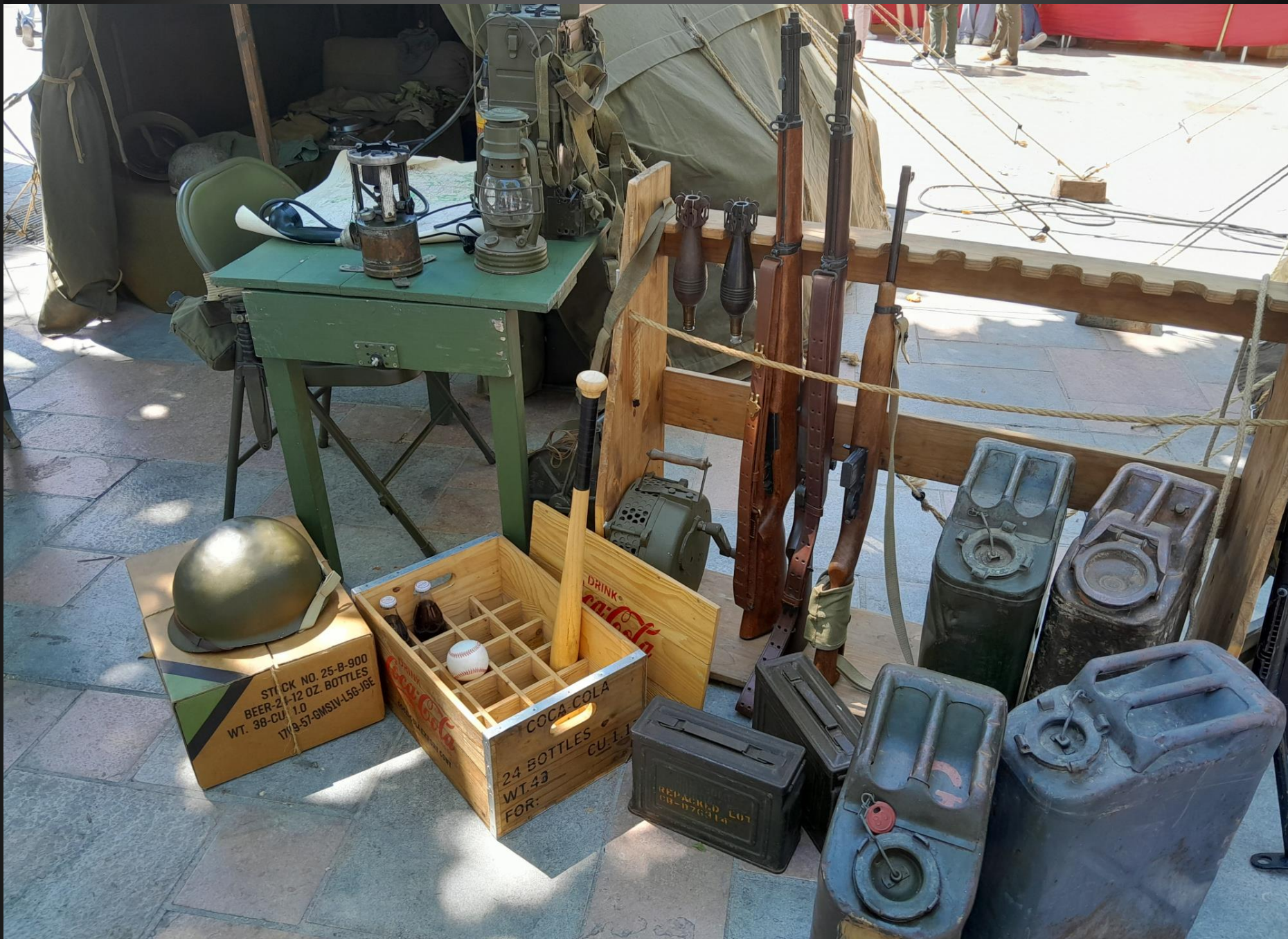
BERRE L'ETANG _ Le campement, matériels divers.