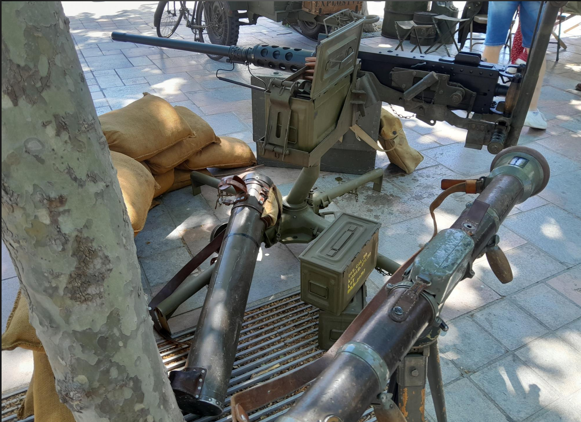
BERRE L'ETANG _ Le campement, mitrailleuse lourde Browning calibre 50 M2 HB (12,7 mm), portée terrestre 1200m, objectif terrestre : 1200 m, cadence de tir 150 c/mn, perforation : 20 mm d'acier à 400 m.