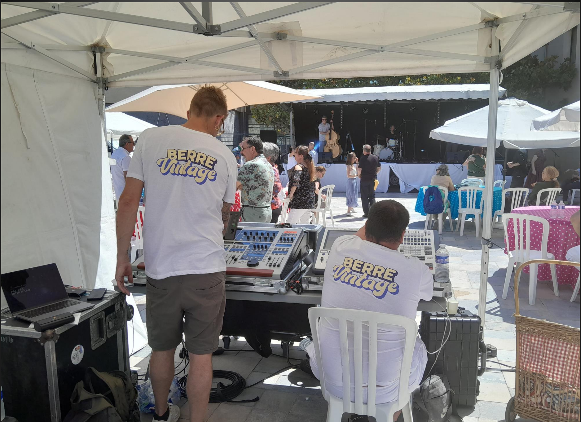
BERRE L'ETANG _ L'orchestre Lollipop & Boy's joue sur la scène, en régie on surveille le volume et la qualité du son .