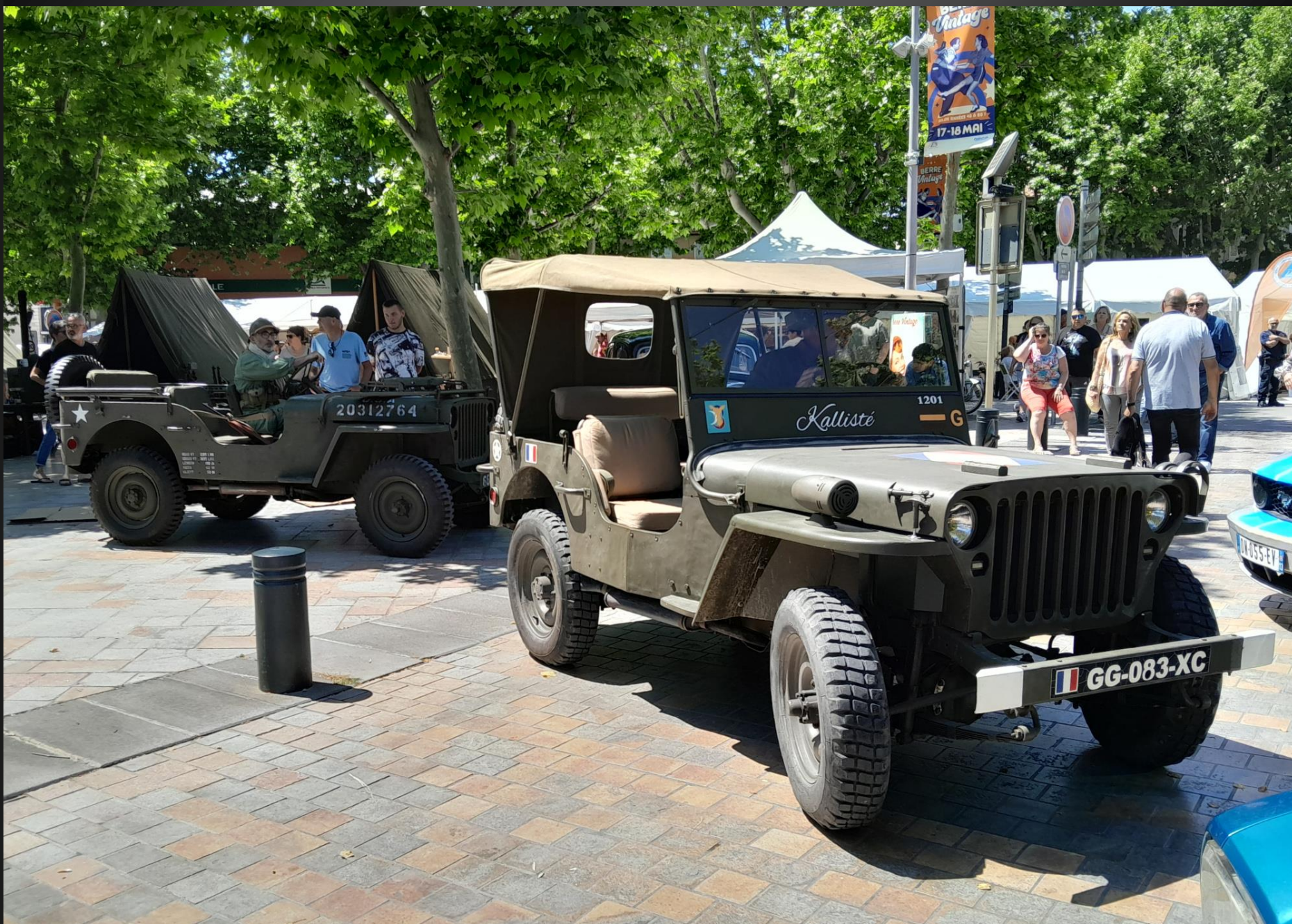
BERRE L'ETANG _ Dans une reconstitution historique, lorsqu'on voit une Jeep, il y en a toujours une quantité qui suivent (Le constructeur américain Willys-Overland reçoit sa première commande de 16 000 Willys MB au milieu de l'année 1941). Voir l'Histoire de la Willys MB devenue « Jeep » : https://jeepvillage.com/fr/blog/post/histoire-de-la-willys-mb-devenue-jeep