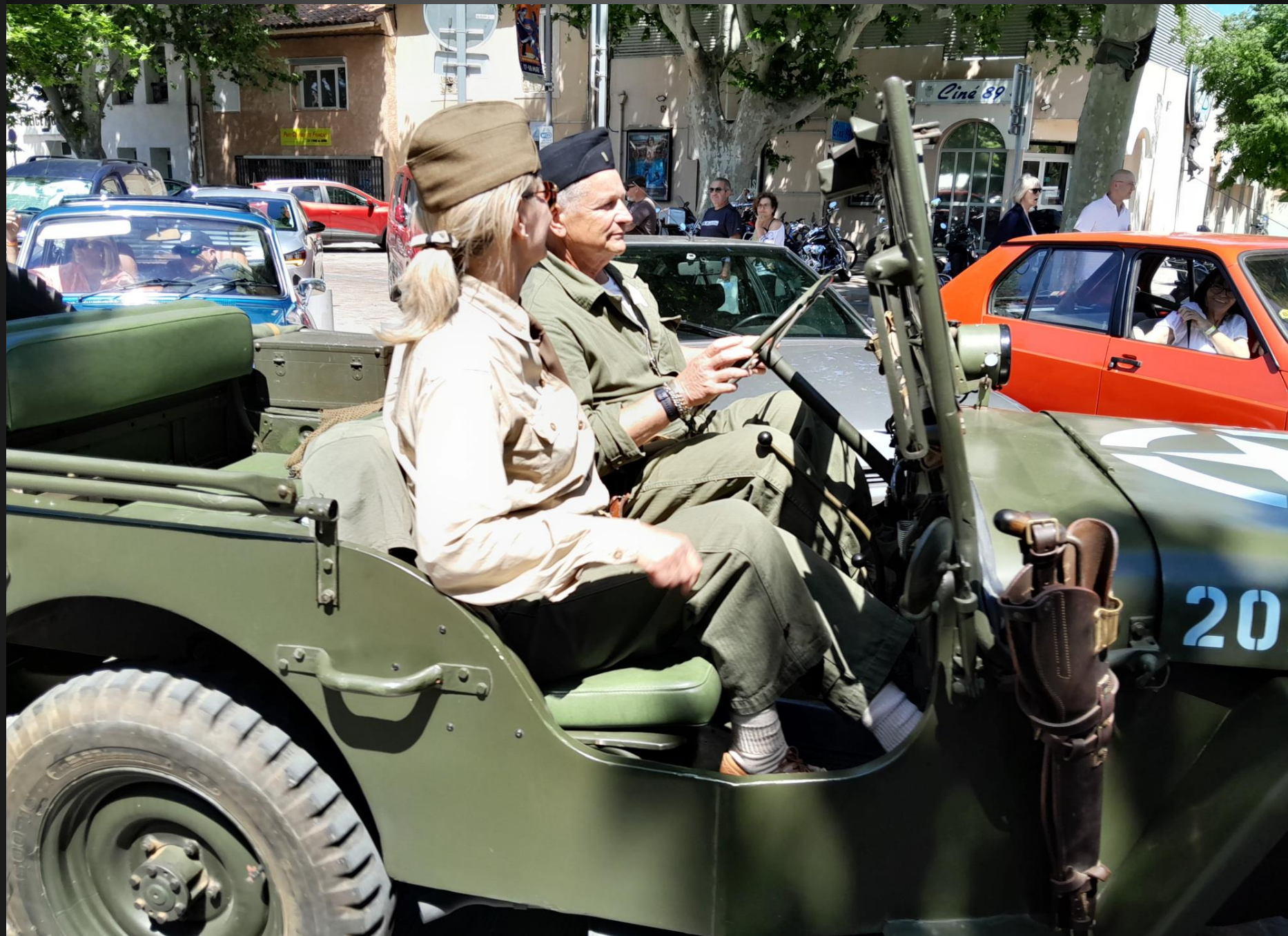
BERRE L'ETANG _ Le numéro de série du véhicule ou VIN (Vehicule Identification Number) est indispensable pour connaître l'année d'une Jeep et savoir si elle a pu faire le Débarquement.