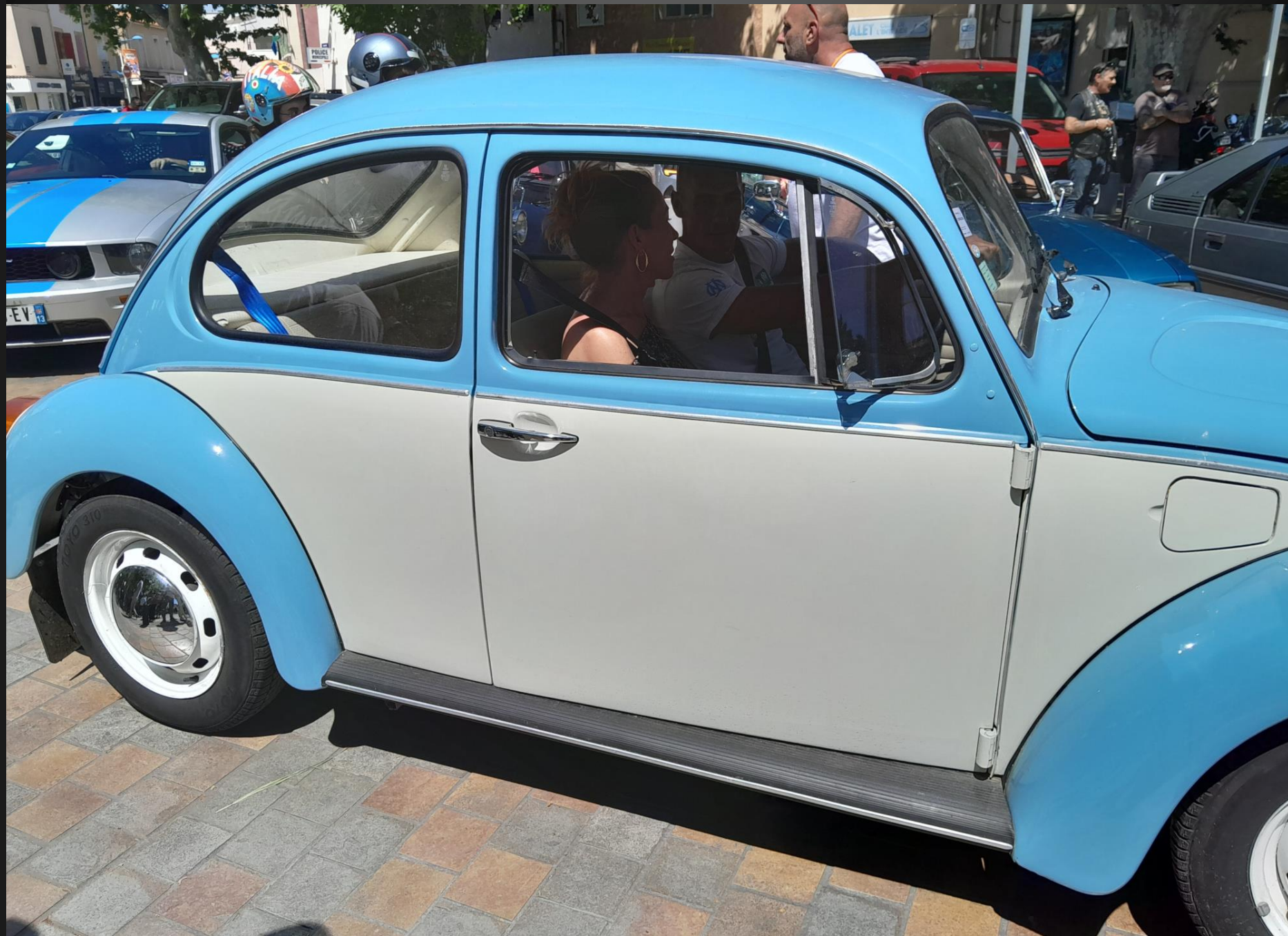
BERRE L'ETANG _ La « Voiture du peuple » est née dans l'Allemagne nazie des années 1930, une voiture populaire qui allait devenir la Coccinelle – officiellement désignée « type 1 », et appelée Käfer .