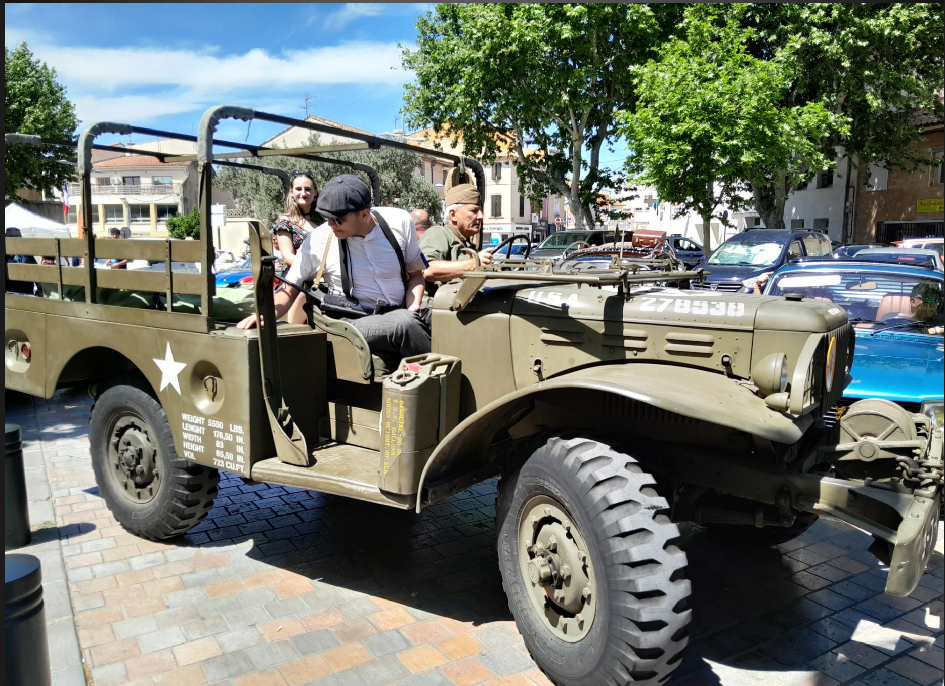
BERRE L'ETANG _ Le défilé continue ...