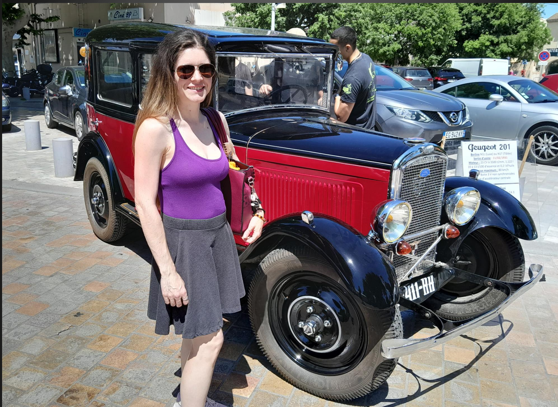
BERRE L'ETANG _ Oh la belle ... 201 Peugeot de 1931, encore toute rutilante, une époque où l'on savait faire des automobiles.