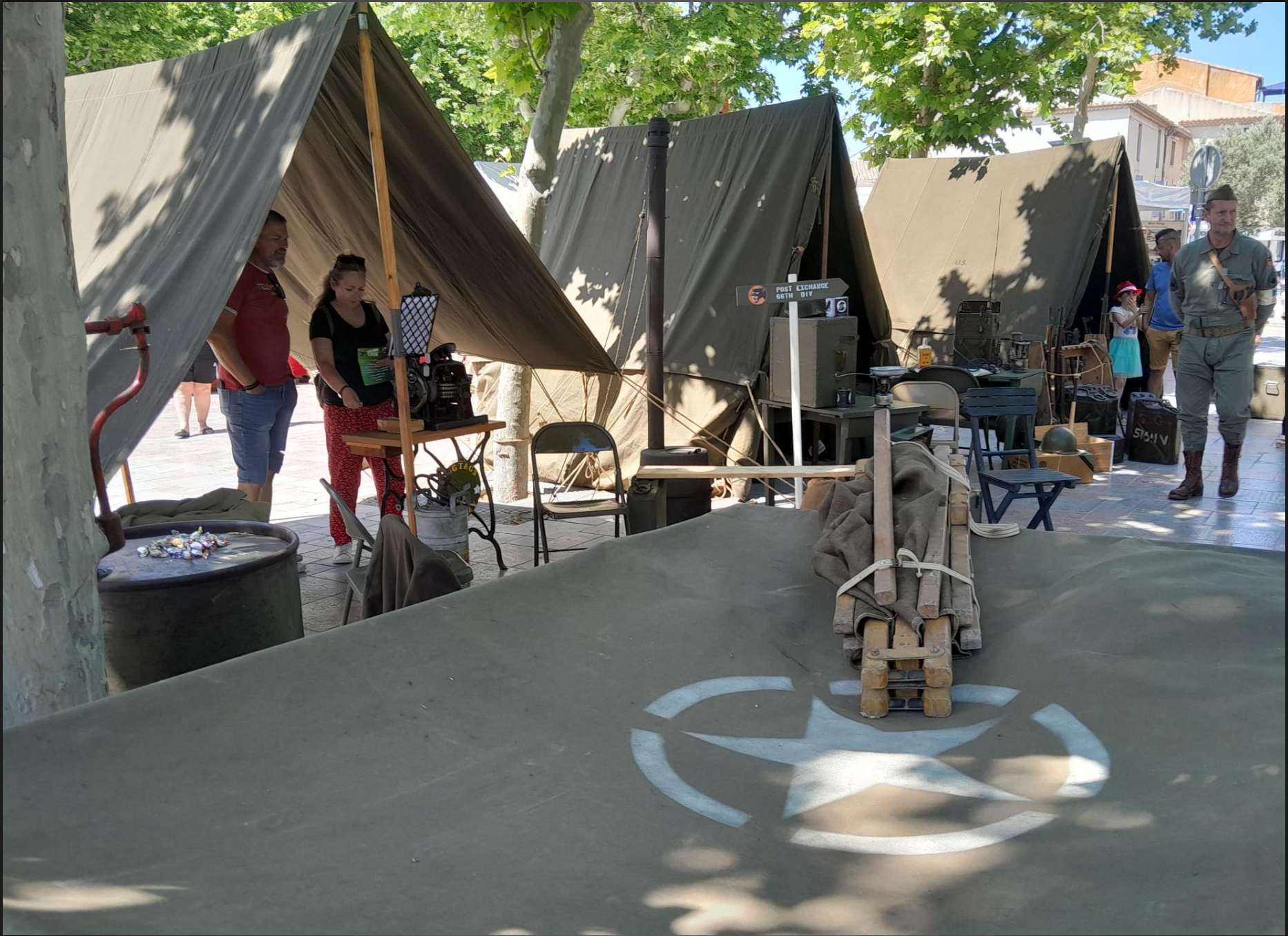
BERRE L'ETANG _ Le campement militaire 39-45. Essentiellement du matériel US.