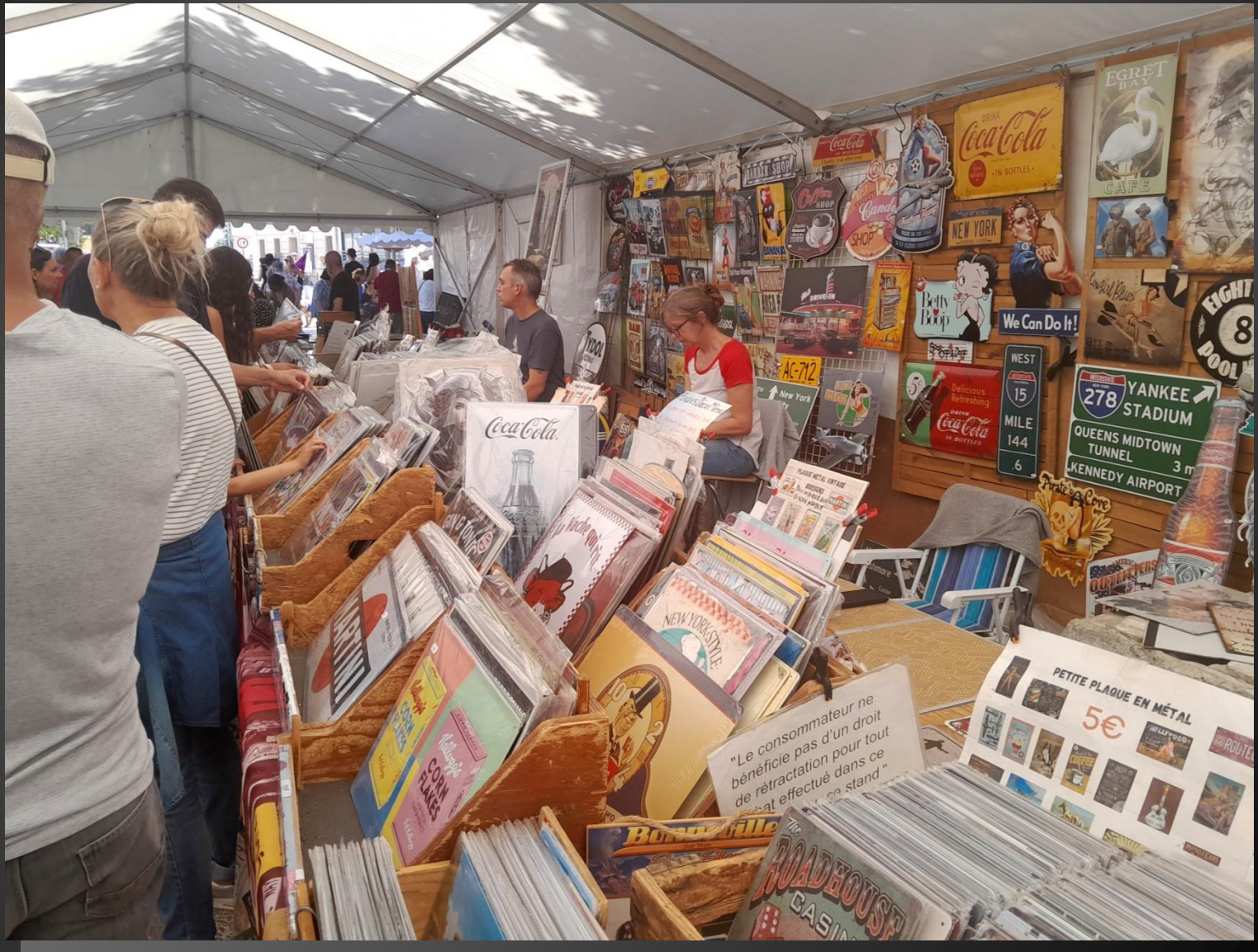
BERRE L'ETANG _ Ce week-end, le « rêve américain » était à Berre.