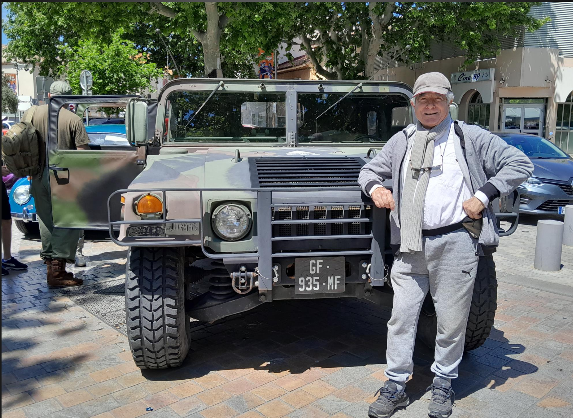
BERRE L'ETANG _ Oh le beau ... Humvee (M998, ou High mobility multipurpose wheeled vehicle ) dont il y a au moins 17 versions différentes en service au sein des forces armées américaines depuis 1985.