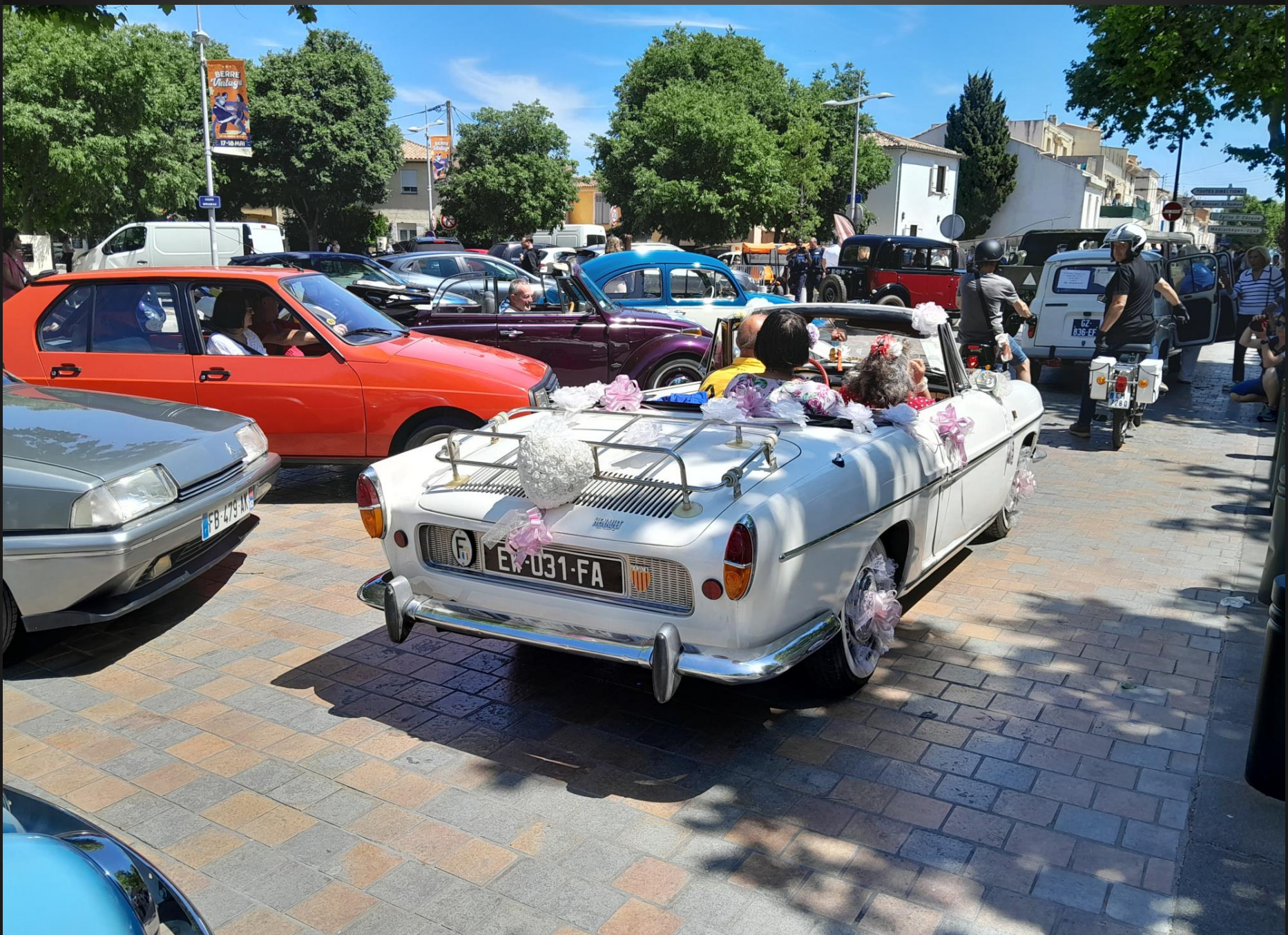
BERRE L'ETANG _ Tout-à-fait représentatives de l'insouciance des Trente Glorieuses qui a suivi la 2 e Guerre mondiale.