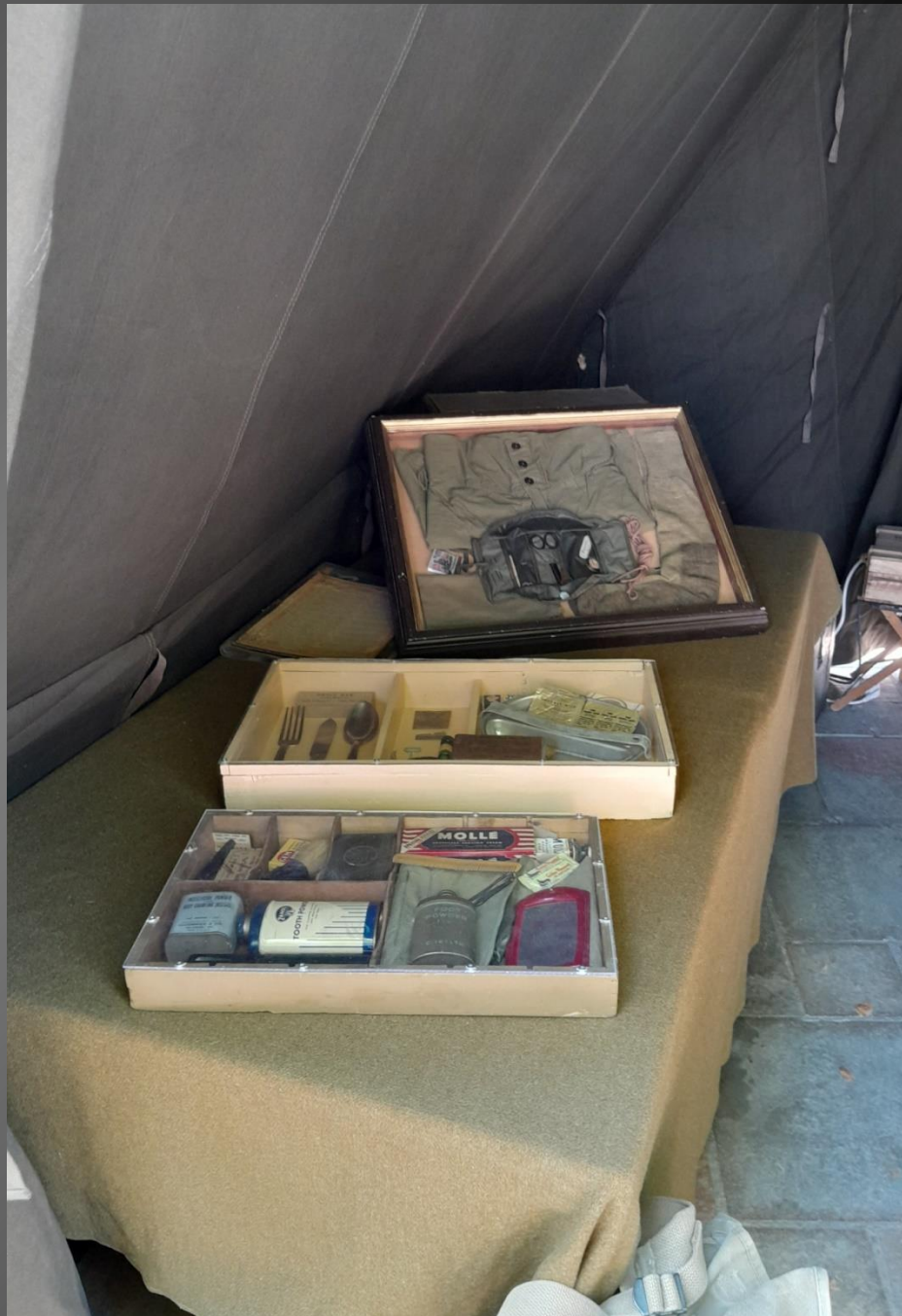
BERRE L'ETANG _ Le campement, stand de toilette du GI.