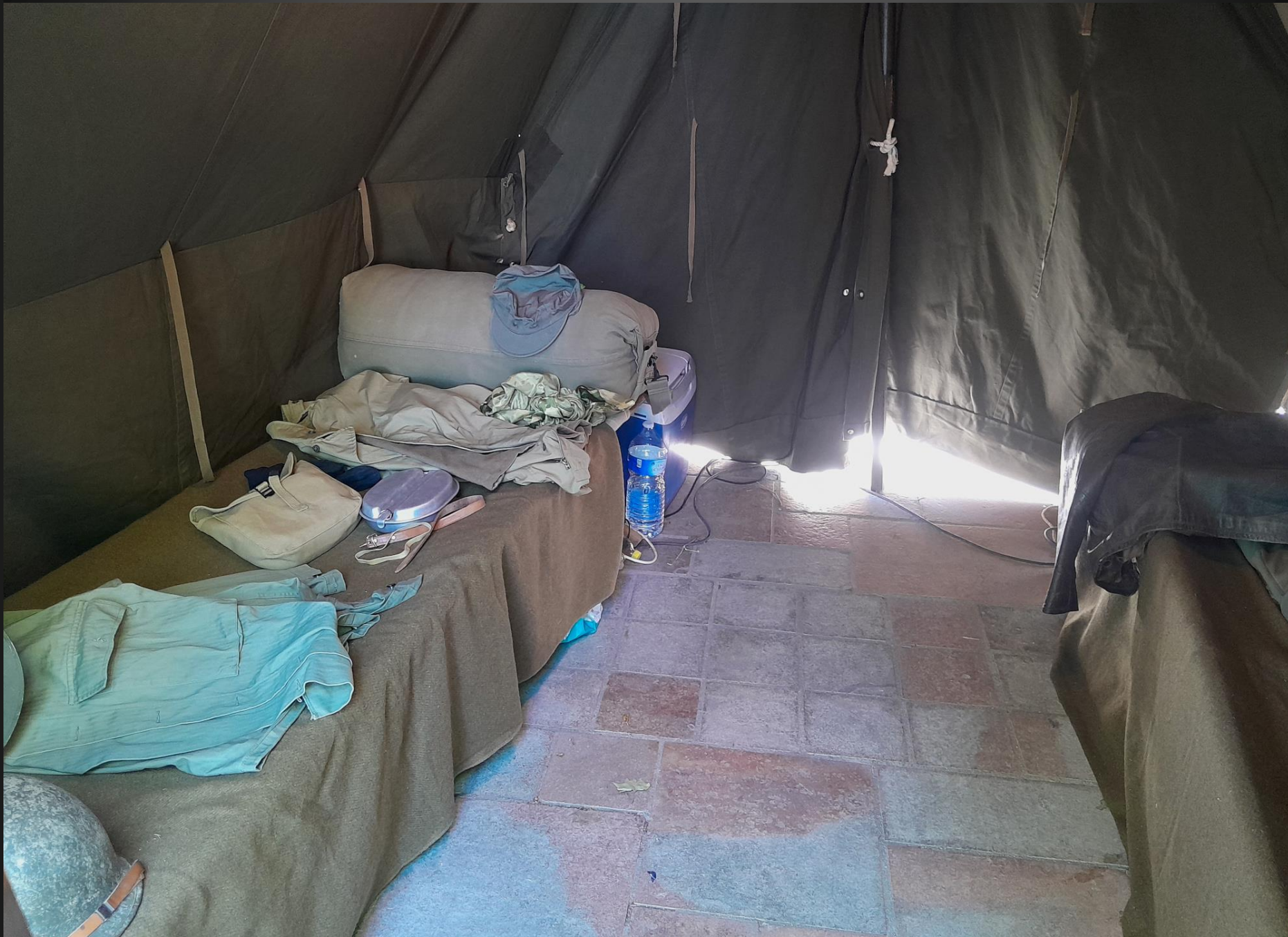
BERRE L'ETANG _ Le campement, intérieur d'une tente.