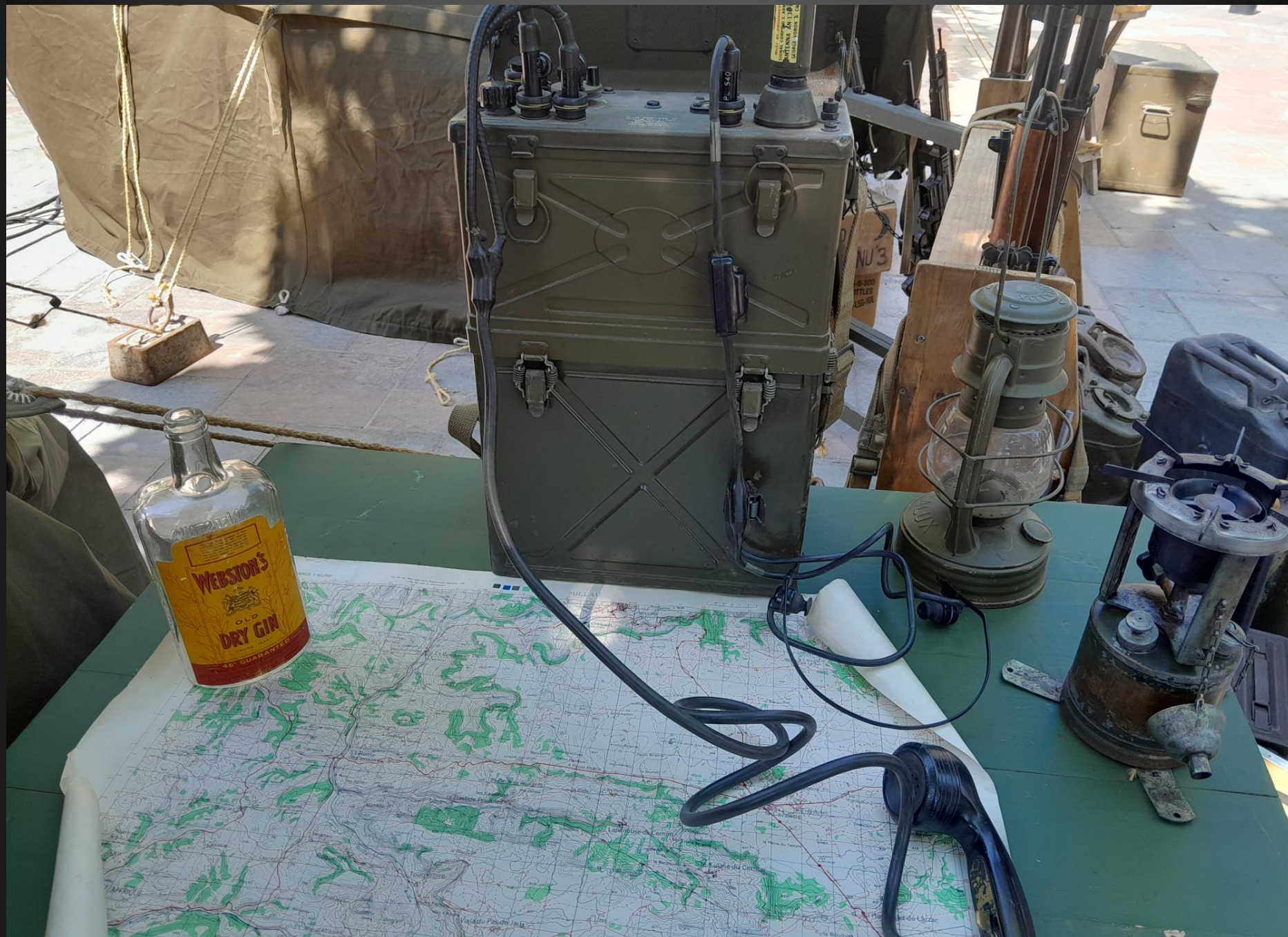
BERRE L'ETANG _ Le campement, matériel de communication.