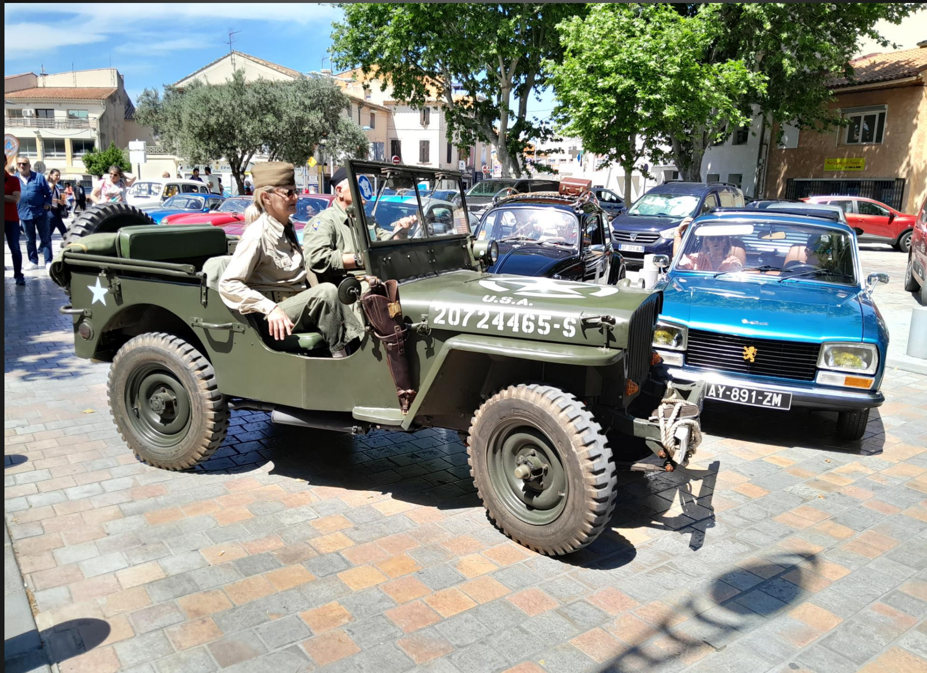
BERRE L'ETANG _ Tendence de la cote de Jeep Willys [all] en France, de 11.500€ en 2016 à 27.276€ en 2025. Voir : https://www.classictrends.eu/fr/jeep/willys.php