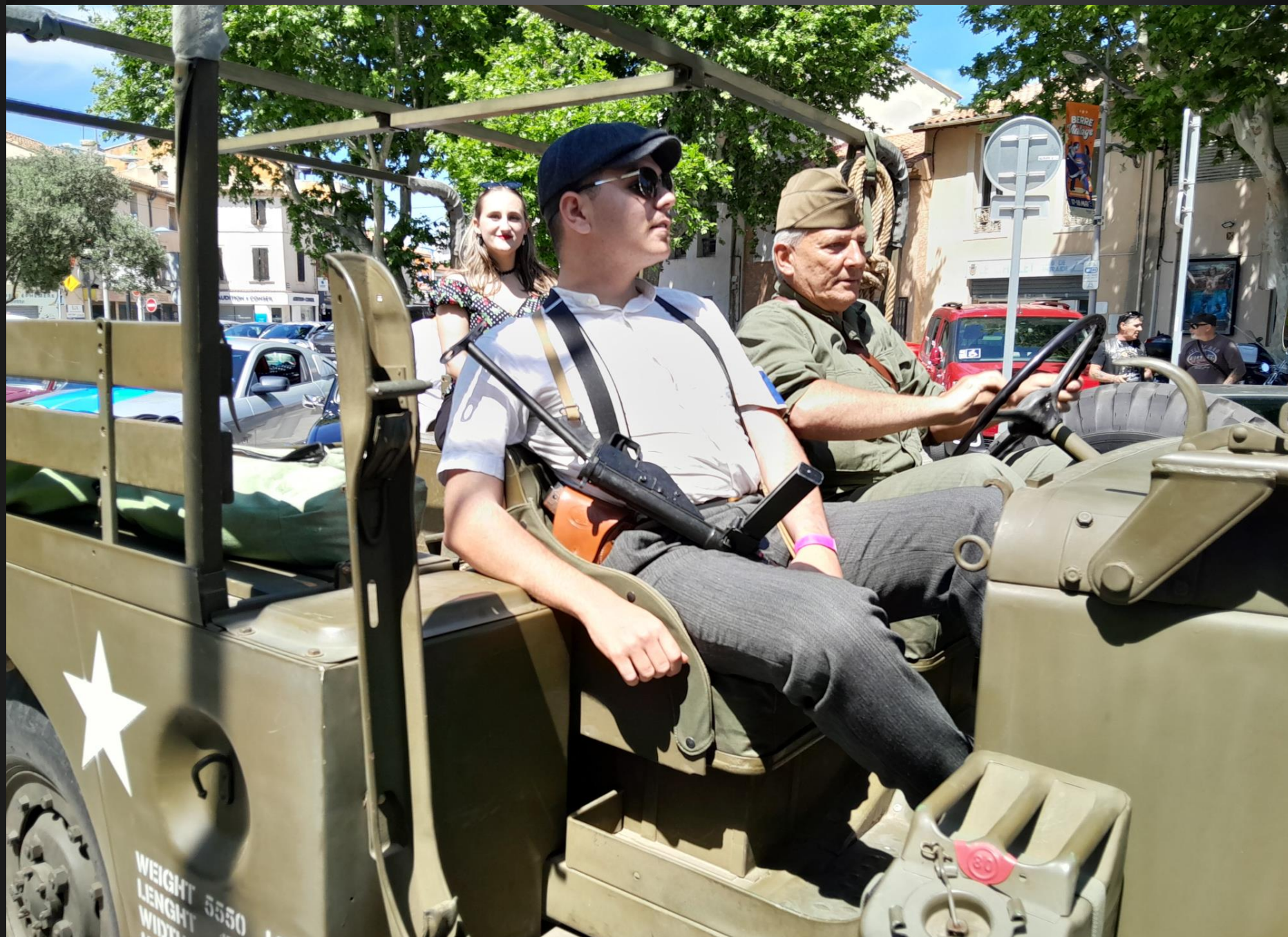
BERRE L'ETANG _ Le défilé continue ... ici, ave cun « Résistant » équipé d'une mitraillette anglaise STEN.