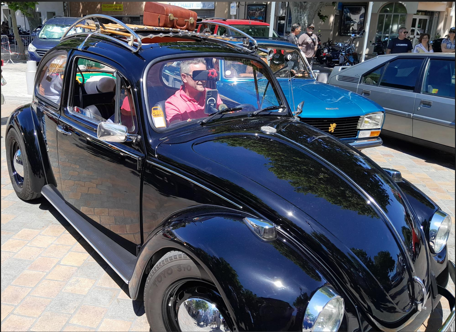
BERRE L'ETANG _ En 2024, le groupe Volkswagen a généré un chiffre d'affaires de plus de 348 milliards de dollars, premier groupe automobile mondial, devant le géant japonais Toyota.