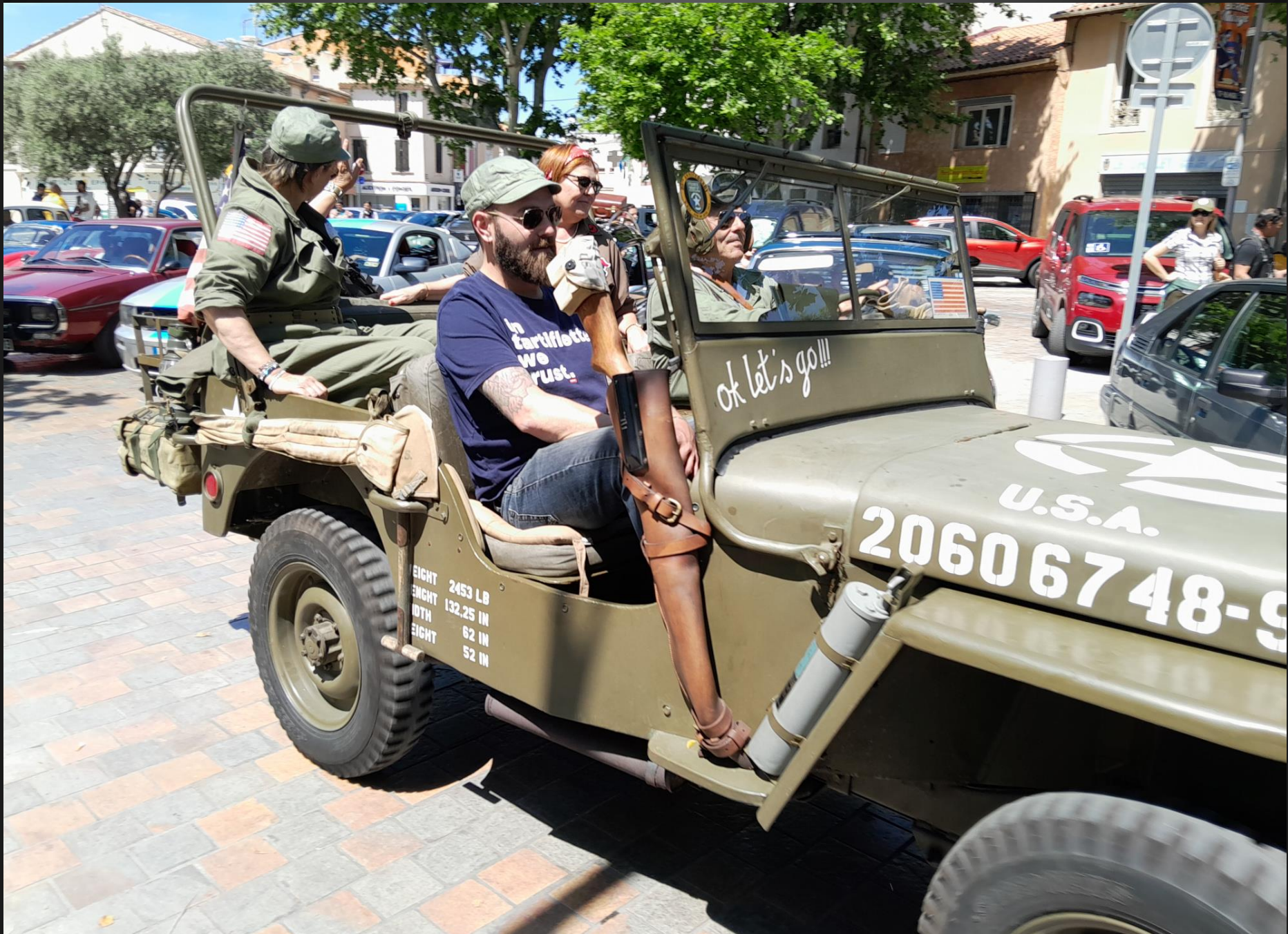
BERRER L'ETANG _ Des reconstitutions historiques sont organisées par de nombreuses communes de la région lors de leur Libération après le Débarquement de Provence du 15 août 1944.