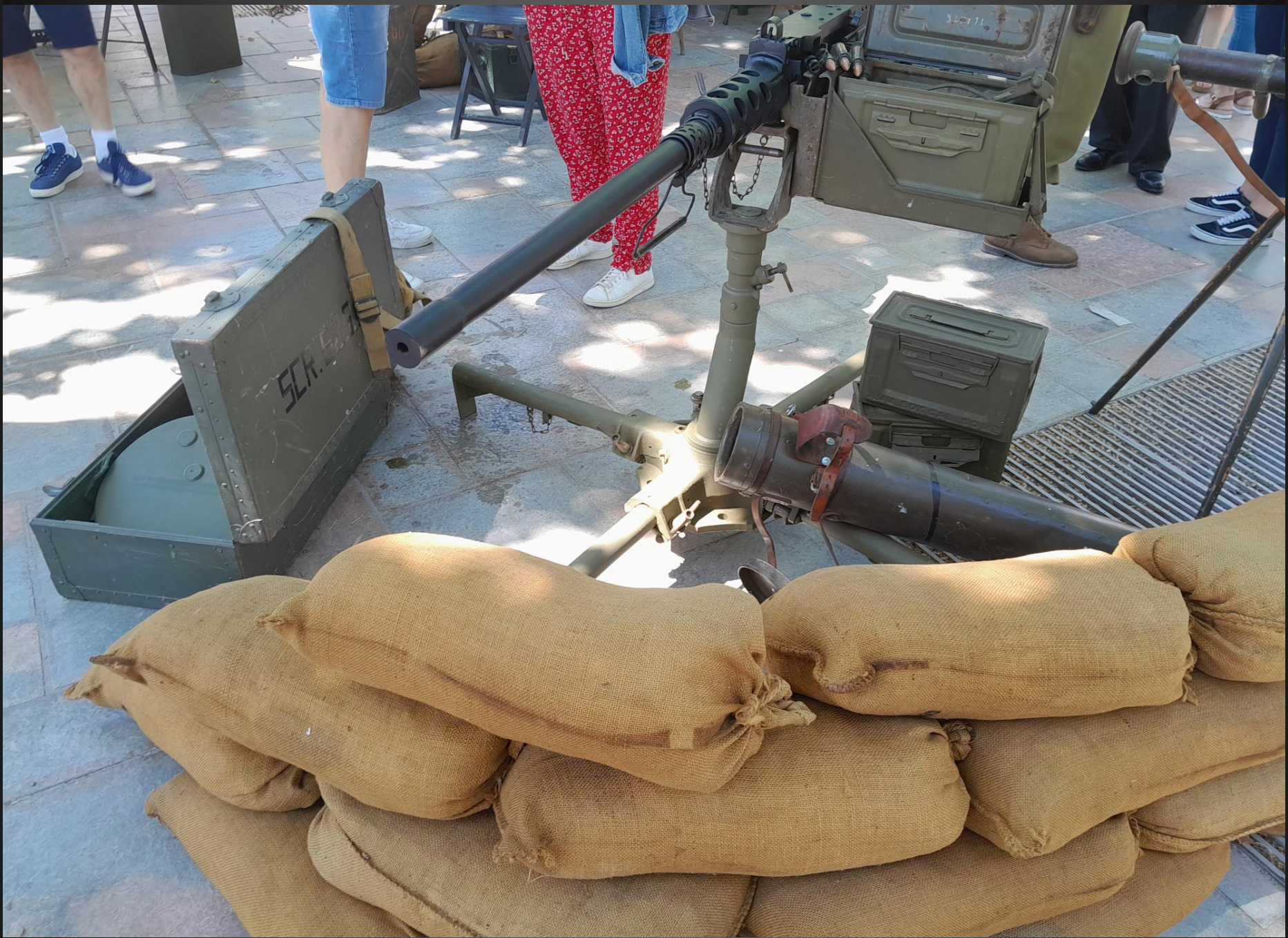
BERRE L'ETANG _ Le campement, protection sacs de sable.