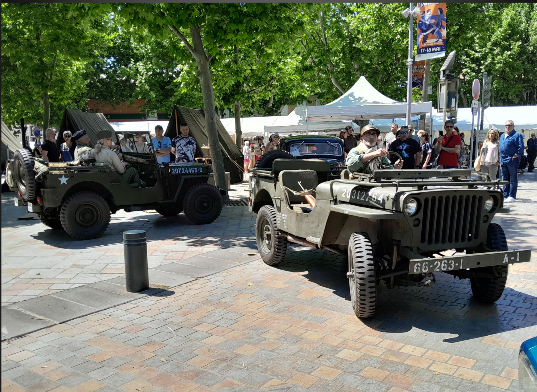
BERRE L'ETANG _ On estime que ce petit véhicule lancé en 1940 a donné lieu à une production de plus de 3 millions d'unités !