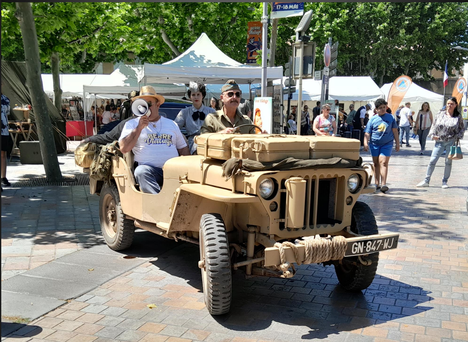
BERRE L'ETANG _ Début du défilé historique, avec une Jeep couleur sable et avec un lot de jerrycans sur le capot.