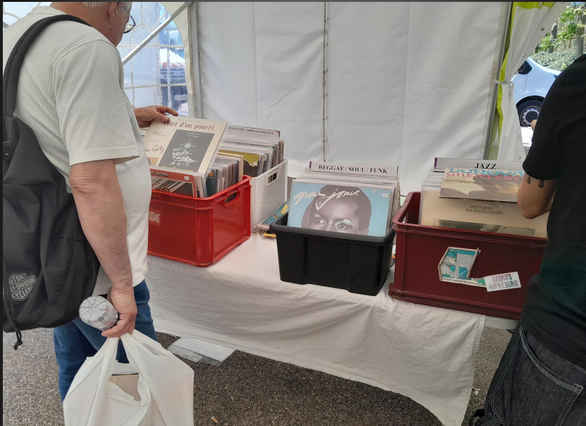
BERRE L'ETANG _ Musiques de film, Jazz, Reggae, et Rock'n Roll ...