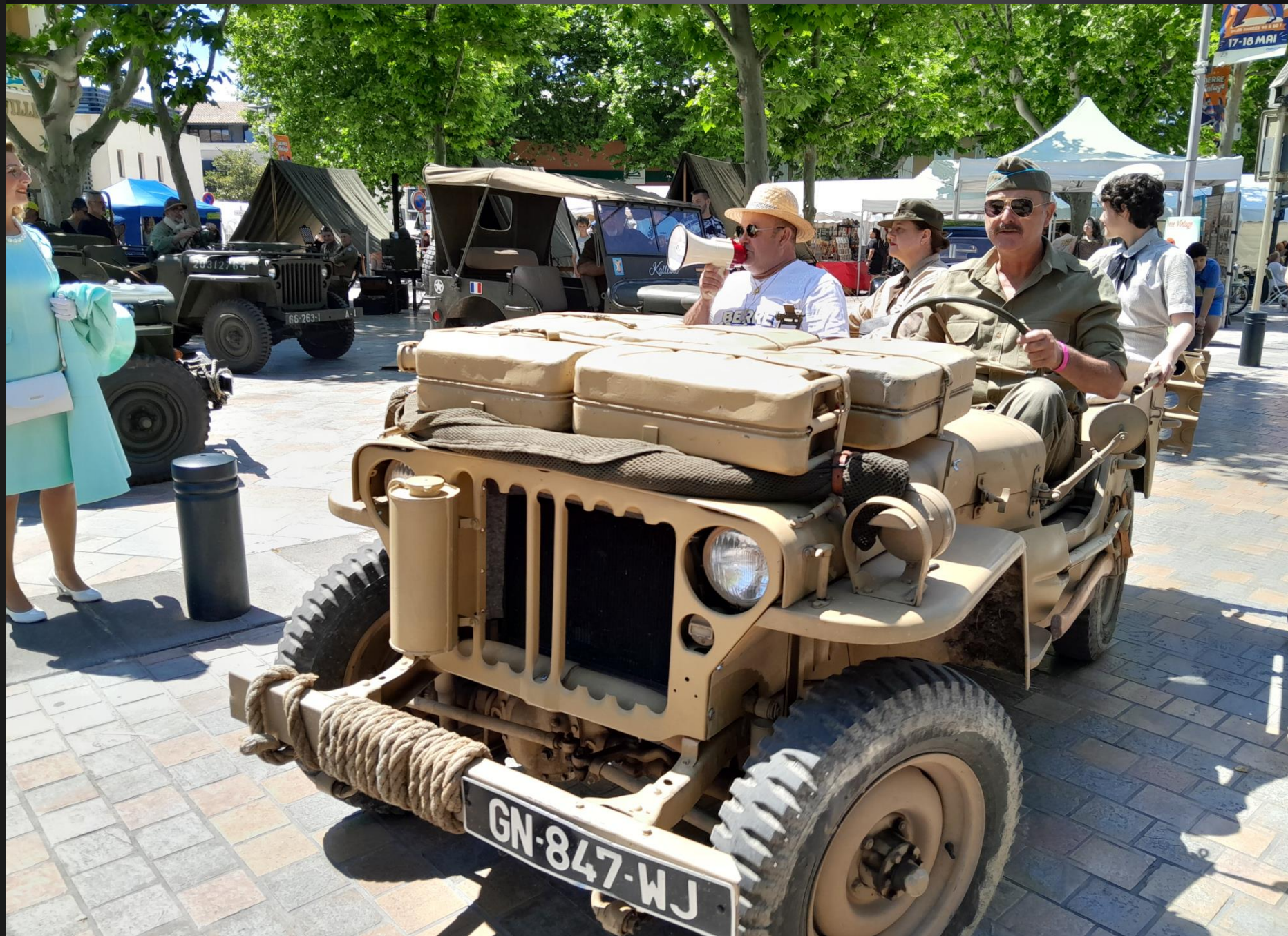
BERRE L'ETANG _ Le haut-parleur annonce le défilé et demande aux spectateurs de laisser le passage...