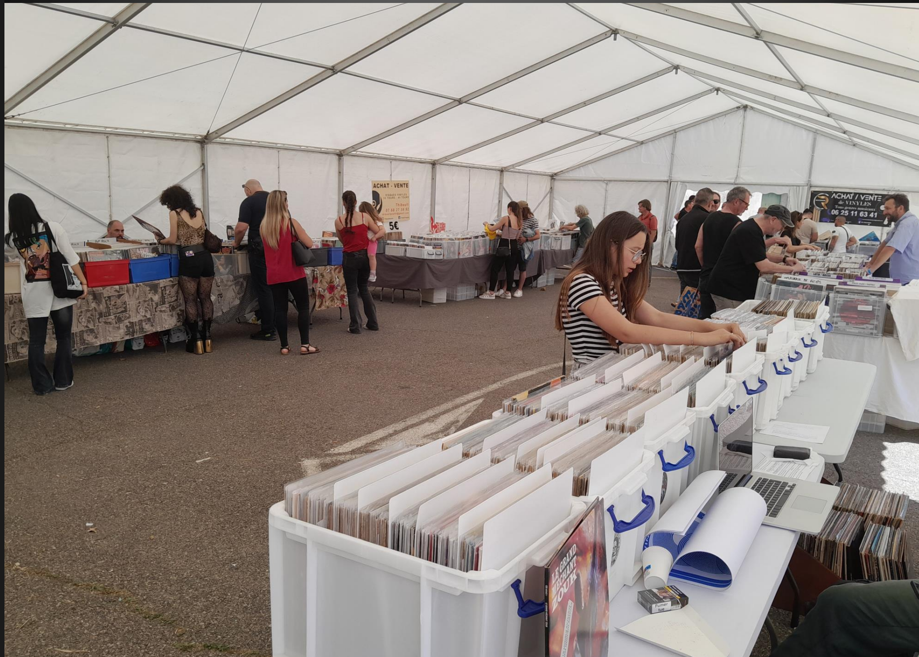
BERRE L'ETANG _ Les exposants du VINYL MARKET PACA et leurs disques 33 tours... après une longue désaffection, c'est le retour des vinyles et des platines Haute-Fidélité pour la restitution optimale du son et le plaisir des audiophiles exigeants.