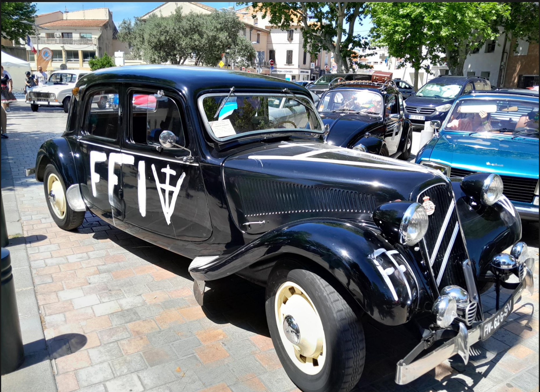
BERRE L'ETANG _ Pas de défilé historique sans la voiture emblématique de la période, utilisée par les FFI et réquisitionnée par la Gestapo, la Citroën Traction , produite de 1934 à 1957.