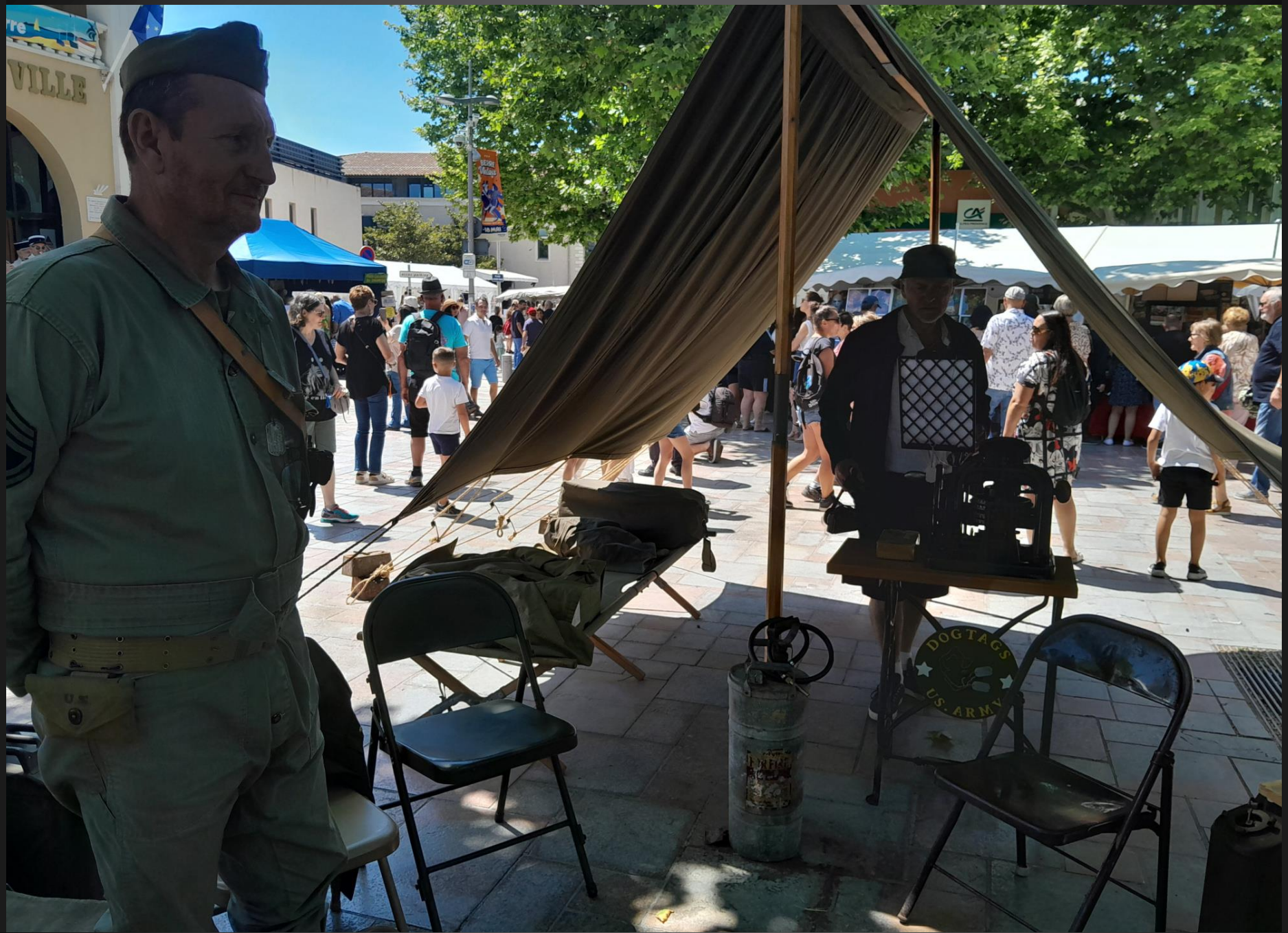
BERRE L'ETANG _ Le campement.