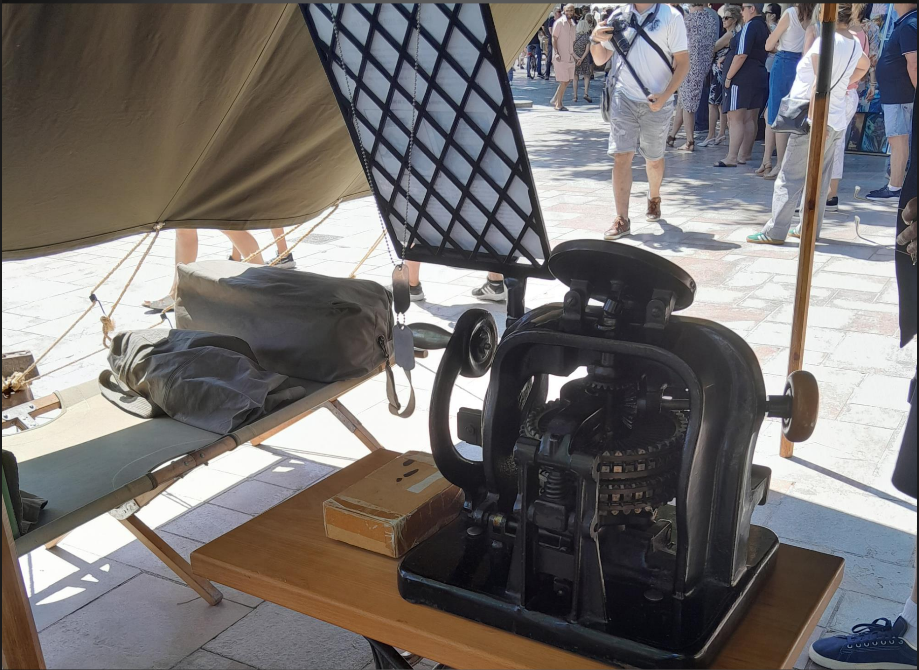
BERRE L'ETANG _ Le campement.