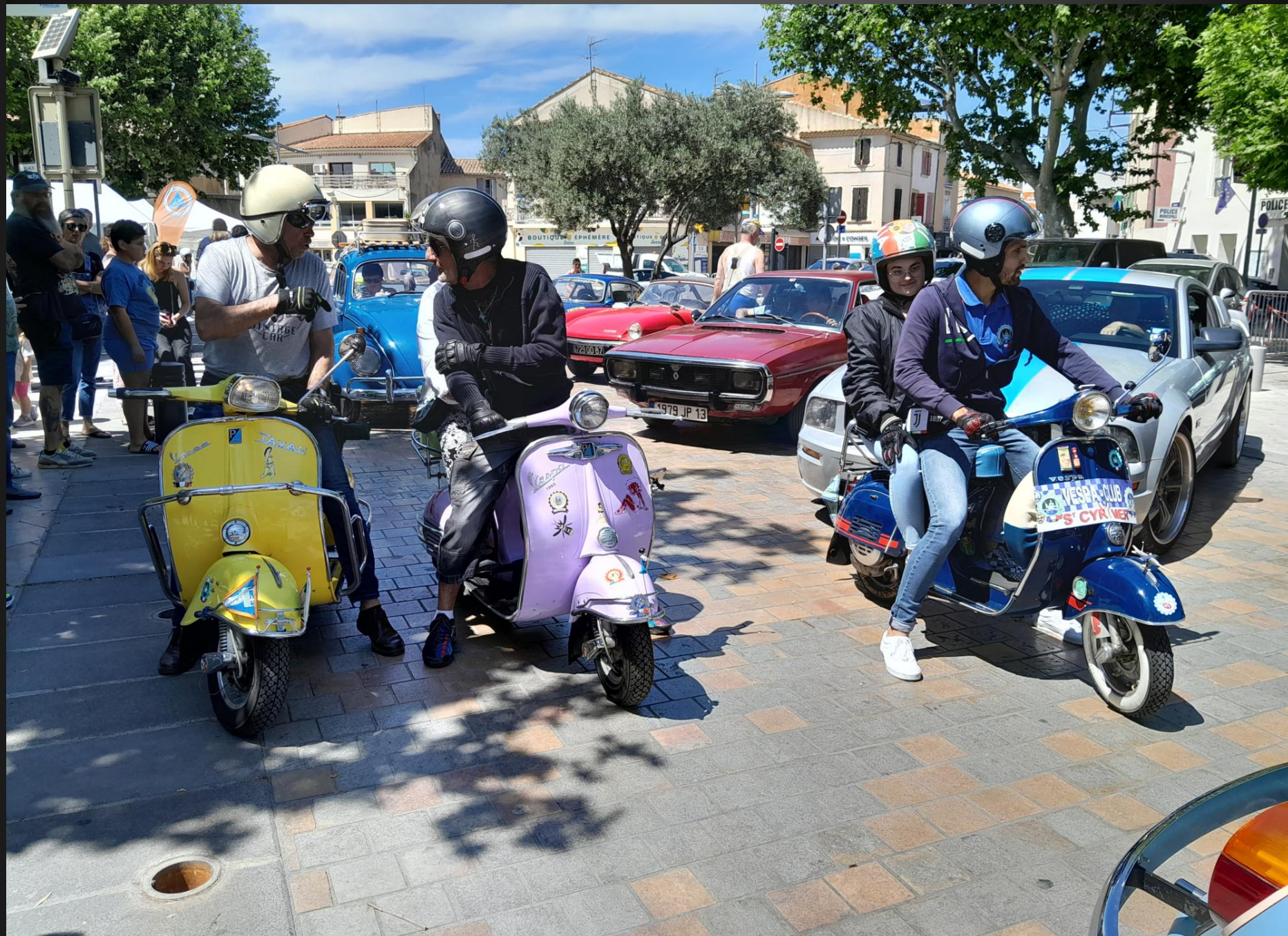
BERRÉ L'ÉTANG _ Vespa est une marque de scooters brevetée en 1946 par la société Piaggio & Co, S.p.A. Devenue très populaire, elle est à la fois un symbole de la créativité italienne et un succès commercial.