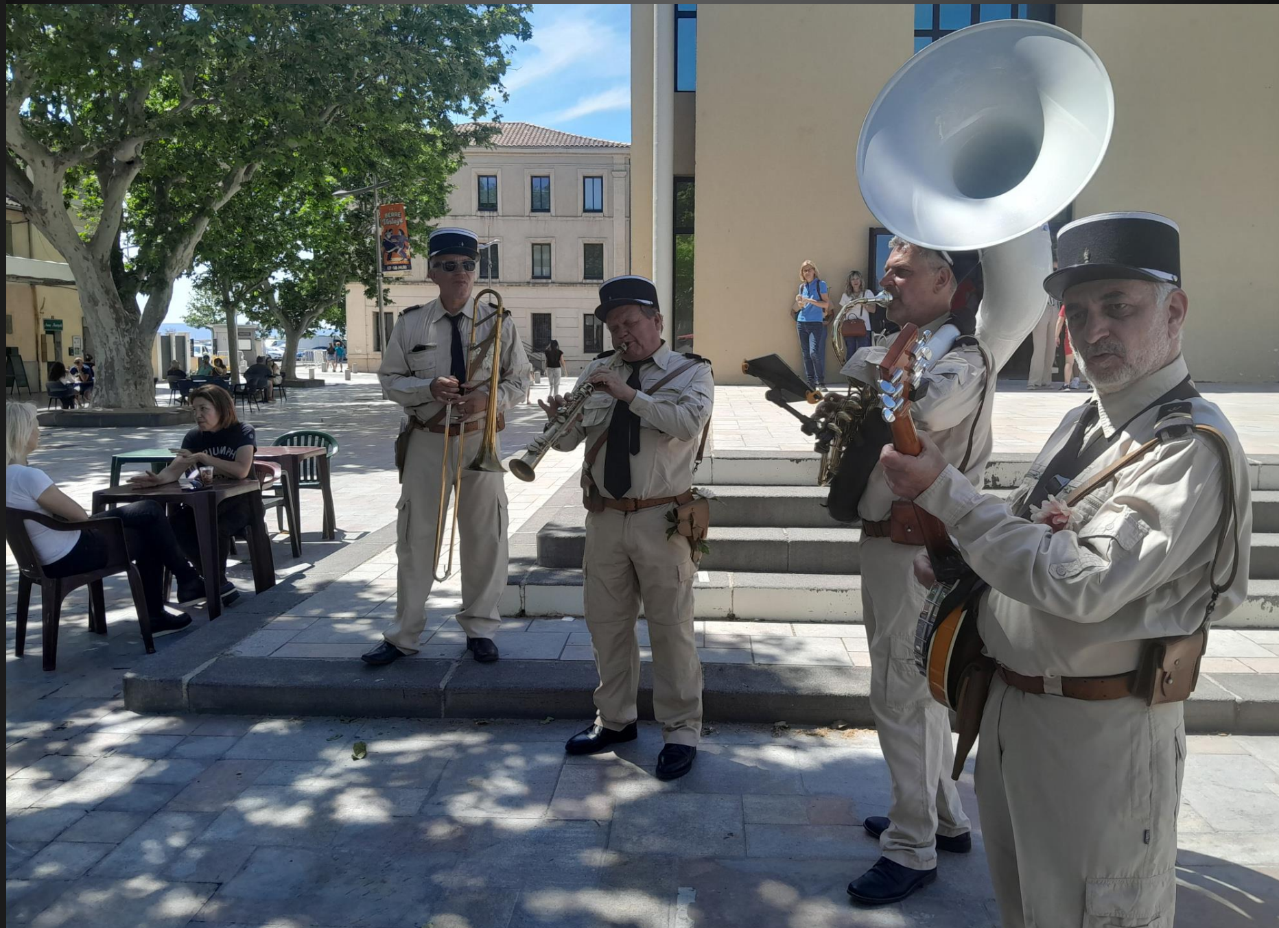
BERRE L'ETANG _ La fête est animée par plusieurs groupes musicaux dont celui-ci, La Brigade , qui déambule avec des airs de jazz, comme si elle était encore à Saint-Tropez avec le gendarme De Funès...