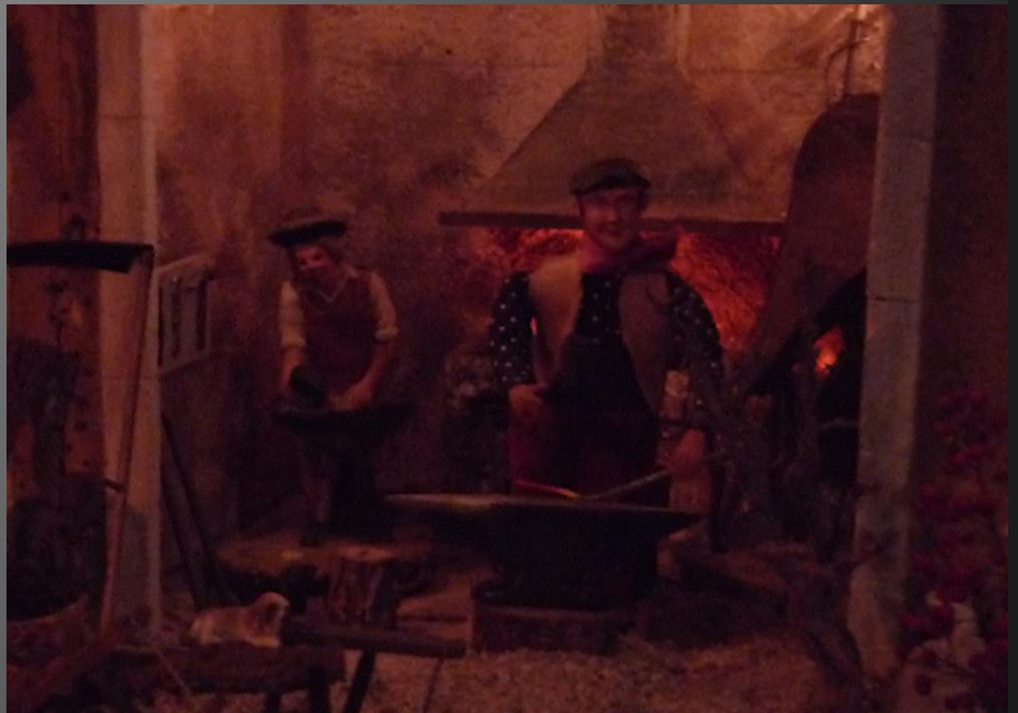
Dans son atelier, le forgeron est au travail.