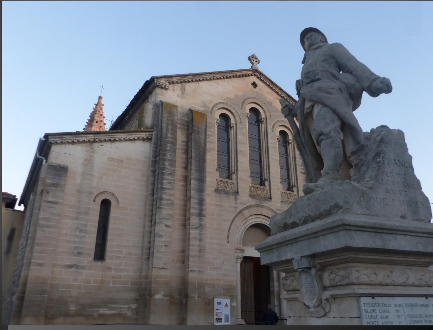
CABANNES L'église Sainte- Marie-Madeleine et le Monument aux Morts de 14-18.