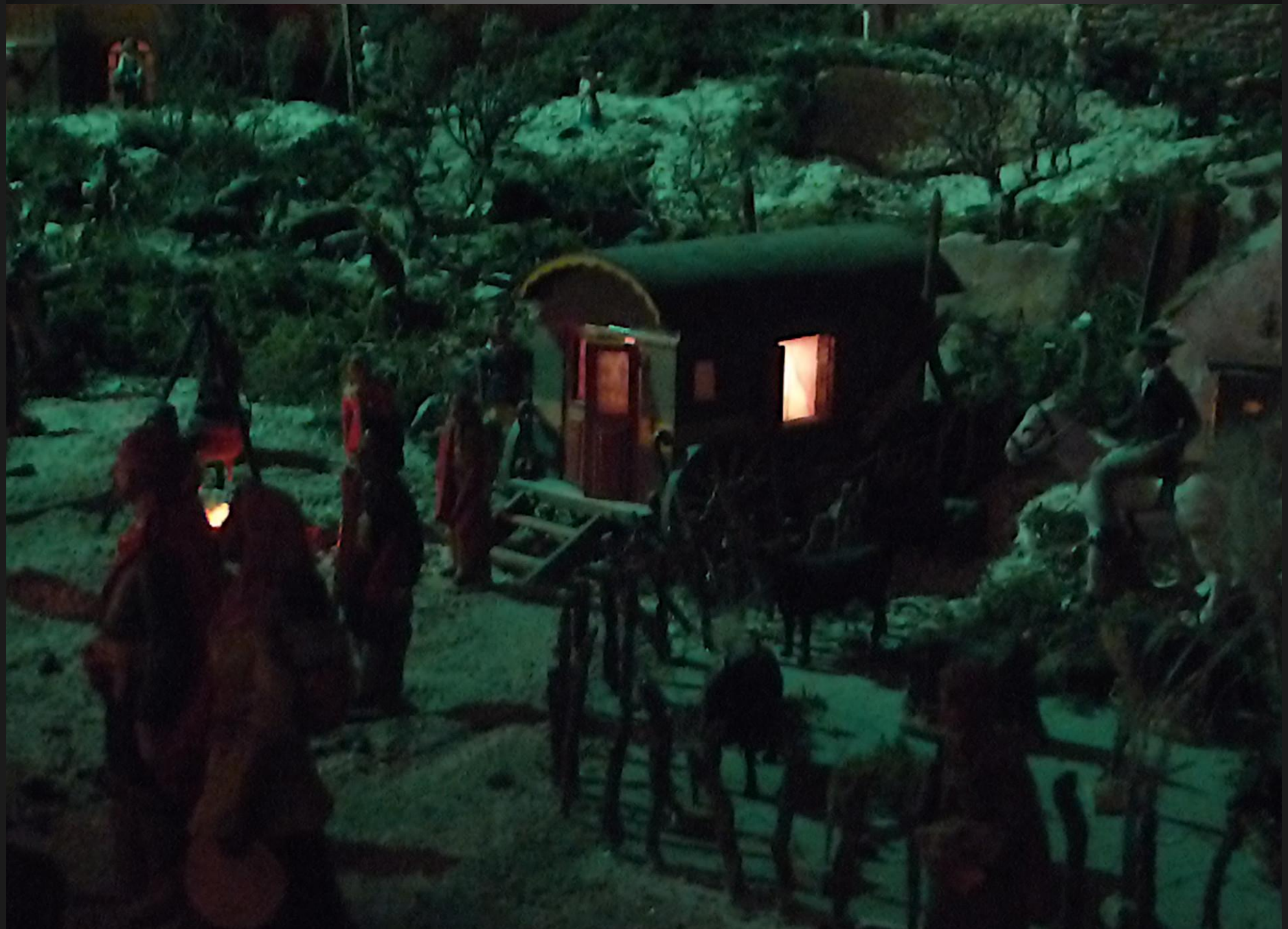
Il y a de l'animation aussi chez les Boumian qui sont réveillés.