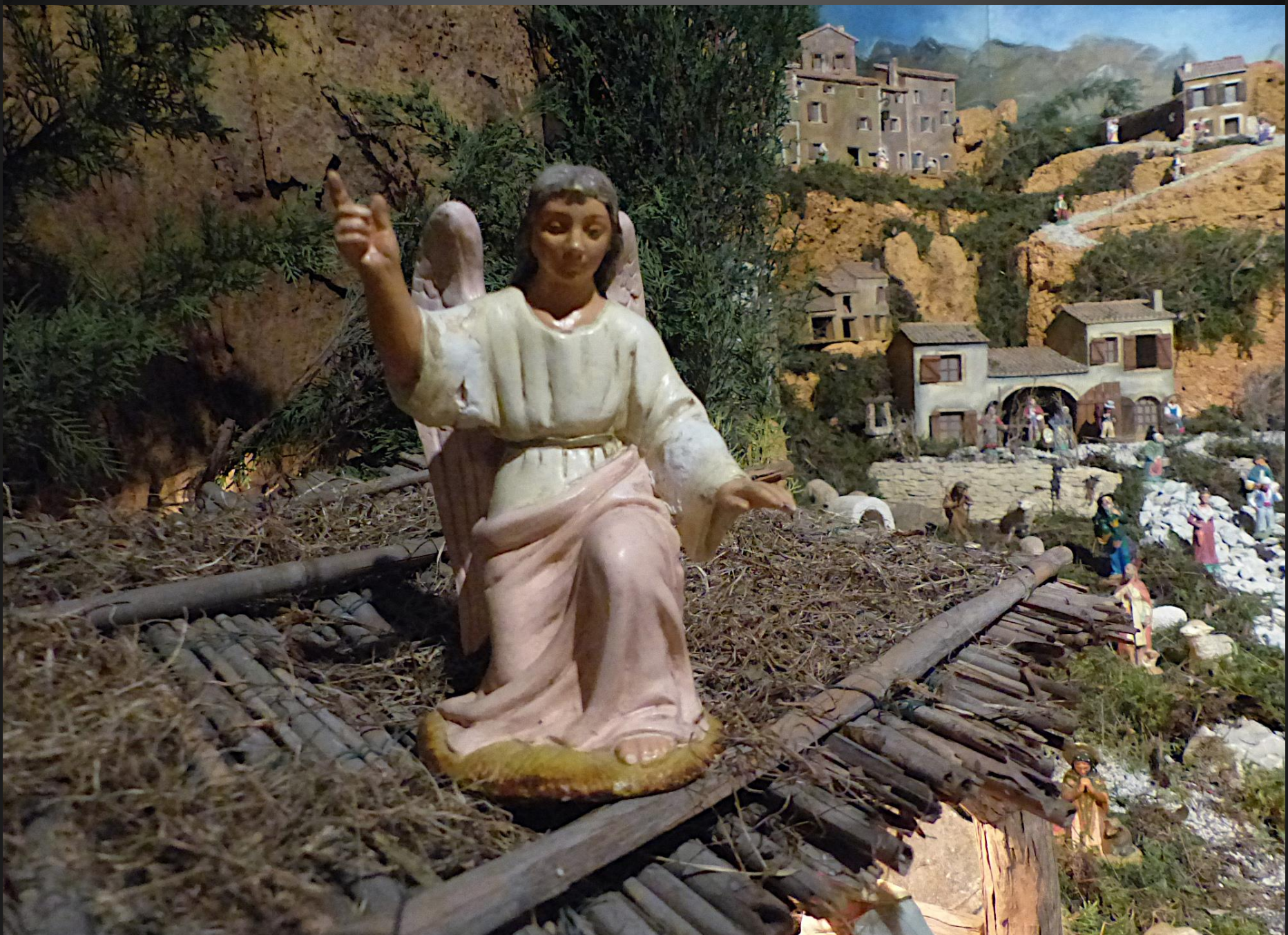
De bon matin, l'Ange annonce la Bonne Nouvelle au-dessus de la crèche.