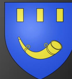
Blason de Cabannes

D'or au gousset renversé d'azur chargé en cœur d'une fleur de lys du champ surmontée d'un lambel de gueules brochant sur le tout.