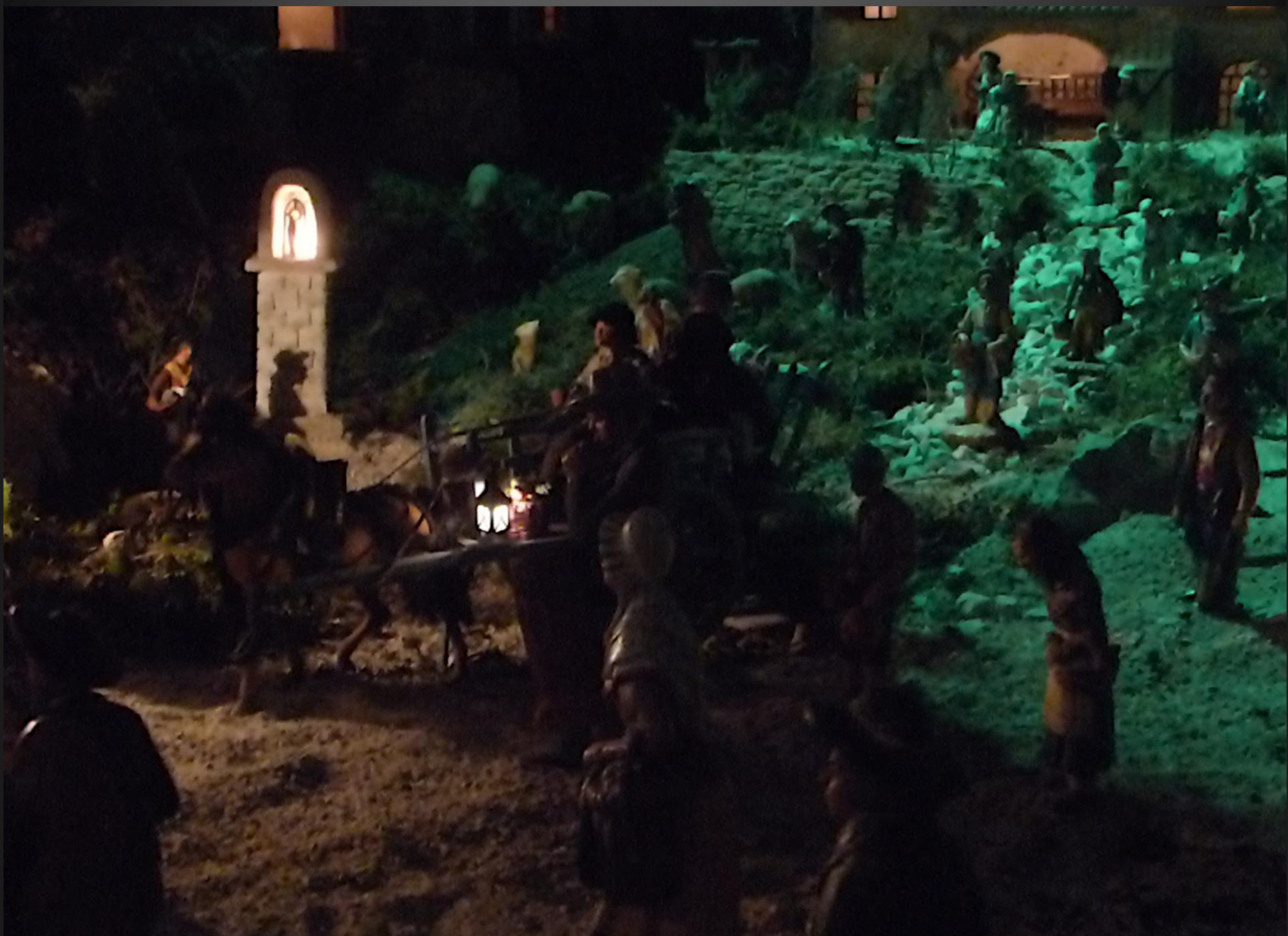
C'est la nuit, le peuple des santons se dirige vers l'étable où le Sauveur est né.