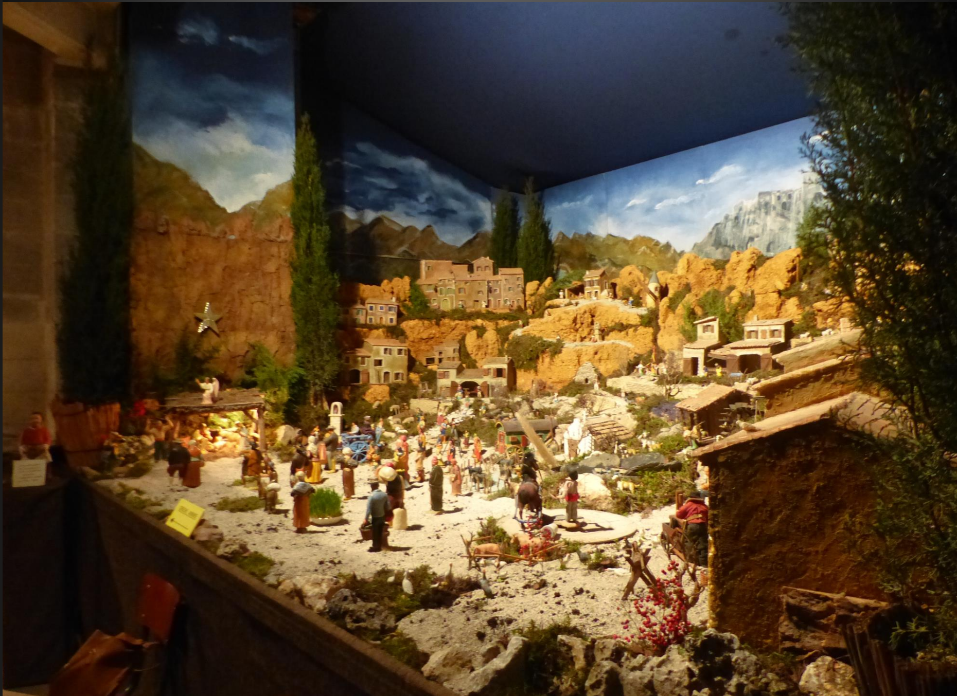
La grande crèche provençale occupe toute une chapelle latérale, à gauche de l'entrée; elle représente les paysages typiques de la région et elle est animée, avec de très beaux jeux de lumière.