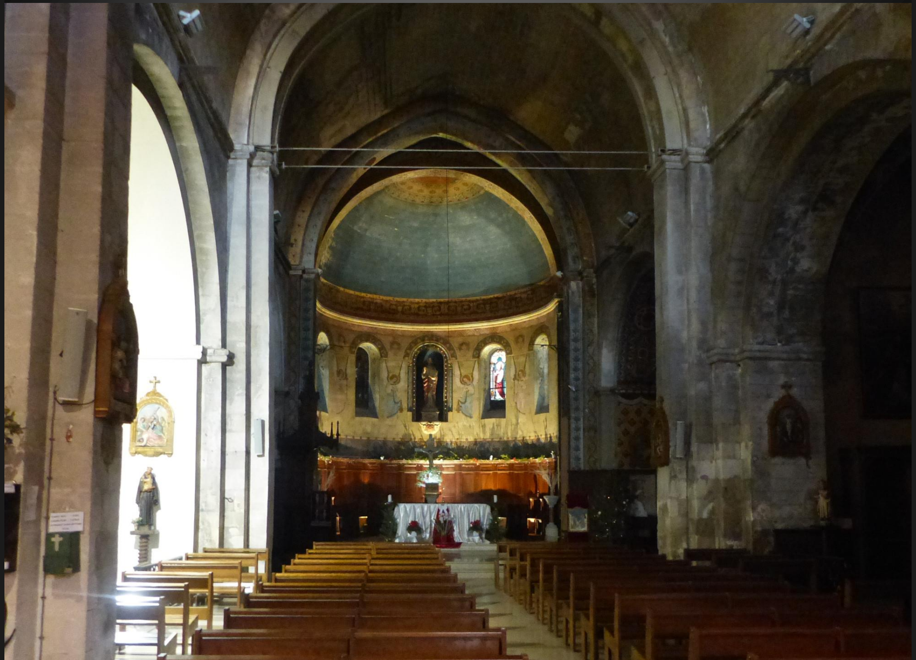
Eglise Ste Marie-Madeleine _ La grande nef romane du XIIIe s.