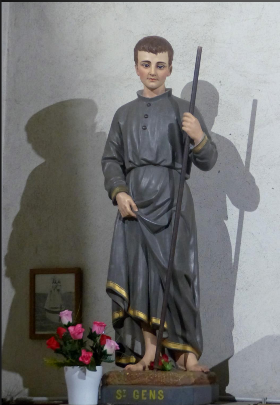
Statue de Saint Gens, patron de la Provence. Pèlerinage au Beaucet dans le Vaucluse le 16 mai. https://www.lebeaucet.com/fr/je-decouvre-le-beaucet/notre-patrimoine/l-ermitage-de-saint-gens