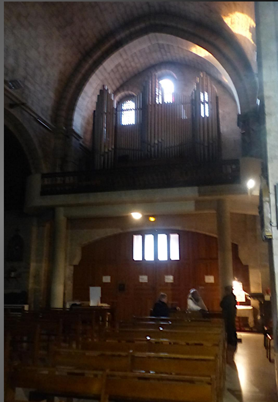
Eglise Ste Marie-Madeleine _ Le chœur roman et ses peintures murales. Dans la tribune, un orgue monumental datant de 1956.