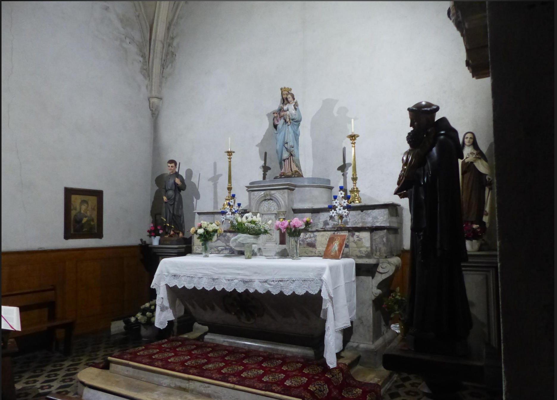
Eglise Ste Marie-Madeleine _ Chapelle latérale : autel de la Vierge à l'Enfant.