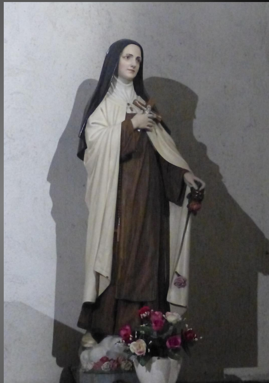
Statue de Ste Thérèse de l'Enfant-Jésus. Grand pèlerinage à Lisieux le 1 er octobre. https://www.lebeaucet.com/fr/je-decouvre-le-beaucet/notre-patrimoine/l-ermitage-de-saint-gens