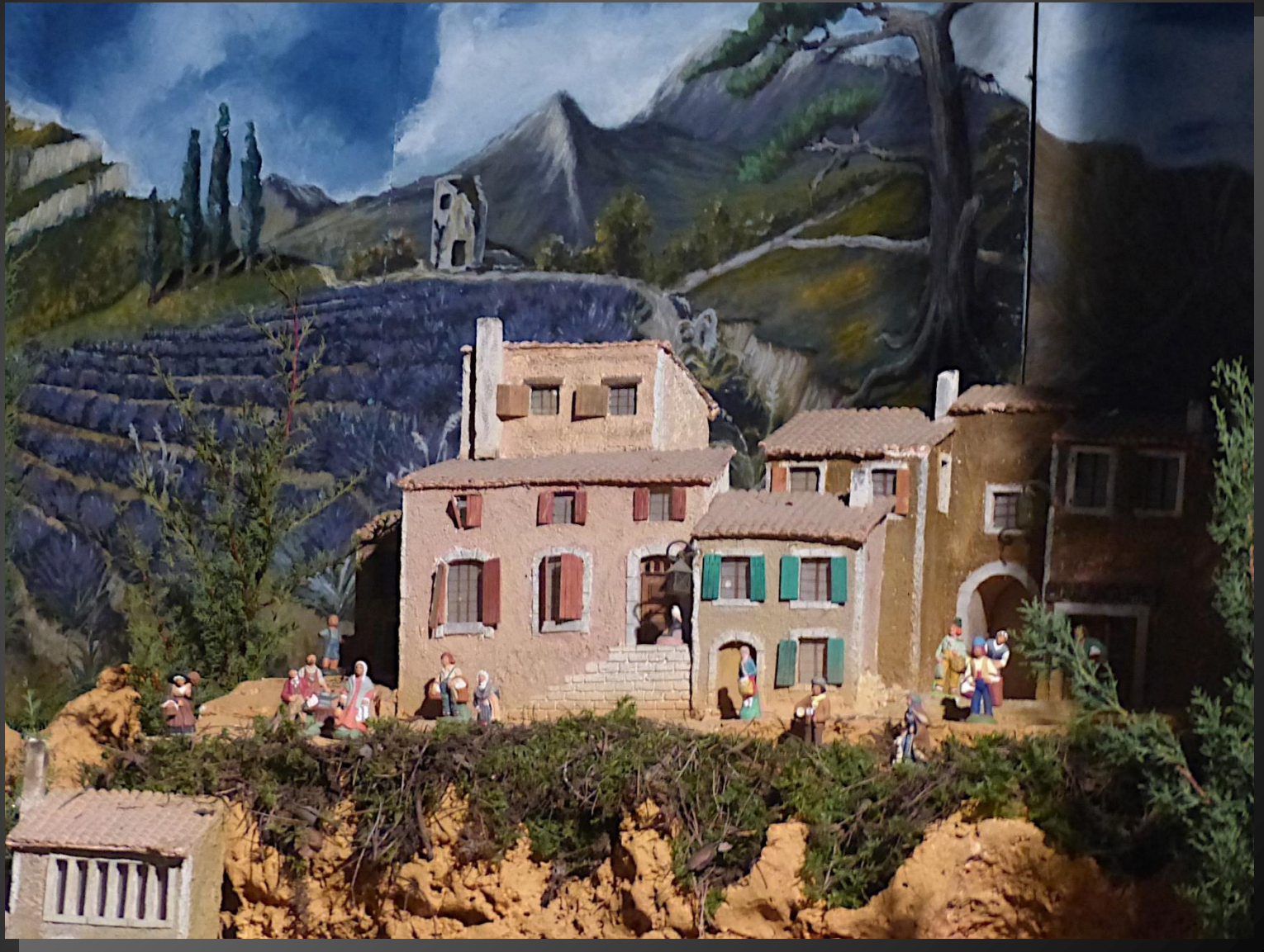
Crèche provençale, avec Sainte-Victoire dominant les champs de lavande ...