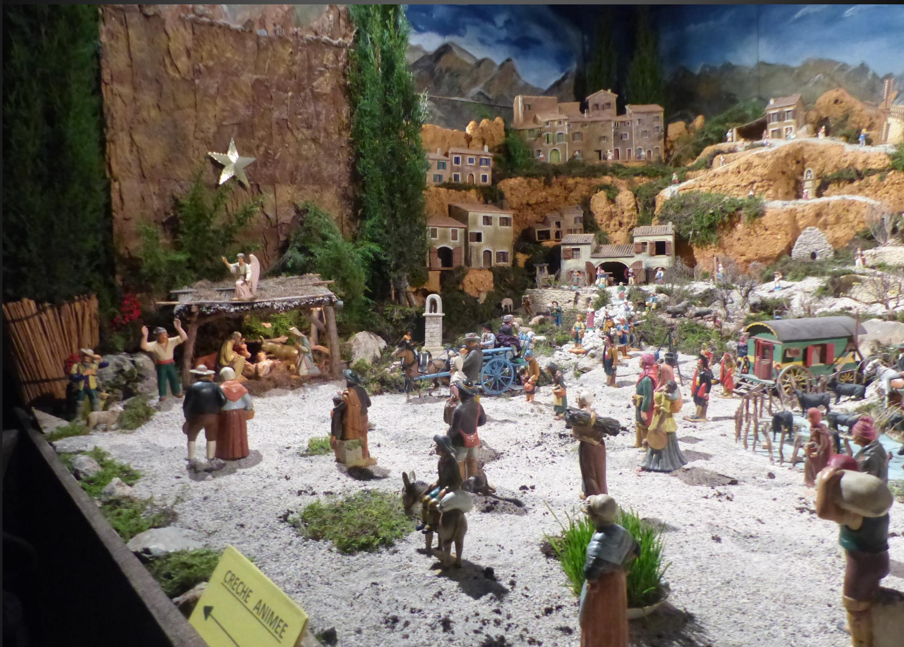
Belle crèche provençale animée. Voir le reportage : http://www.webmaster2010.org/variables/cabannes-crechedenoel-stemm2023.pdf