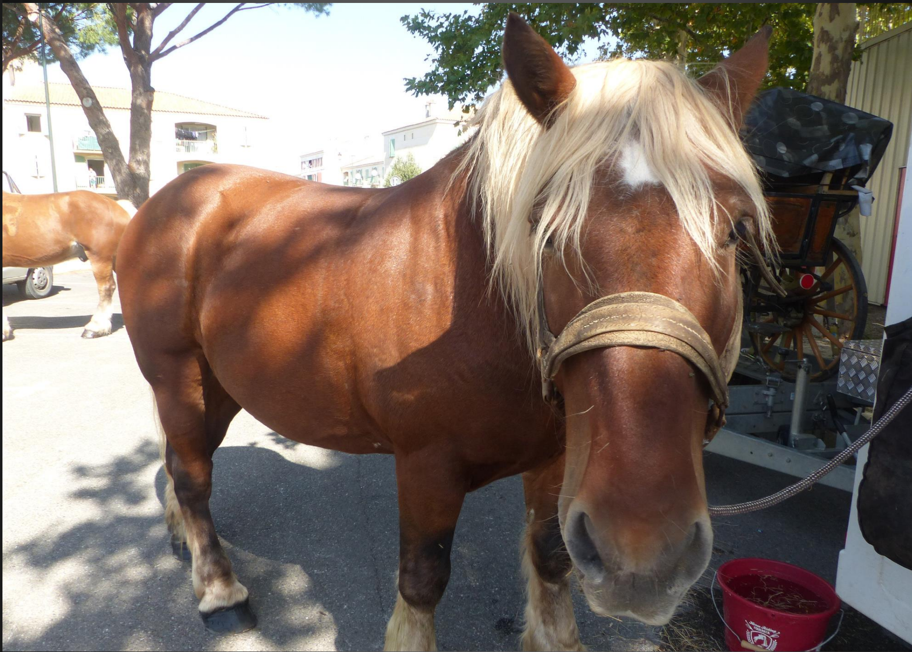
CABANNES_ Le soin des chevaux vient avant l'apéro ... les équidés sont déharnachés, ils ont de l'eau et du foin... Le comtois est le cheval de trait le plus fréquent dans la région, ses origines remonteraient à la grande «Race germanique» importée par les Burgondes au Ve siècle. ( Wikipedia )