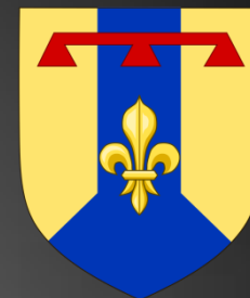
Blason des Bouches-du-Rhône