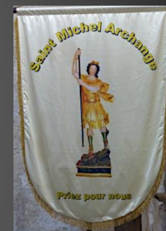
Bannière de Saint Michel Archange