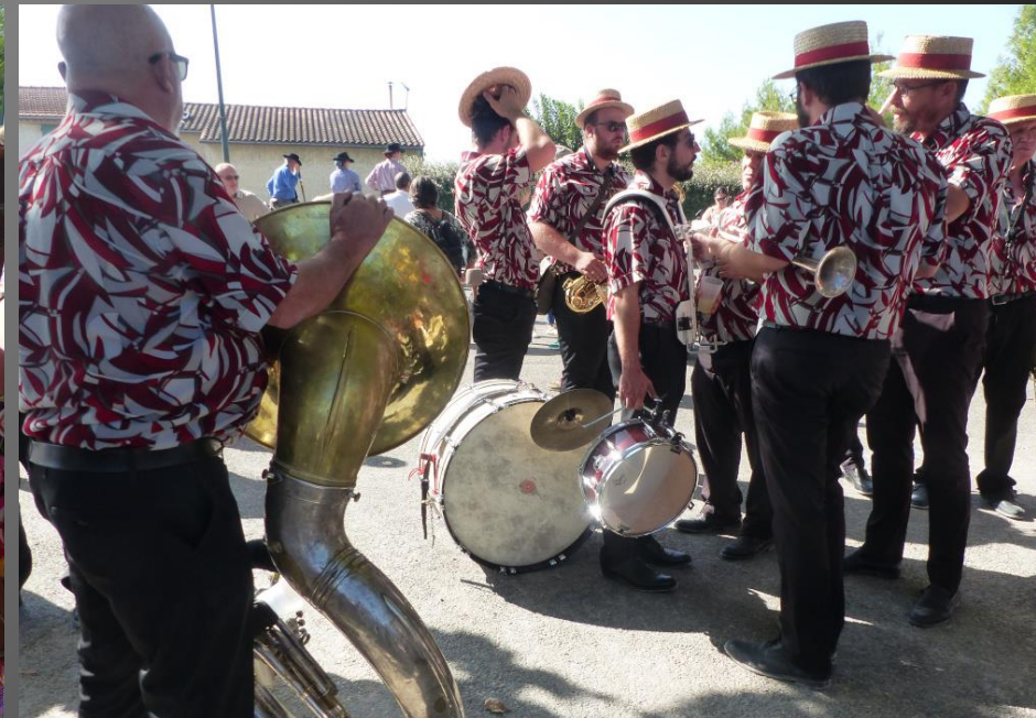
CABANNES _ Pendant qu'on s'occupe aussi des chevaux Camargue, les participants au défilé attendent l'ouverture des grilles des arènes.