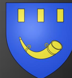
Blason de Cabannes «D'azur, à un cor de chasse d'or, surmonté de trois billettes du même, rangées en chef..»