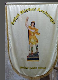
Bannière de Saint Michel Archange