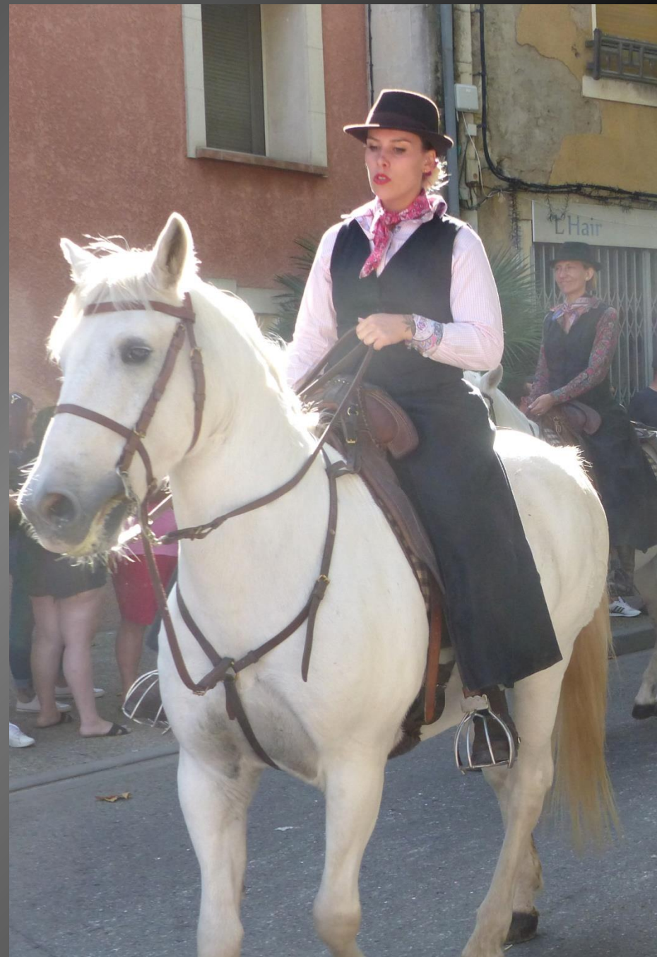
CABANNES _ Les Gardians se mettent en place eux aussi, à l'avant et à la fin du défilé.