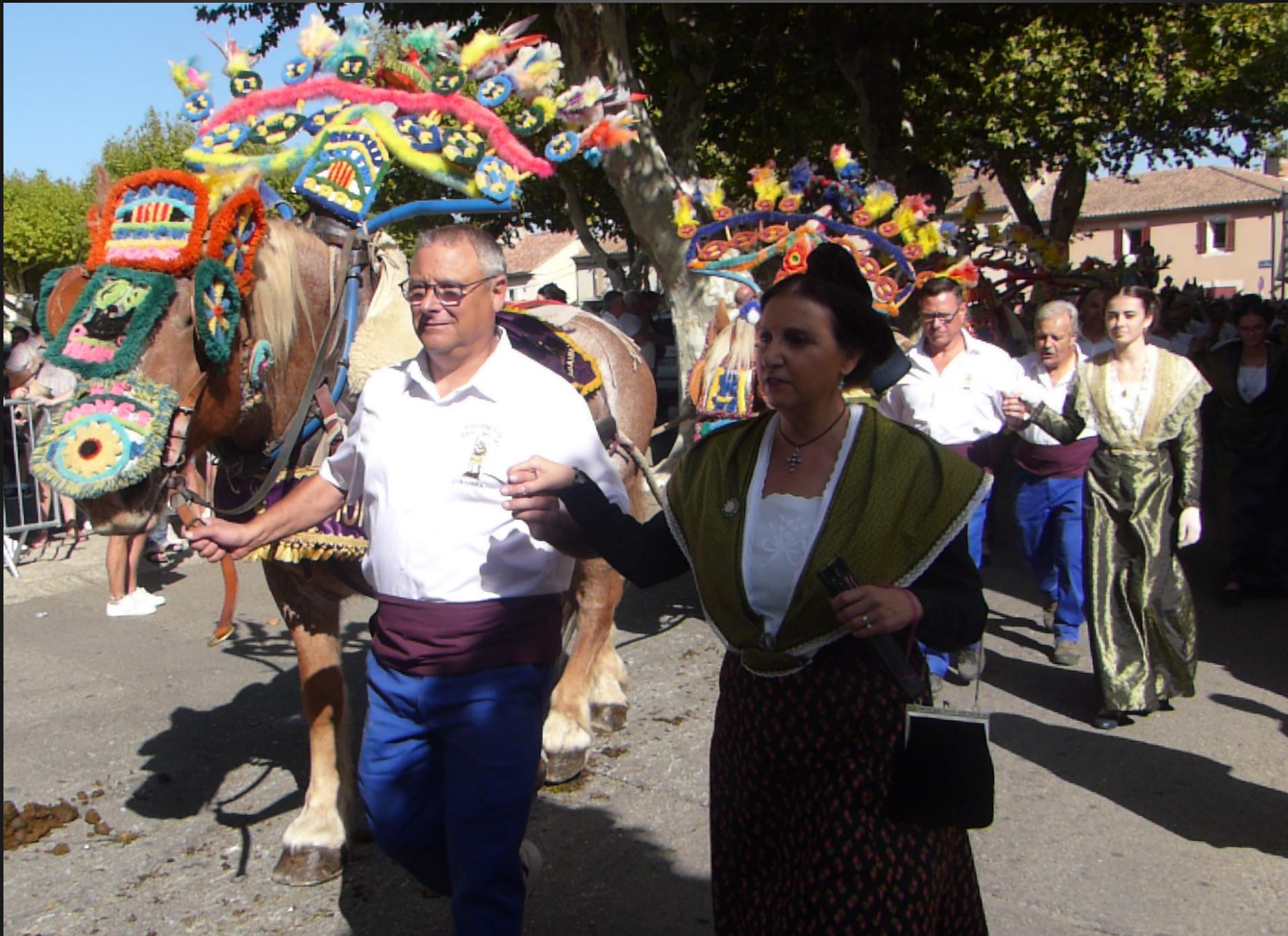
CABANNES _ Les charretiers de l'attelage de la charrette tiennent chacun une Arlésienne en main d'honneur.