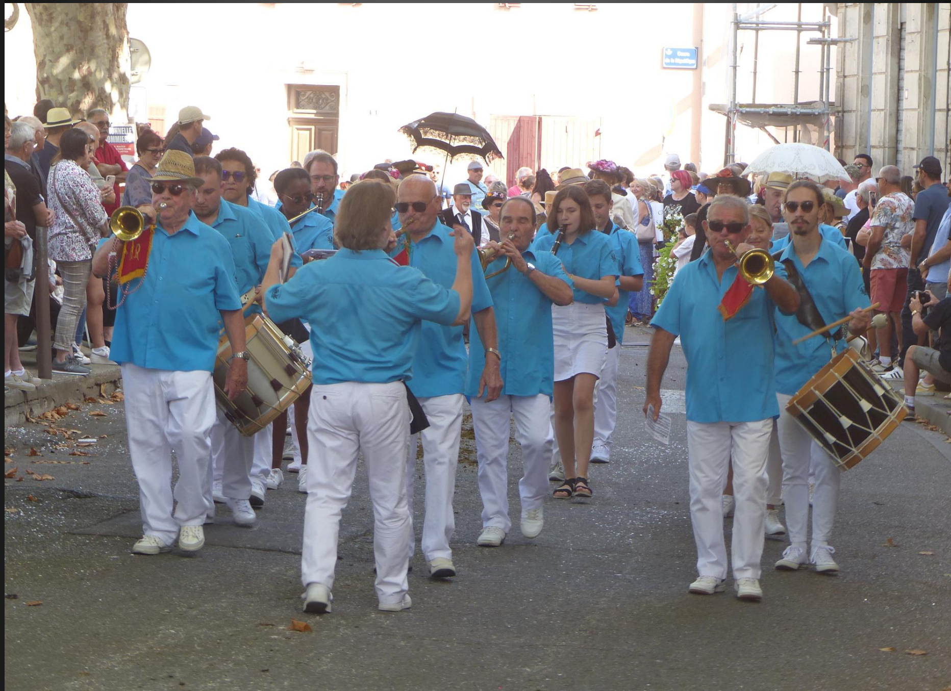
CABANNES _ L'orchestre d'harmonie de Rognonas est l'une des fanfares importantes qui subsistent encore de l'époque où quasiment chaque village avait ses propres musiciens.