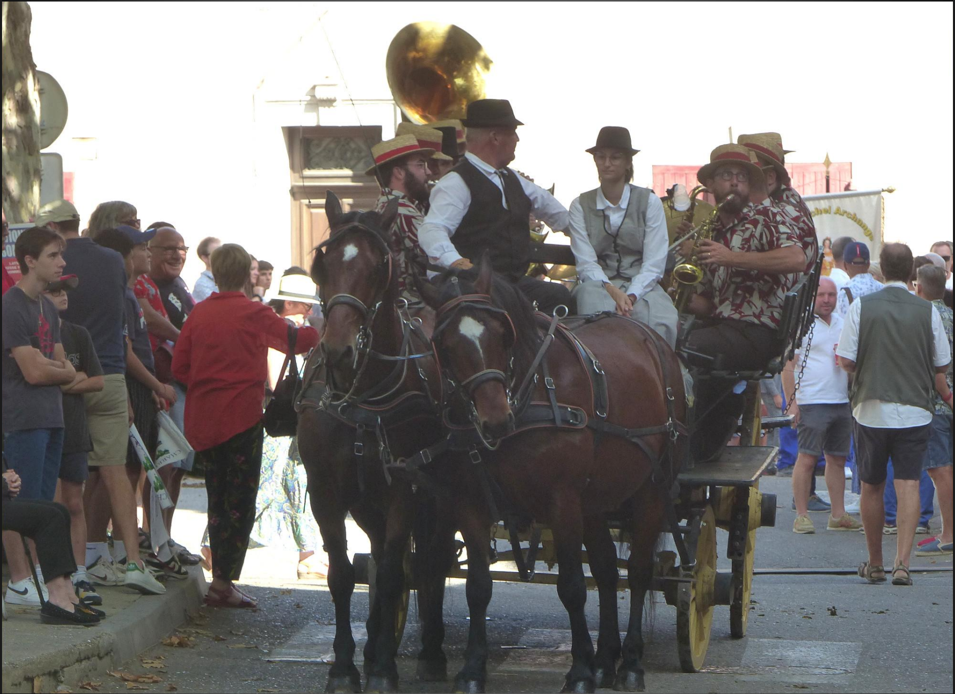
CABANNES _ La charrette de la fanfare est toujours présente dans les fêtes à charrette.