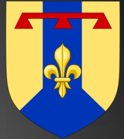
Blason des Bouches-du-Rhône