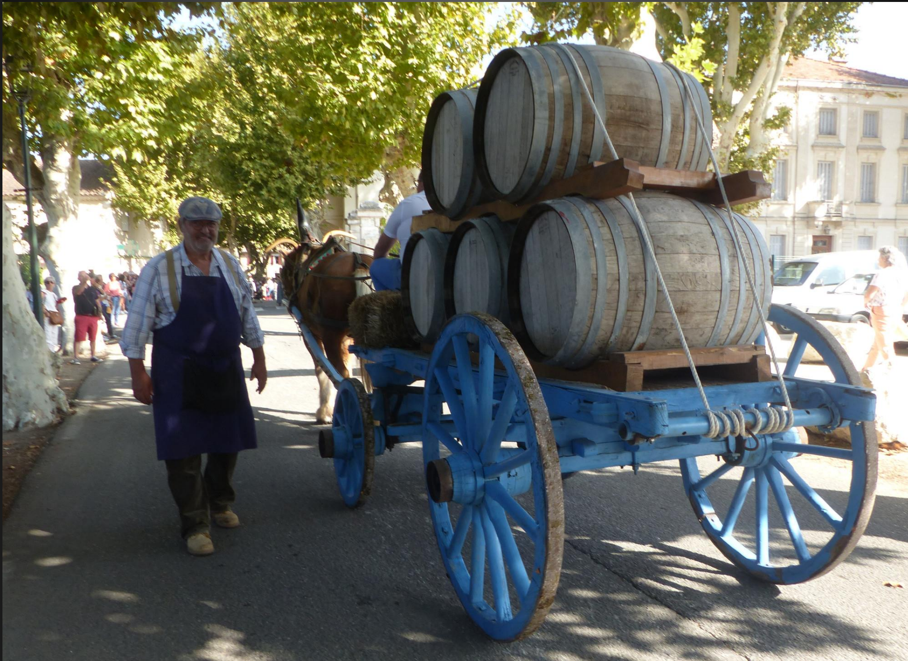
CABANNES _ Saint Michel est le patron des tonneliers, il y a cinq barriques sur cette charrette.