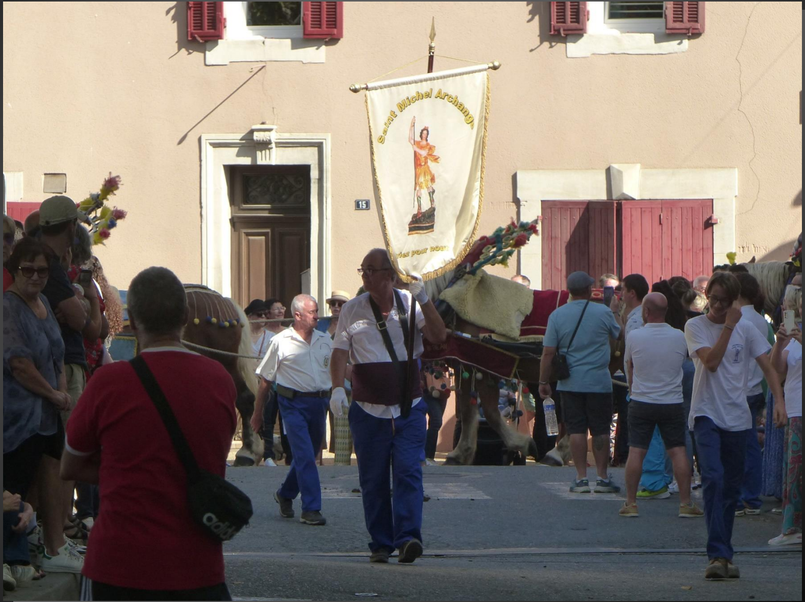
CABANNES _ La bannière de Saint-Michel Archange annonce l'arrivée de la charrette.