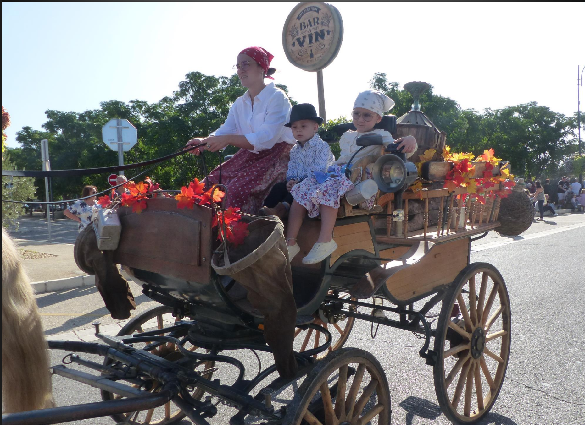
CABANNES _ Les carrioles, calèches et autres charrettes habillées sur le thème du vin et de la vigne se mettent en place pour le défilé.