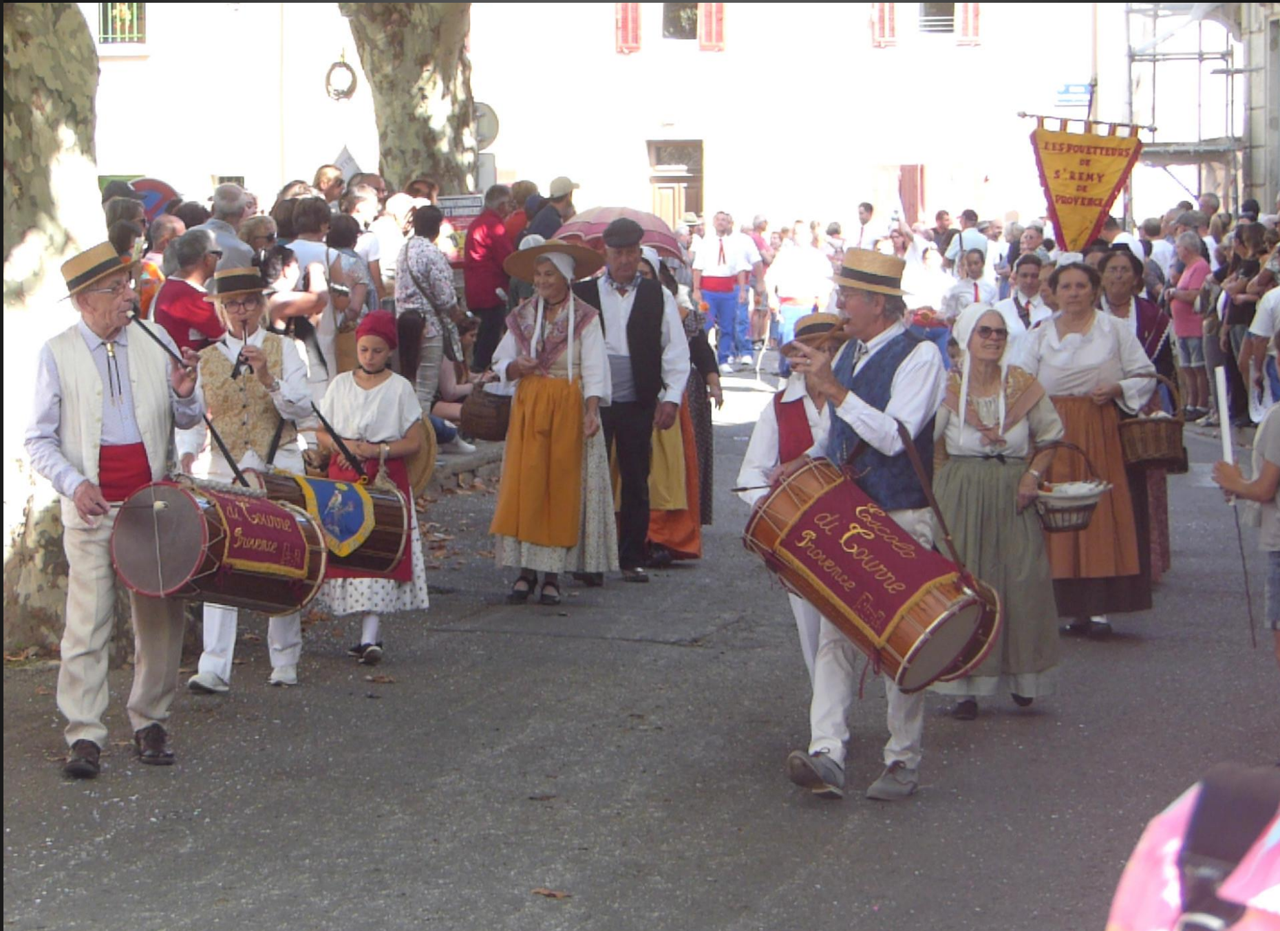
CABANNES _ Tambourinaires, danses provençales traditionnelles et les Fouetteurs de Saint-Rémi.