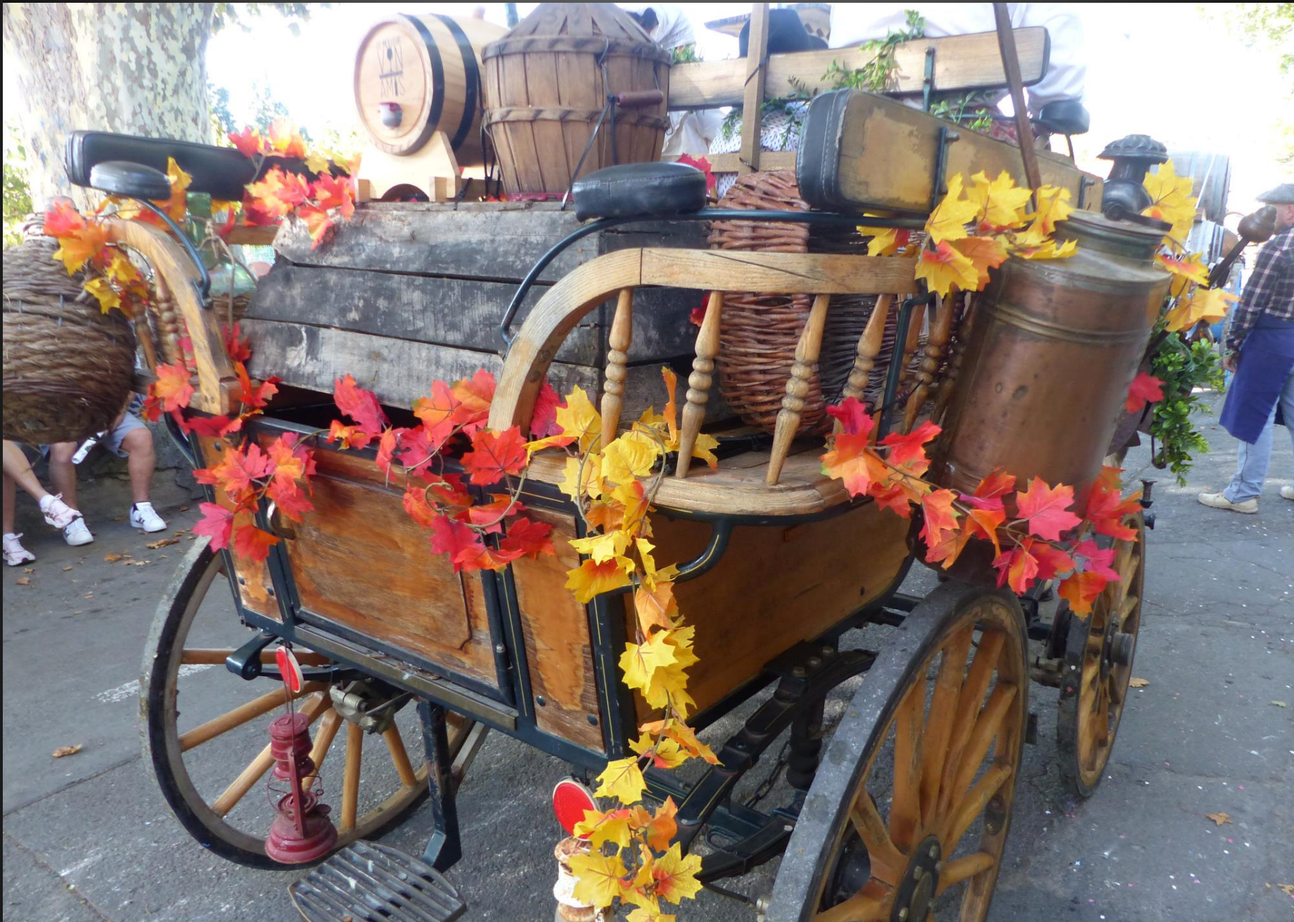
CABANNES _ Fûts et alambics et autres matériels utilisés par les bouilleurs de cru naguère. Dans le Jura, la campagne de distillation débute le 1er septembre 2023 et s'achève le 31 août 2024.