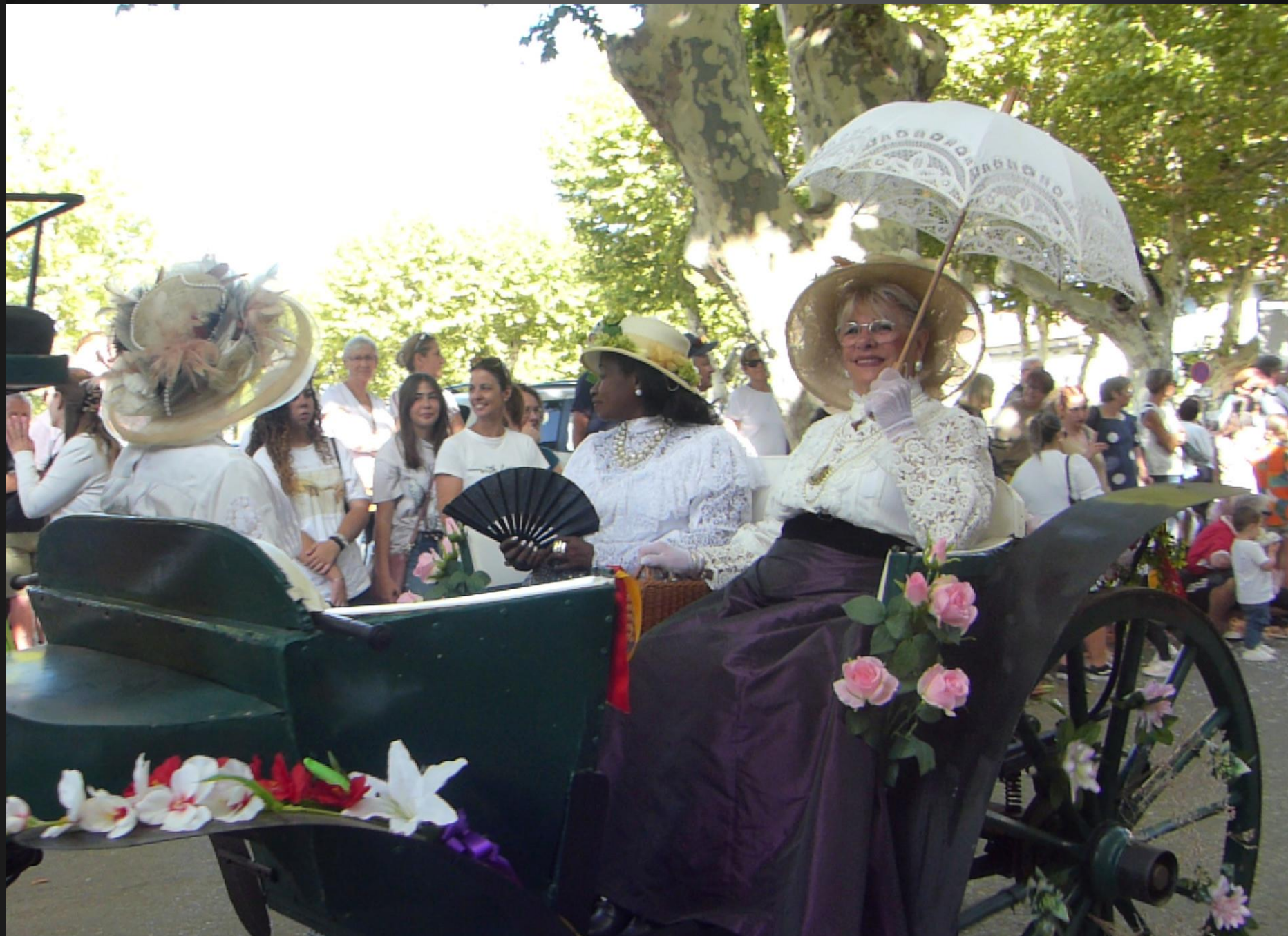
CABANNES _ La calèche des personnalités a beaucoup d'allure.