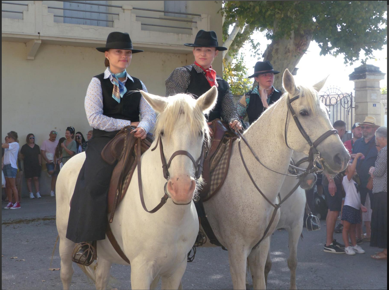
CABANNES _ En 1964 est créée l'Association des éleveurs de chevaux de race Camargue (AECRC), soutenue depuis 1974, par le parc naturel régional de Camargue. La date de la reconnaissance officielle est de cette race est celle du 1 er étalon marqué au fer de l'élevage, le 17 mars 1978, par arrêté ministériel. (Wikipedia)