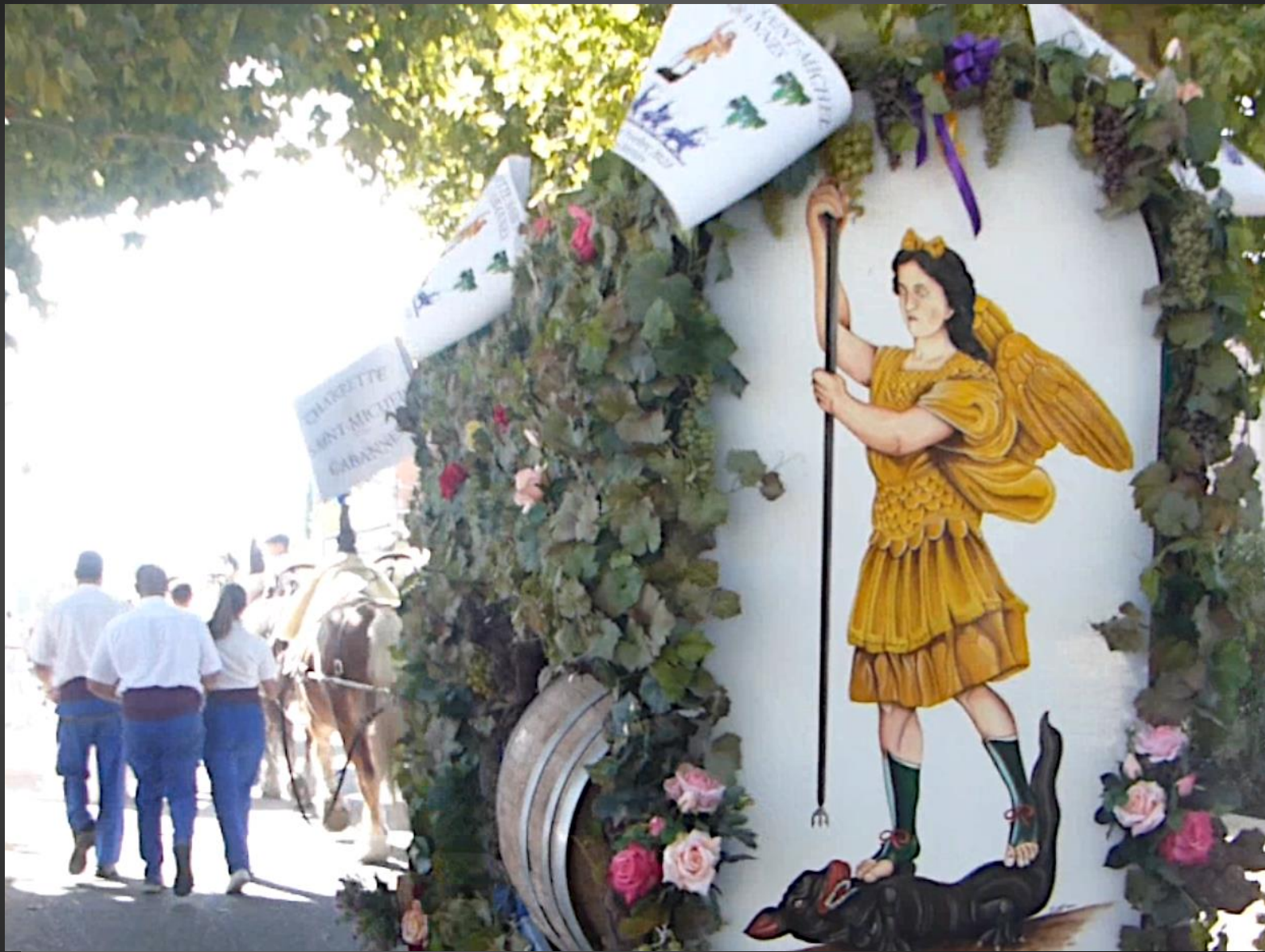
CABANNES _ La charrette de Saint-Michel va maintenant disparaître jusqu'à son retour l'an prochain pour cette belle fête, la dernière des fêtes à charrette de la saison.