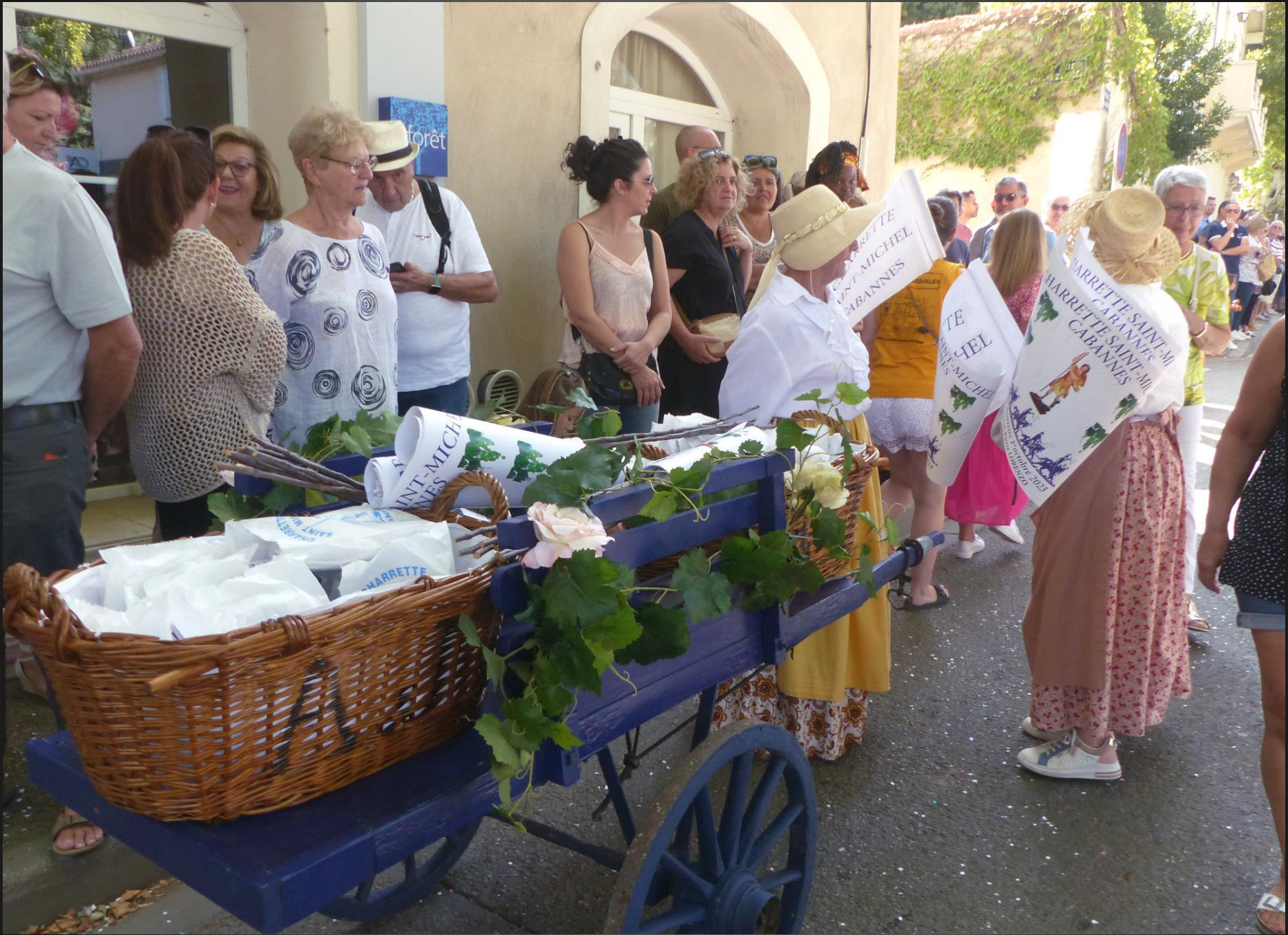
CABANNES _ L'association Les Amis de la Charrette de Saint-Michel distribue divers souvenirs contre un don laissé à l'appréciation de chacun .