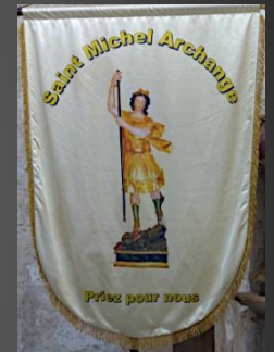
Bannière de Saint Michel Archange