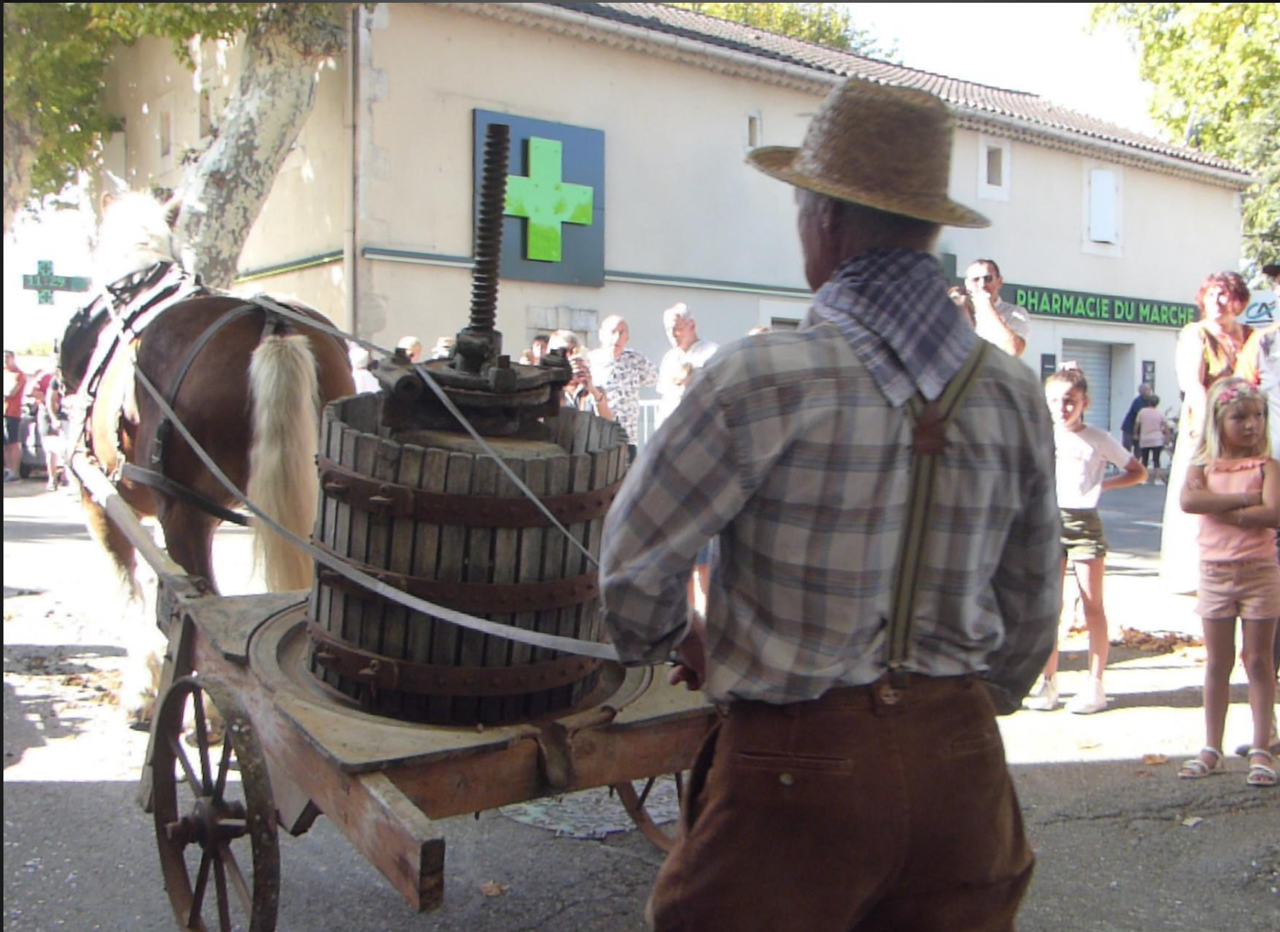
CABANNES _ Le pressoir à vis rappelle de bons souvenirs à ceux qui ont participé aux vendanges du temps jadis.