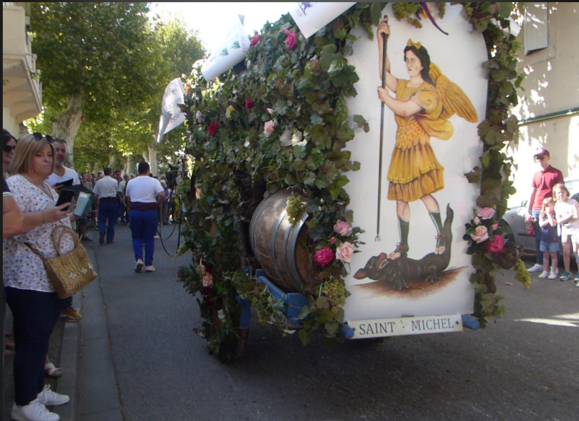
CABANNES _ Une grande image de l'Archange orne l'arrière de la charrette.