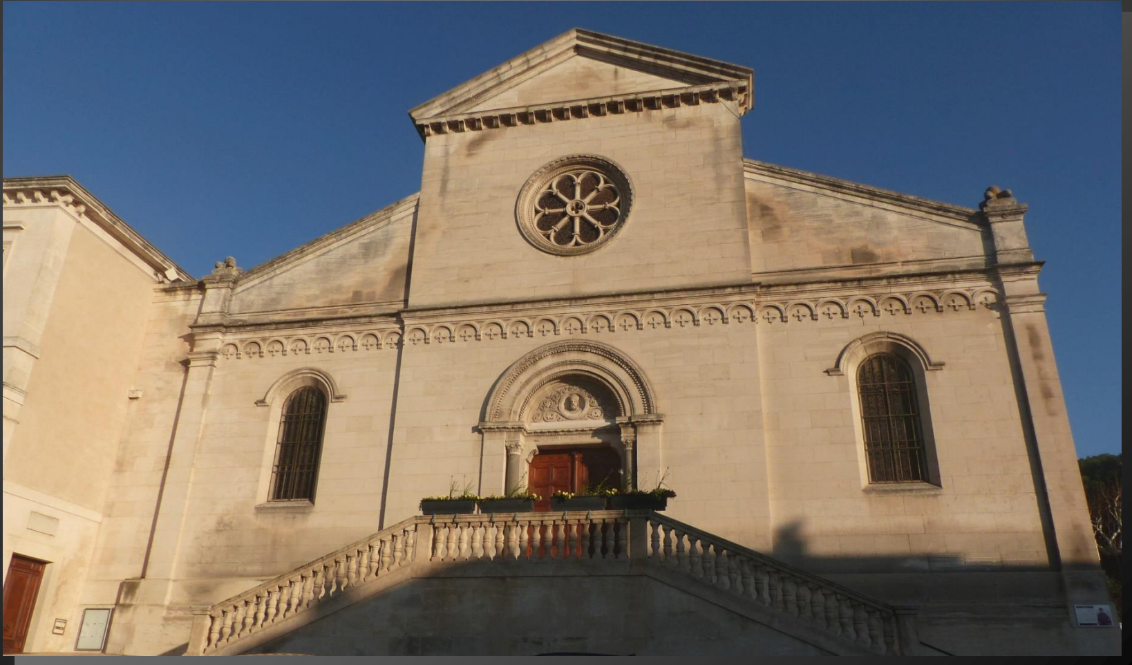
CHATEAURENARD _ La grande façade de l'église Saint-Denys est du XIXe siècle.