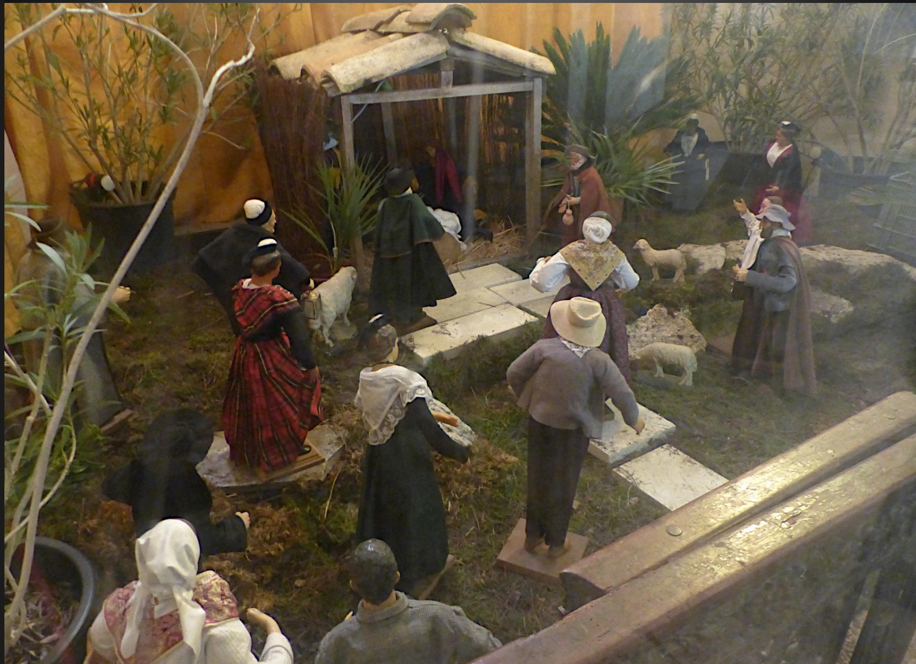
Eglise Saint-Denis _ Une paroi en plexiglass protège ces grands santons de valeur.