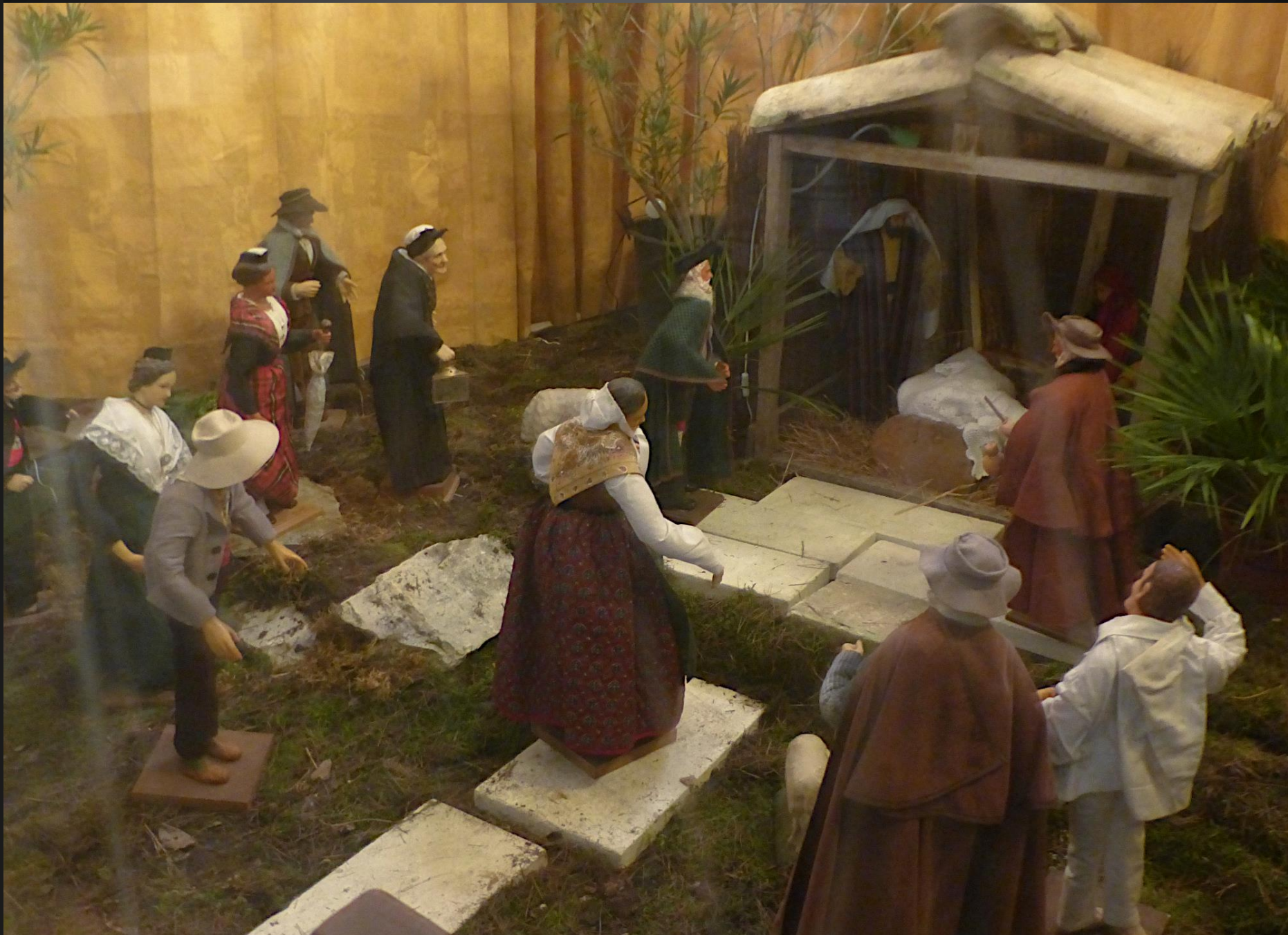
Eglise Saint-Denys _ Curieusement, on n'aperçoit pas l'Enfant dans la mangeoire...