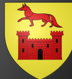
Blason de Châteaurenard

D'or au gousset renversé d'azur chargé en cœur d'une fleur de lys du champ surmontée d'un lambel de gueules brochant sur le tout.