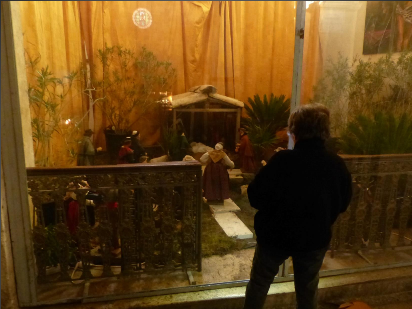
Eglise Saint-Denys _ Vue générale de la crèche.