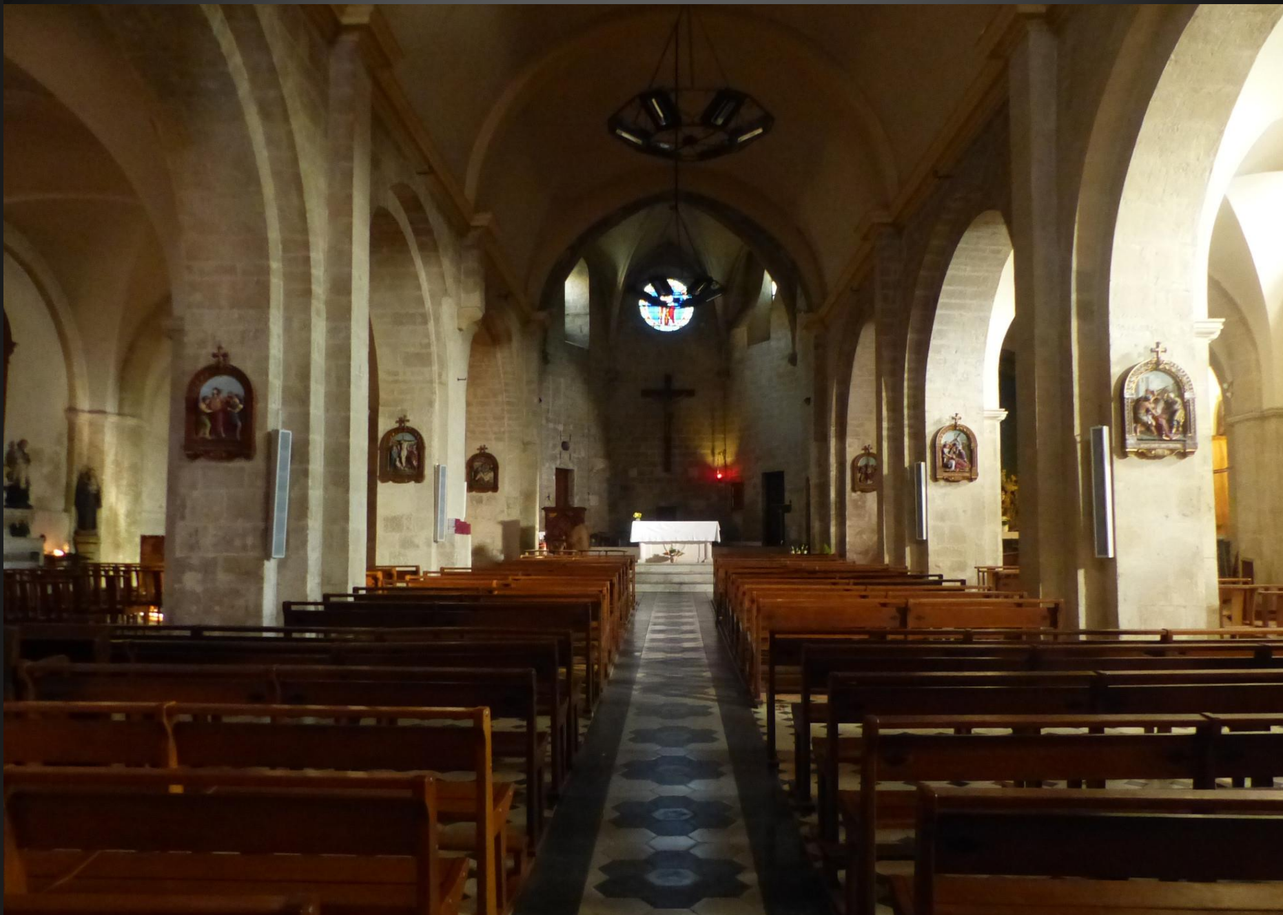
Eglise Saint-Denis _ L'origine de l'église de Châteaurenard remonte probablement à la fin du XIIe siècle, début XIIIe, date de construction de la nef romane. Au milieu du XIVe siècle, l'ancien chœur roman fut remplacé par un chœur gothique. Sur les piliers qui soutiennent l'édifice, on peut suivre les quatorze stations d'un chemin de croix de style sulpicien qui a été restauré à la fin du siècle dernier