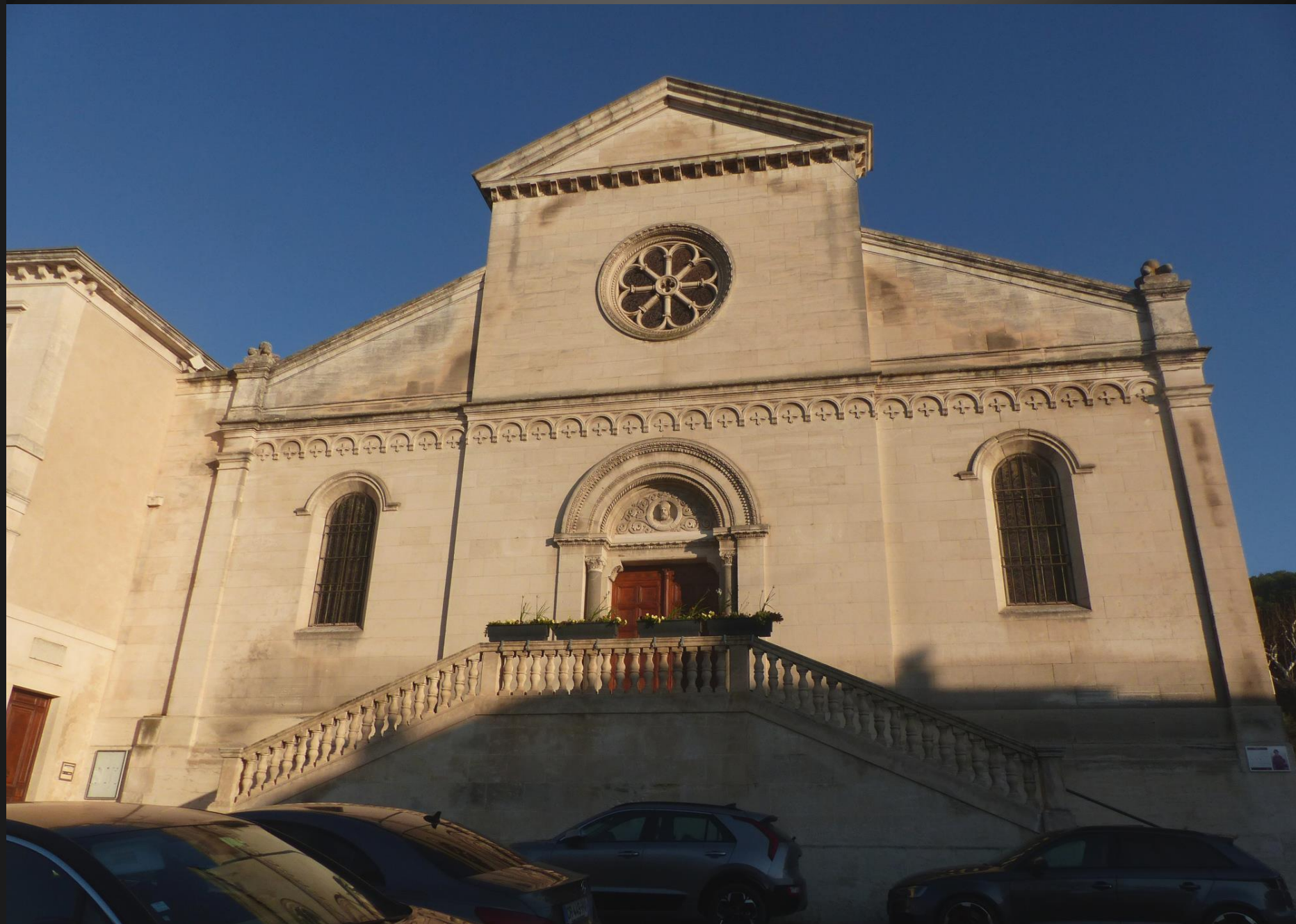
Église Saint-Denis _ Entre 1832 et 1848, d'importants travaux d'agrandissement furent menés. On construisit alors les nefs latérales et la façade de l'église, à l'ouest, avec sa grande rosace et son porche en plein cintre, montrant saint Denys, sculpté en ronde bosse.