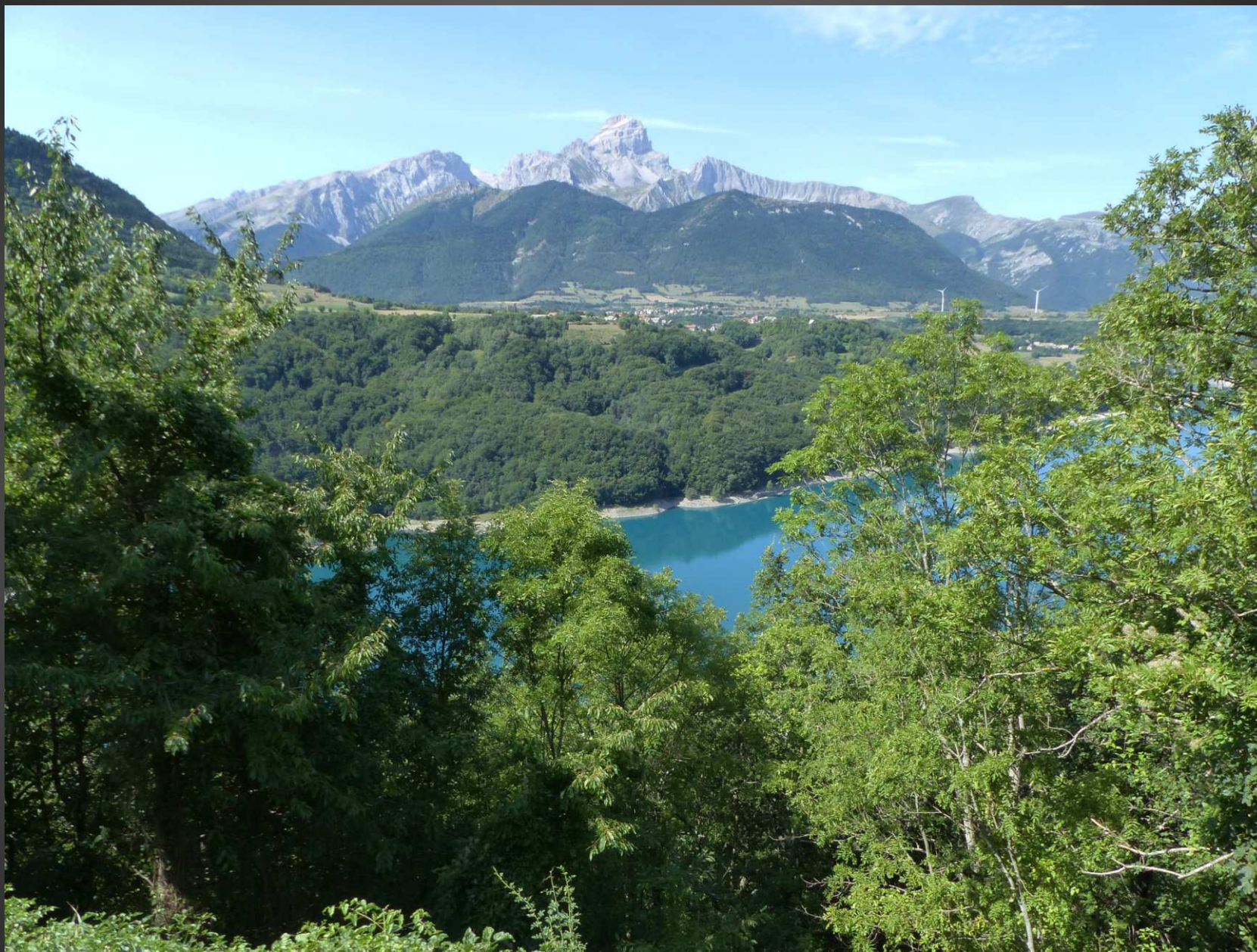
CORPS _ Lac du Sautet, couleur turquoise et dans le lointain, le village de Pellafol, sous la Grande Tête de l'Obiou.