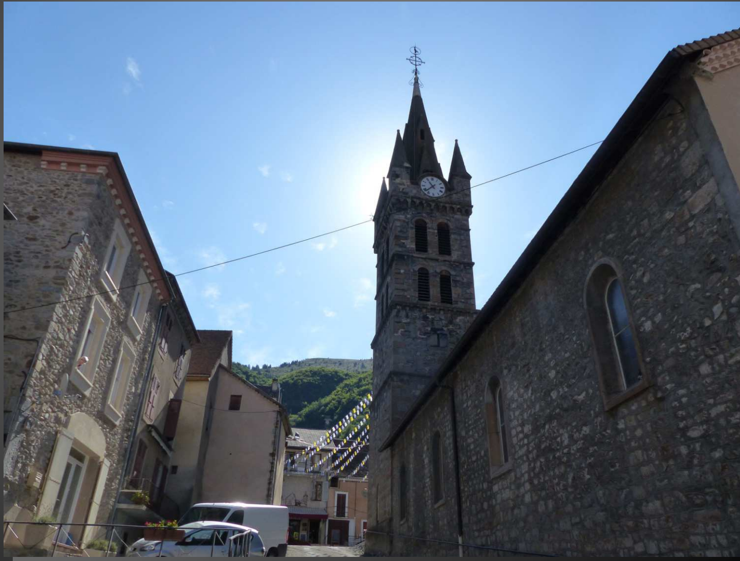
CORPS (alt. 937m), église Saint-Pierre.