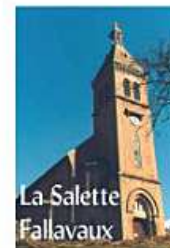
La Salette Fallavaux