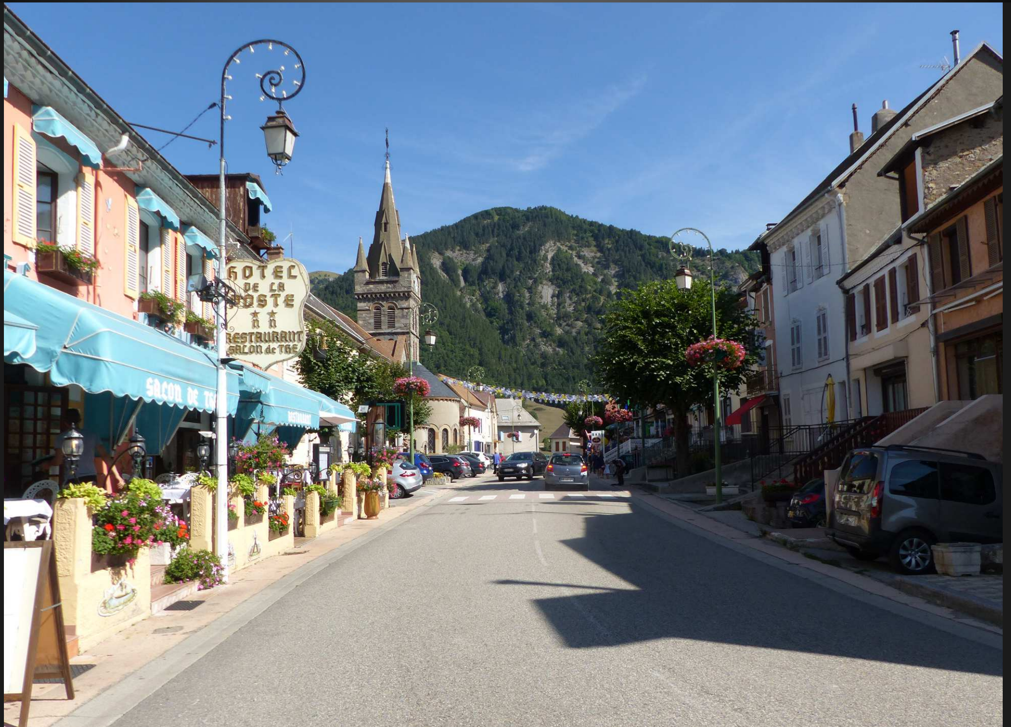
COPRS, RUE DES FOSSÉS _ Eglise Saint-Pierre, au bord l'artère principale et commerçante du village. Jadis, pour améliorer la sécurité des remparts, un grand fossé avait été creusé, qui a donné le nom à la rue.