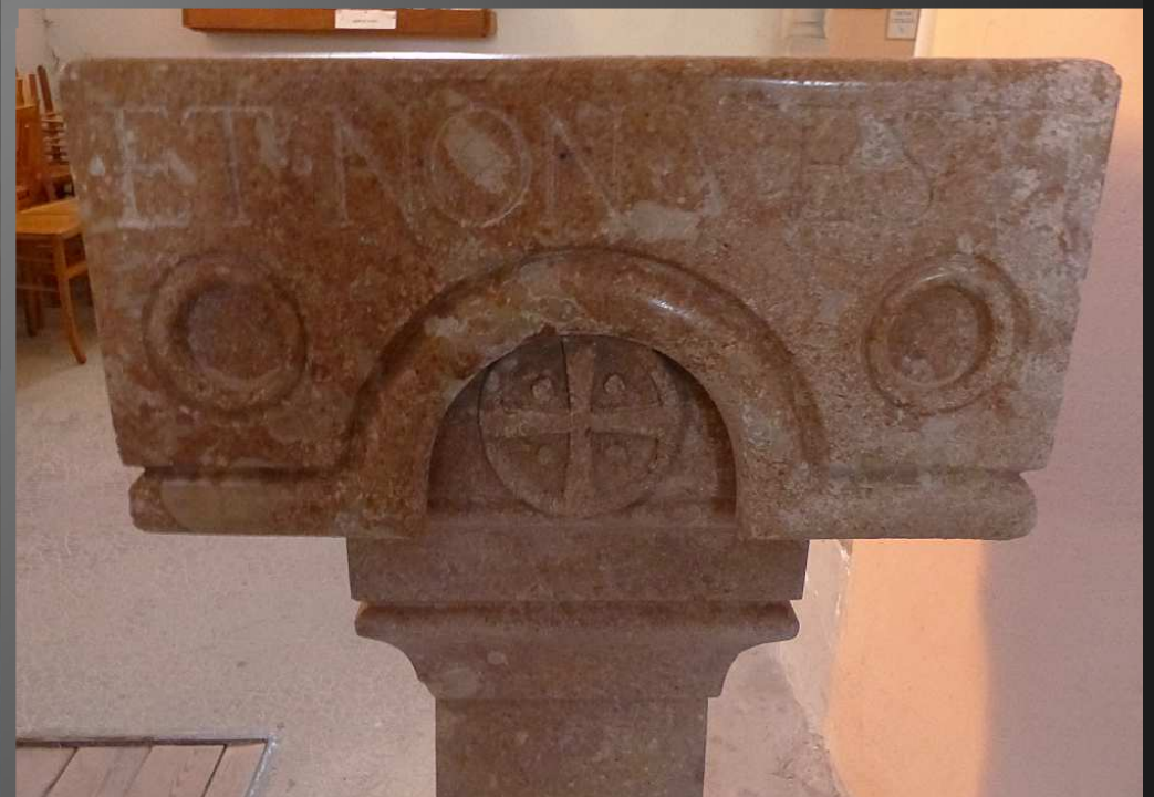
EGLISE SAINT-PIERRE _De part et d'autre de l'entrée, deux bénitiers en marbre qui datent du XIXe siècle portent des inscriptions en grec et en latin (ci-dessus) : SCINDITE CORDA VESTRA ET NON VESTIMENTA VESTRA (Déchirez vos cœurs, et non pas vos vêtements, Joel Ch. 02 V. 13 )