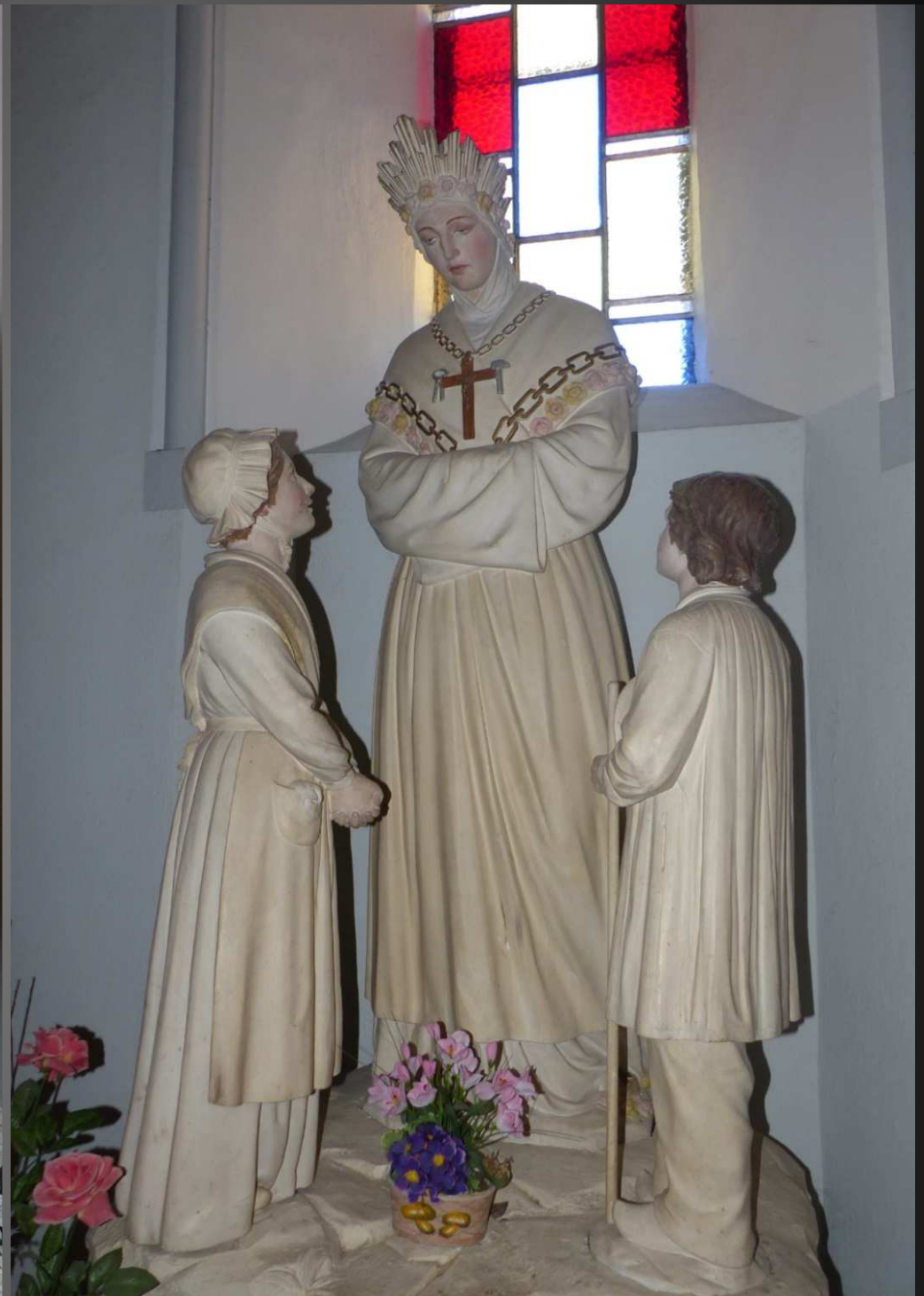
EGLISE SAINT-PIERRE _ Deux statues représentent Notre-Dame de la Salette : l'une, debout devant Maximin et Mélanie, les deux jeunes voyants du 19 septembre 1846, dans les alpages du Planeau au-dessus de Corps, à 1800m. d'altitude ; l'autre, assise et en pleurs, telle qu'elle a d'abord été aperçue par les deux petits bergers.