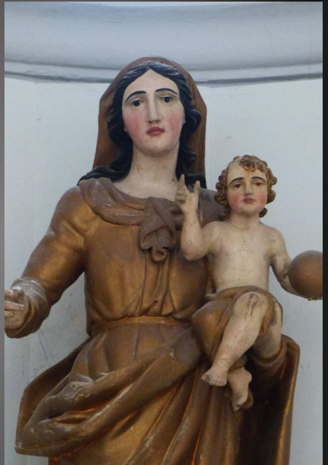
EGLISE SAINT-PIERRE _ Chapelle Sainte-Marie, éclairée par un oculus ovale ; la Mère de Dieu porte l'Enfant-Jésus sur le bras gauche.