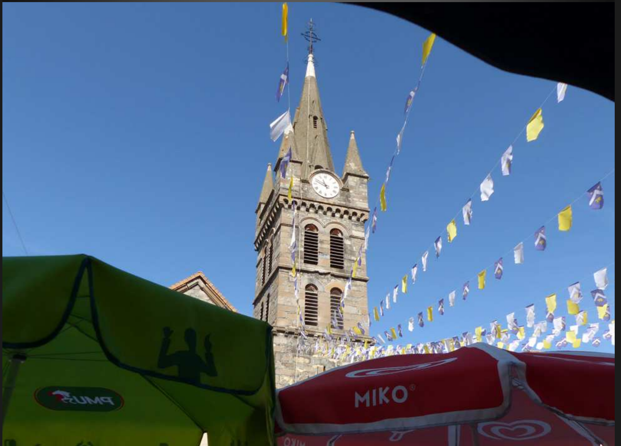
CORPS, RUE DES FOSSES _ Le clocher de l'église, vu de l'Obiou Bar, en face, où le pèlerin fait une pause ...