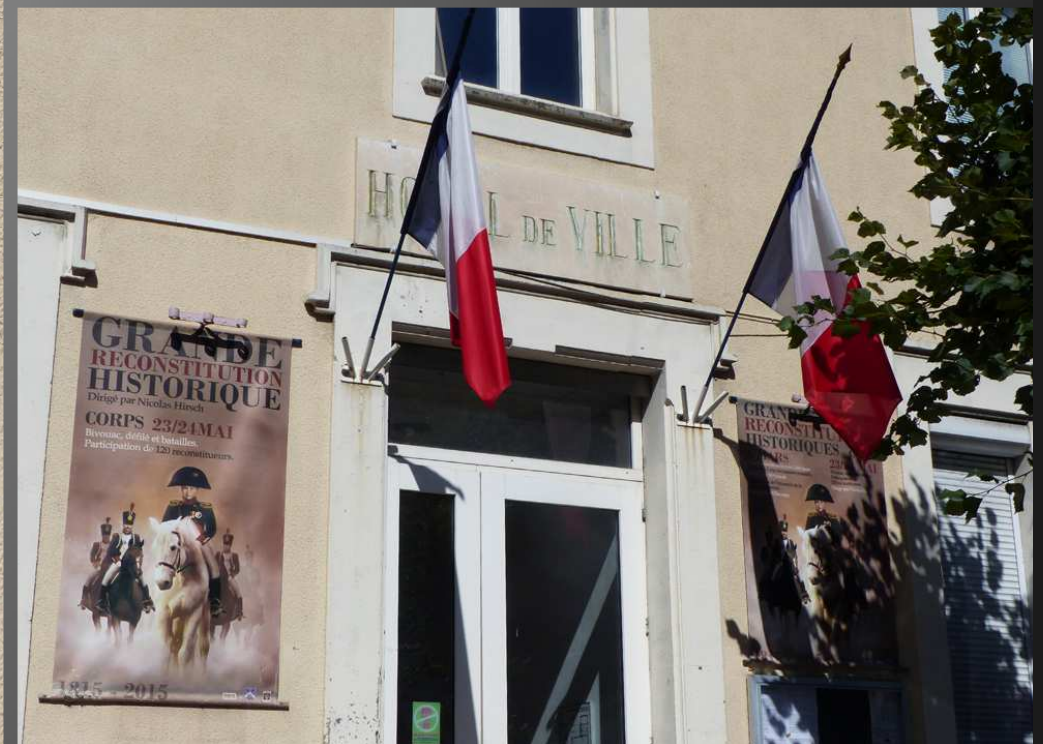
CORPS, RUE DES FOSSES _ Affiche de la grande reconstitution historique napoléonienne, sur le mur de la mairie.