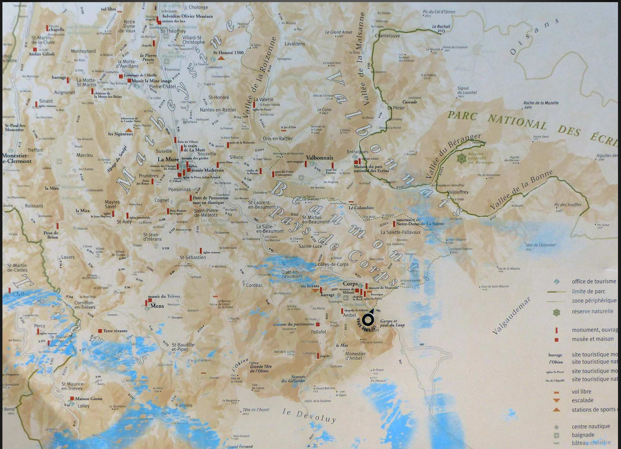
CORPS_ Sortie du village vers le Sud, de grandes cartes du Pays de Corps sur une aire de stationnement face à l'Obiou : Corps et la Salette-Fallavaux sont situés entre le Parc des Ecrins et le Massif du Dévoluy.