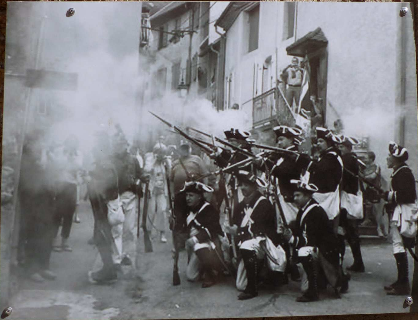
CORPS, GRAND RUE_ Photographie d'une reconstitution historique du passage de Napoléon en 1815.