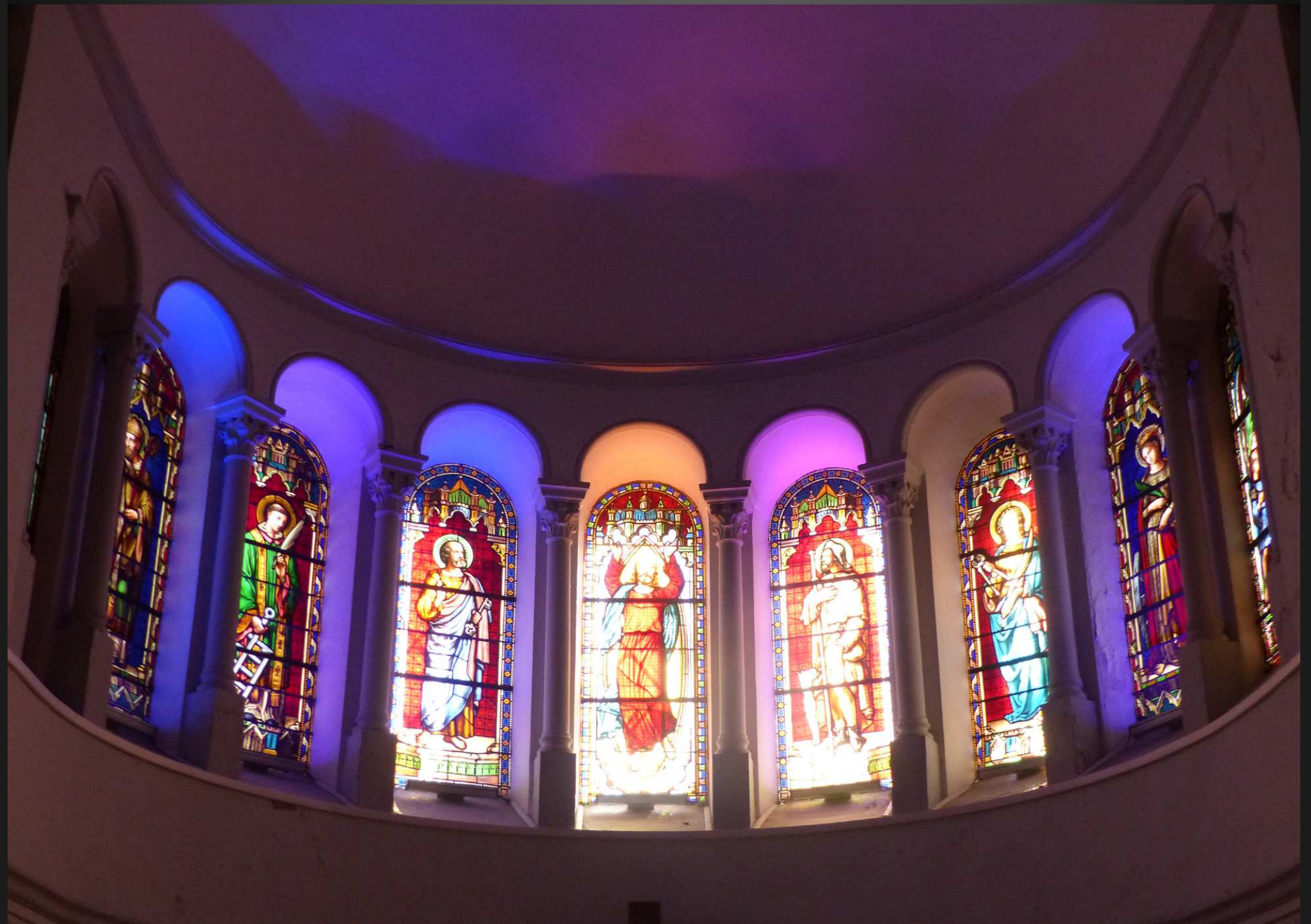
EGLISE SAINT-PIERRE _ L'abside, très dépouillée, est circulaire et éclairée par une rangée de hauts vitraux où l'on reconnaît St Laurent (avec le grill), saint Pierre ( avec les deux clés) et saint Roch (avec son chien). Ils sont tournés vers le Christ qui occupe la position centrale.