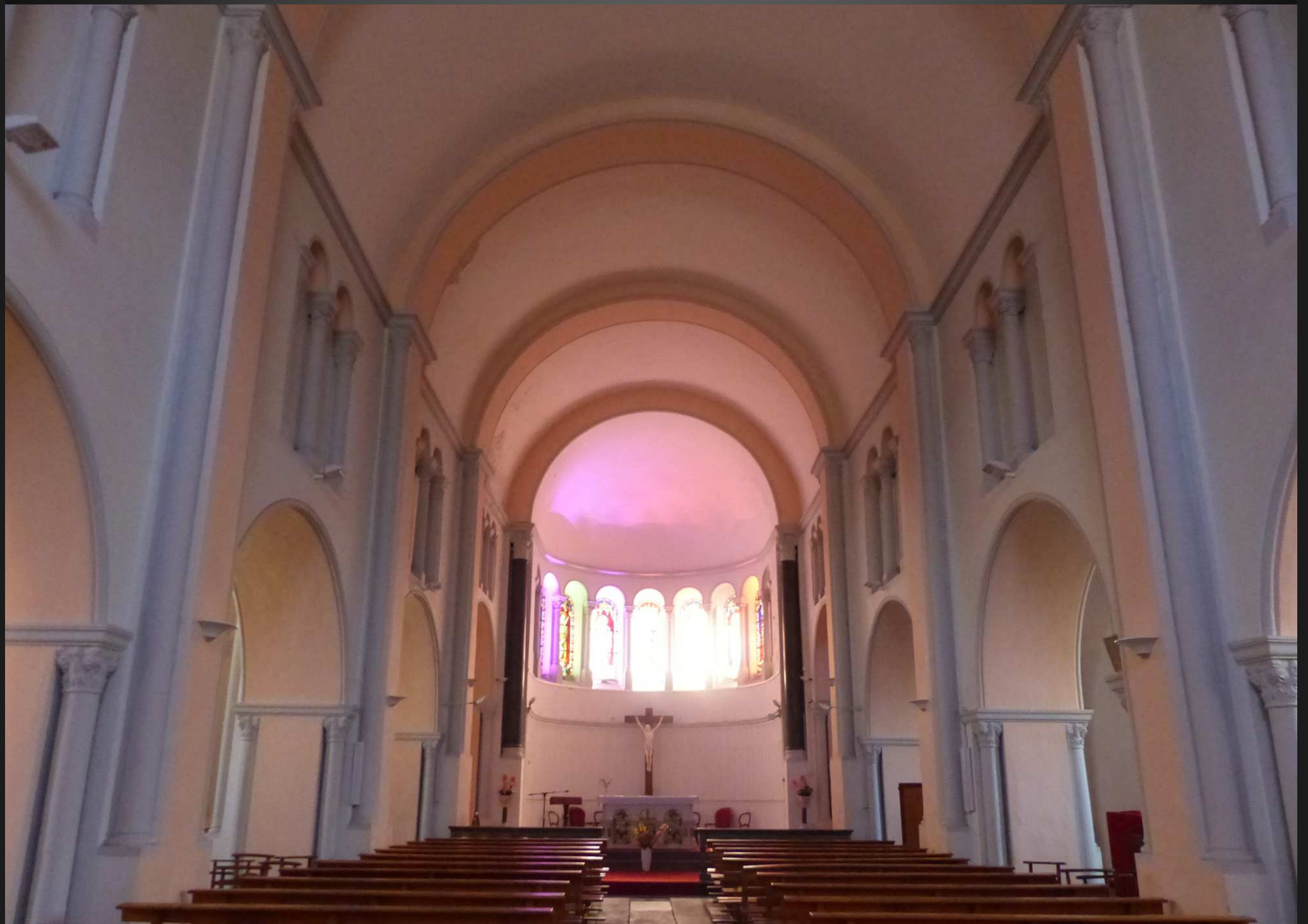
EGLISE SAINT-PIERRE _ Le maître-autel en marbre blanc est décoré de mosaïques recouvertes de feuilles d'or. La table de communion et les colonnes sont en marbre noir extrait d'une carrière d'un village du canton. Ce marbre a servi aux Invalides pour le socle du tombeau de Napoléon.