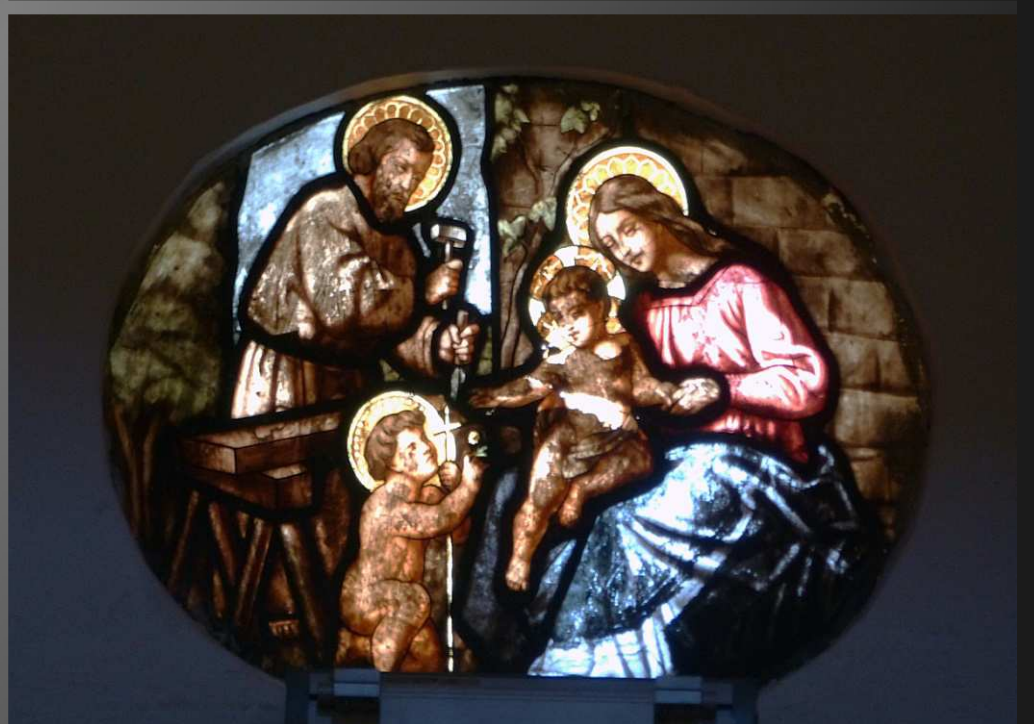
EGLISE SAINT-PIERRE _ Vitrail dans le transept représentant St Eldrade, patron de la paroisse. Les vitraux des deux chapelles latérales (à dr.), exécutés au XVIe siècle, représentent l'un, "l'Annonciation" par l'Archange Gabriel (le messenger de Dieu), et l'autre, la Sainte Famille avec le petit Jean-Baptiste, qui n'a que quelques mois d'écart avec Jésus assis sur les genoux de Marie. Joseph s'affaire à sa tâche de charpentier.