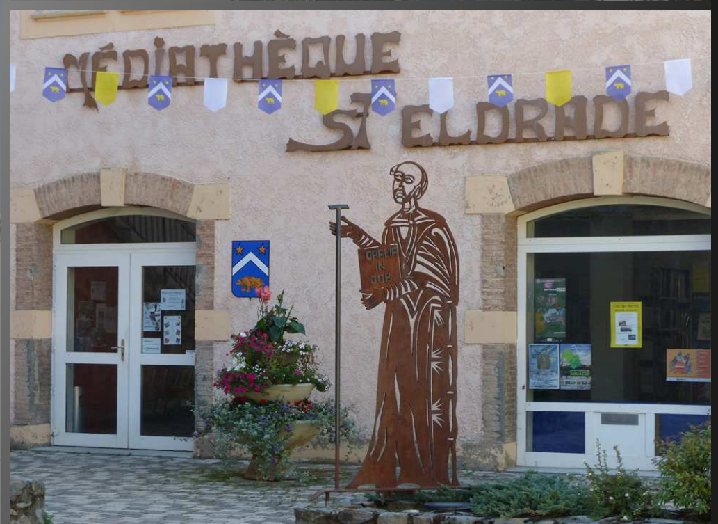
CORPS, RUE DES FOSSÉS_ Chevet et clocher de l'église Saint-Pierre. L'Obiou domine le village du haut de ses 2702m. St Eldrade (Abbé de la Novalaise, IXe siècle) est le patron des Corpatus, les habitants de Corps.