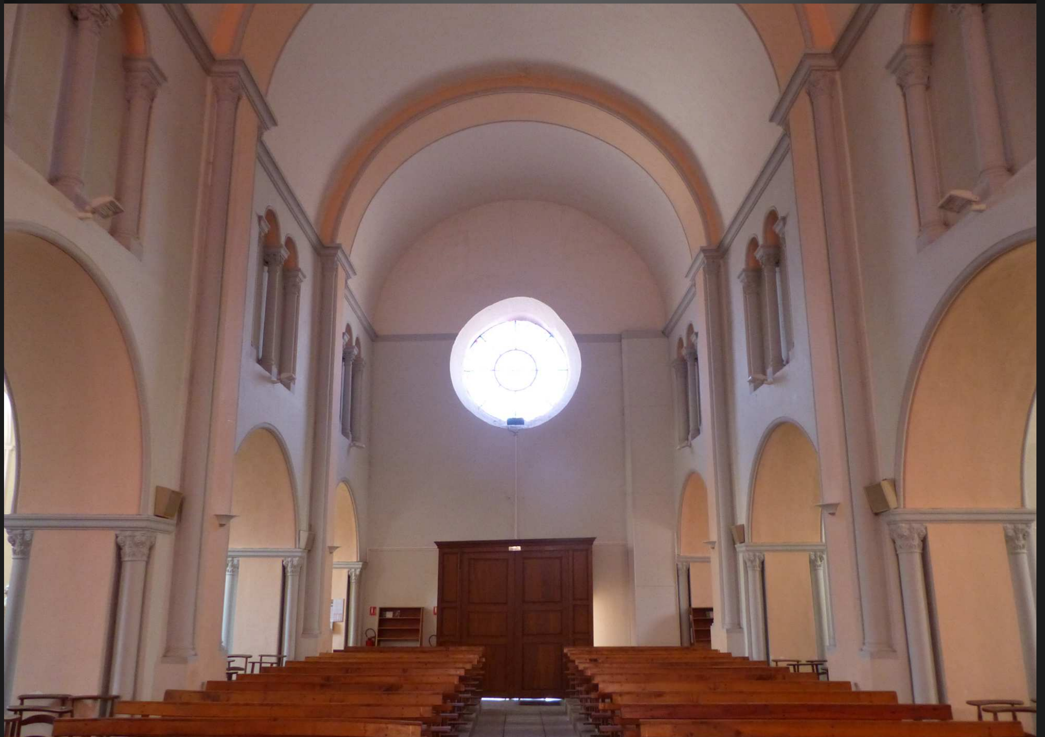
EGLISE SAINT-PIERRE _ L'église paroissiale de Corps faisait partie d'un prieuré construit en 1212 par des moines bénédictins de l'abbaye Saint-Victor de Marseille. De style roman, l'édifice a été ravagée en 1821 par un incendie qui a aussi détruit le presbytère et la plus grande partie du village d'alors ; elle a été restaurée en accord avec son style d'origine.