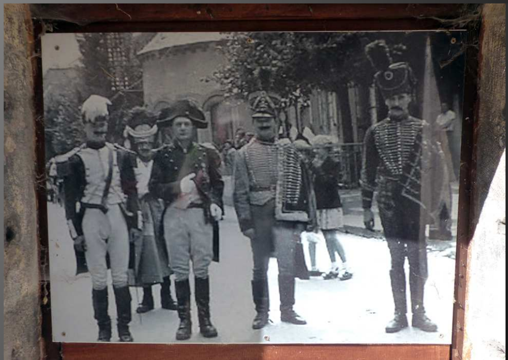
CORPS GRAND RUE _ La Maison Napoléon : plusieurs photographies dans la Grand Rue rappellent les commémorations du passage de l'Empereur en 1815, en route pour les Cent-Jours.