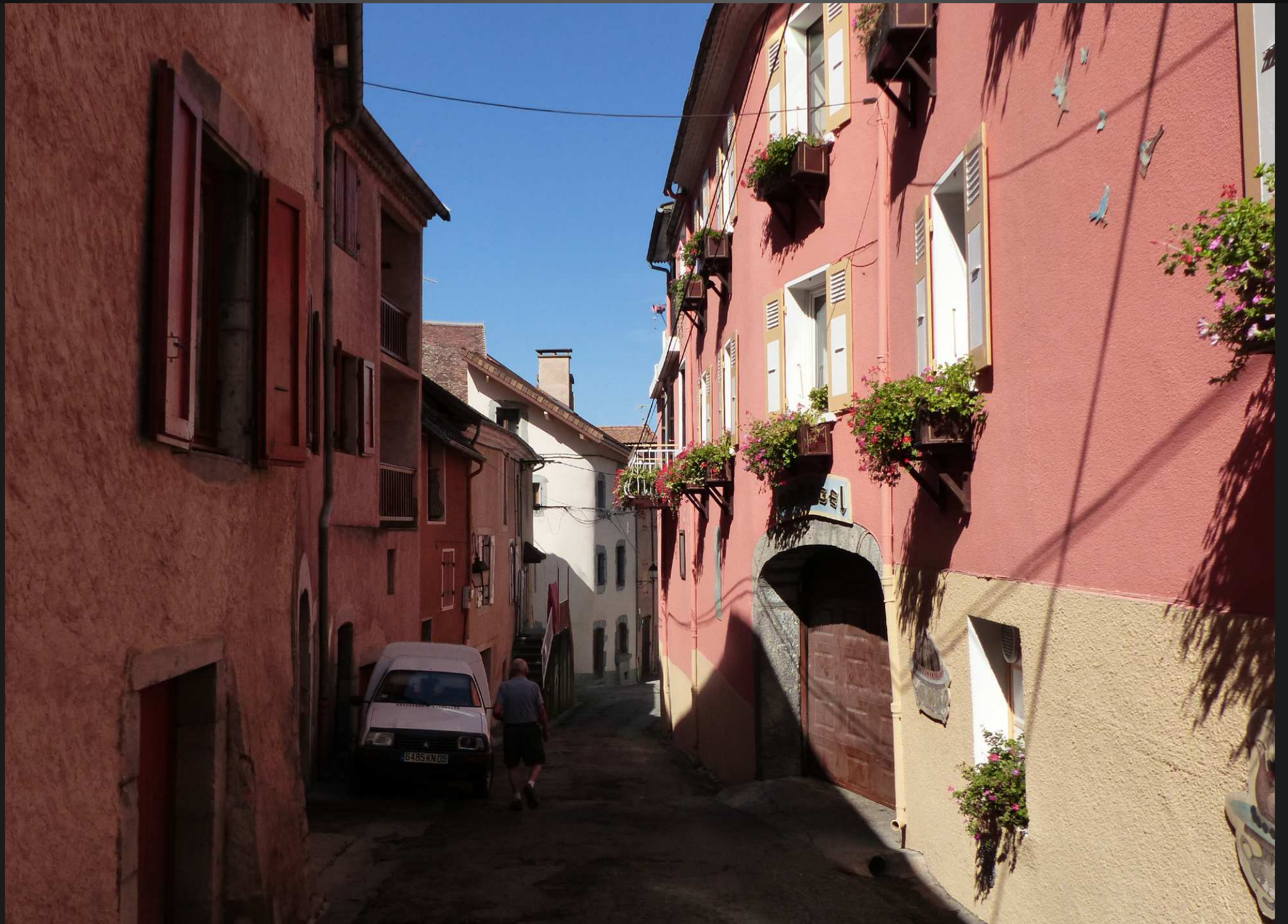
CORPS_ Couleurs chatoyantes des maisons du village et fleurs de géranium à profusion..