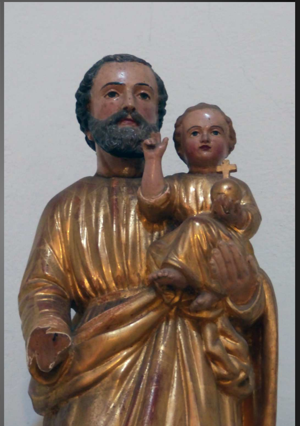
EGLISE SAINT-PIERRE _ Chapelle Saint-Joseph, éclairée par un oculus ovale ; le saint patron de l'Eglise Universelle porte l'Enfant-Jésus sur le bras gauche.