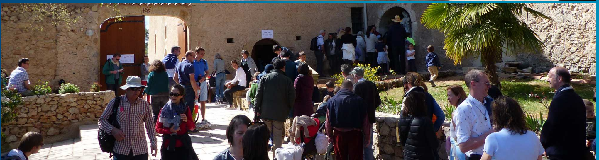
LE MONASTERE / En 1661 l'évêque de Fréjus prononça ces paroles : « Dieu, par les grâces qu'Il voulait accorder en l'honneur de Saint Joseph, voulait ne point séparer dans la dévotion des fidèles, les deux saintes personnes (Marie et Joseph) qu'Il avait jointes sur la terre pour le Mystère de notre salut... ». Le jour de la fête de Saint Joseph, les pèlerins viennent prendre de l'eau à la Source (ci-dessus).