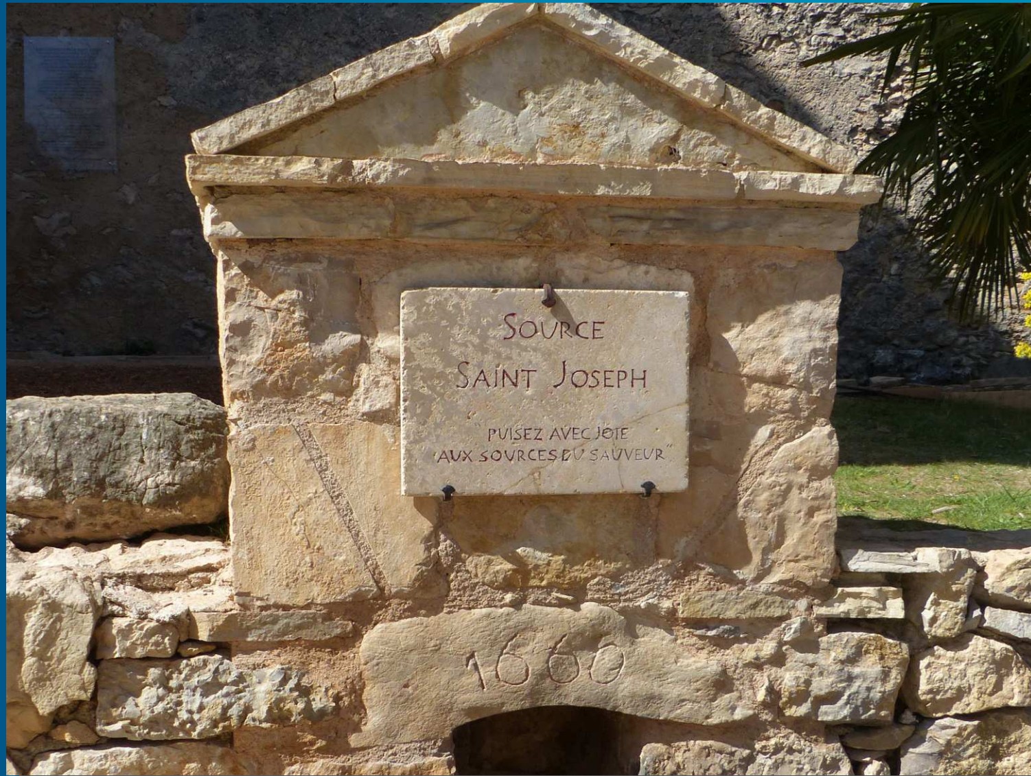
La Source Saint Joseph / Monastère La Font Saint-Joseph du Bessillon à Cotignac (Var).