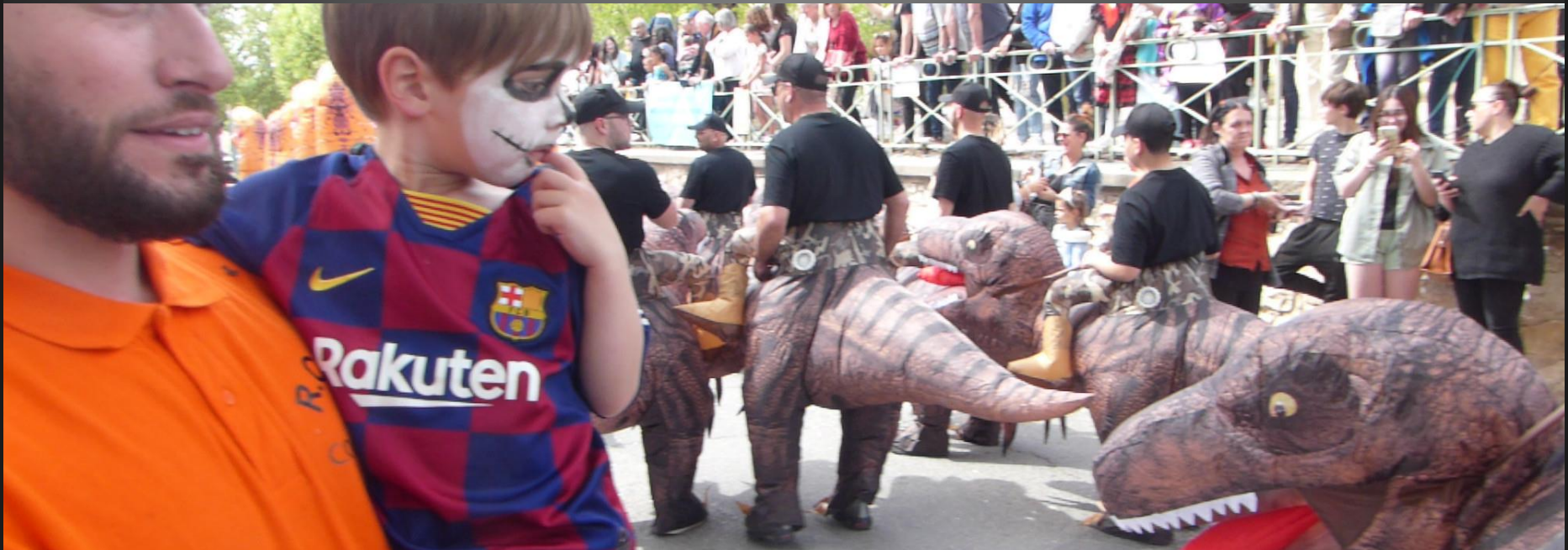
COUDOUX_ Dinos : ça fait réfléchir.