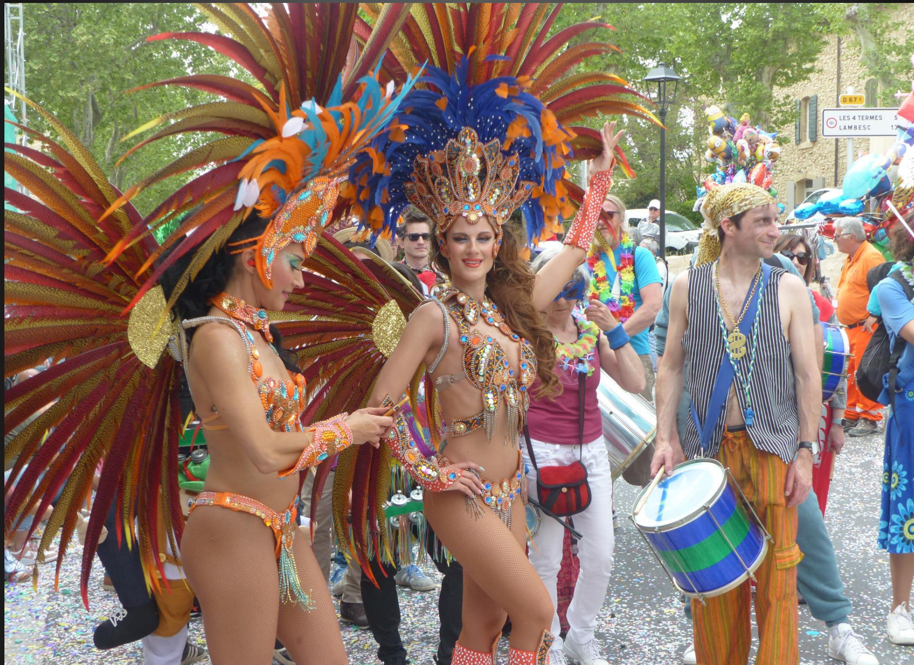
COUDOUX _ Les danseuses prennent la pause.