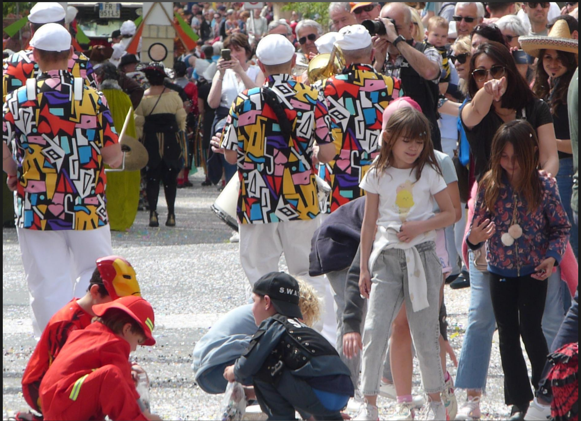
COUDOUX_ Beaucoup de confettis.