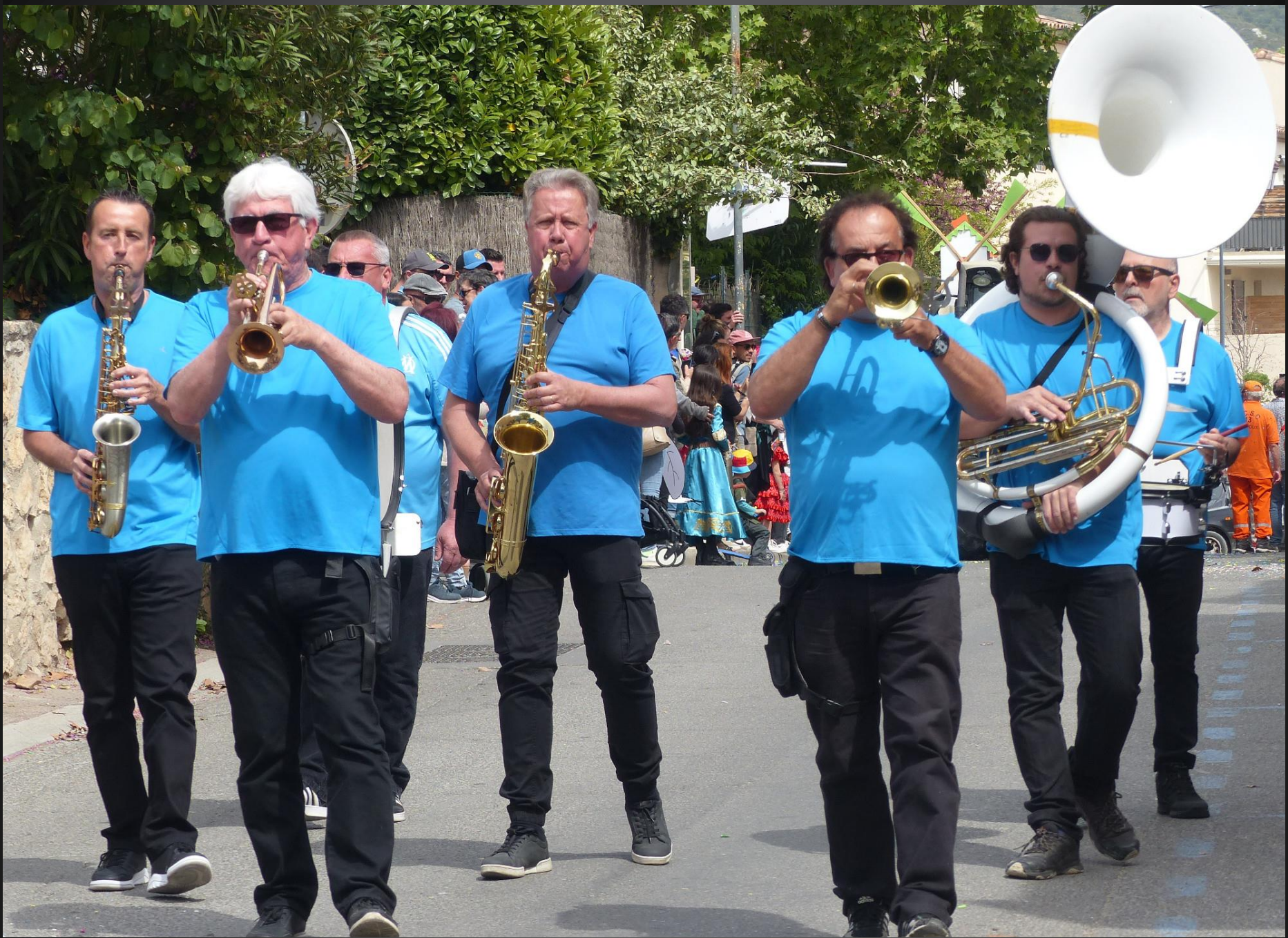
COUDOUX _ Fanfare et cuivres.