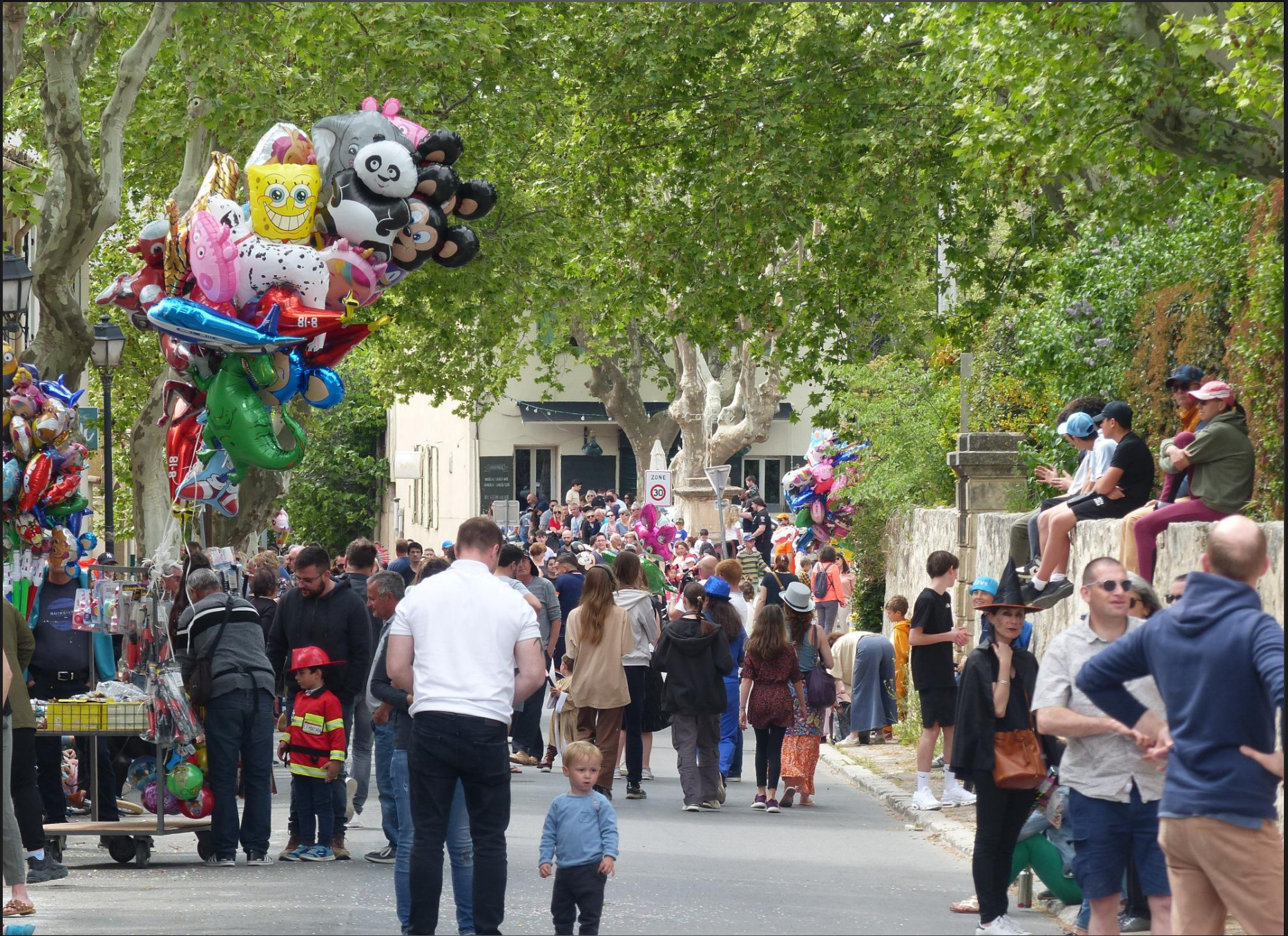
COUDOUX _ Avenue de la République.