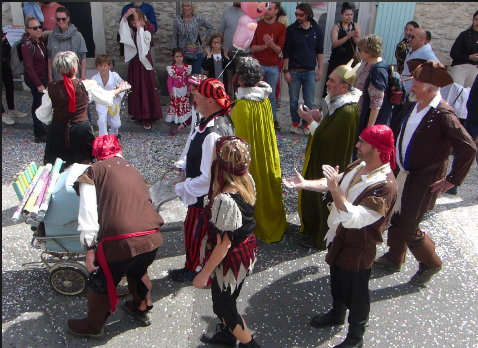
COUDOUX _ Le gang des pirates..