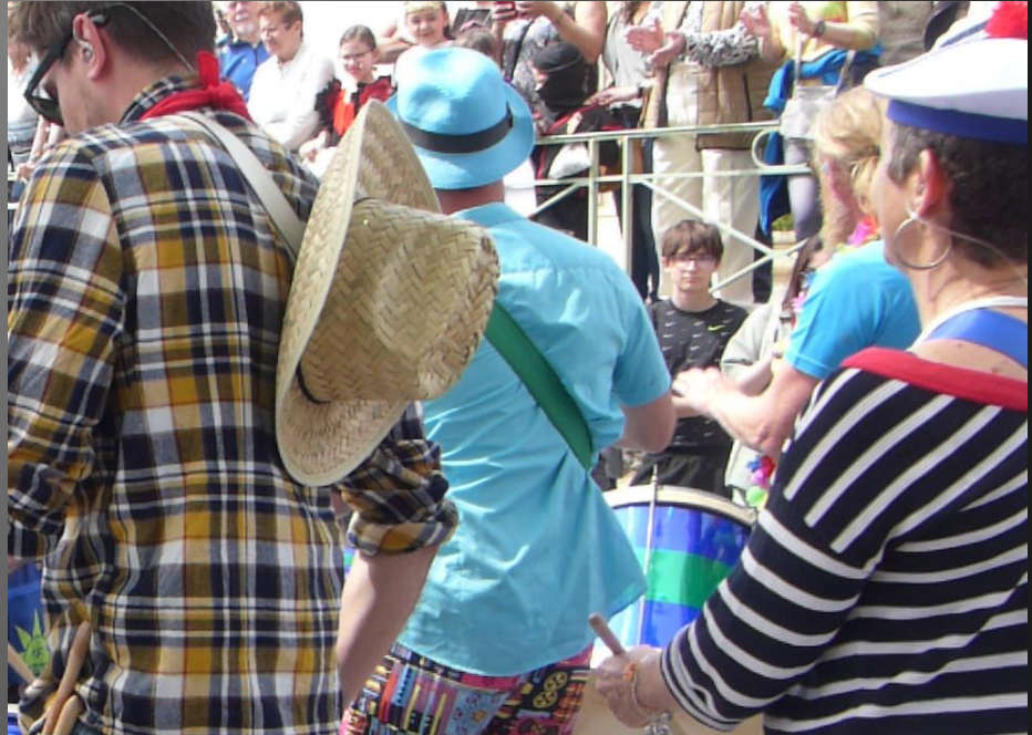
COUDOUX _ Des percussions et du rythme.