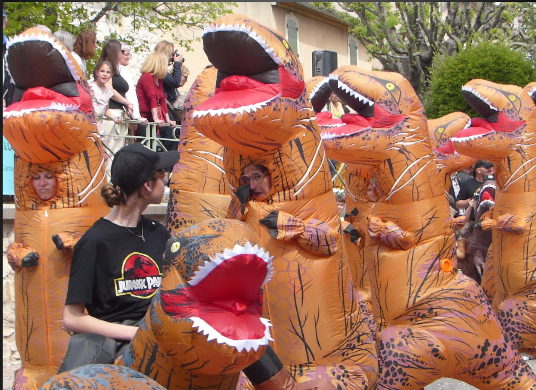
COUDOUX _ Gros plan sur les dinos.