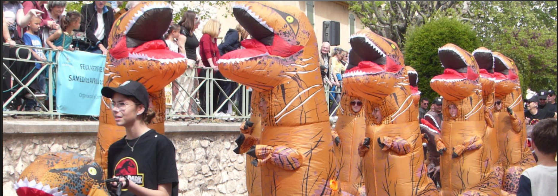
COUDOUX _ Premier thème du défilé, les dinosaures.