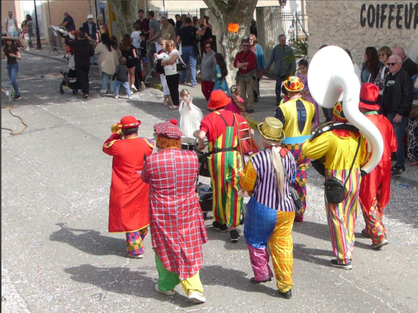
COUDOUX _ Les clowns clôturent le défilé.