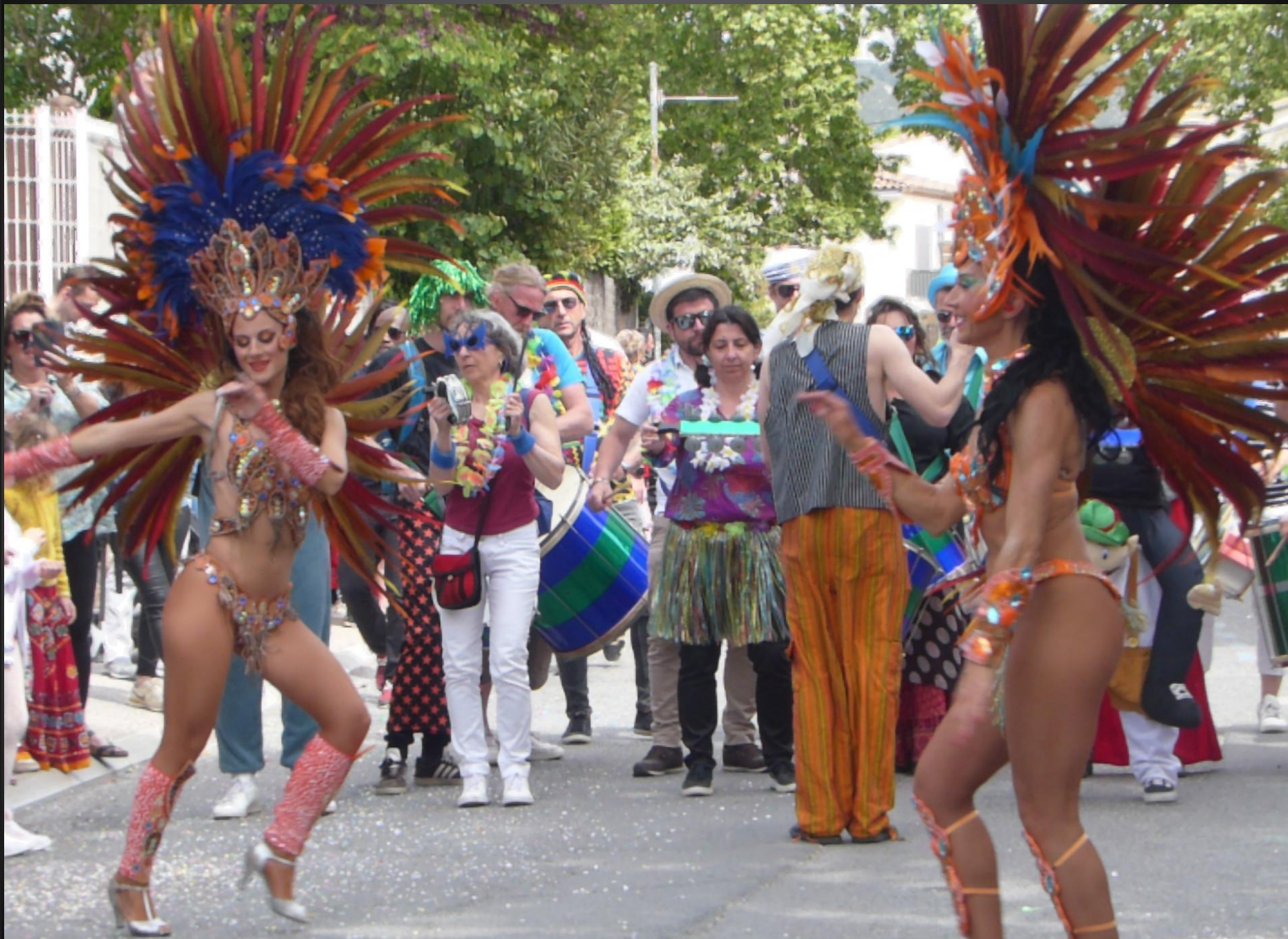
COUDOUX _ Les danseuses brésiliennes..