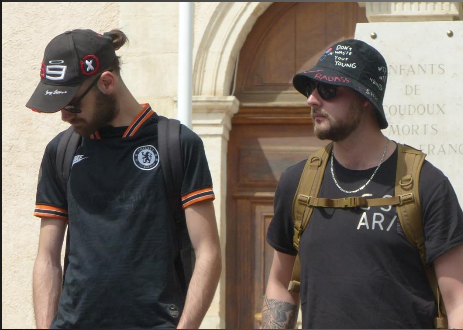
COUDOUX_ Devant l'église.