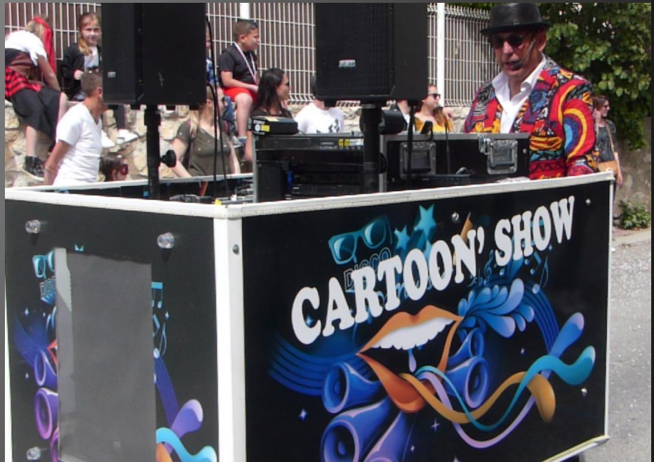
COUDOUX _ La Hollande avec ses moulins, et le Cartoon'Show.