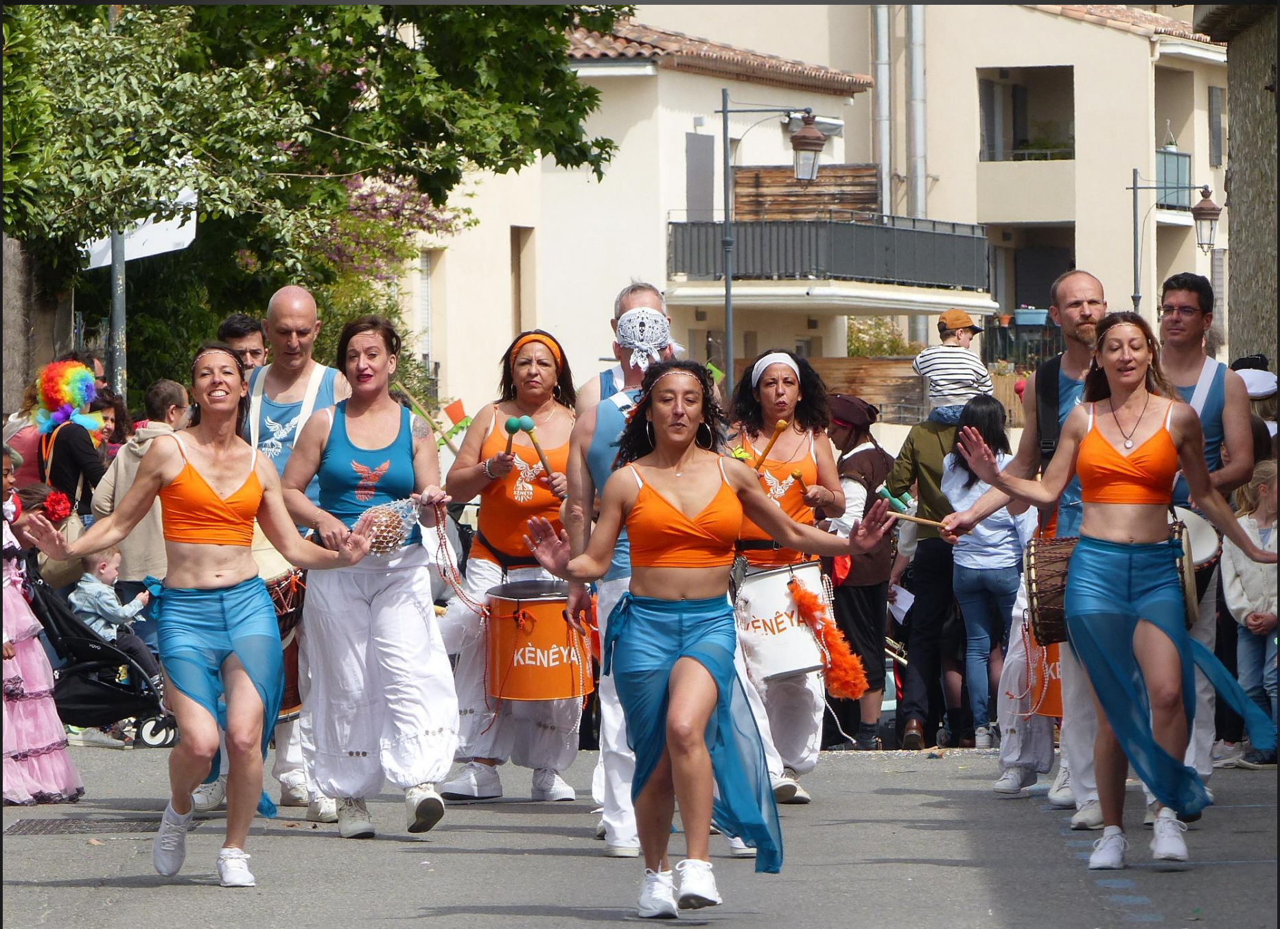
COUDOUX _ Encore de la danse.