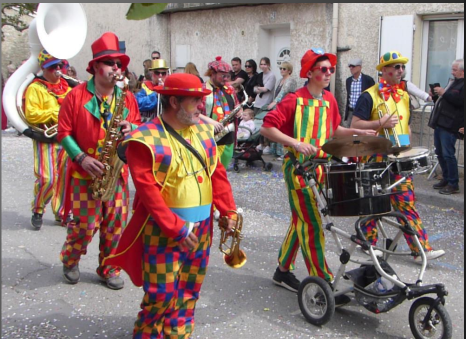
COUDOUX _ La Fanfare des Clowns.