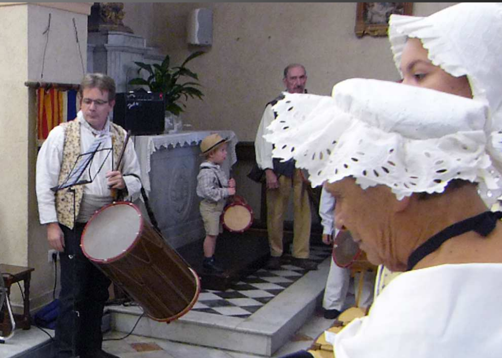
COUDOUX Eglise Saint-Michel_ Le chant « La fête, la fête, aujourd'hui c'est la fête » a accueilli la procession d'entrée.