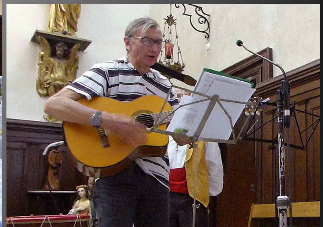
COUDOUX Eglise Saint-Michel_ Lectures des textes sacrés ; le chant du psaume est accompagné à la guitare.