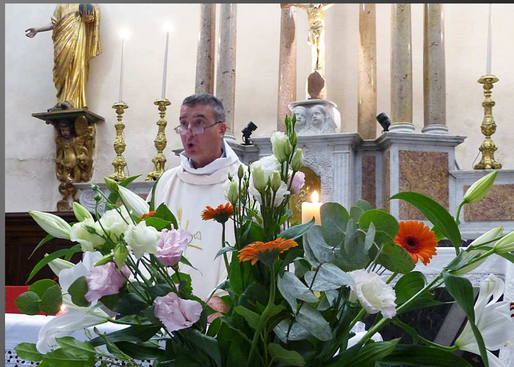
COUDOUX Eglise Saint-Michel_ La Prière Universelle, avec le refrain « Pour les hommes, pour les femmes, Pour les enfants de la terre, Ton église qui t'acclame, Vient te confier sa prière. »