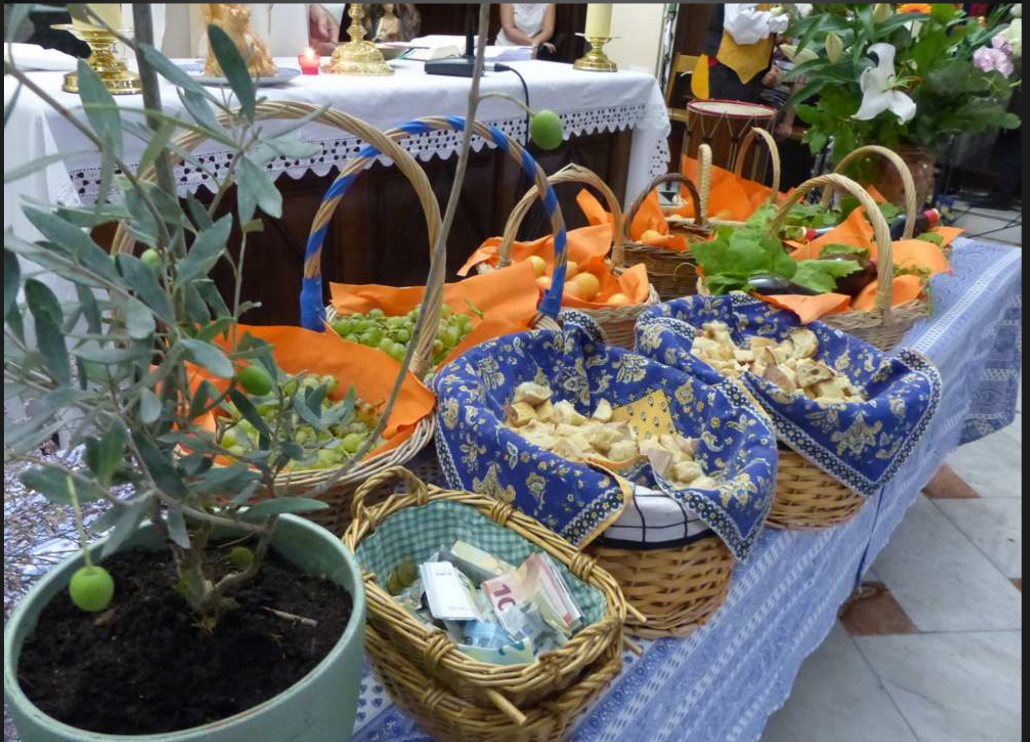
COUDOUX Eglise Saint-Michel _ Les offrandes ont été placées soigneusement sur une table, devant l'autel.