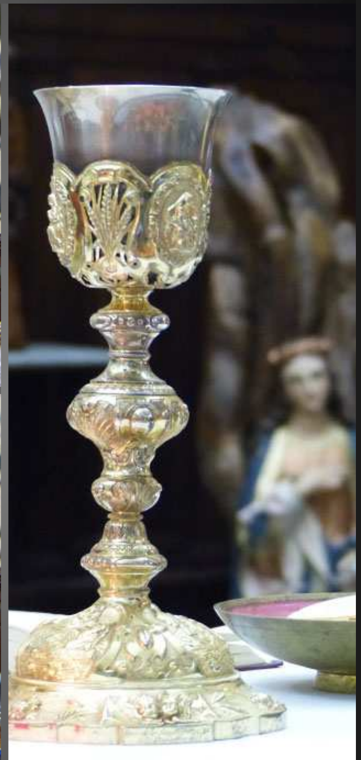
COUDOUX Eglise Saint-Michel _ La Consécration du pain et du vin.