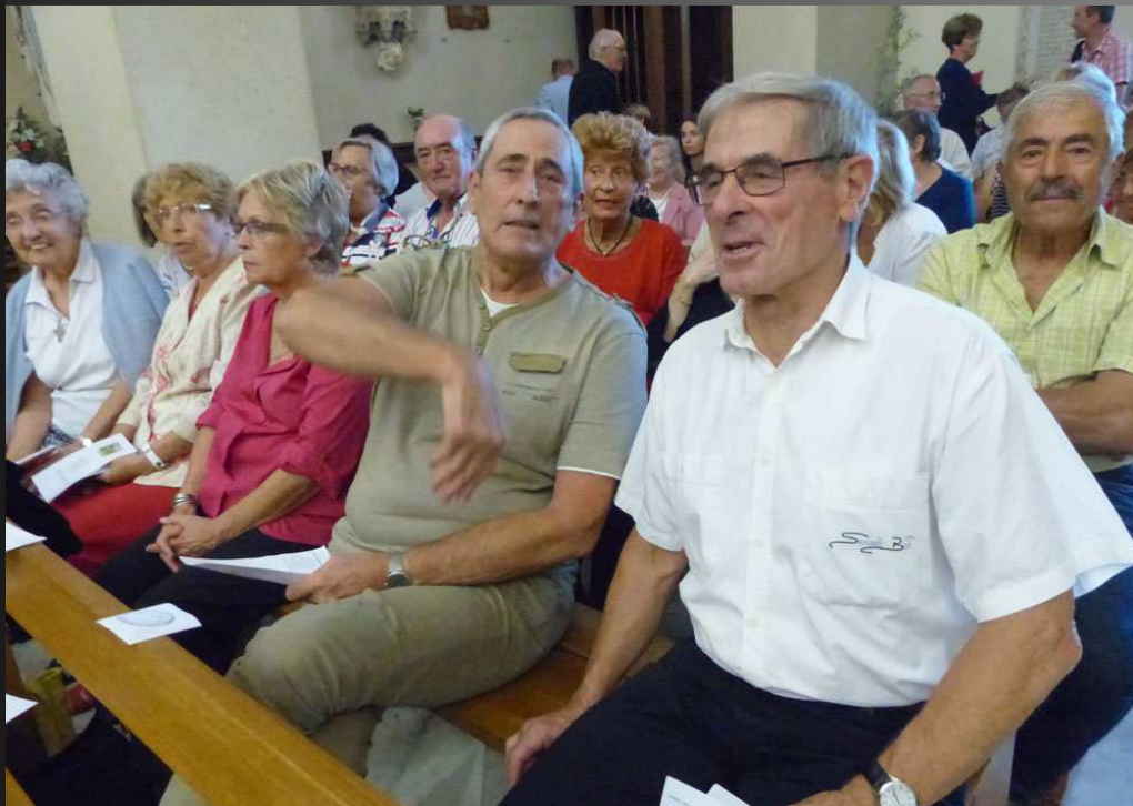
COUDOUX Eglise Saint-Michel _ Les paroissiens se pressent déjà dans l'église.