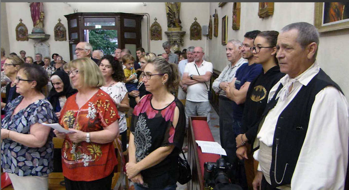
COUDOUX Eglise Saint-Michel_ La Communion des fidèles.