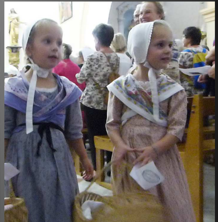
COUDOUX Eglise Saint-Michel _ La cérémonie est terminée, les Provençaux vont suivre la bannière de Li Canesteletto jusqu'au parvis de l'église.