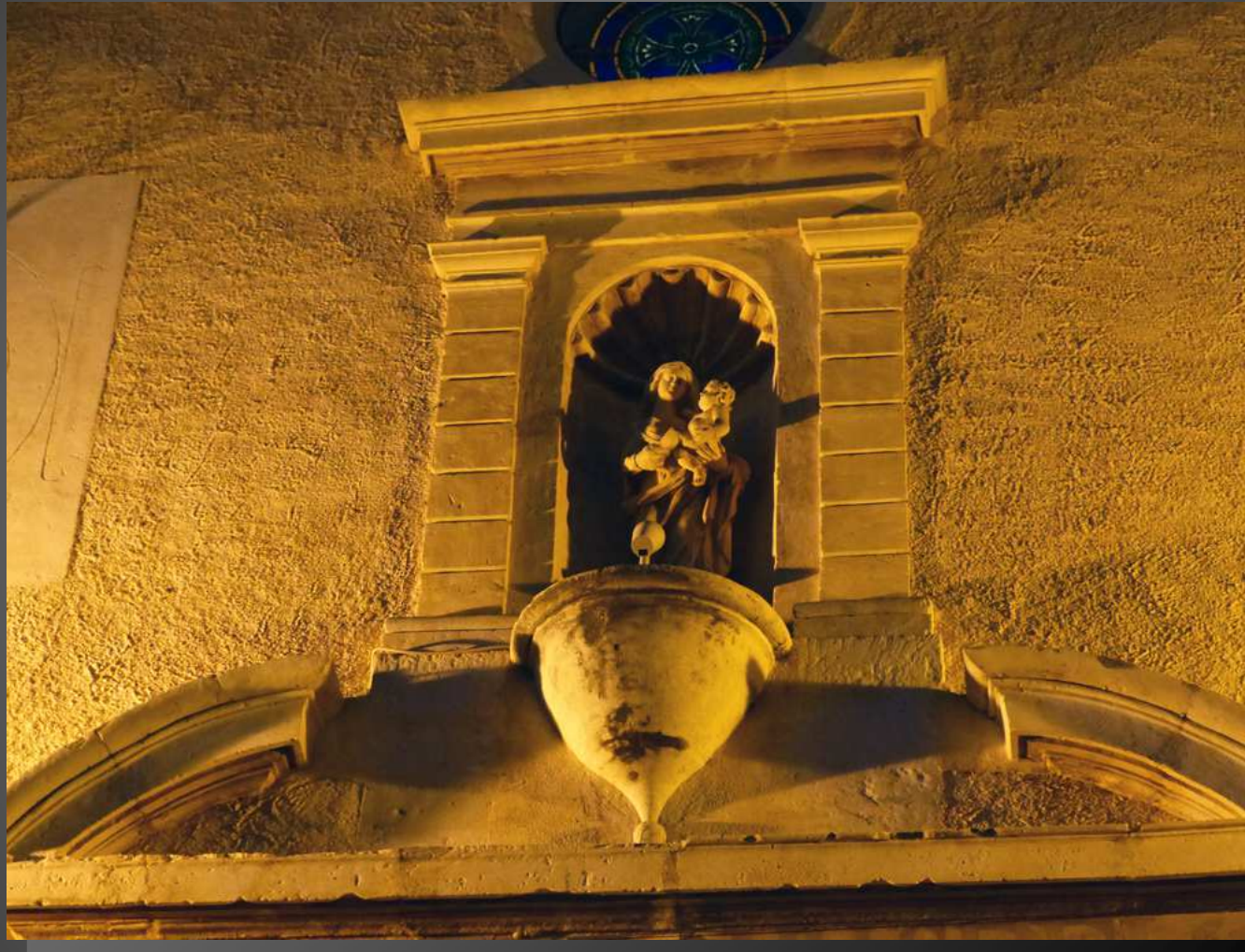
COUDOUX Eglise Saint-Michel_ La Madone veille sur le village depuis la façade de l'église.