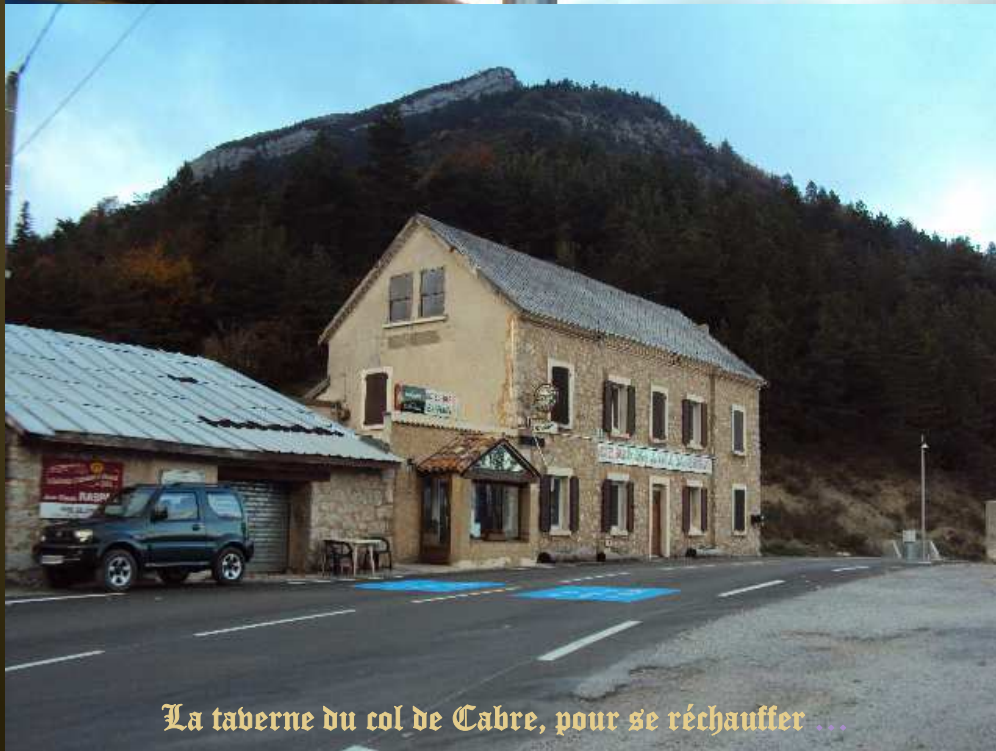
La taberne du col de Cabre, pour se réchauffer ...