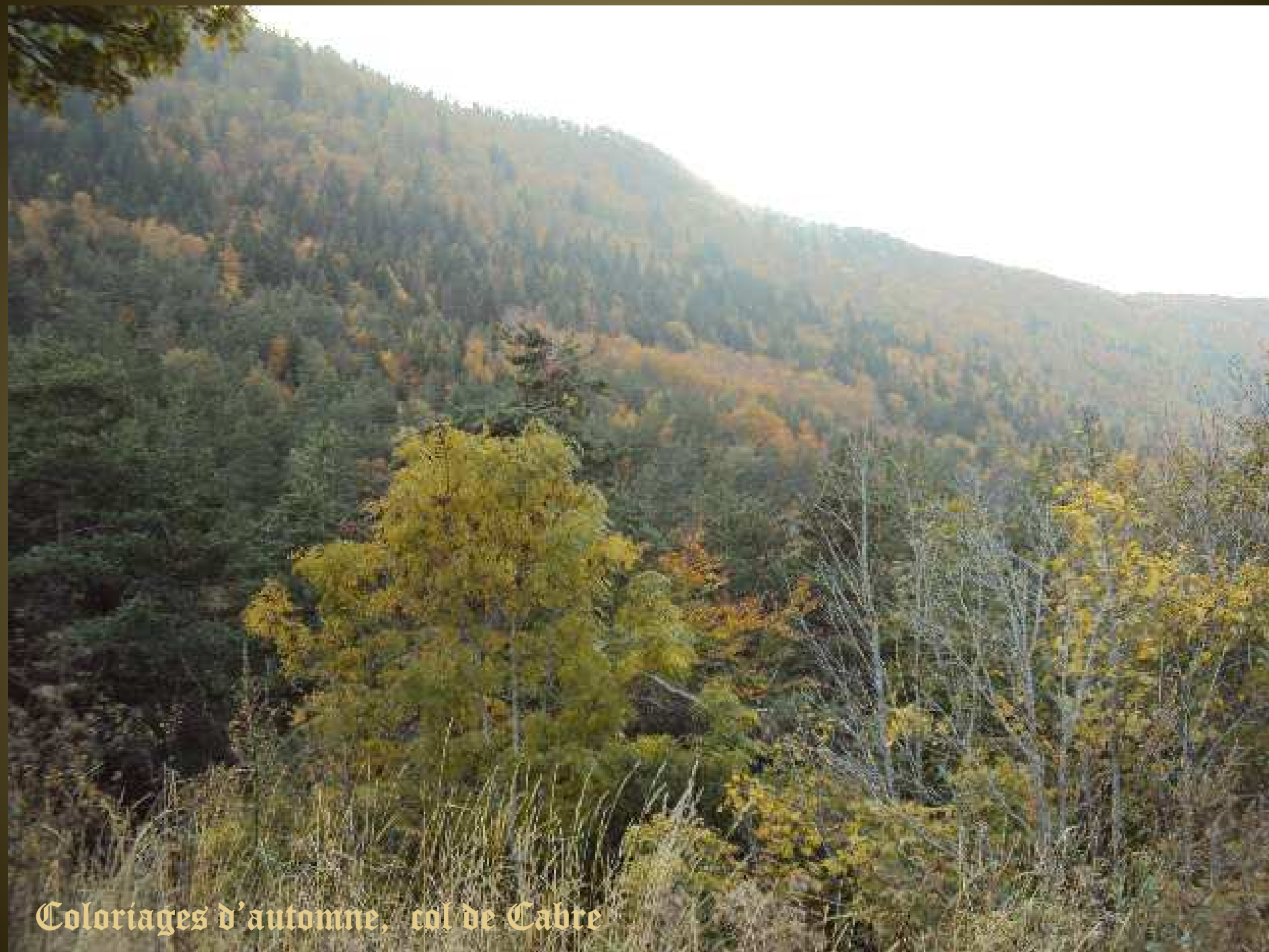
Coloriages d'automne, col de Cabre