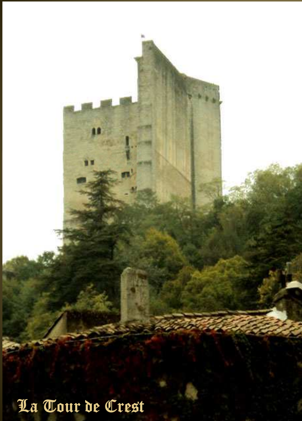
La Tour de Crest

La Tour de Crest sert alors de prison jusqu'au XIXe siècle et devient propriété nationale après la Révolution. En 1988, cent ans après son classement au titre des Monuments Historiques, la Ville de Crest achète la Tour.