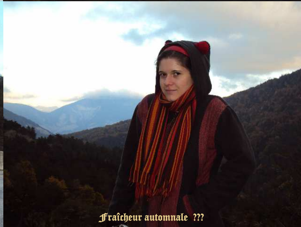
Fraîcheur automnale ???