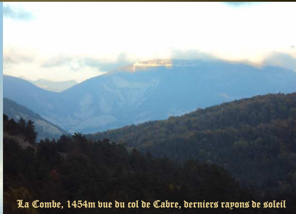
La Combe, 1454m vue du col de Cabre, derniers rayons de soleil