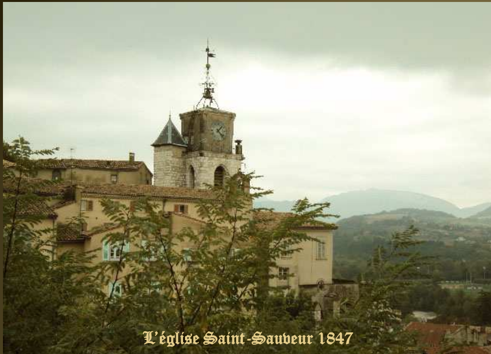
L'église Saint-Sauveur 1847