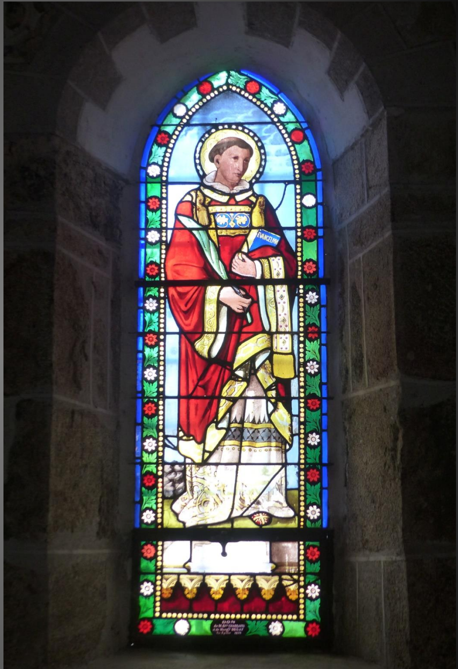
Vitrail d'un saint, Evangelicum dans une main, palme du martyre dans l'autre.