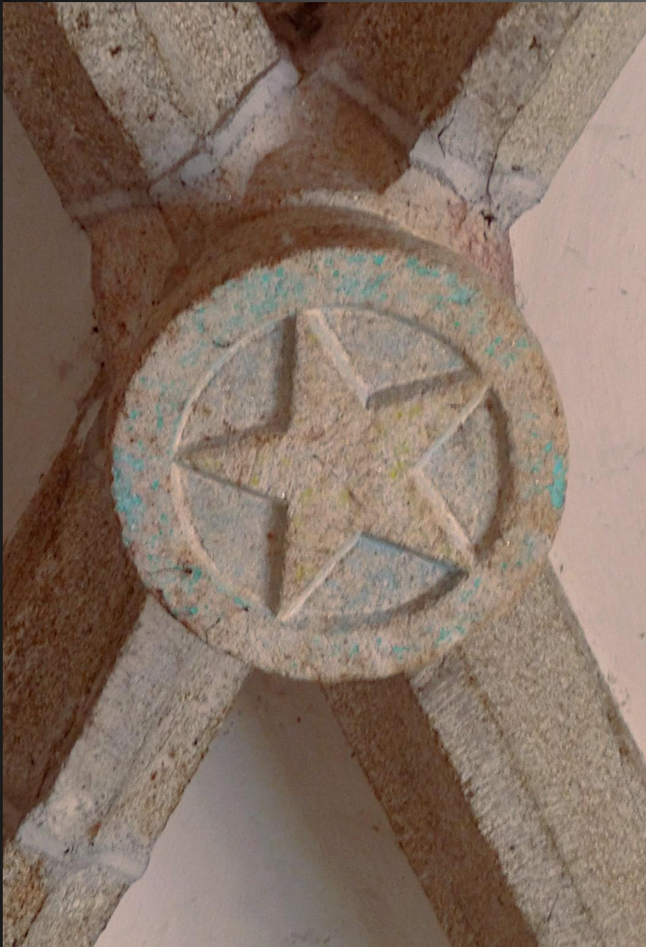
EGLISOLLES_ Clé de voûte , pentagramme étoile à cinq branches..