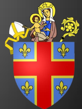
Blason des Evêques de Clermont