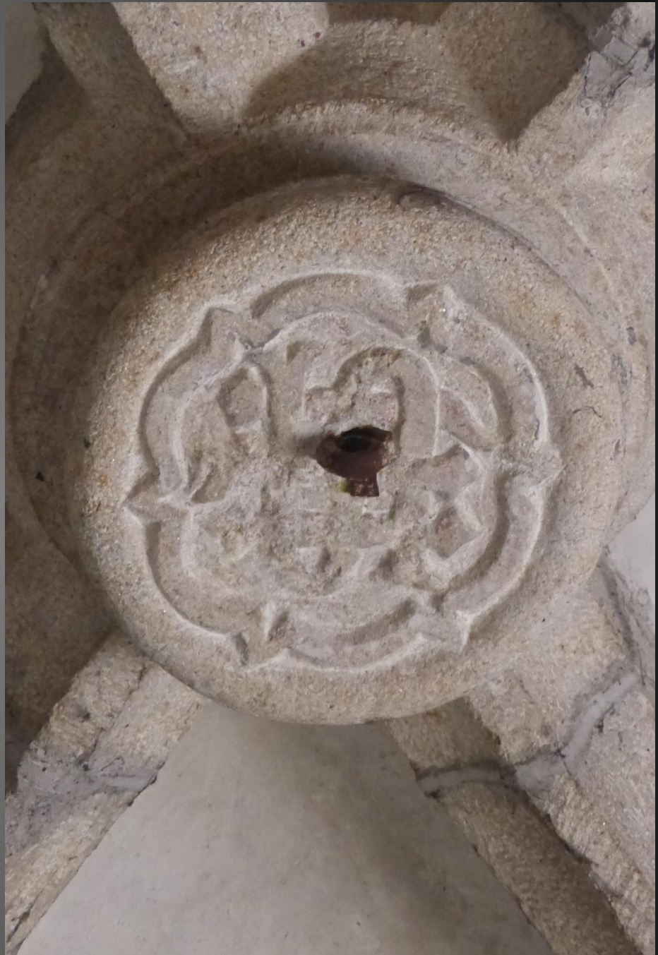
Clé de voûte , entrelacs se terminant en fleuron.