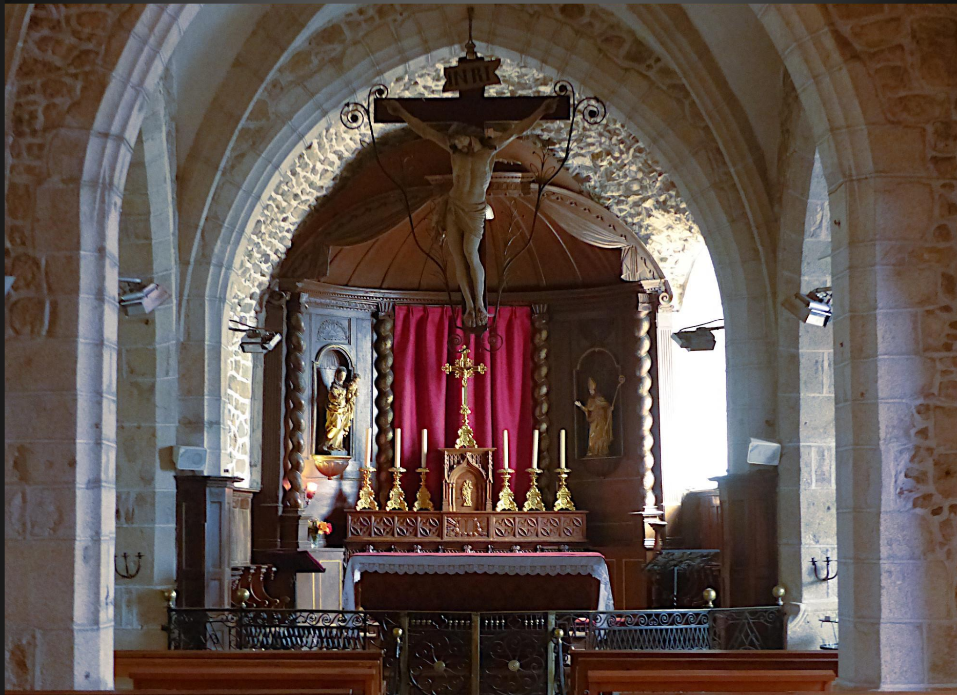
EGLISOLLES _ Vue du chœur qui a gardé son bel autel d'origine.