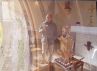
Pèlerinage de Saint-Léger 2013 & 2015