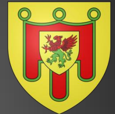
Blason du Puy-de-Dôme « D'or au gonfanon de gueules frangé de sinople, chargé en abîme d'un écusson d'or au griffon coupé de gueules et de sinople. »