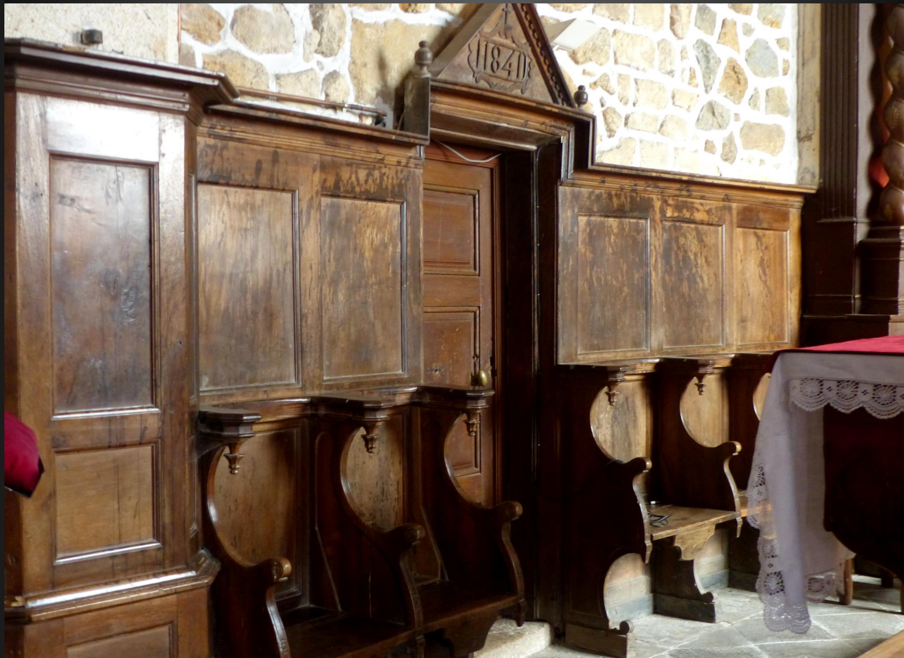
EGLISOLLES _ Stalles en bois dans le chœur, avec la date de 1841.