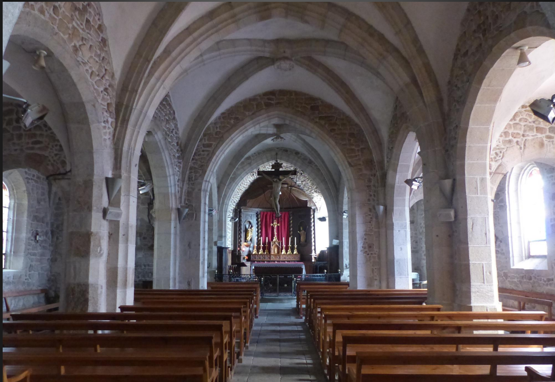
EGLISOLLES _ Vue de la nef principale, de style néo-gothique. L'édifice est bâti selon un plan orienté. Ce plan allongé, comportant une nef entourée de deux bas-côtés, aboutit à un chevet semi-circulaire. On trouve un bâtiment annexe accolé au mur nord de l'église.