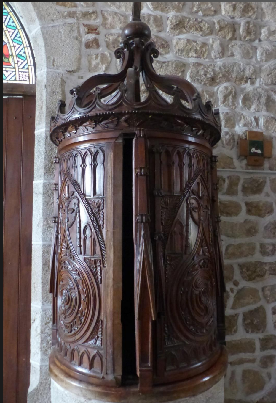
EGLISOLLES_ Fonds baptismaux avec entourage en bois sculpté.