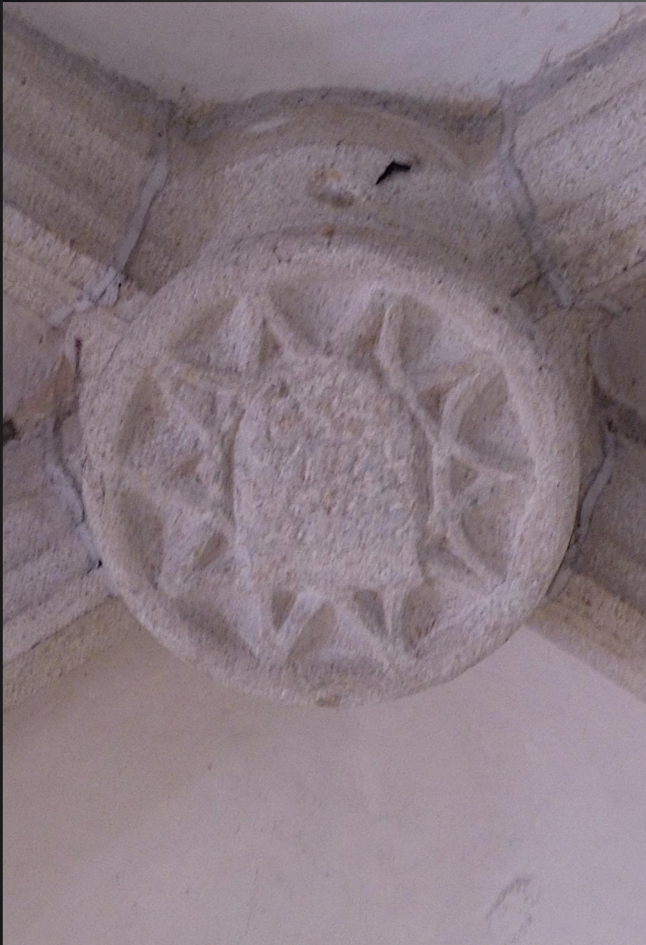
EGLISOLLES_ Clé de voûte, blason sculpté.