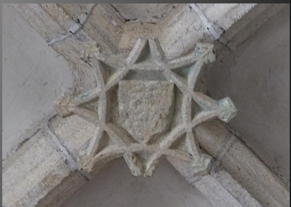
EGLISOLLES_ Clés de voûte remarquables dans la nef centrale : blasons.