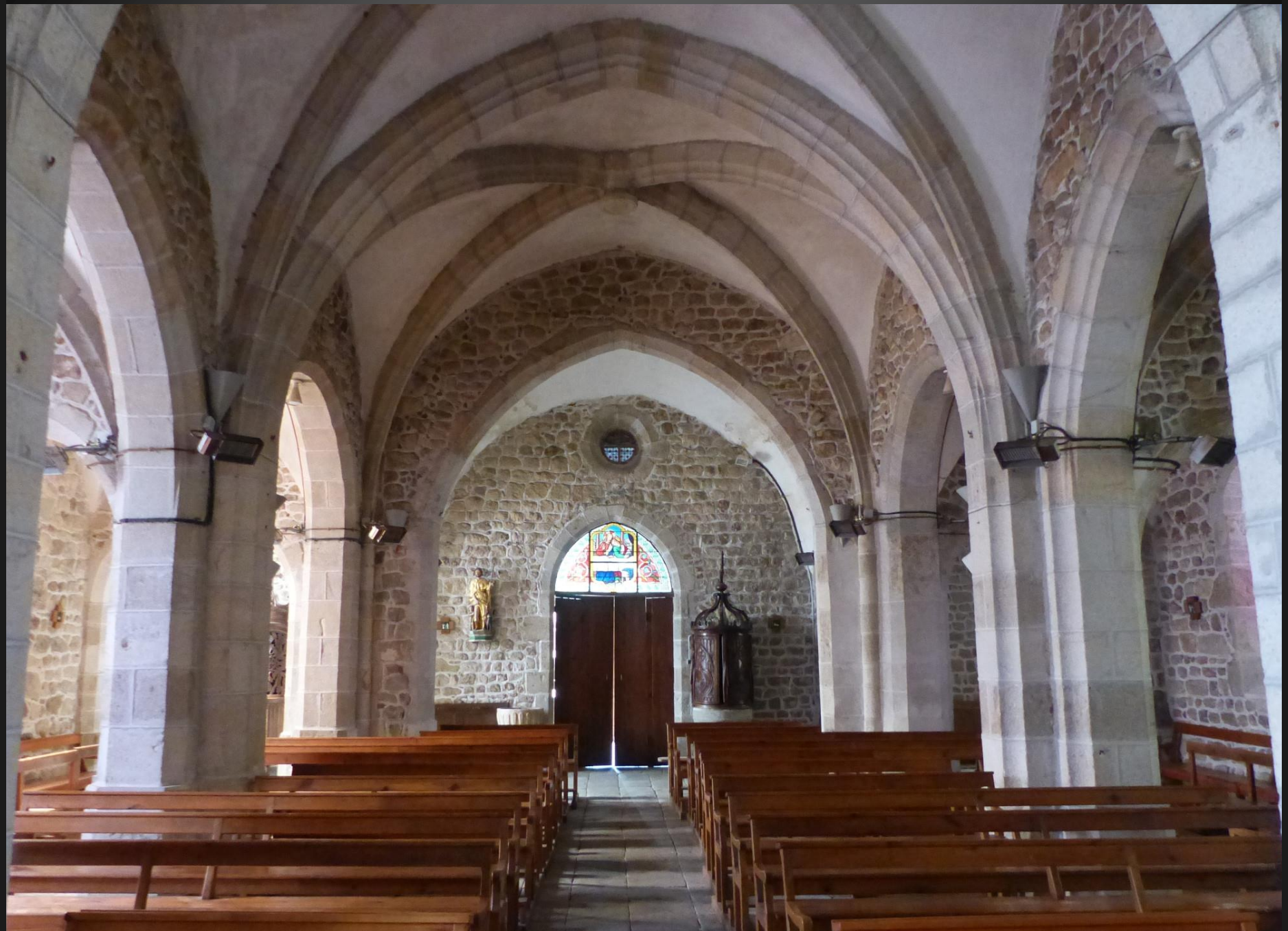
EGLISOLLES_ Le portail d'entrée est surmonté d'un vitrail.