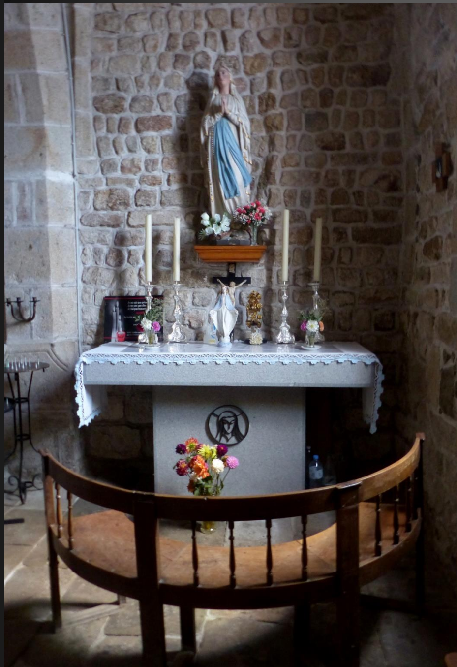
EGLISOLLES_ Chapelle Notre-Dame de Lourdes.