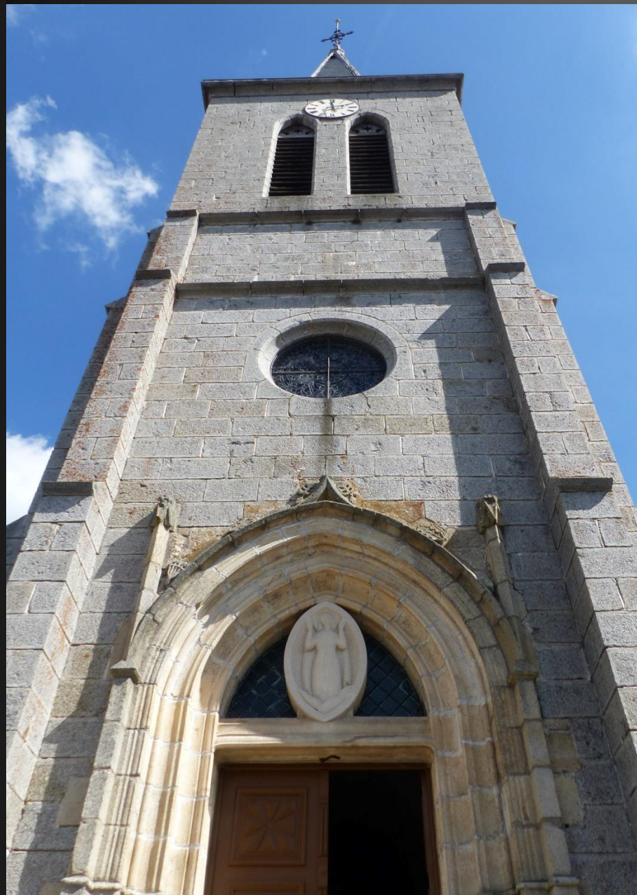
EGLISOLLES _ Le clocher-porche a été érigé entre 1895 et 1902 à la place de l'ancienne maison dite du grenadier, sa partie haute est percée de baies à arcs brisés et munies d'abat-sons. Il est couronné d'une flèche surmontée d'une croix faitière. Les angles du clocher sont épaulés de contreforts. Les 4 cloches datent de 1537, 1542, 1697, et 1702. L'une d'elle a été cachée sous un tas de fumier pendant la révolution pour éviter qu'elle ne soit fondue. La paroisse Saint Jean-François Régis compte 45 clochers dans le Livradois-Forez...