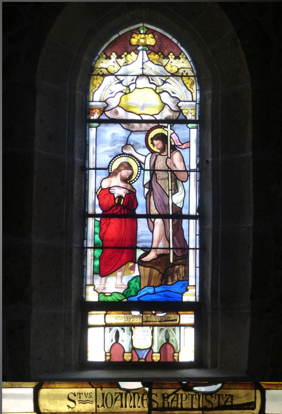
Vitrail « Sanctus Joannes Baptista »