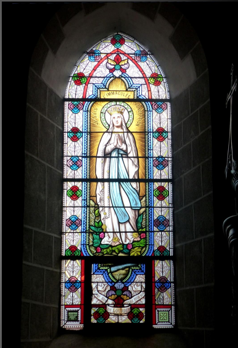
Vitrail « Notre-Dame de Lourdes »