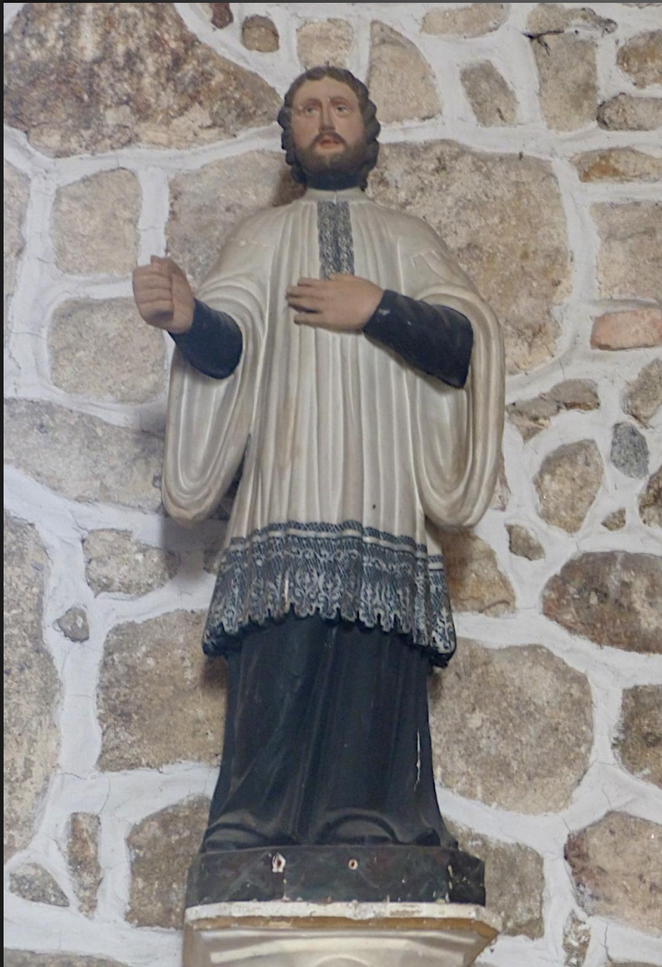
EGLISOLLES _ Statue de saint Jean-François Régis (1597-1640).