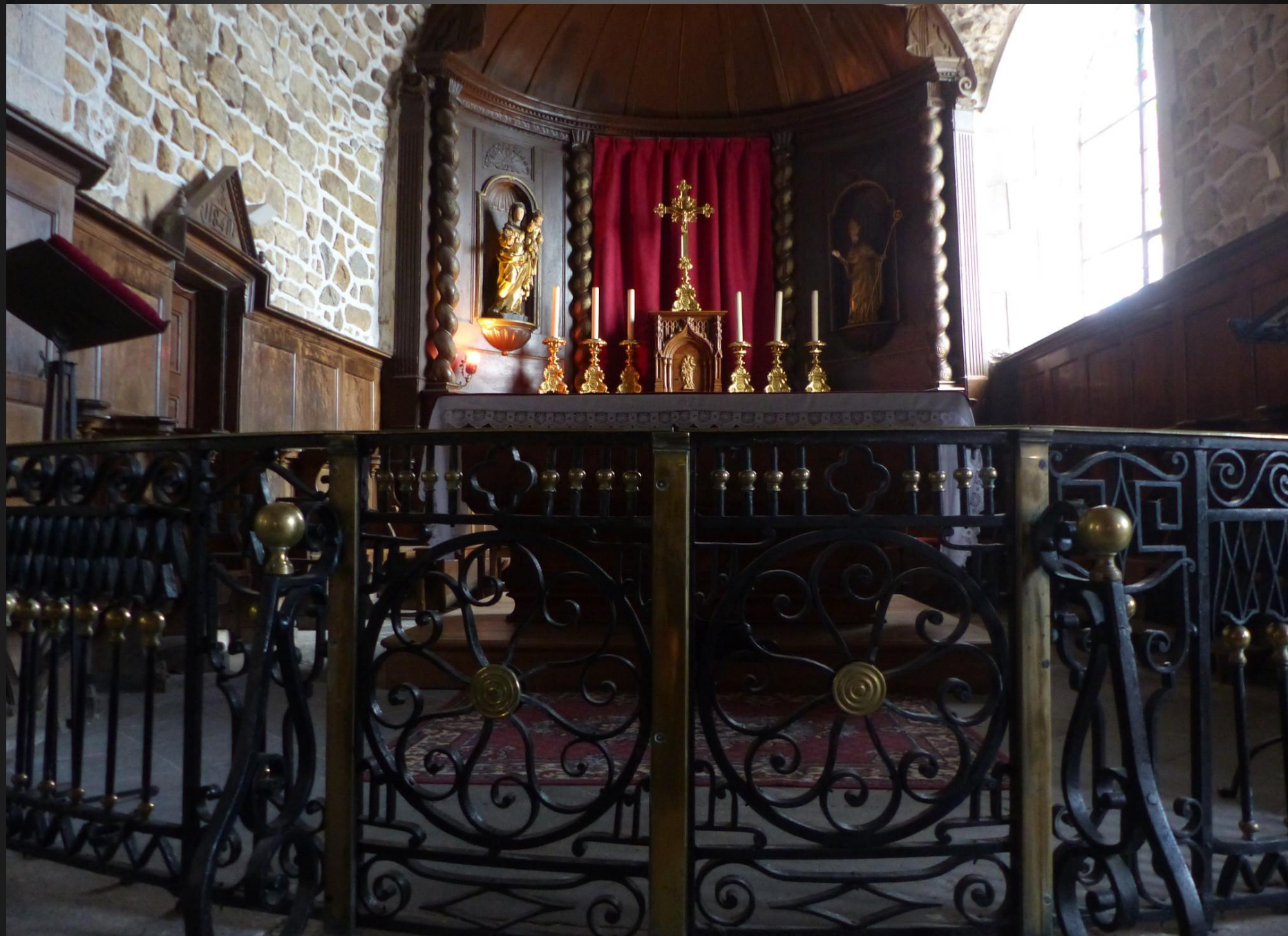
EGLISOLLES_ La grille de communion, en fer forgé ouvragé, qui ferme le chœur a été conservée. Le chœur était jadis, par définition, le Sanctuaire de Dieu où seuls les consacrés pouvaient pénétrer.