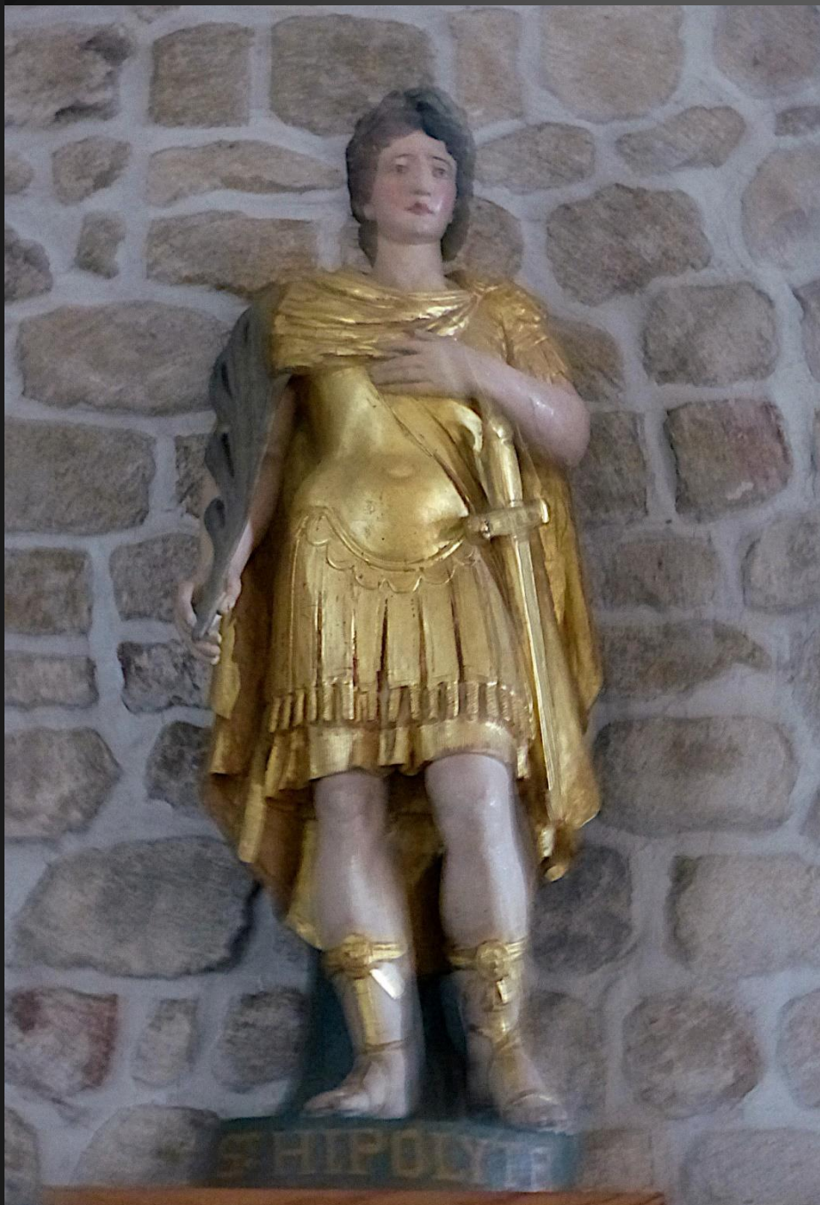
EGLISOLLES_ Statue de Saint Hippolyte, officier romain, palme du martyre, + 258, fête le 13 août.