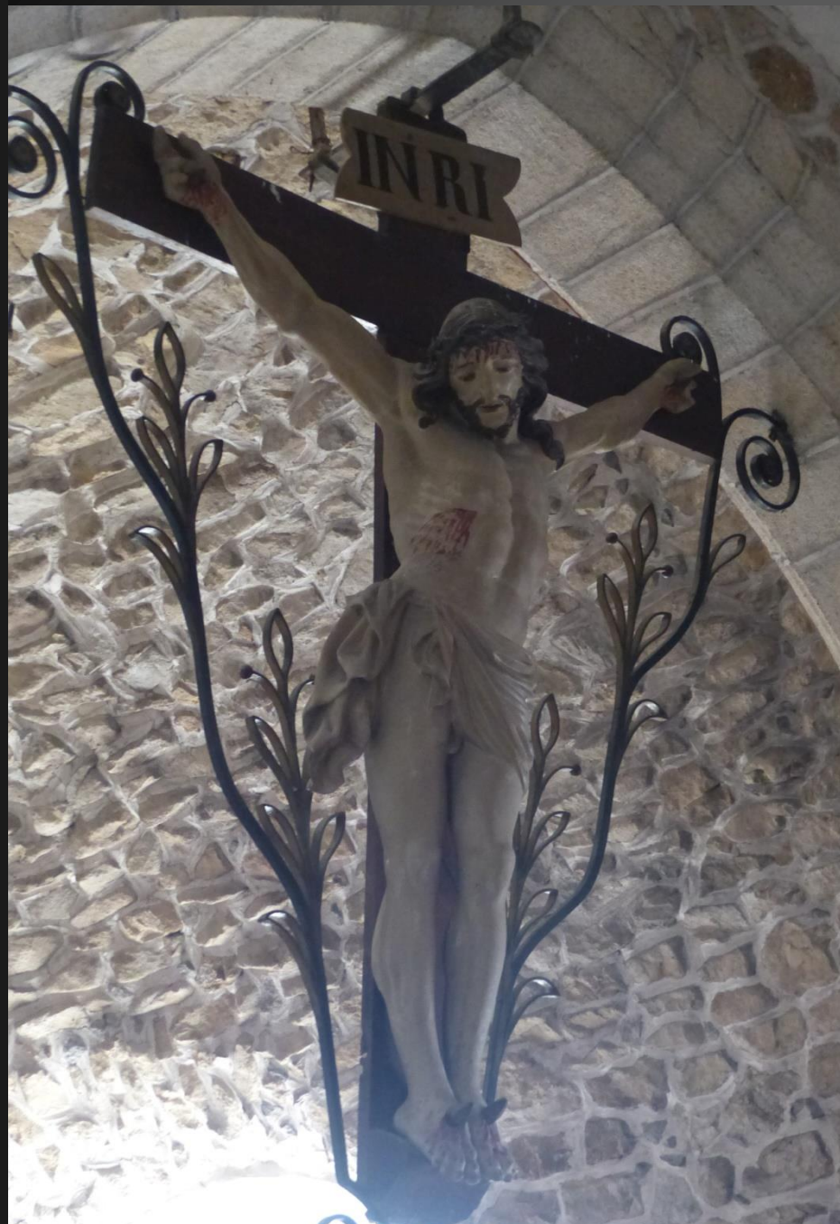
EGLISOLLES_ Christ en croix dominant le chœur.