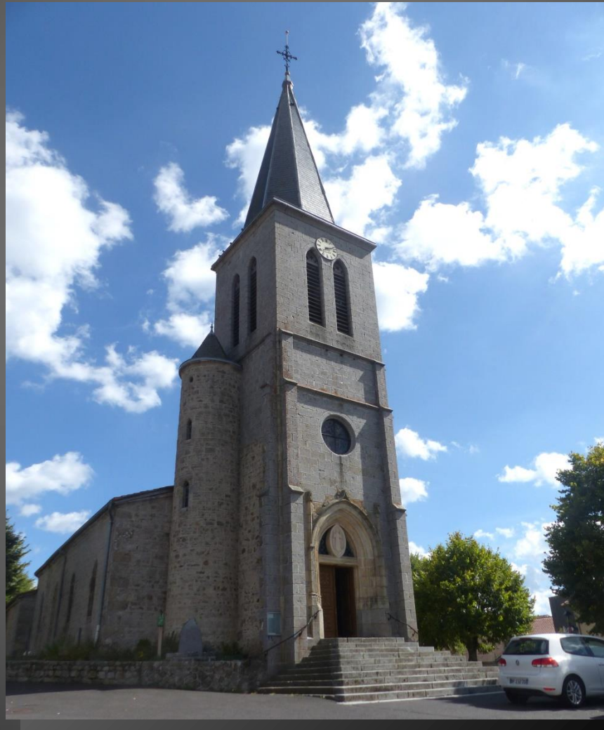
EGLISOLLES L'église Saint-Hippolyte