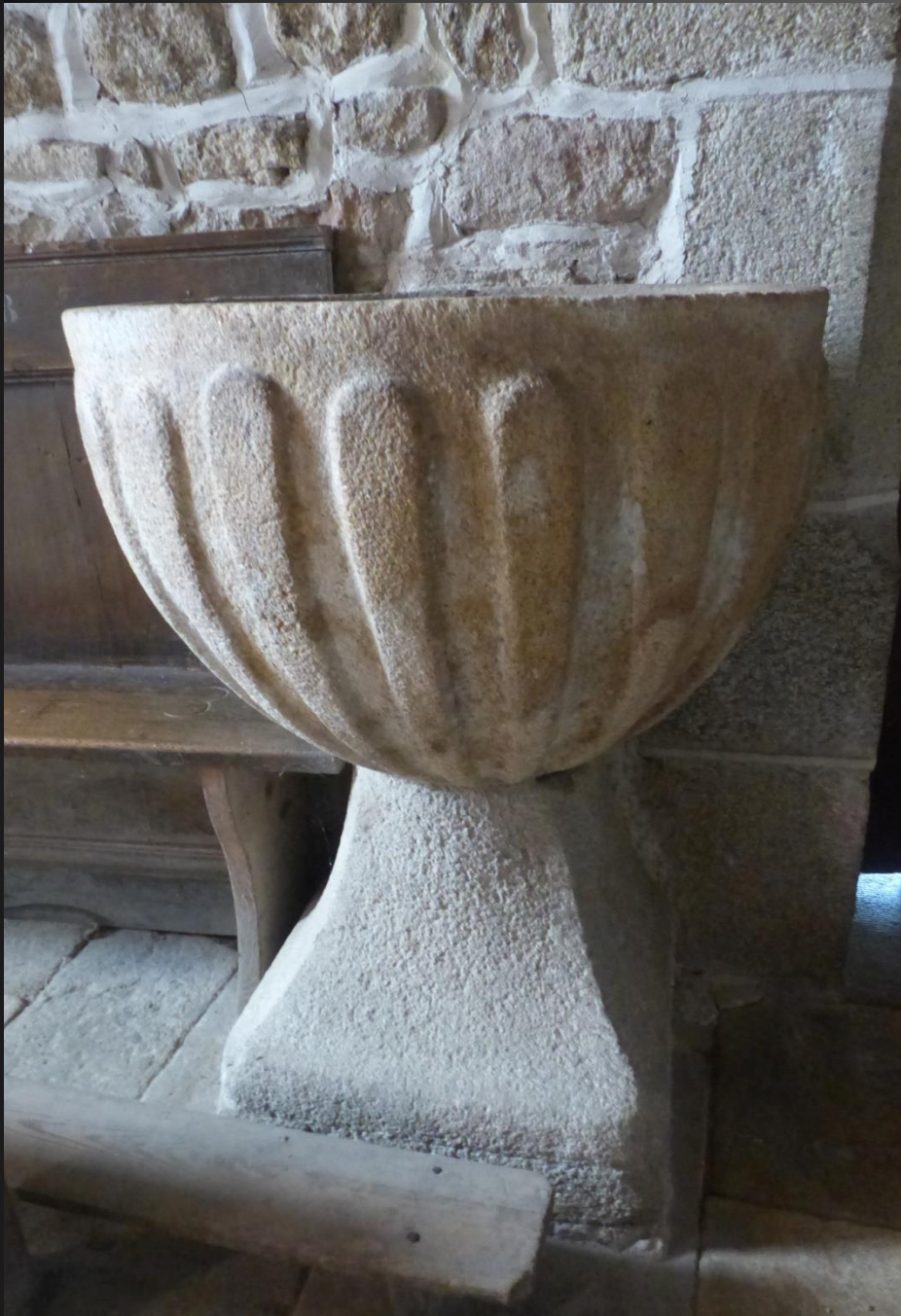
EGLISOLLES _ Bénitier en pierre sculptée.