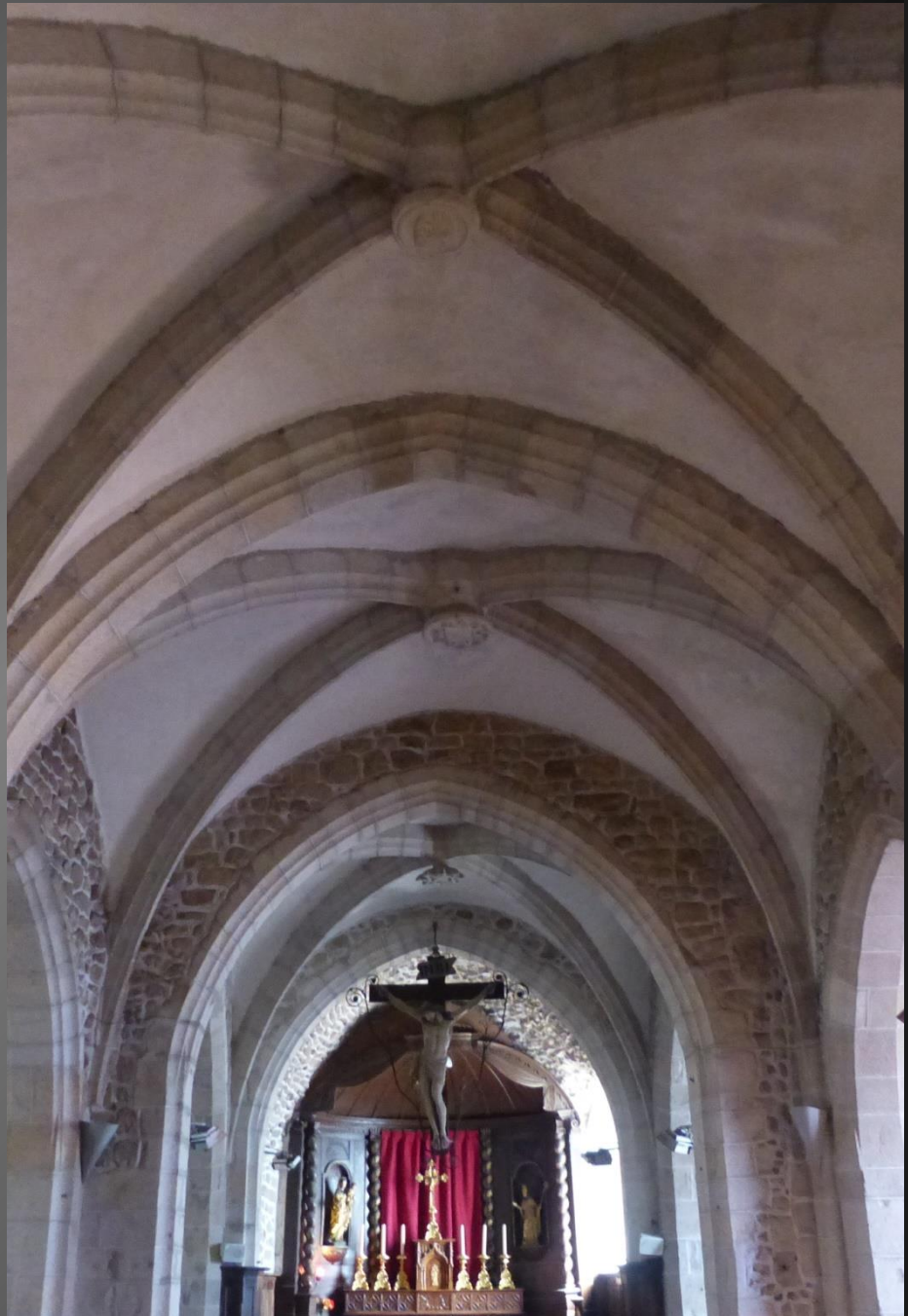
La nef centrale néo-gothique, clés de voûte aux croisées d'ogives.