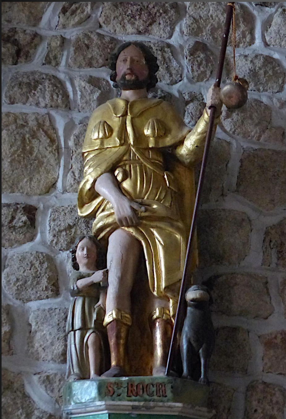
EGLISOLLES _ Statue de Saint Roch (1350-1378).