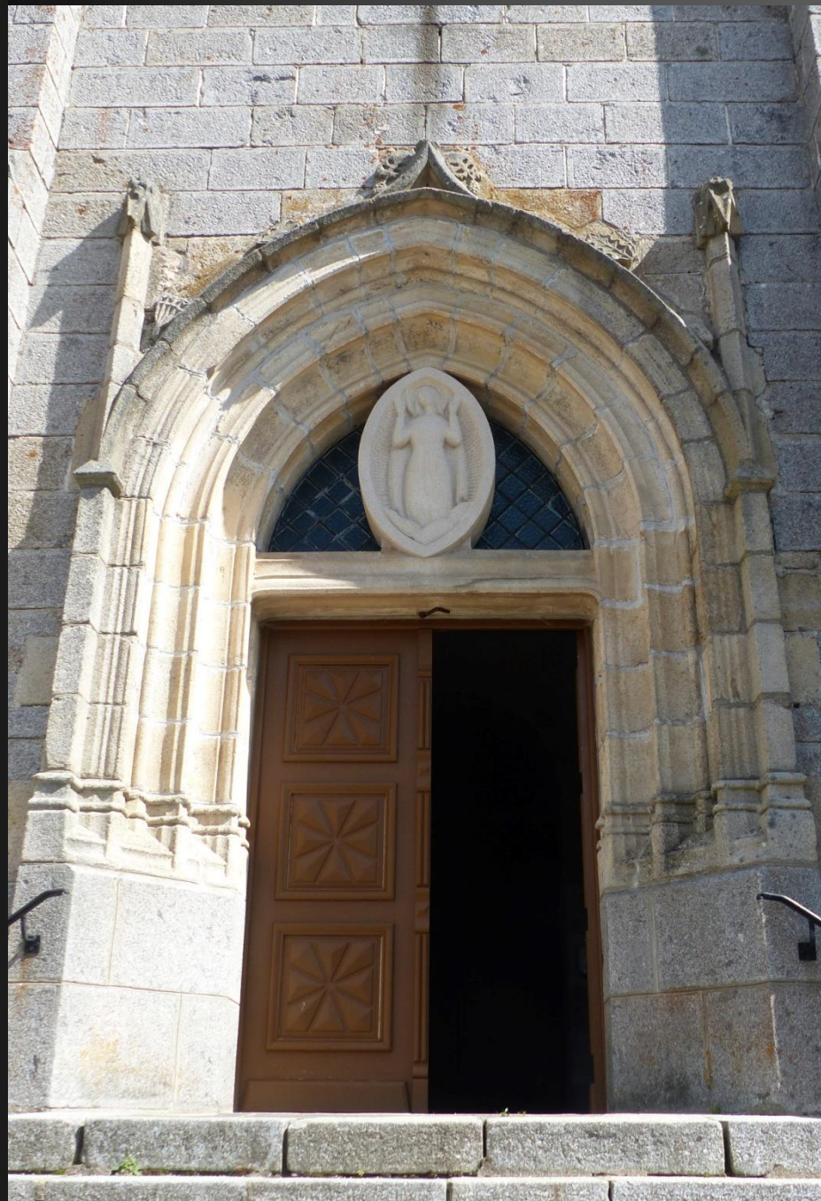
EGLISOLLES_ Le portail en arc brisé à voussures est surmonté d'un oculus vitré.