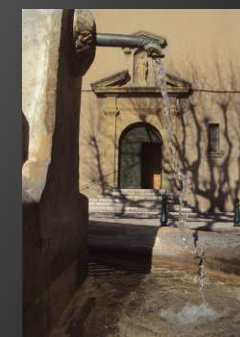
Eglise Saint-Julien, ancienne chapelle castrale, reconstruite après destruction par le tremblement de terre de 1909.