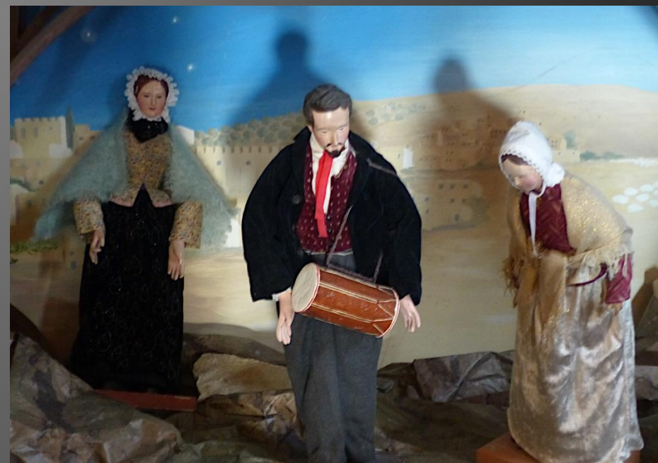
Eglise Saint-Julien _ La crèche provençale est au centre du chœur, devant l'autel.