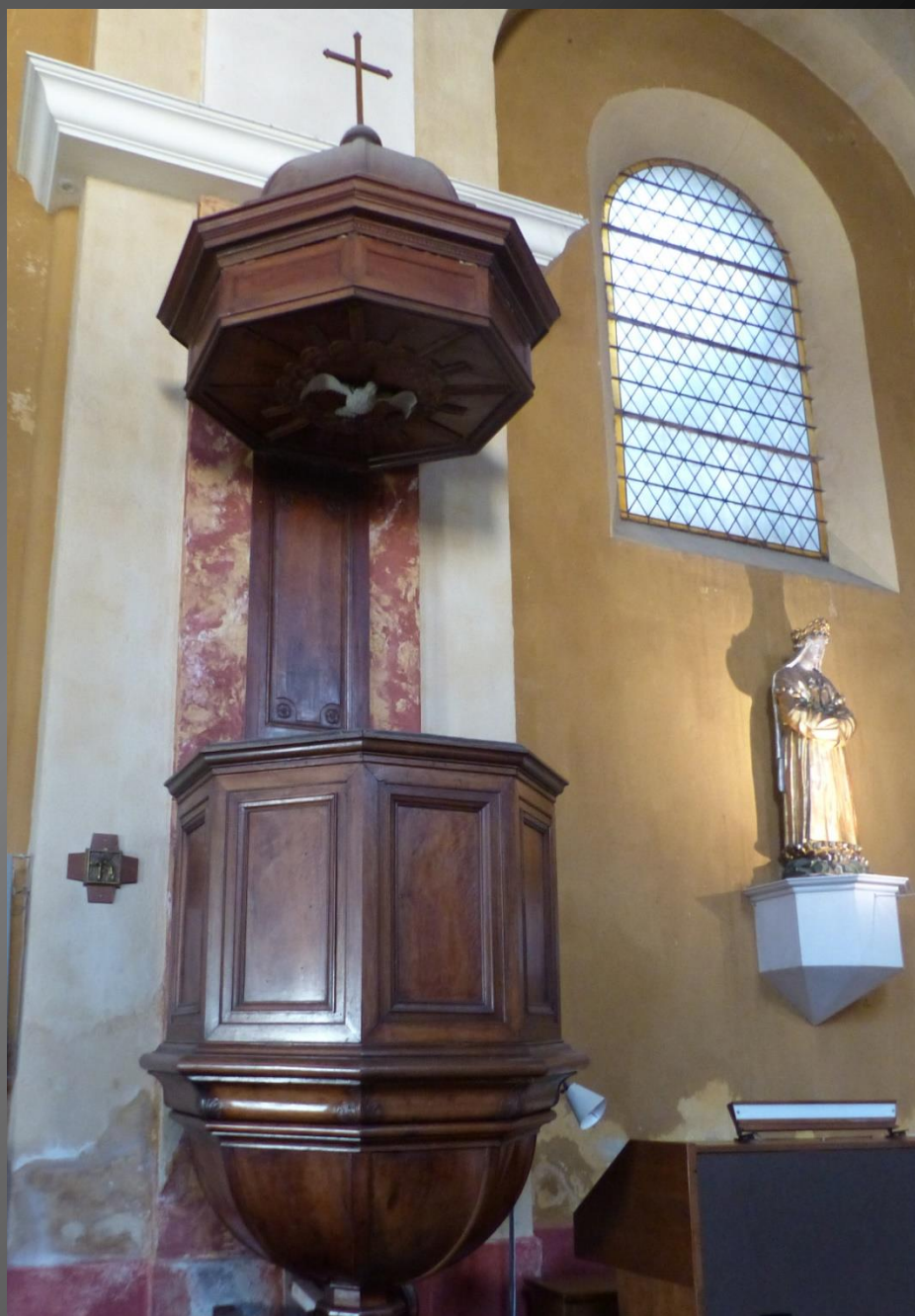
Eglise Saint-Julien _ Elle a été consacrée en 1913. L'autel d'origine a été conservé, de même que la chaire, cette dernière ayant été déplacée de l'autre côté de la nef.