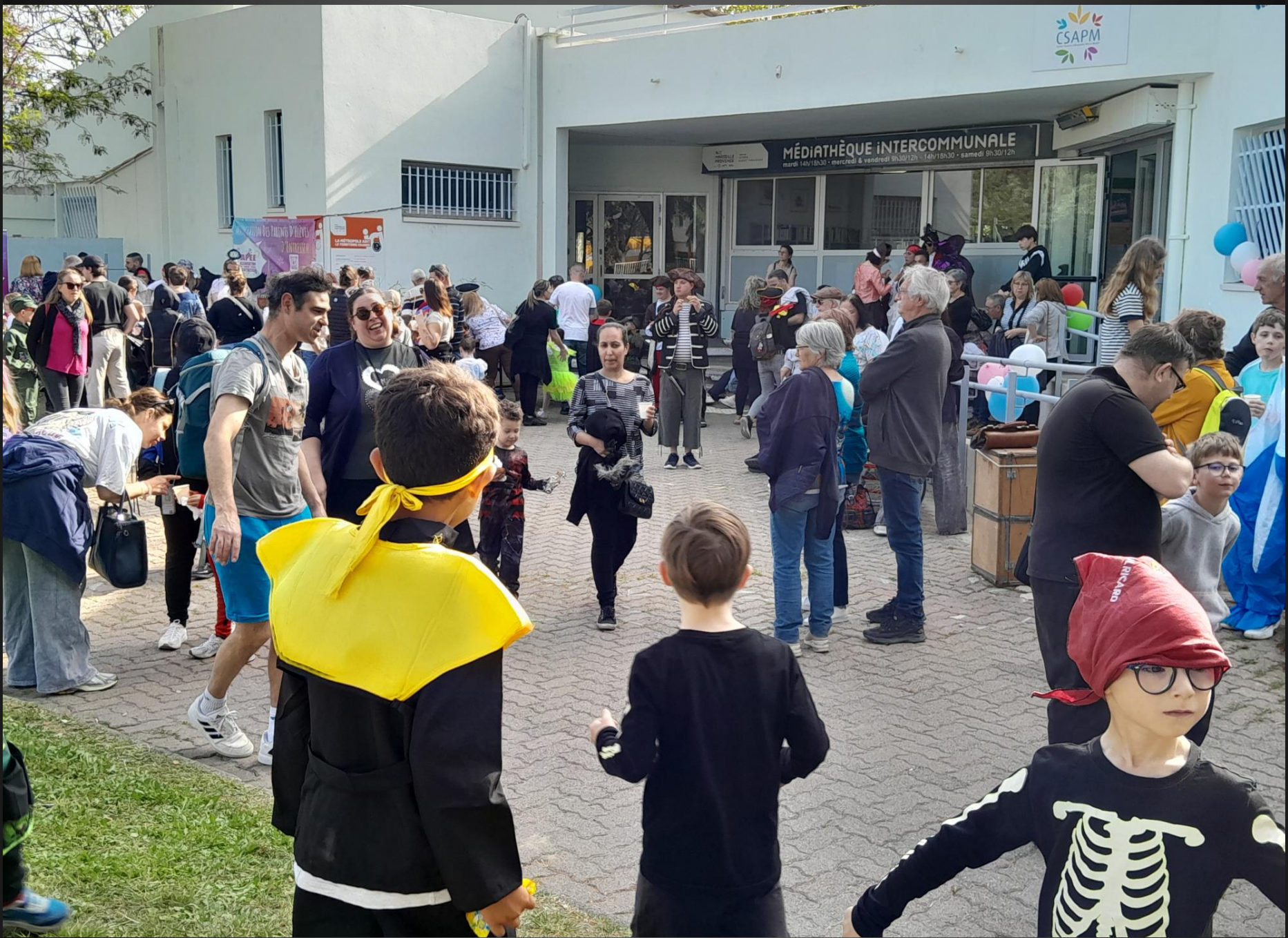
ENTRESSEN_ Effervescence devant le Centre Social et d'Animation Pierre-Miallet.