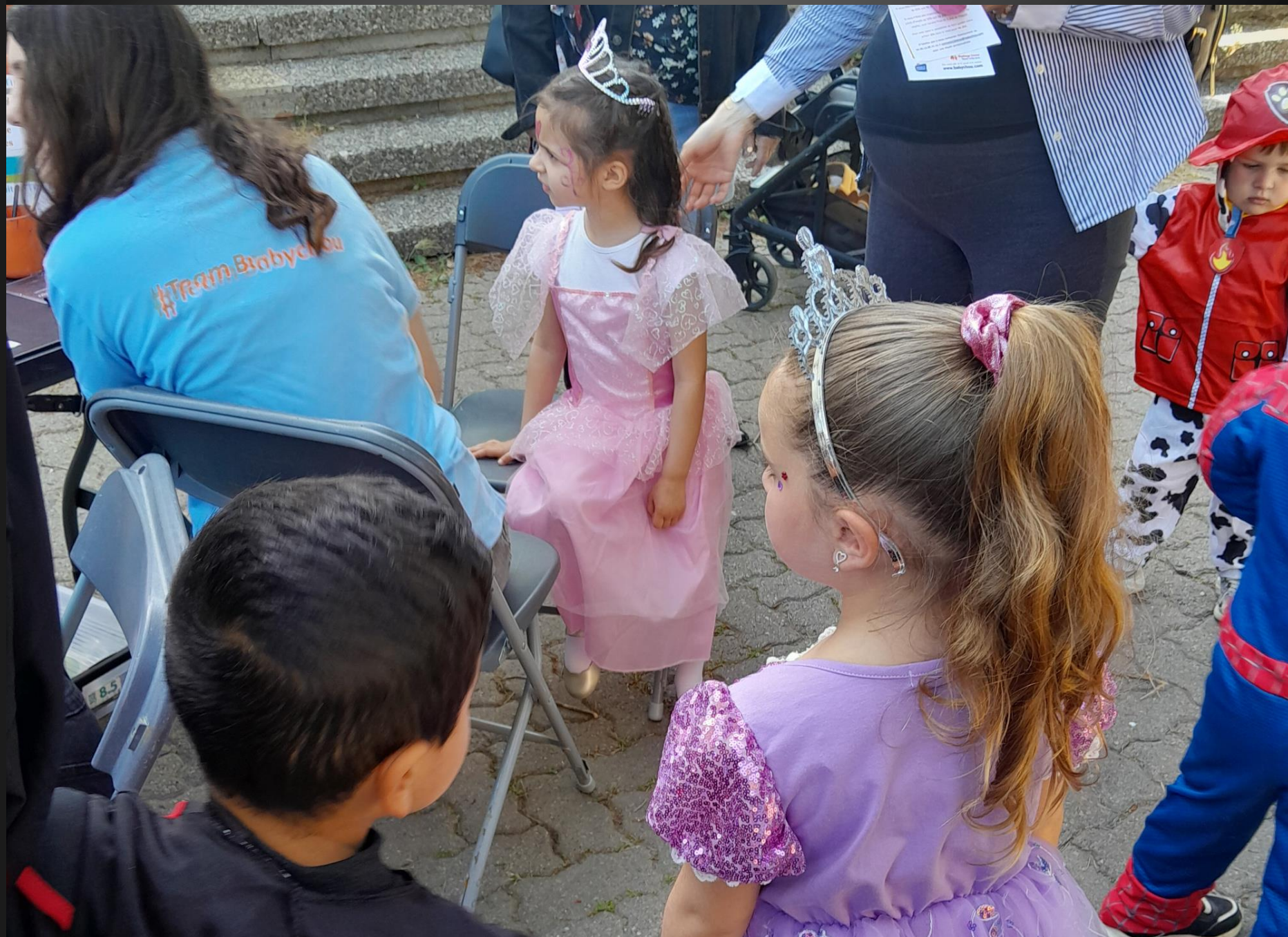
ENTRESSEN _ Il y avait autant de princesses que de pirates ....