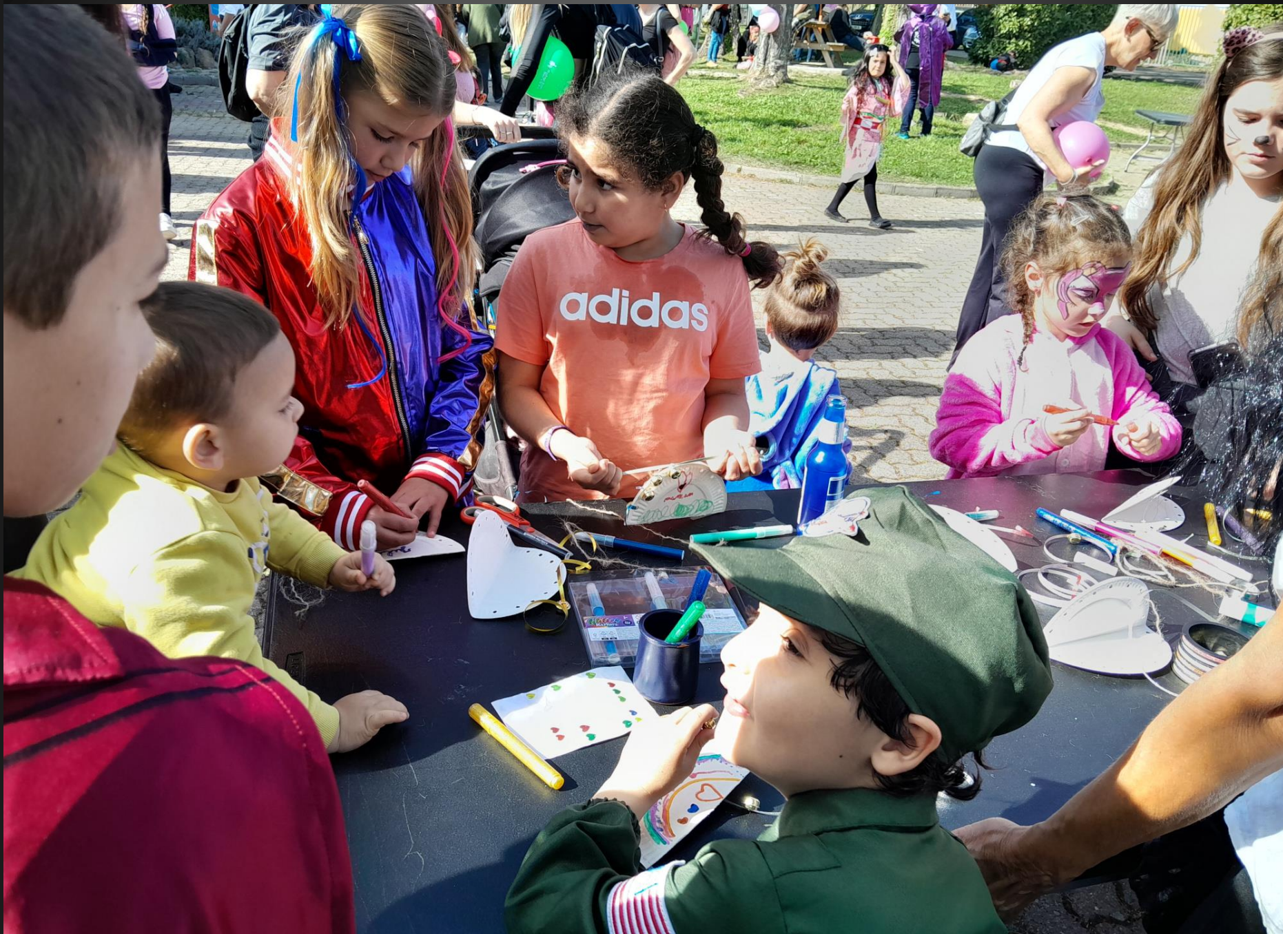
ENTRESSEN _ Le stand des arts créatifs a beaucoup occupé les enfants...