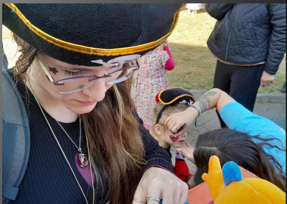
ENTRESSEN_ Pendant le maquillage, on est sage, très sage même, c'est une chose sérieuse !