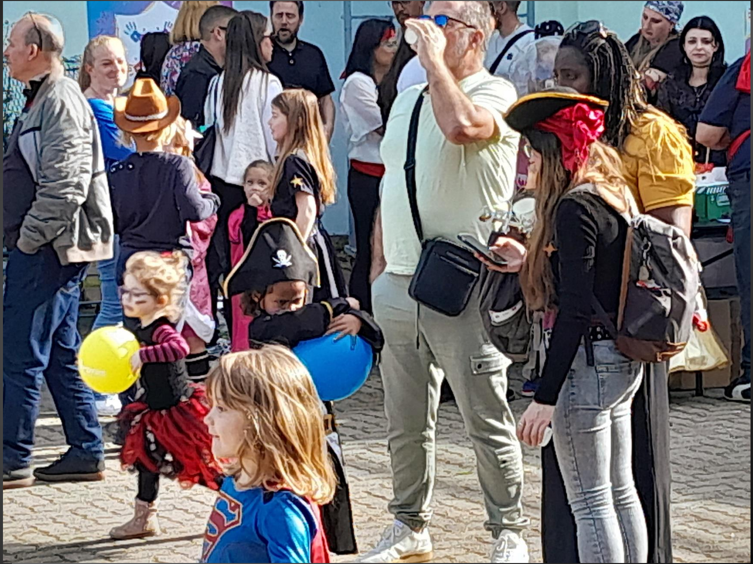
ENTRESSEN_ Le défilé va bientôt se former.