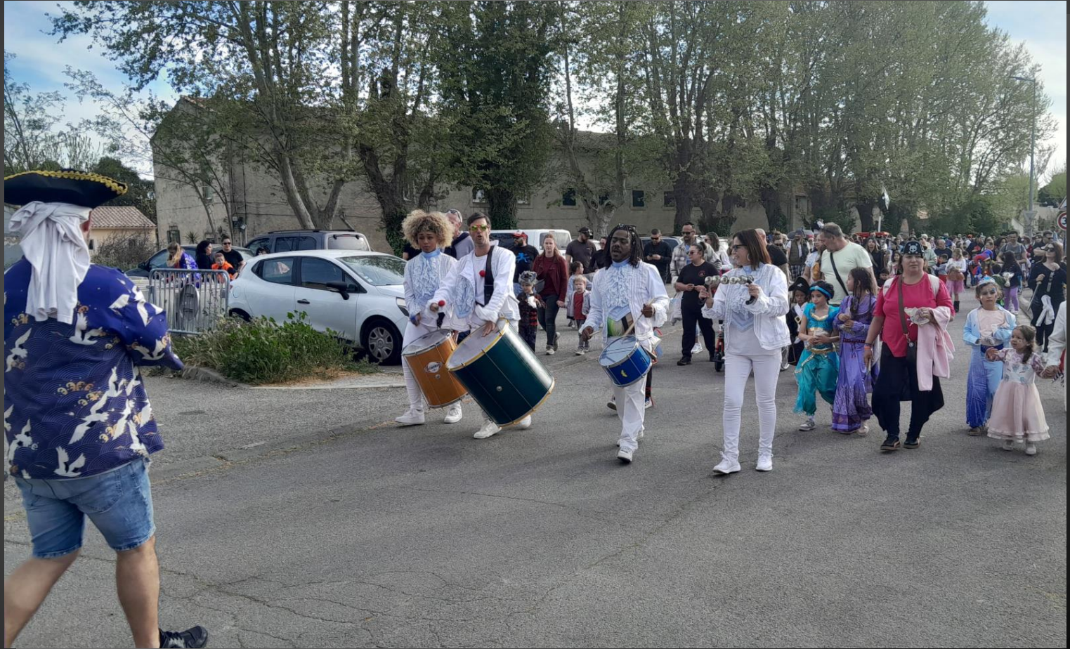
ENTRESSEN_ Le défilé se dirige vers la place où le roi du carnaval va être brûlé., comme le veut la tradition.