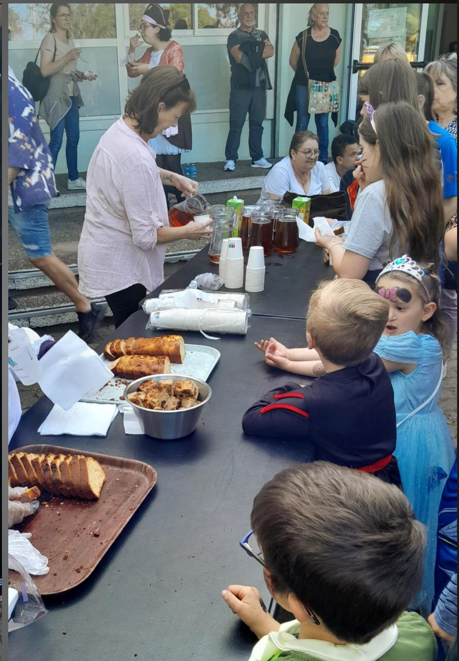
ENTRESSEN _ La table du goûter et le stand de la barbe à papa ...