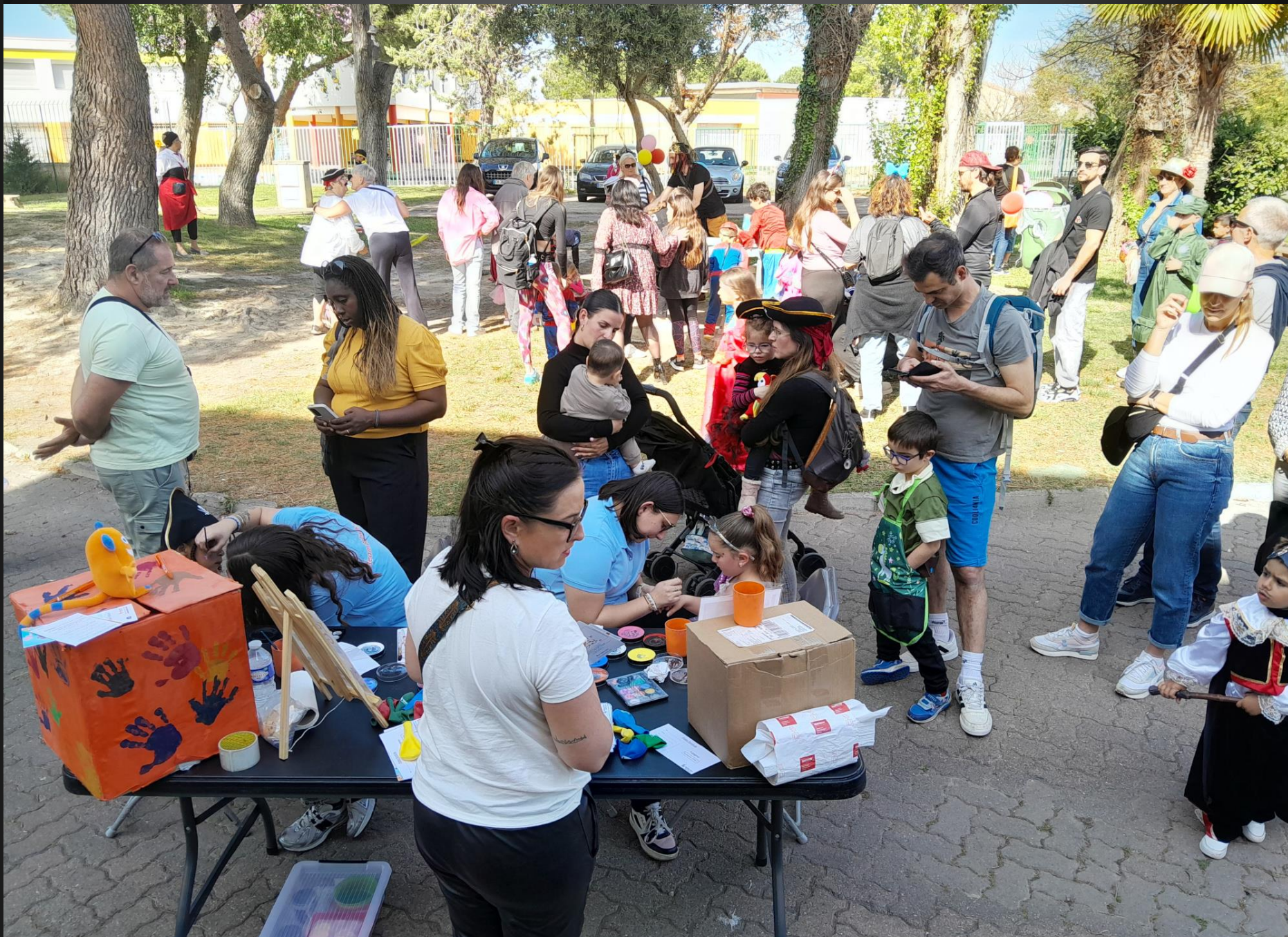
ENTRESSEN _ Le stand du maquillage a été très sollicité.