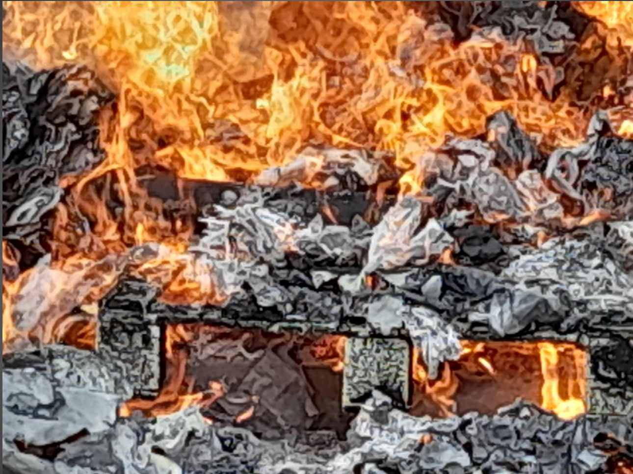
ENTRESSEN_ Le feu purificateur a consumé le bouc émissaire, pour ses fautes et ses méfaits...