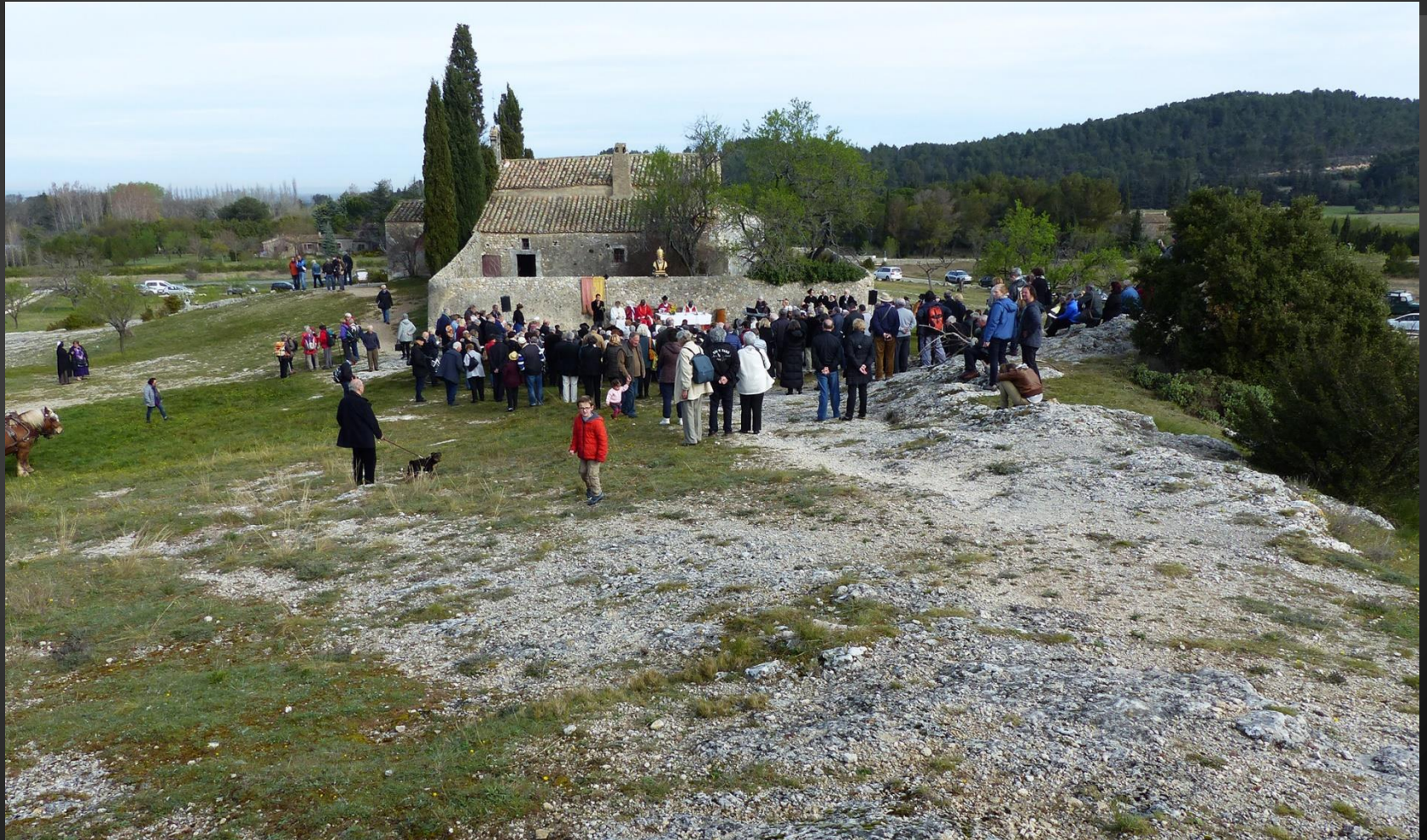
EYGALIERES Le Roumavage 2016 _ Chaque année, le Mardi de Pâques, les pèlerins assistent à la messe en plein air devant la chapelle.