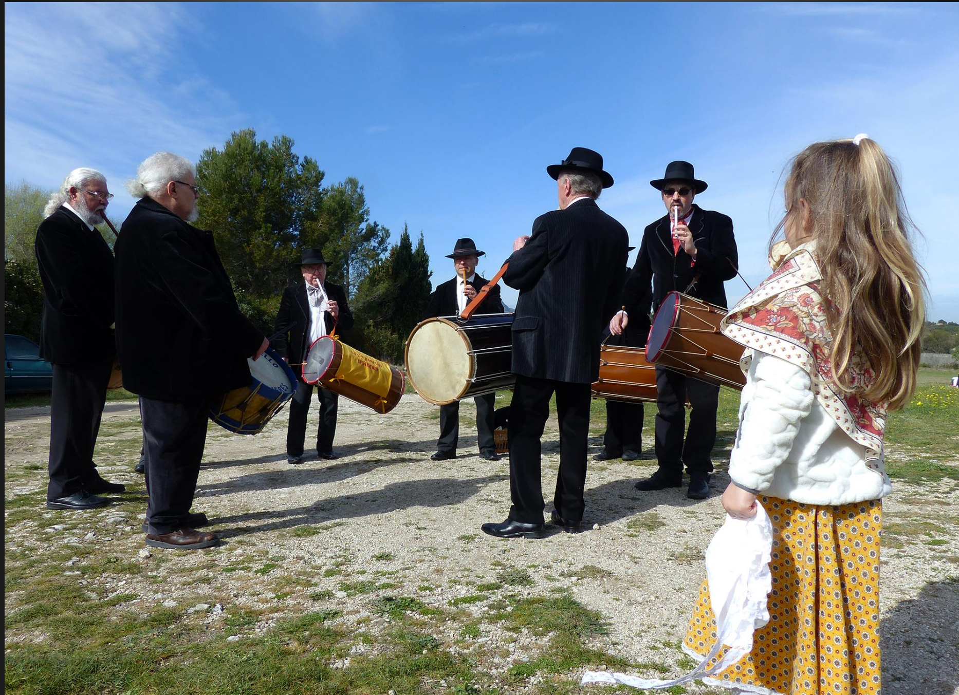
EYGALIERES Le Roumavage 2016 _ Pendant des siècles les habitants vinrent à ce pèlerinage en priant, les années de grande sécheresse, pour demander la pluie.