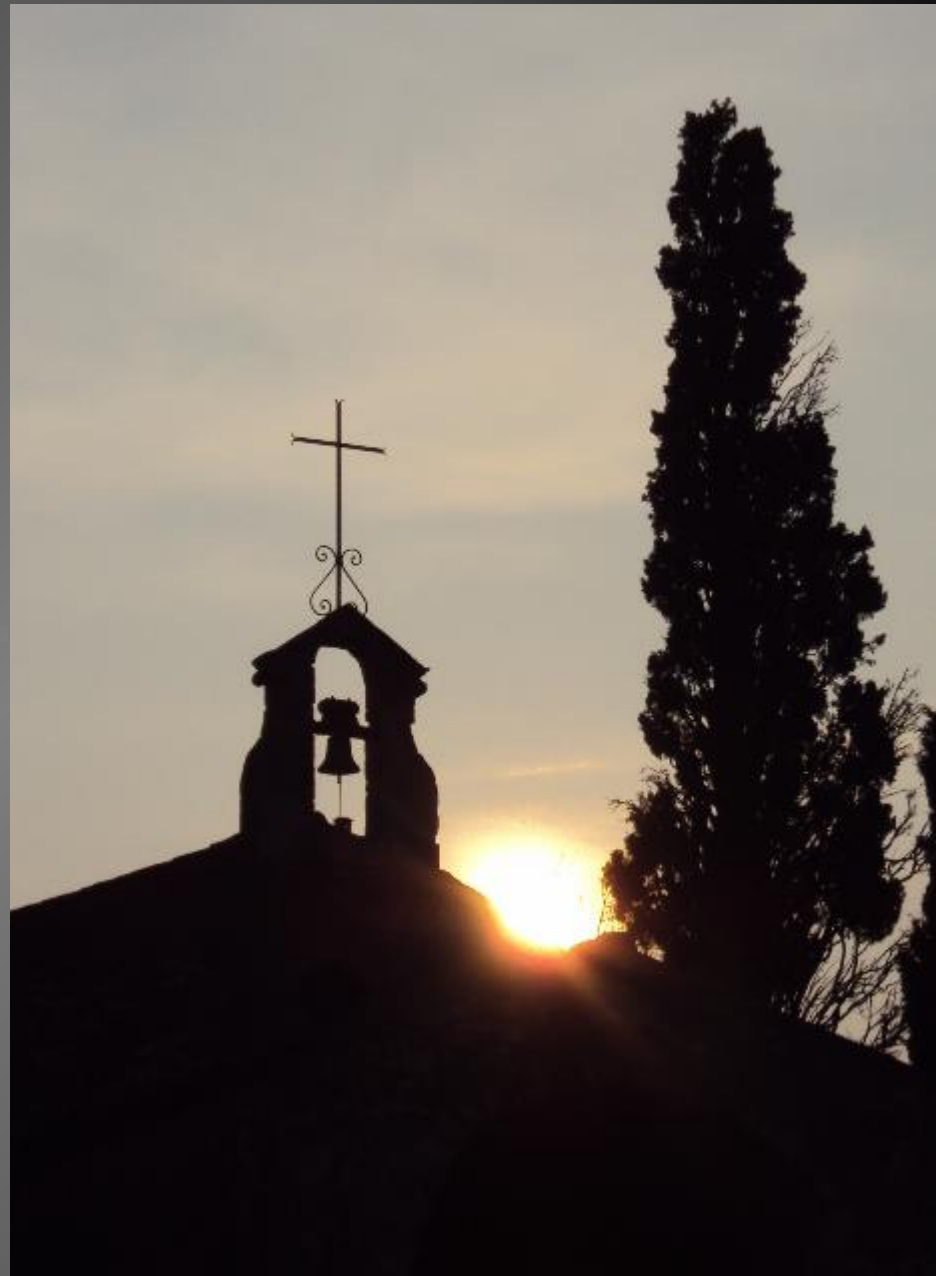
EYGALIERES_ La chapelle Saint-Sixte au soleil couchant.