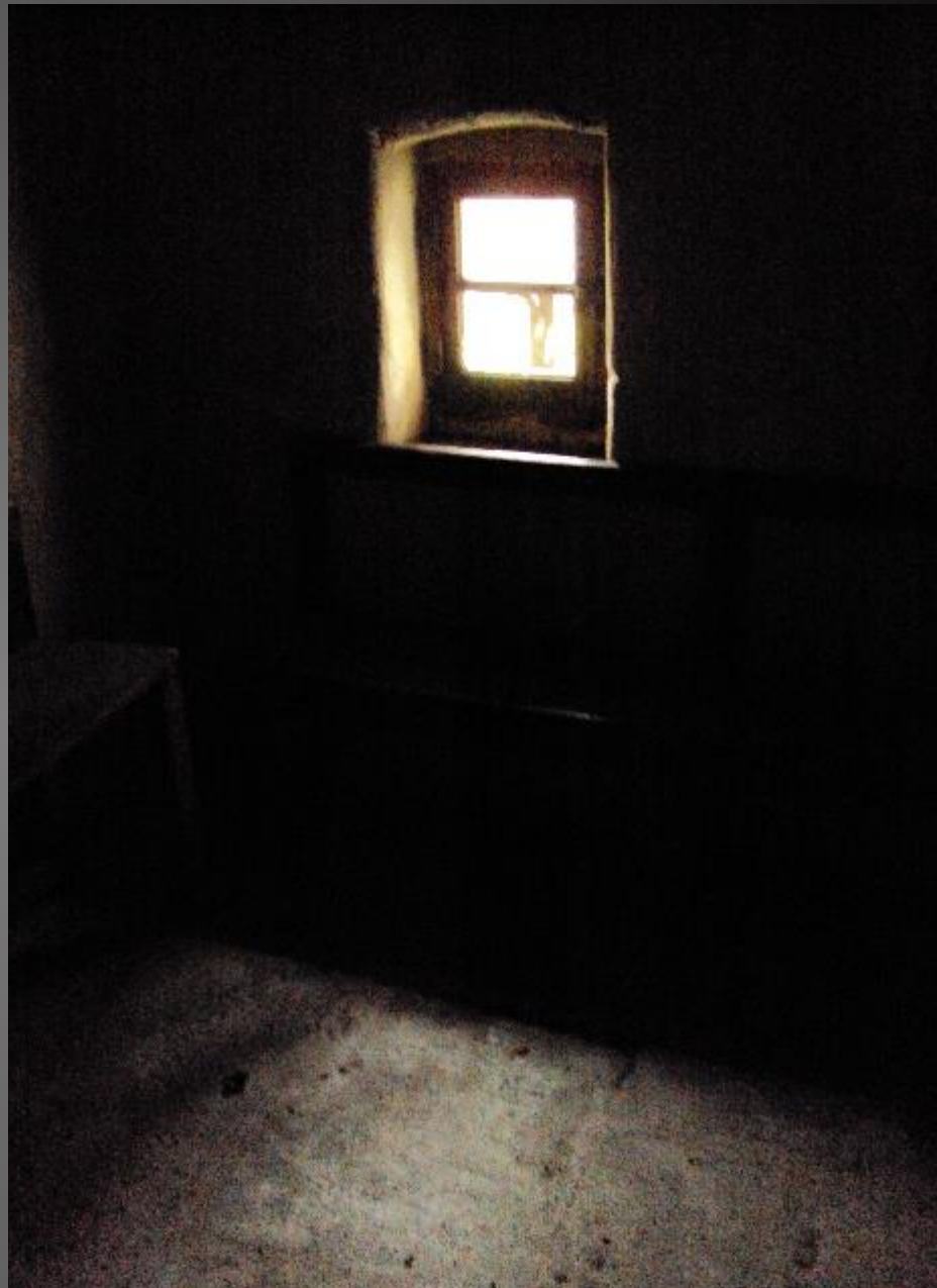
EYGALIERES_ L'ermitage de la chapelle Saint-Sixte.