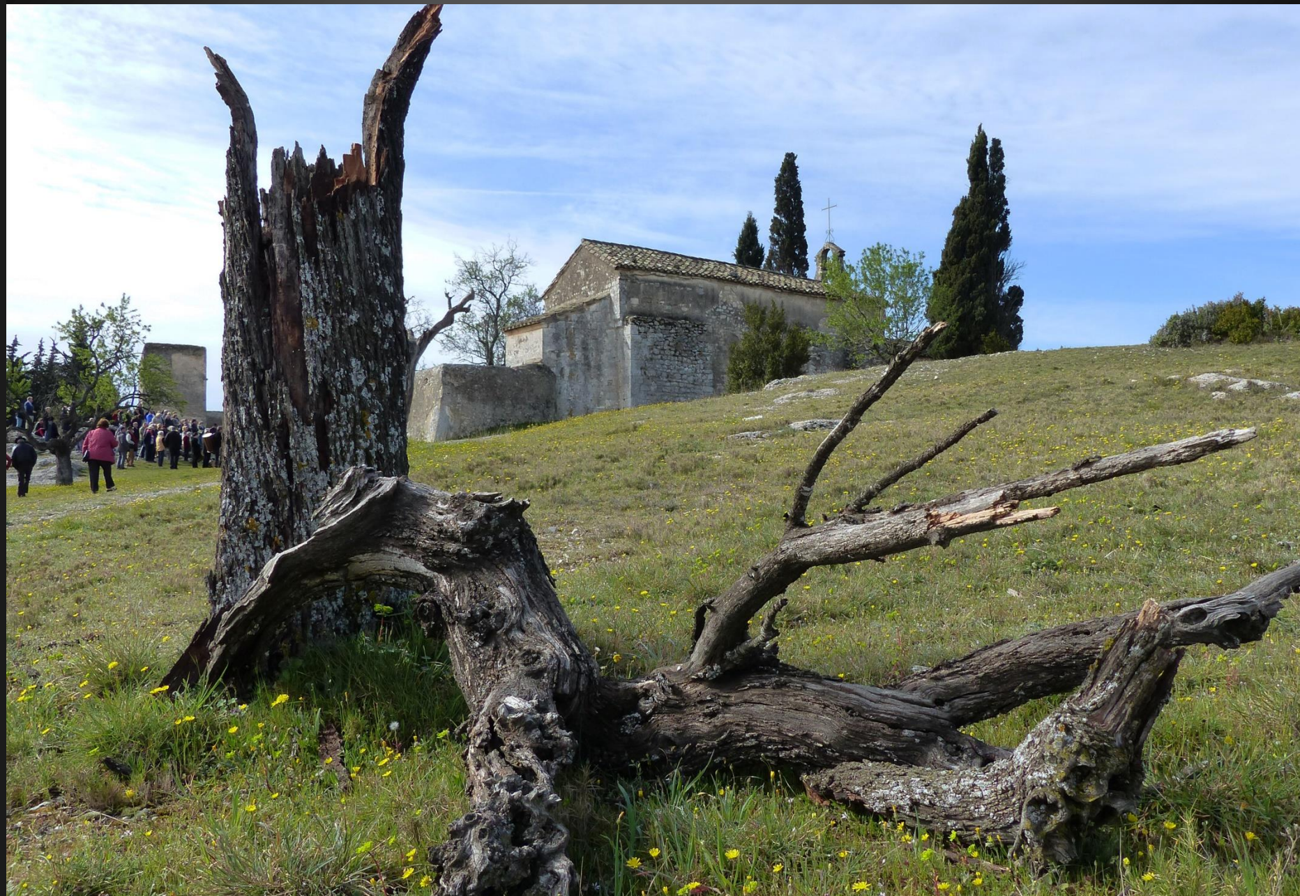
EYGALIERES _ La Chapelle Saint-Sixte fut construite au XIIe siècle à l'emplacement d'un sanctuaire antique, à proximité d'une source.