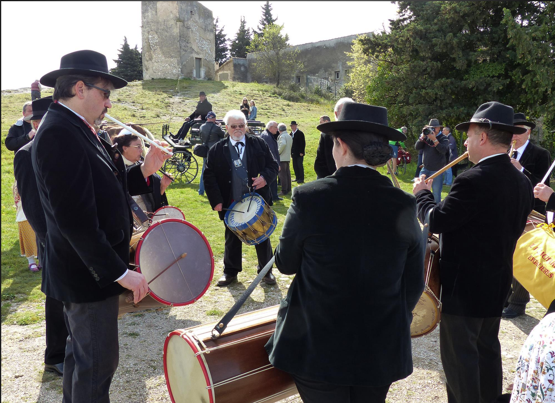
EYGALIERES Le Roumavage 2016 _ C'est l'un des très beaux pèlerinages de Provence, cette terre si précocement et charnellement chrétienne.