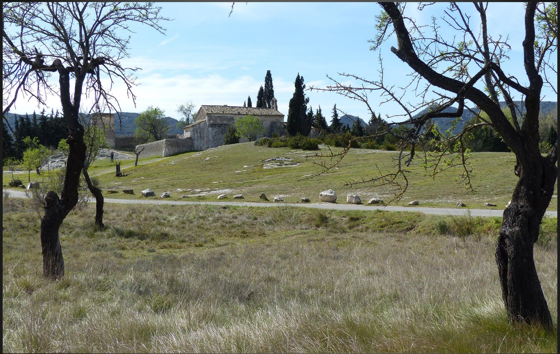
EYGALIERES_ Chapelle Saint-Sixte, située sur un tertre rocheux, à 1 Km du village.