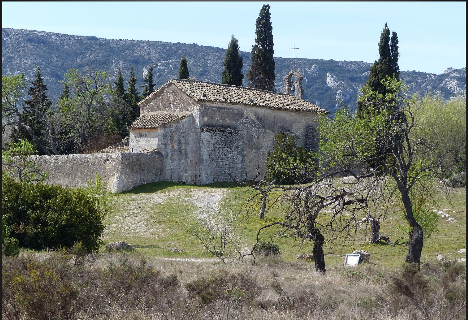
EYGALIERES _ Chapelle Saint-Sixte, la quintessence du paysage provençal.