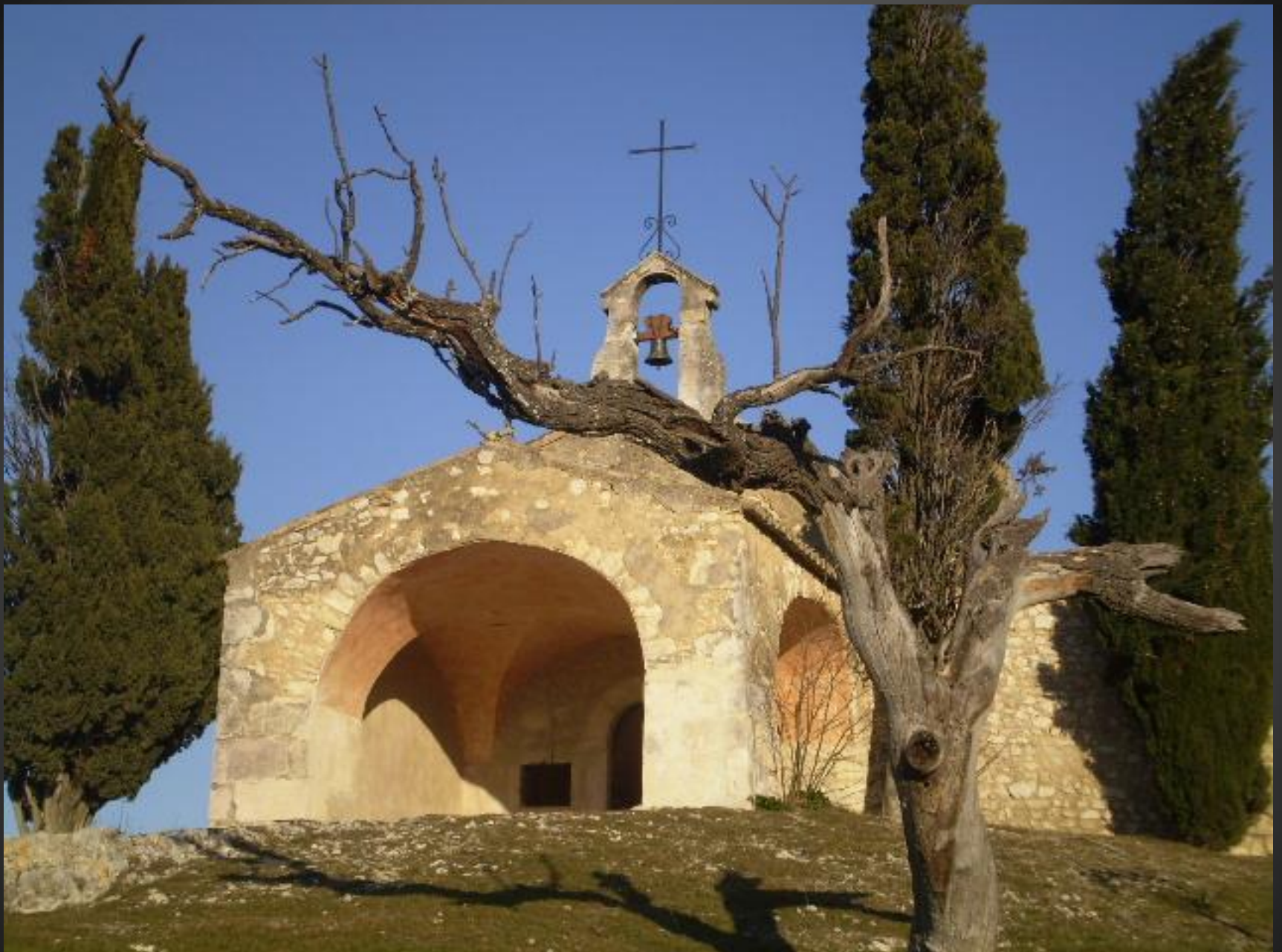
EYGALIERES_ La chapelle Saint-Sixte, entourée de cyprès, offre une des images les plus connues de la Provence en général et de l'art roman provençal en particulier.