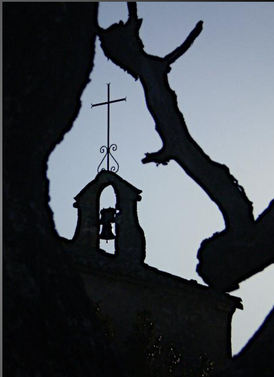
EYGALIERES_ Toute simple, la chapelle Saint-Sixte, construite en moellons, est soutenue par des contreforts massifs.