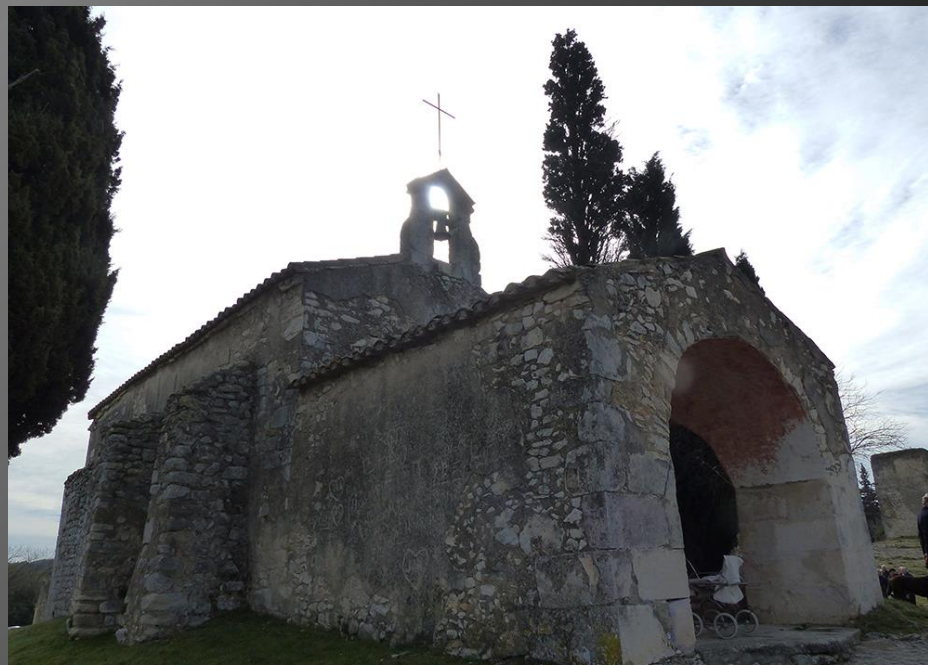
EYGALIERES_ La chapelle Saint-Sixte et son imposant porche du XVIIe siècle.