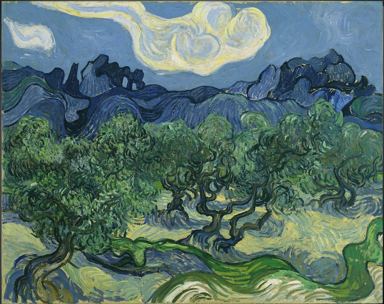
EYGALIERES _ Oliviers dans les Alpilles, Vincent van Gogh, juin 1889, Huile sur toile.