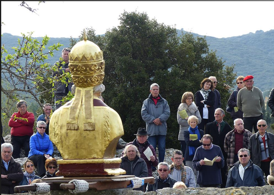
EYGALIERES Le Roumavage 2016 _ Le buste de Saint Sixte a été placé sur le muret, face aux fidèles.