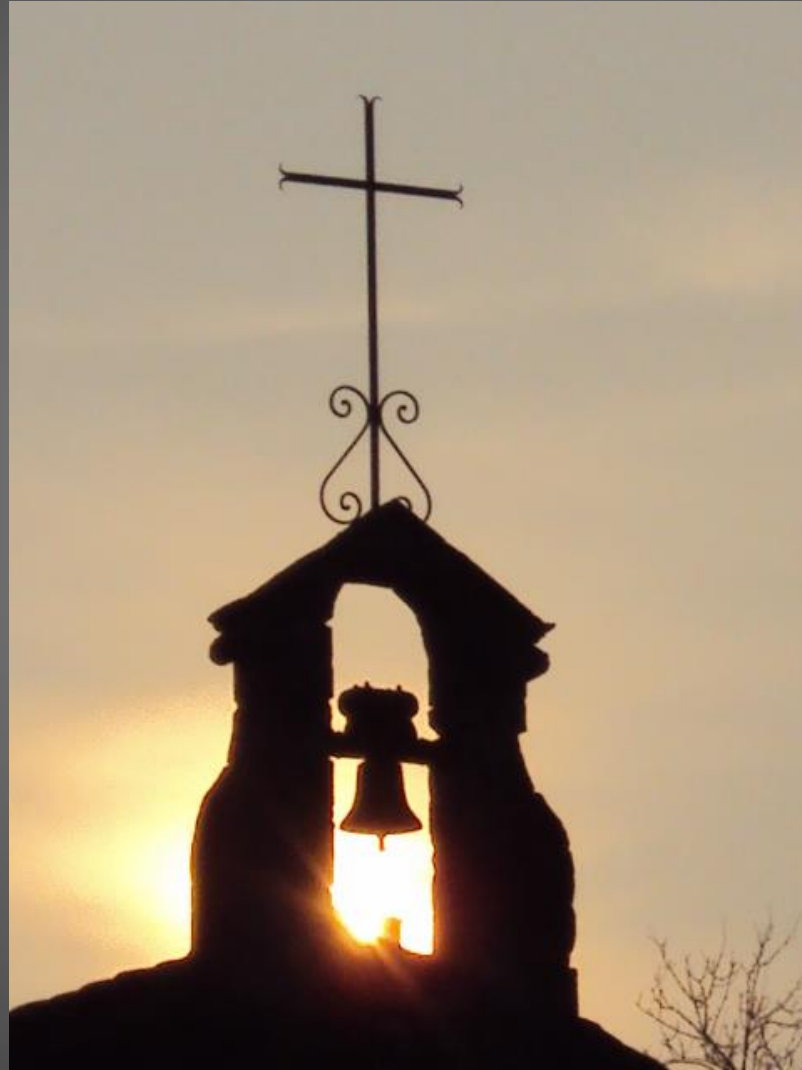
EYGALIERES_ Chapelle Saint-Sixte