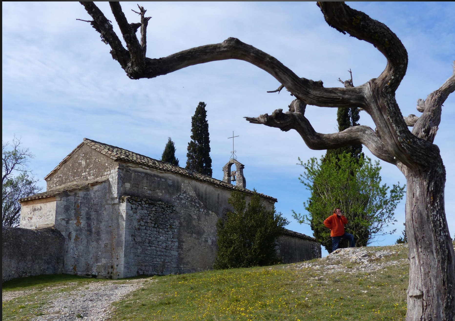
EYGALIERES_ la chapelle Saint-Sixte avait à l'origine, comme façade, le clocher-mur à une baie campanaire toujours existant. Le porche a été ajouté en 1629 pour abriter les nombreux pèlerins.