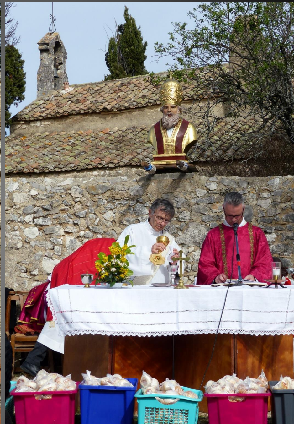
EYGALIERES Le Roumavage 2016 _ Bannière de procession : O GRAND SANT SIST PROUTÈJO NOSTE BÈU PAÏS . Comme le veut la tradition, le prêche a été fait en langue provençale.