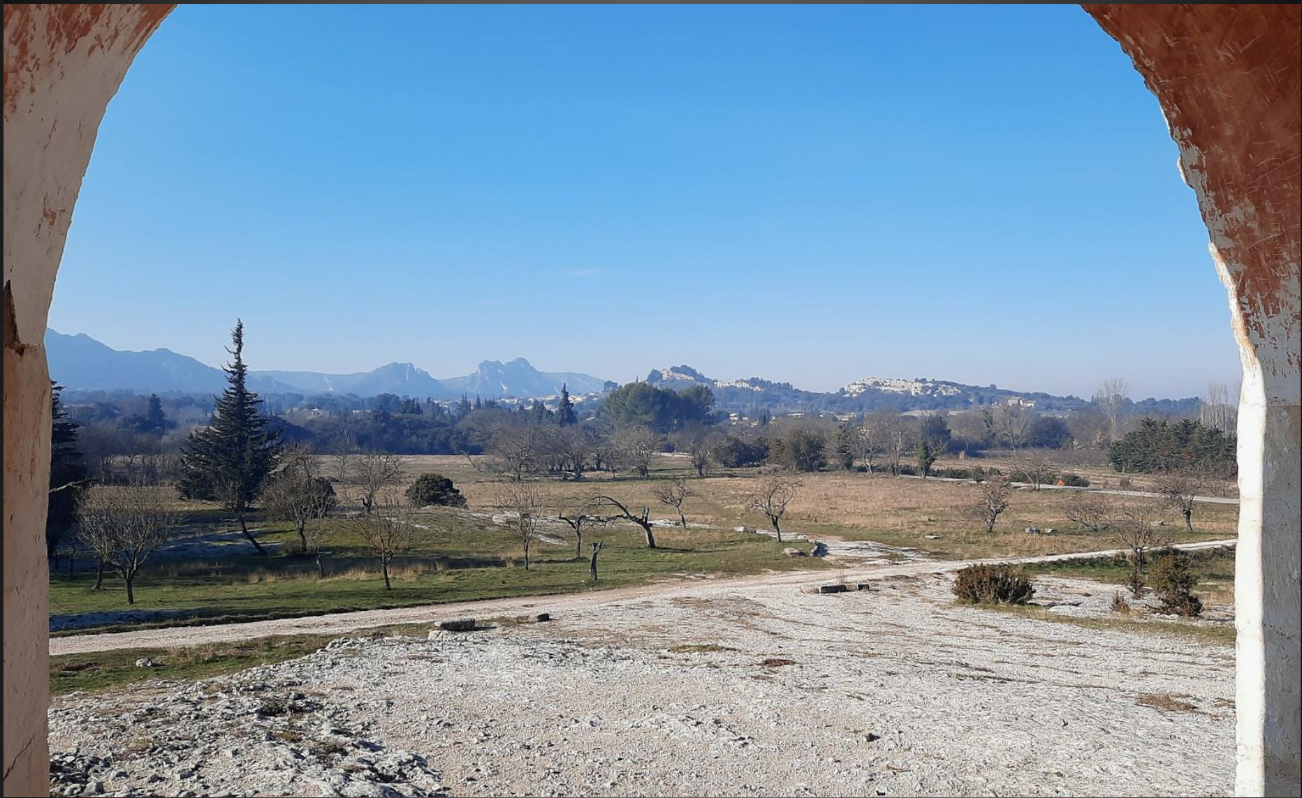
EYGALIERES _ Vue sur les Alpilles depuis le porche de la chapelle.