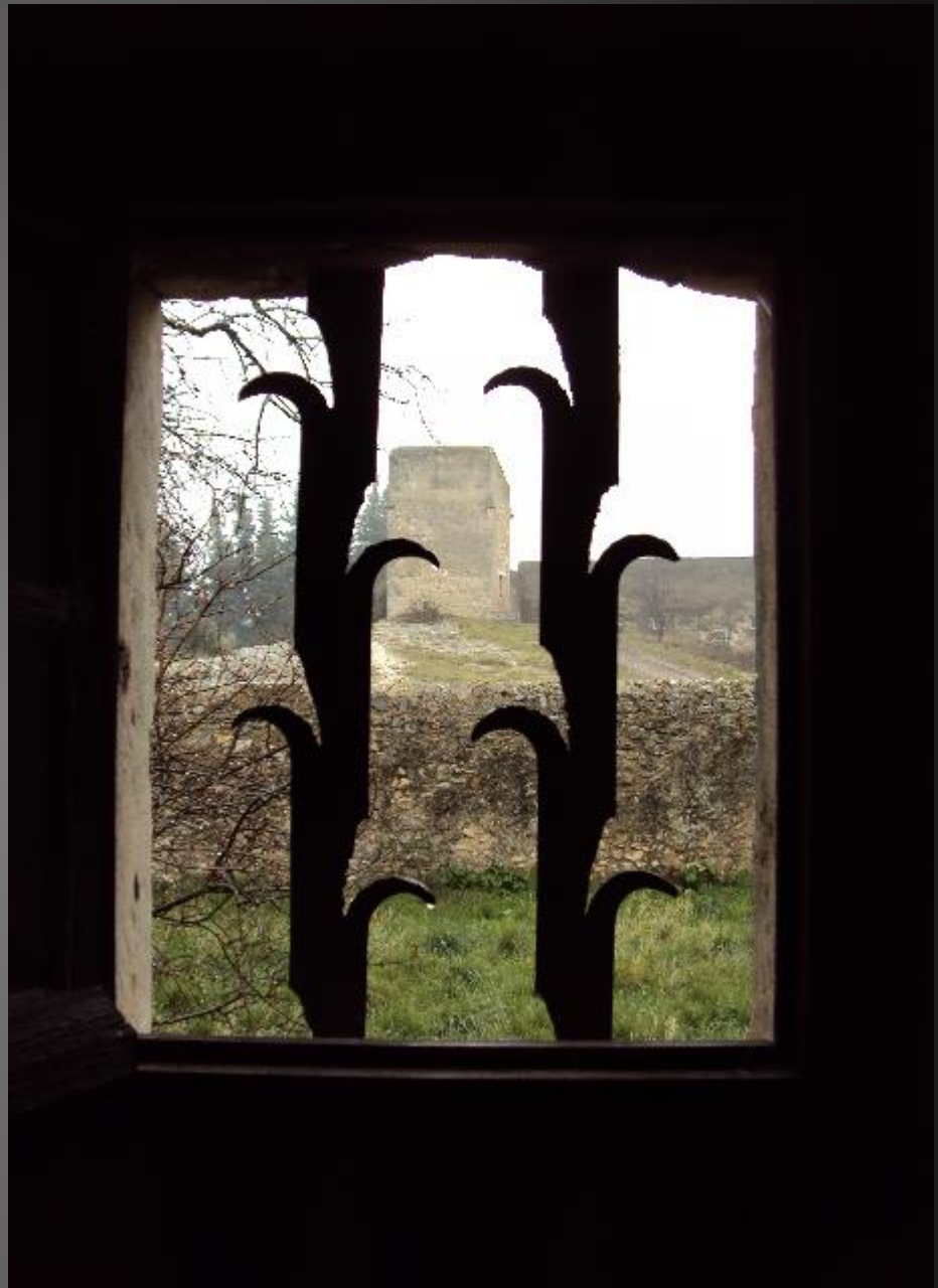
EYGALIERES_ La chapelle Saint-Sixte a été complétée au XVIIe s. d'un petit ermitage dont on voit ici la cheminée et une partie du muret à l'extérieur.