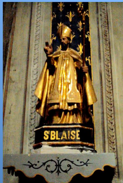
Saint Blaise, évêque de Sébaste en Arménie, et martyr (316)