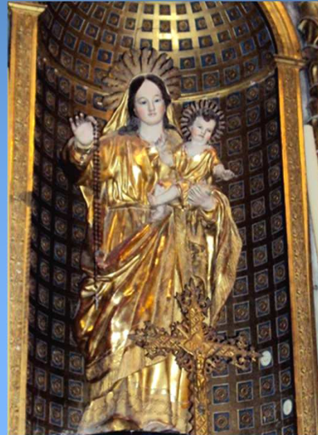
La Vierge à l'Enfant, représentant Marie avec son Fils, Jésus de Nazareth