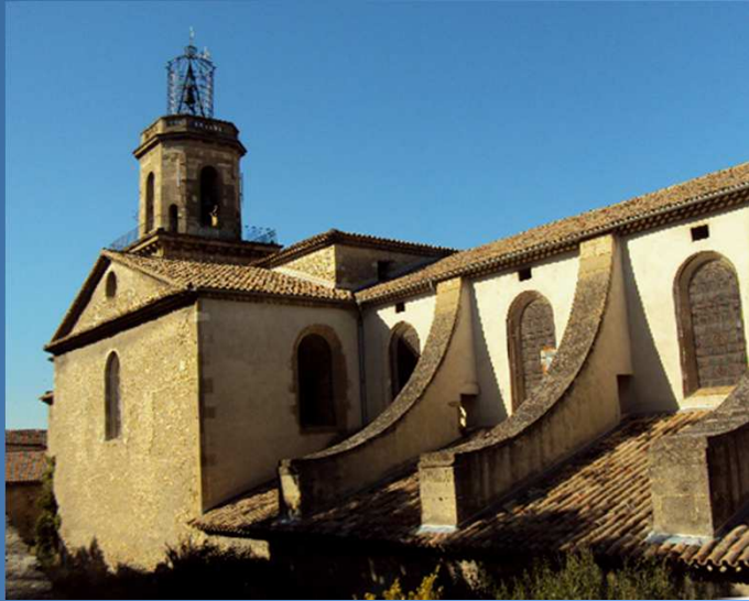
Ancienne église Ste Marie-Madeleine (XIe s.) reconstruite en 1345 et placée sous le patronage de Notre Dame de Grâce: la dernière construction, décidée par l'archevêque d'Avignon en 1757 coûta une somme considérable, et fut consacrée en 1783