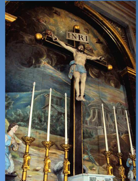
Jésus meurt en croix, au Golgotha, avant de ressusciter, le 3 e jour