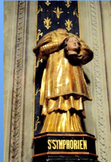
St Symphorien, très populaire en Provence, à Vernègues (Cazan) où il a un grand pèlerinage annuel