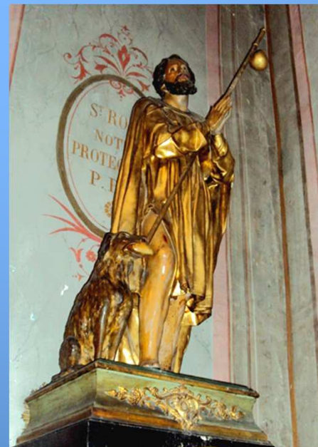
Saint Roch a protégé de nombreux villages de la peste en 1720