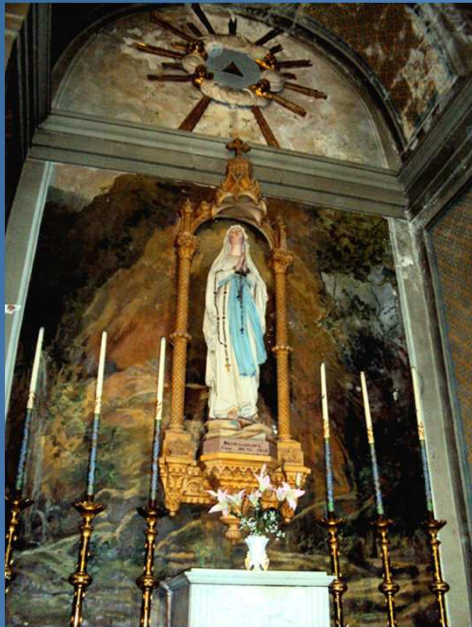
Notre-Dame de Lourdes, en 1864 : "Que soy era Immaculada Councepciou", « Je suis l'Immaculée Conception »