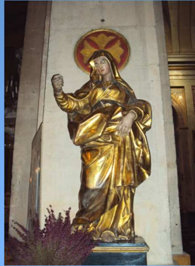
Statue de la Vierge enceinte, thème diffusé au XIIIe siècle (Notre-Dame-de-l'Attente, cathédrale de Léon)