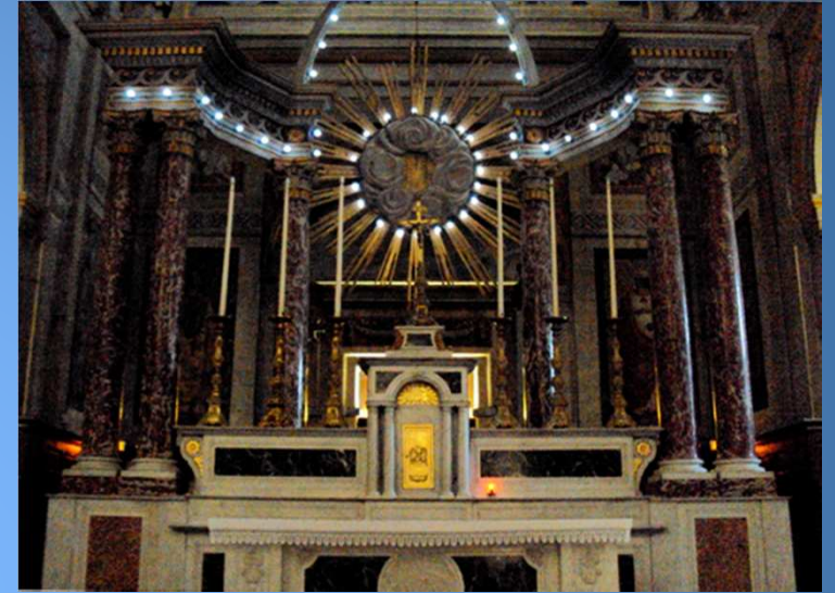
L'autel dans le chœur est surmonté d'une colonnade en marbre au centre de laquelle se manifeste la gloire de Dieu (livre d'Ézéchiel) : « L'Éternel appelle Moïse du milieu de la nuée. »