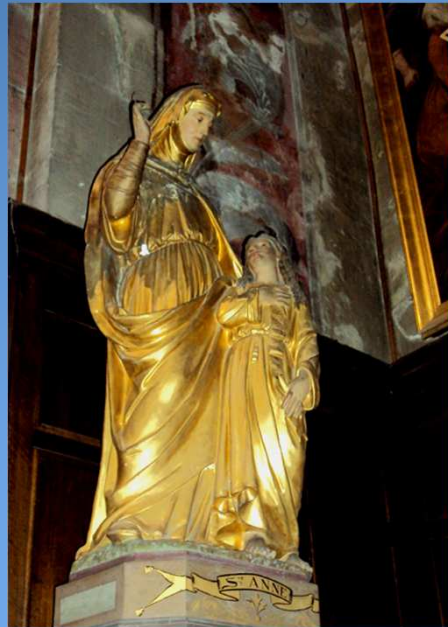
Ste Anne, à Auray en 1624 : "Me zo Anna mamm Mari", « Je suis la mère de Marie »