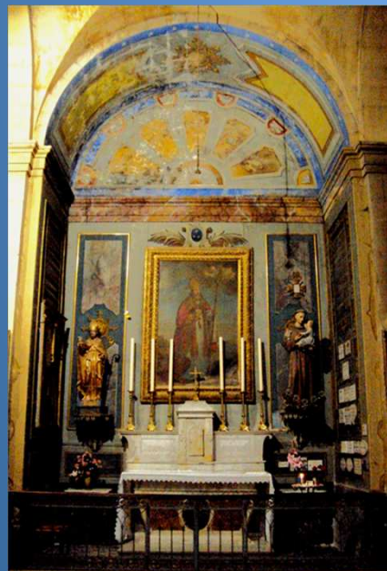
Les chapelles latérales abritent les statues de nombreux saints