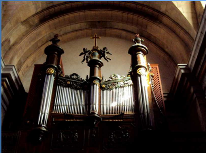
L'orgue d'Eyguières sur lequel Frédéric Chopin a joué en 1839, lors d'un enterrement, dans l'église Notre-Dame-du-Mont à Marseille où il avait été livré en 1802.