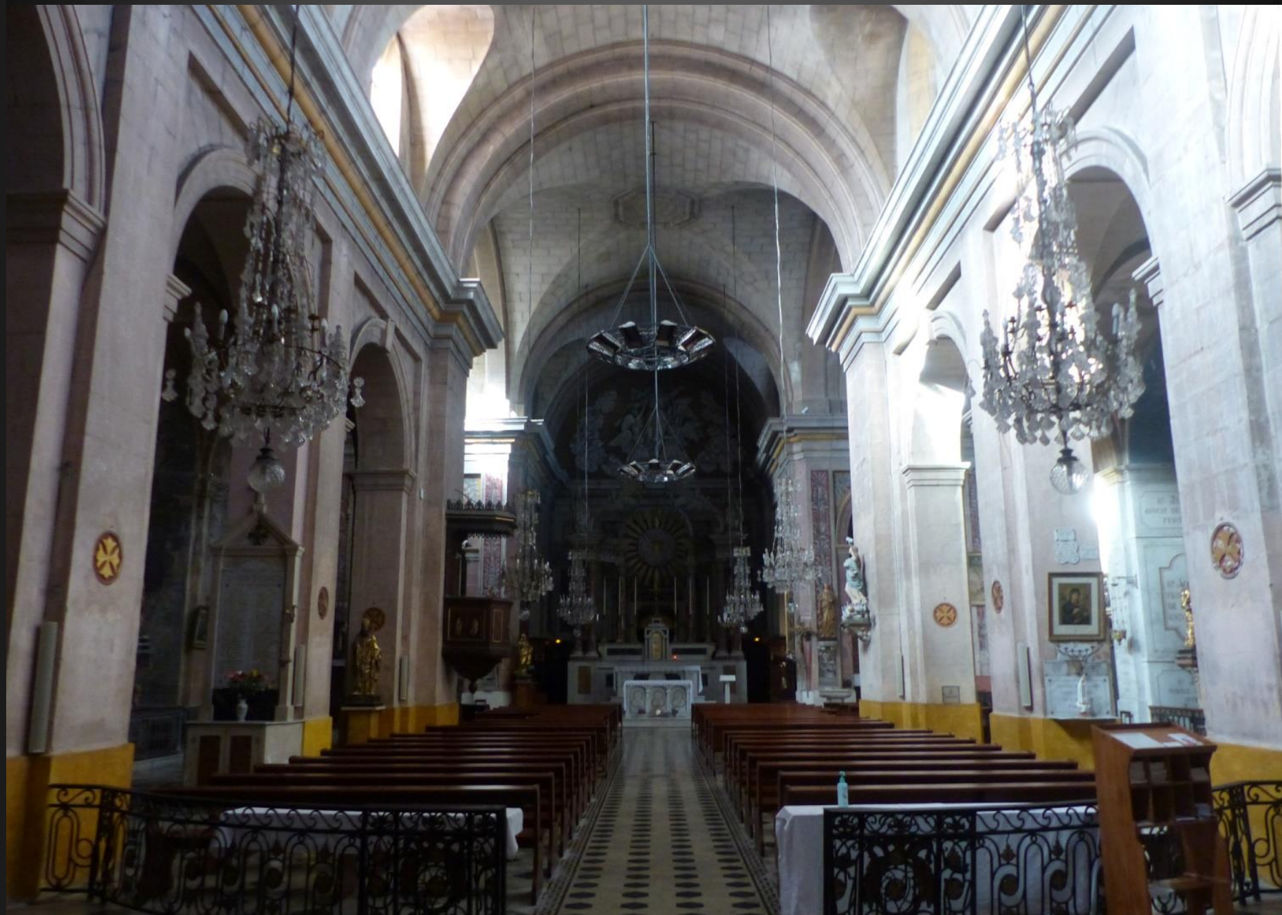
Eglise Notre-Dame-de-Grâce _ Conçue à la fin du XVIIIe siècle, Esprit-Joseph Brun est le maître d'oeuvre de cette église. Achevée en 1754 après 4 ans de travaux, c'est un édifice néo classique de belles dimensions (ensemble église et presbytère d'une emprise au sol de plus de 40m par 30m, pour un intérieur de 3 nefs de largeur 18m et de longueur 24 m). Inscription MH 1984.