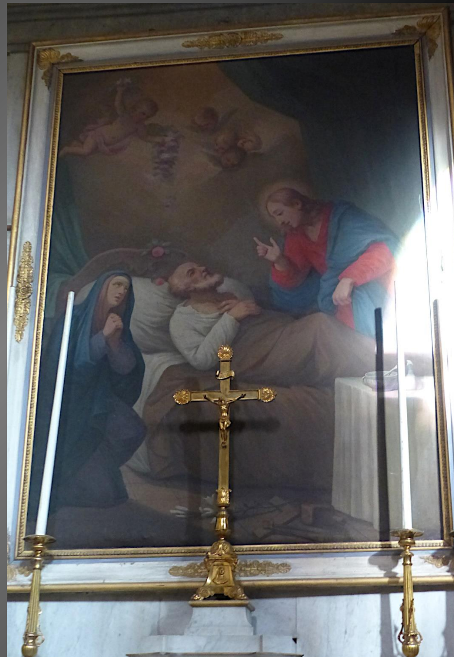
Chapelle de saint Joseph. Le tableau représente la mort du père nourricier de Jésus.