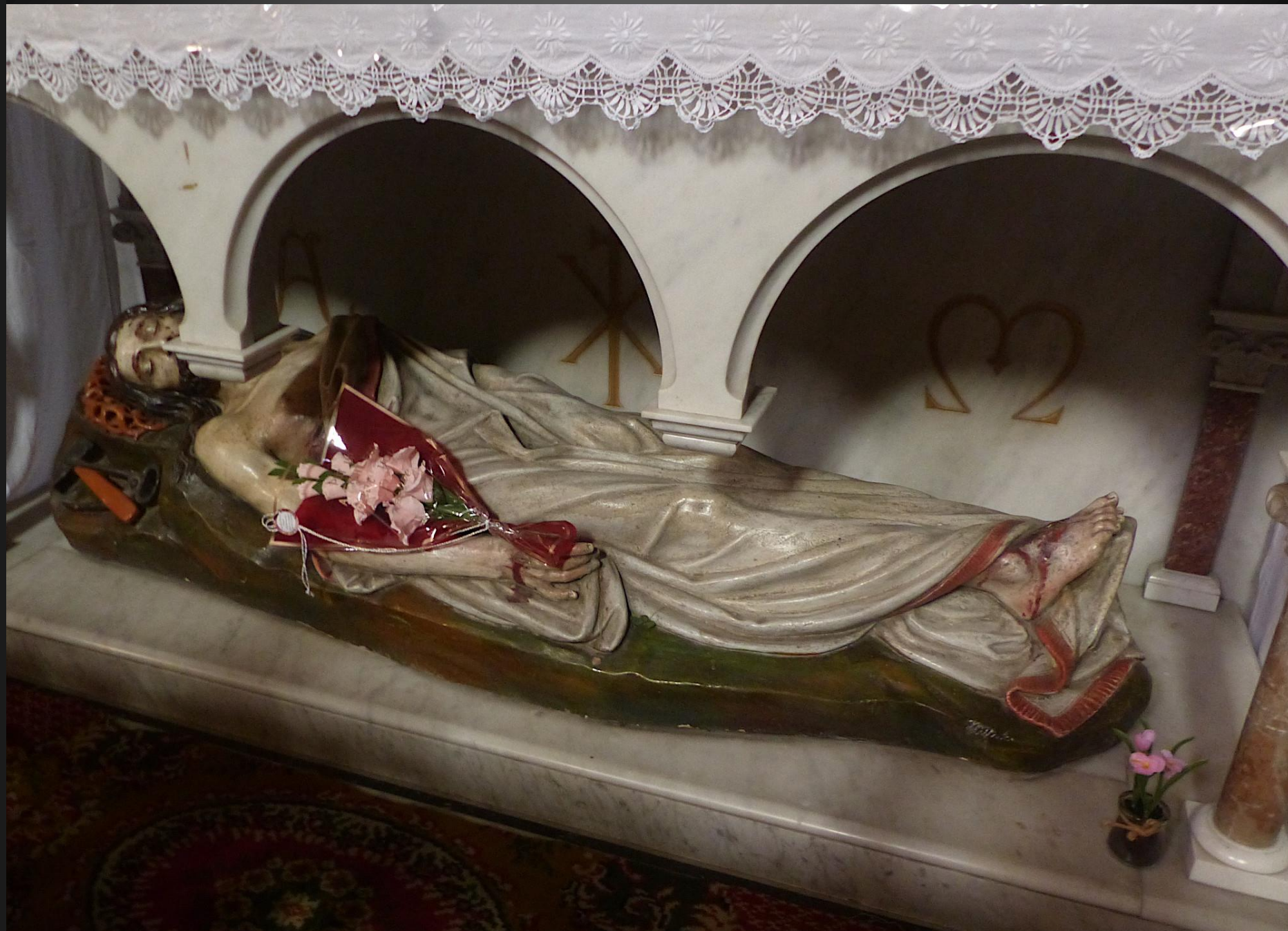
Chapelle du Purgatoire_ Sous l'autel, un gisant représente le Christ au tombeau ; près de lui, les instruments de la passion, tenaille et marteau.