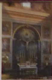
Chapelle du Calvaire

Une plaque commémore la béatification de Bernadette Soubirous, canonisée par le Pape Pie XI le 8 décembre 1853. À gauche, une croix et au faisant face, une statue de sainte Thérèse d'Avila, réformatrice du Carmel en Espagne (1515-1582).