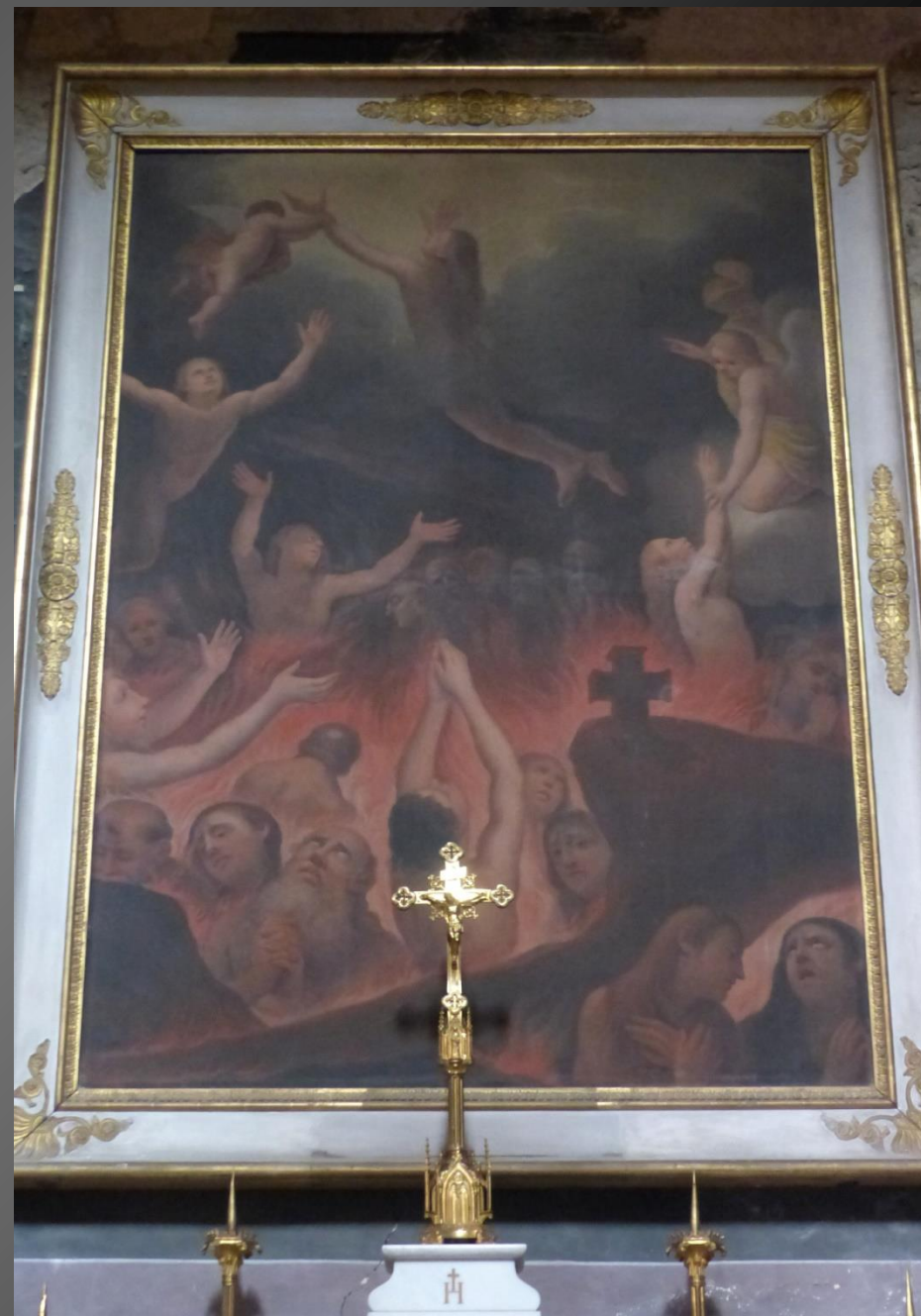
Chapelle du Purgatoire. Le tableau représente les âmes du Purgatoire.