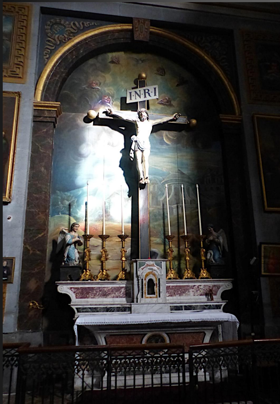
Chapelle du Calvaire. Le tableau représenterait les extérieurs de la ville de Jérusalem aux lieux et heure de la passion du Christ.