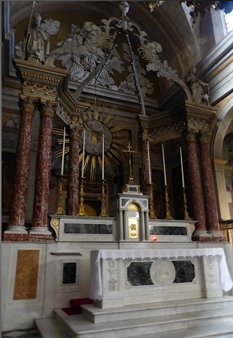
L'autel majeur de l'église Notre-Dame-de-Grâce.