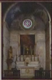
Chapelle de saint Joseph

Le tableau représenterait les extérieurs de la ville de Jérusalem au lieu et heure de la passion du Christ. En haut, à gauche, Pilate, à droite Gethsémani où Jésus pria avant d'être arrêté. Crucifix grandeur nature avec l'inscription I.N.R.I. (initiales de quatre mots latins traduits en français par « Jésus, Nazarien, roi des Juifs ». À gauche, tableau de la résurrection du Christ au matin de Pâques, à droite saint Agricole (VI e siècle) mourant, transmettant son titre à saint Vérédème qui lui succéda.