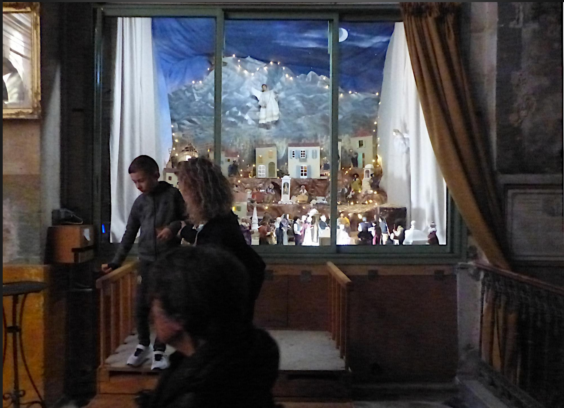
La crèche provençale est située tout de suite à gauche de l'entrée, derrière des vitres en verre.