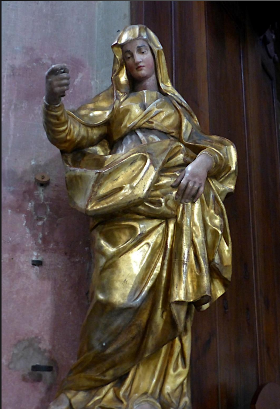
Rare statue de la Vierge enceinte, à gauche du Chœur.