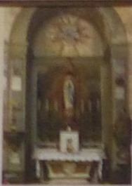
Chapelle de Notre-Dame-de-Lourdes

Une plaque commémore la béatification de Bernadette Soubirous, canonisée par le Pape Pie XI le 8 décembre 1853. À gauche, une croix et au faisant face, une statue de sainte Thérèse d'Avila, réformatrice du Carmel en Espagne (1515-1582).