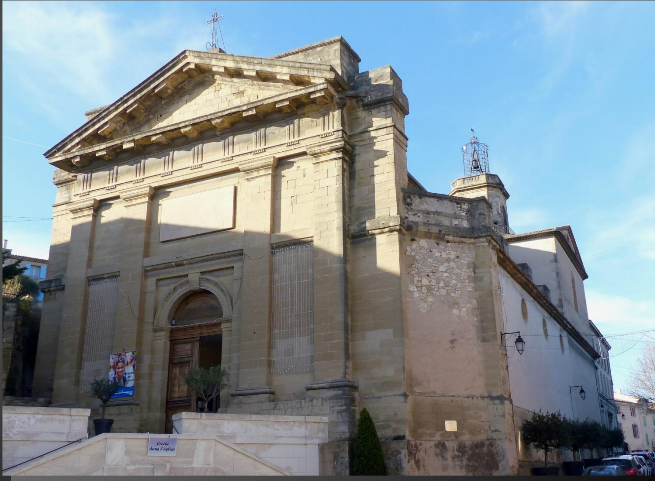
EYGUIERES L'église Notre-Dame de Grâce