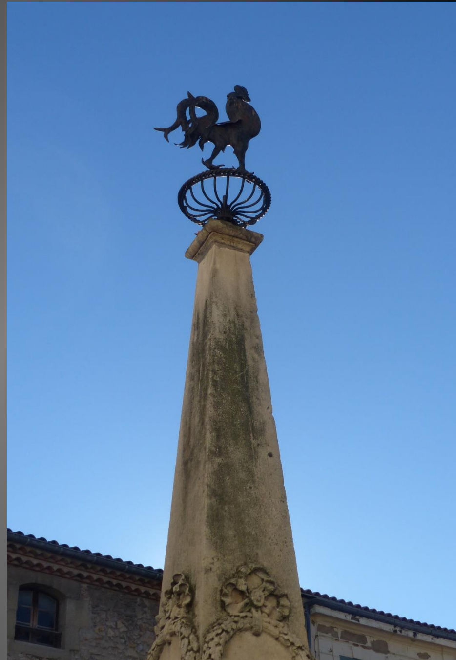
Place Croix-du-Prêche, la Fontaine Cocotte, construite en 1830, est classée MH depuis 1923.