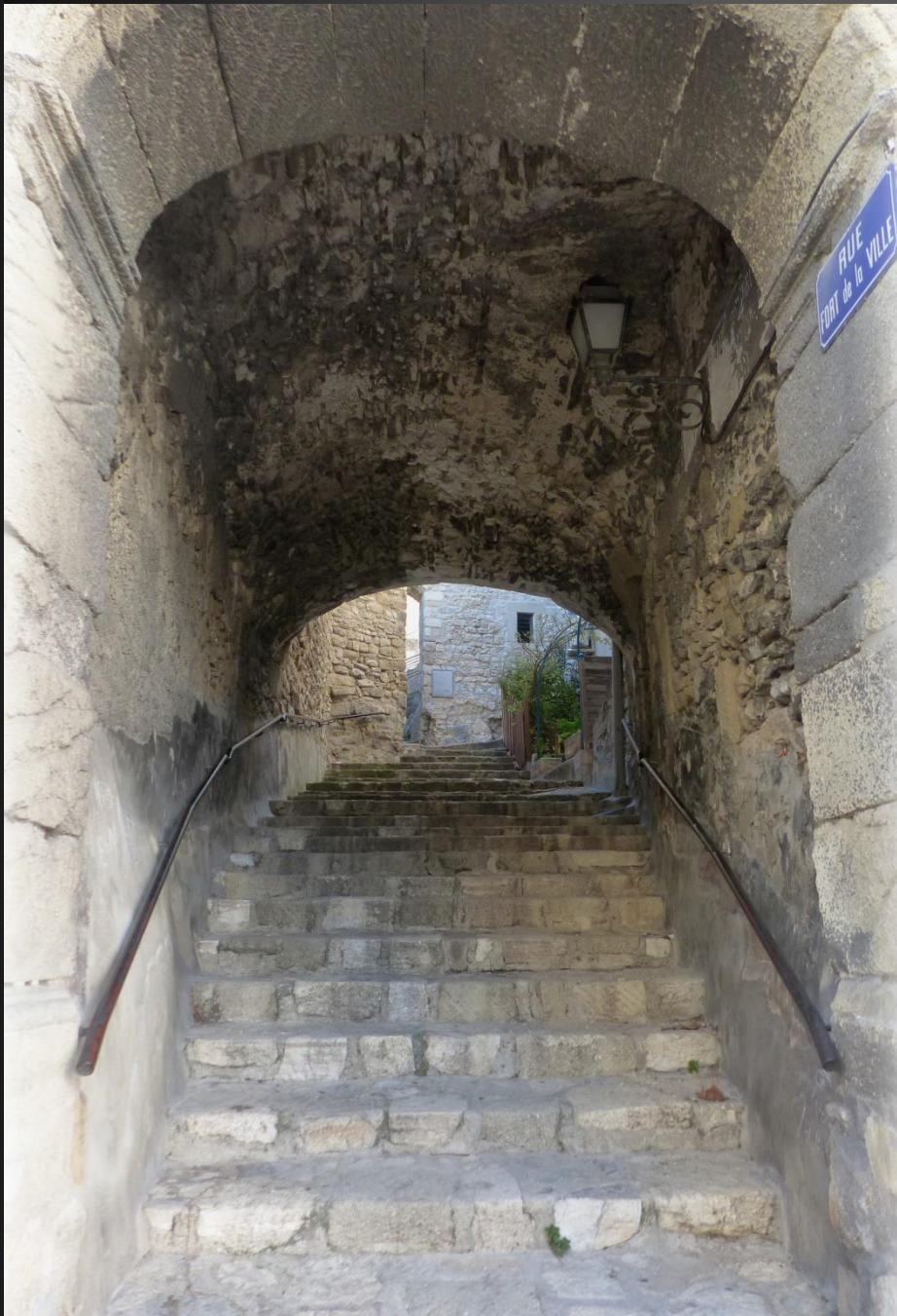
Près de l'église, cet escalier couvert monte vers les vestiges des fortifications médiévales.