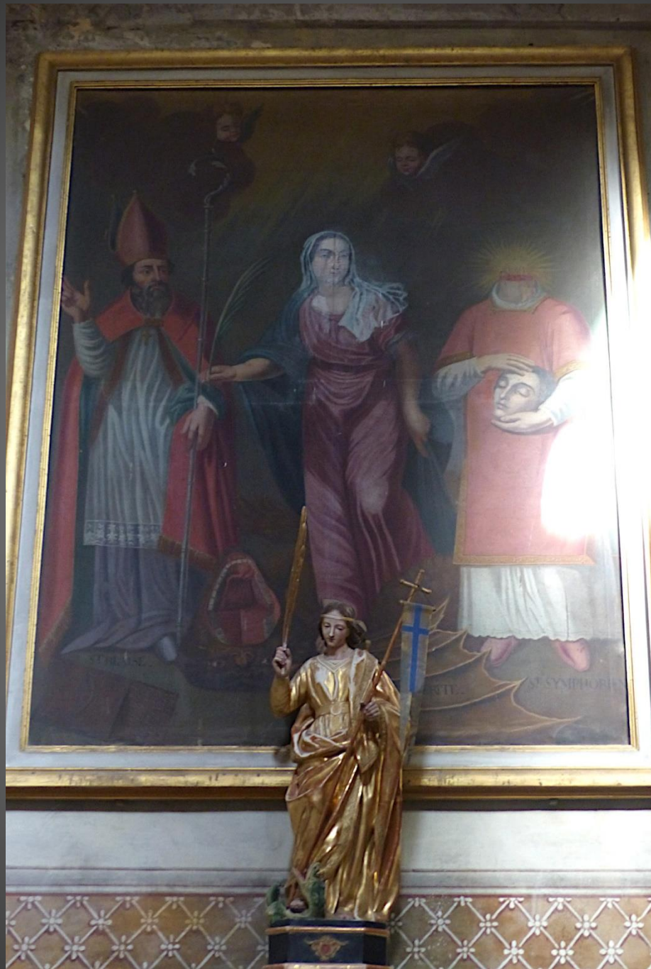
Tableau de la chapelle dédiée à sainte Marguerite, vierge martyre vénérée en Corse, qui était invoquée pour la délivrance des femmes en couches. A gauche, saint Blaise et à droite, saint Symphorien, le saint céphalophore vénéré le 22 août à Cazan, hameau du Vernègues.