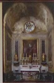
Chapelle de sainte Marguerite

Les parois de l'autel sont en marbre. Un tableau représente la mort du Saint, père nourricier de Jésus, avec Marie et Jésus à son chevet. Face à la statue de saint Joseph, de l'autre côté de l'allée, on trouve l'une des rares représentations de la Vierge enceinte (il en existe environ 10 en France).