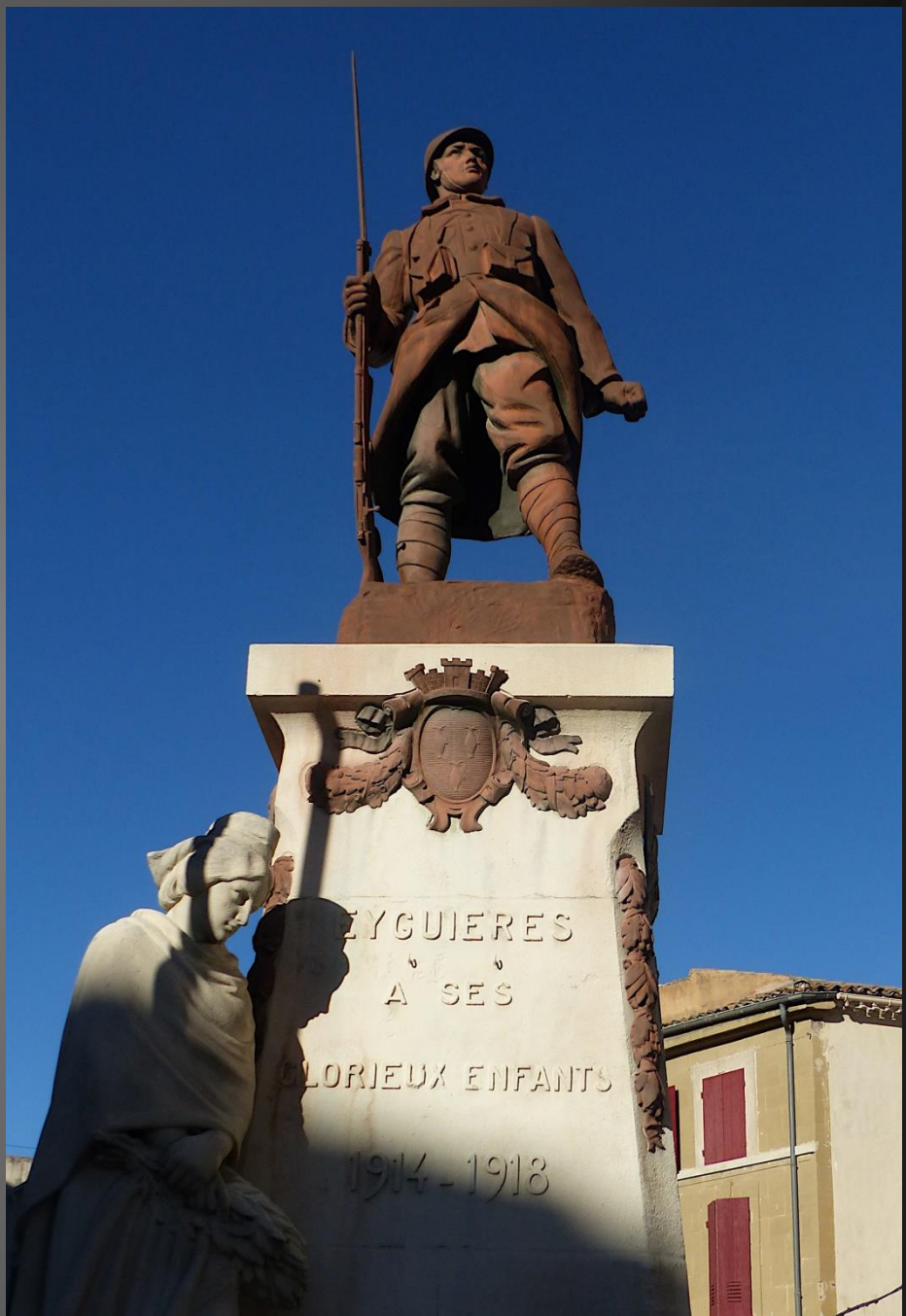
A côté de l'église Notre-Dame-de- Grâce, le Poilu de la Grande Guerre monte la garde sur le Monument aux Morts érigé vers 1921, les yeux rivés sur la « ligne bleue » des Vosges ...