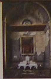
Chapelle du Purgatoire

Le saint est représenté avec son chien portant un pain dans sa gueule. On reconnaît en lui, le protecteur de la peste. Une chapelle lui fut dédiée à Eyguières en 1725.