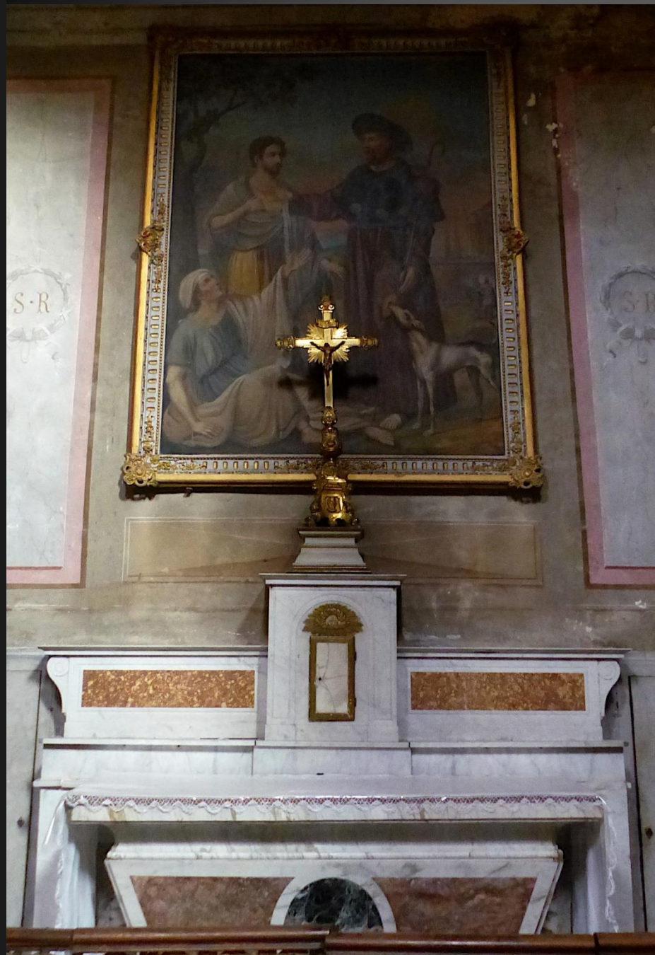
Chapelle dédiée à saint Roch en 1725.