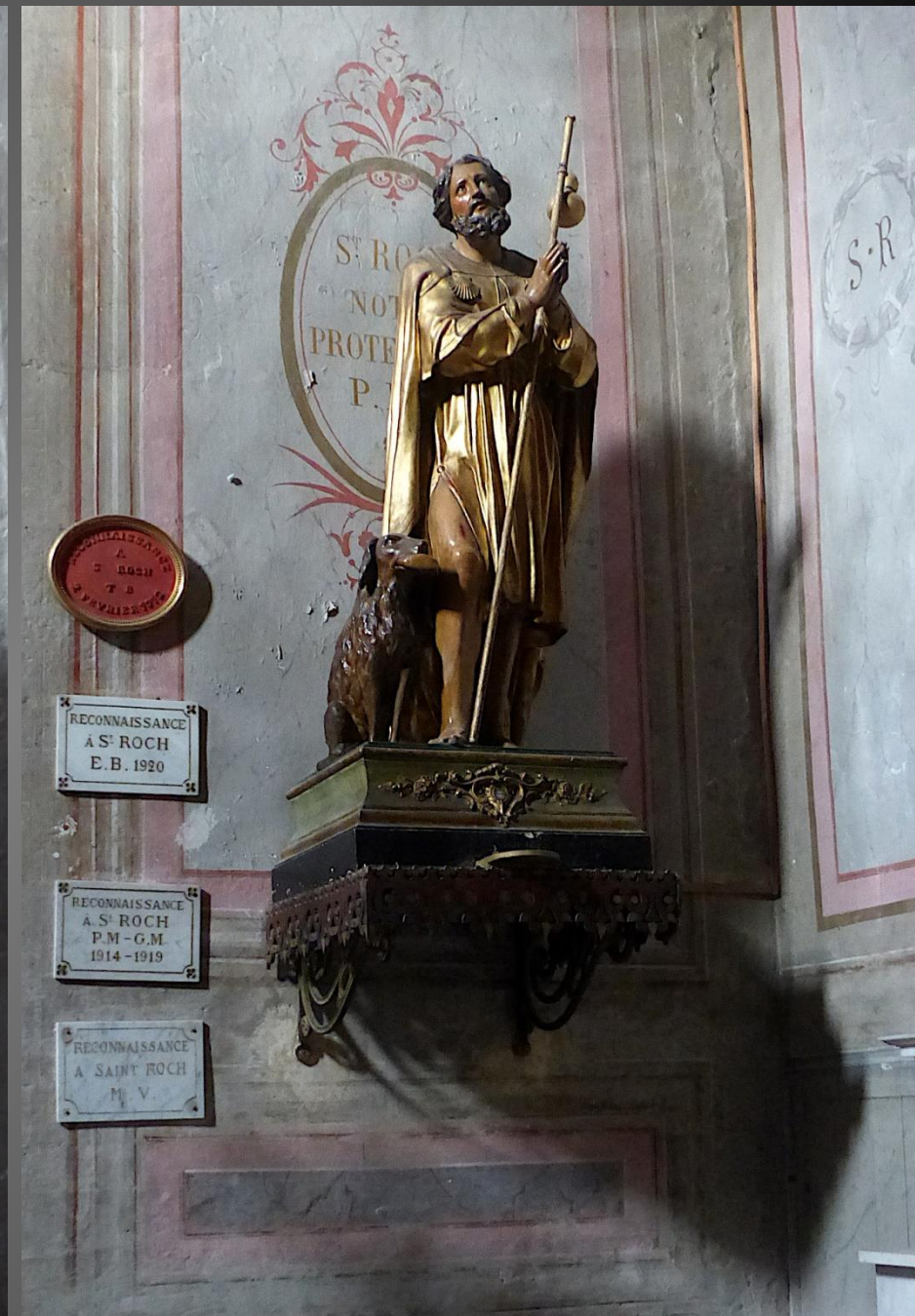
Statue de saint Roch, avec son chien, dans la chapelle dédiée à Roch de Montpellier. Le culte de saint Roch est, de nos jours, toujours lié à ses vertus de thaumaturge, notamment lors des grandes épidémies.