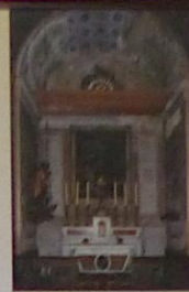
Chapelle de saint Roch

Sainte vénérée en Corse, vierge martyre qui était invoquée pour la délivrance des femmes en couches. A gauche, saint Blaise, à droite saint Symphorien.