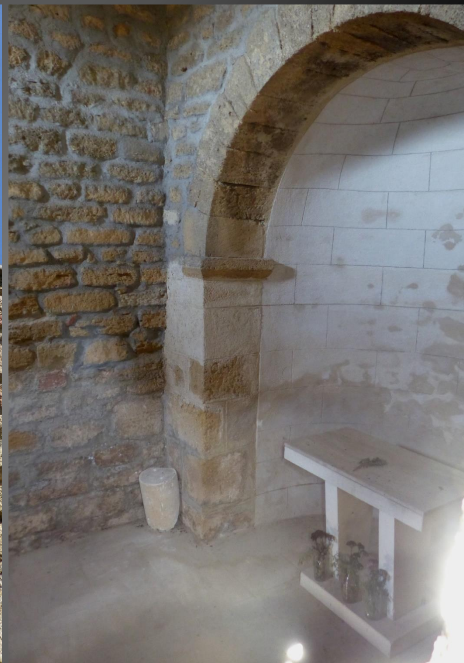
ISTRES Chapelle Saint-Michel _ Rien n'est certain au sujet de l'ancienneté de la chapelle, sinon qu'elle est citée dans des documents du XI e siècle sous le nom d' " église de Vulturne "; à moins que cette expression ne désigne une autre chapelle toute proche, dédiée à Saint-Etienne et implantée en contrebas sur le flanc de la colline. " Vulturno " est également le nom du plateau sur laquelle elle est construite.