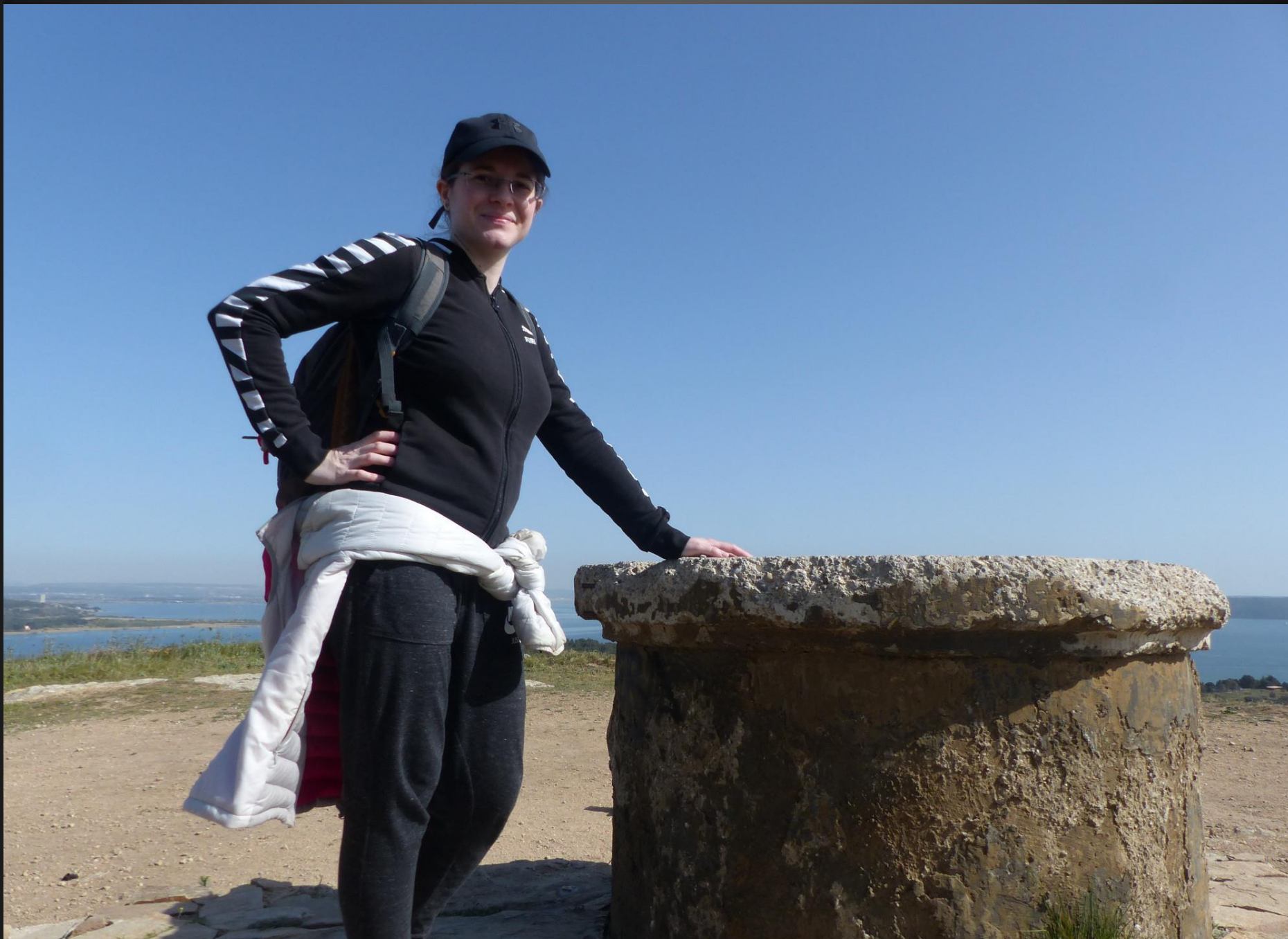
ISTRES _ Vue sur les étangs.