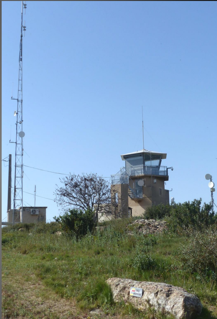
ISTRES Chapelle Saint-Michel _ Promenade autour de la vigie, à deux pas de la chapelle.