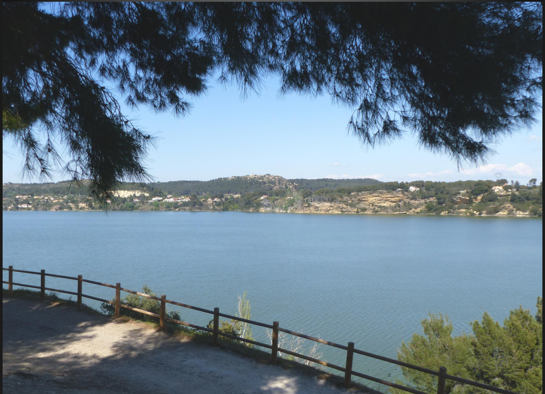
ÉTANG DE L'OLIVIER _ La marche autour de l'étang sur un sentier aménagé (10,7 km) est un exercice apprécié des Istréens.