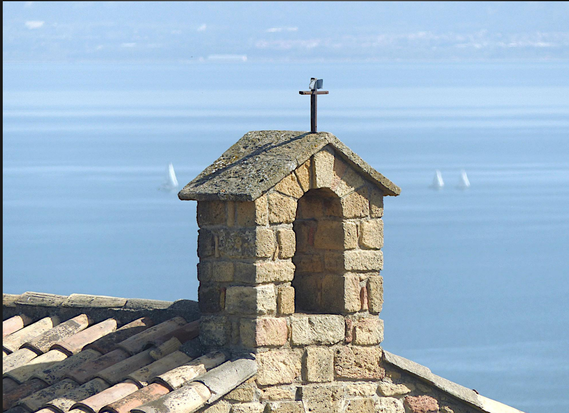
ISTRES Chapelle Saint-Michel _ Quand les voiliers semblent croiser le clocheton dans le ciel.