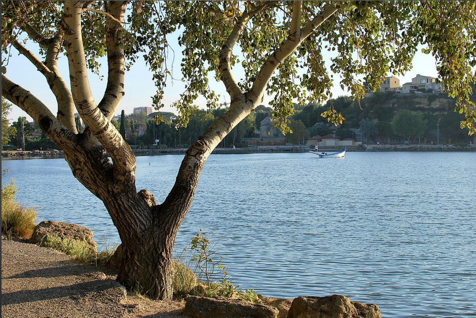
ETANG DE L'OLIVIER _ Promenade autour de l'étang.