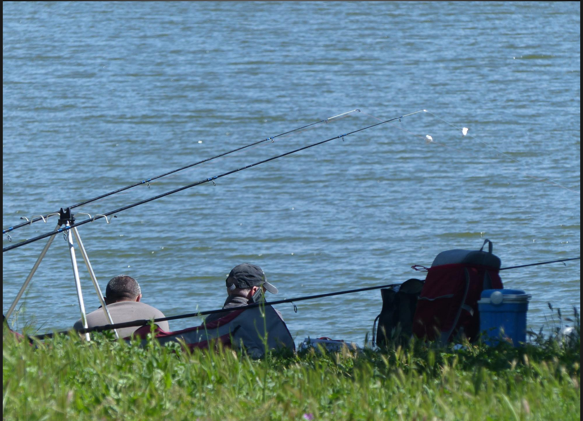
ETANG DE L'OLIVIER _ la pêche à la ligne est un exercice de patience ...