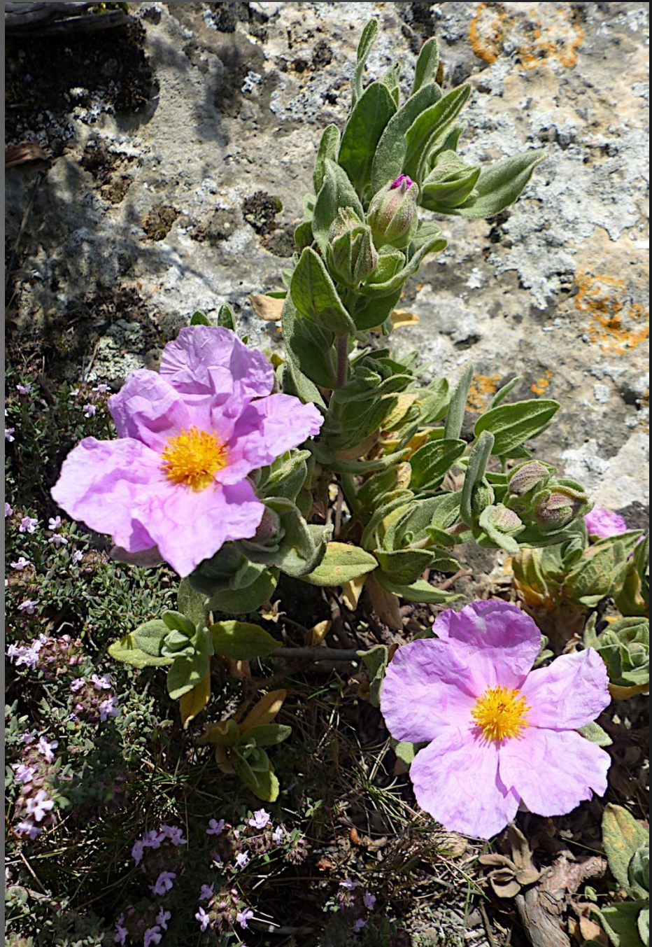
ISTRES Chapelle Michel _ Promenade reposante au milieu des fleurs sauvages..