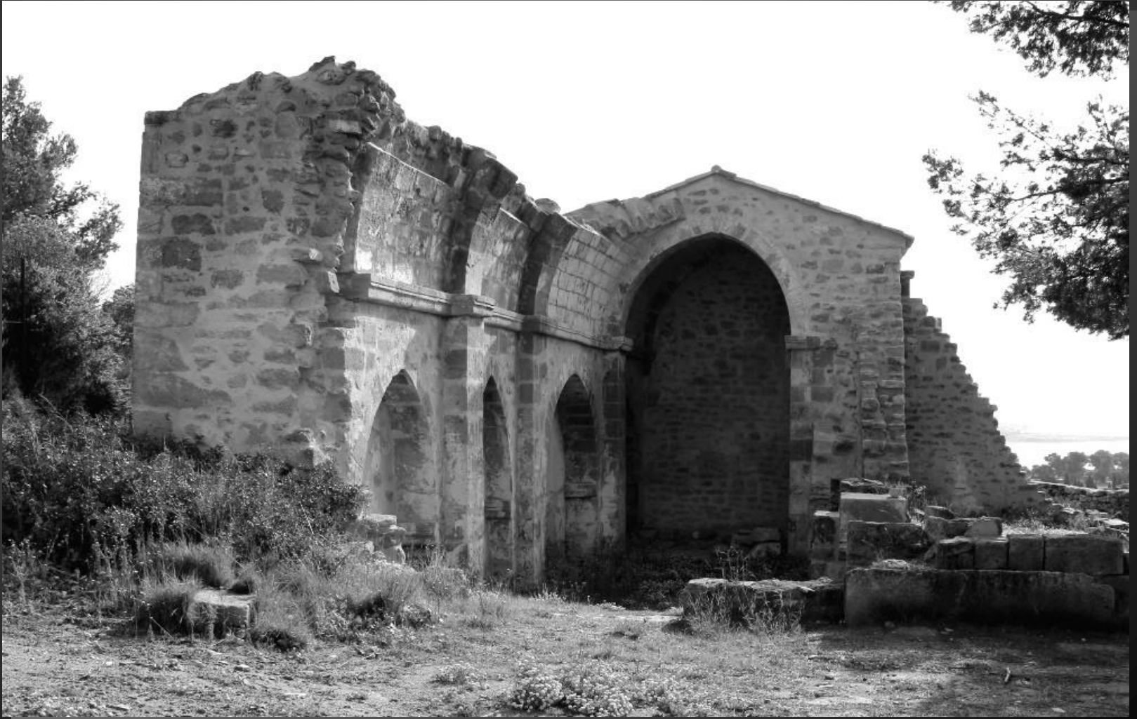
Chapelle Saint-Etienne _ L'association Saint Etienne Renaissance a travaillé sur sa restauration.