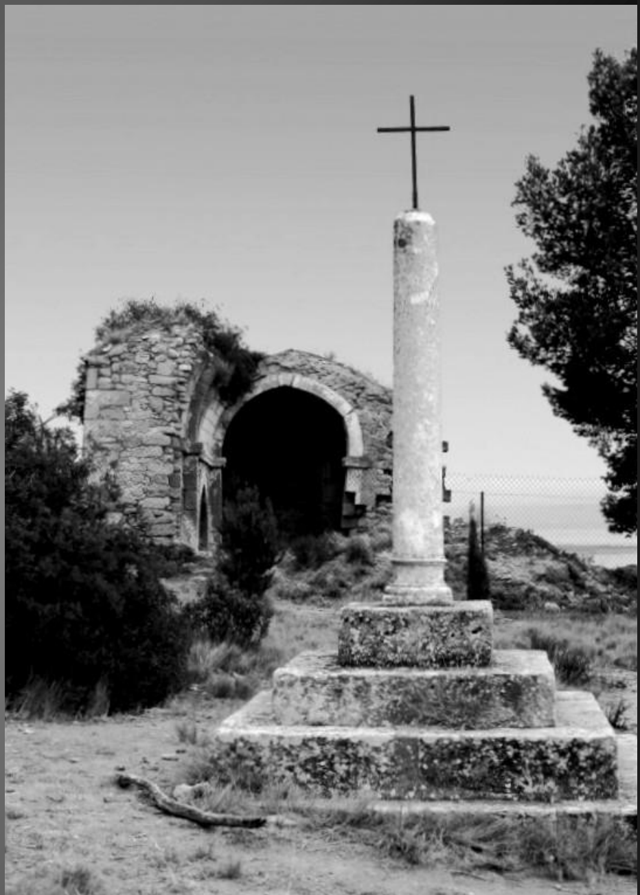
Chapelle Saint-Etienne _ Chantier de restauration, du 06 jan au 30 avr 2016, pour sauver de la ruine les restes de cette petite chapelle. Techniques utilisées : – Etalement par contrefort en bois des faces Sud et Est du Chœur – Dépose et repose de l’arc doubleau entre la nef et le Chœur – Dépose et repose à 50% du parement extérieur du mur Sud du Chœur – Réalisation à neuf d’une toiture en tuiles canal sur mortier de chaux – Reprise des joints et réfection des arases de mur.