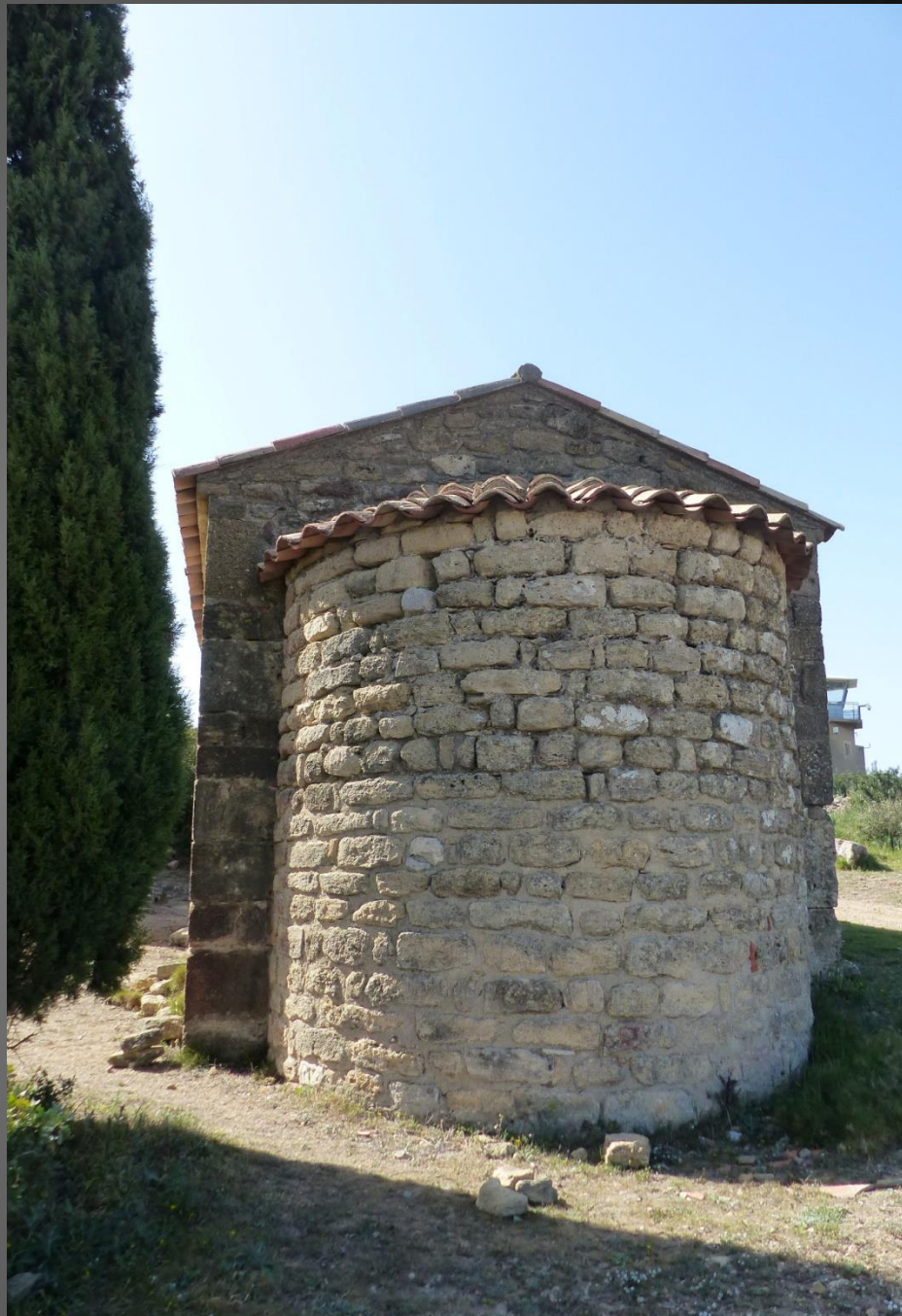
ISTRES Chapelle Saint-Michel _ Toute simple et faite de pierres scellées, son plan rectangulaire est complété par une abside en cul-de-four. Sa façade est percée d'un oculus et rehaussée par un clocher-mur.