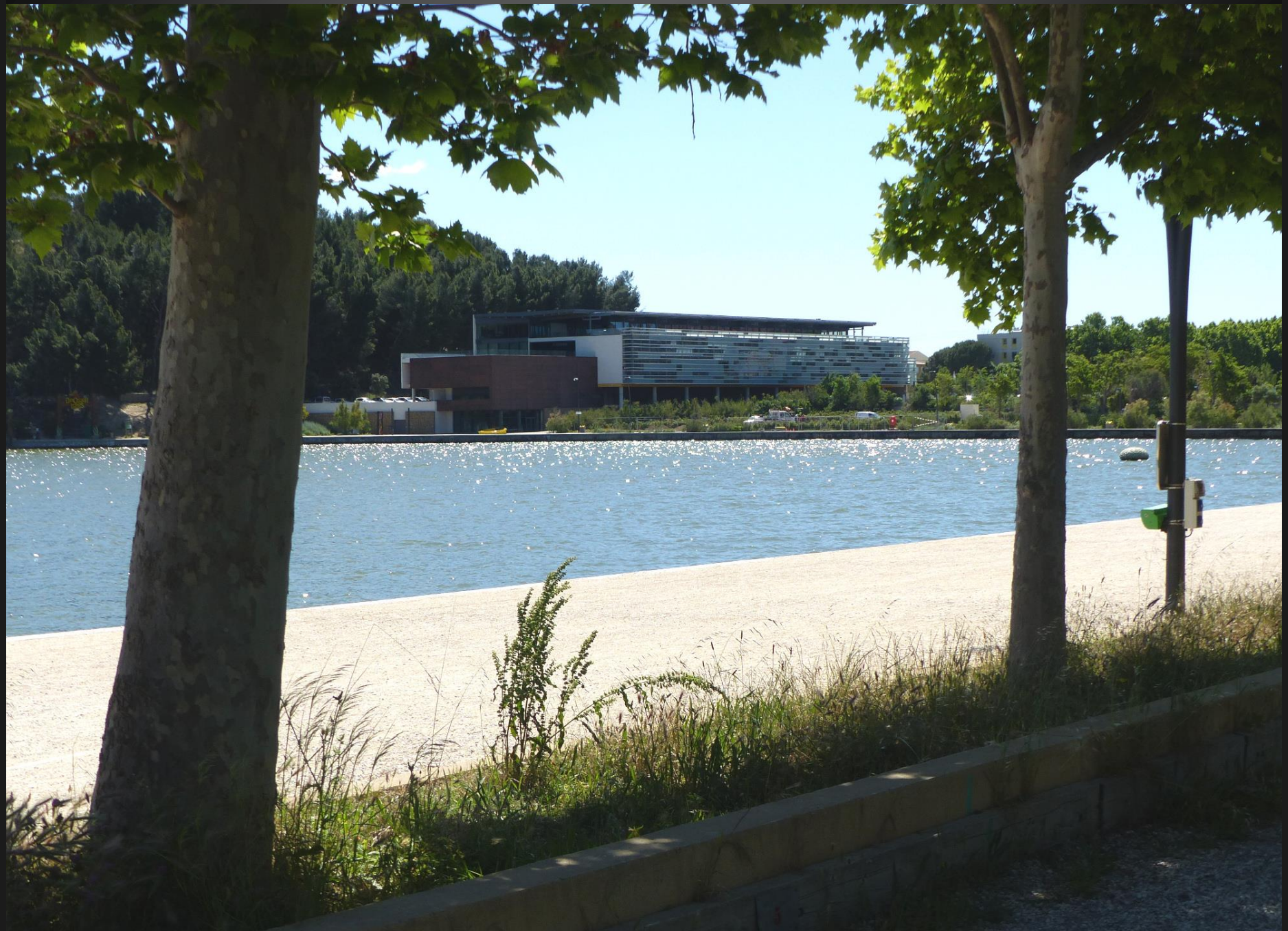
ETANG DE L'OLIVIER _ Vue de l'Hôtel de Ville d'Istres en bordure de l'étang et au pied de la colline du Castillon.