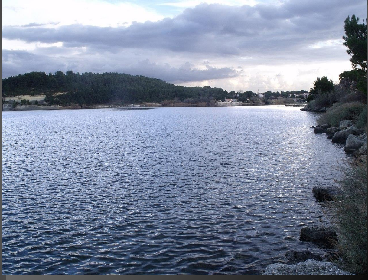
ETANG DE L'OLIVIER _ Les oiseaux sont les mêmes que ceux rencontrés sur l'étang de Berre.