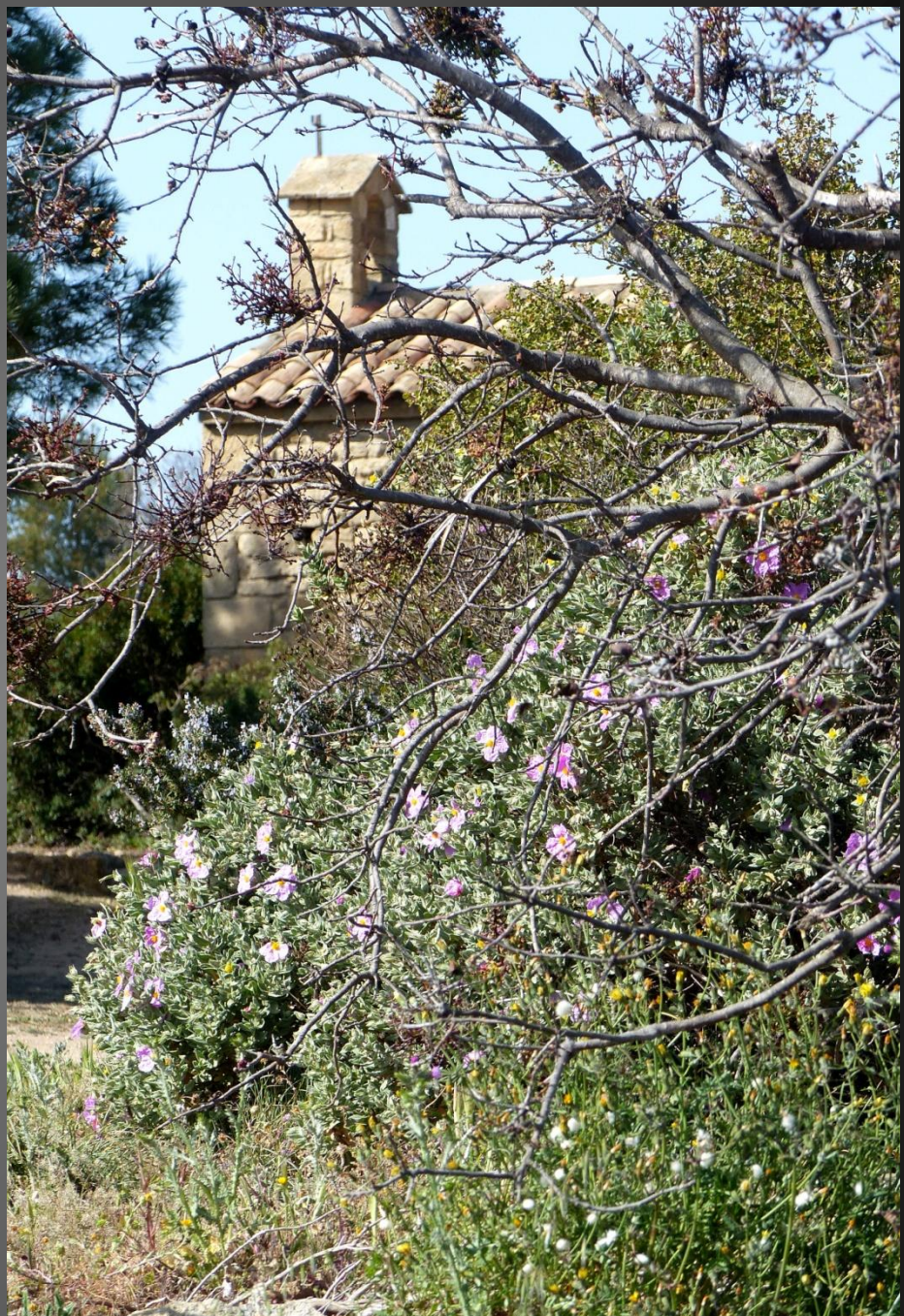
ISTRES chapelle Saint Michel _ Lieu où les Istréens fêtent la Saint-Jean depuis 1989.