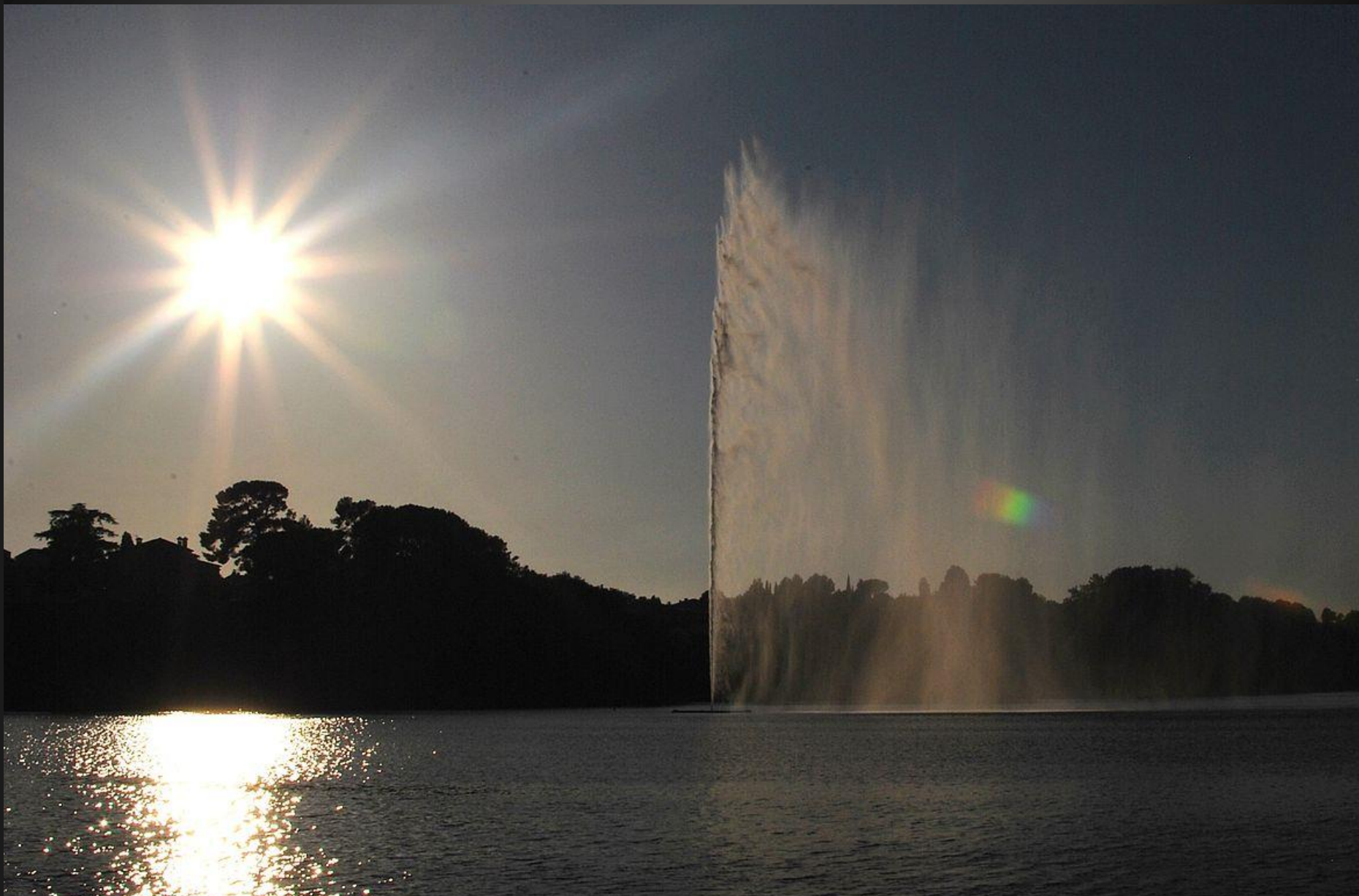
ETANG DE L'OLIVIER _ Le jet d'eau, à contrejour (image du web). C'est le plus septentrional du chapelet d'étangs situés entre le bras oriental du Rhône et la grande lagune de 15 000 ha que forme l'étang de Berre. Il est dans une grande cuvette ovale, longue de 2,5 km et large de 1,5 km au nord de la ville d'Istres. Au sud de l'étang, s'avance un éperon rocheux en safre sur lequel est implanté le petit oppidum du Castellan, qui n'a guère été fouillé. Il possède, selon Bernard Bouloumié « les mêmes caractéristiques que l'oppidum de Saint-Blaise, distant de 7 km, puisqu'on y retrouve des documents étrusques archaïques ». Le pourtour de l'étang est constitué de roselières, où les oiseaux viennent nicher et se reproduire. Il était autrefois entouré de vignes et d'oliviers. La végétation est composée d' interomorpha intestinalis , de ruppia maritima , de chaetomorpha spiralis , de zostera , de gobius microps KR et de monocotylédones, comme l' asphodelus ayardii , qui servaient dans l'Antiquité à fleurir les tombes des morts. Source : https://fr.wikipedia.org/wiki/Étang_de_l'Olivier