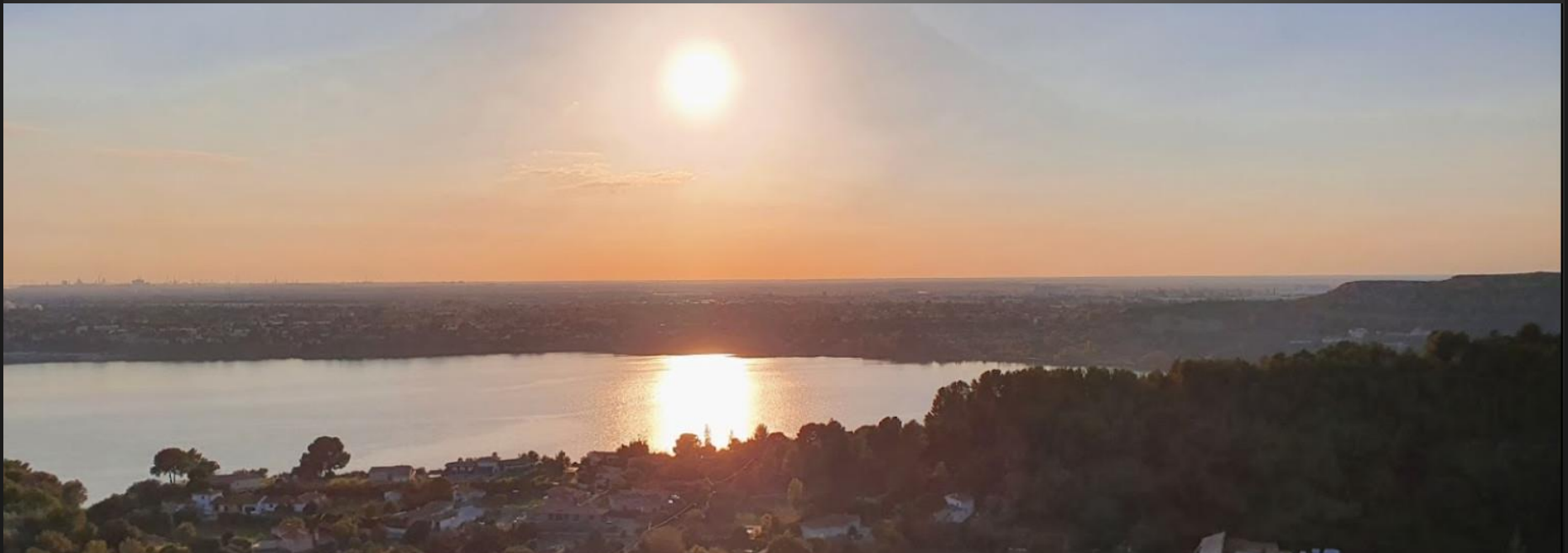
ISTRES Chapelle Michel _ Fin de la promenade.