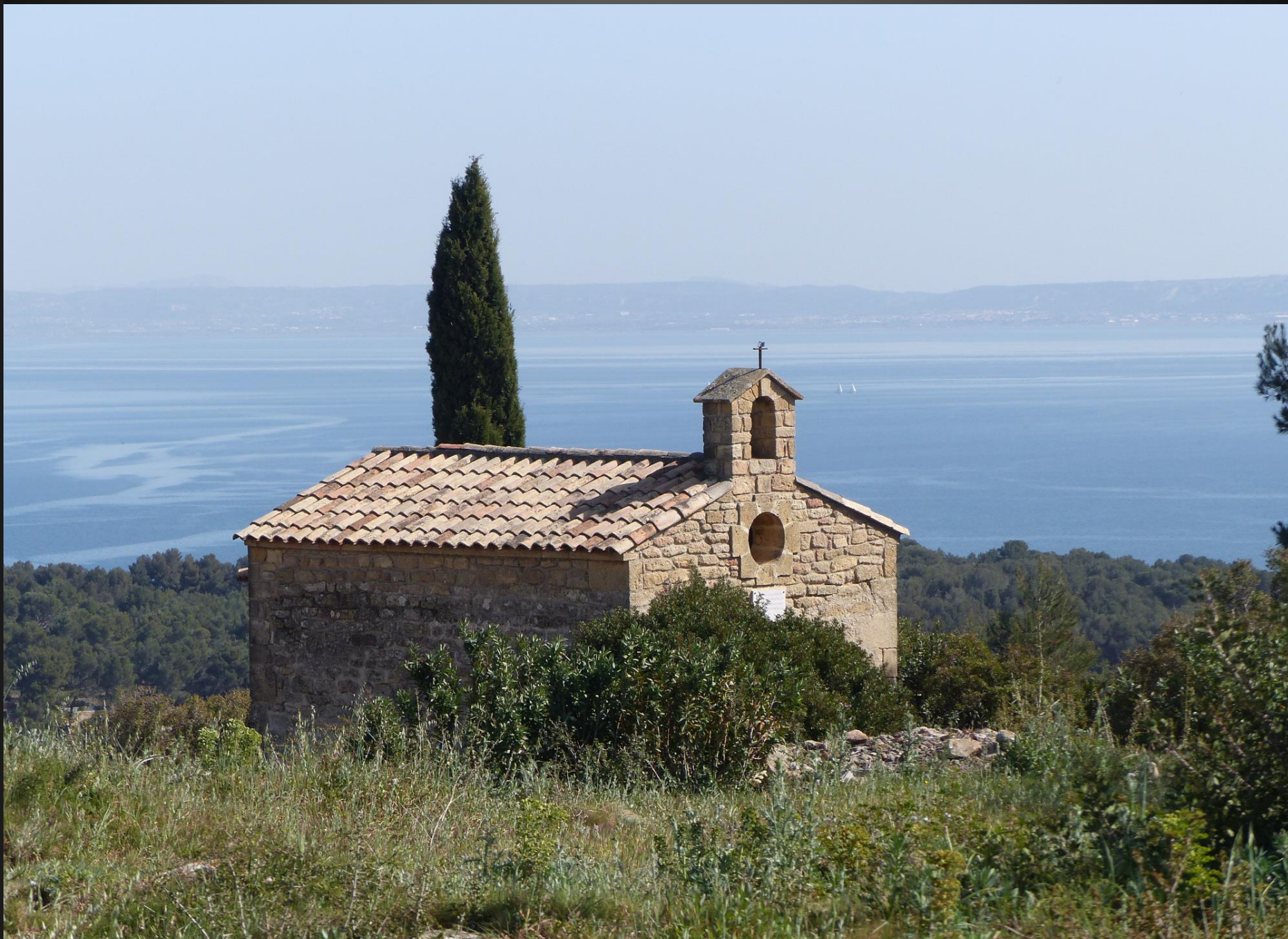
ISTRES Chapelle Saint-Michel _ Au pied de la chapelle, une vue exceptionnelle s'offre au visiteur... L'étang de Berre, l'étang de l'Olivier de l'Olivier et les nombreuses collines istreennes ...