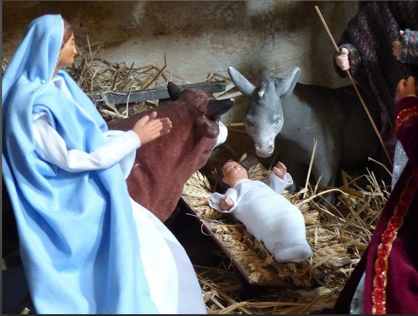
EGLISE NOTRE-DAME DE BEAUVOIR _ La crèche dans la chapelle ... Mario, Jousè e l'Enfantoun coucha dins la grùpi.