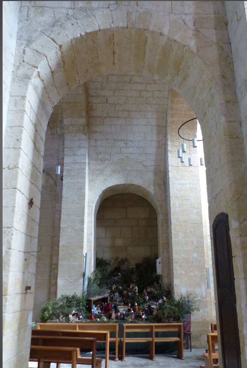
Vue de la crèche de Noël au fond du collatéral gauche.