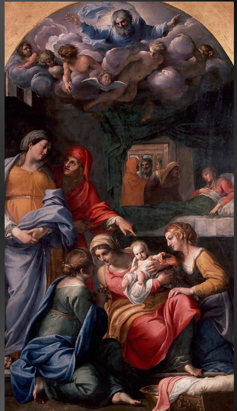
Naissance de la Vierge, par Annibale Carracci (1560-1609), conservé au musée du Louvre.