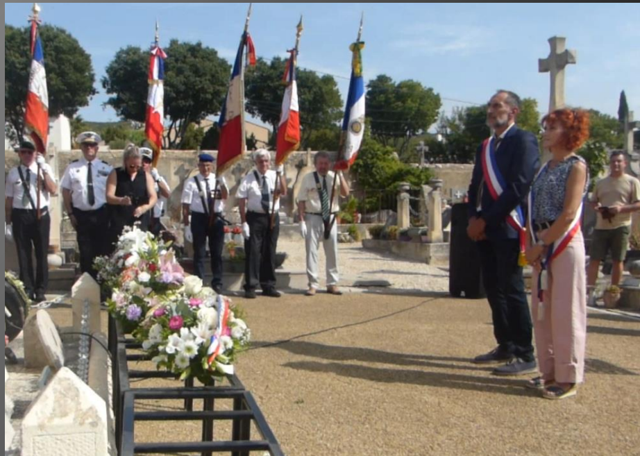
LA FARE _ La gerbe du Maire et du Conseil Municipal.