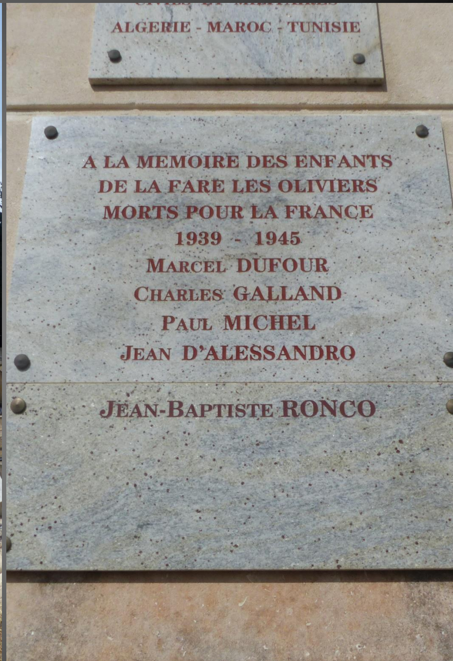
LA FARE_ Le nom de Charles GALLAND est gravé sur une plaque commémorative parmi les Cinq Farencs morts pour la France en 39-45.