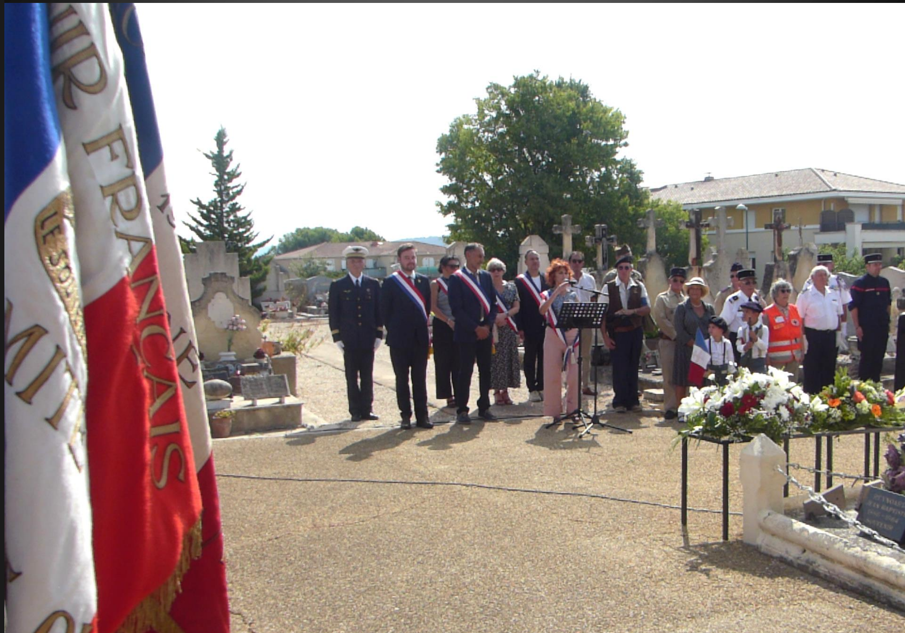
LA FARE _ La cérémonie se termine par les remerciements protocolaires, adressés aux militaires, aux représentants des corps constitués et des associations d'Anciens Combattants, Officiers de la BA 701, corps de sapeurs pompiers de la Vallée de l'Arc et des CCFF, de la gendarmerie et de la police municipale, Souvenir Français sans oublier des reconstituteurs en habits d'époque, venus avec une Jeep Willy de 1944 et une Traction Avant Citroën, et tout le personnel ayant préparé l'évènement.