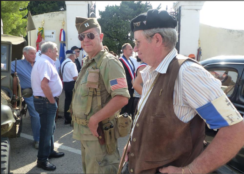
LA FARE_ Jeep « Willy » et Traction Avant Citroën, avec des reconstituteurs pour évoquer la période de l'Occupation et de la Libération.