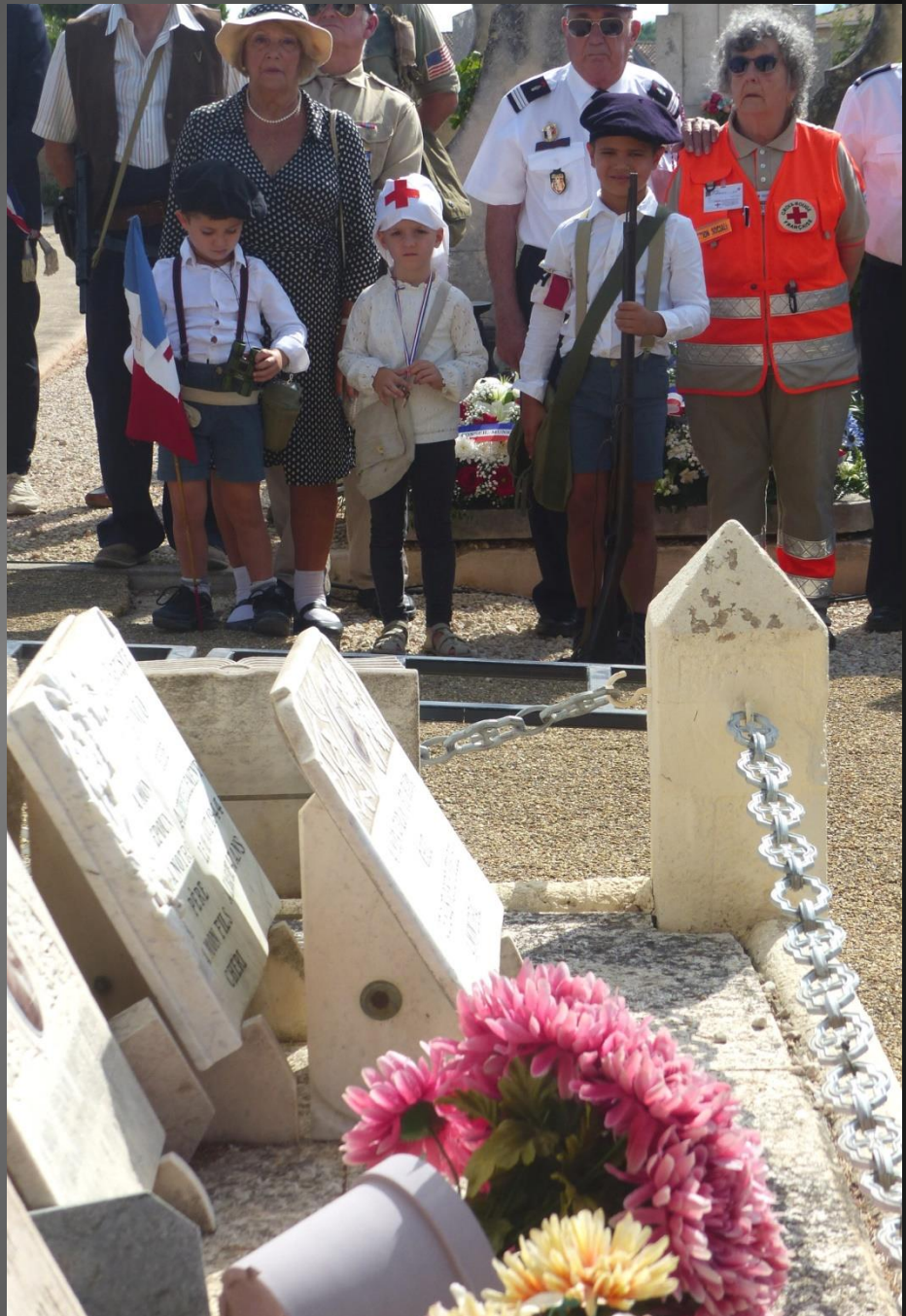
LA FARE _ Les gerbes vont être déposées au pied du monument aux morts.