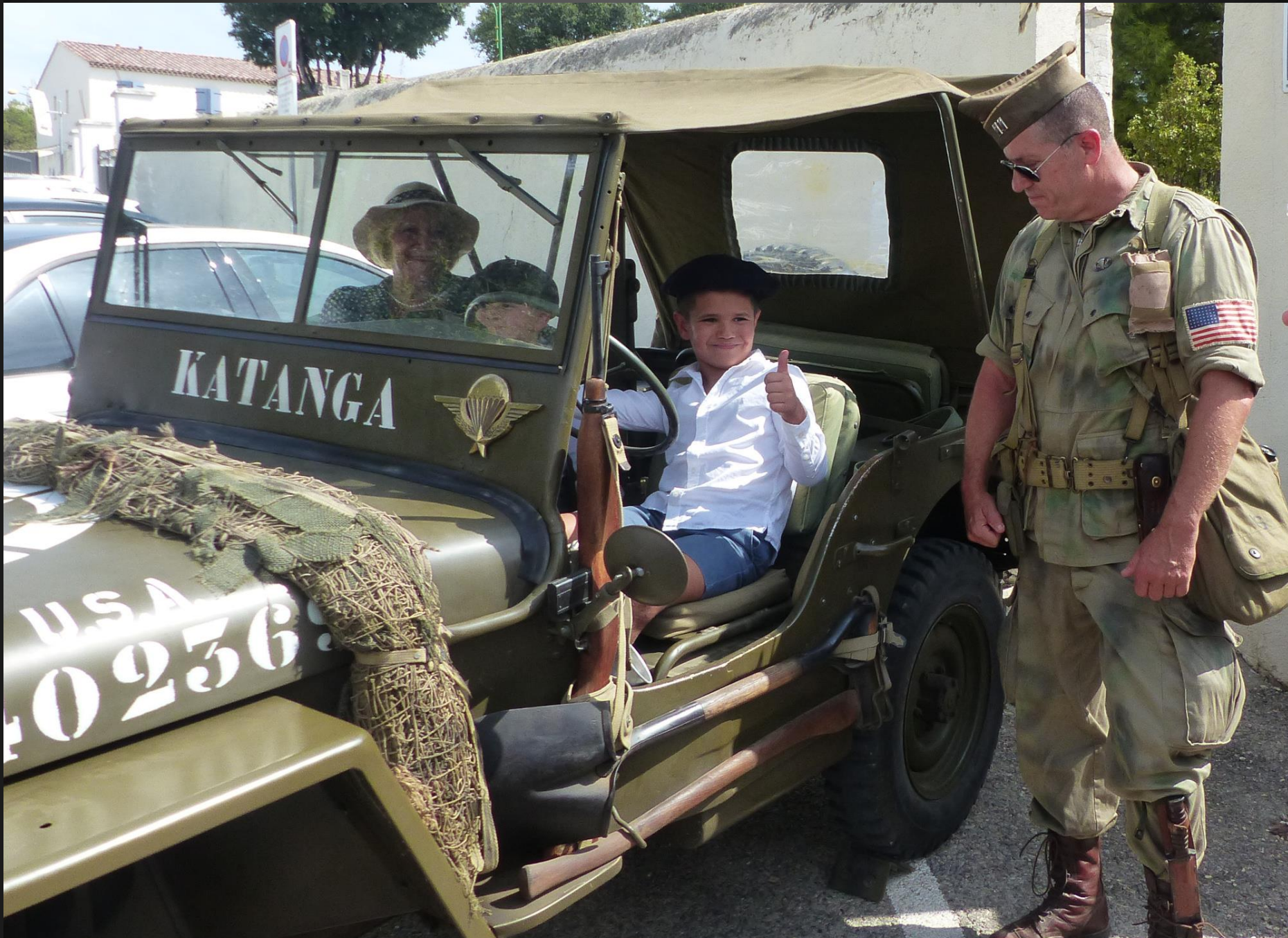
LA FARE _ La nouvelle génération, actuellement à l'école primaire, aura-t-elle à défendre la patrie encore une fois contre des envahisseurs ???