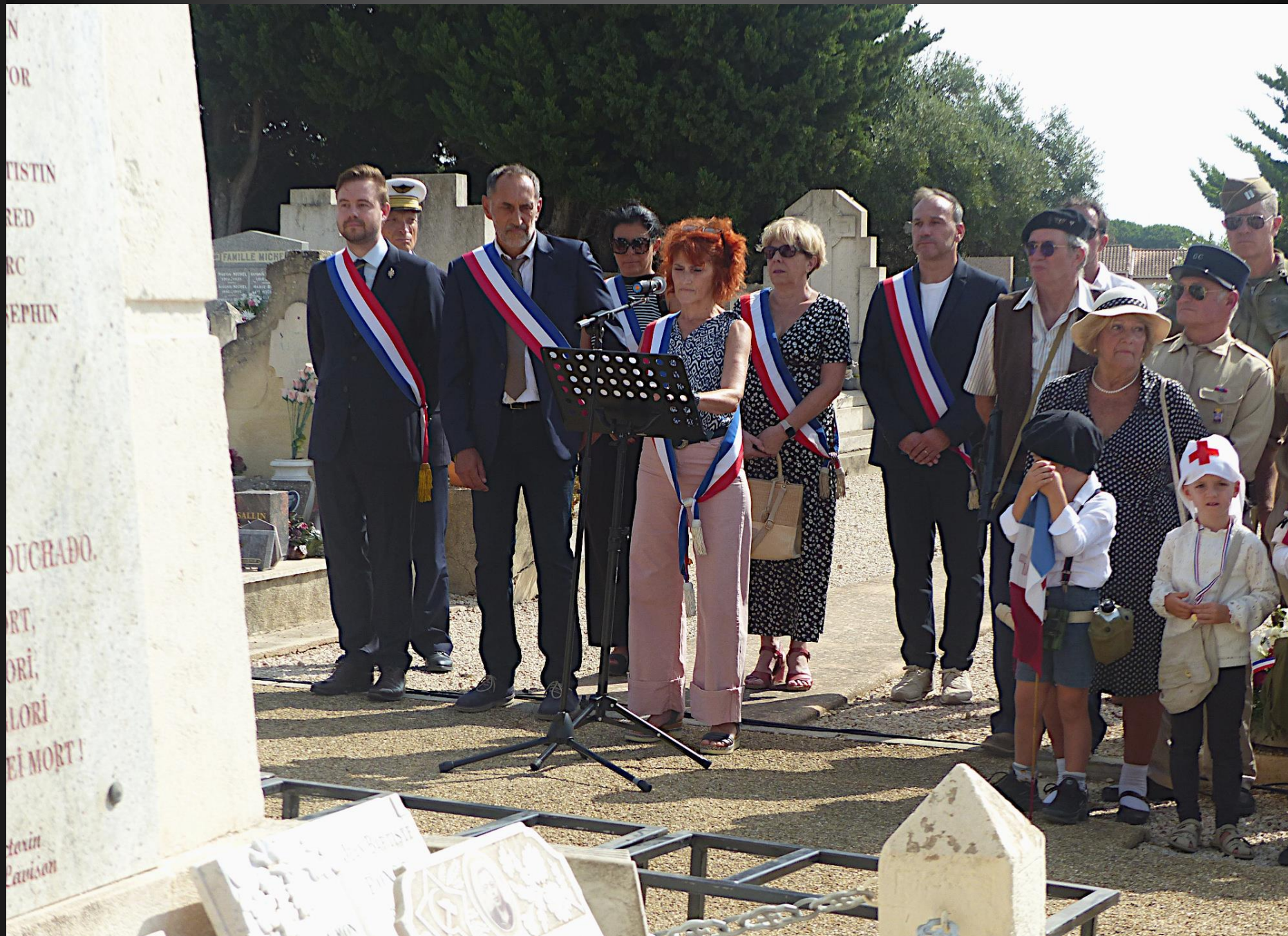
LA FARE _ Un mot d'introduction sur la 2 e Guerre Mondiale, l'Occupation et la Résistance.