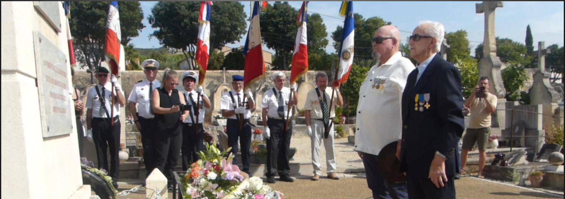
LA FARE _ La gerbe des Anciens Combattants.