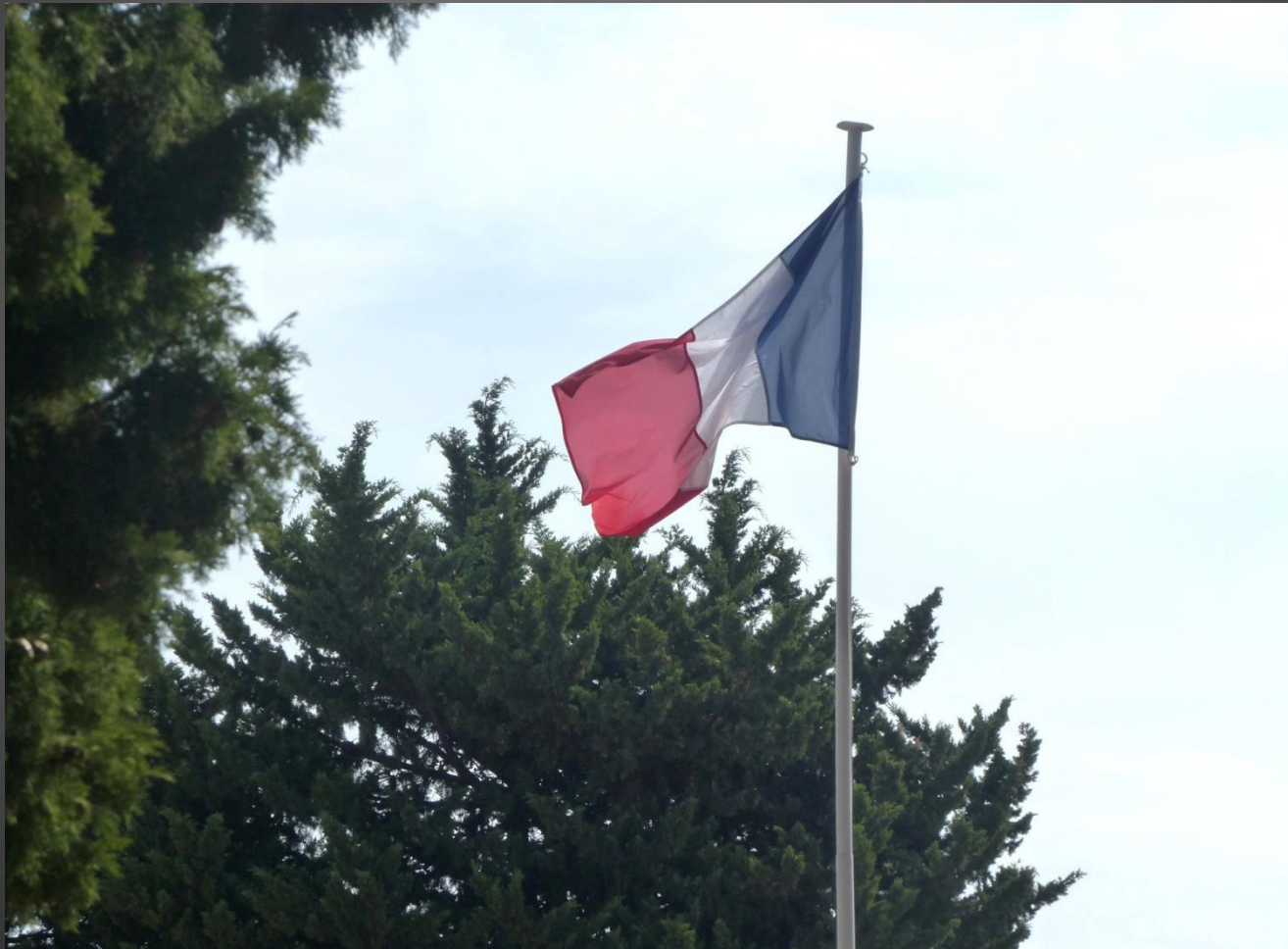
LA FARE _ Le tricolore flotte dans le cimetière, au-dessus du monument aux morts.