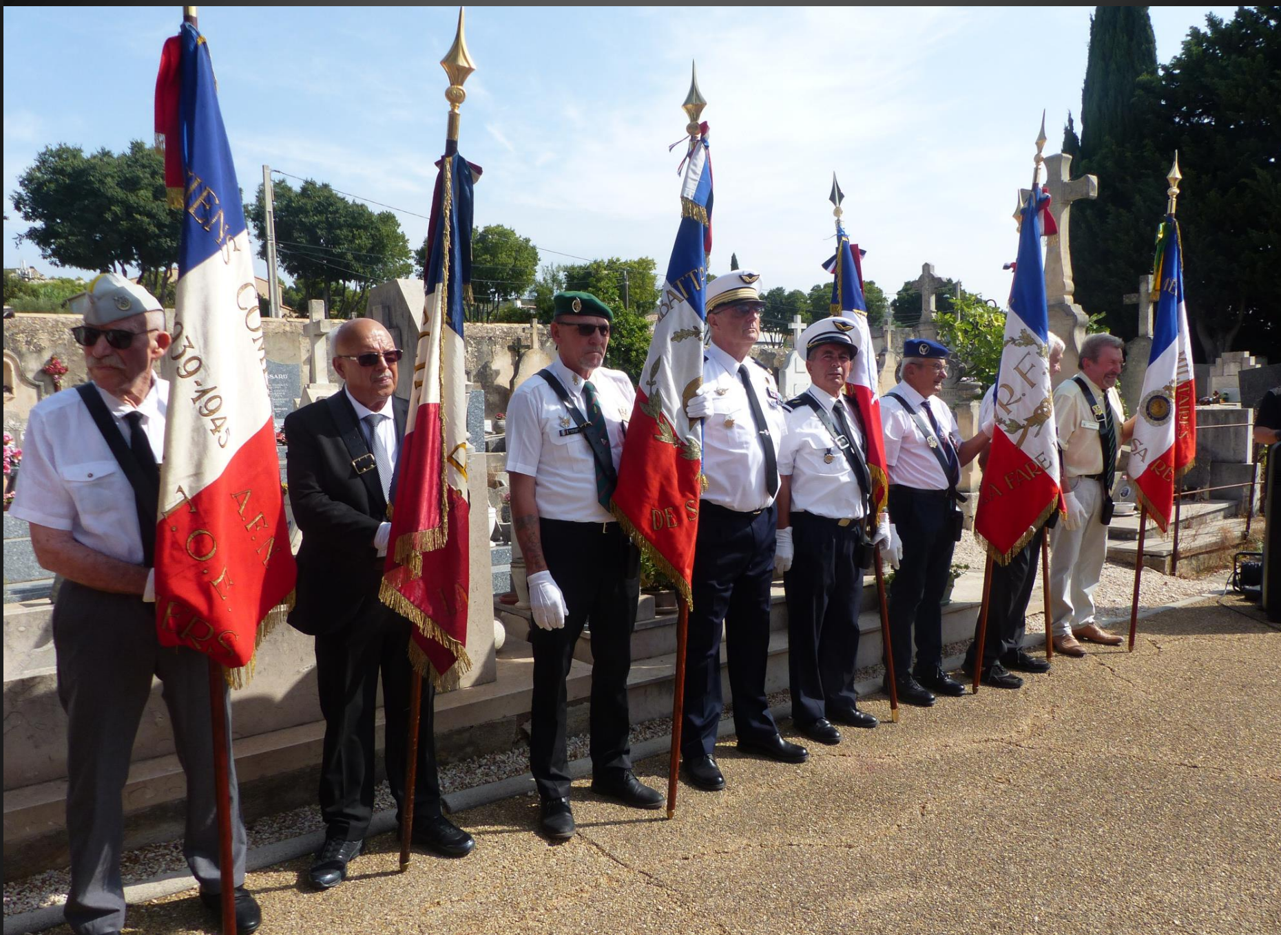
LA FARE _ Les porte-drapeaux étaient au nombre de huit.