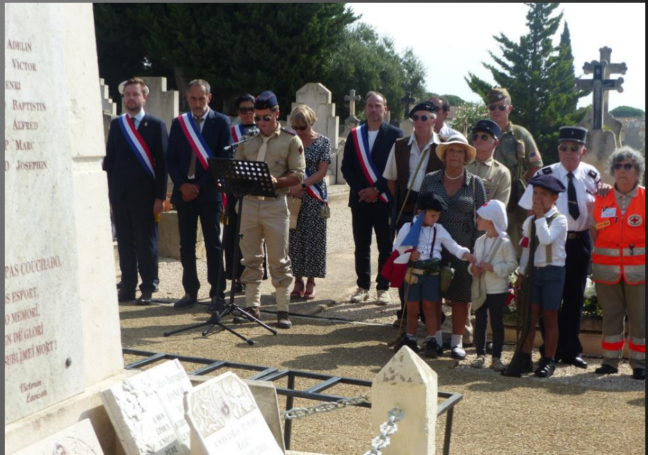
LA FARE _ Anciens et futurs défenseurs de la France sont attentifs.