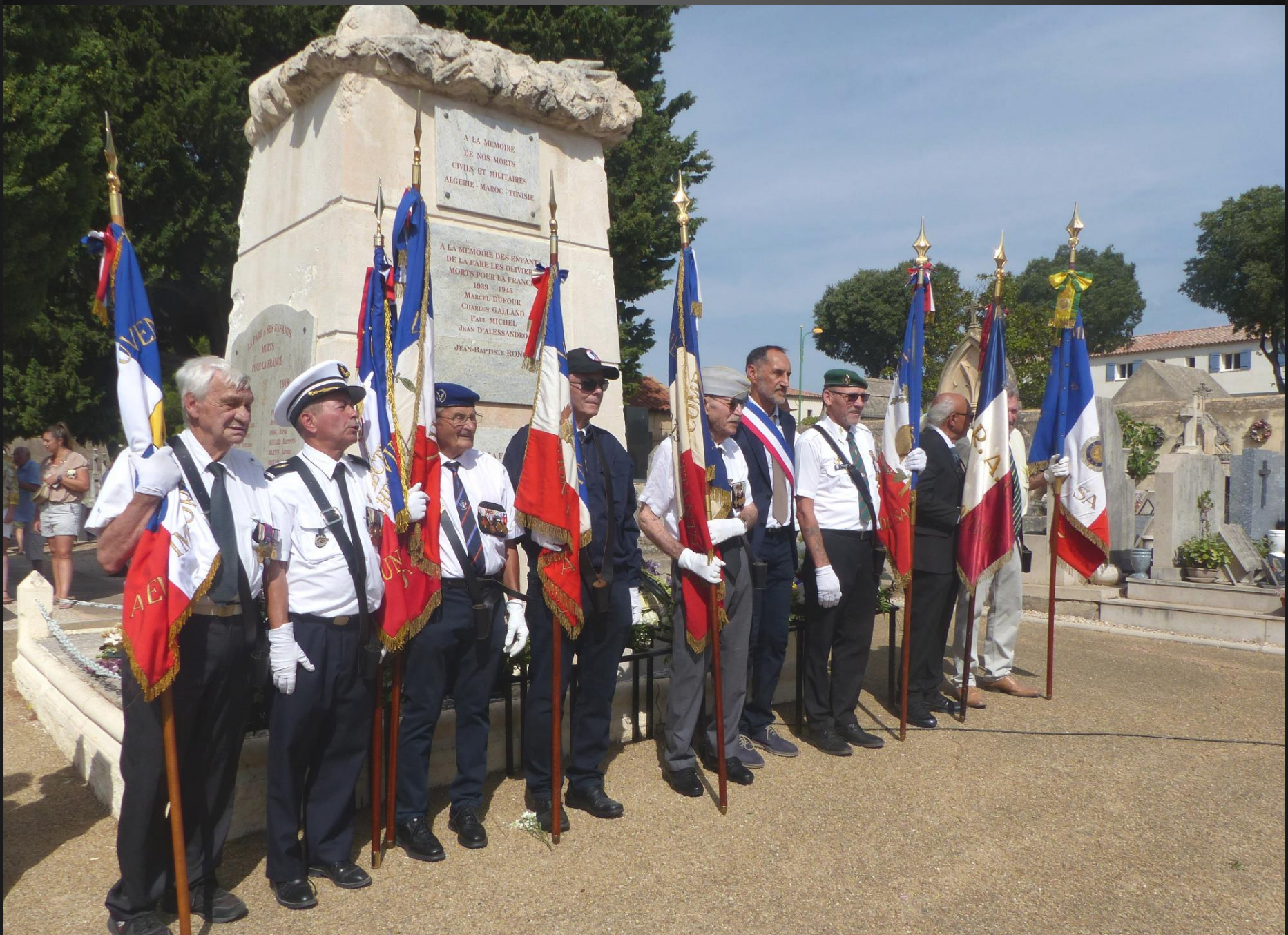
LA FARE _ Séance photo devant le monument aux morts.