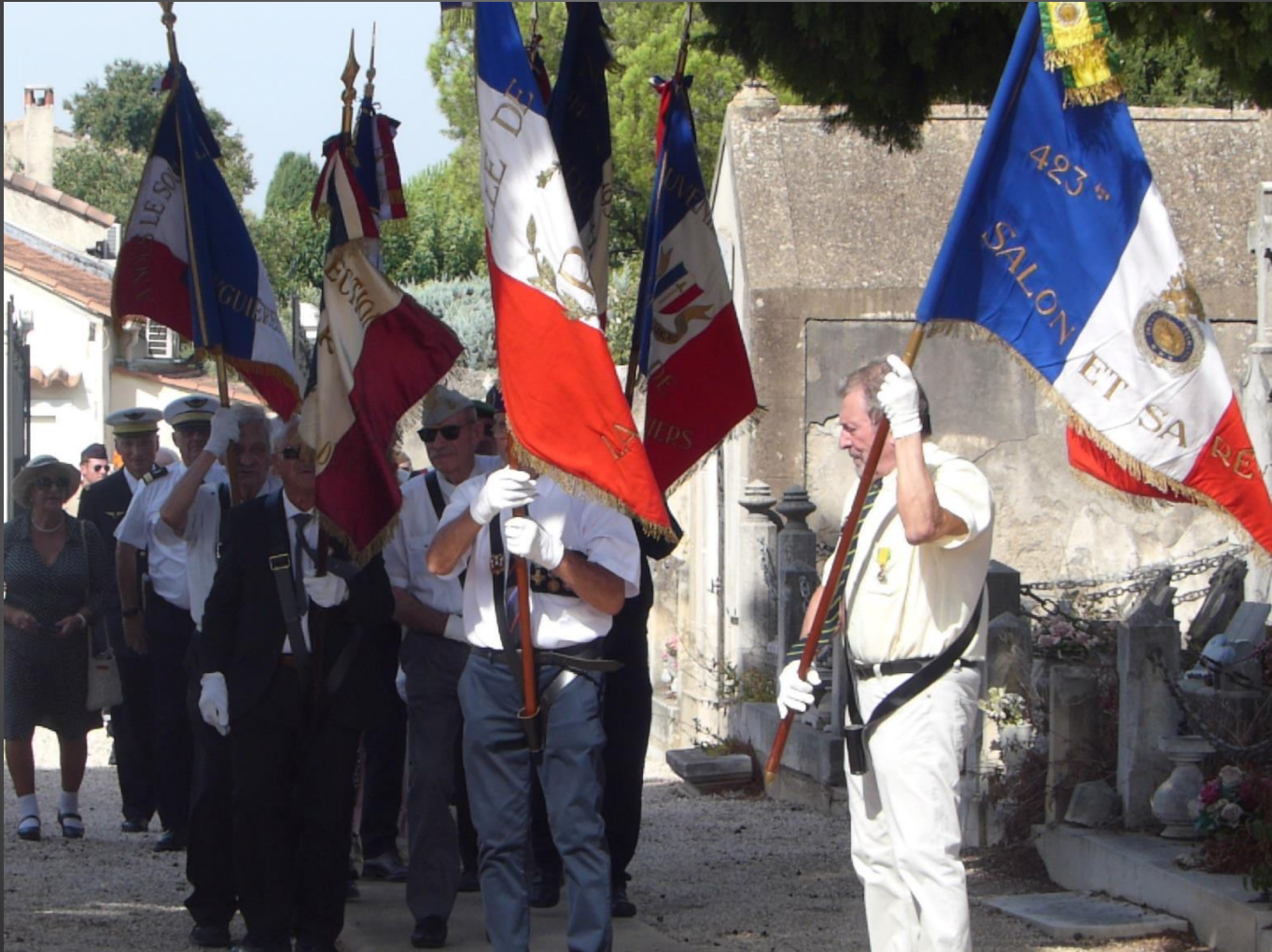
LA FARE _ La procession d'entrée dans le cimetière.