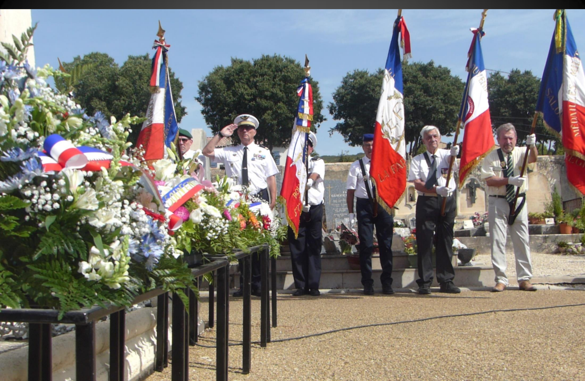
LA FARE_ « Aux Morts ! ». Une minute de silence suivie de la Marseillaise.