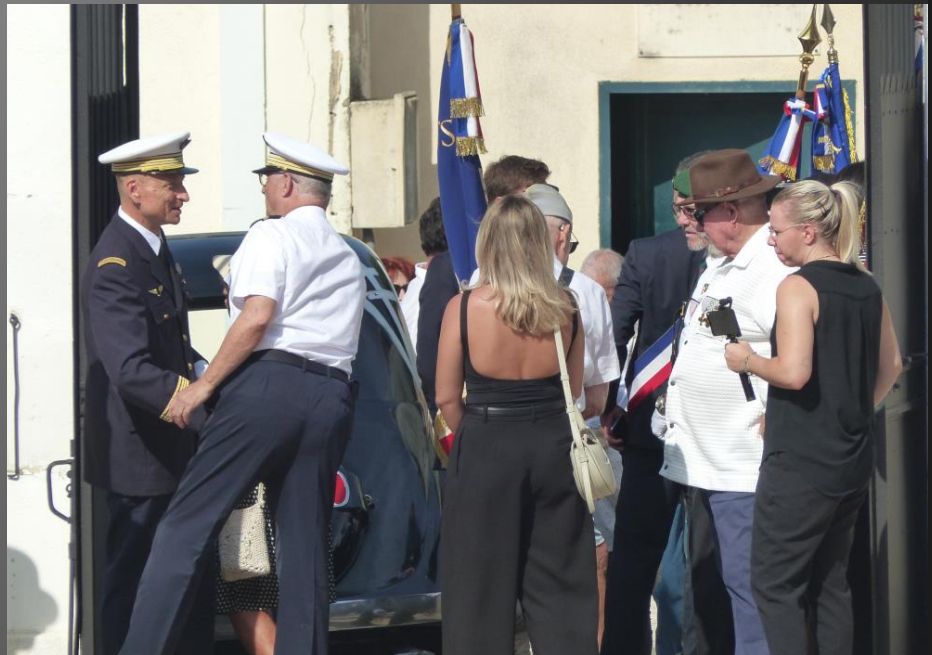
LA FARE _ Rassemblement devant l'entrée du cimetière, avant la cérémonie.