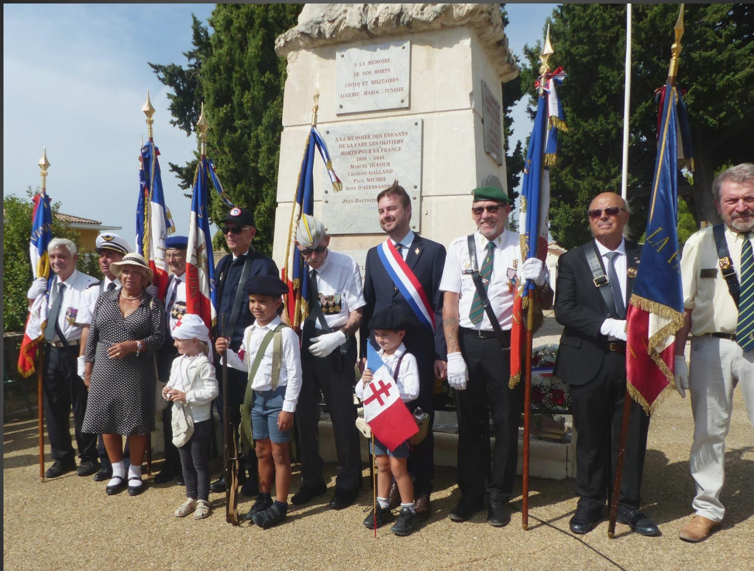
LA FARE _ Le Député de la circonscription, Romain TONUSSI, au milieu des porte-drapeaux et avec les jeunes reconstituteurs. Un vin d'honneur était ensuite offert à la Mairie.