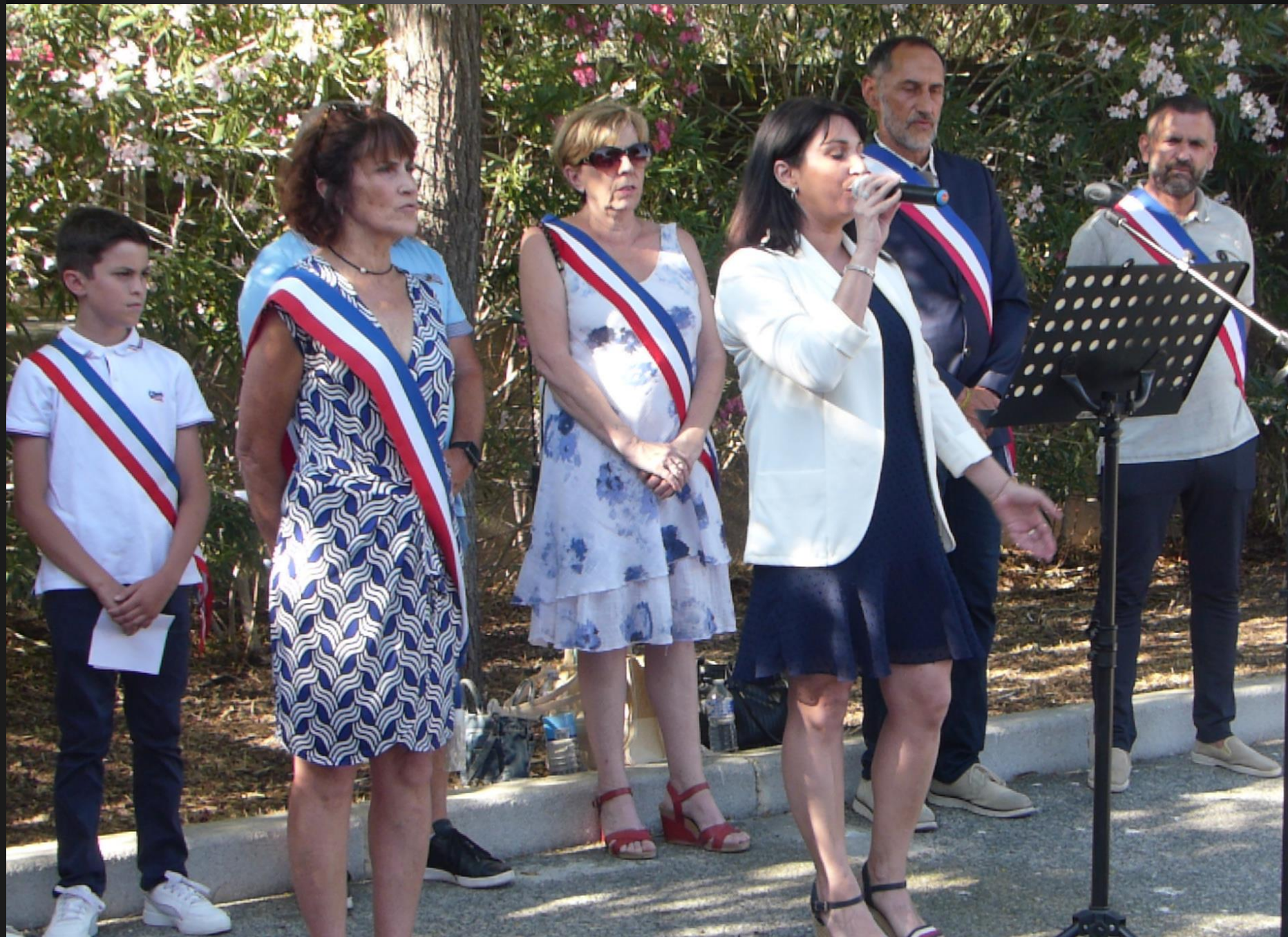
LA FARE_ La « Marseillaise », chantée q capella.