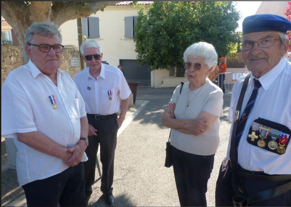
LA FARE_ Il y a régulièrement un représentant de la B.A. 701 de Salon-de-Provence aux commémorations à La Fare.