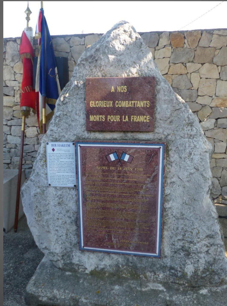
LA FARE _ Stèle en mémoire de l'Appel du Général de Gaulle depuis Londres Le 18 juin 1940.