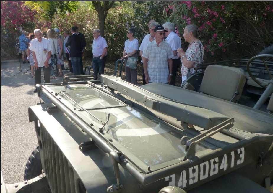
LA FARE _ La cérémonie est terminée.