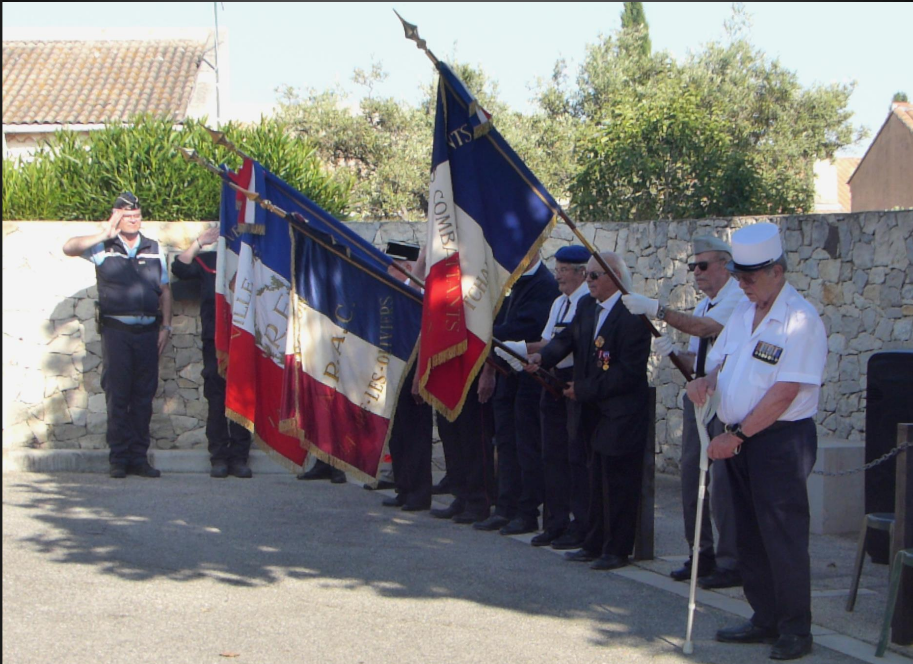
LA FARE _ Sonnerie Aux Morts, suivie d'une minute de silence.