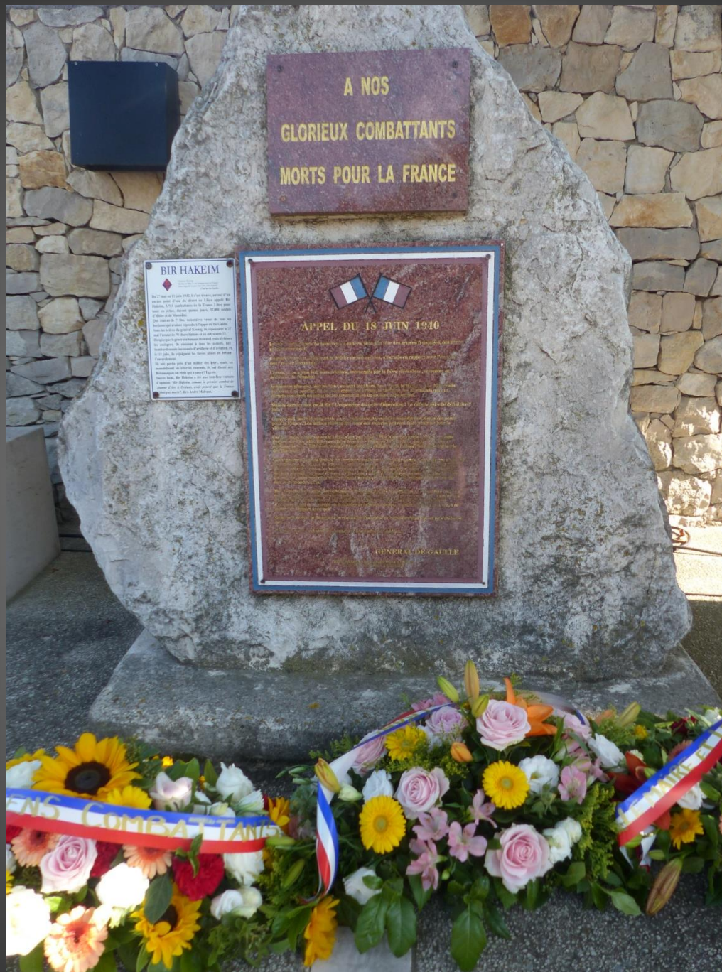
Gerbes de fleurs déposées au pied de la stèle