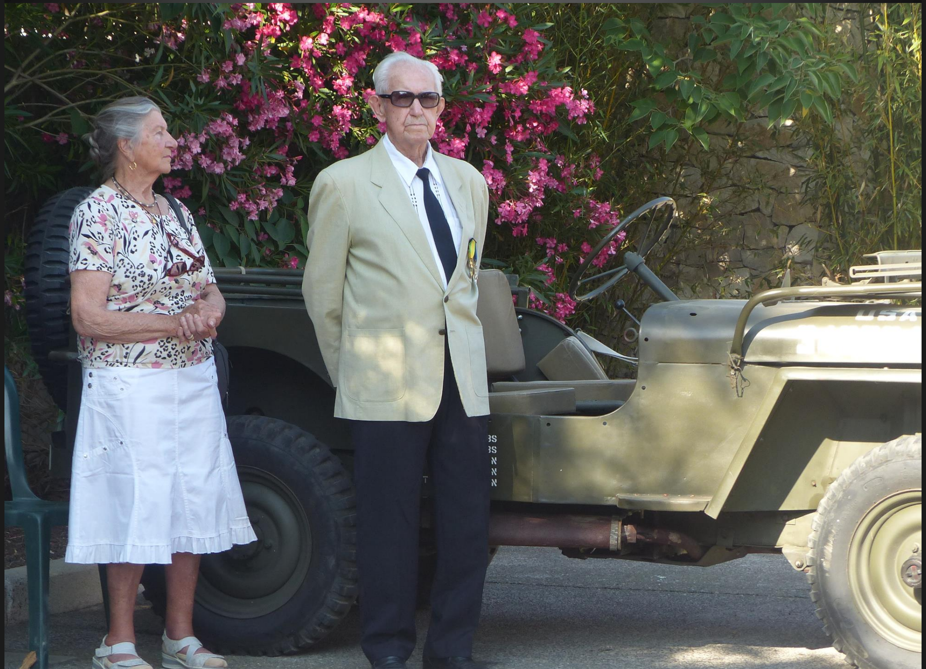
LA FARE _ Un ancien combattant de la Guerre d'Algérie et son épouse.