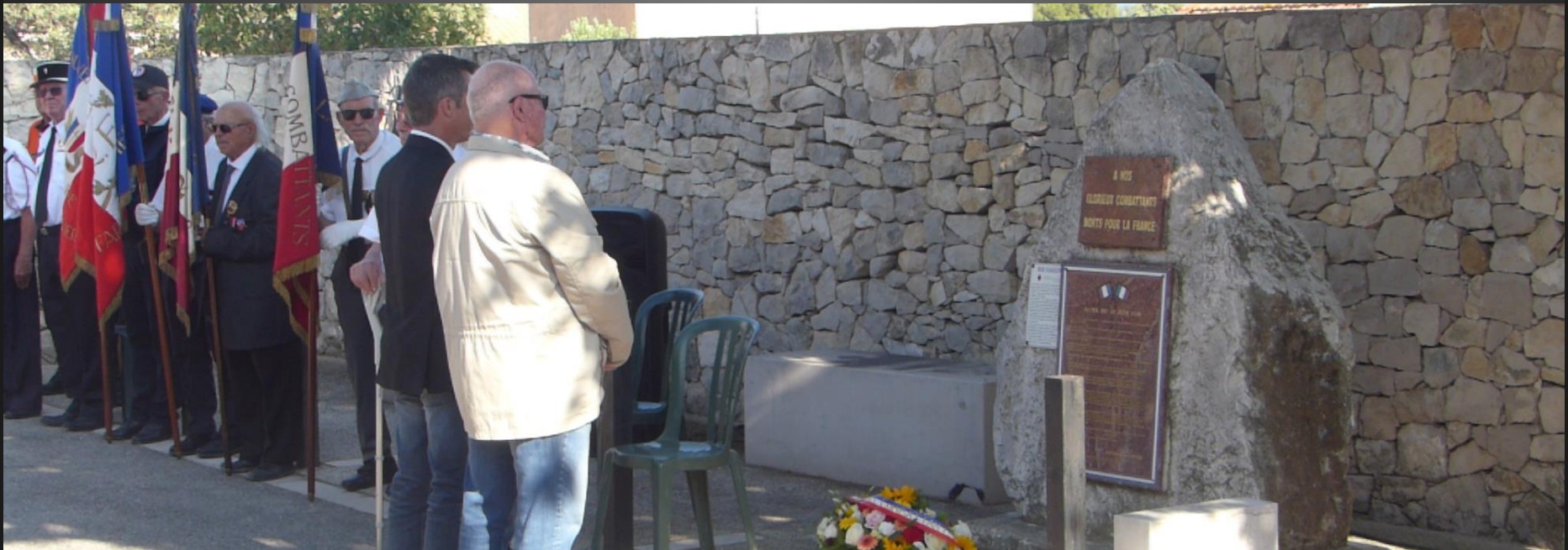
LA FARE _ Dépôt de la gerbe de l'ARAC, Associations des Anciens Combattants.