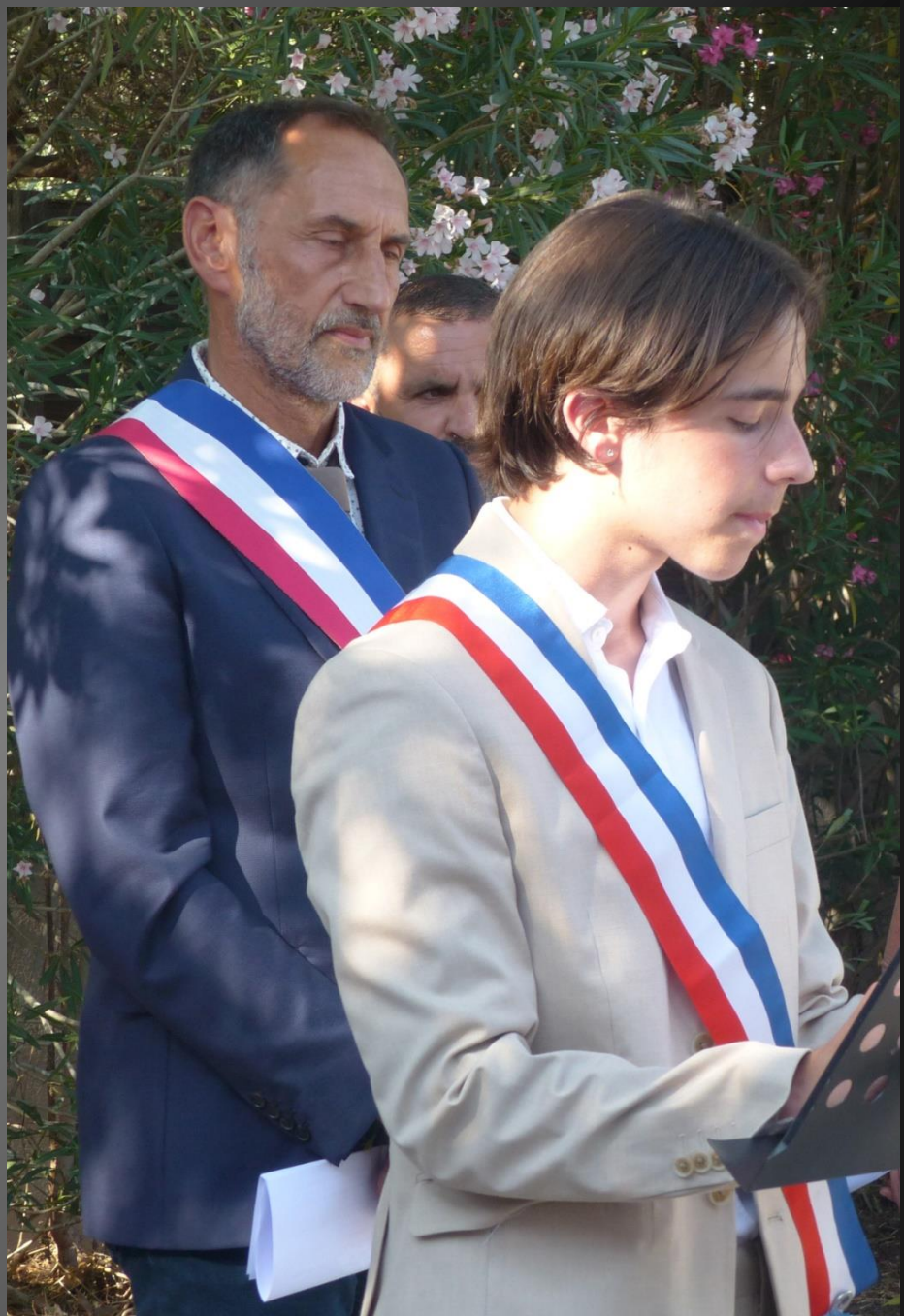
LA FARE _ Deux membres du Conseil Municipal Junior lisent l'Appel du 18 juin 1940.