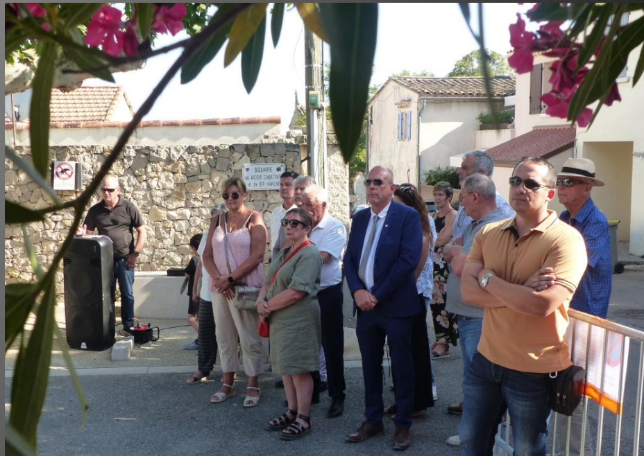
LA FARE_ Tout le monde s'est positionné dans une zone d'ombre, le thermomètre montre régulièrement au-dessus de 35°C l'après-midi.