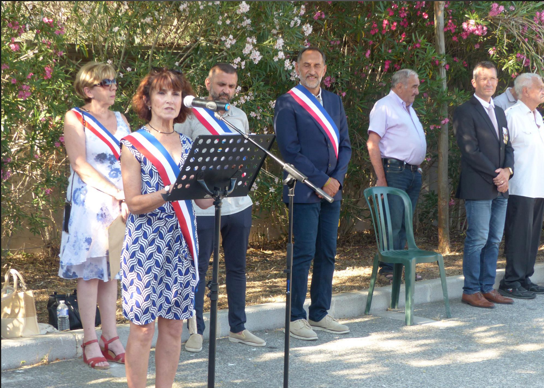
LA FARE _ Remerciements d'usage aux représentants des différents corps qui étaient présents, et des personnels de la mairie qui ont préparé l'évènement. Fin de la cérémonie. Un apéritif est offert par l'Association des Anciens Combattants et Victimes de Guerre à la Salle Padovani.