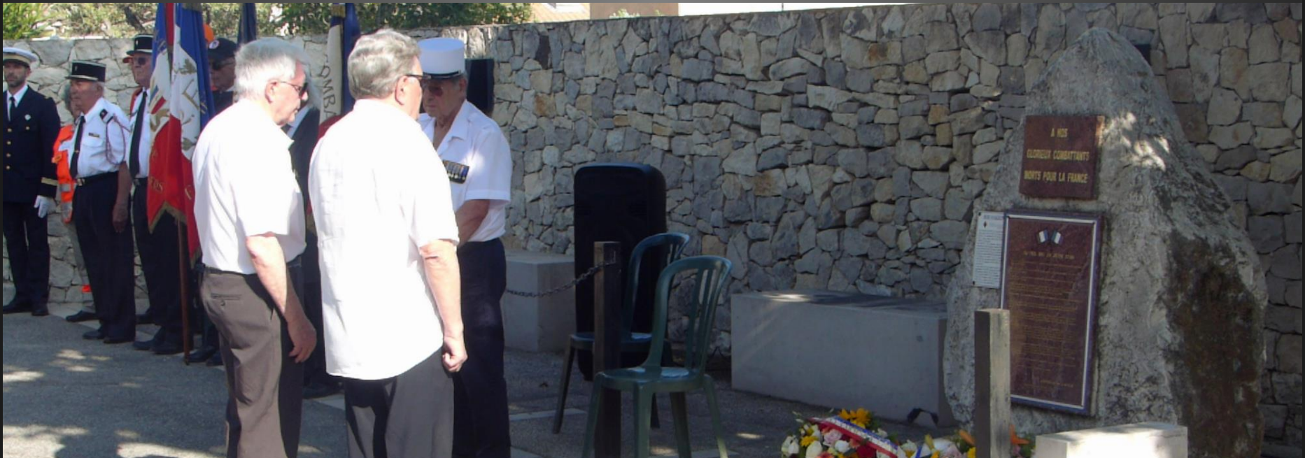
LA FARE _ Dépôt de la gerbe du Souvenir Français.