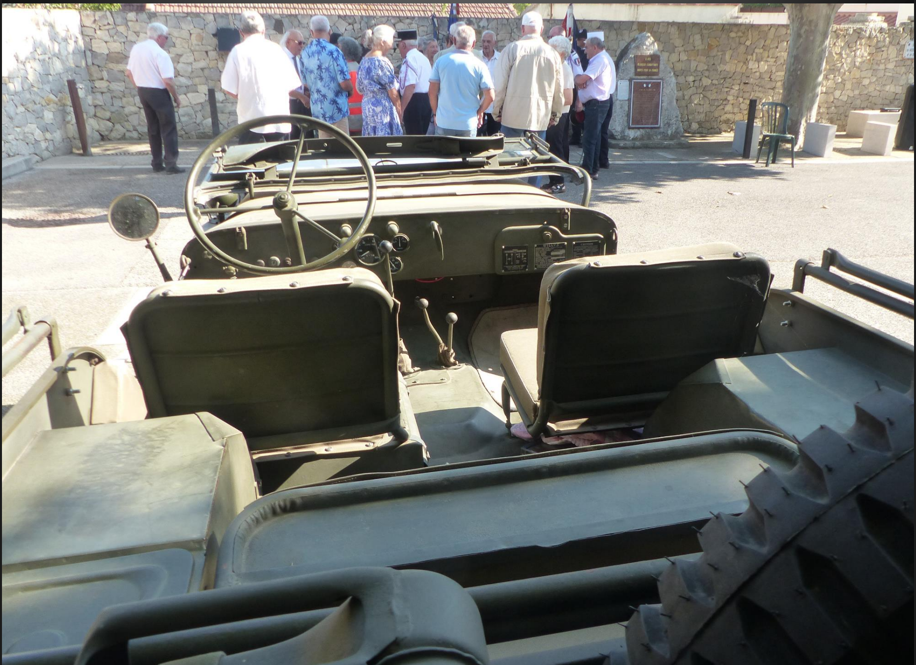
LA FARE _ Anciens combattants, porte-drapeaux et sympathisants arrivent peu à peu pour la commémoration.