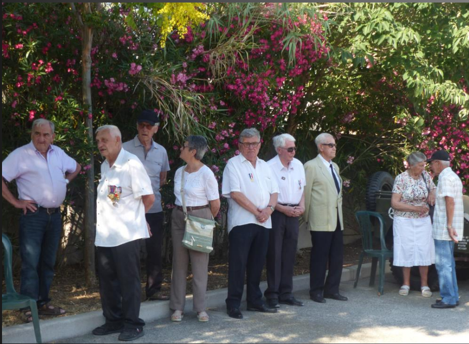
LA FARE _ La cérémonie va commencer.