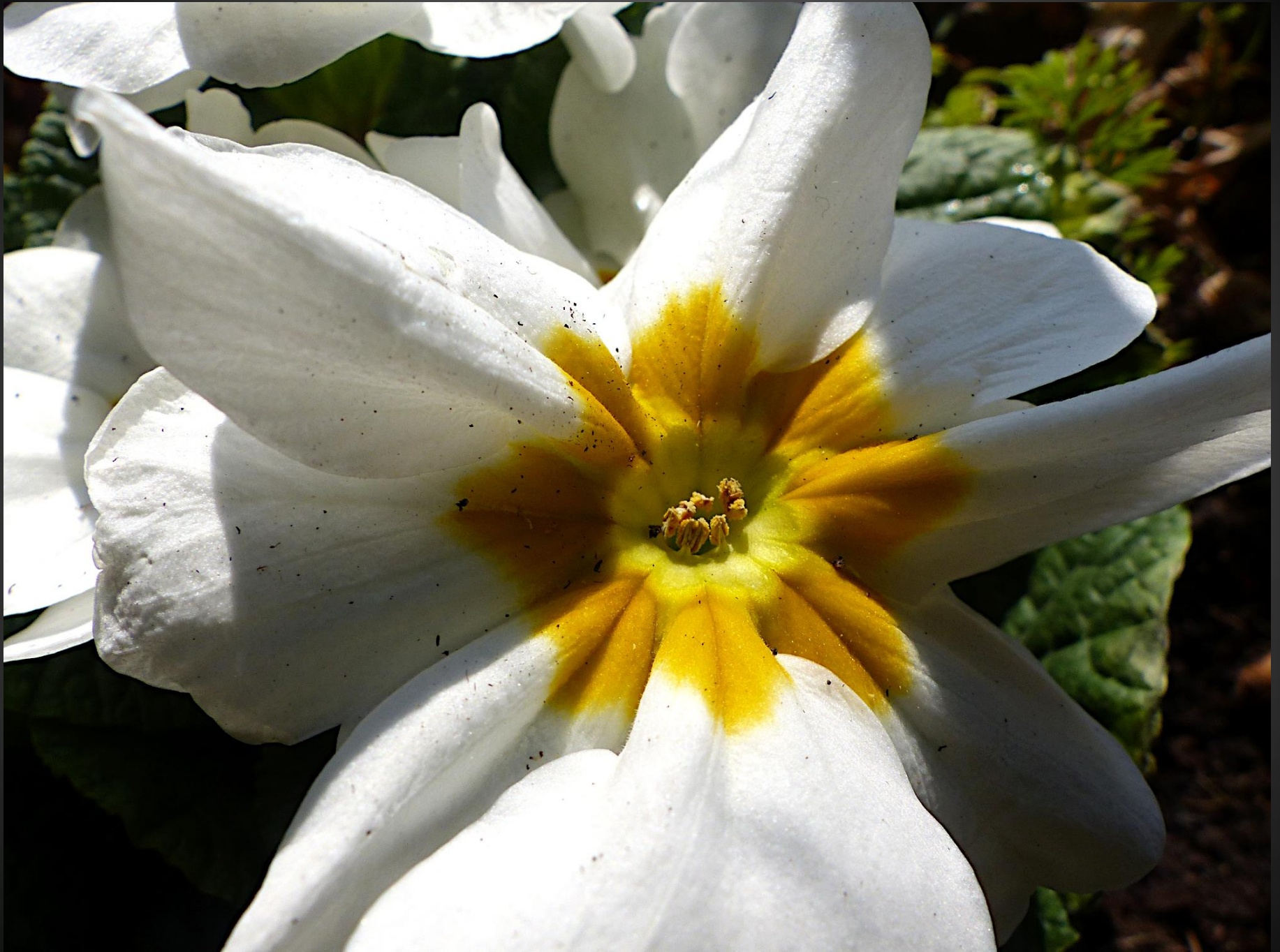
PRIMEVÈRE ( Primula )