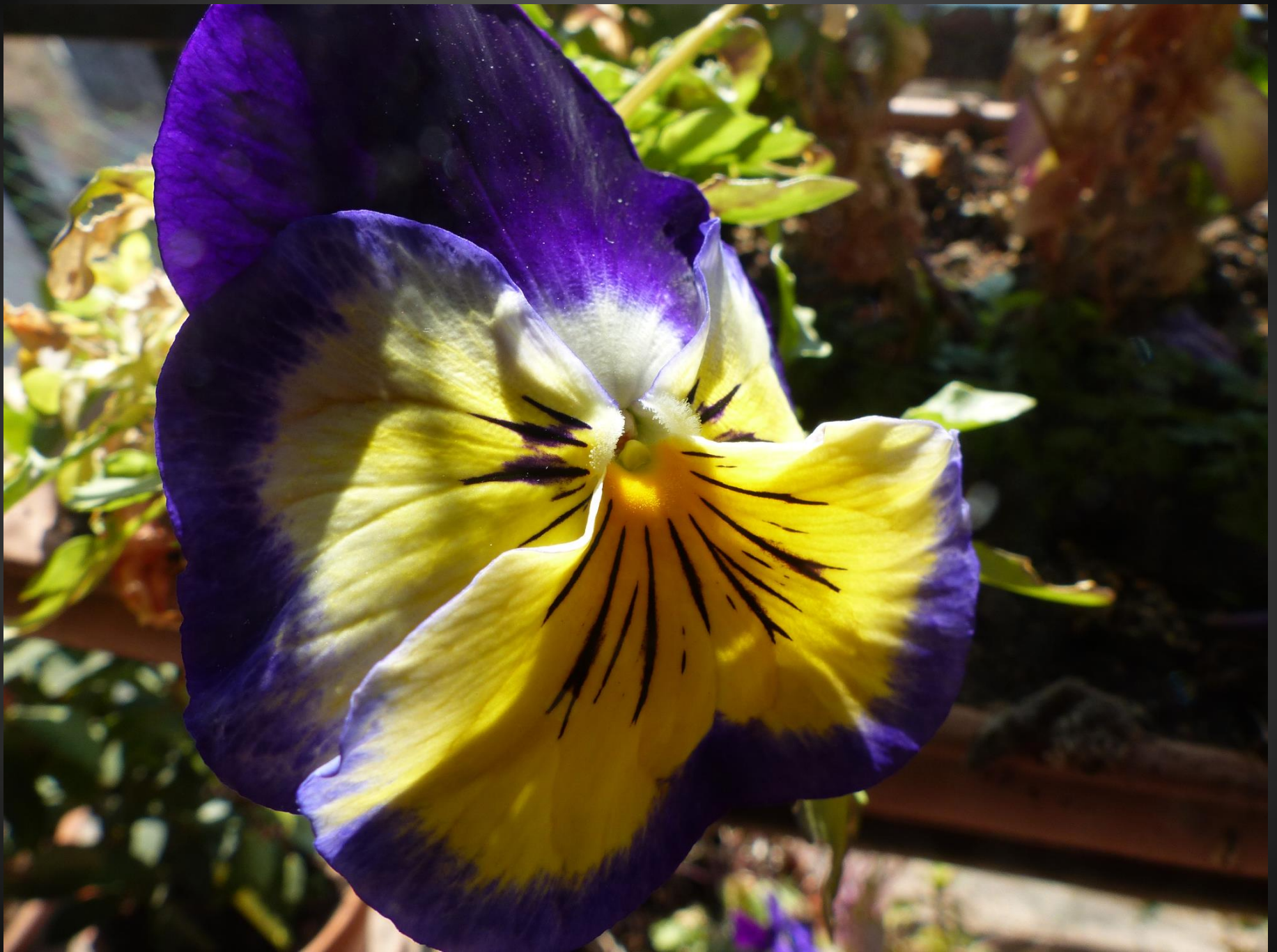
PENSÉE ( Viola ×wittrockiana )