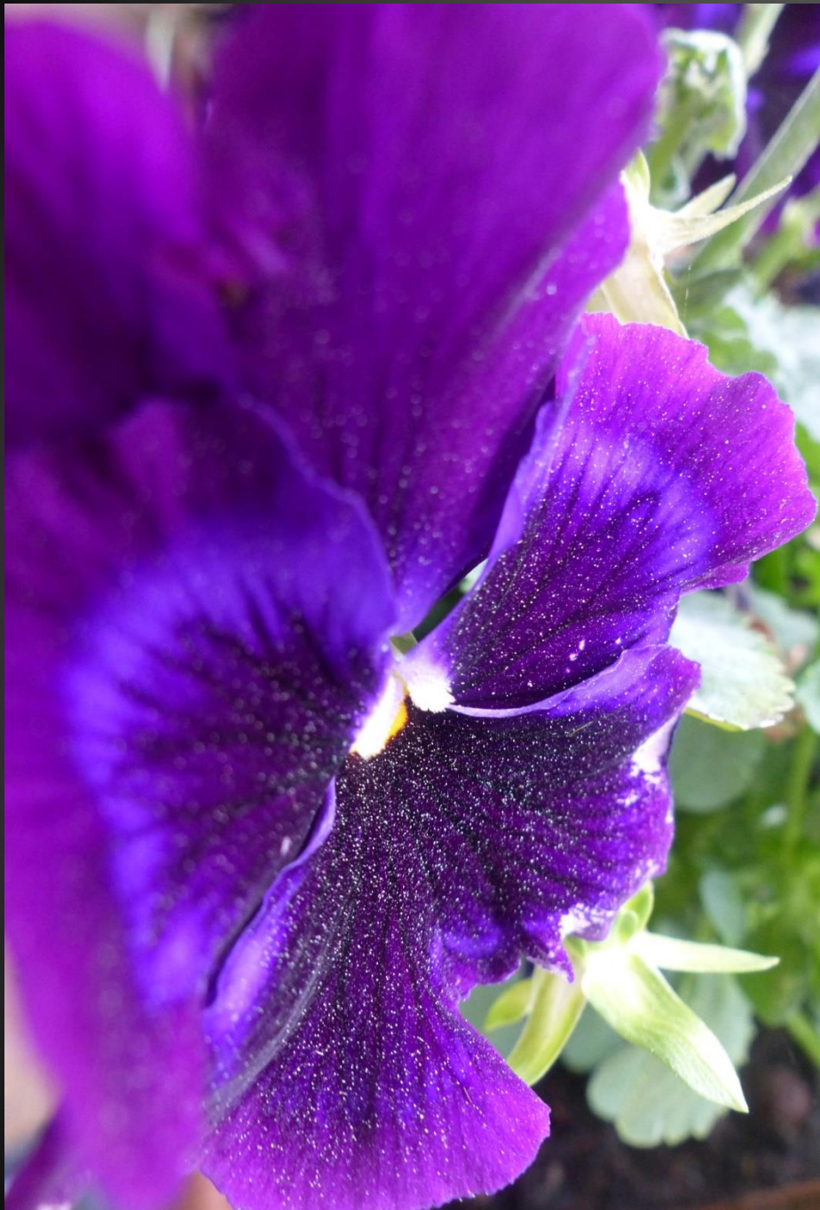
PENSÉE ( Viola ×wittrockiana )