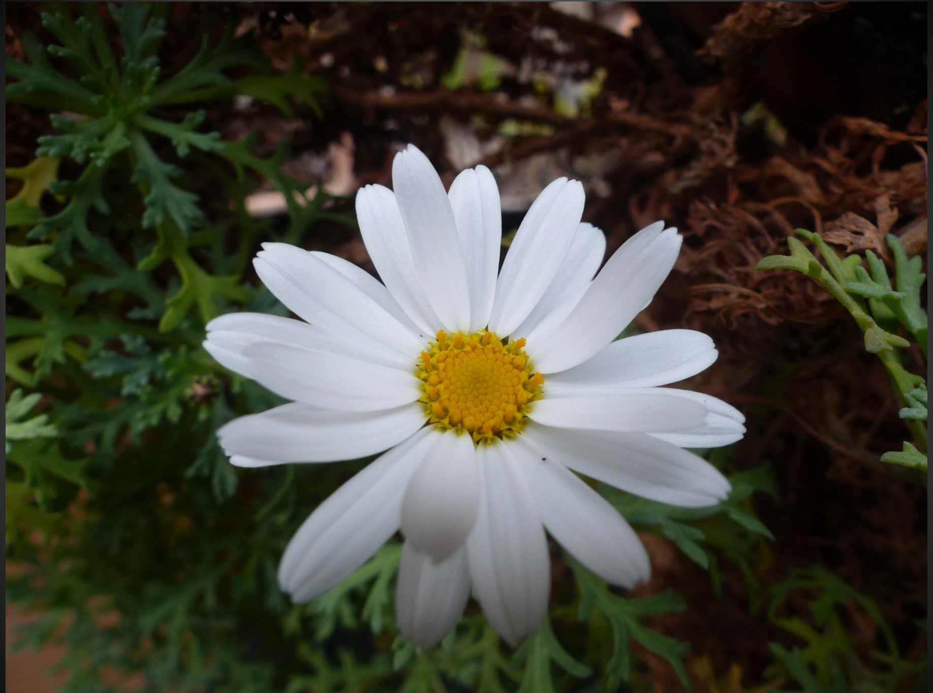
MARGUERITE COMMUNE ( Leucanthemum vulgare )