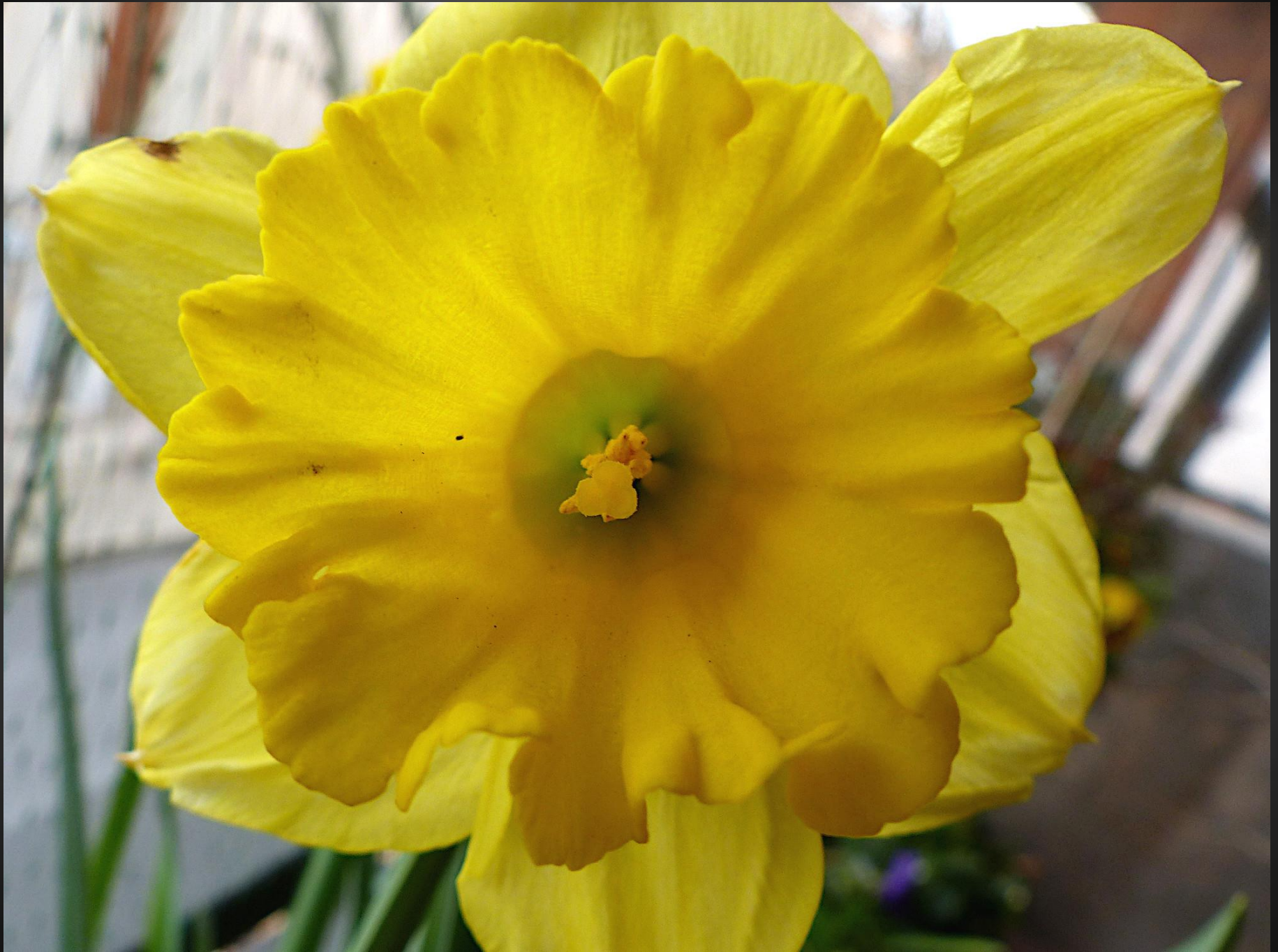
NARCISSE ( Narcissus pseudonarcissus )