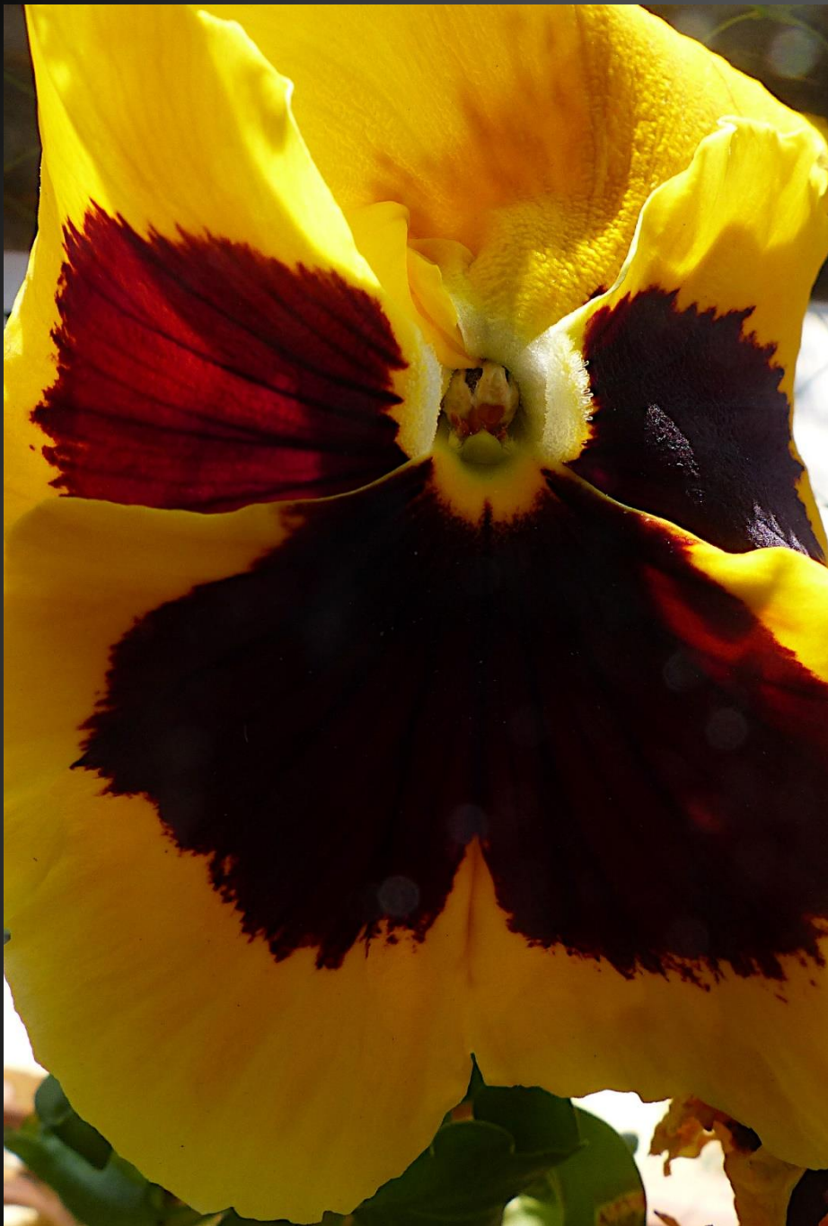
PENSÉE ( Viola xwittrockiana )