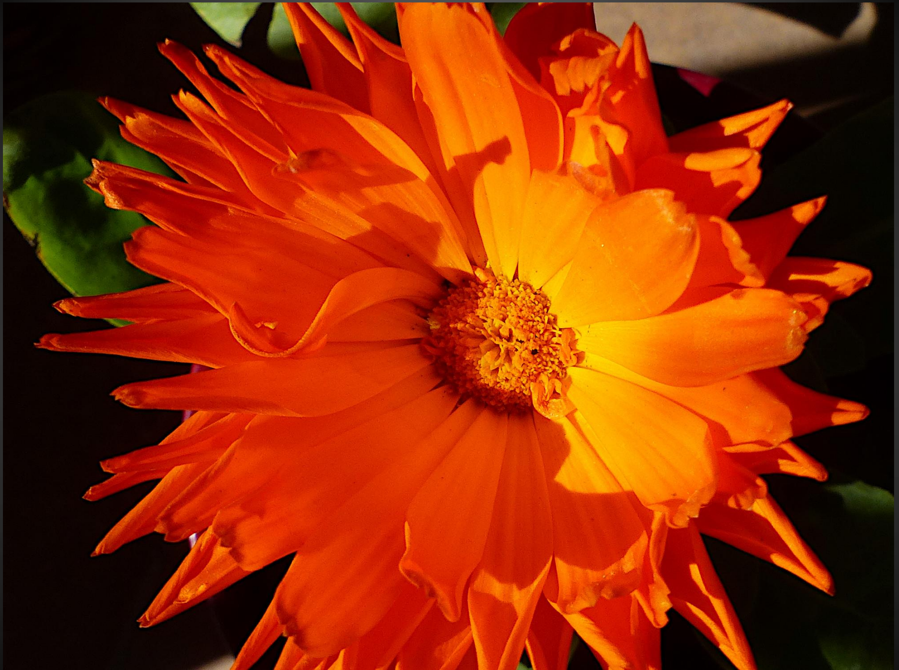
SOU CIS ( Calendula officinalis )