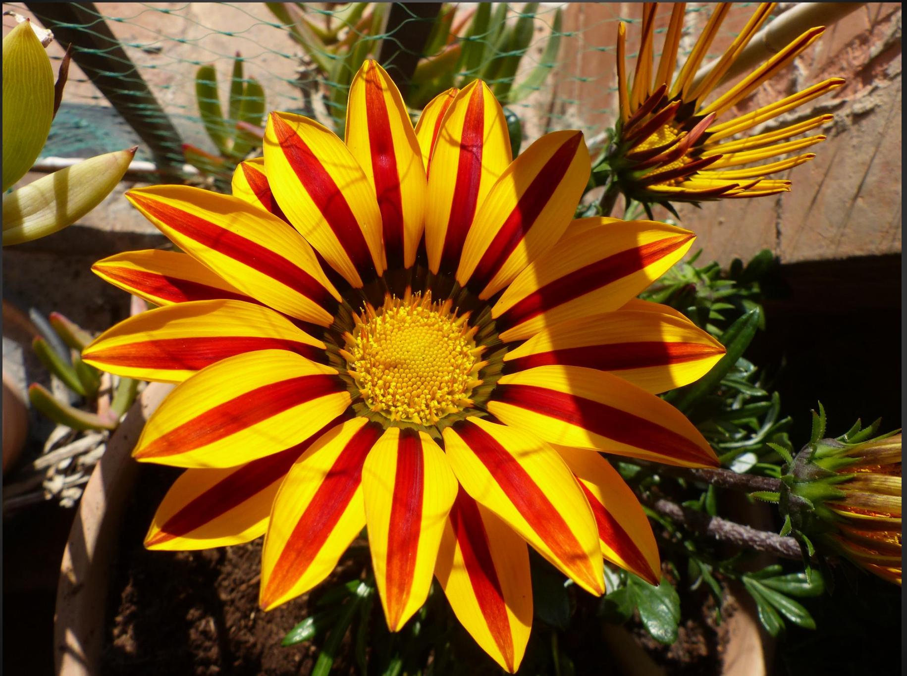
GAZANIA ( Gazania rigens )