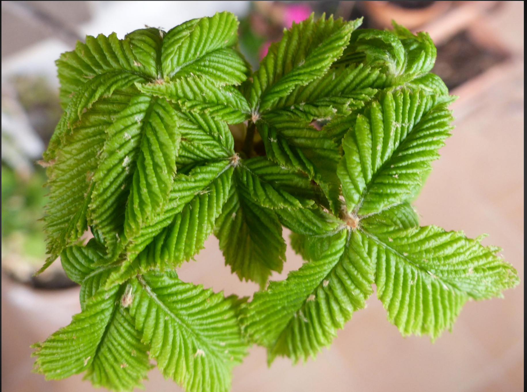
MARRONNIER ( Aesculus hippocastanum )