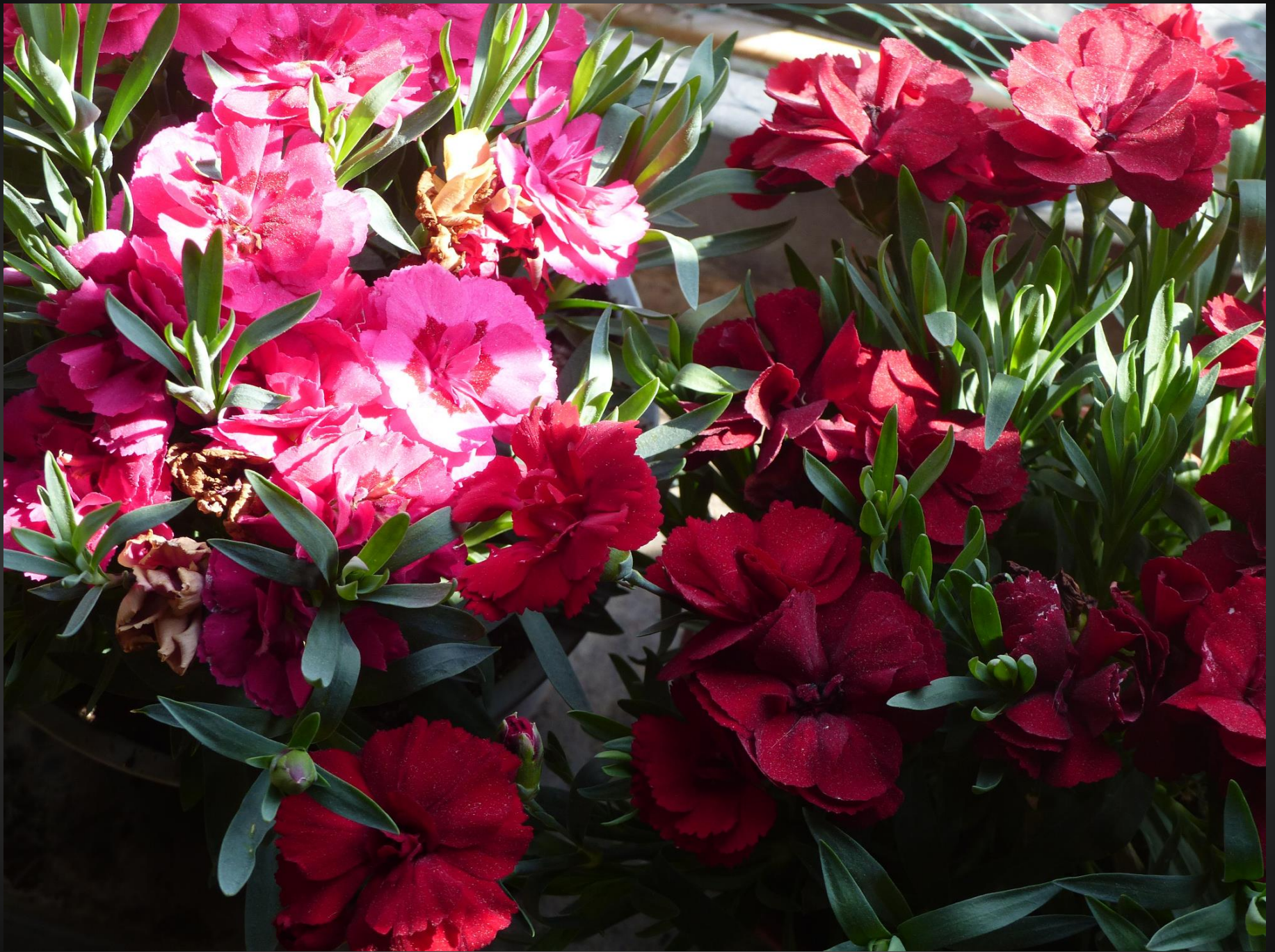
CEILLETTS ( Dianthus caryophyllus )