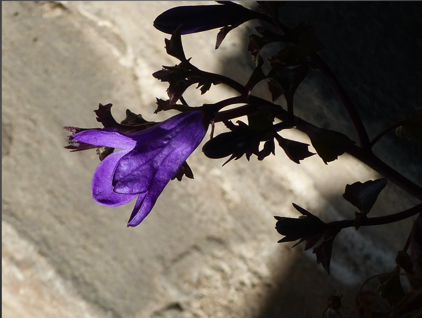
CAMPANULE ( Campanula )