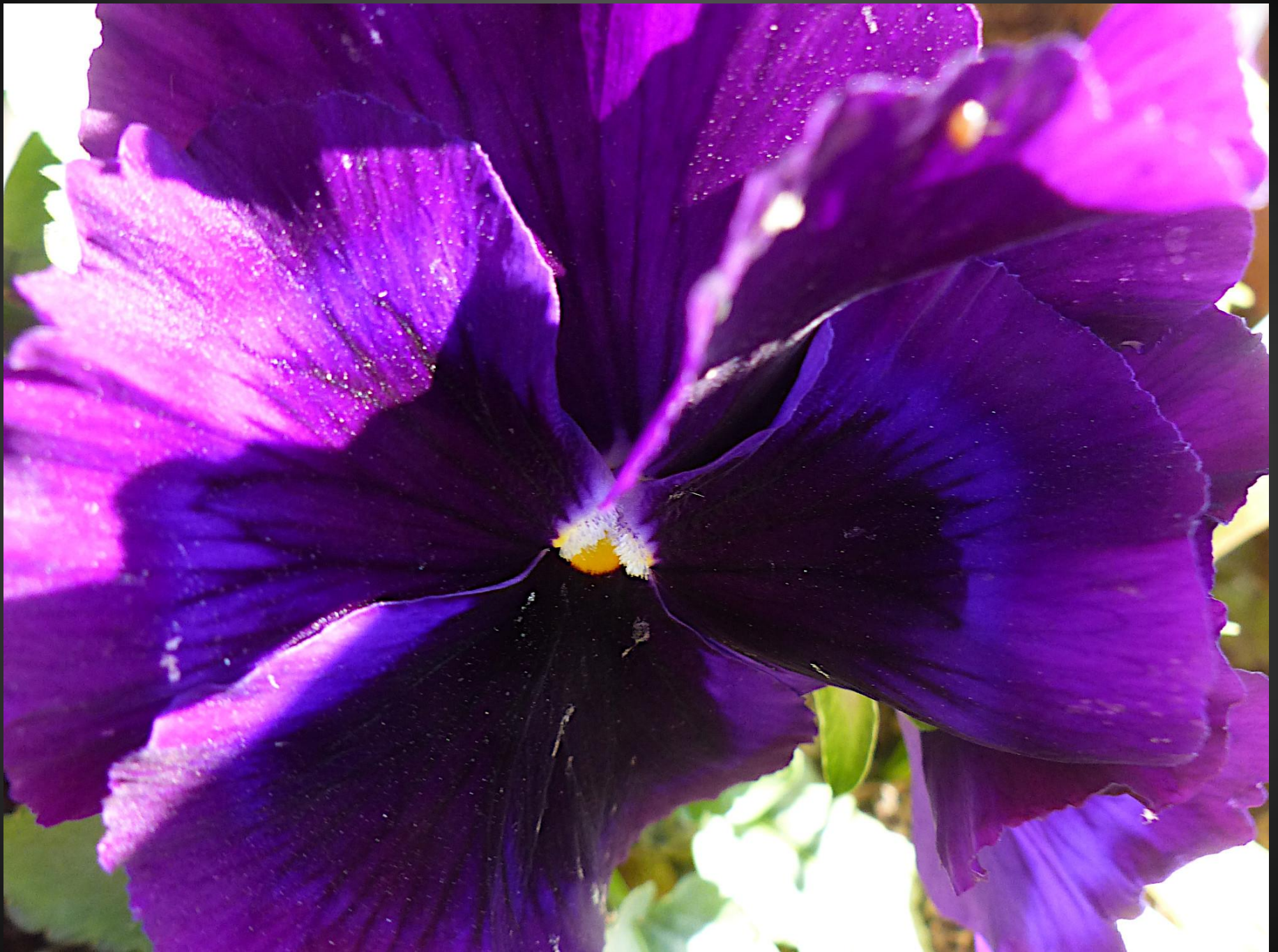
PENSÉE ( Viola x wittrockiana )