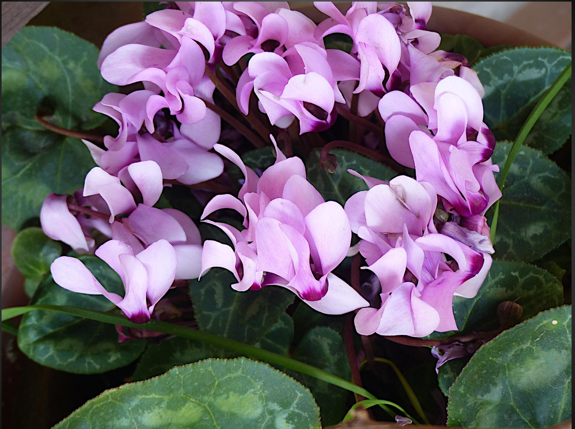
CYCLAMEN ( Cyclamen hederifolium )