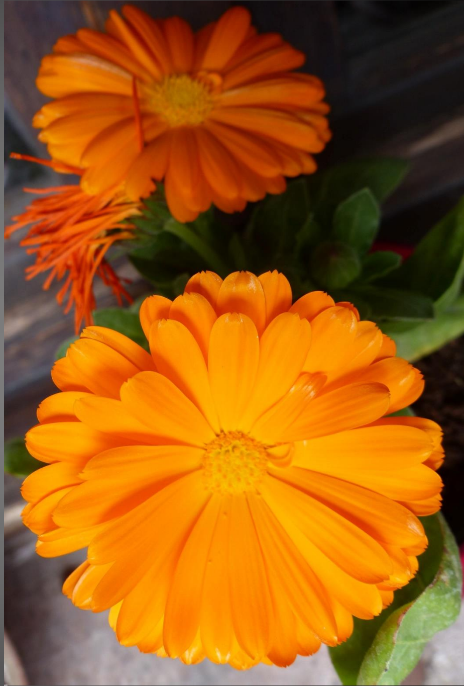
SOUCIS ( Calendula officinalis )