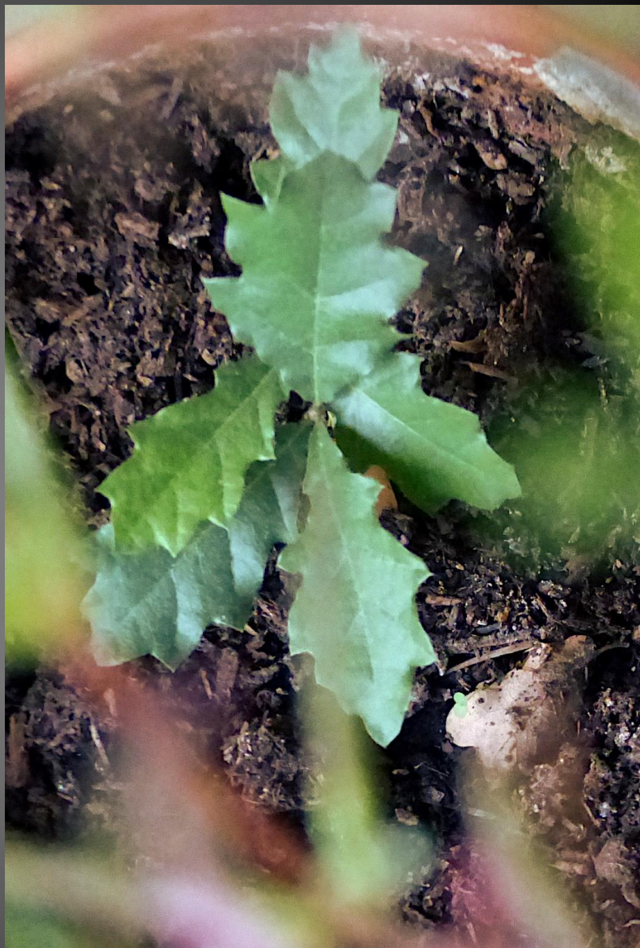
CHÊNE ( Quercus petraea )