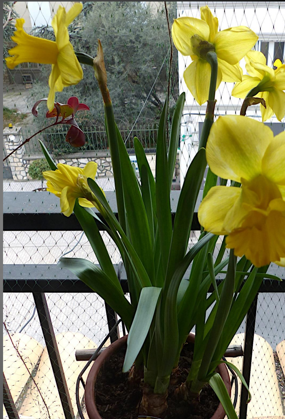
NARCISSE ( Narcissus pseudonarcissus )