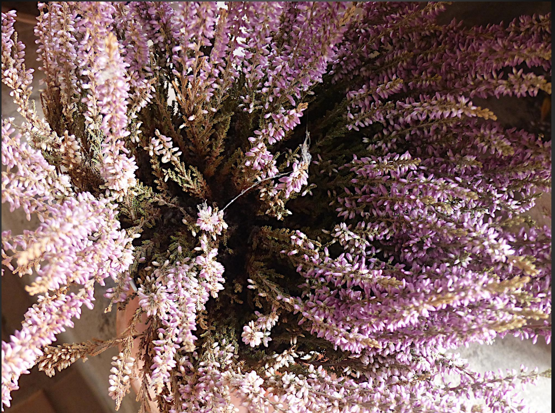
BRUYÈRE ( Calluna vulgaris )