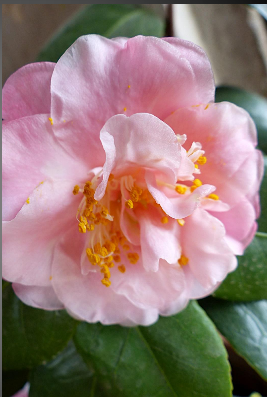
CAMELIA ( Camellia japonica )