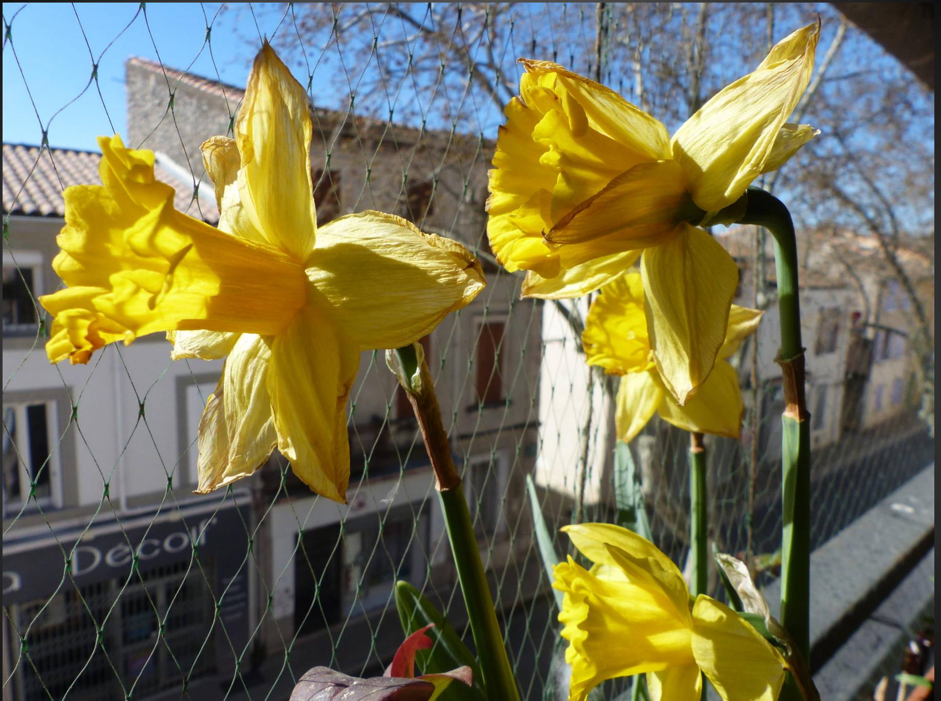
NARCISSE ( Narcissus pseudonarcissus )