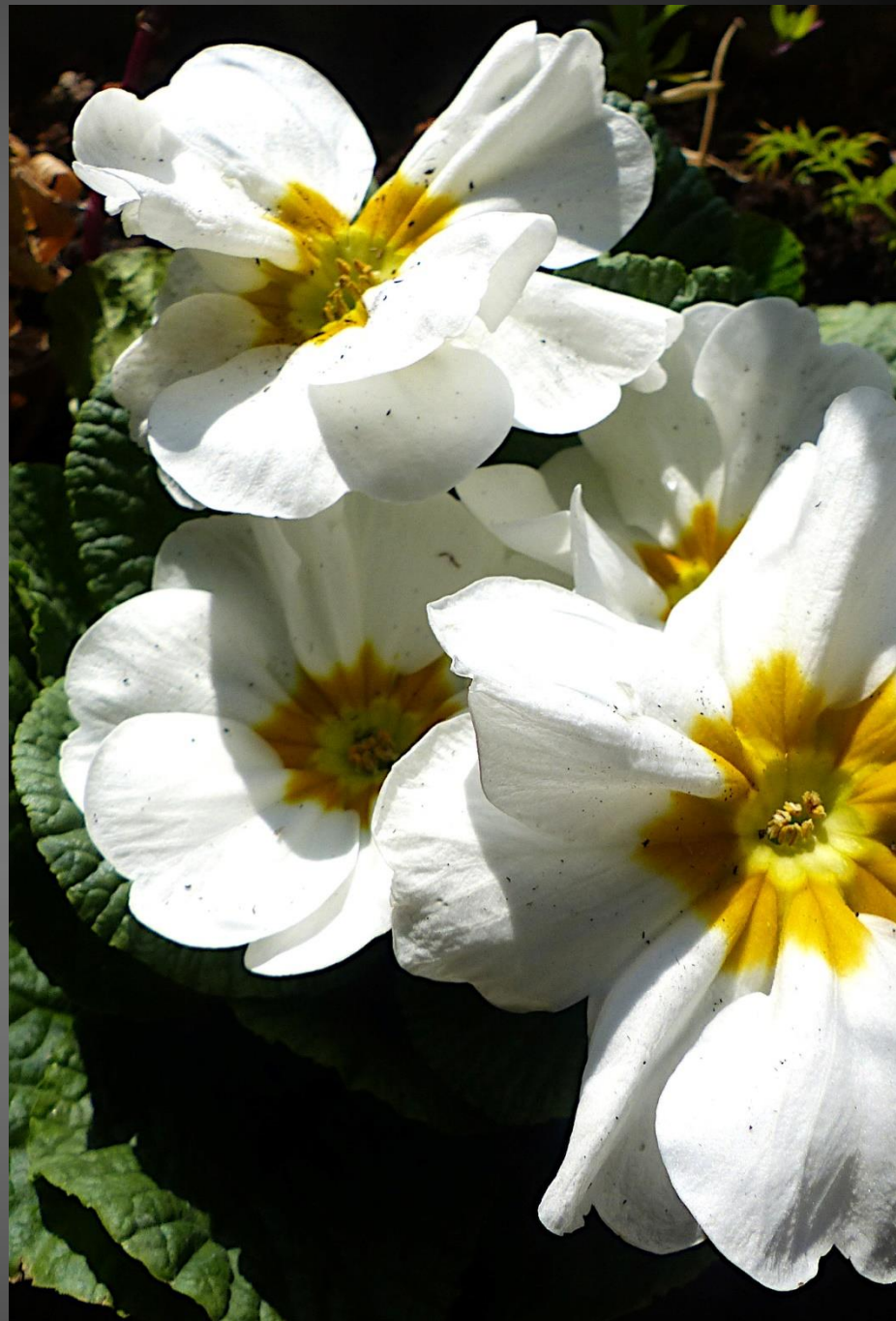
PRIMEVÈRE ( Primula )