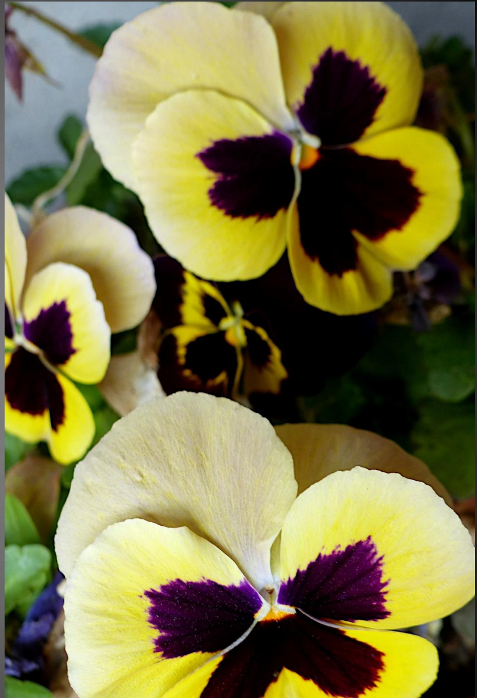
PENSÉE ( Viola ×wittrockiana )