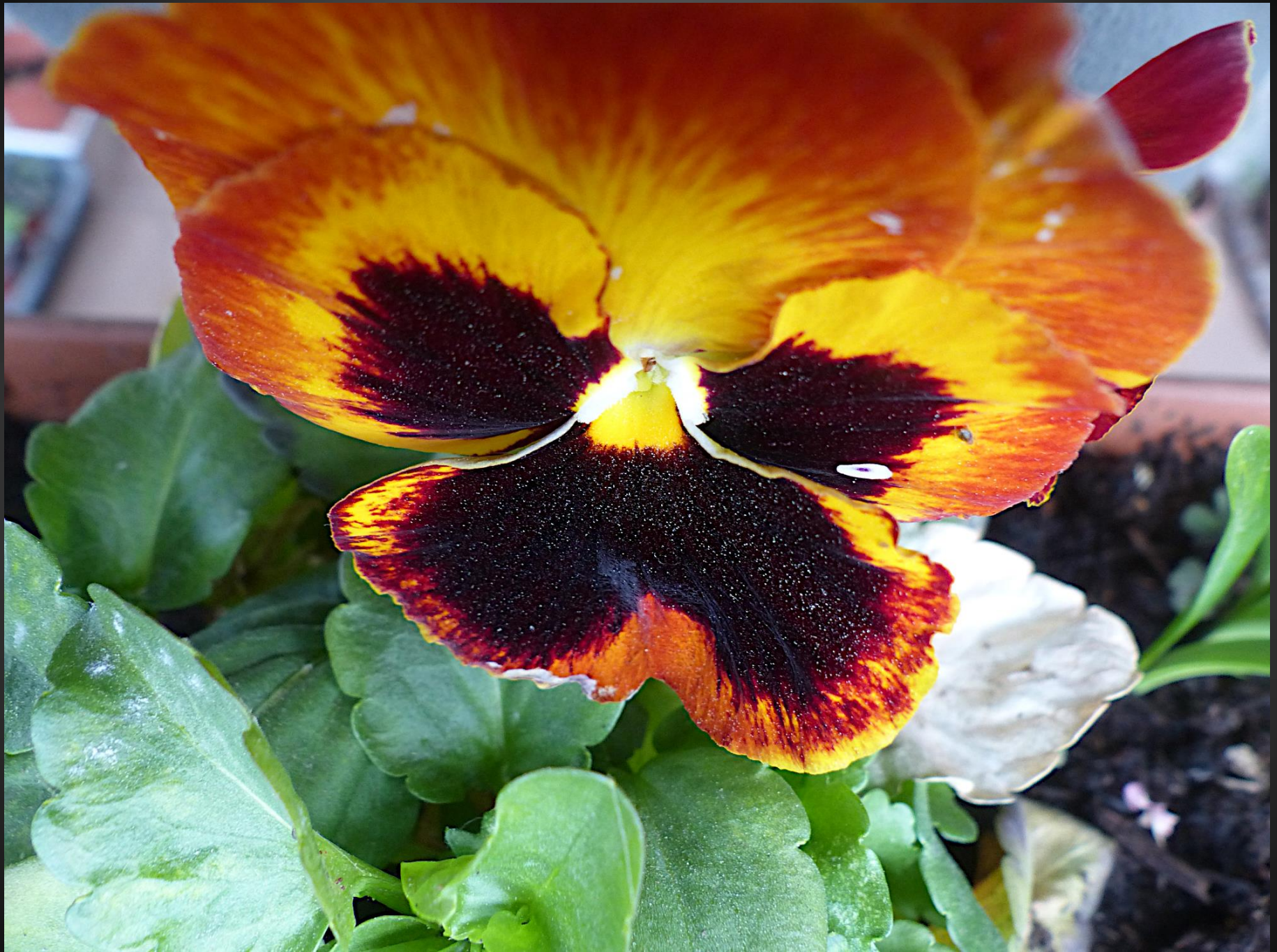
PENSÉE ( Viola ×wittrockiana )