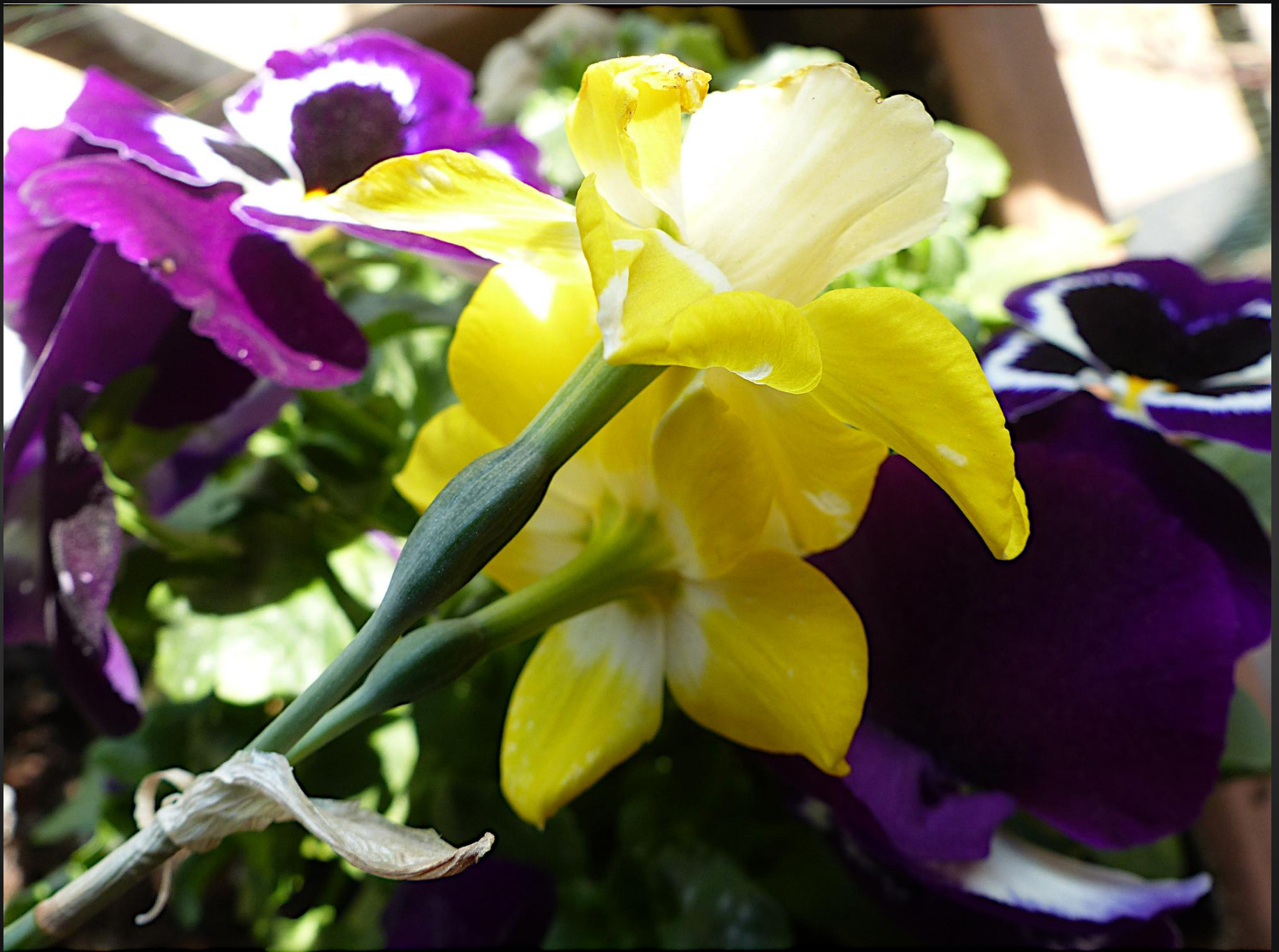
NARCISSE ( Narcissus pseudonarcissus ) )