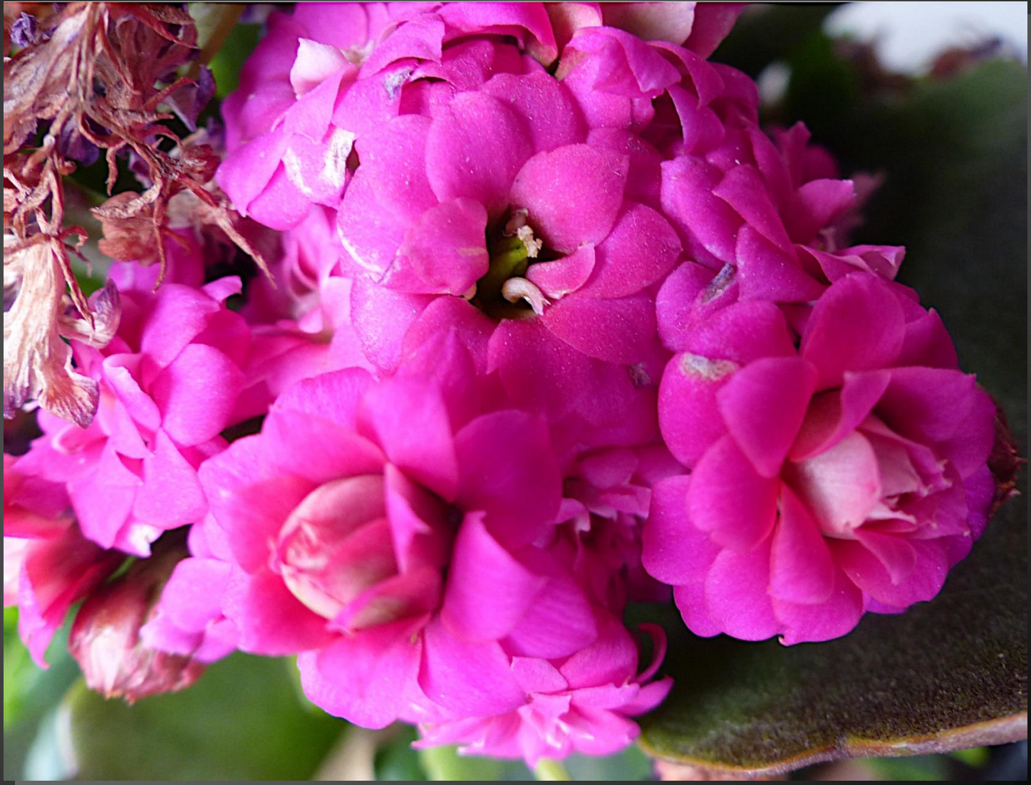
CRASSULA ( famille des Crassulaceae )