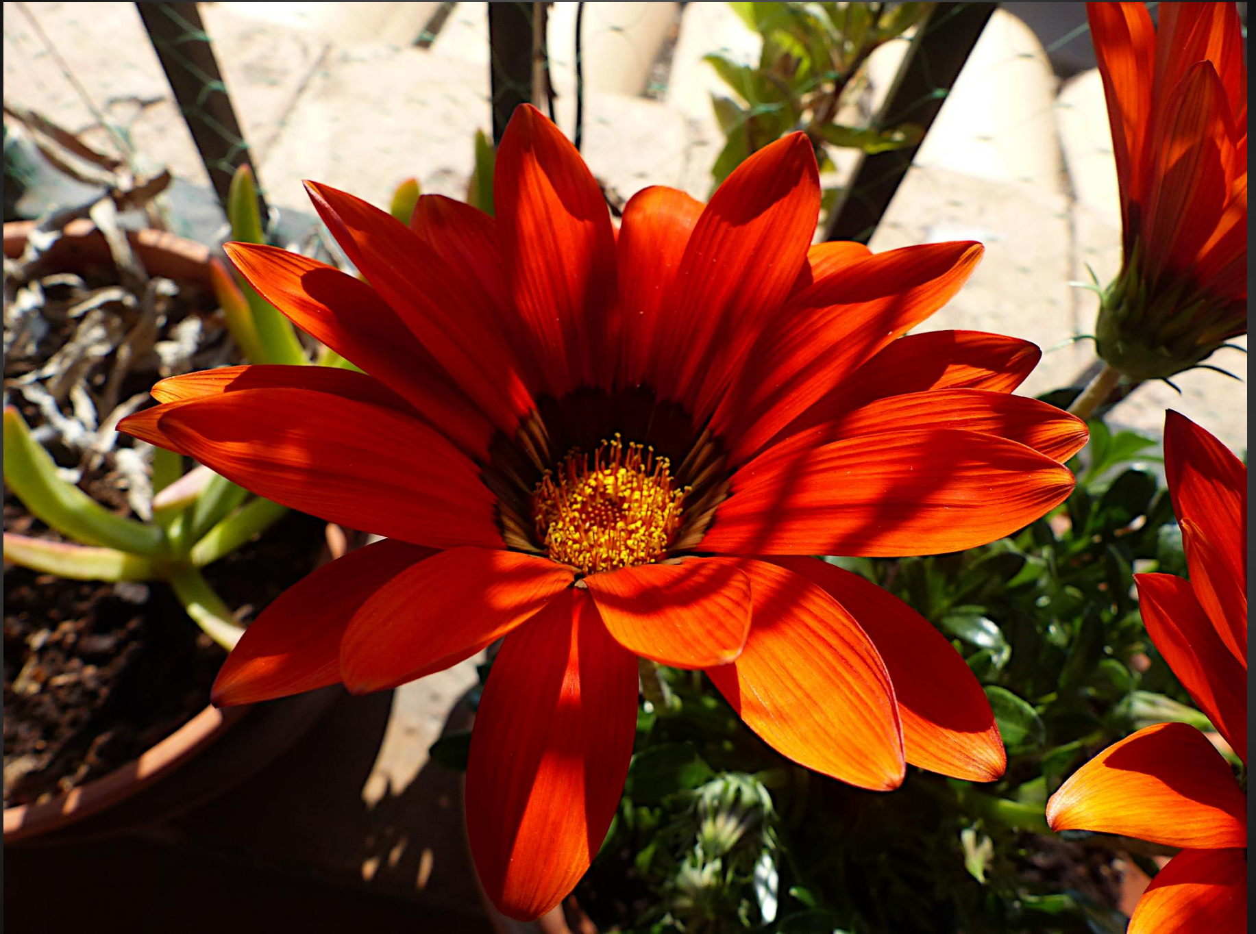
GAZANIA ( Gazania rigens )