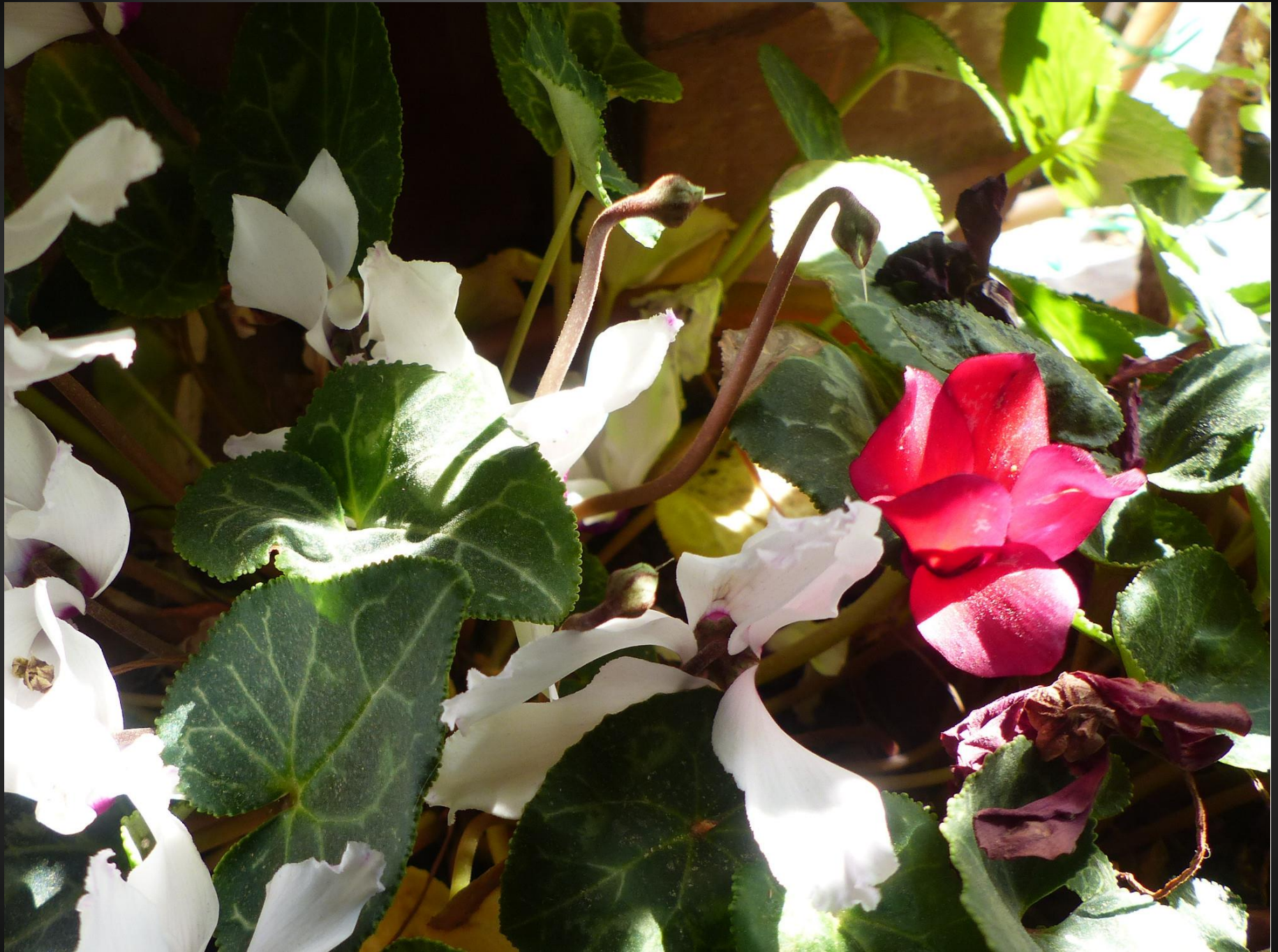
CYCLAMEN ( Cyclamen hederifolium )