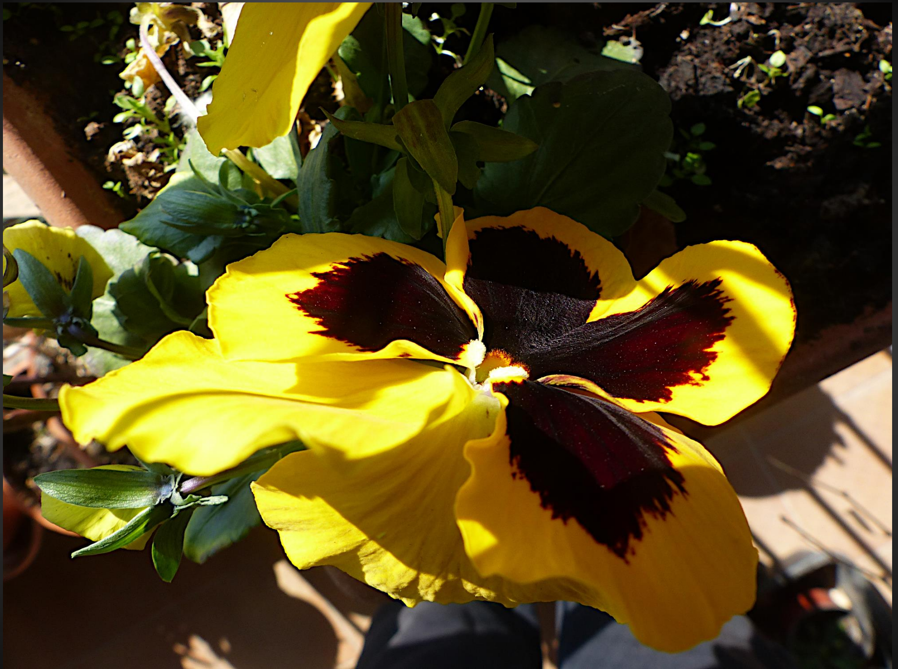
PENSÉE ( Viola ×wittrockiana )