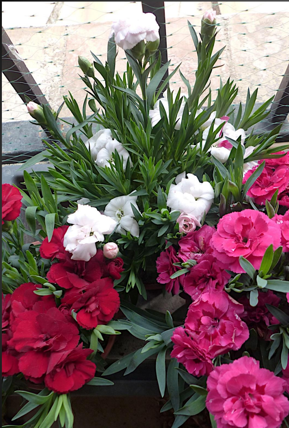
CEILLETS ( Dianthus caryophyllus )