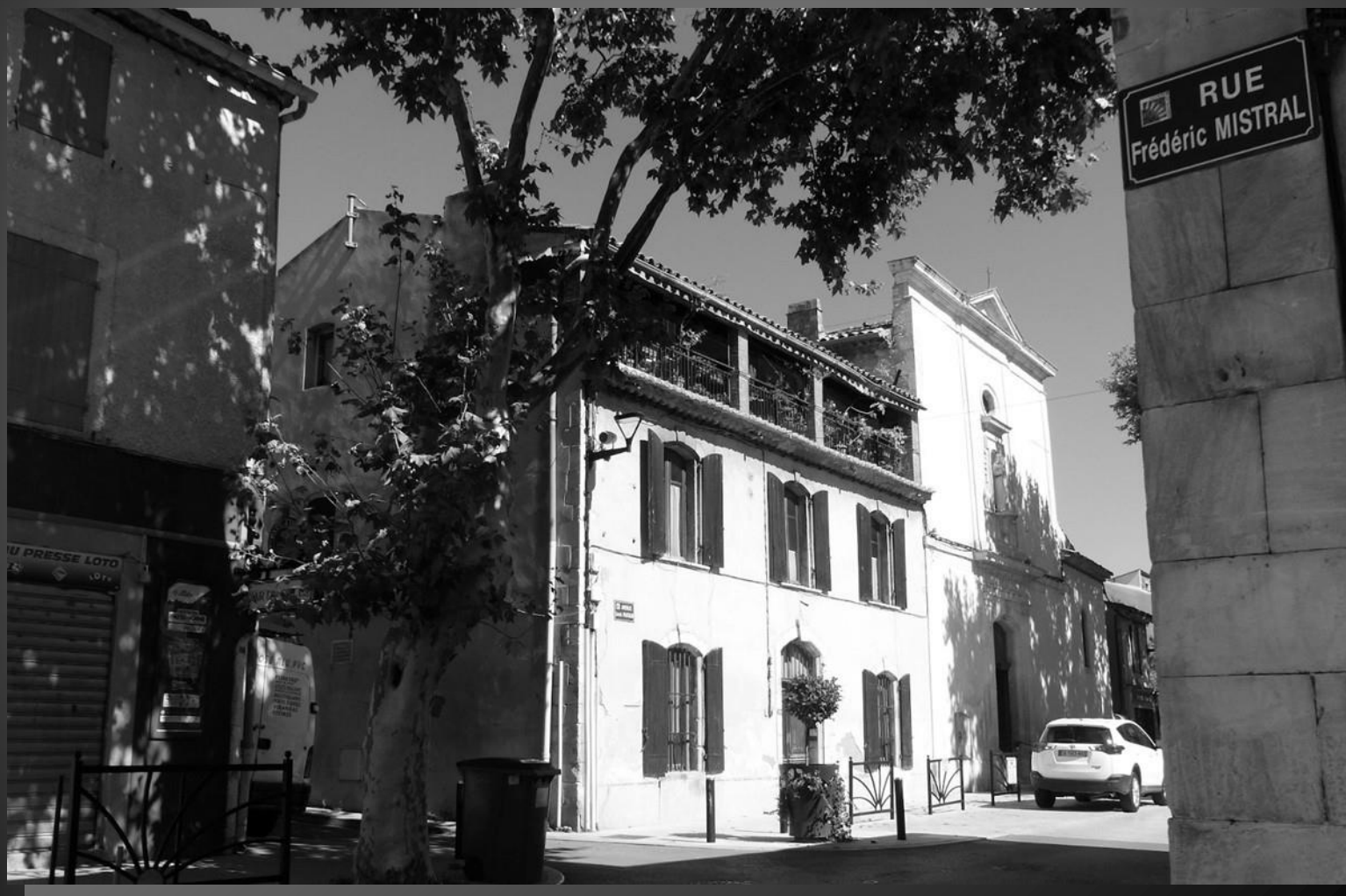
Le Presbytère est accolé à l'église Saint-Sauveur, face au Sud, sur l'avenue Louis Pasteur.