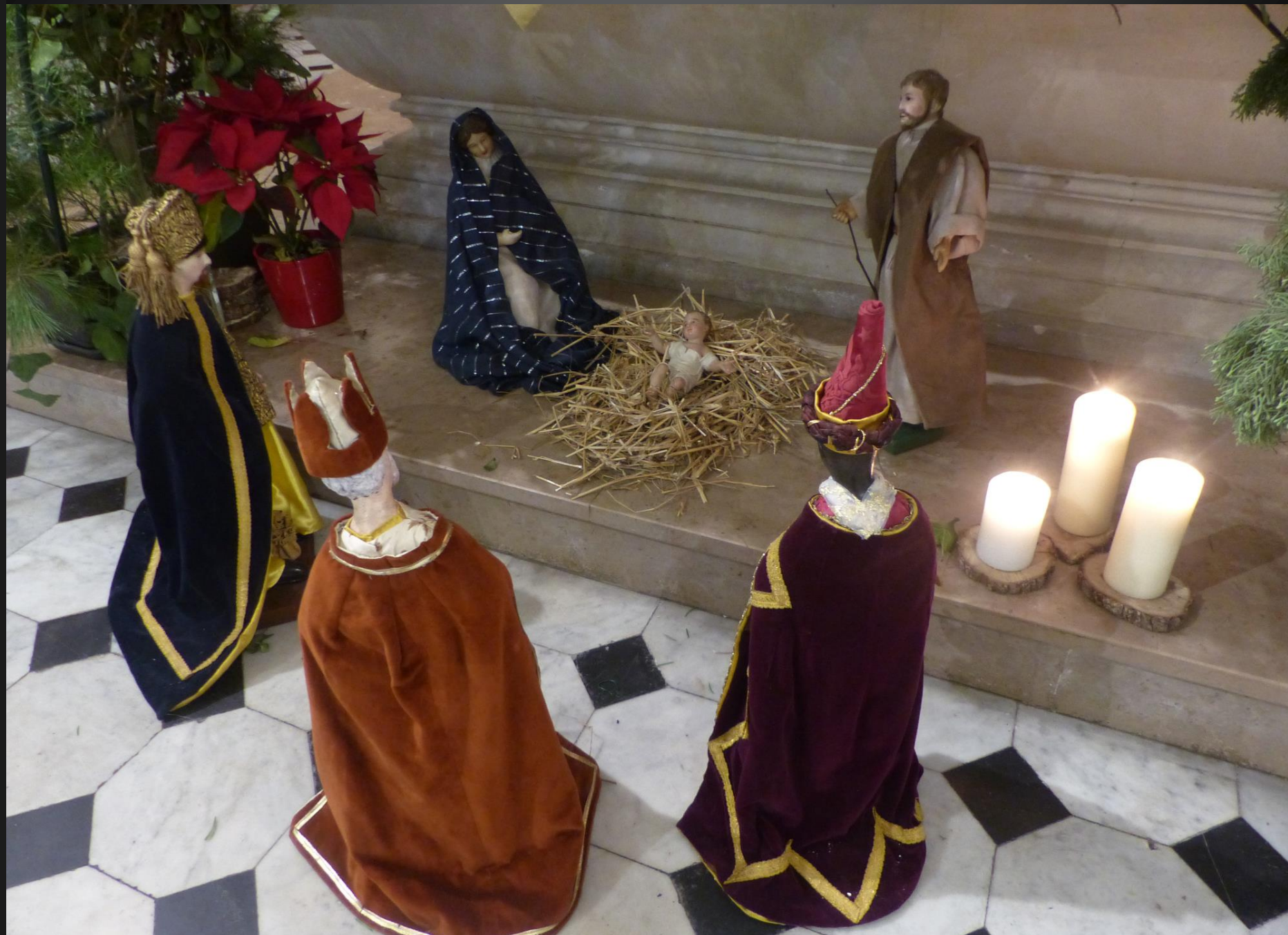
EGLISE ST SAUVEUR _ Les Rois Mages ont été placés devant la Sainte Famille au pied de l'autel. Identité des Mages : https://jeretiens.net/les-rois-mages-balthazar-gaspard-et-melchior/