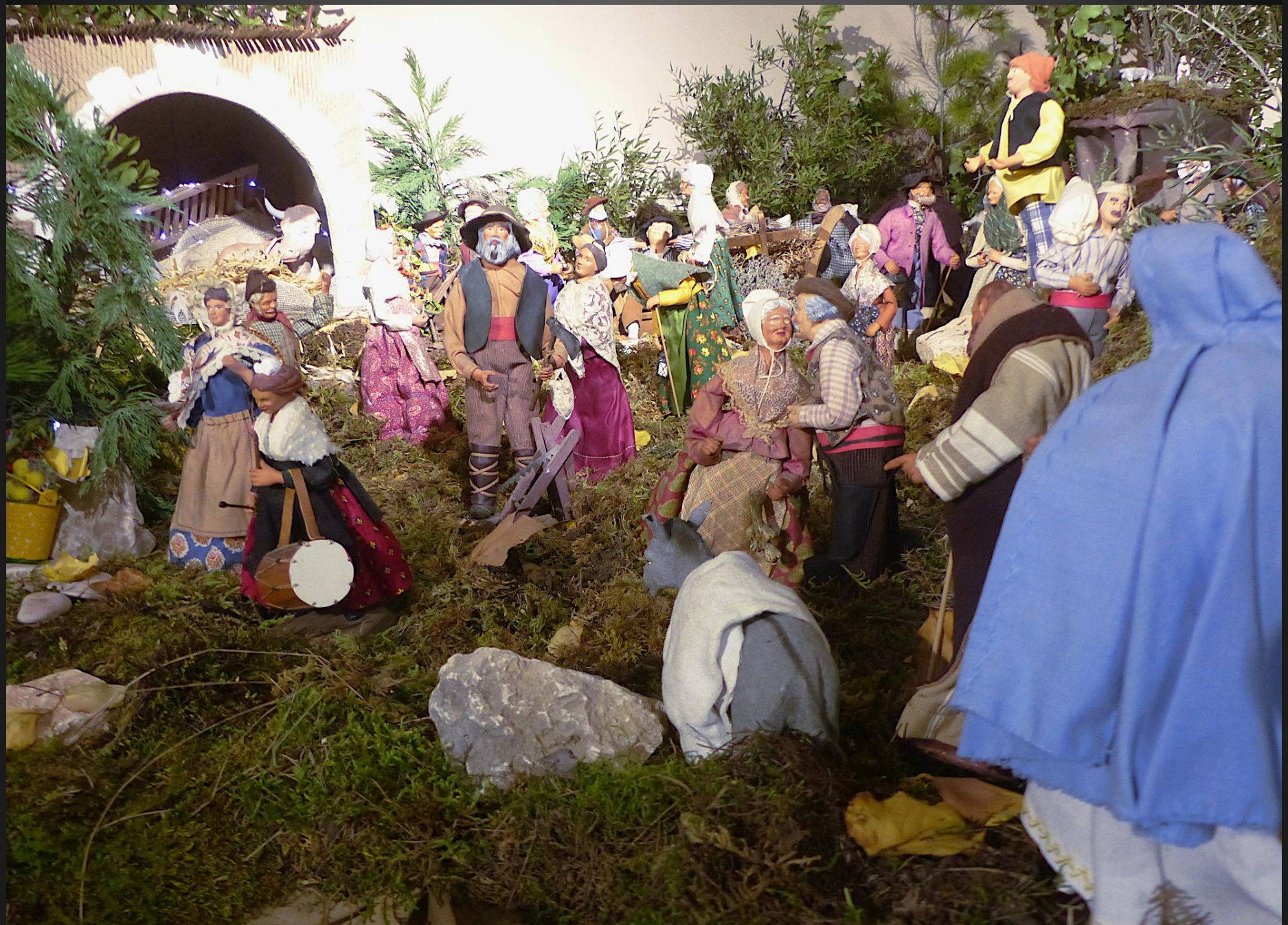
3 e dimanche de l'Avent _ Marie et Joseph sont en vue chemin de Bethléém.