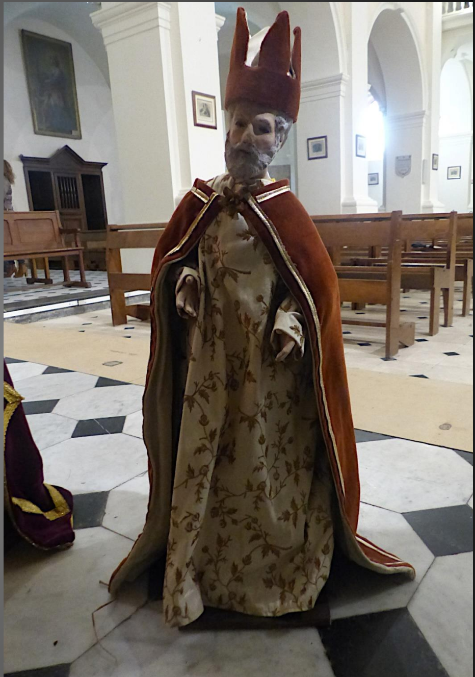
Gaspard représente la Perse et est figuré comme un vieillard aux cheveux blancs. Il offre la myrrhe (utilisée pour embaumer les morts), symbole du fait que Jésus était également homme.