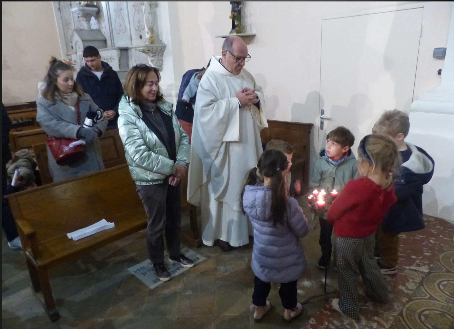
EGLISE ST SAUVEUR _ Prière à Notre-Dame avec le salut de l'Ange de l'Annonciation « Je vous salue Marie ...»