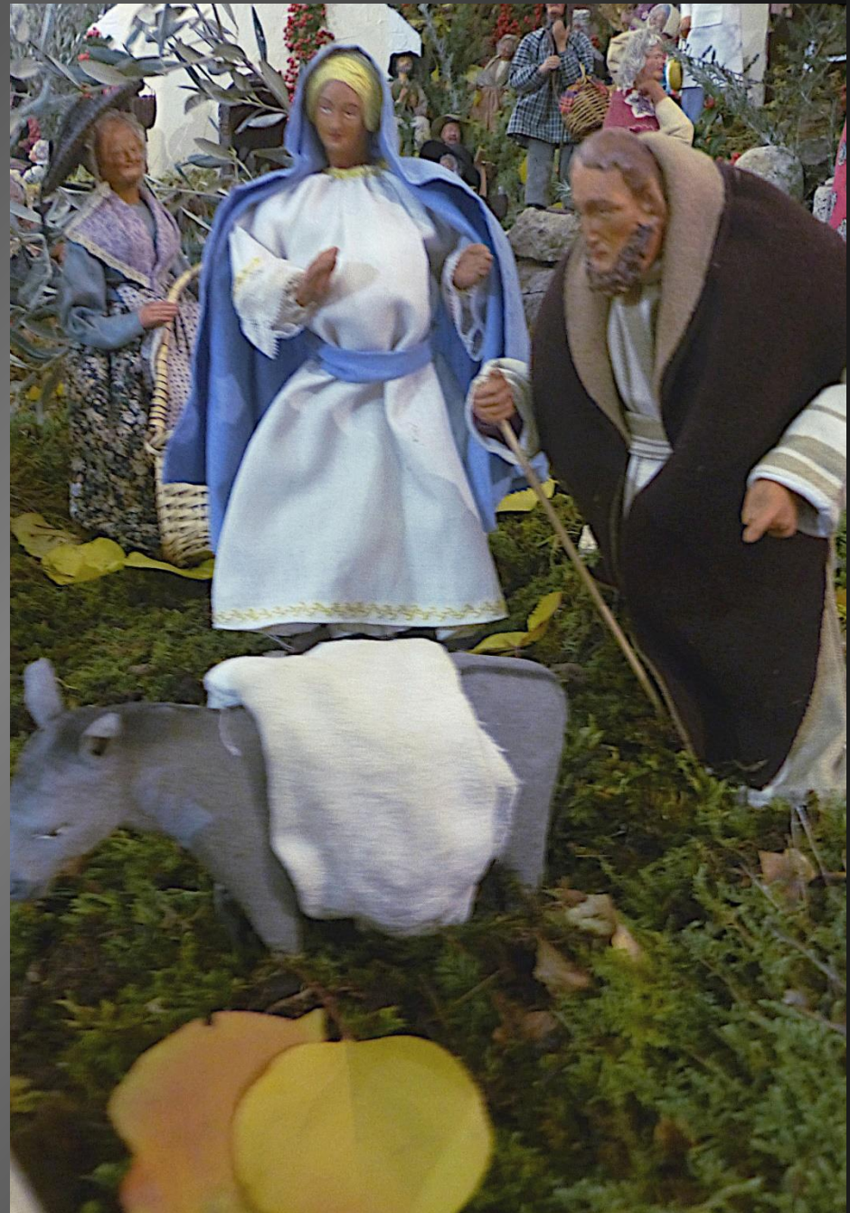
1 er dimanche de l'Avent _ Marie et Joseph sont en chemin vers Bethléem.