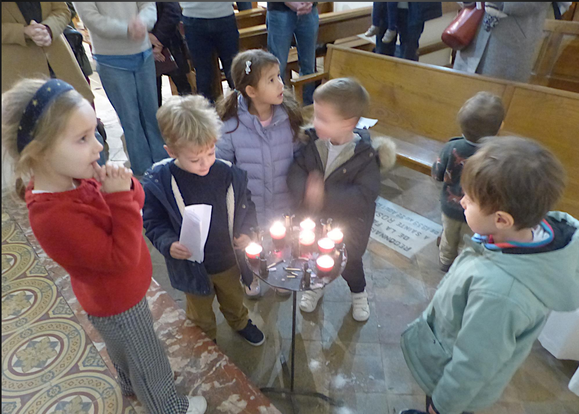
EGLISE ST SAUVEUR _ Noël, c'est aussi la fête des jeunes enfants, de l'Innocence... les Saints Innocents sont fêtés le 28 décembre, en mémoire du massacre des tout-petits de moins de deux ans nés à Bethléem (Judée), ordonné par le roi Hérode afin de se débarrasser du nouveau-né Jésus de Nazareth que les Mages lui avaient annoncé comme le « Roi des Juifs » et qu'il voyait comme une menace ...