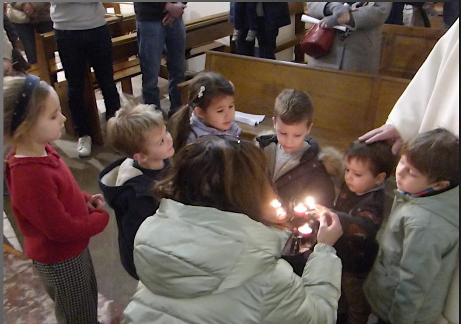
EGLISE ST SAUVEUR _ Le Père NOEL demande aux enfants de mettre leurs lumignons devant la crèche pour qu'ils soient allumés.