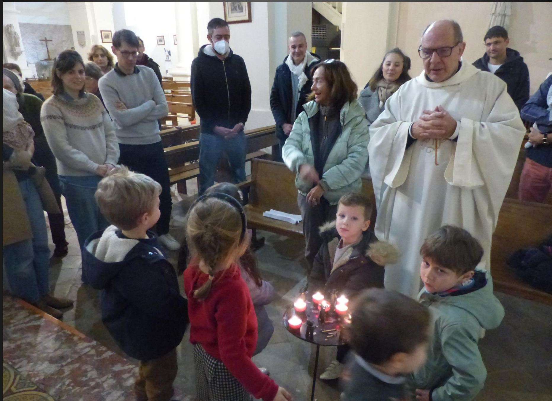
EGLISE ST SAUVEUR _ Litanie des Saints Patrons des enfants : St Victor, Ste Joséphine, St Raphaël, St Clément, St Antoine, St Joseph... « Priez pour nous ».