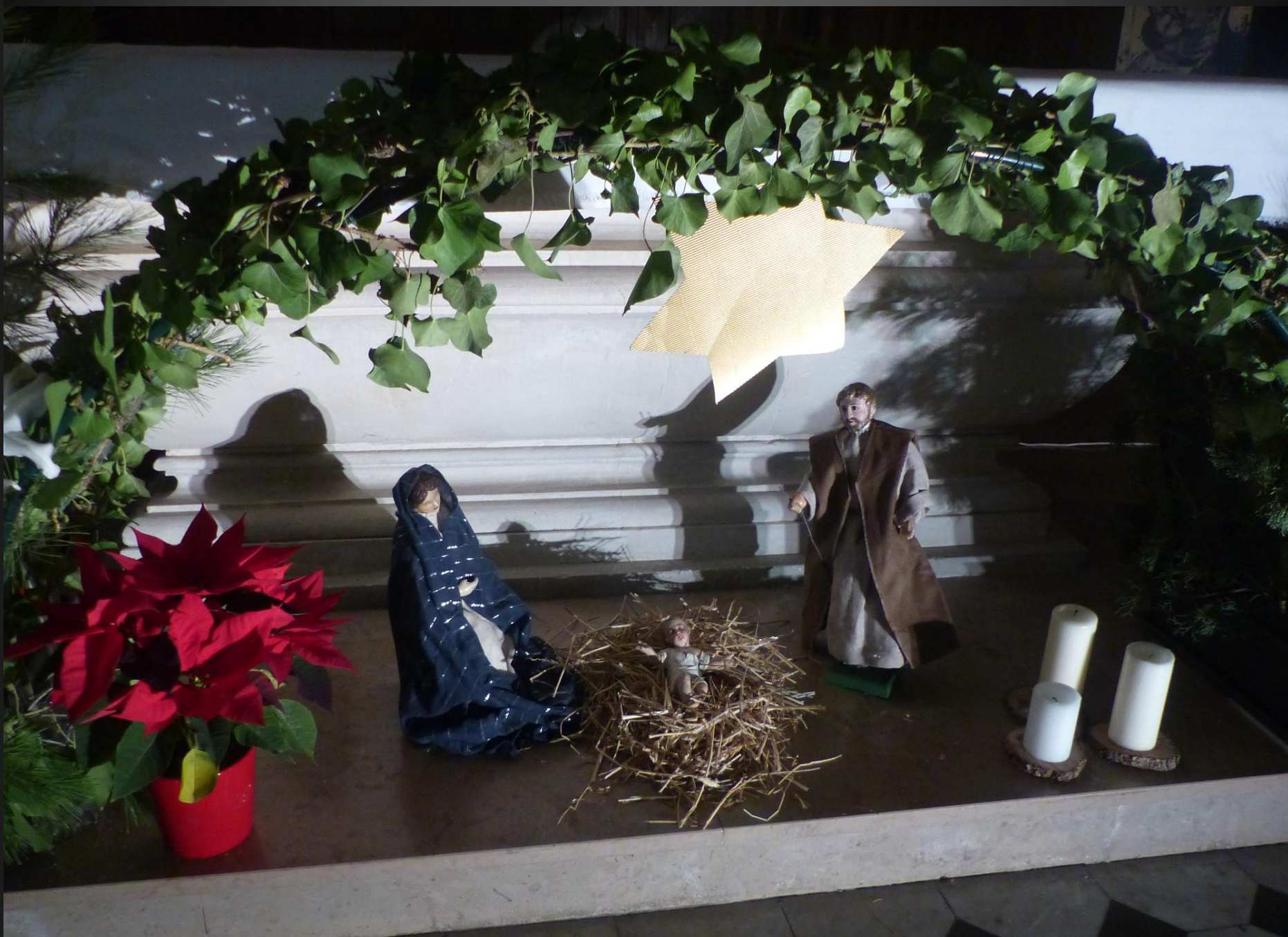
EGLISE ST SAUVEUR _ Représentation de la Nativité au pied de l'autel.