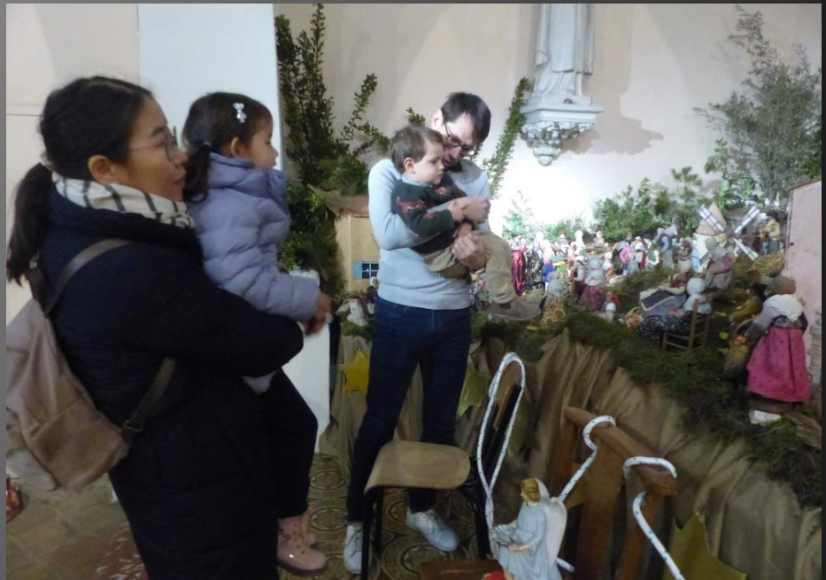
EGLISE ST SAUVEUR _ Des parents expliquent à leurs enfants la signification de l'arrivée des Rois Mages devant l'étable de Bethléem où est né l'Enfant-Roi.