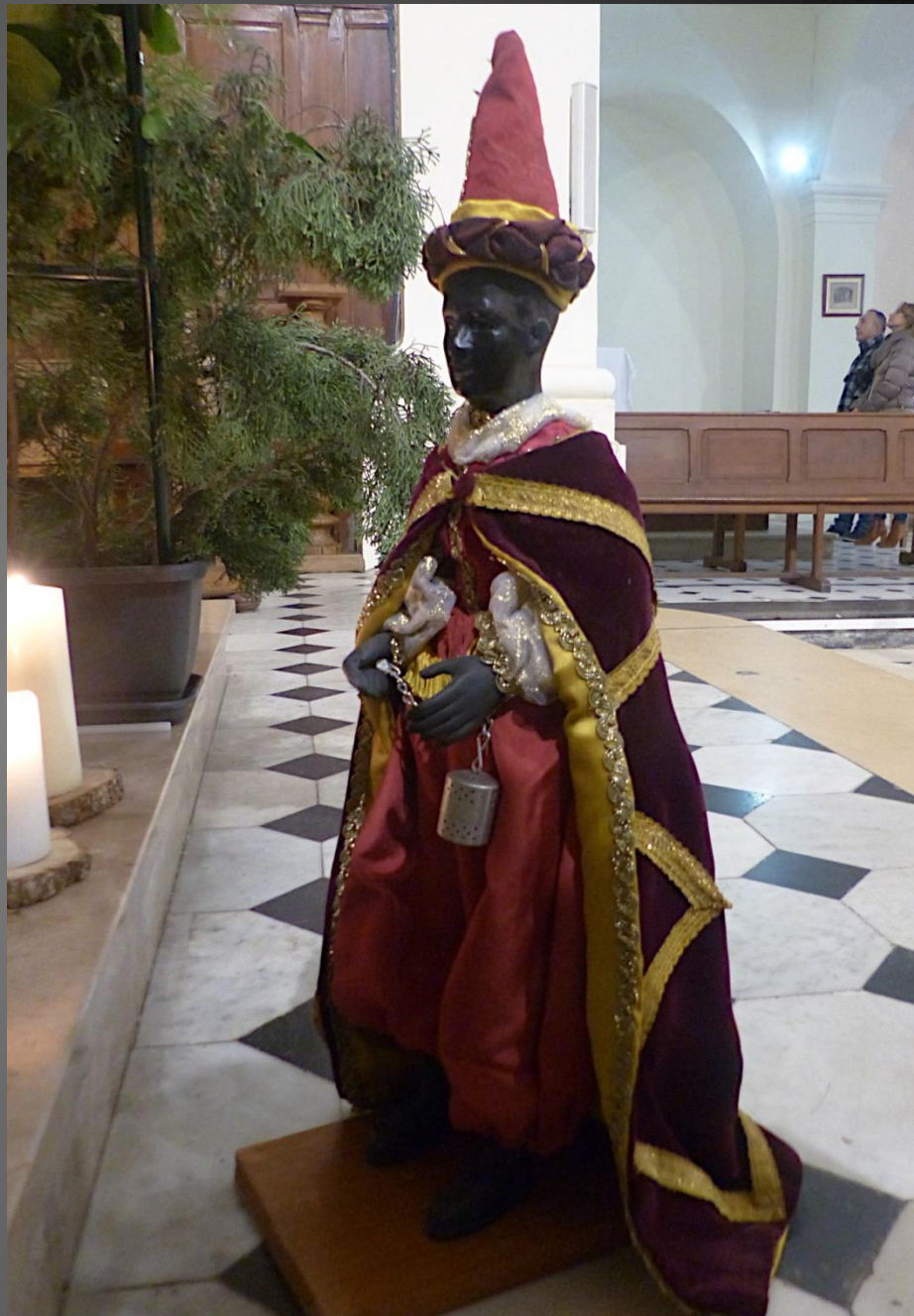
Balthazar est décrit avec un visage noir, il est descendant de Cham, fils de Noé et représente l'Arabie. Il offre de l'or (réservé aux rois), symbole de la royauté de Jésus.