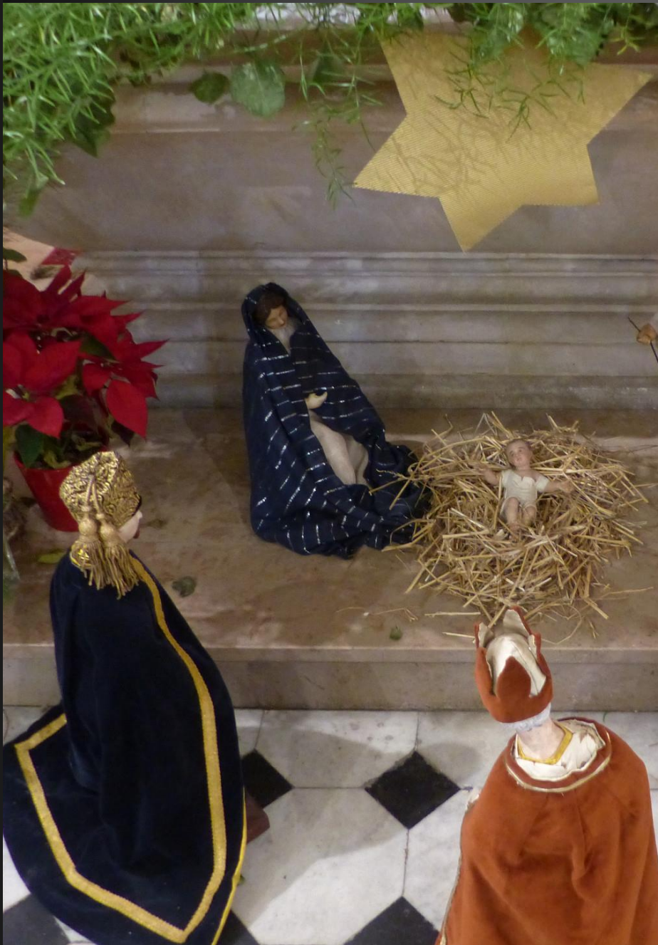
Gaspard, Melchior et Balthazar, Les Rois Mages de l'Orient, ont suivi l'étoile, et apporté l'or, l'encens et la myrrhe pour honorer le Roi des Juifs.