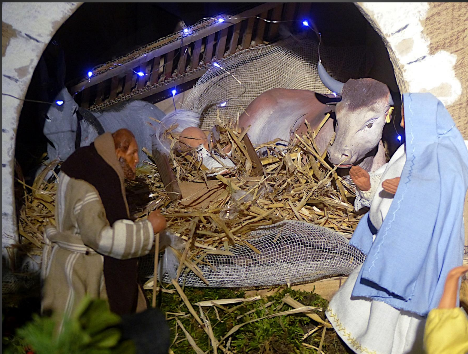
Nativité _ Or, pendant qu'ils étaient là, arrivèrent les jours où elle devait enfanter. Et elle mit au monde son fils premier-né; elle l'emballota et le coucha dans une mangeoire, car il n'y avait pas de place pour eux dans la salle commune. (Luc 2, 7).