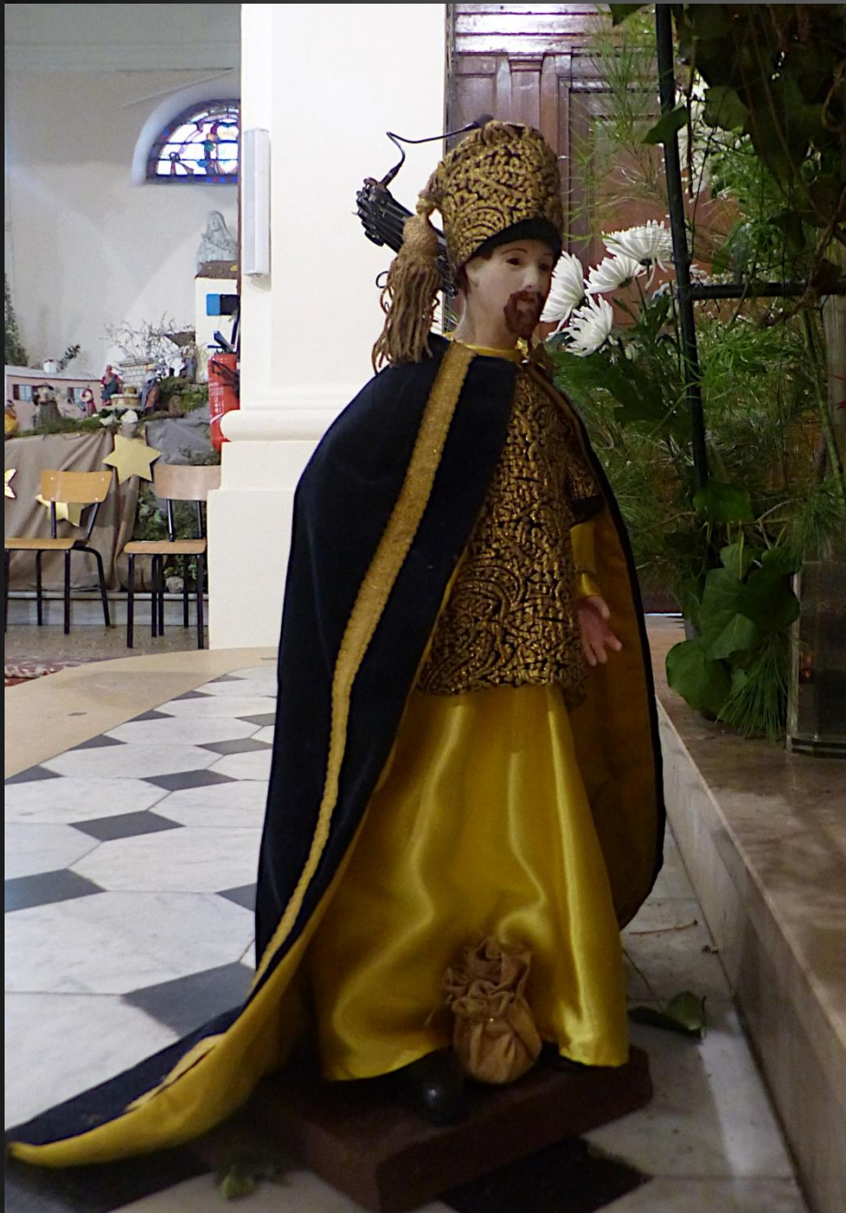
Melchior est décrit comme étant jeune, au visage asiatique et représente l'Inde. Il offre de l'encens (employé pour honorer Dieu), symbole de la divinité de Jésus.