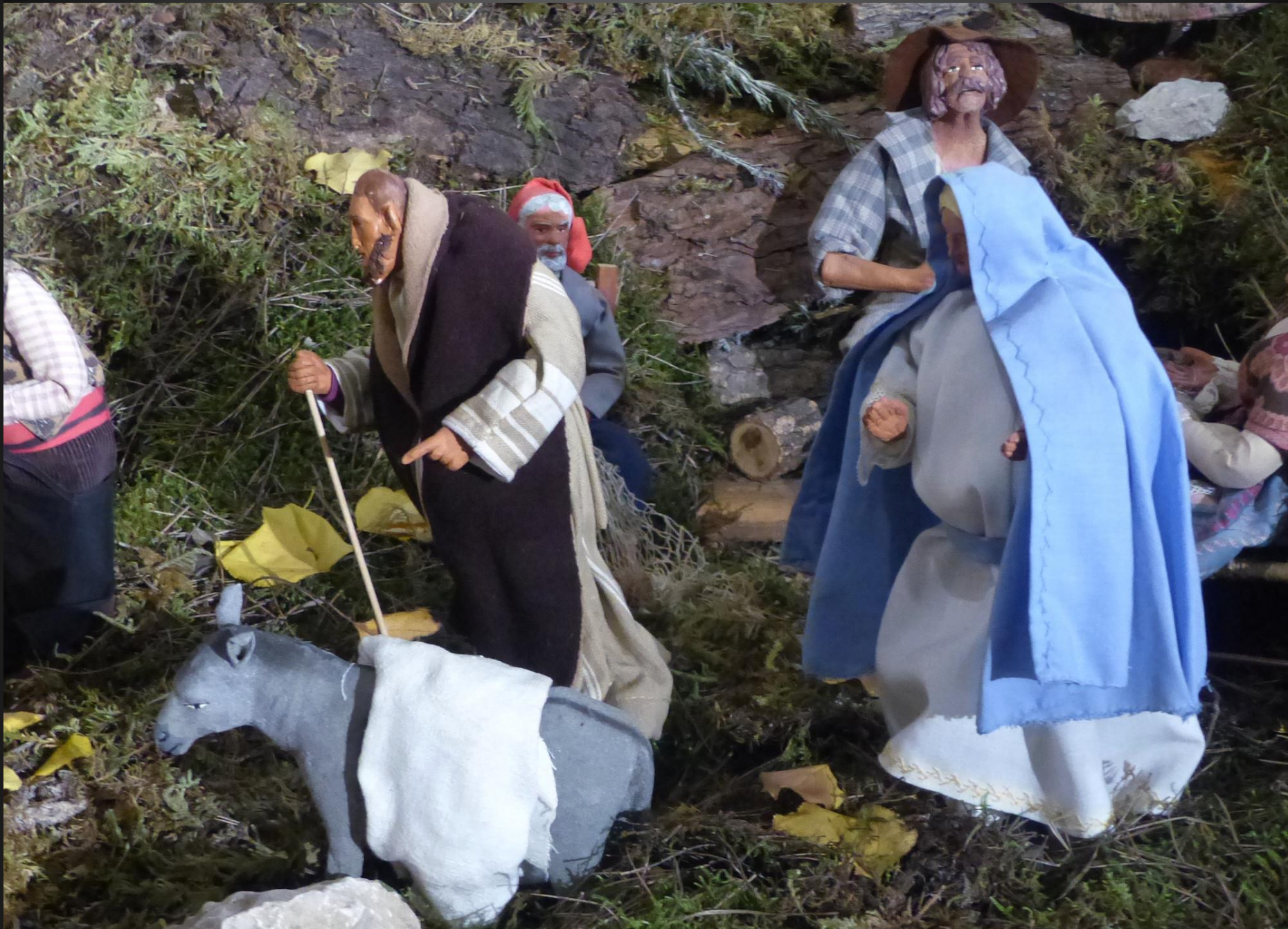
2 e dimanche de l'Avent _ Marie et Joseph sont toujours en chemin vers Bethléem.