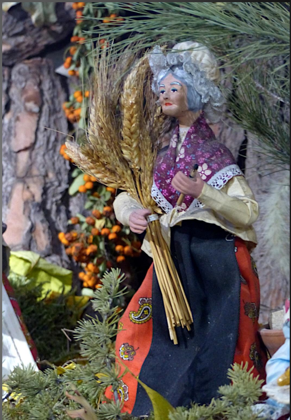
4 e dimanche de l'Avent _ Marie et Joseph sont arrivés à Bethléem.