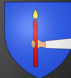
Blason de La Fare

D'or au gousset renversé d'azur chargé en cœur d'une fleur de lys du champ surmontée d'un lambel de gueules brochant sur le tout.