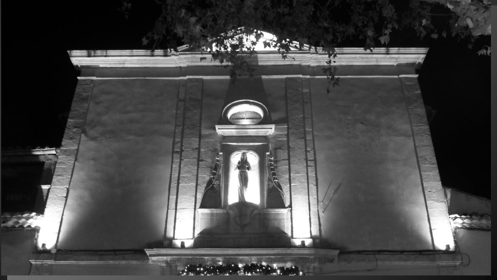
LA FARE-LES-OLIVIERS _ L'église Saint-Sauveur illuminée le soir durant le temps de Noël.