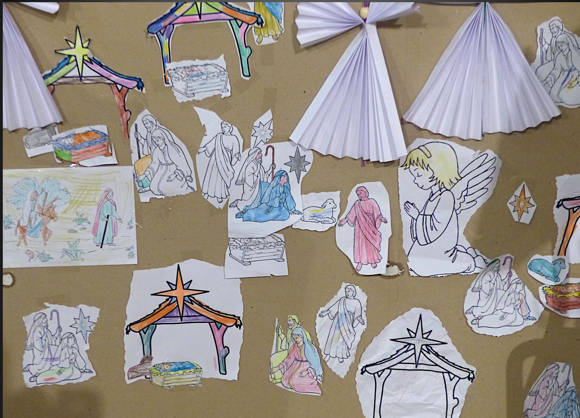
Les enfants du catéchisme ont dessiné et colorié des scènes de la Nativité.