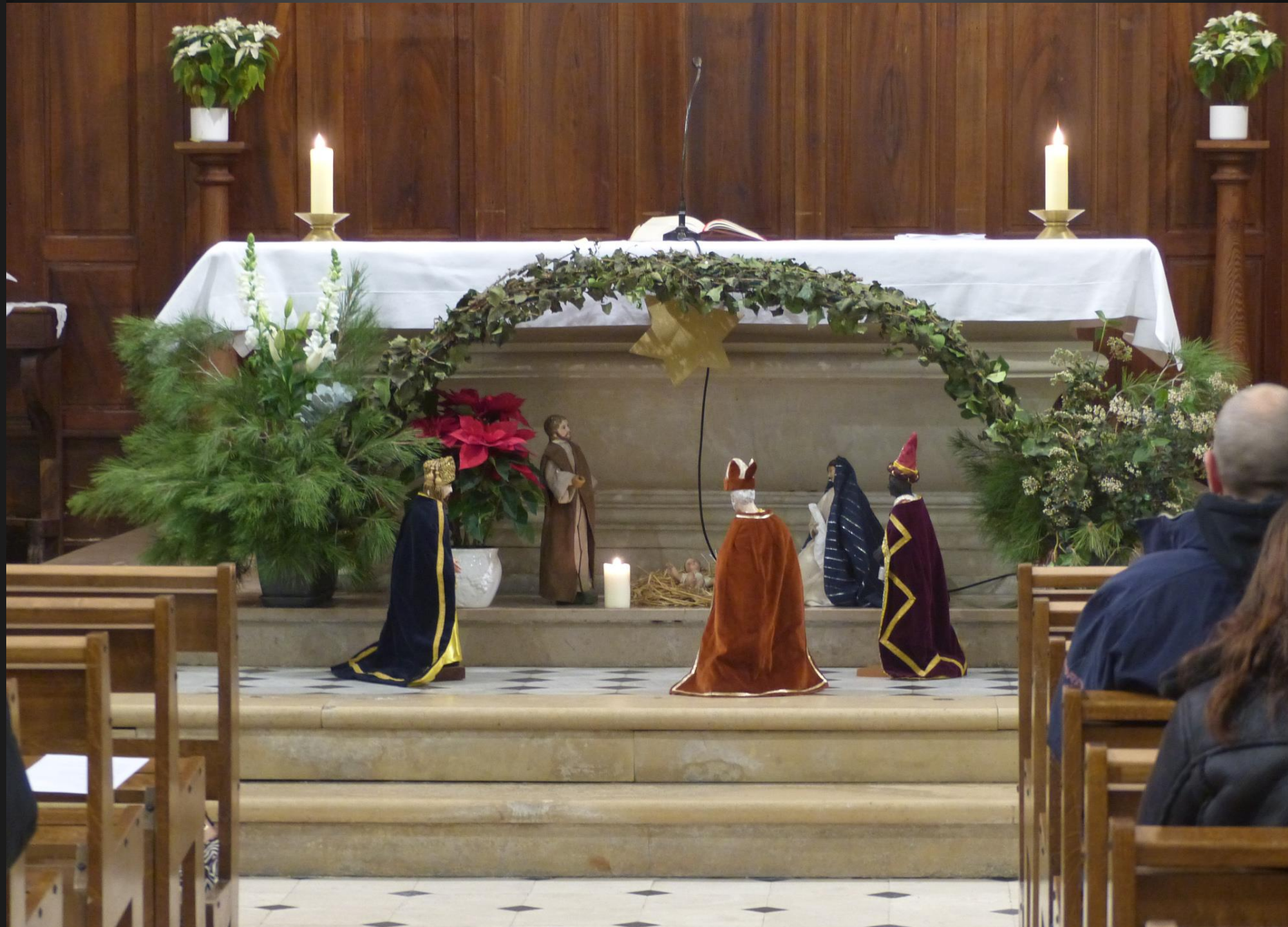
Les Rois Mages, Melchior, Gaspard et Balthazar ont suivi l'Etoile jusqu'à Nazareth où ils ont offert respectivement à l'Enfant Roi l'or, l'encens et la myrrhe.