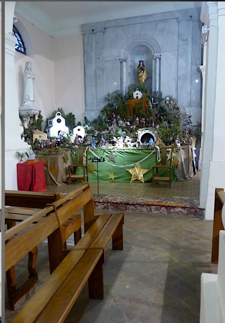
La crèche a été construite dans la chapelle Sainte-Rosalie.