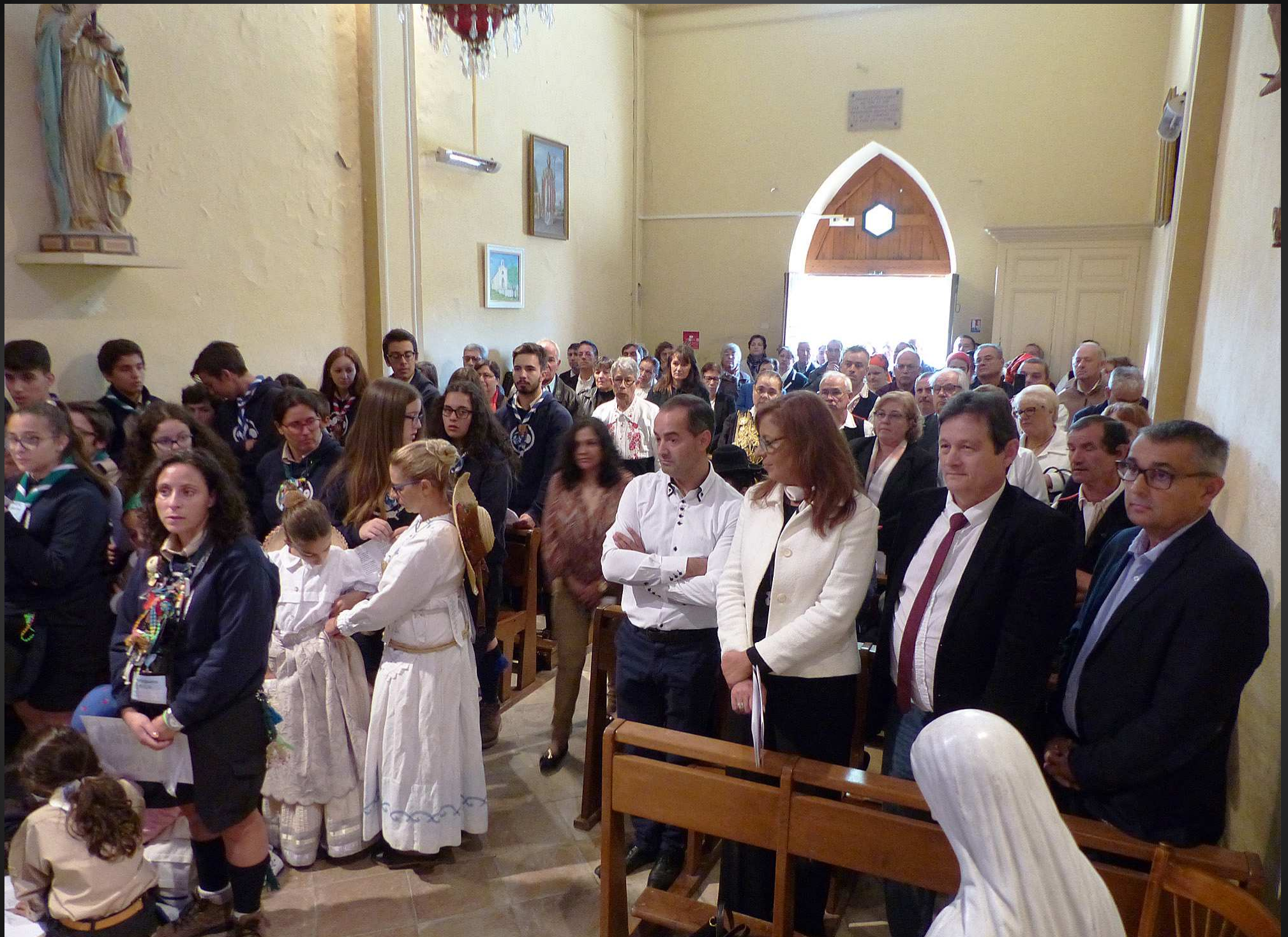
LA FARE 16 octobre 2016 _ Les maires de Coggiola (Italie), Garfe (Portugal) et La Fare-les-Oliviers (France) sont au premier rang (ci-dessus à droite).