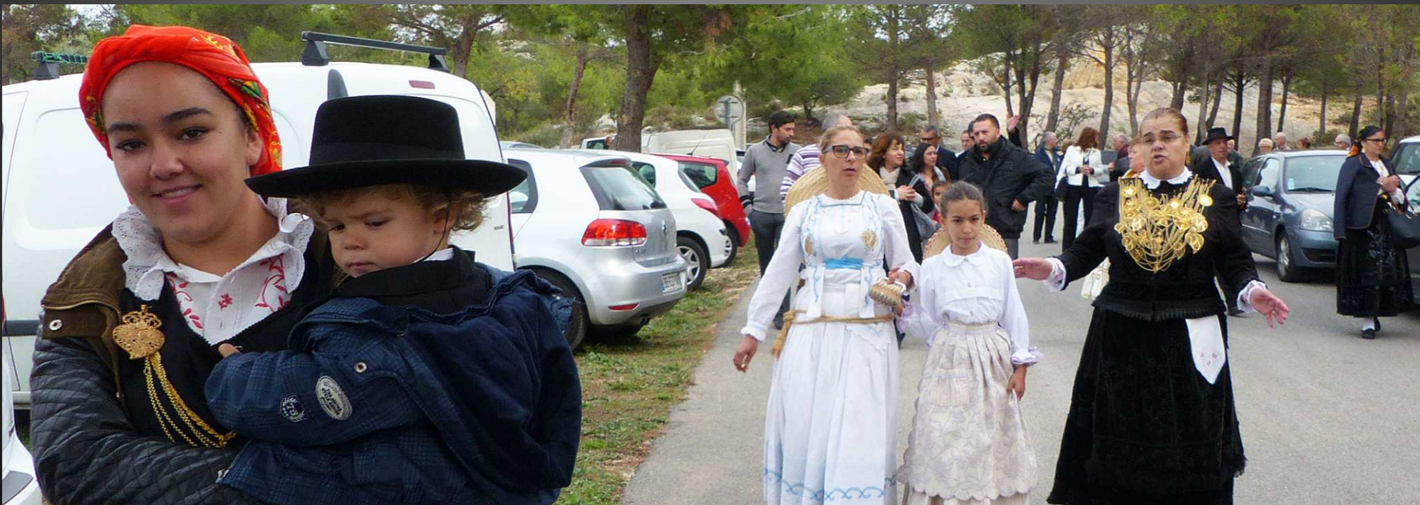
LA FARE 16 octobre 2016 _ Fin de la messe, les Portugais se rendent au point de départ du défilé qu'ils vont animer avec danses et fanfare.