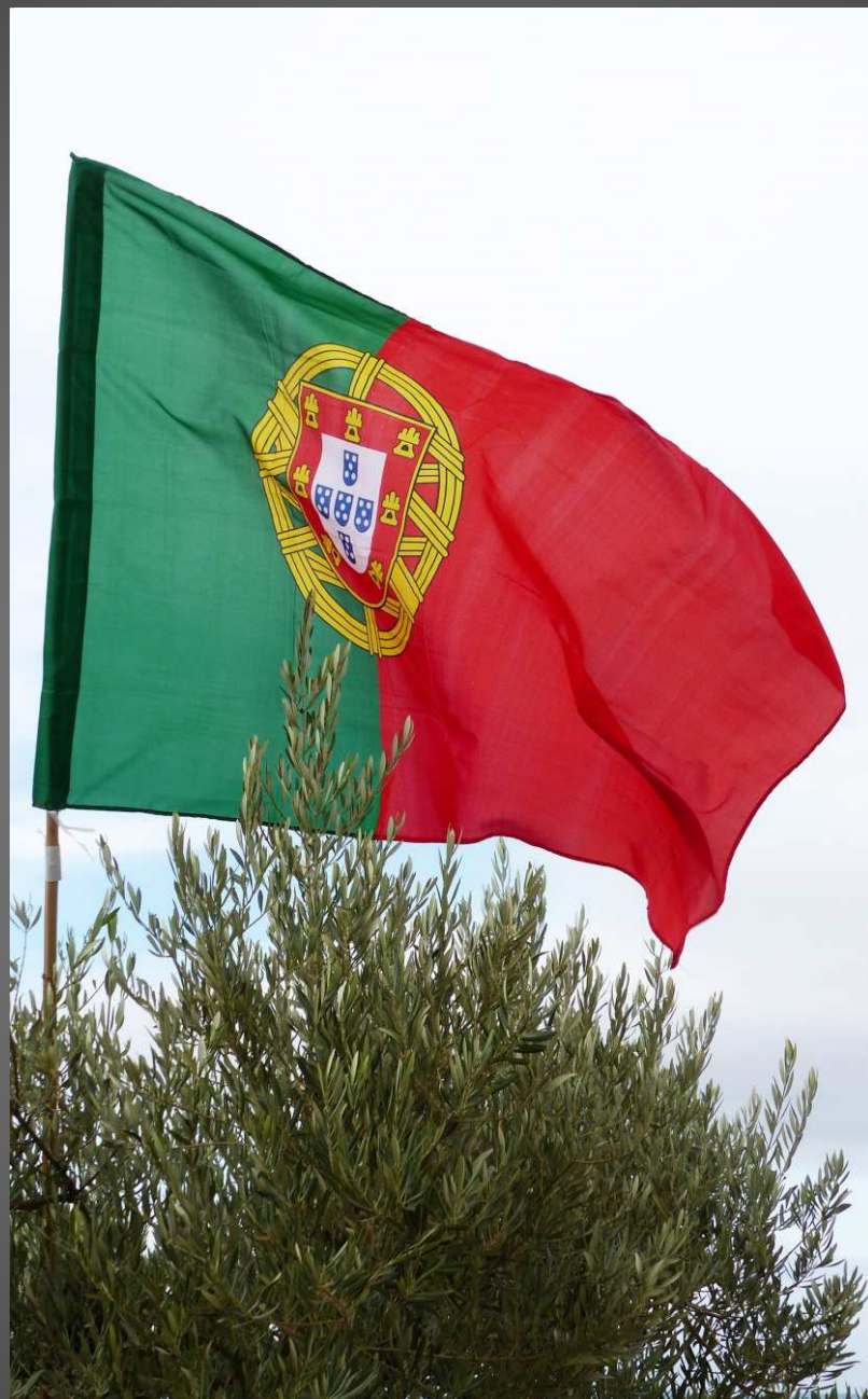
LA FARE-LES-OLIVIERS Le drapeau du Portugal flotte au-dessus du rond-point de Garfe.