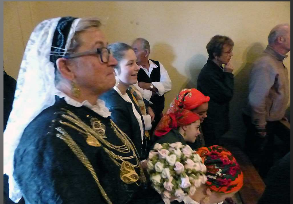
LA FARE 16 octobre 2016 _ Arrivée des fidèles Portugais à la chapelle Sainte-Rosalie pour une messe matinale.