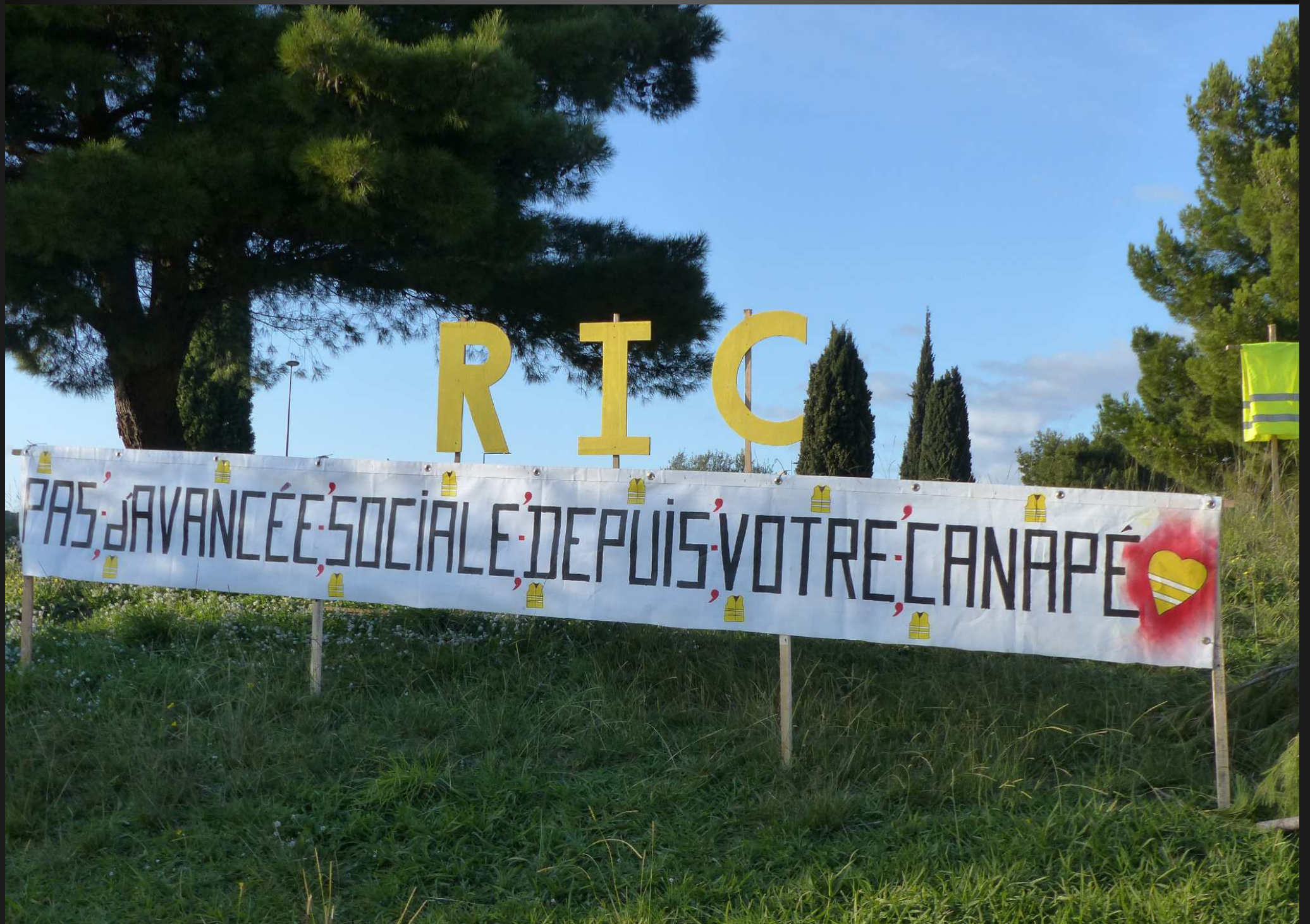
Samedi 16 novembre 2019 _ Une banderole illustre bien le désir des Gilets Jaunes de mobiliser la population, dont plus des deux tiers (69%) soutiennent le mouvement selon une enquête Odoxa-Dentsu Consulting publiée par Le Figaro le 14 novembre 2019. (Source : https://www.lefigaro.fr/actualite-france/gilets-jaunes-un-an-apres-deux-francais-sur-trois-trouvent-le-mouvement-justifie-20191114 )