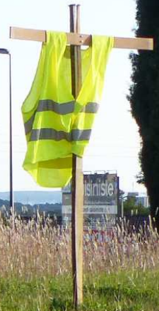
Samedi 16 novembre 2019 _ Un aperçu de la pression constatée par les Gilets Jaunes sur leur budget, qui dénote avec le taux "officiel" de l'inflation à 1,2% sur les sept premiers mois de 2019 : comme pour la température, l'inflation ressentie est nettement plus élevée que l'inflation indiquée sur le thermomètre de l'économie. (VOIR : http://france-inflation.com/index.php )