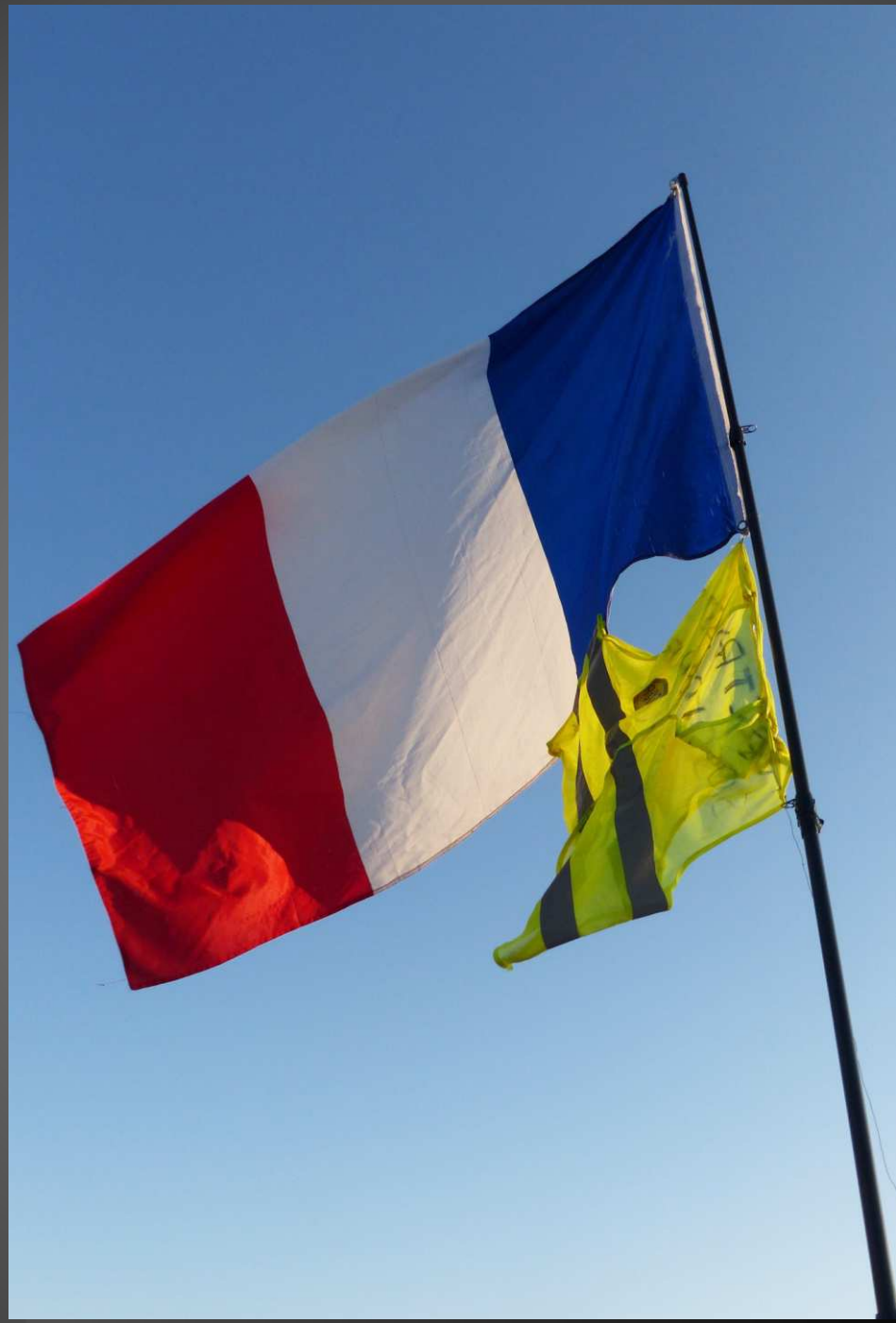
GILET JAUNE et DRAPEAU TRICOLORE