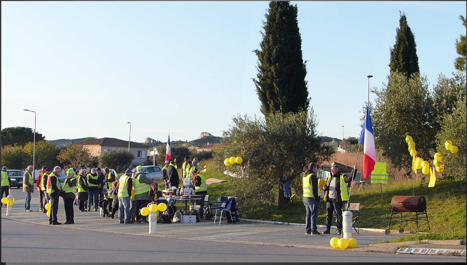
Rassemblement des Gilets Jaunes en fin d'après-midi pour célébrer le 1 er anniversaire du mouvement démarré le 17 novembre 2018.