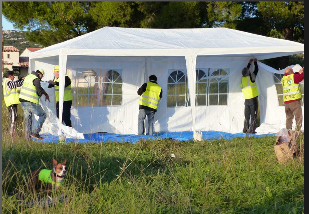
Samedi 16 novembre 2019 _ Canis lupus , lui aussi, il est mobilisé avec un gilet jaune...