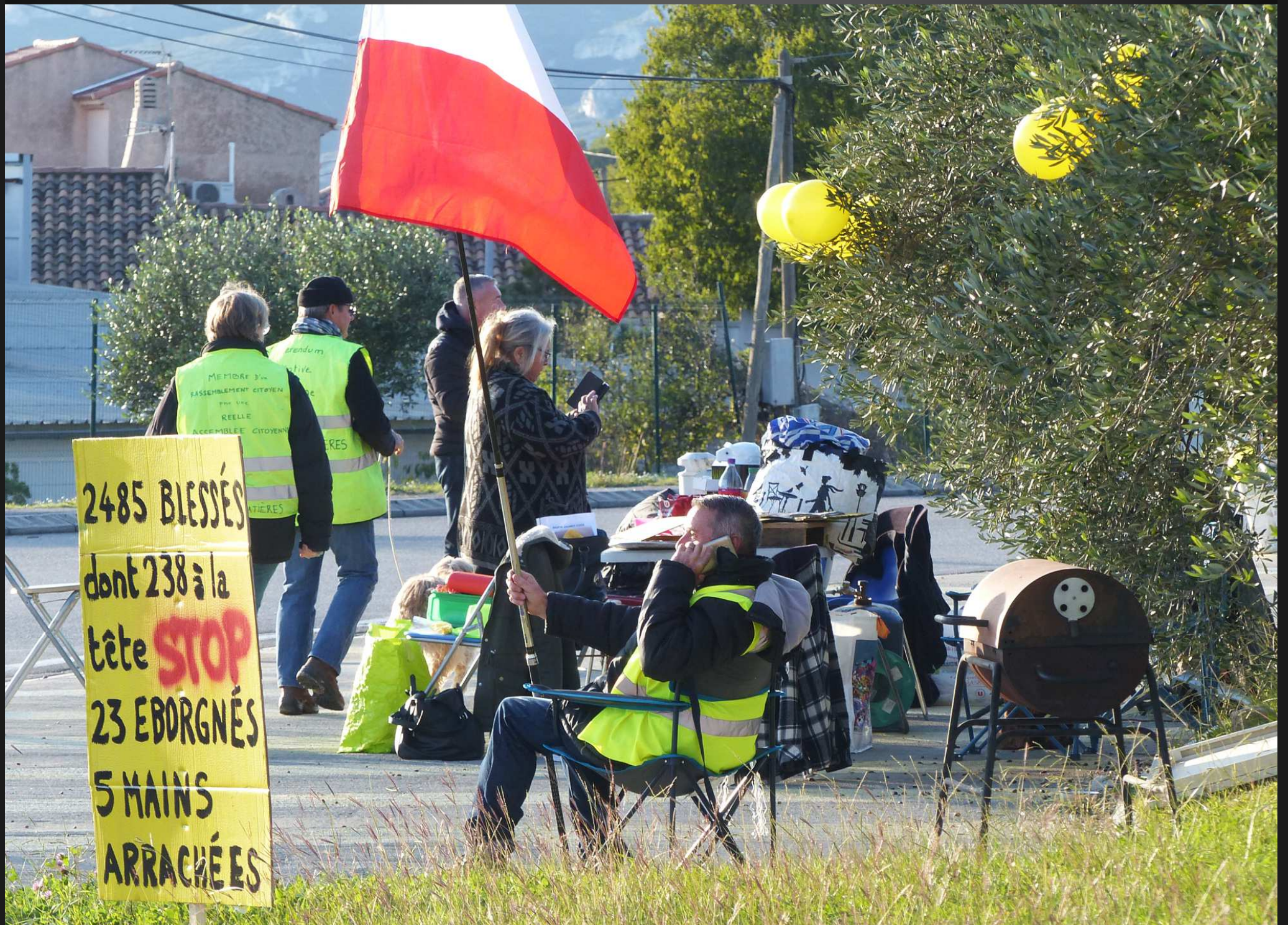
Samedi 16 novembre 2019 _ Parmi les différents panneaux portant revendications et slogans, celui-ci affiche le triste bilan d'une répression inédite depuis 1945.