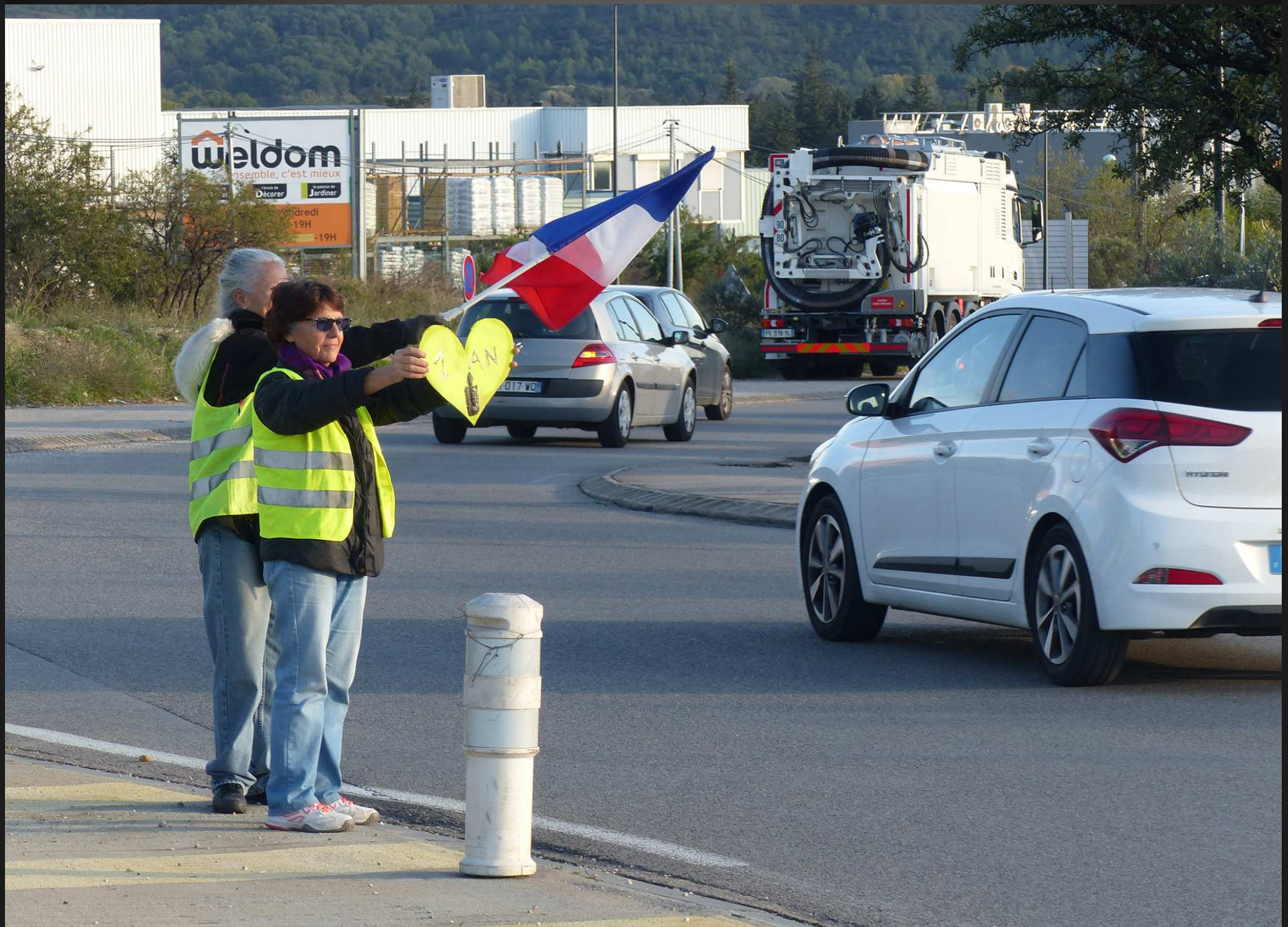
Samedi 16 novembre 2019 _ Concert de klaxons autour du rond-point, les automobilistes saluant les Gilets Jaunes font entendre leur soutien au mouvement.