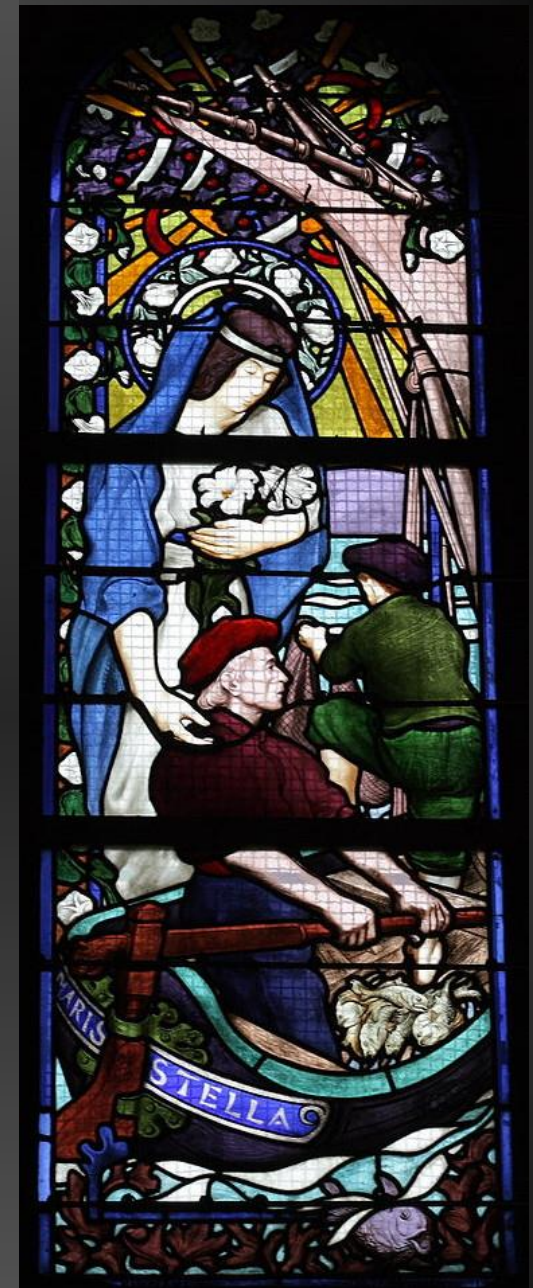
Vitrail de Marie, Stella maris , église Sainte-Croix, Bordeaux.