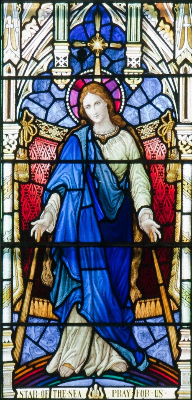
Star of the Sea detail, Church of Our Lady and St. Patrick, South Wall fourth window, Goleen, Ireland.