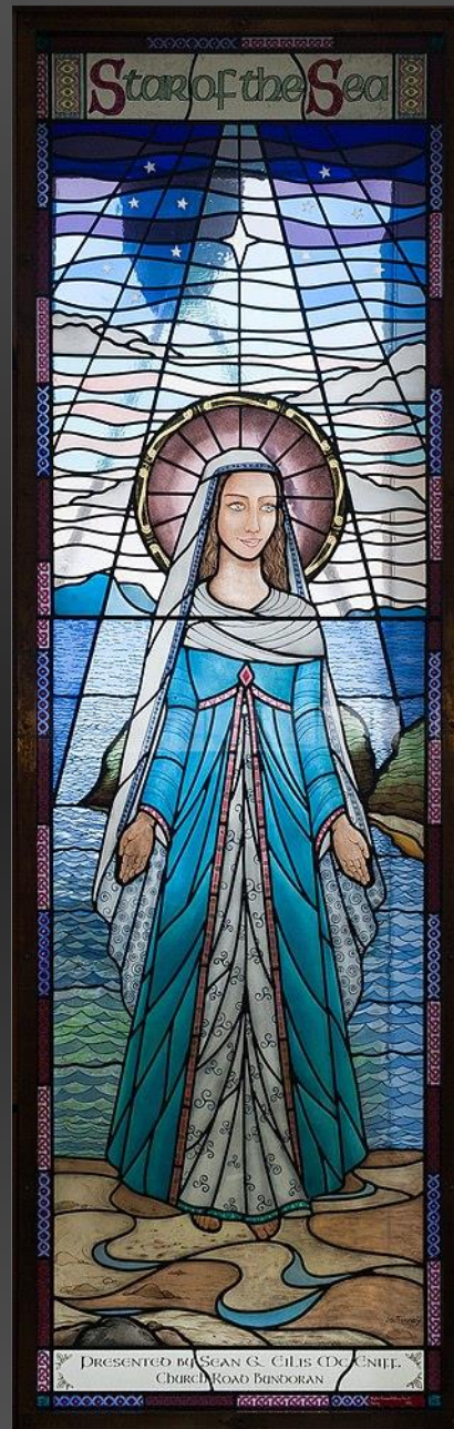
Star of the Sea stained glass window (2012) by Jo Tinney, depicting Our Lady, Star of the Sea with the Donegal Bay as seen from Bundoran in the background, Ireland. (Wikipedia)