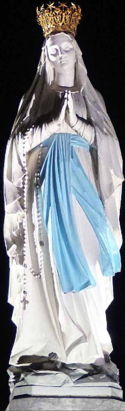
Statue de Notre-Dame Lourdes 2016