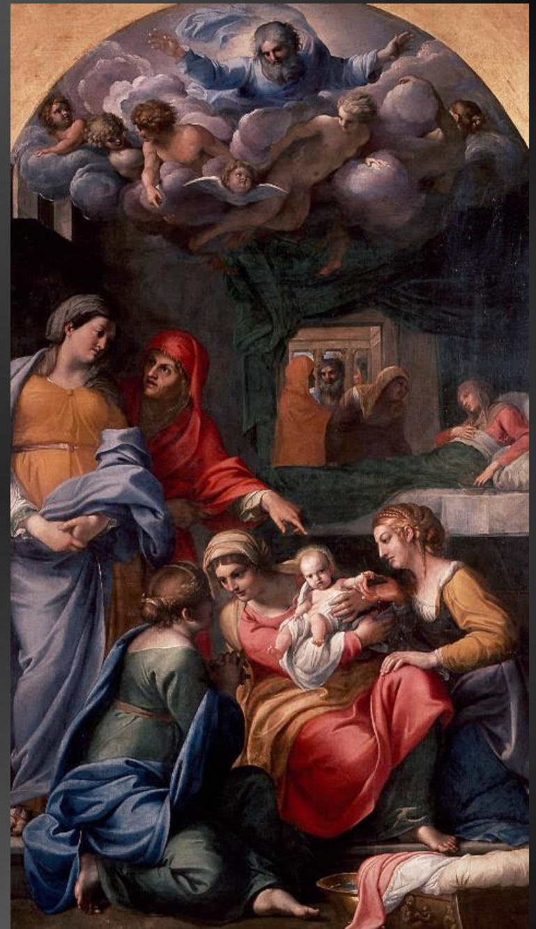
Naissance de la Vierge, par Annibale Carracci (1560-1609), conservé au musée du Louvre.