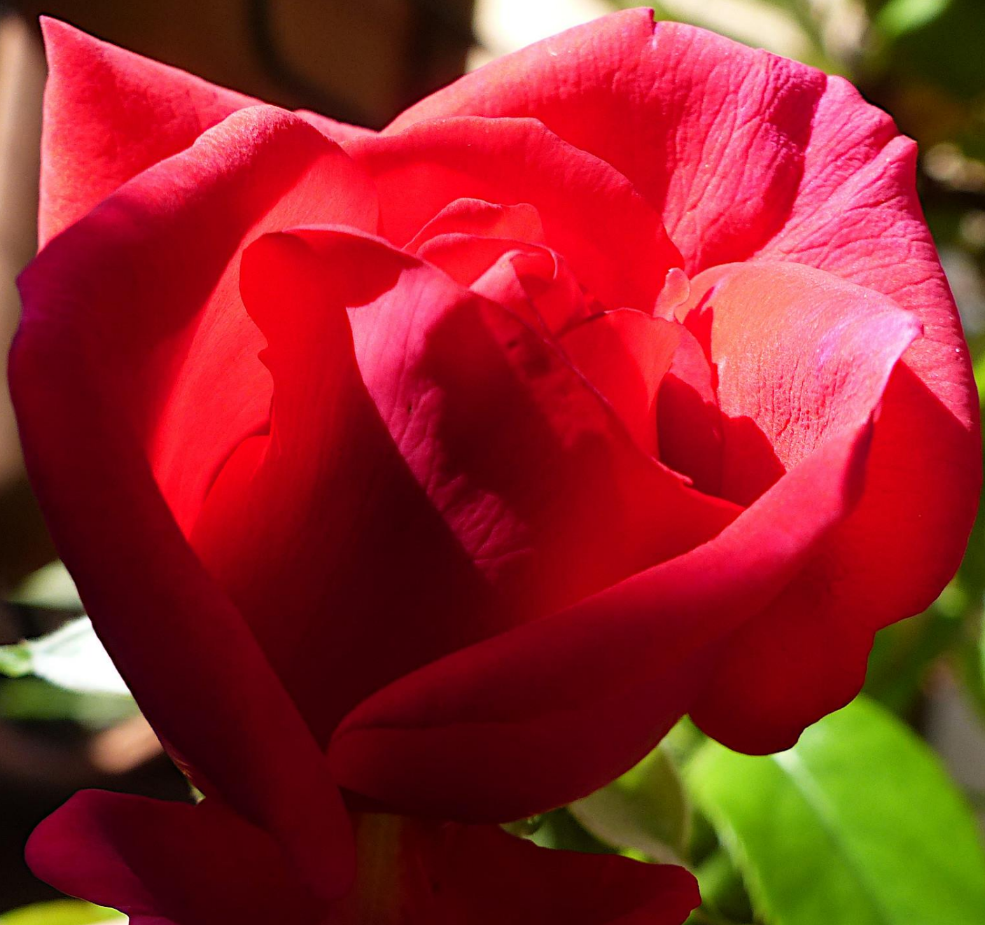
LA FARE 08 septembre 2023 la rose 'Adharman au parfum capiteux, dans sa prime jeunesse.