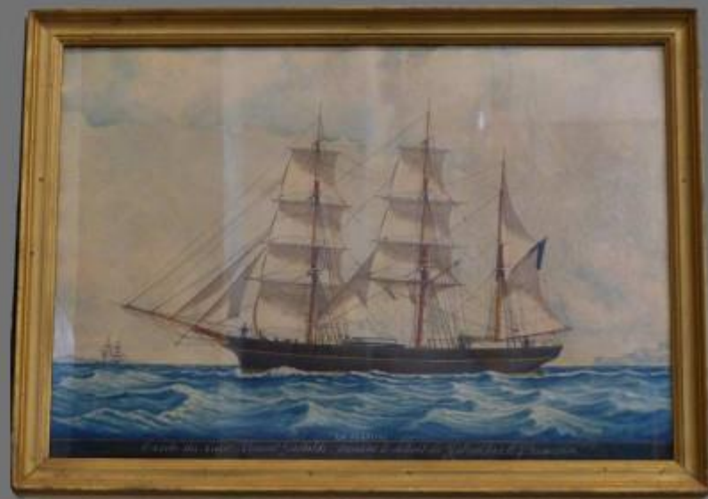
BASILIQUE NOTRE-DAME DE LA GARDE _ Ces témoignages irréfutables sont naturellement contestés par les ennemis héréditaires de Marie qui attribuent ces sauvetages miraculeux au seul hasard...