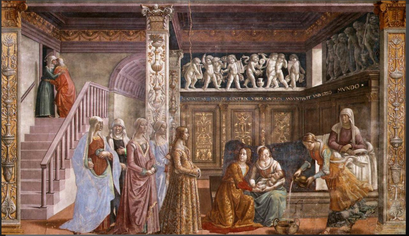
Nativité de la Bienheureuse Vierge Marie, par Domenico Ghirlandaio (1148-1494), basilique Santa Maria Novella à Florence, Italie.