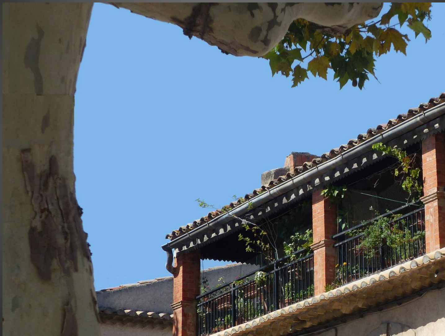
LA FARE _ Le balcon du Presbytère.