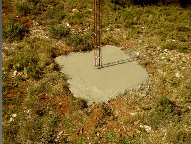
Une solide fondation en béton avec une armature métallique – techniques d'aujourd'hui - pour une construction « à l'ancienne ».