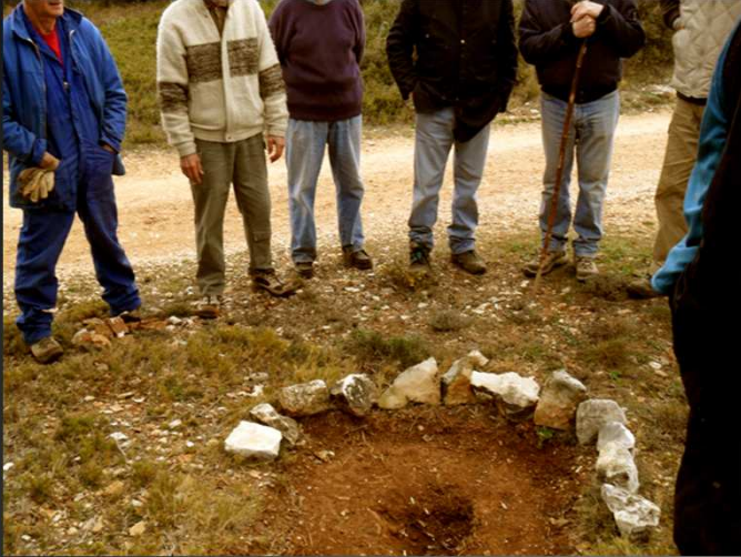
Les bénévoles, concentrés sur la tâche à accomplir, à l'endroit retenu pour l'édification de l'oratoire de la « Bretelle farenque »