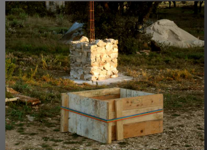
L'oratoire en cours de construction .