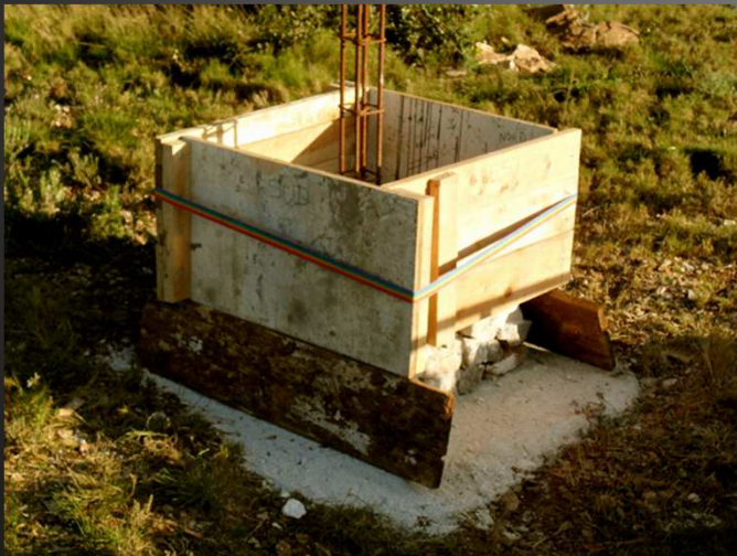
Lorsque le ciment est sec, le gabarit est surélevé pour ajouter la section suivante : la hauteur totale prévue de l'édicule est 1m80.