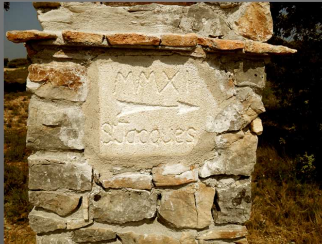
Une pierre gravée sur la façade de l'oratoire indique la direction de Saint-Jacques de Compostelle, et le millésime en chiffres romains...