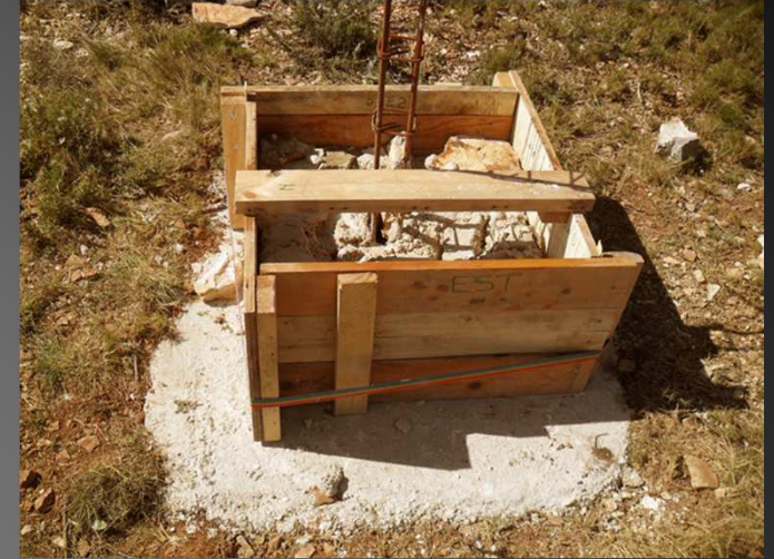
Le gabarit fabriqué par JP OLLIER avec des planches - de récup - permet de bien caler les pierres.