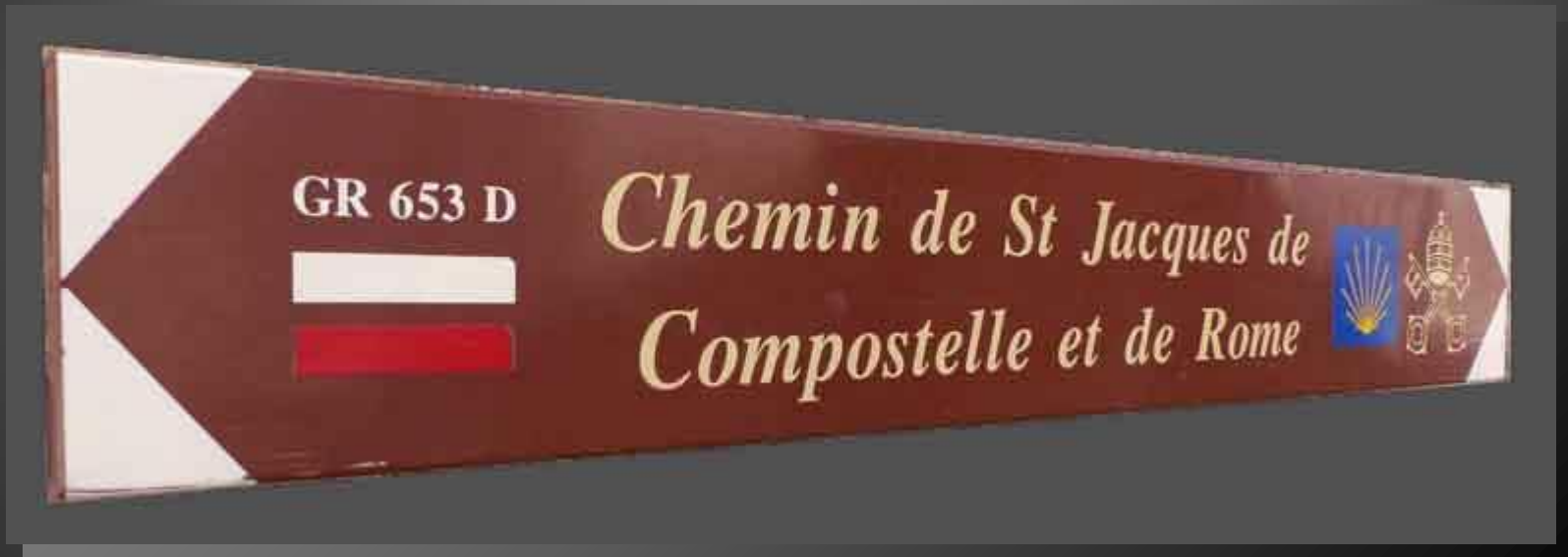
Le chemin de ROME à COMPOSTELLE, 2 300 km entre deux grands Sanctuaires de la Chrétienté.