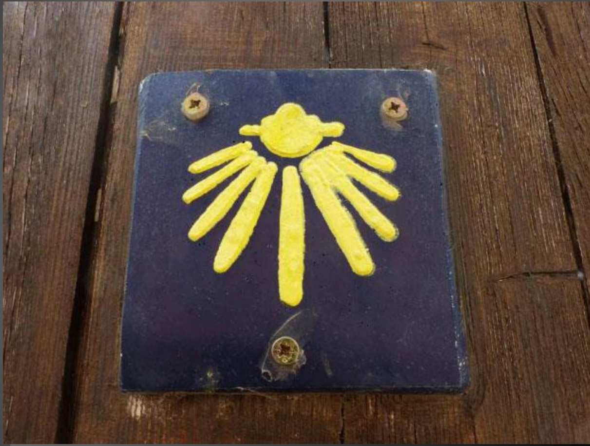
LA COQUILLE _ Sur le portail d'entrée du Gîte Donativo de La Fare-les-Oliviers.