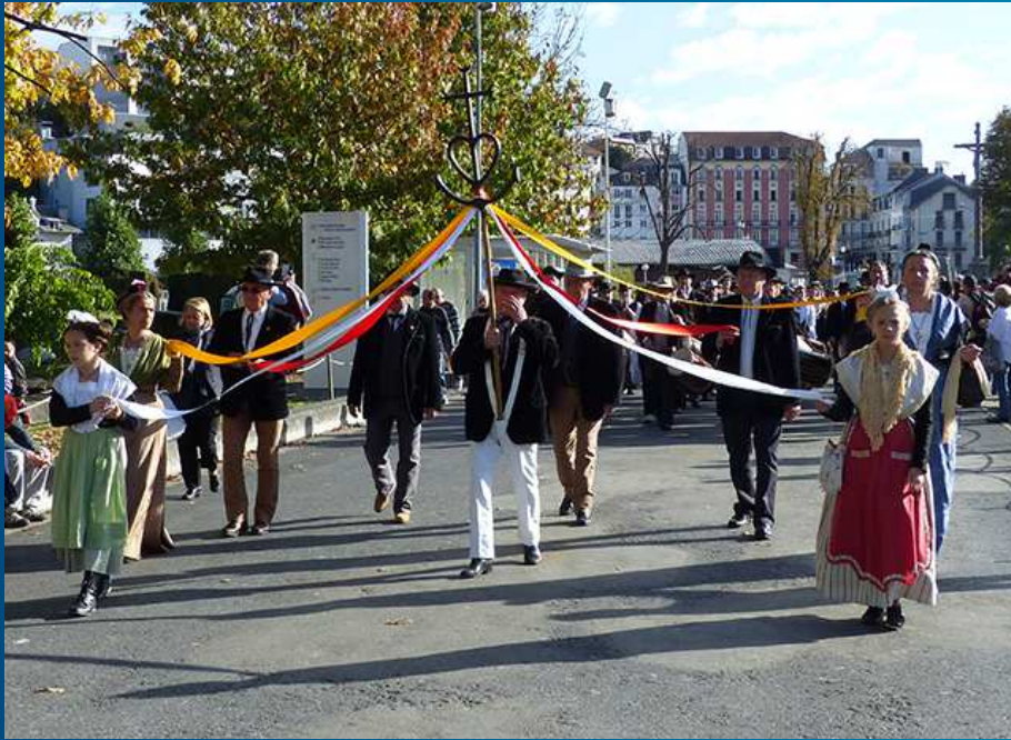
Le cortège : Arlésiennes et Mireilles tiennent les rubans de la Croix de Camargue.