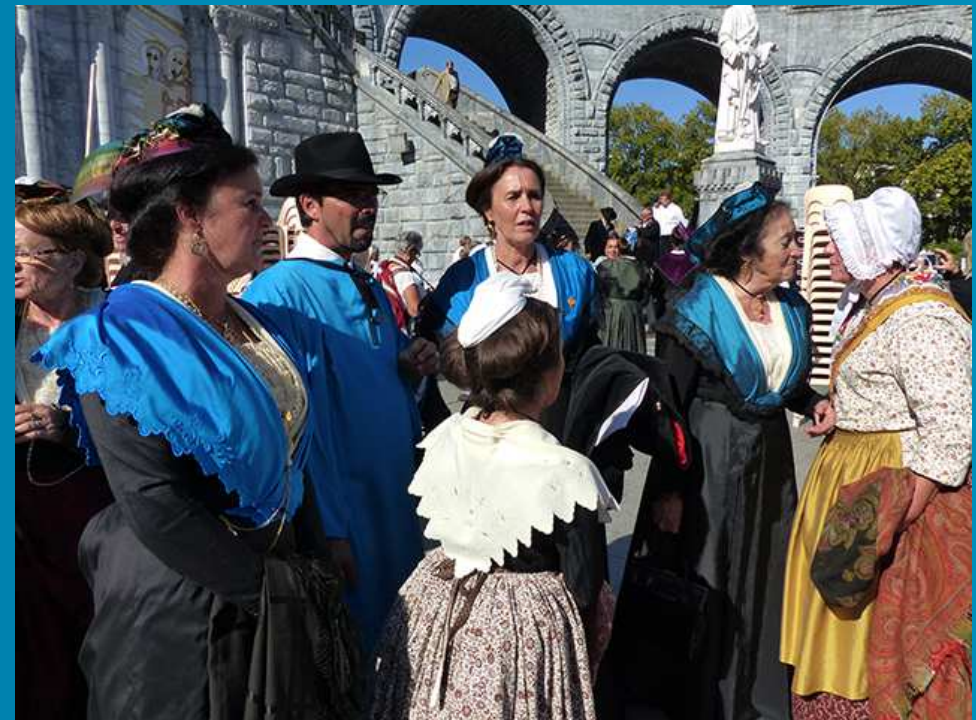
La messe terminée, de nombreux pèlerins viennent sur le parvis et comme la Chorale Sainte-Cécile (page suivante) posent dans la bonne humeur pour une photo souvenir...