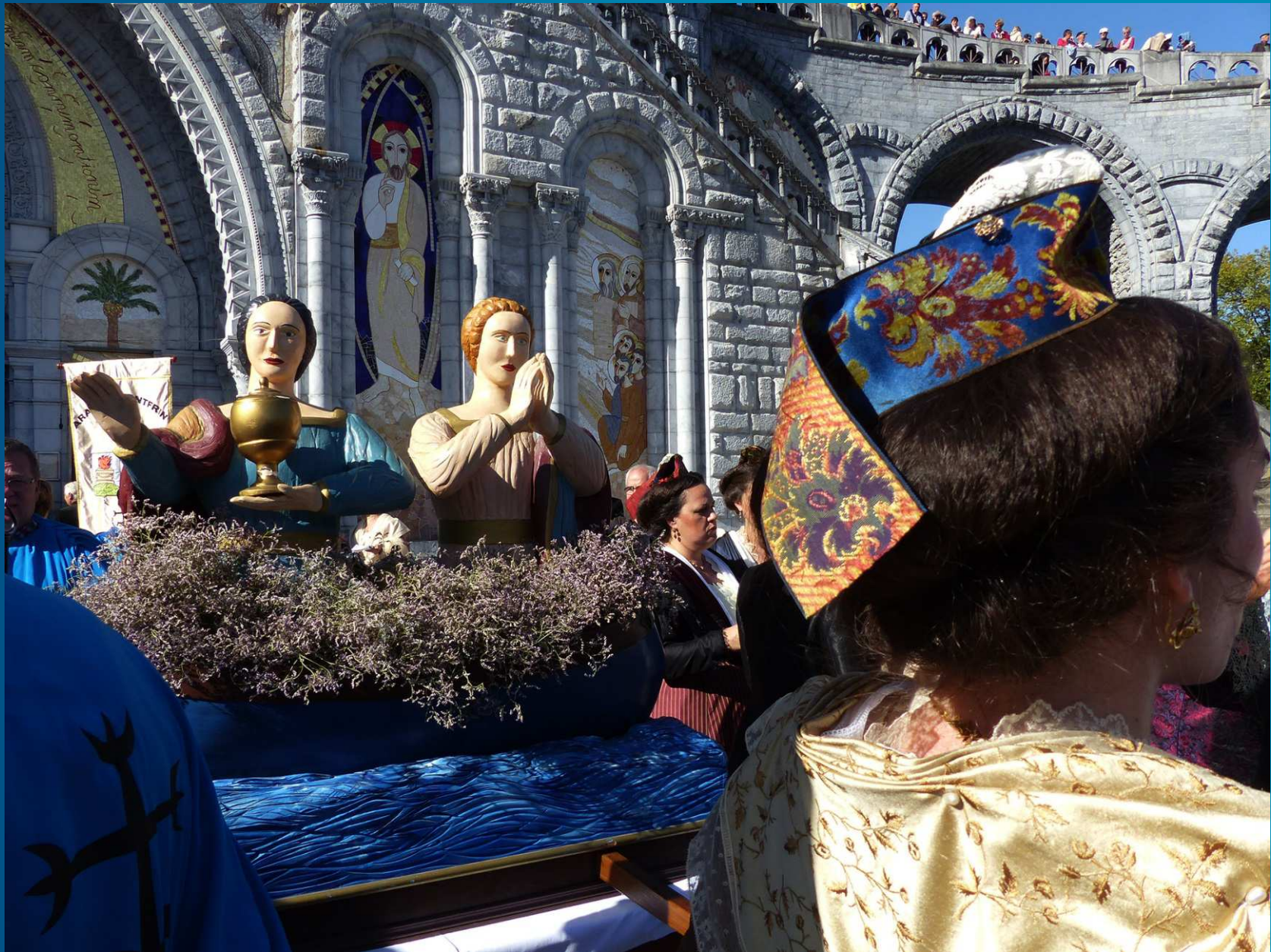
Aux saints évangélistes de Provence – dont les Saintes Maries Jacobé et Salomé – succéderont, en 2016, saint Eloi, saint Roch et saint Jean-Baptiste, des figures extrêmement populaires en Provence avec des confréries dynamiques comme celles qui organisent les Carreto Ramado dans la région des Alpilles.