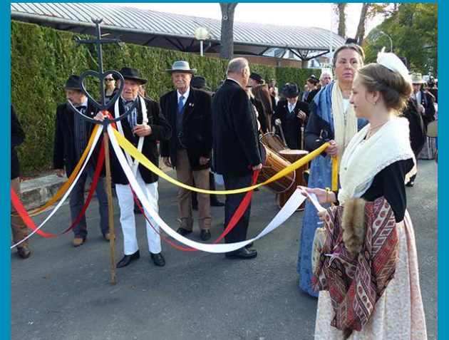
Le grand rassemblement de la Nacioun Gardiano a lieu à la Porte Saint-Michel, à l'extrémité de l'esplanade, que le long cortège des pèlerins va emprunter, derrière la Croix de Camargue et au son des galoubets-tambourins, en direction du parvis de la Basilique Notre-Dame du Rosaire.