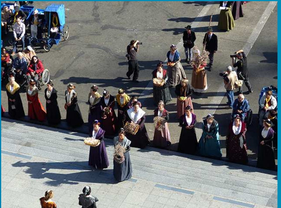
La procession des Offrandes : des tambourinaires emmènent la longue file des Arlésiennes portant les diverses offrandes, fruits du travail des hommes, pour être posées au pied de l'autel.