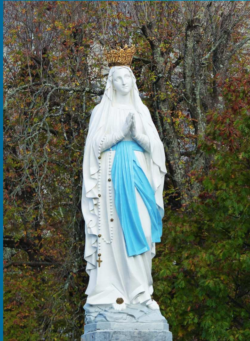
Statue de la Vierge couronnée, au début de l'esplanade du Sanctuaire, Reine du Ciel mais pas seulement : il y a au moins une paroisse Notre-Dame de la Forêt, et c'est dans le doyenné des Sables d'Olonne, en Vendée...