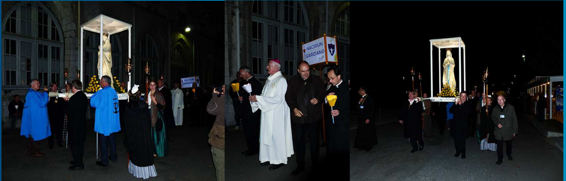
La procession se met en place, sous l'œil attentif de Mgr Pierre-Marie Carré, Archevêque de Montpellier, alors que des pèlerins du monde entier attendent au bord de l'esplanade.