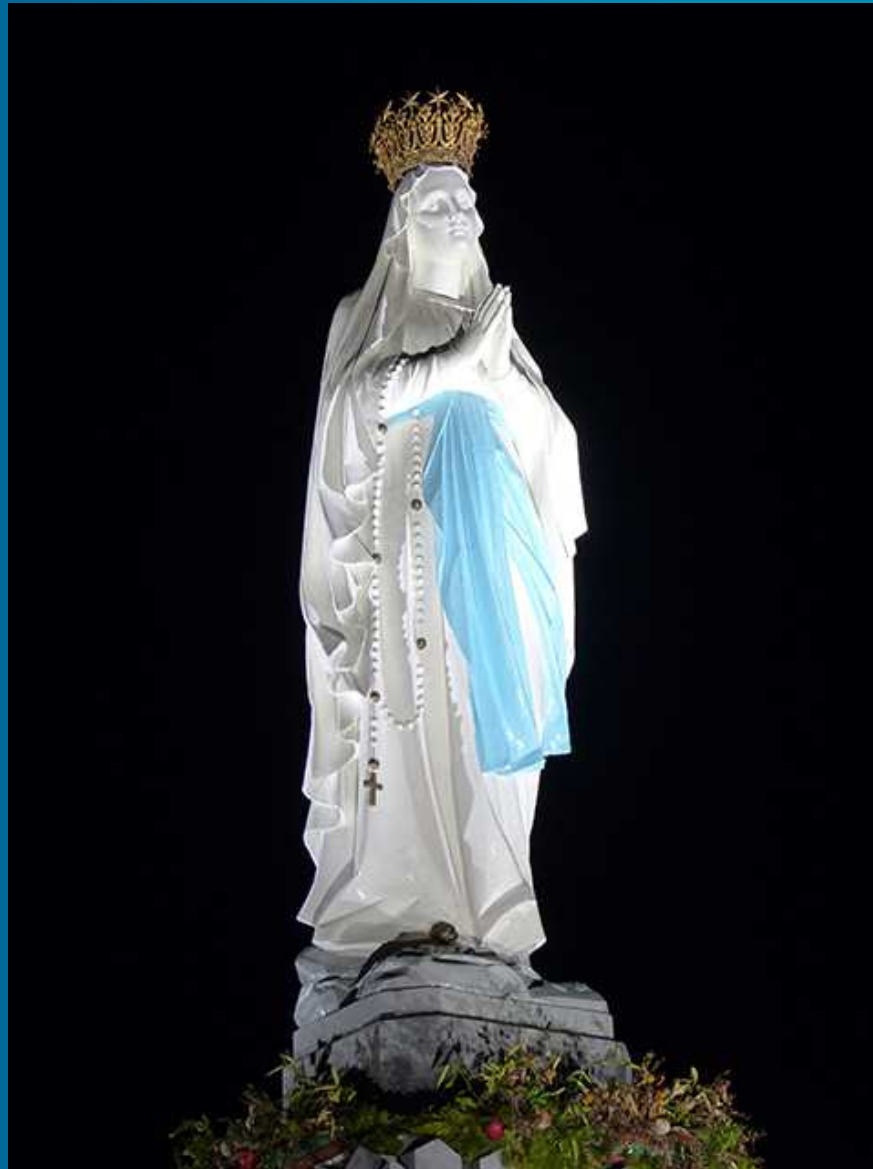
Statue de la Vierge couronnée au début de l'esplanade, pendant la procession mariale.