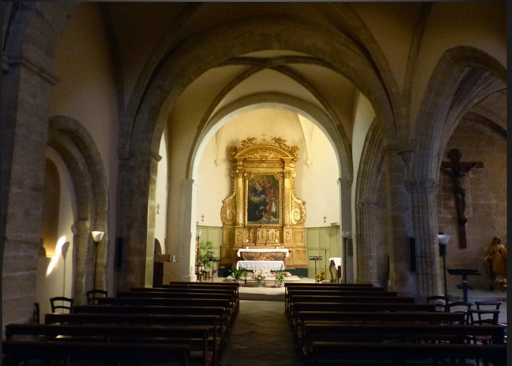
LA NEF PRINCIPALE (XVIe s.) : voûte à croisées d'ogives, et dans le chœur, un très beau retable.