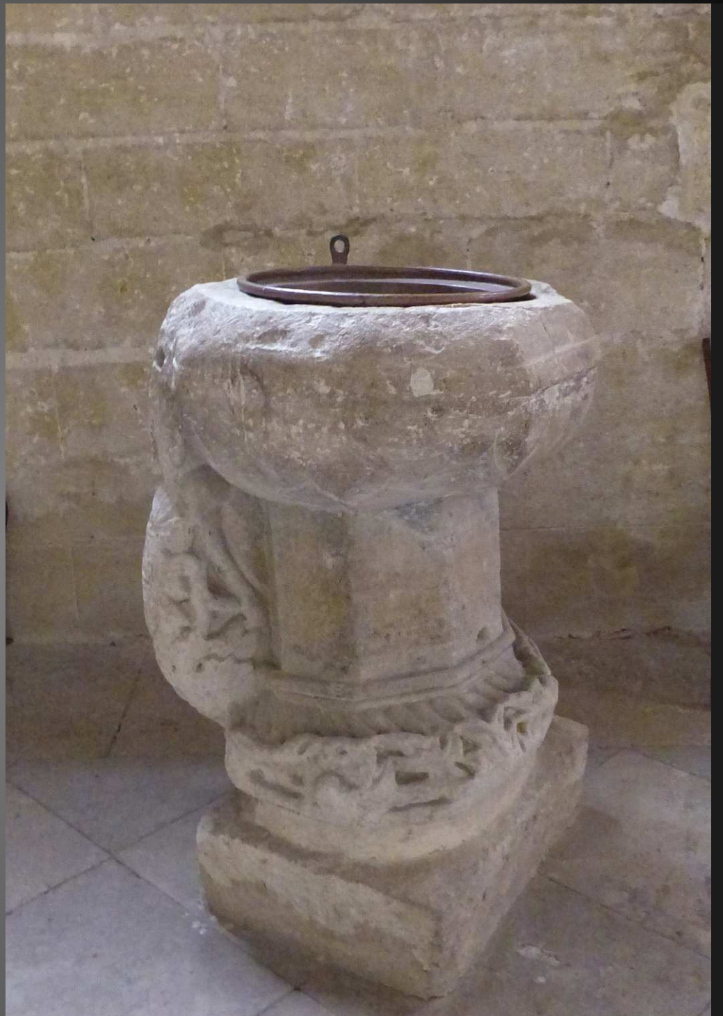
FONTS BAPTISMAUX : ils sont constitués d'un chapiteau de colonne inversé où l'on peut voir un animal sculpté, un loup rampant et campé sur ses pattes. Ce blason de la famille d'Agoult-Montauban fait partie des armoiries de Lourmarin.