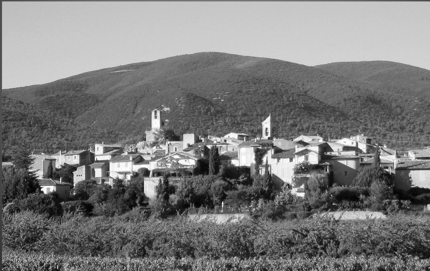
LOURMARIN, vue du Sud.