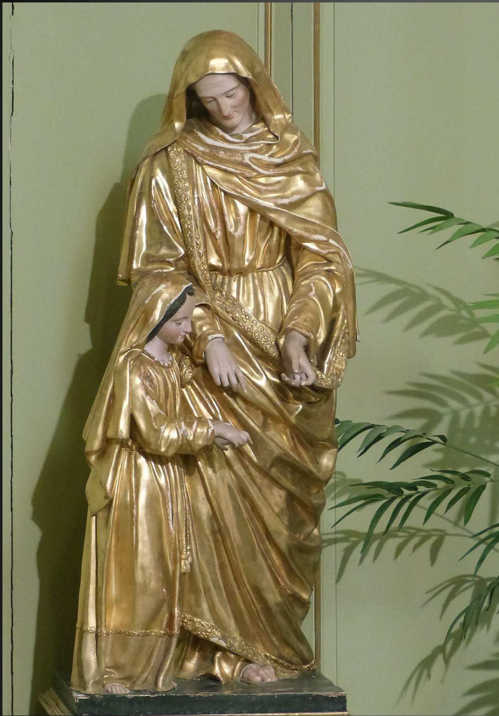
Statue de sainte ANNE, aïeule du Christ, avec sa fille MARIE.