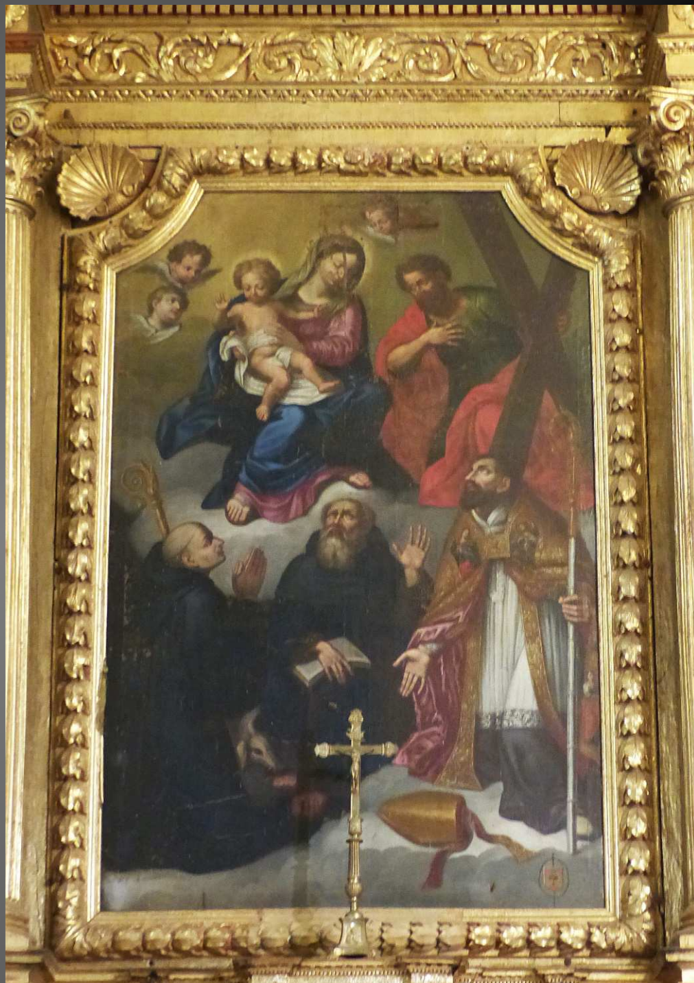
LE RETABLE : A g. inscription latine au-dessus du retable " Laetetur cor quarentium Dominum " (Que se réjouisse le coeur de ceux qui cherchent le Seigneur. Psaume 104, 3). A dr. le tableau du retable, représentant (probablement) saint Trophime, 1 er évêque d'Arles, sa mitre à terre, avec deux moines dont un Abbé, et sur une nuée, la Vierge et l'Enfant accompagnés par saint André tenant une croix. Saint Trophime, l'un des soixante-douze disciples du Christ, s'est vu confier la ville d'Arles par saint Pierre. (Source : https://www.saintsdeprovence.com/les-saints/trophime/ )