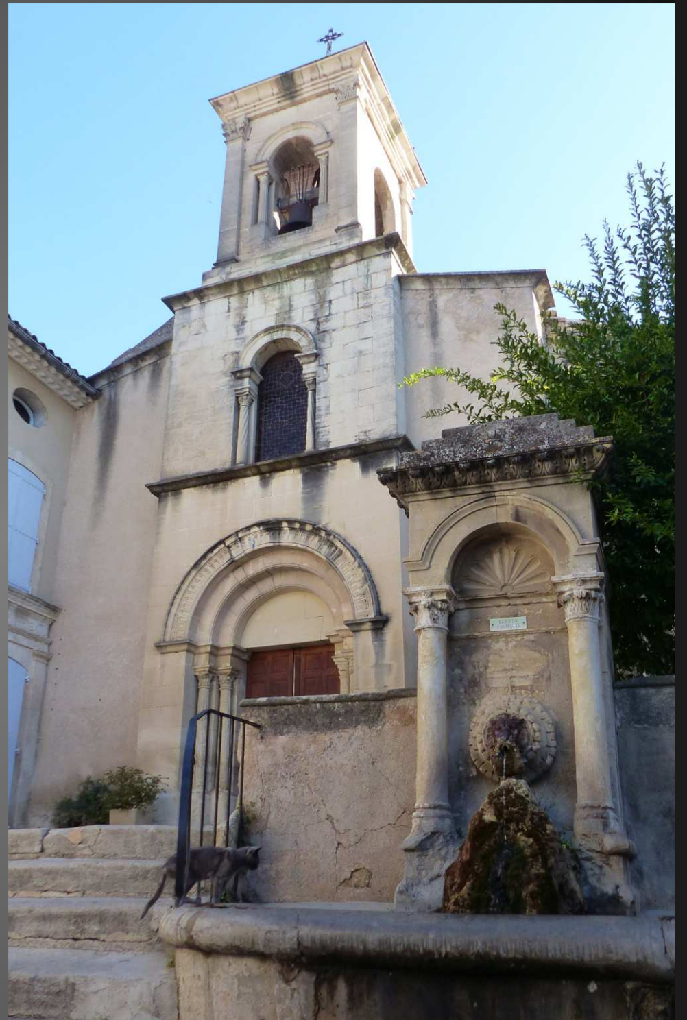
EGLISE DE LOURMARIN : ... le chat de la fontaine, devant l'église paroissiale.