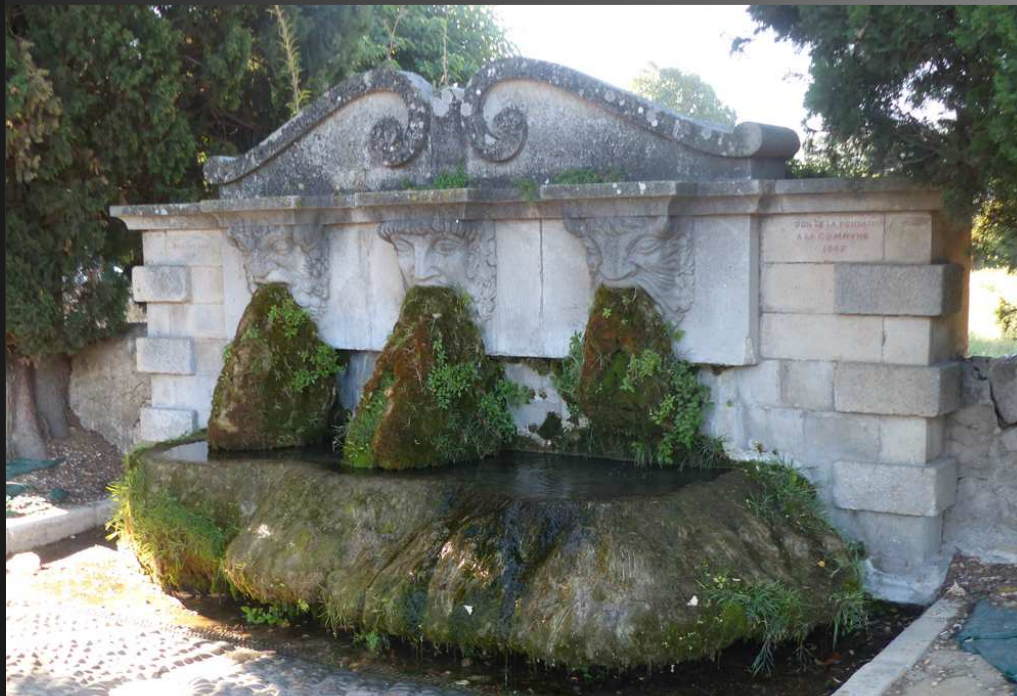
LA FONTAINE AUX TROIS MASQUES : ornée de masques grotesques , elle date de 1937. Pour Henri Bosco, ces têtes représenteraient les éléments naturels importants de la région : Rhône, Durance et Luberon. Ces trois têtes pourraient tout aussi bien rappeler trois divinités grecques avec de gauche à droite : Neptune, dieu de l'eau ; Apollon, dieu de la beauté et Pan, dieu des troupeaux et des bergers.