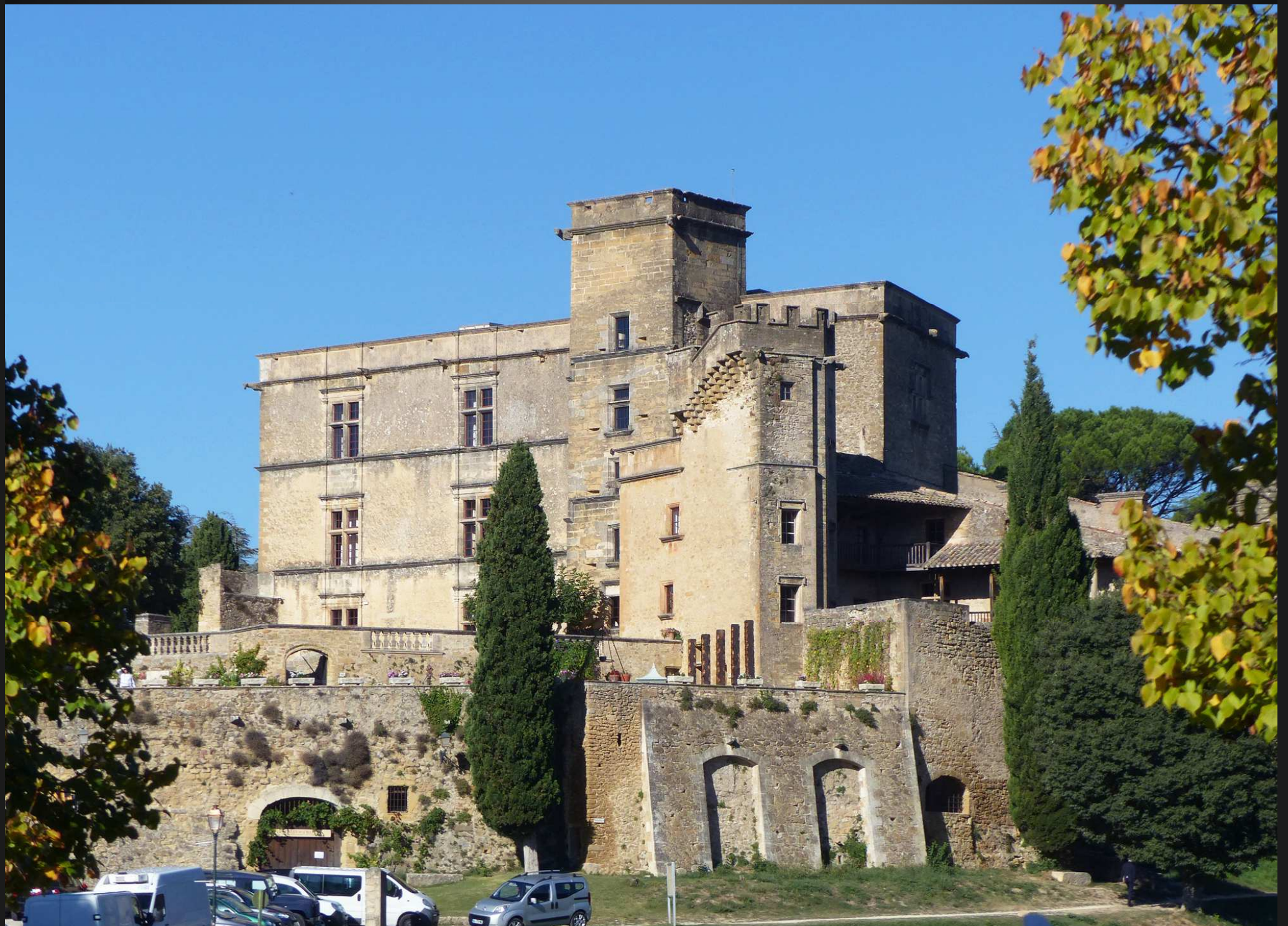
CHÂTEAU DE LOURMARIN : édifié au XV^e siècle par Foulques d'Agoult, sur les restes d'une ancienne forteresse du XII^e , sa silhouette trapue domine le village. Classé MH 1979.