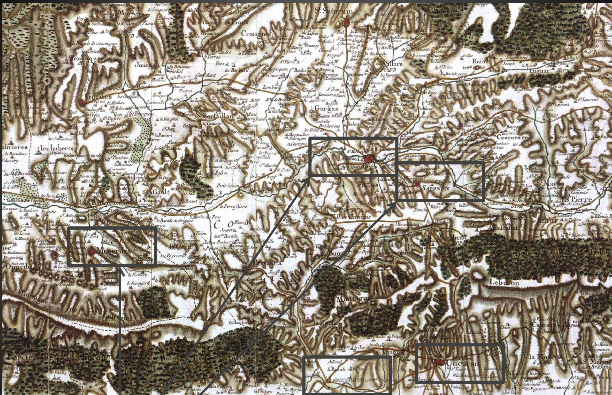
CARTE DE CASSINI (XVIIIe s.) : LE LUBÉRON