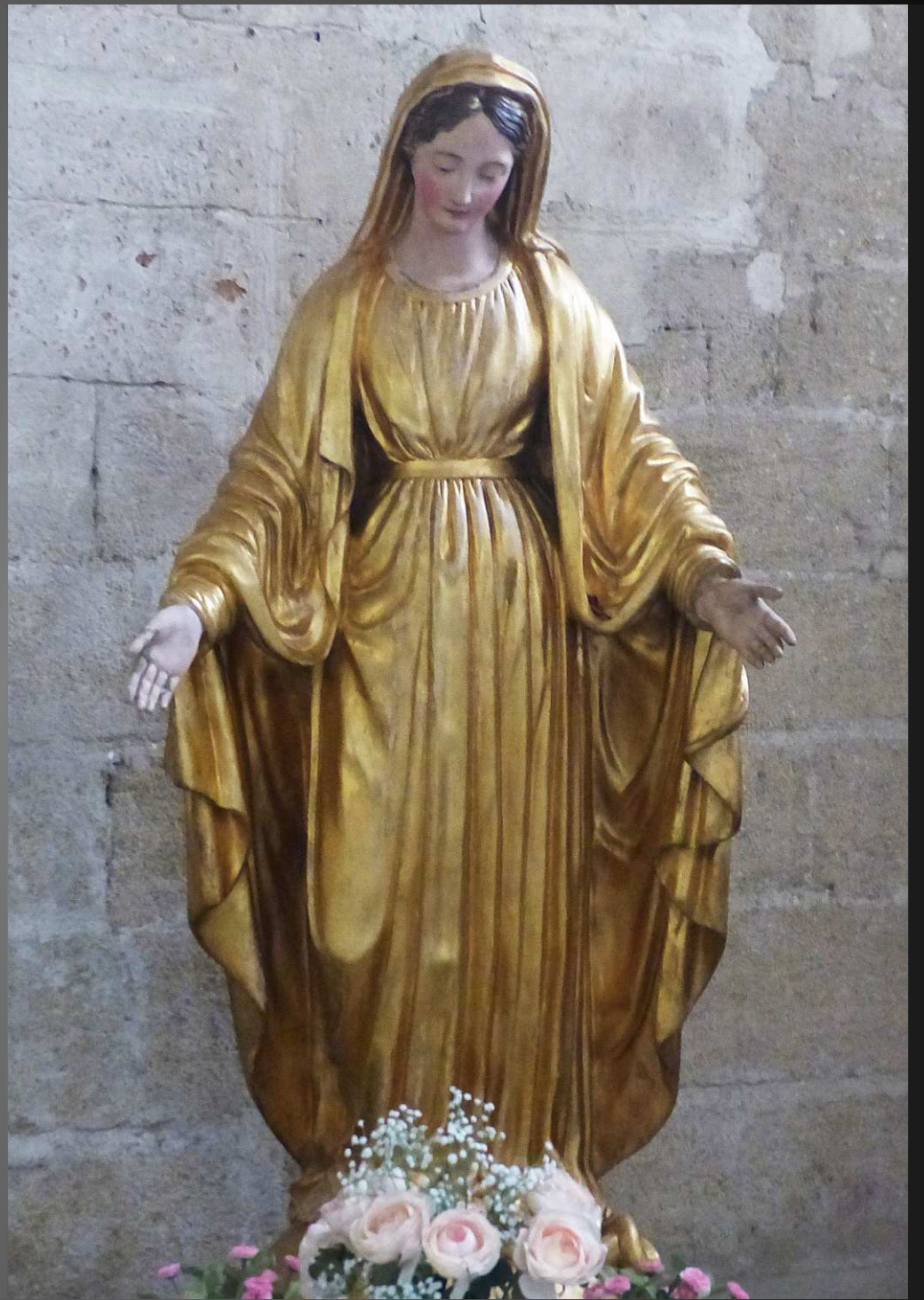
Statue de sainte MARIE, Mère de Dieu, fille de sainte ANNE.