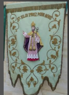
Bannière de la Confrérie de Saint-Eloi de Maillane