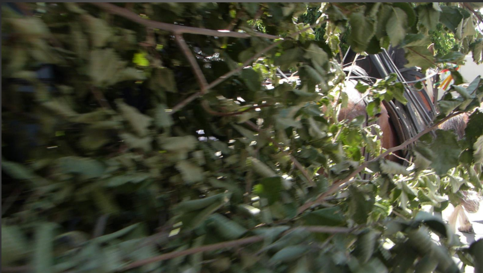
MAILLANE _ La charrette va s'éloigner par la rue Lamartine et faire demi-tour au niveau du cimetière pour faire son dernier passage dans le village.