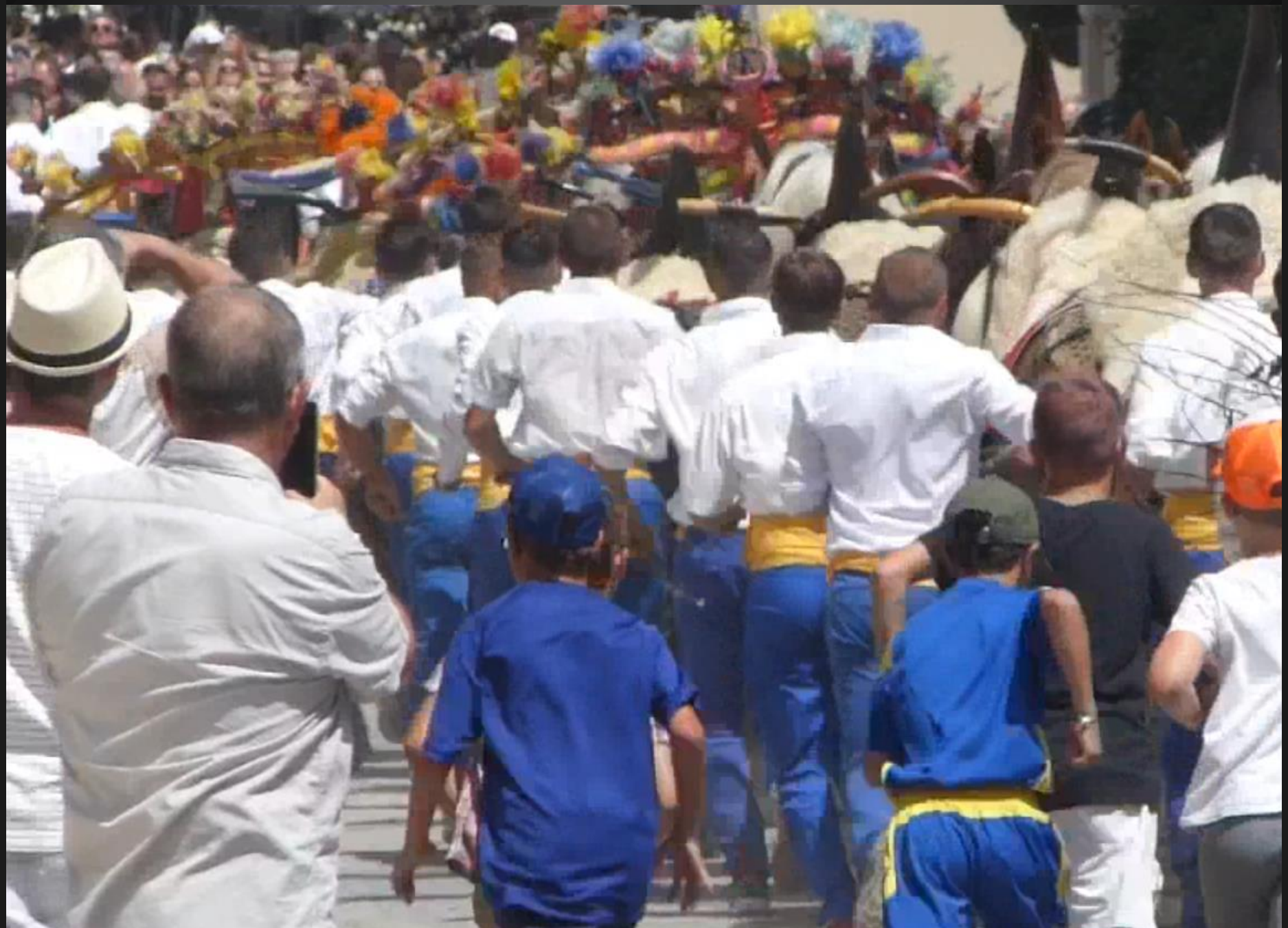
MAILLANE _ La charrette est repartie au grand trot dans le village pour son dernier passage.