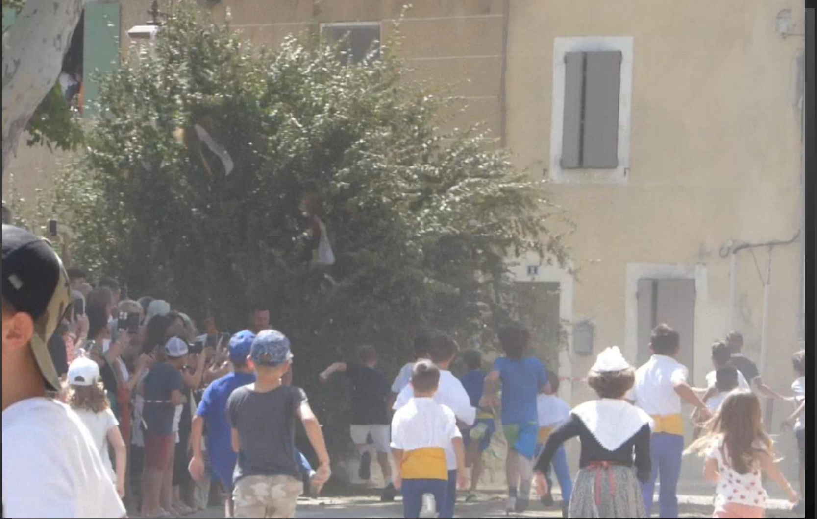
MAILLANE _ la charrette disparaît dans un nuage de poussière et sous les acclamations du public.