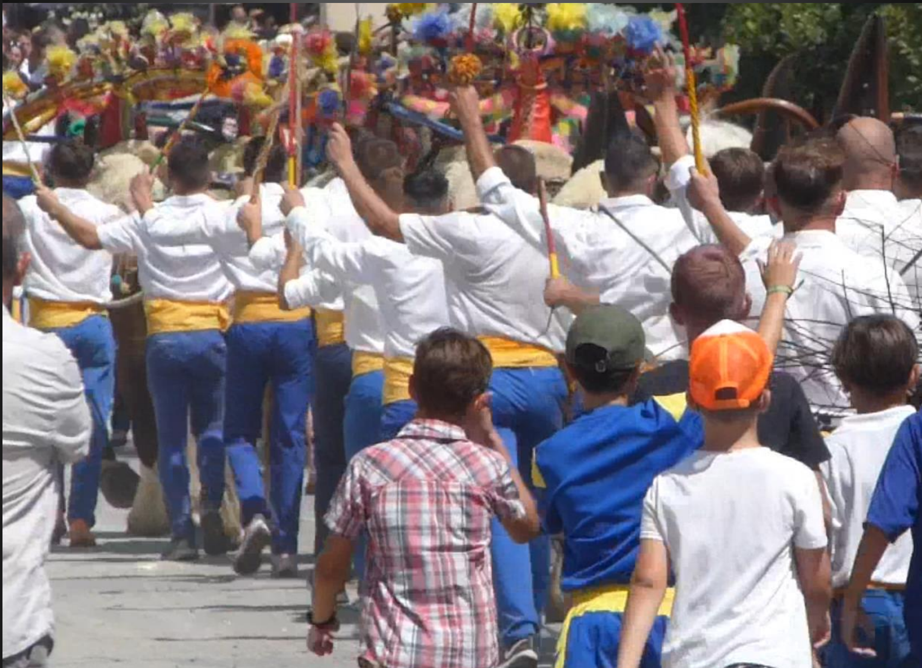
MAILLANE _ Les charretiers lèvent leur fouet pour signaler le départ de la course de la charrette.