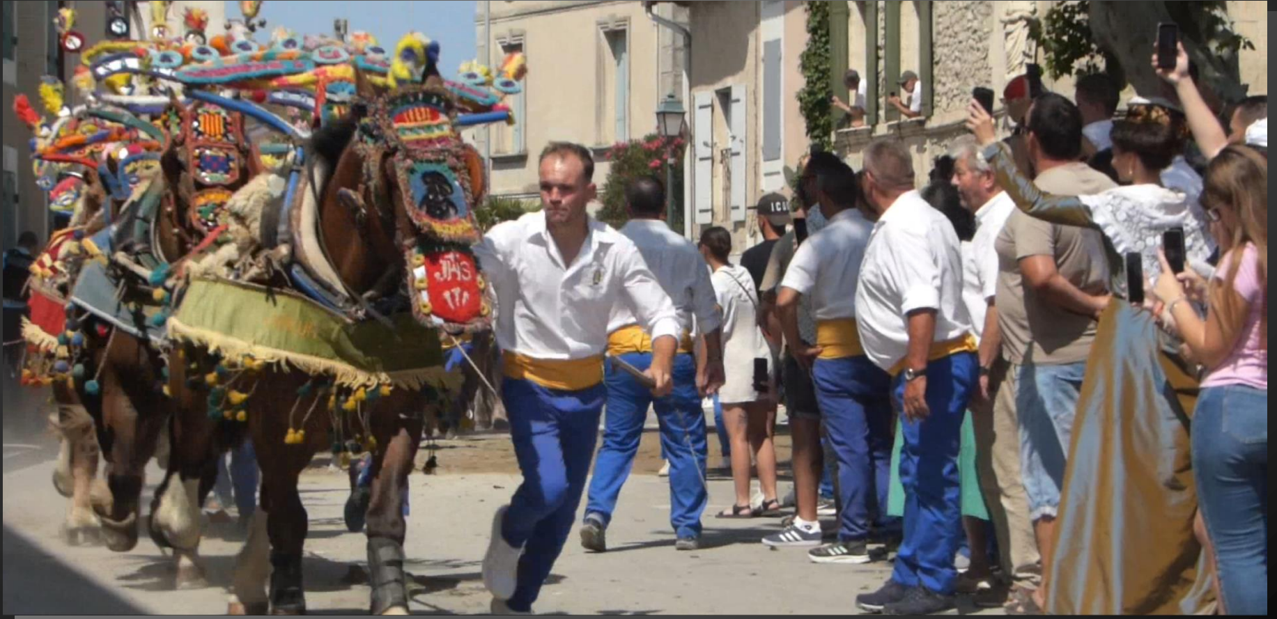
MAILLANE _ Place Frédéric Mistral.