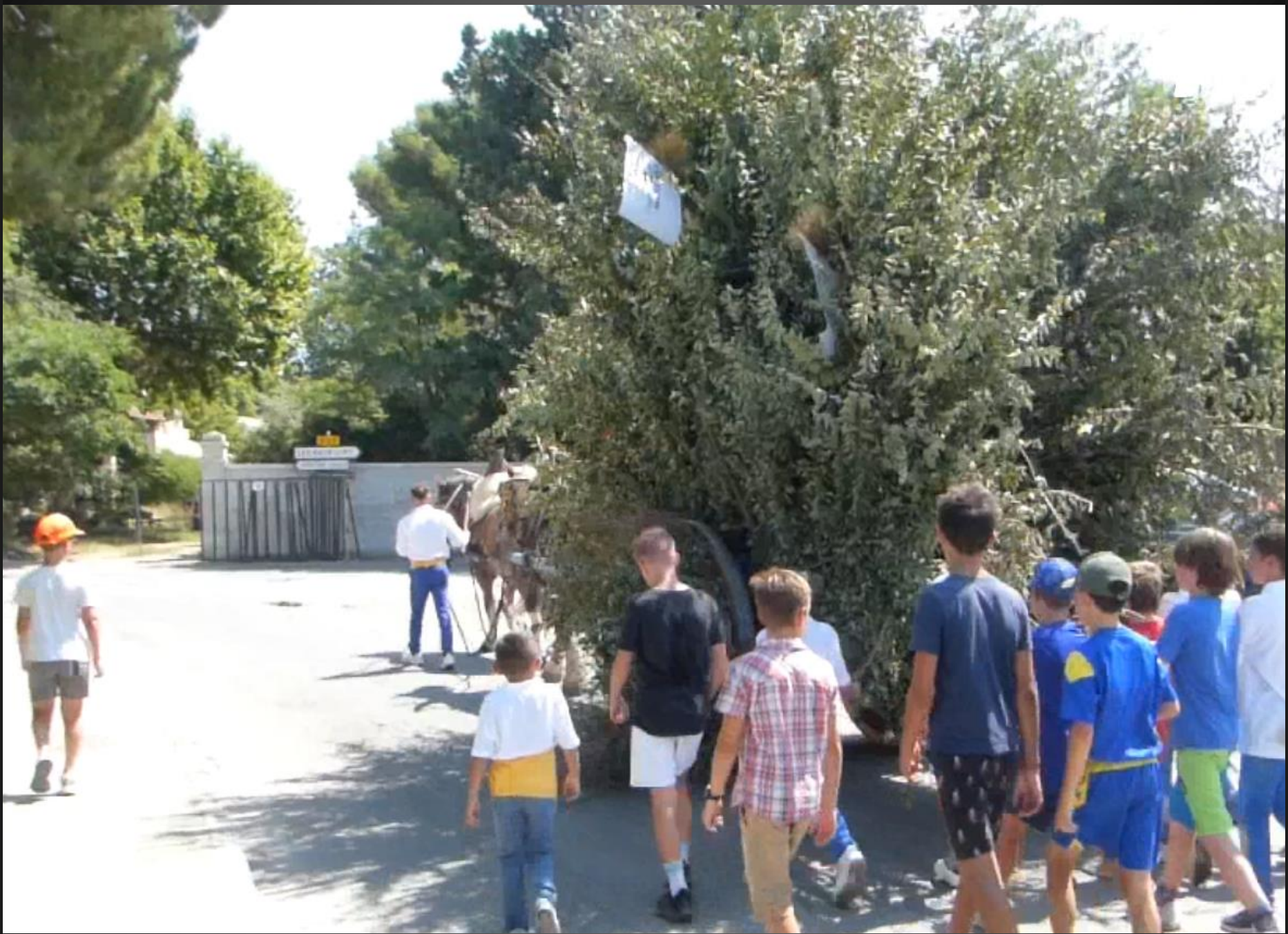
MAILLANE _ la charrette est toujours suivie par une nuée de jeunes Maillanais.