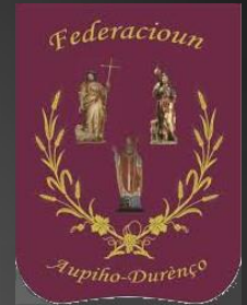
Bannière de la Fédération Alpilles-Durance