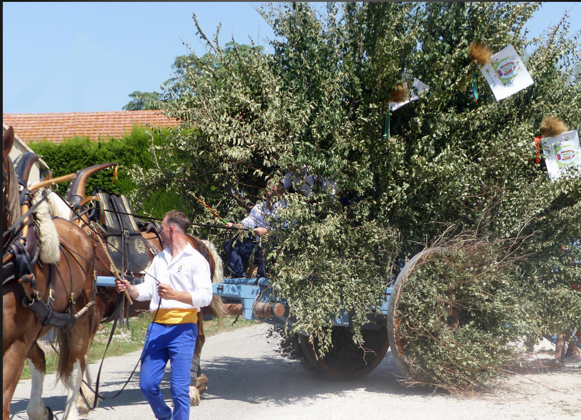
MAILLANE _ La charrette a été détachée de l'attelage pour faire un demi-tour.