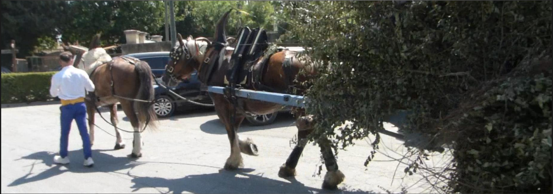
MAILLANE _ La charrette va être rattachée à l'attelage dans la rue Lamartine.