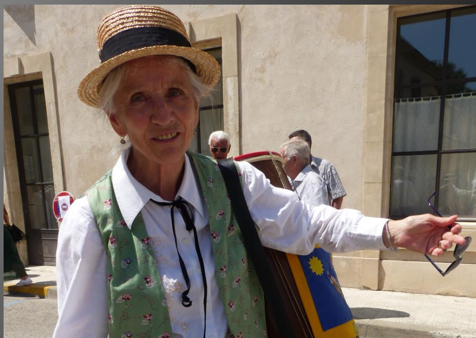
MAILLANE _ Place Mistral, la fête bat son plein, les verres se vident, un brouhaha joyeux remplace le son des galoubets et tambourins, les musiciens rentrent à la maison.