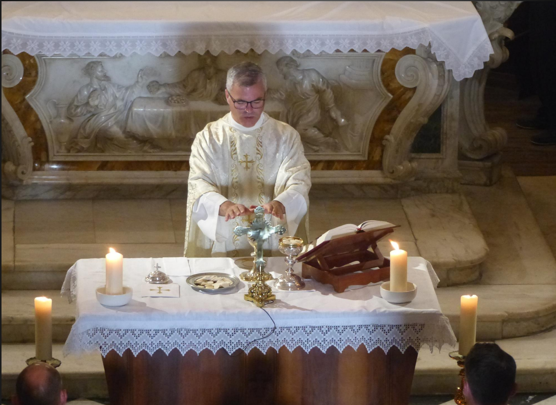
MAILLANE _ Le pain et le vin vont devenir le Corps et le Sang du Christ, c'est la Transsubstantiation des espèces.