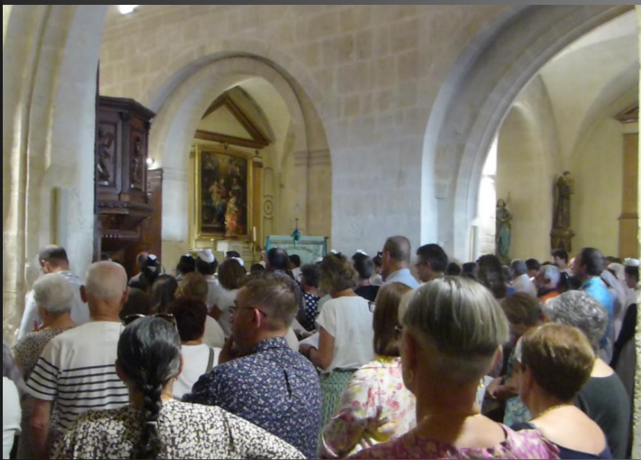
MAILLANE _ La bannière de saint Eloi est de l'autre côté du chœur.