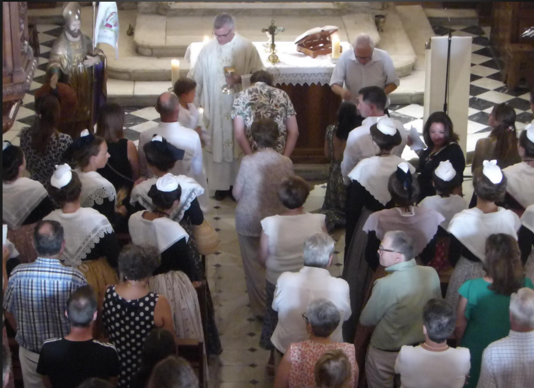
MAILLANE _ La Communion des fidèles devant le chœur.