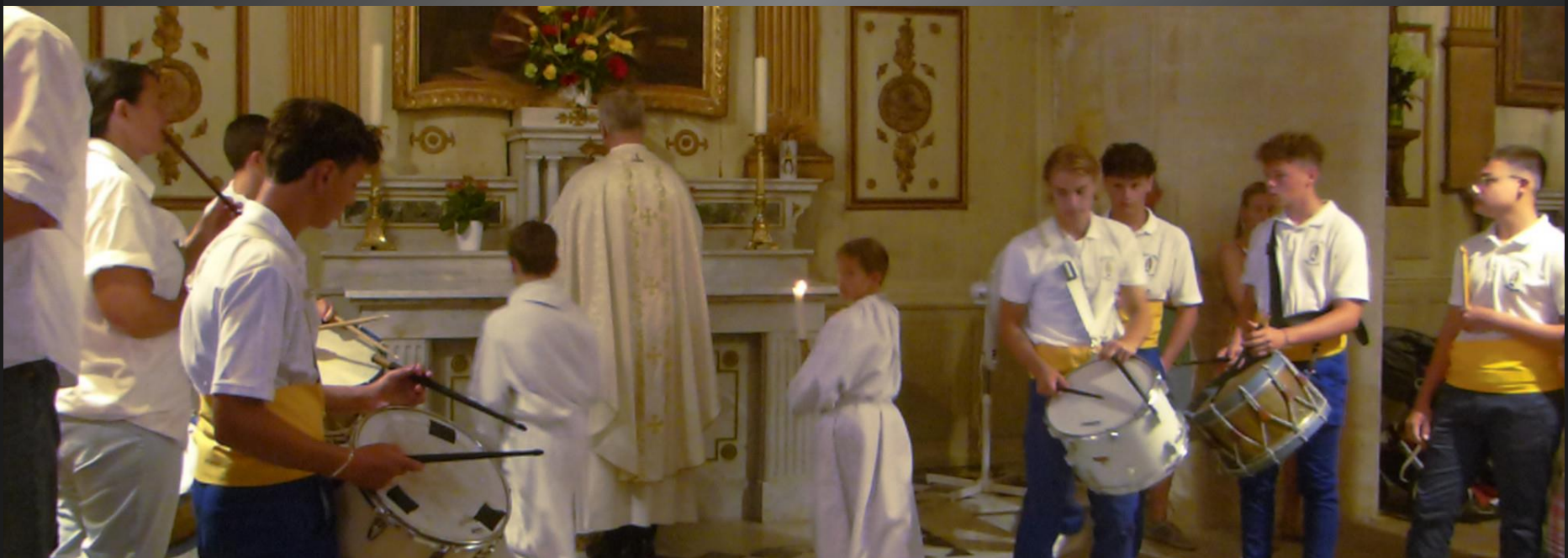
MAILLANE _ La Vénération des reliques a lieu sous les roulements de tambour.