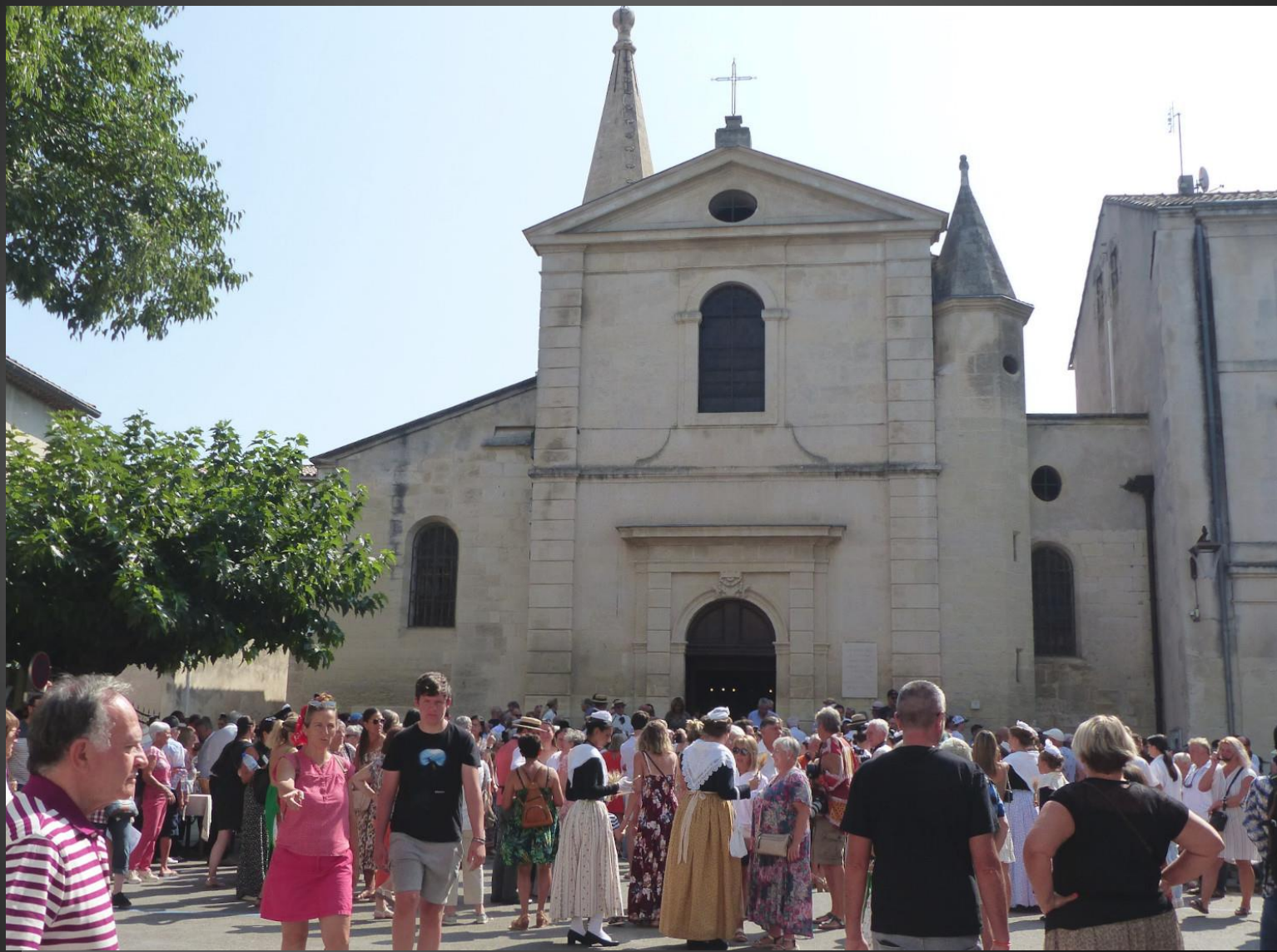
MAILLANE _ Place de l'Eglise, avant la bénédiction de la charrette.