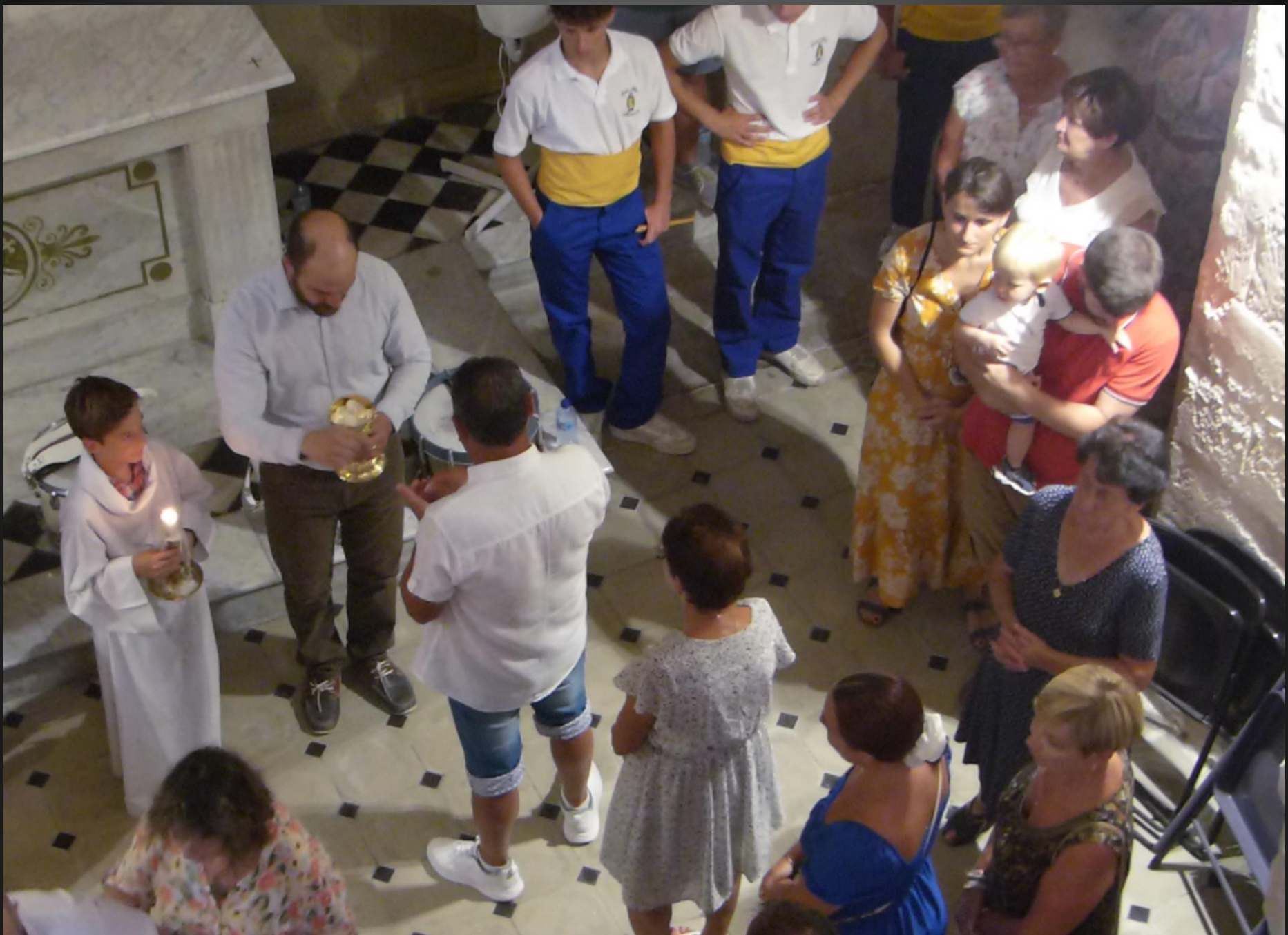
MAILLANE _ La Communion des fidèles devant l'autel de Saint-Eloi.