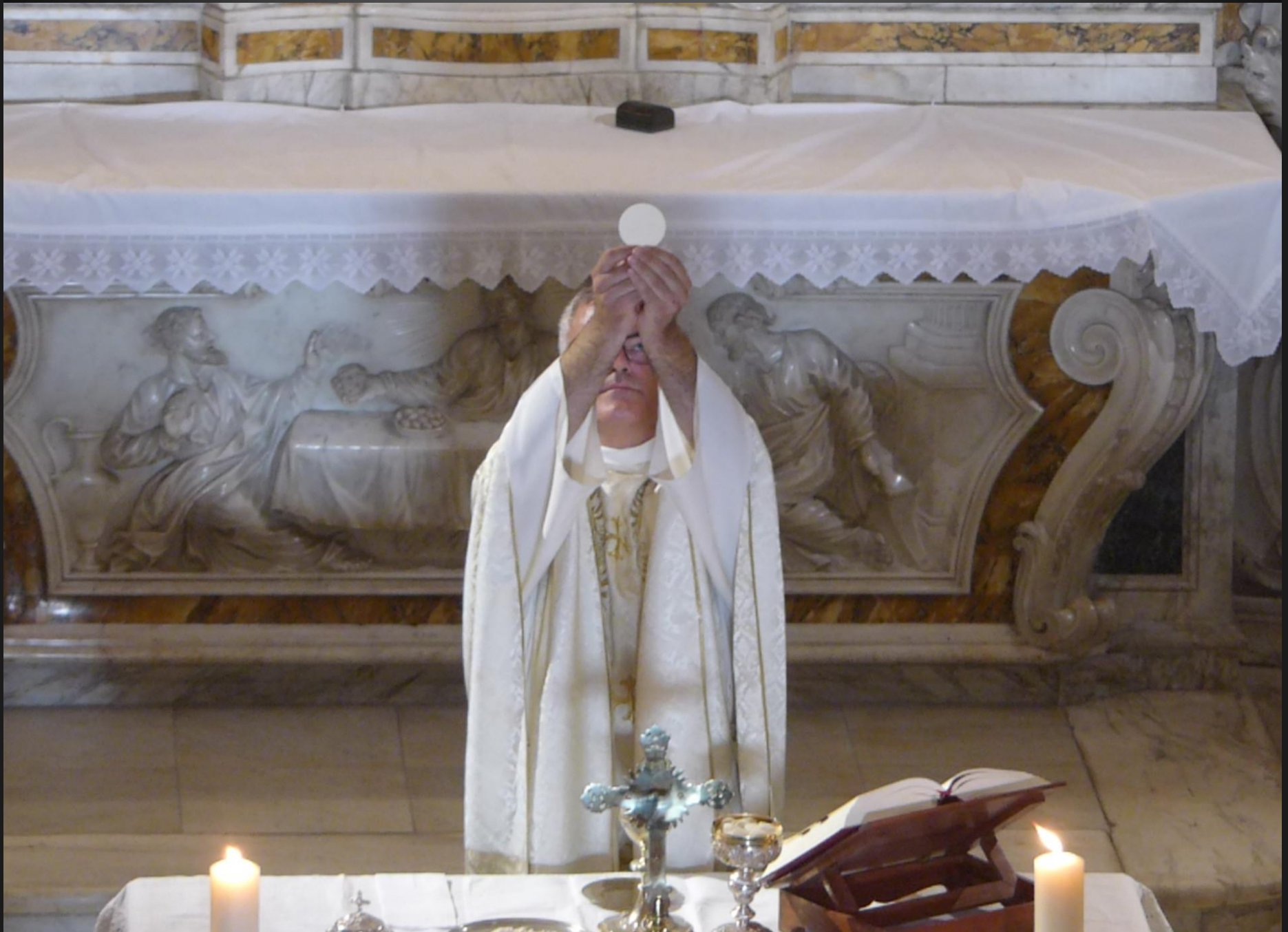
MAILLANE _ Elévation du pain.