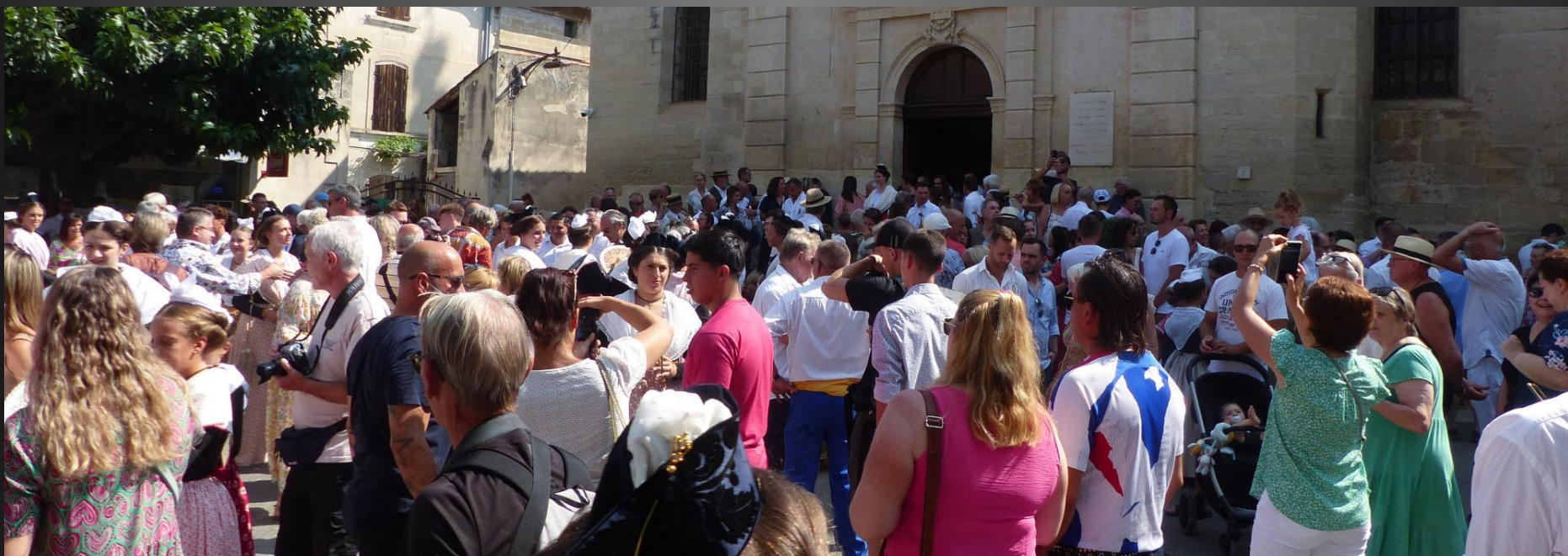
MAILLANE _ Les fidèles sortent entre deux haies de musiciens, au son des galoubets et tambourins.