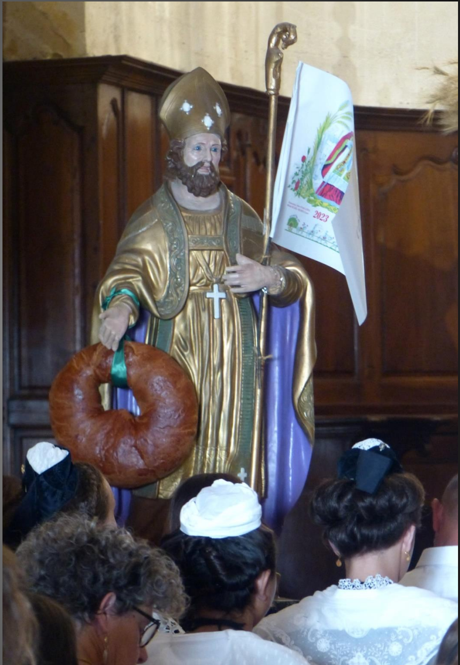
MAILLANE _ La statue du Saint a été placée devant le chœur, face aux fidèles.