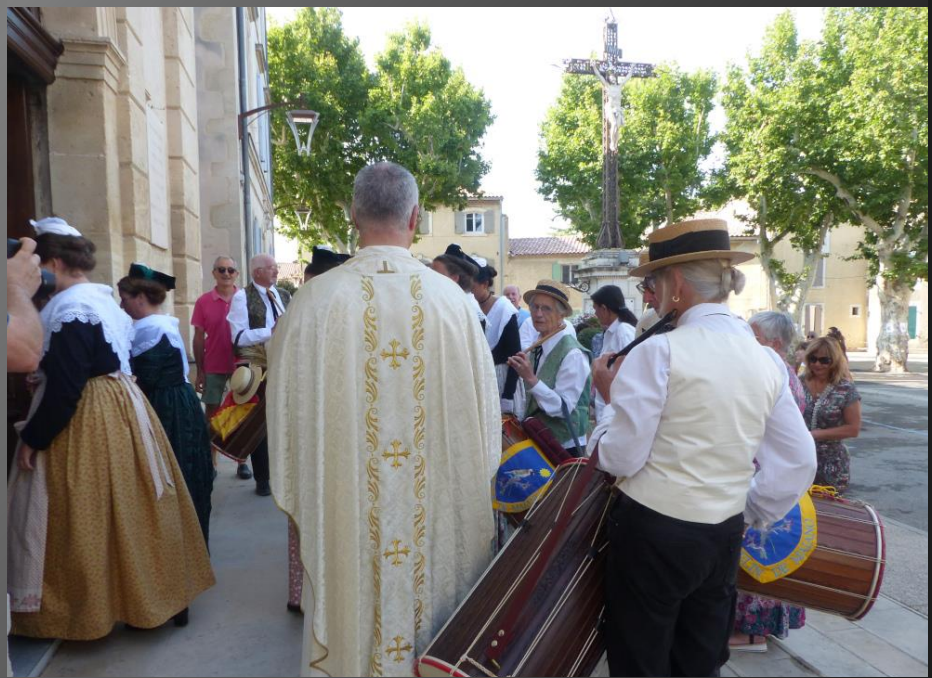
MAILLANE _ Village natal de Frédéric Mistral, Maillane possède une église placée sous le vocable de Sainte Agathe.