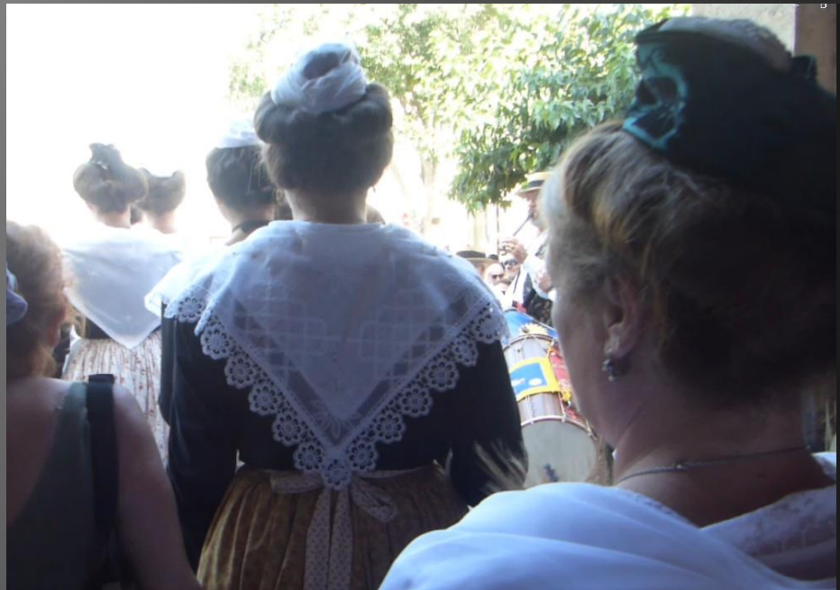
MAILLANE _ Chant à Saint-Eloi « Grand Sant Aloï ». Procession de sortie.