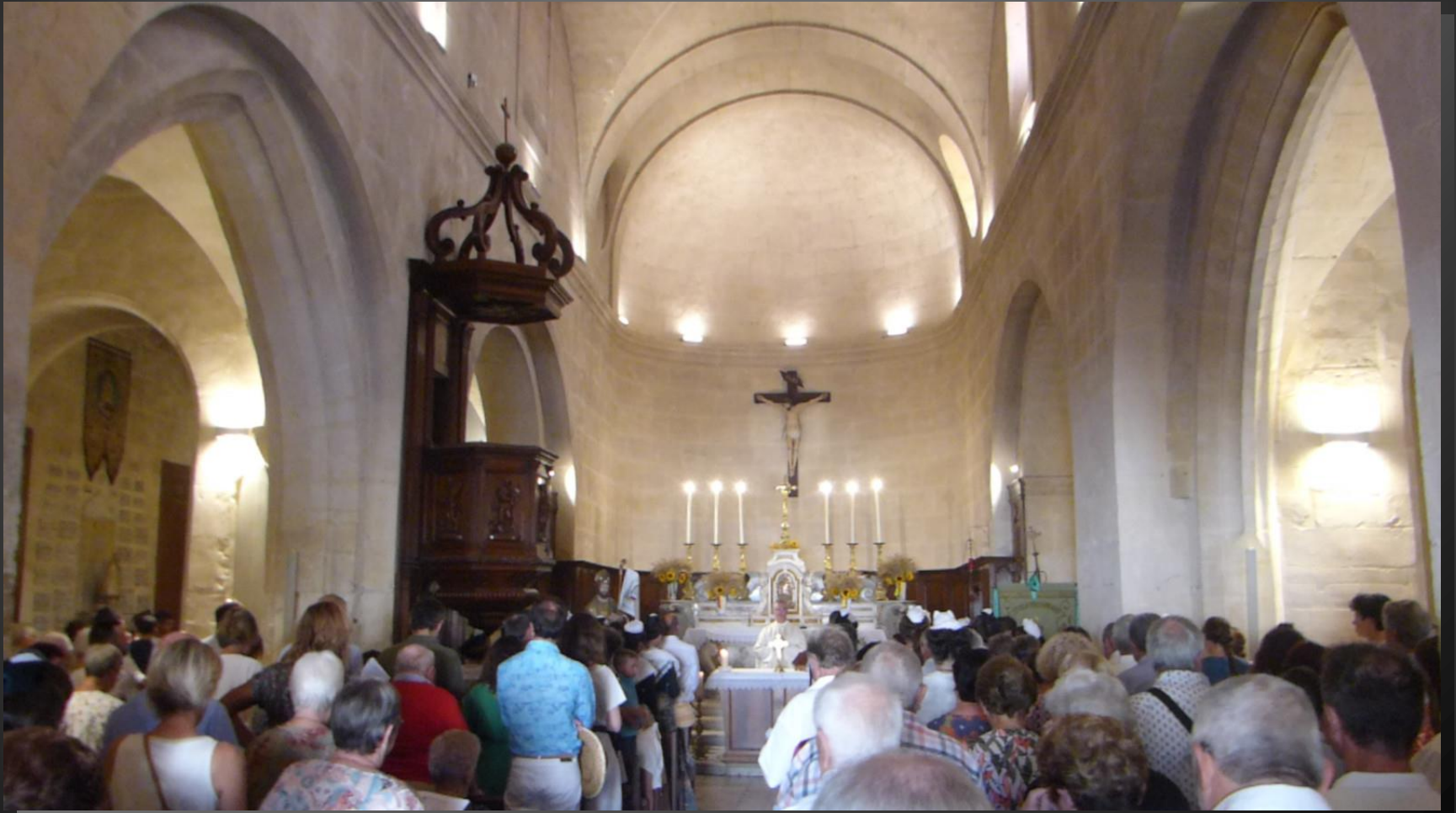
Maillane _ Prière universelle : Largo nous ta gràci, Segnour te n'en pregan.