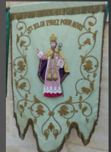
Bannière de la Confrérie de Saint-Eloi de Maillane