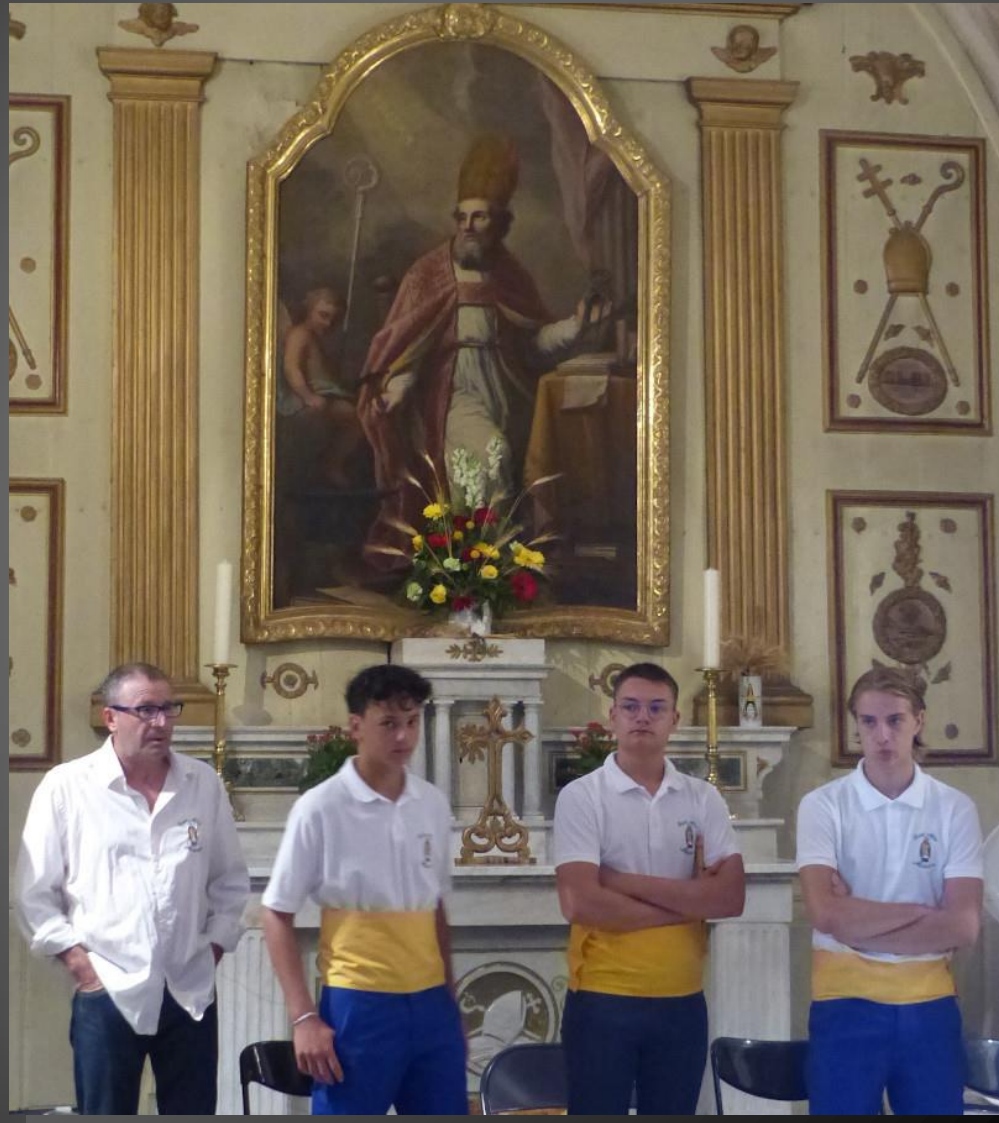
Maillane _ L'autel de Saint-Eloi.