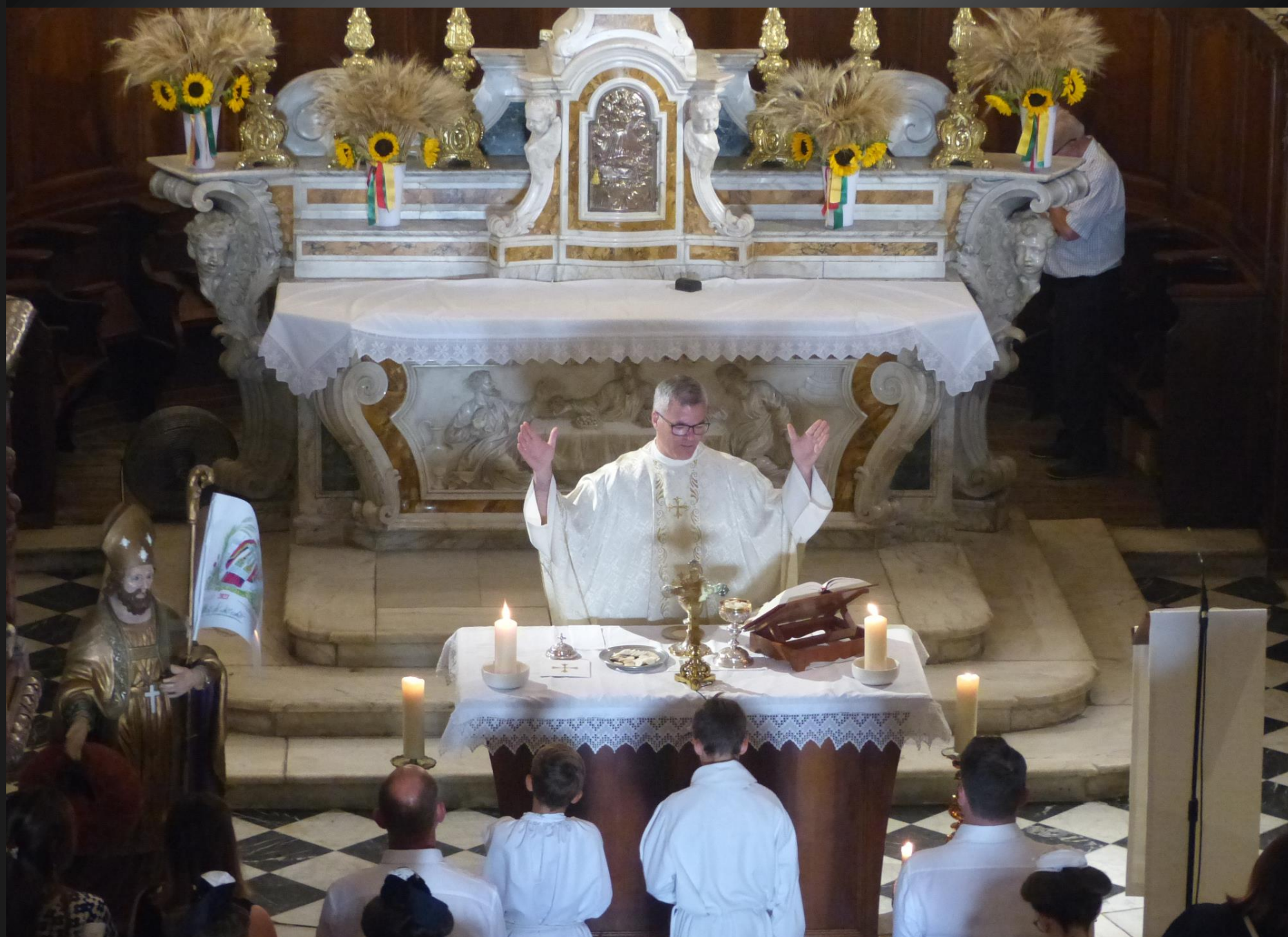
MAILLANE _ Préparation de la Consécration, devant l'autel du XVIIe siècle en marbre blanc, classé MH.