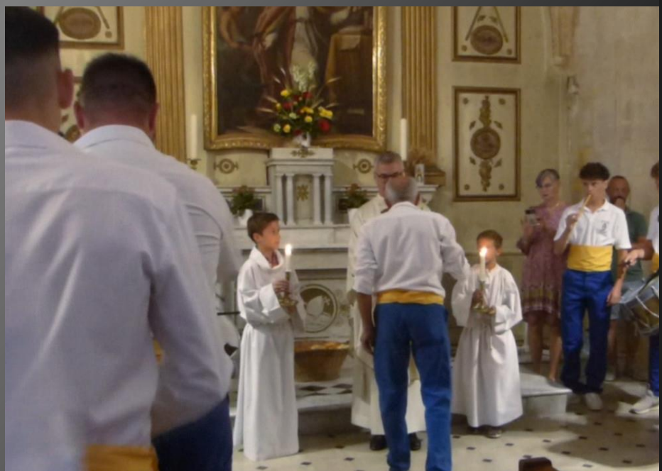
MAILLANE _ Chaque charretier vient devant le célébrant une bougie allumée à la main.