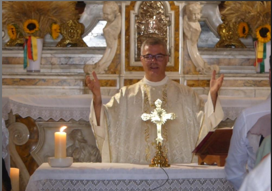
MAILLANE _ Bénédiction finale et envoi.