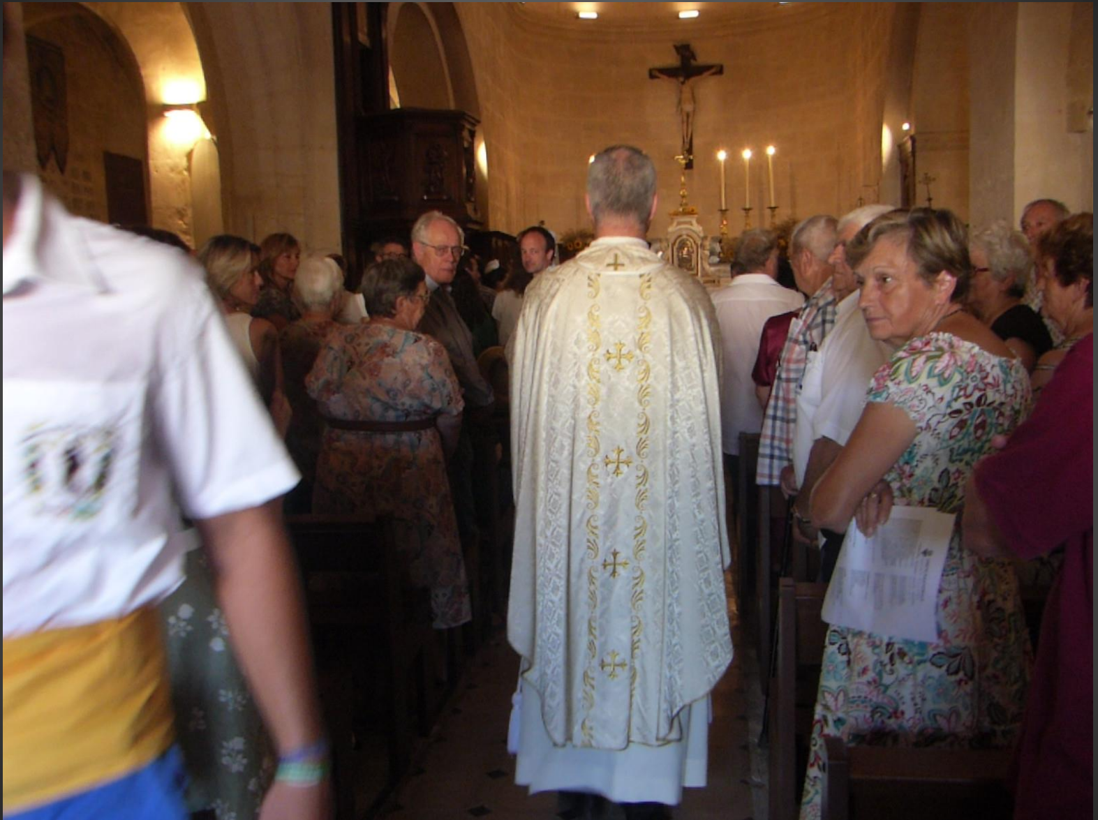
MAILLANE _ le célébrant retourne à l'autel pour la suite de la cérémonie eucharistique.