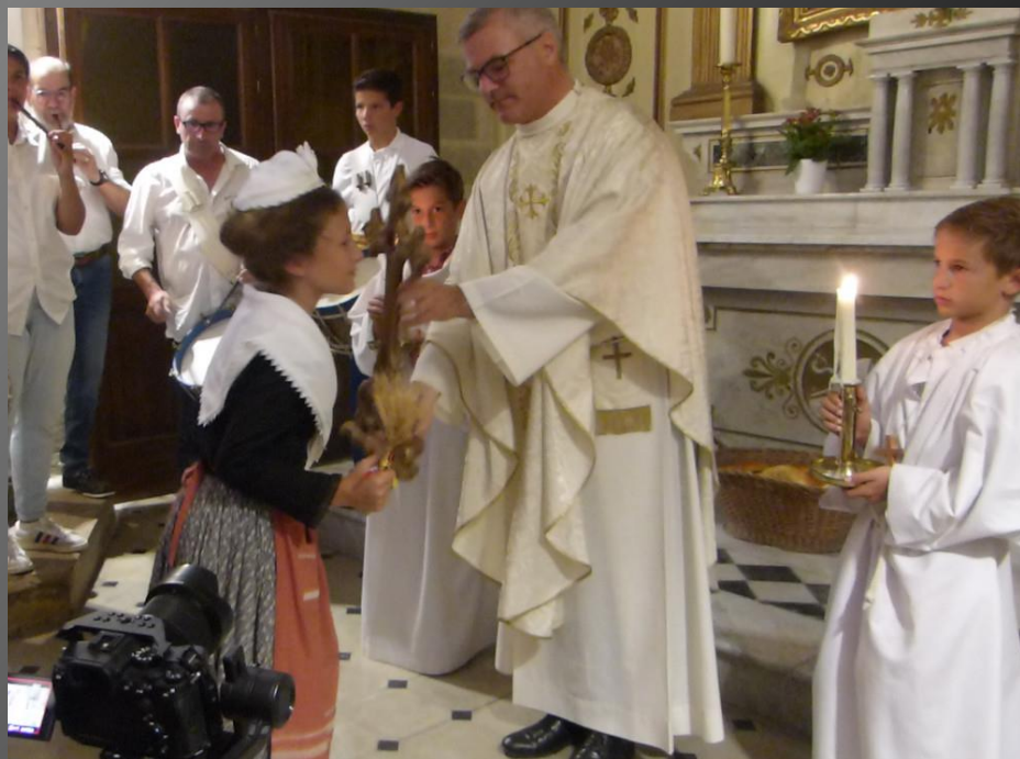
MAILLANE _ Des jeunes Provençales viennent aussi vénérer.