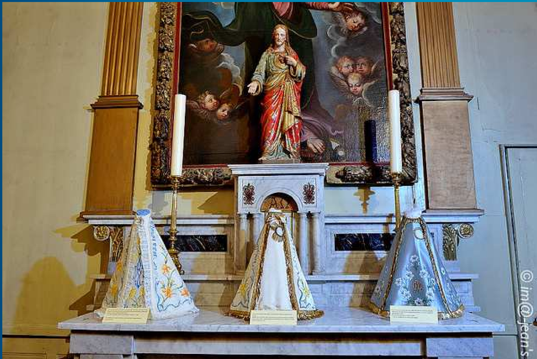
EXPOSITION DES ROBES DE NOTRE-DAME DE GRACE _ Maillane 06-07 décembre 2014