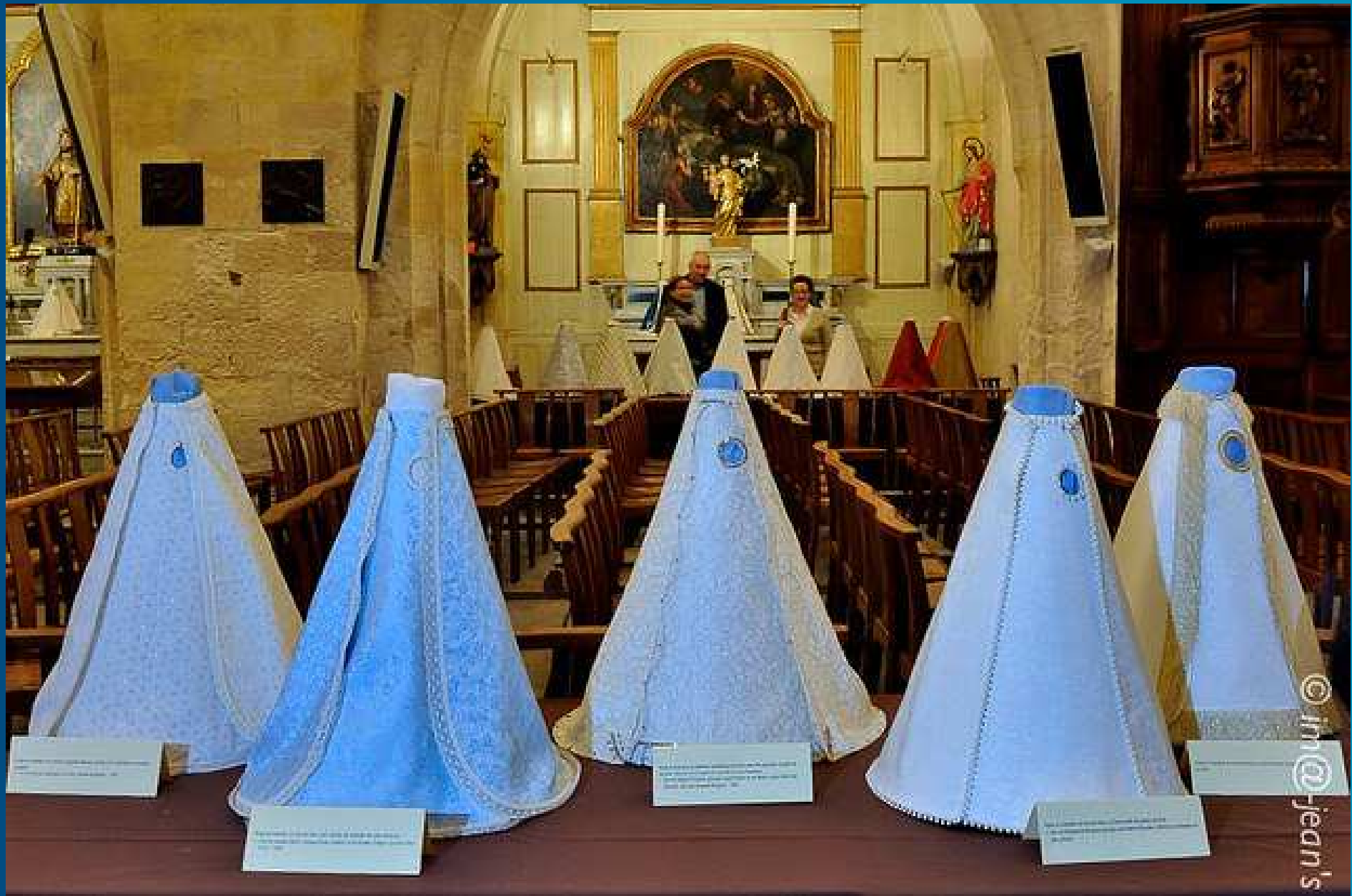
EXPOSITION DES ROBES DE NOTRE-DAME DE GRACE _ Maillane 06-07 décembre 2014