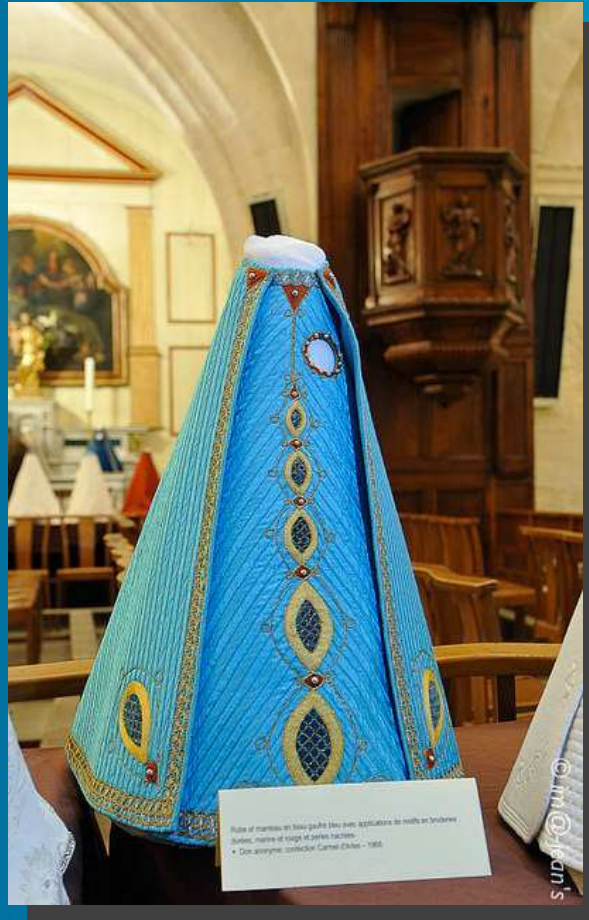
Robe et manteau en tissu gaufré bleu... Don anonyme, confection Carmel d'Arles -1968