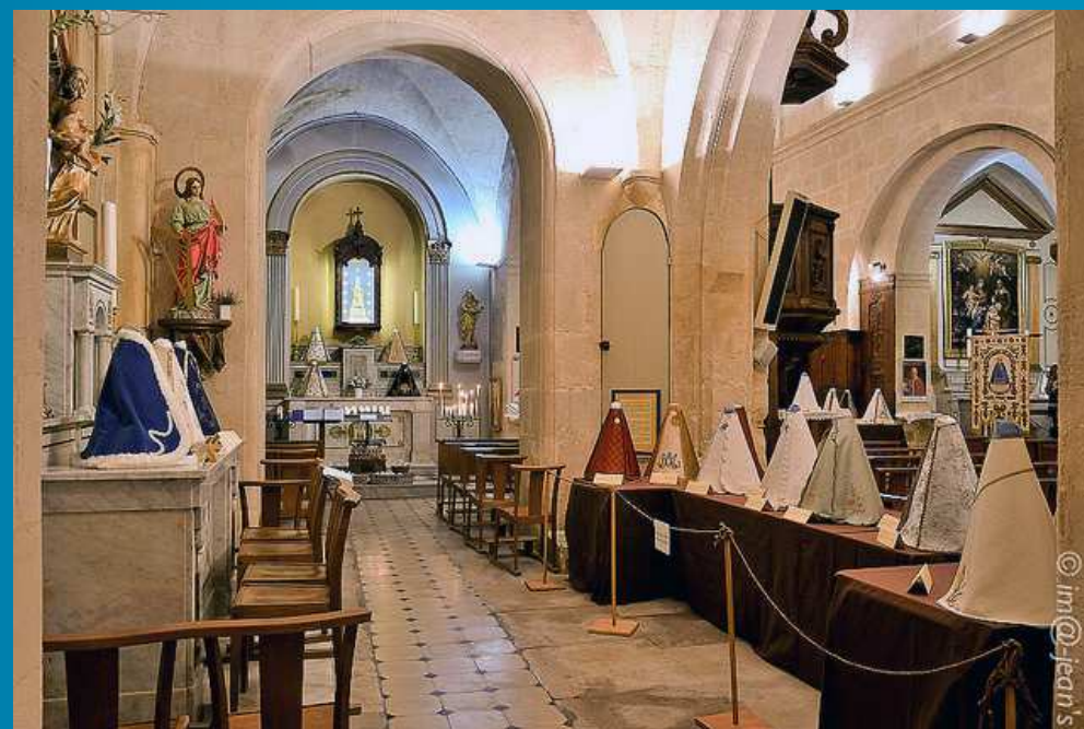
EXPOSITION DES ROBES DE NOTRE-DAME DE GRACE _ Maillane 06-07 décembre 2014