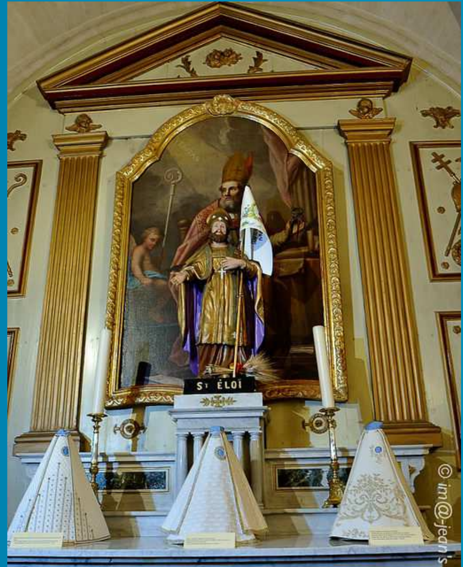
EXPOSITION DES ROBES DE NOTRE-DAME DE GRACE _ Maillane 06-07 décembre 2014