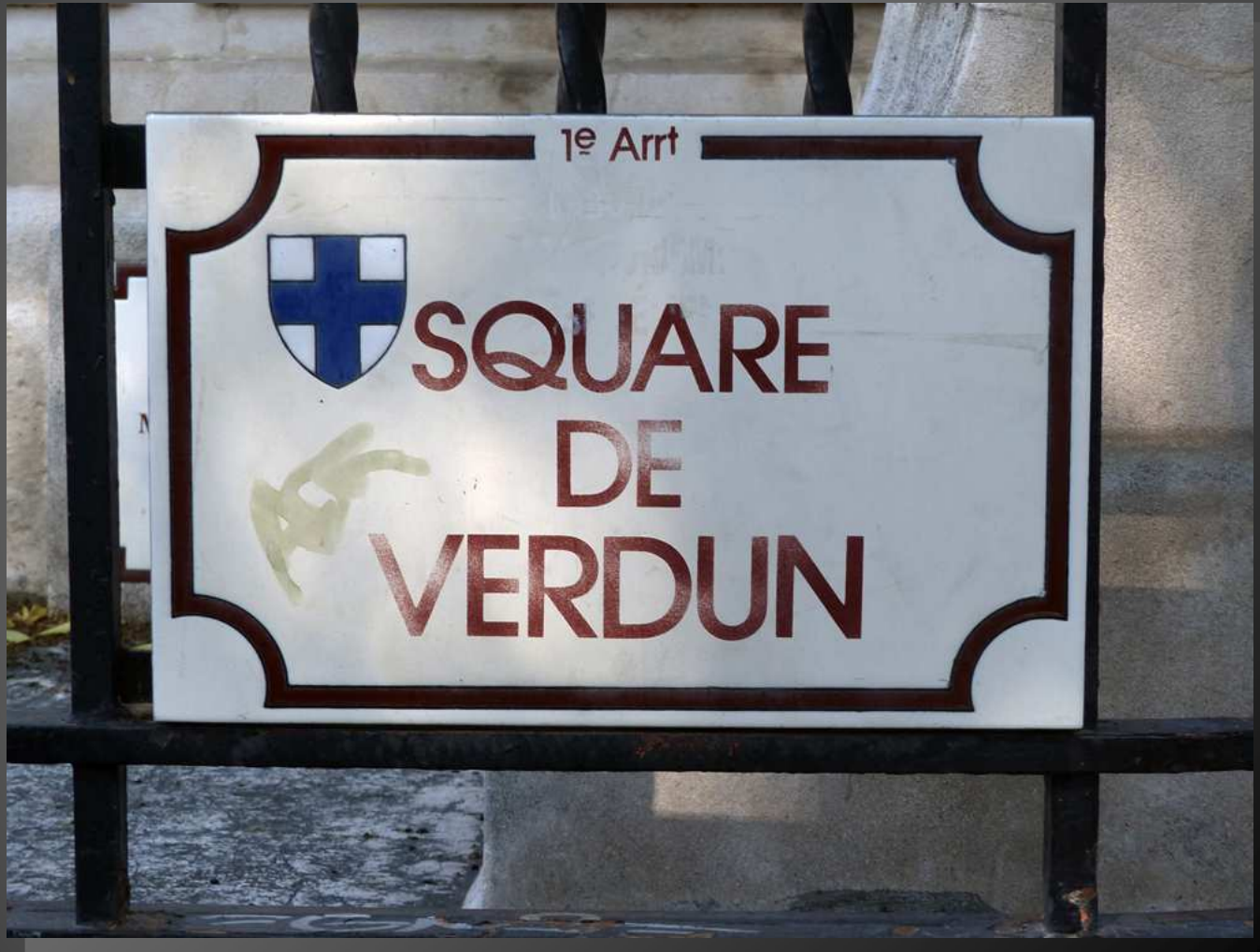
Verdun, un nom mythique chargé d'histoire, mais dont, 100 ans plus tard, le souvenir s'est estompé dans les brumes de la mémoire collective pour ne rester plus guère que dans les notes des historiens et des érudits ...