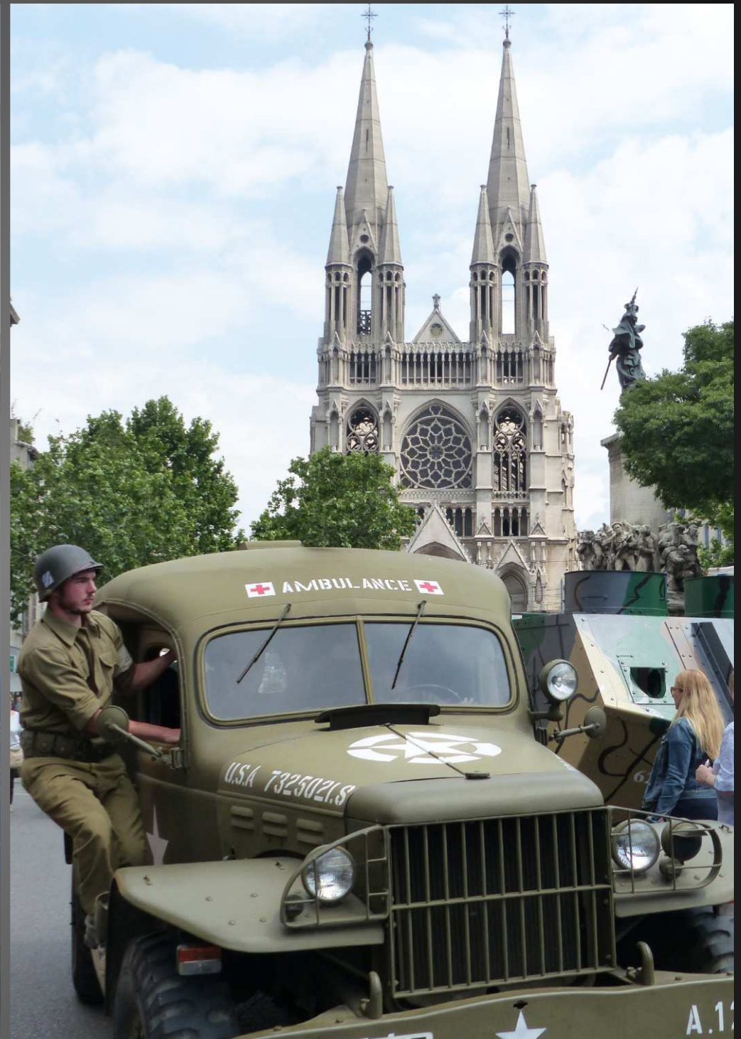
Troupes et matériel américain débarquent en Provence le 15 août 1944 : Marseille est libérée par les Goumiers marocains et les Tirailleurs algériens du général de Montsabert le 25 août.