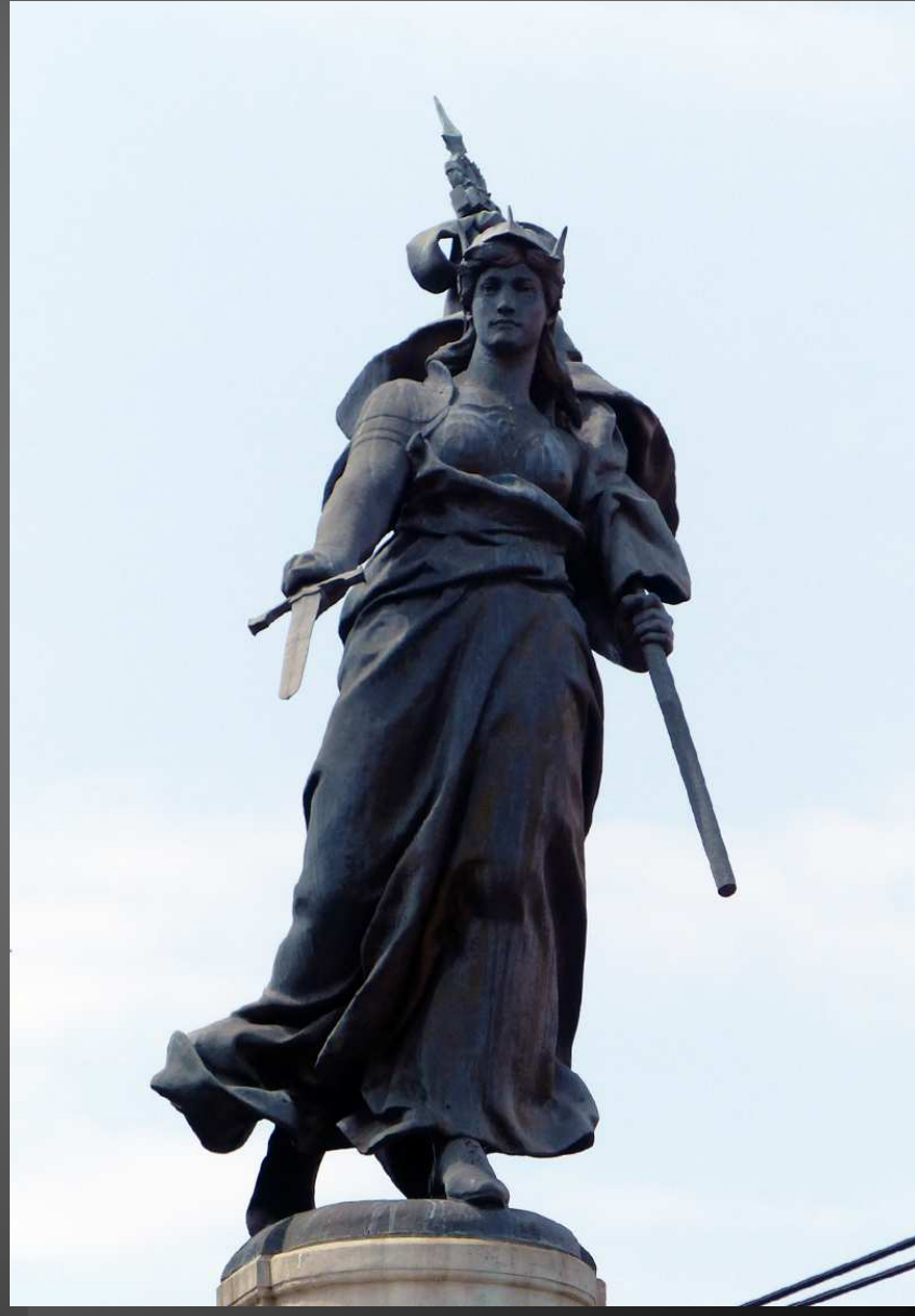
Statue en bronze de la France armée tenant un drapeau et une épée, Et coiffée d'un bonnet Phrygien.