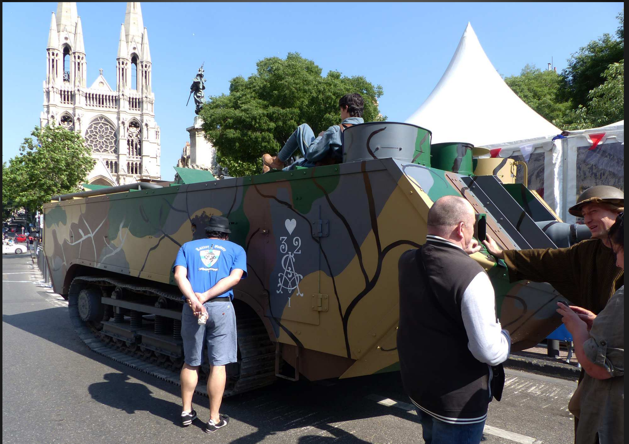
Lors de la guerre Franco-Prussienne de 1870-1871, la France perdit l'Alsace et partie de la Lorraine _ Puis, survint la Grande Guerre de 1914 -1918 où l'arme blindée fit son apparition (ce char Saint-Chamond reconstitué en est un bel exemple) et la France retrouva ses territoires perdus _ De 1939 à 1945, la 2 e Guerre mondiale fut la conclusion de la précédente avec encore une fois l'arrivée des troupes américaines ...