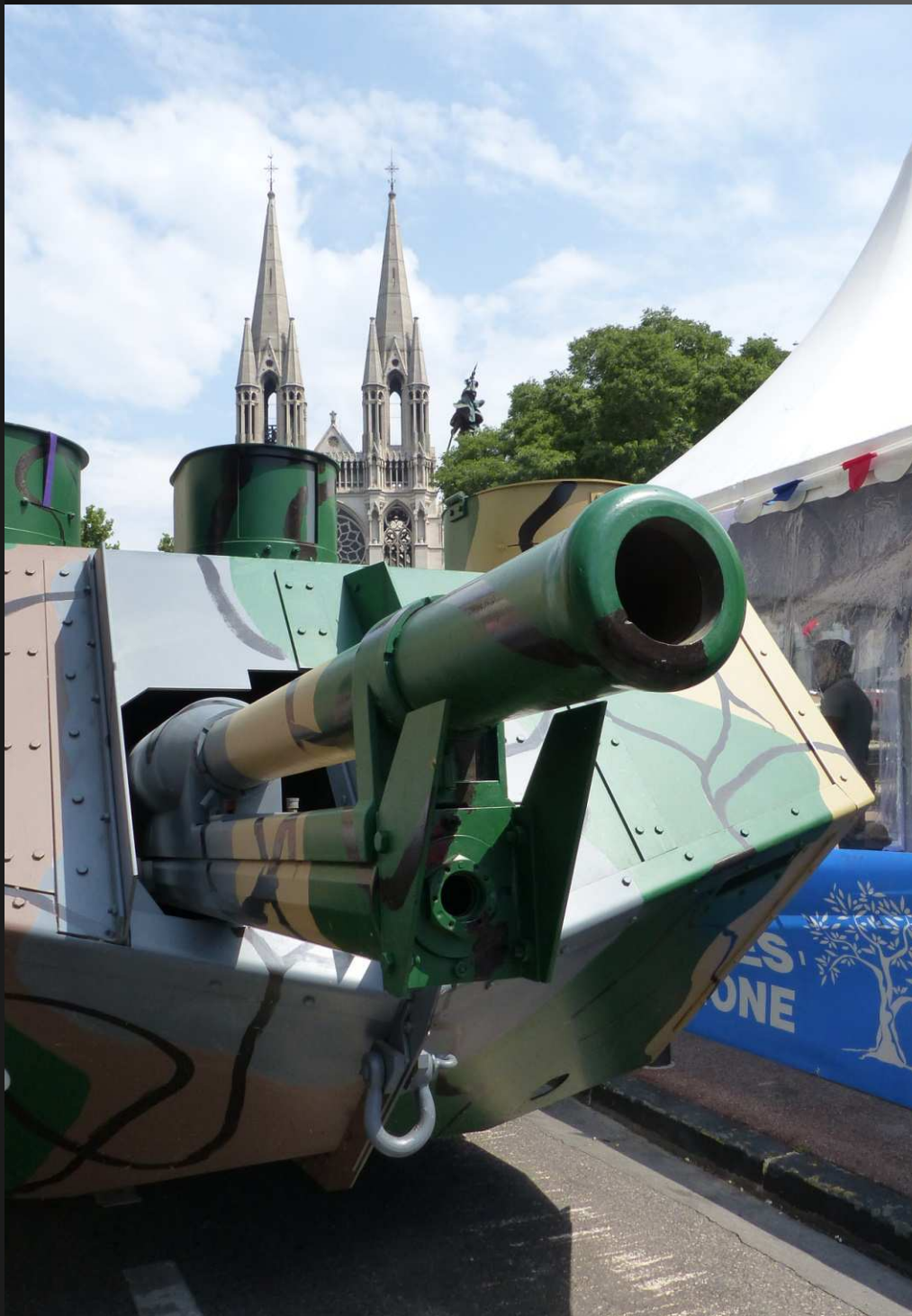
Le Saint-Chamond, 24 tonnes, 5km/h en tout terrain, moteur Panhard-Levassor 4 cyl. 92 ch. équipage : 9 hommes, armement 1 canon de 75, 4 mitrailleuses Hotchkiss de 8mm.