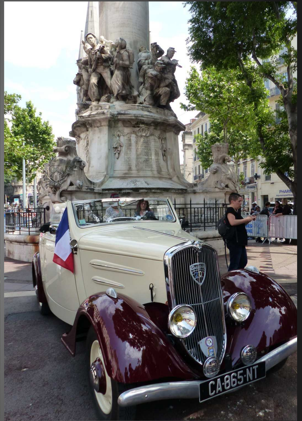
L'église Saint-Vincent-de-Paul, style néo-gothique XIXe siècle, se dresse au bord de la Canebière _ Au pied du Monument des Mobiles, sur le Square de Verdun, commémoration du 8 mai 1915 avec des véhicules d'époque, comme cette superbe Peugeot 201 décapotable.