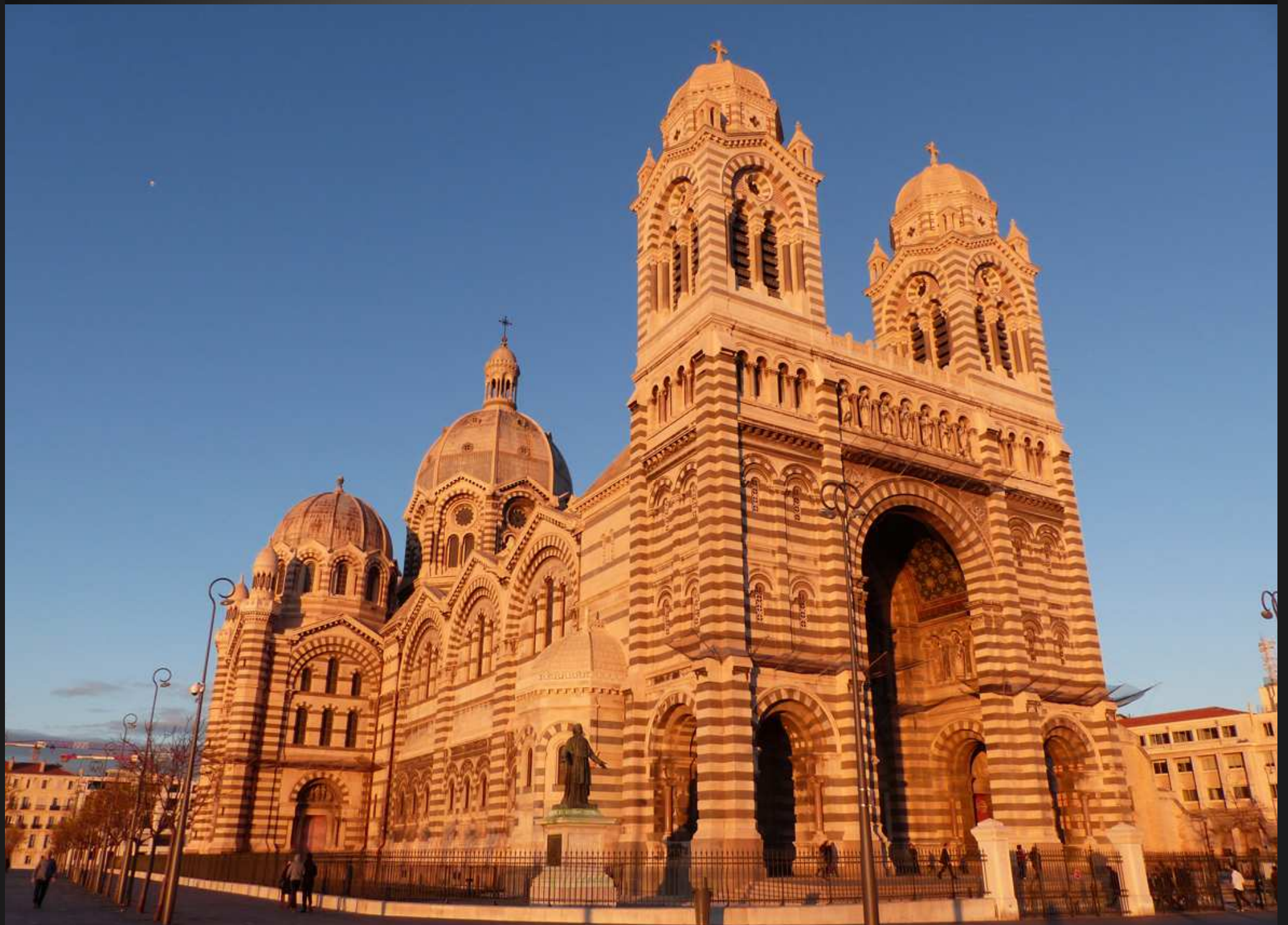
Le soleil couchant fait rougeoyer la cathédrale de la Major, devant laquelle se dresse la statue de Mgr de Belzunce.