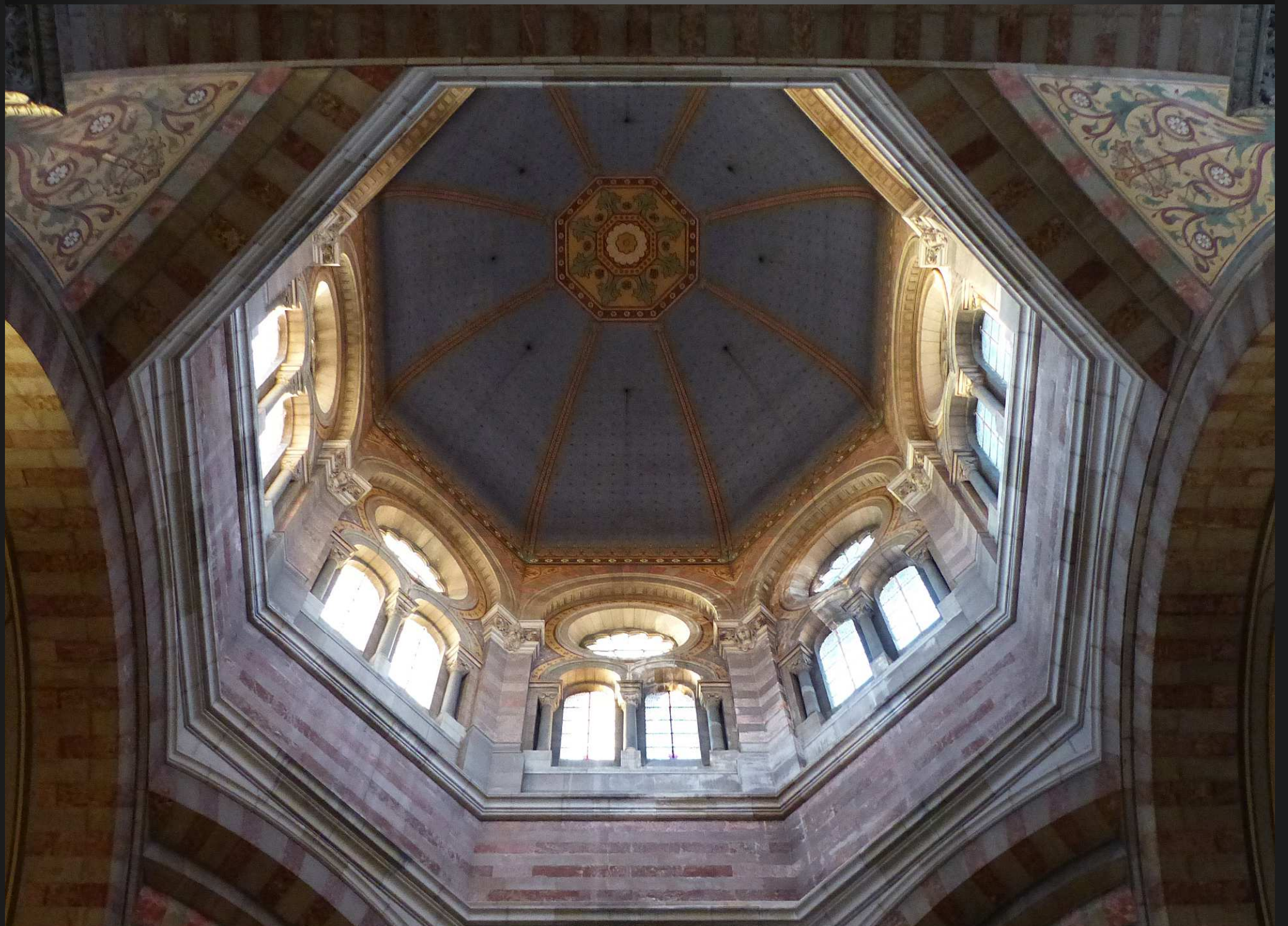
La journée prend fin, le soleil couchant illumine encore pour quelques instants la grande coupole de la Cathédrale de la Major.