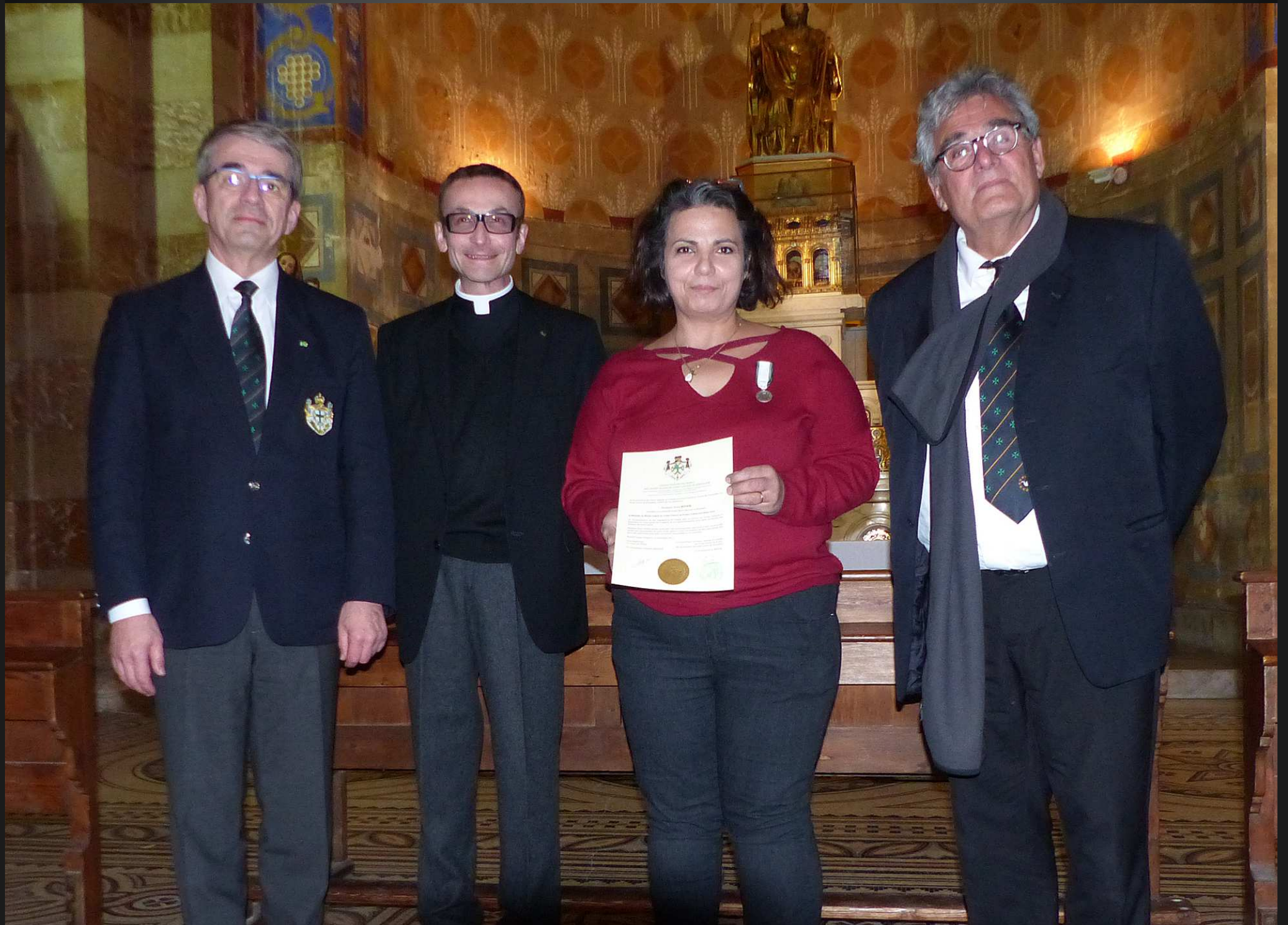
Un certificat aux armes de l'Ordre de Saint Lazare de Jérusalem accompagne cette décoration.