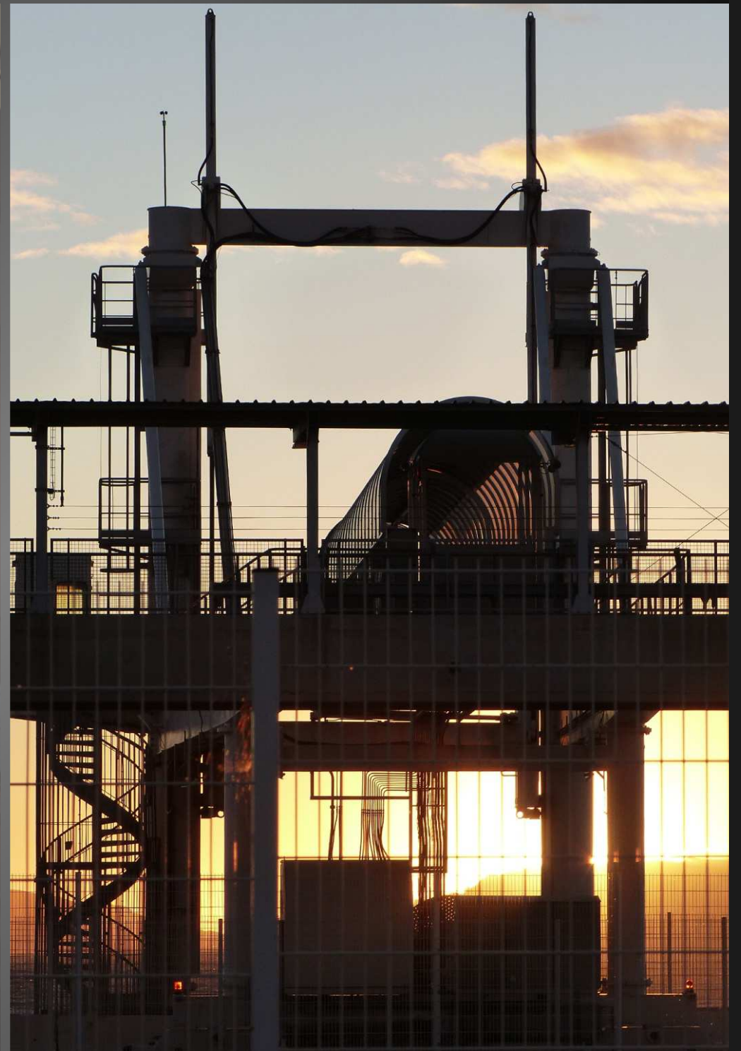
Les équipements portuaires du terminal passager prennent des teintes pastel qui les transformeraient presque en œuvres d'art.