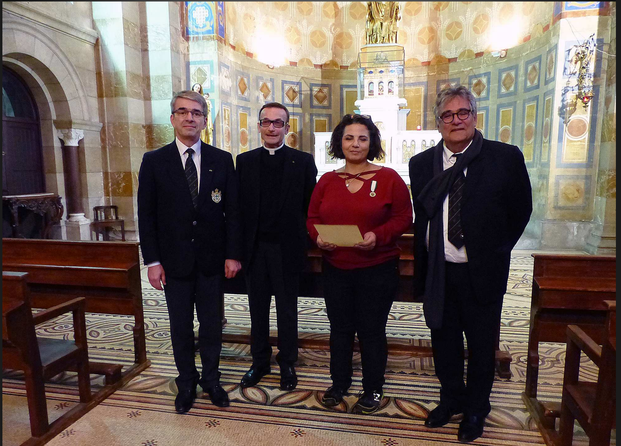
La récipiendaire, avec le Père Ottonello et deux Chevaliers de Saint Lazare, une décoration bien méritée pour services rendus à l'Archiconfrérie des Gardiens des Reliques de Saint Lazare.