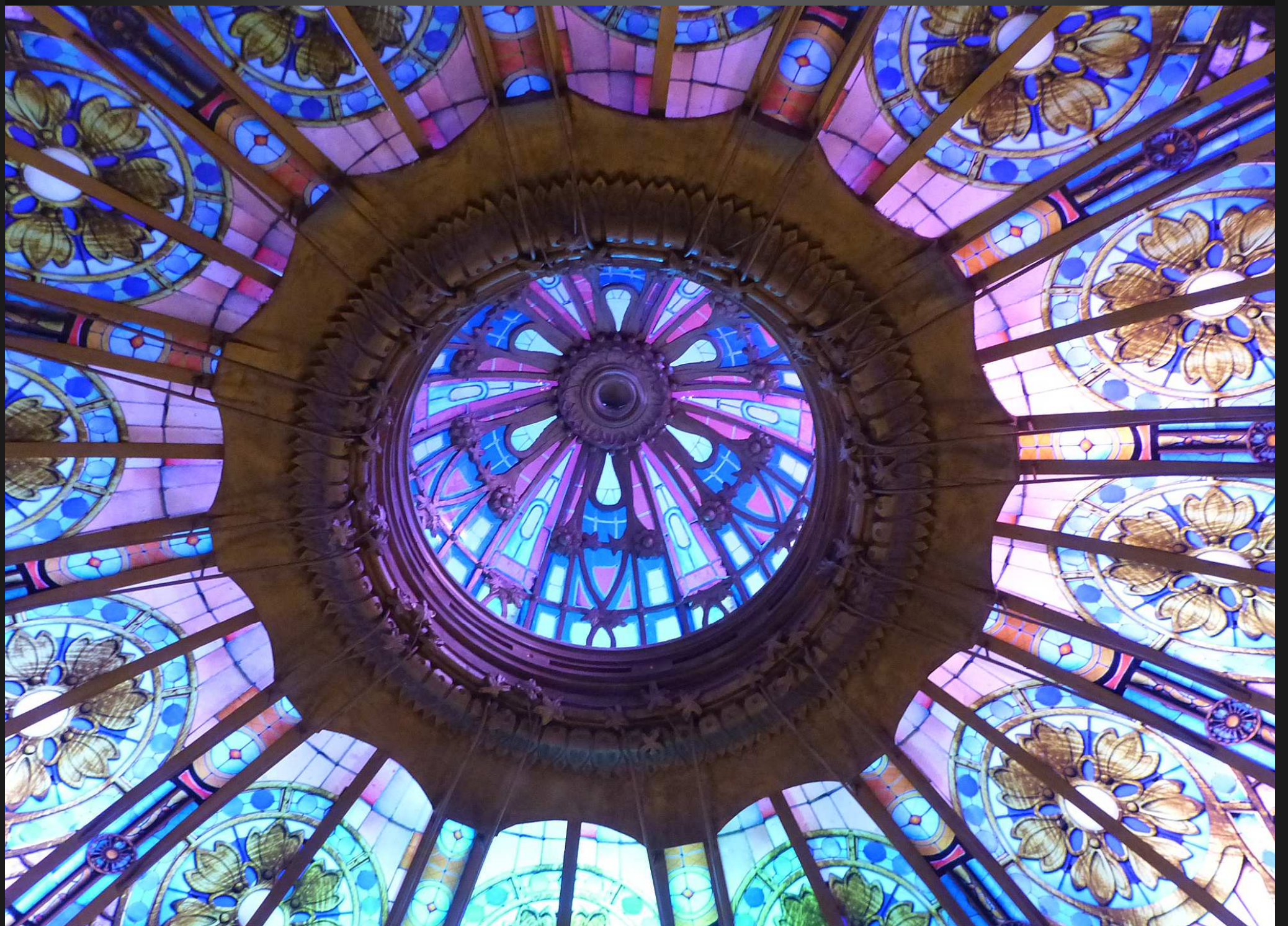
Ce restaurant, tout près de la cathédrale, possède une très grande verrière.