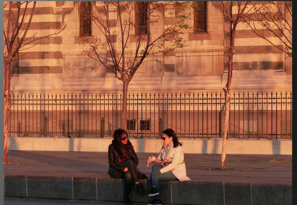
Les armes de Marseille ont pris une couleur brique tout comme le dôme de la cathédrale.