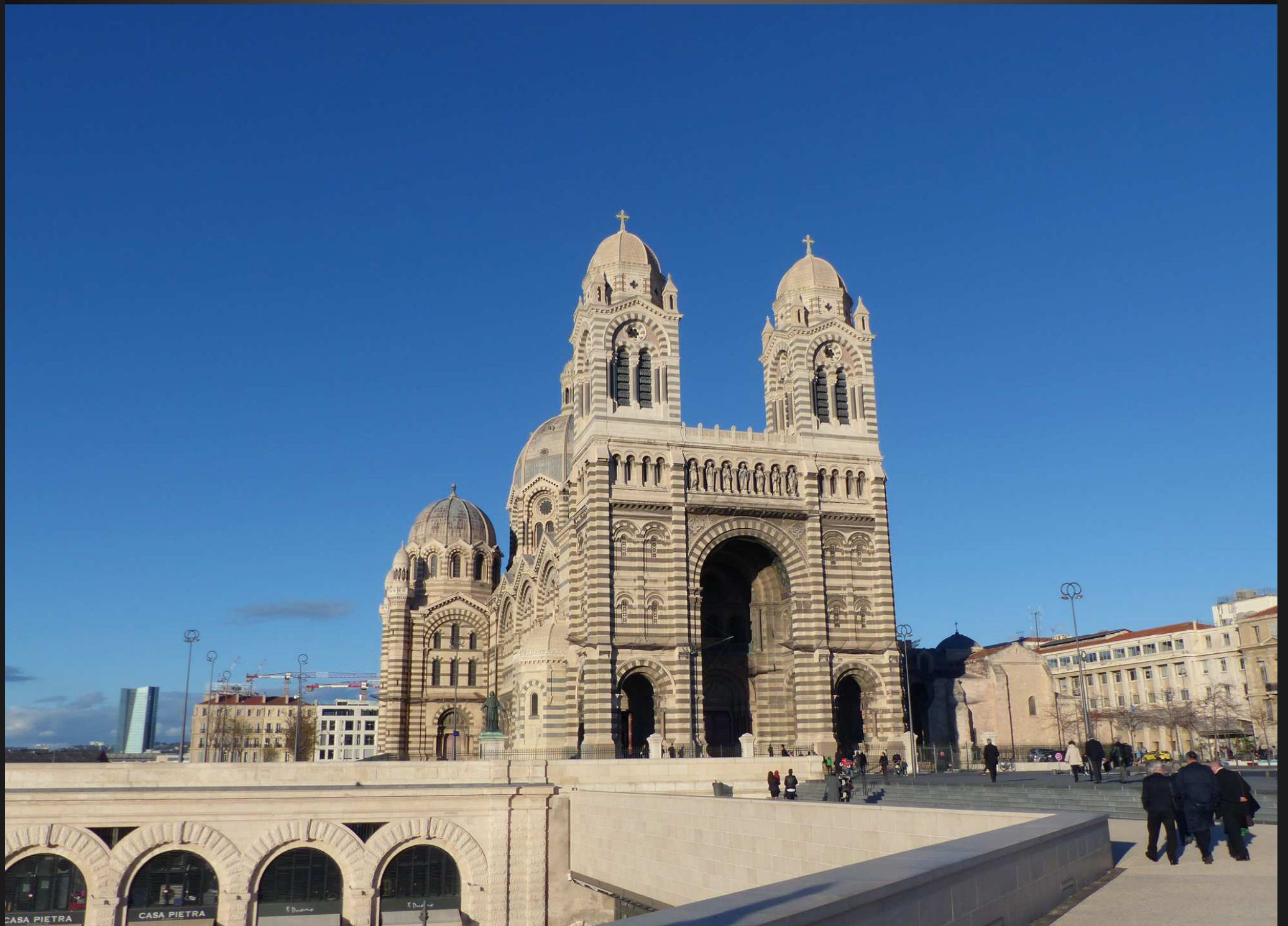
Après le repas, retour à la chapelle Saint-Lazare pour une remise de décoration.