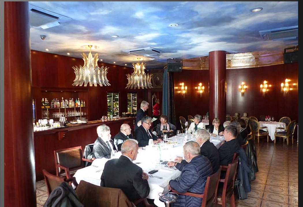
Après la cérémonie religieuse, les Chevaliers de l'Ordre de Saint-Lazare ont coutume de se réunir au restaurant, un moment de spiritualité et de partage.