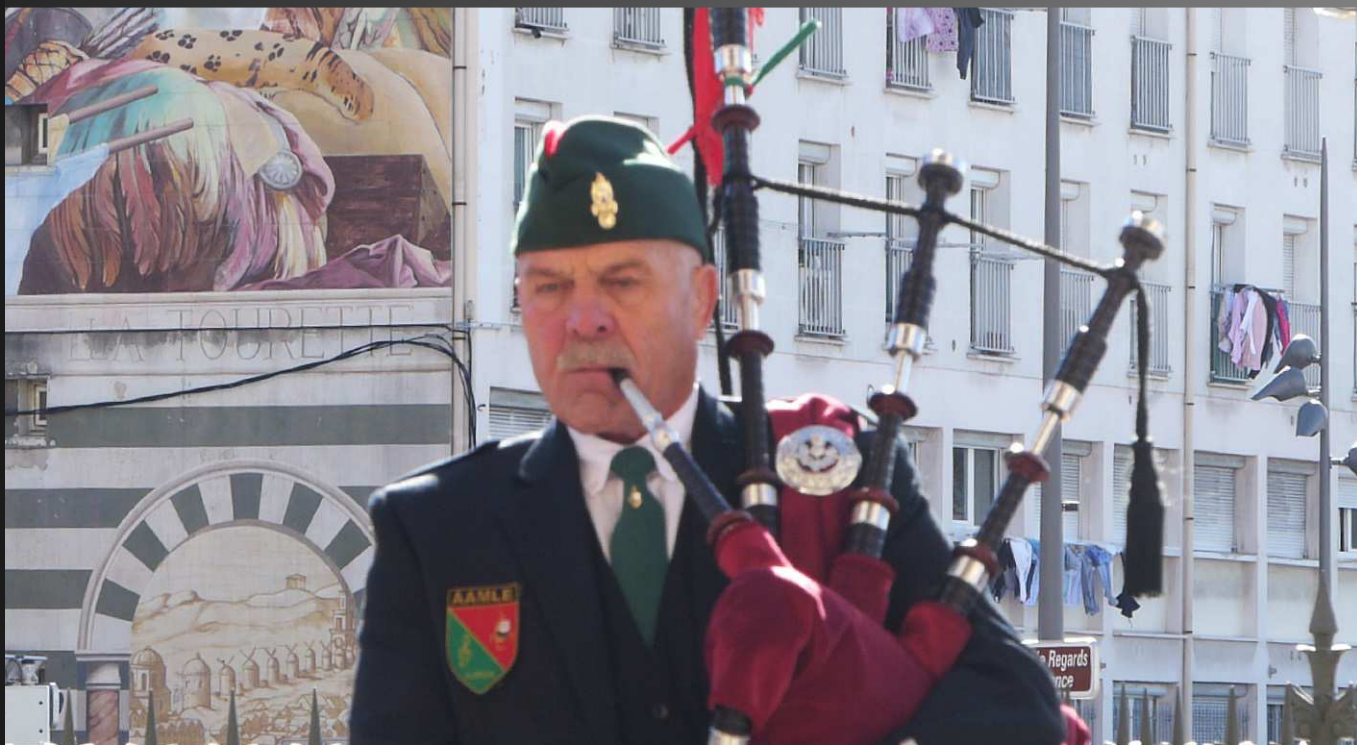
Parmi les morceaux interprétés avec le concours du sonneur de cornemuse, les célèbres "Highland Cathedral" et "Amazing Grace" ont ravi l'assistance.