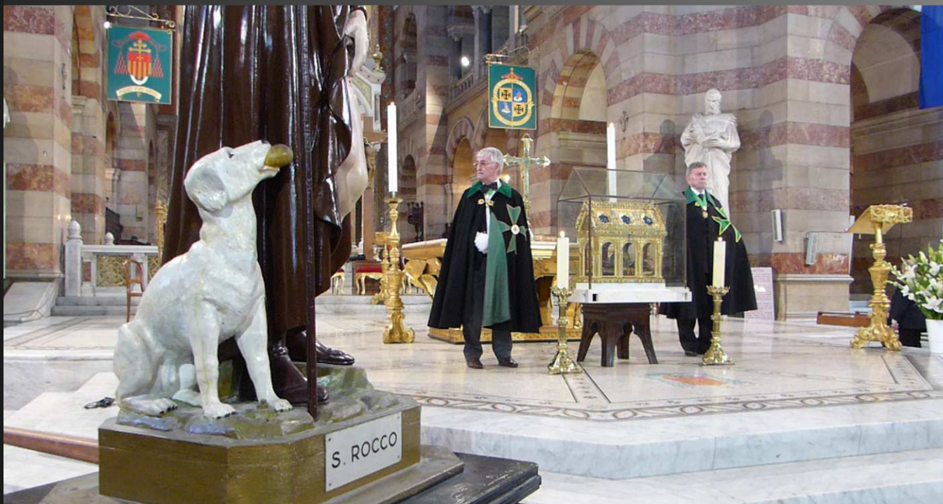
Une fois la cérémonie terminée, le reliquaire de Saint-Lazare est resté exposé dans le chœur sous la garde des Chevaliers de l'Ordre, pendant que les Musiciens de l'AAMLE interprétaient des morceaux de leur répertoire sur le parvis de la cathédrale.