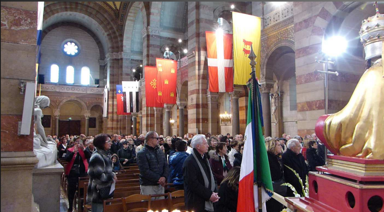
Le Conseil municipal de Sperlonga est au premier rang, devant le buste de Saint-Léon, patron de cette ville du Latium.