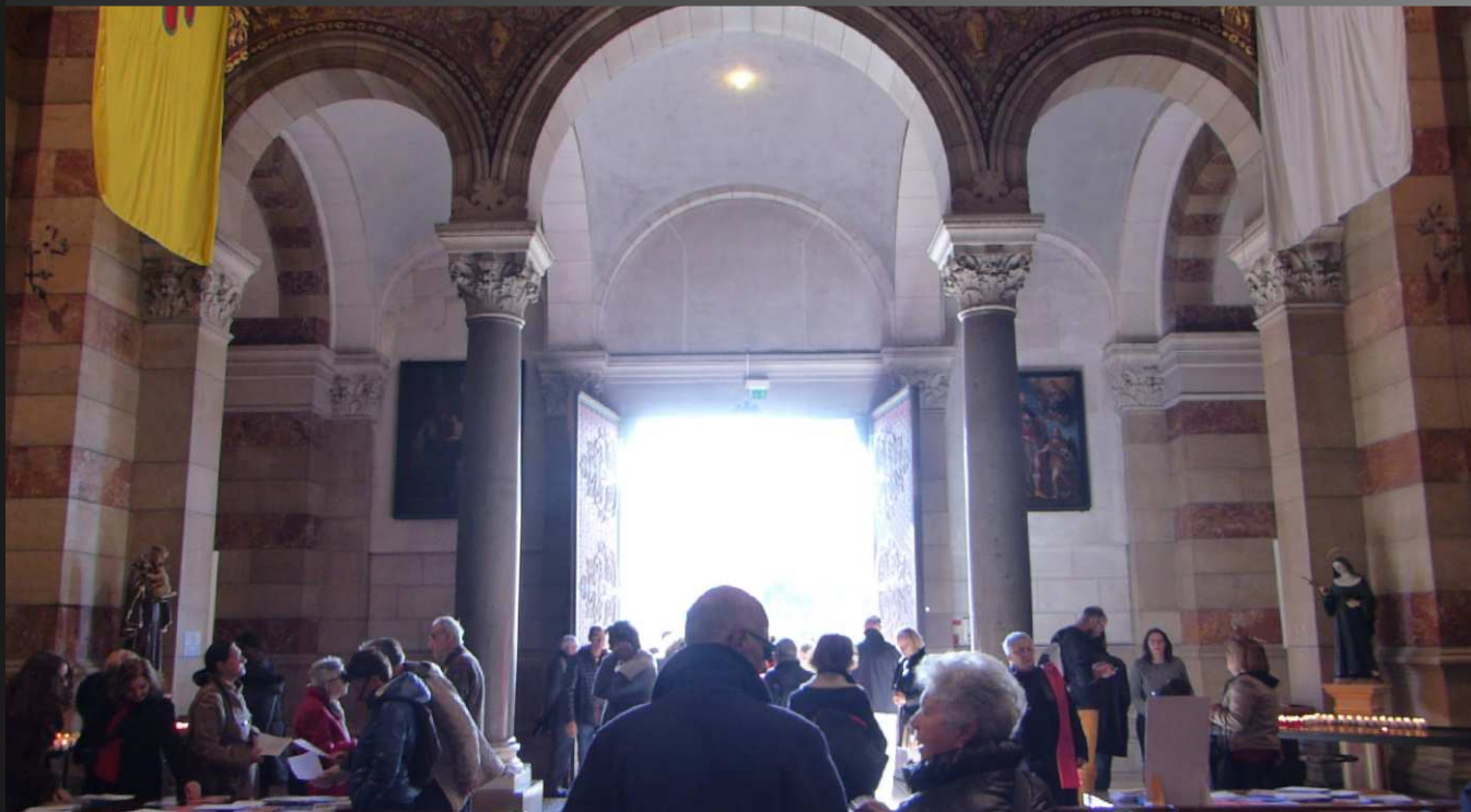
Philippe Gueit, aux Grandes Orgues de la cathédrale (ci-dessus), accompagne de façon magistrale la sortie de la messe.