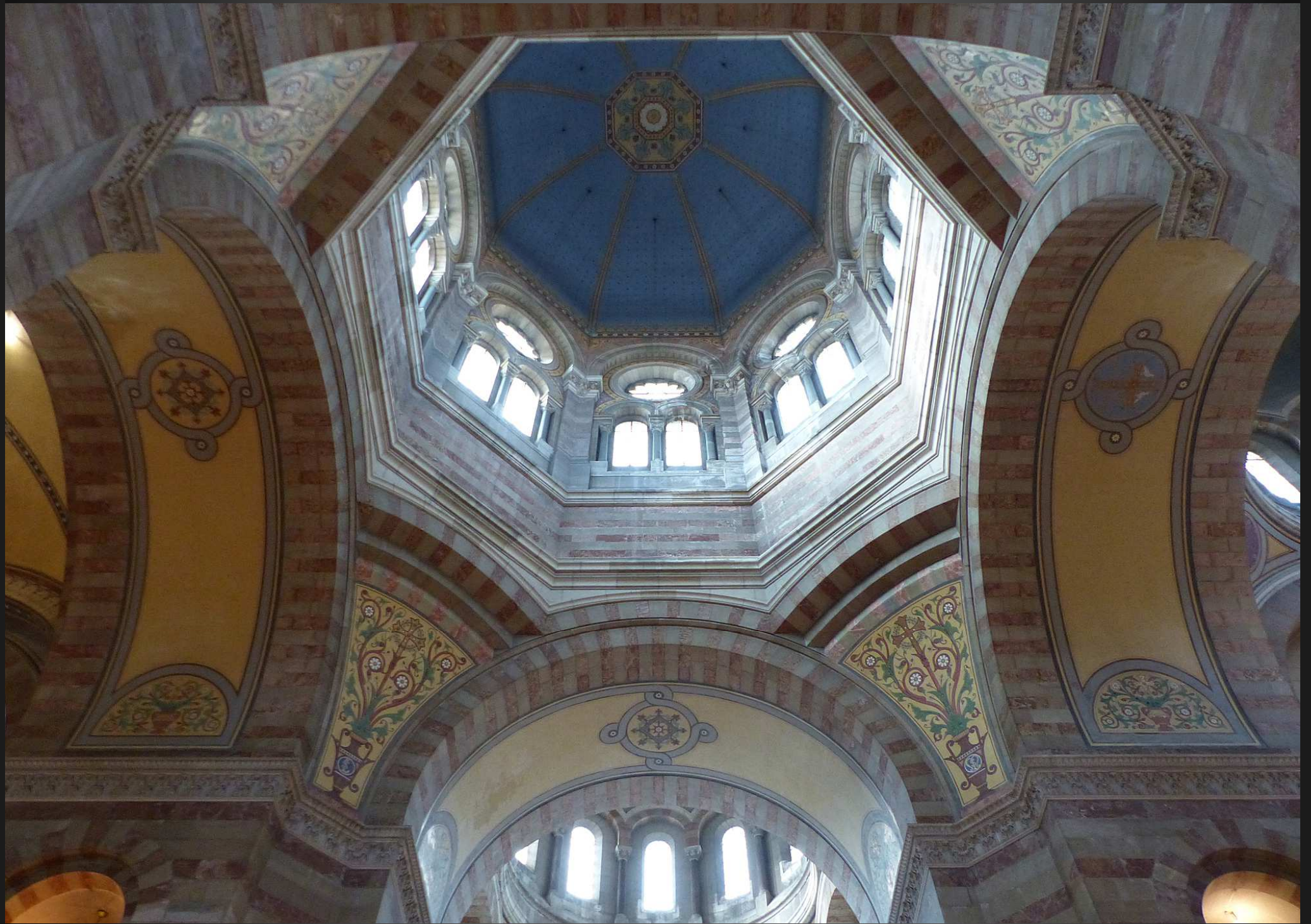
La coupole centrale de la nouvelle Cathédrale Sainte-Marie-Majeure, consacrée en 1897, culmine à 70m.: sa construction, décidée par Mgr Eugène de Mazenod et entreprise en 1852, dura 40 ans. Avec son appareillage de pierres alternativement vertes et blanches, l'édifice est d'inspiration byzantine (mosaïques, coupoles) juxtaposant des éléments romans et gothiques, il est classé MH en 1906.