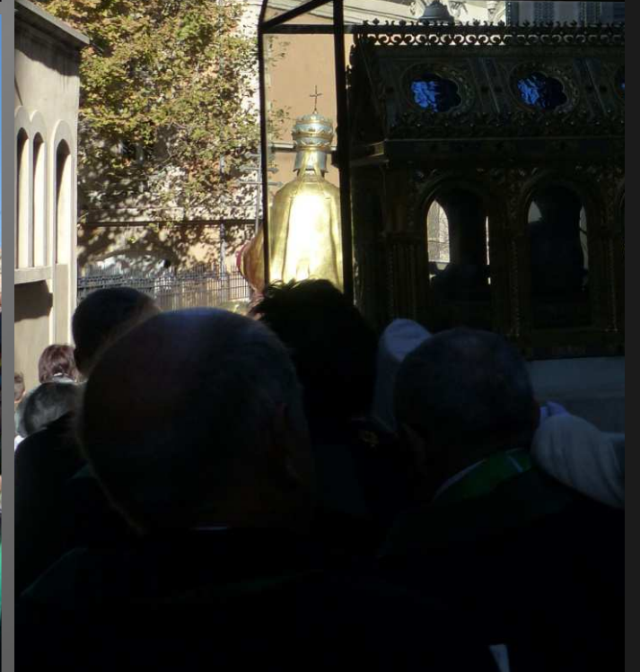
La cathédrale de la Major _ Par la rue de la Cathédrale (ci-dessus et à dr.), le cortège sur le parvis de la Major.