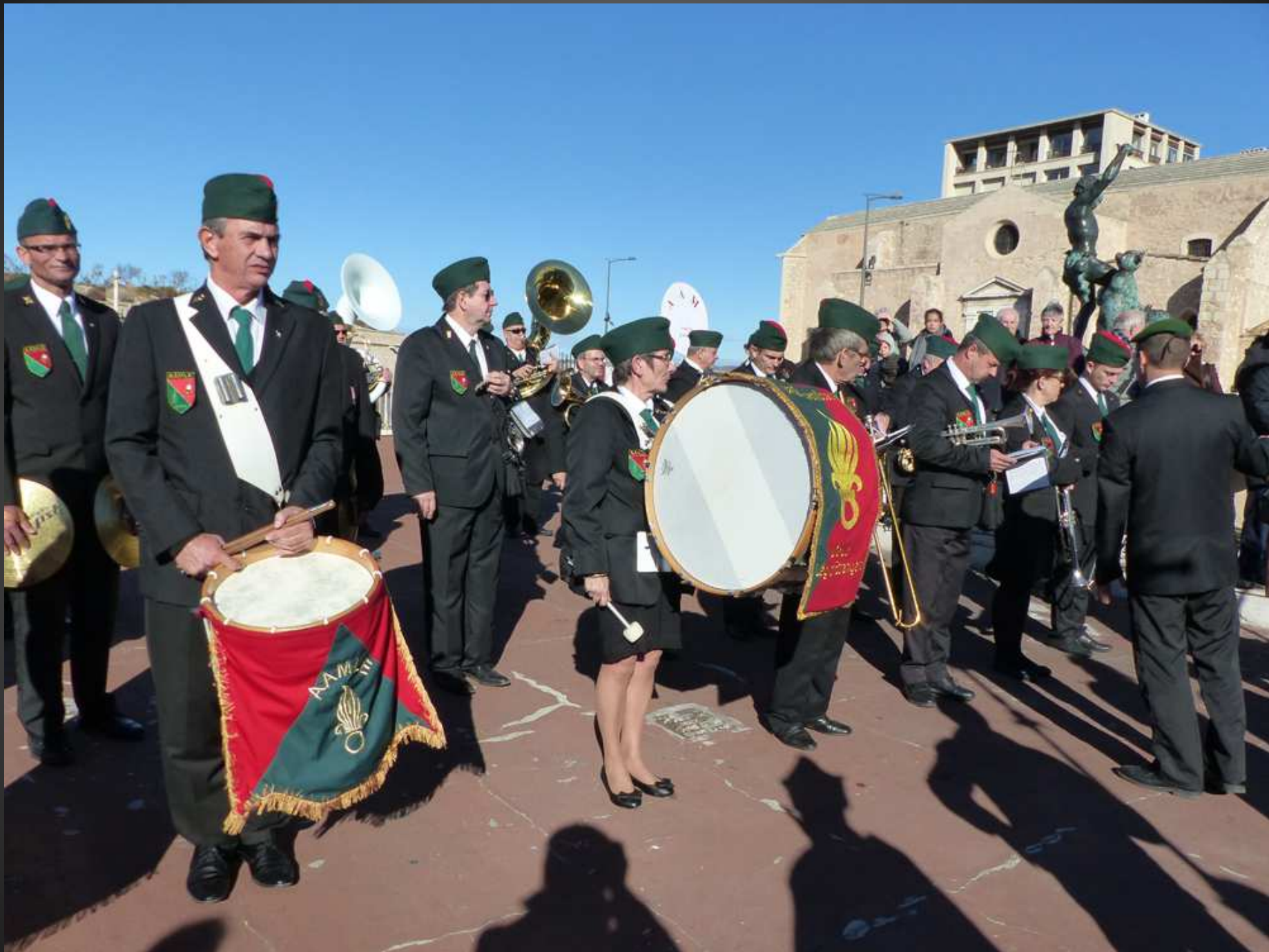
Parvis Saint-Laurent _ L'Amicale des Anciens Musiciens de la Légion Etrangère (AAMLE) vient d'offrir une aubade aux Saints, elle va maintenant prendre la tête du cortège en direction de la Cathédrale.