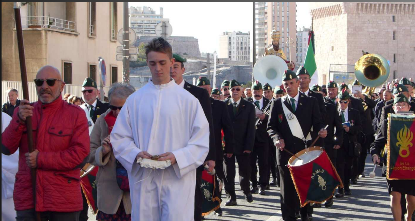
La procession quitte le Parvis Saint-Laurent _ La châsse des reliques de saint Lazare est portée par les Chevaliers de l'Ordre de Saint-Lazare.