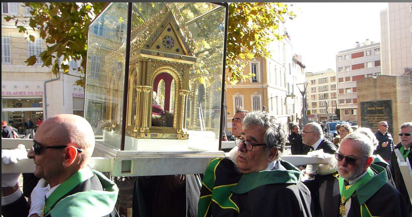
Quartier du Panier _ Le cortège passe ici sur la place de Lenche, au-dessus du cachot souterrain et très sombre où saint Lazare avait été incarcéré et martyrisé ; autrefois, les Pénitents de la Confrérie de Saint-Lazare, qui portaient la châsse lors des fêtes solennelles, faisait halte à cet endroit. (Source : texte affiché dans la chapelle Saint-Lazare de la cathédrale de la Major)